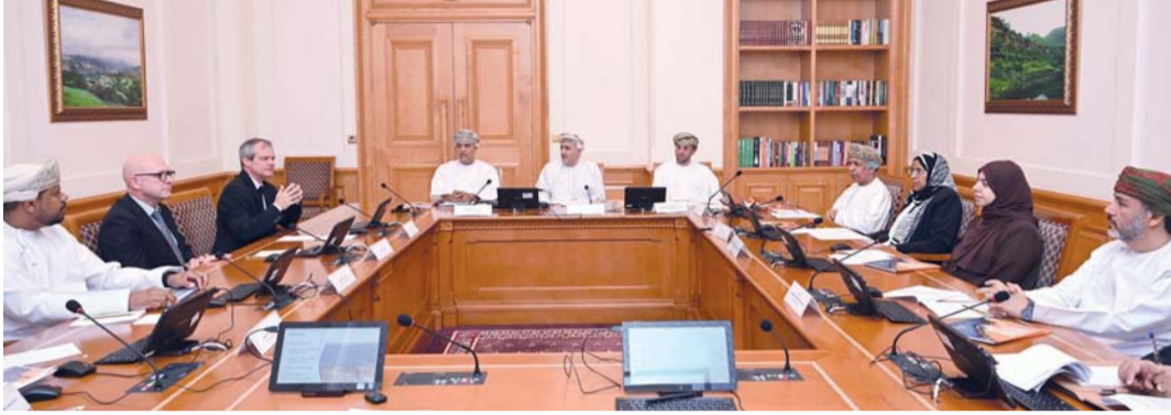
إثراء الجوانب الفنية والتطبيقية المرتبطة بإدارة الموارد المائية