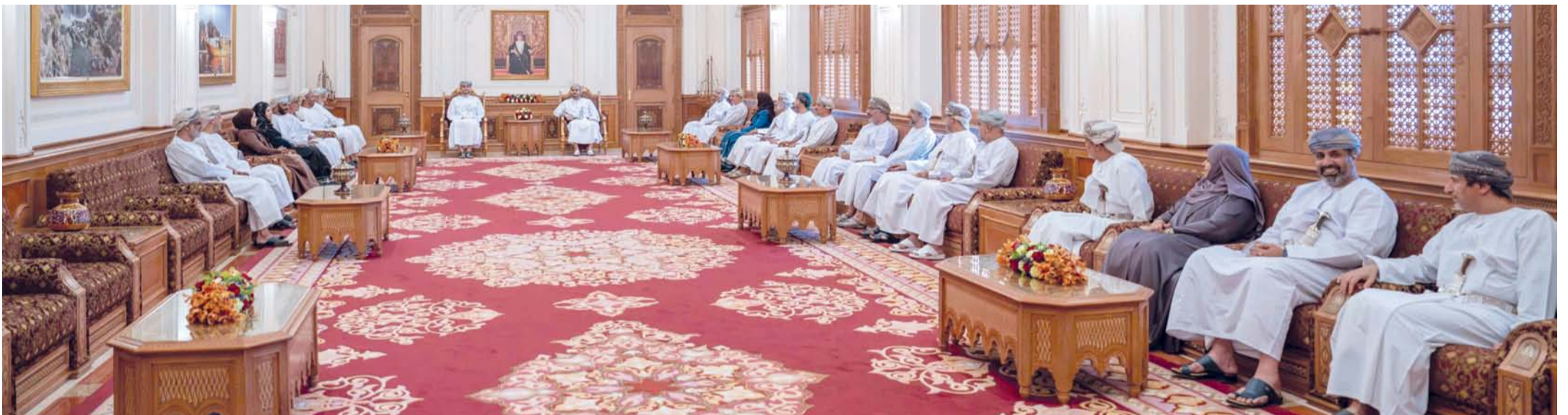
■ مجلس الوزراء يشيد بالجهود التي يبذلها مجلس الدولة في مختلف المجالات.

من الموضوعات، من بينها دور الاستراتيجية القطاعية في تعزيز التنمية في المحافظات، كما تم تبادل الرؤى البناءة في كل ما من شأنه الارتقاء بالجهود المبذولة وبما يحقق الصالح العام.