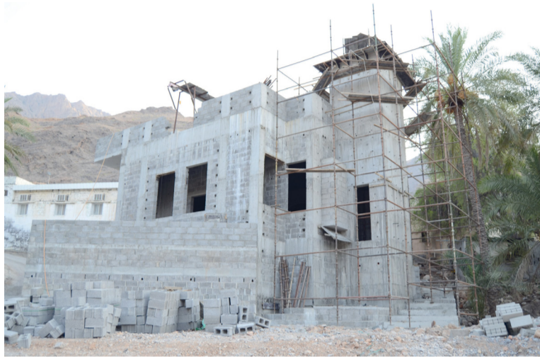
العمل جارٍ في بناء منارة مسجد السيب في قريات