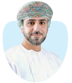
سليمان بن محمد الطائي

العماني نحو القطاعات المستقبلية والتقنيات المتقدمة منسجماً مع التحولات العالمية المتسارعة، حيث يولي الجهاز اهتماماً متزايداً بالاستثمارات ذات القيمة المضافة العالية، بما في ذلك المجالات المرتبطة بالذكاء الاصطناعي والاقتصاد الرقمي