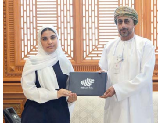
تكريم الكوادر الإشرافية والإدارية والطالبات المجيدات

منصات التوثيق العالمية، فضلاً عن تميزها السابق بحصولها على الجائزة البرونزية العالمية كمعلم ملهم. كما جرى تكريم إدارة مدرسة الأمل؛ تقديرًا لدورها في توفير بيئة تعليمية محفزة للابتكار والبحث العلمي، أسهمت في تحويل الأفكار الطلابية إلى مشاريع تنافس على المستوى الدولي. ويجسد هذا التكريم اهتمام محافظة جنوب الباطنة بدعم الكفاءات الوطنية الشابة وتشجيع ثقافة الإبداع والتميز، بما يساهم في بناء جيل قادر على المنافسة عالمياً وخدمة مسيرة التنمية في سلطنة عمان.