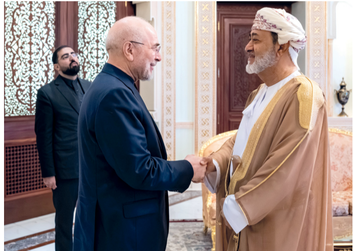
جلالة السلطان لدى استقباله أمس رئيس مجلس الشورى الإيراني بقصر البركة العامر.

للكافة الملفات العالقة، وفي مقدمتها استئناف وانبساط حركة وسلامة الملاحة عبر مضيق هرمز والملف النووي وغيرها من القضايا والتحديات ذات الصلة. وأصدرت سلطة عُمان والجمهورية الإسلامية الإيرانية بياناً مشتركاً، فيما أكدتا من خلاله بوصفهما الدولتين الساحليتين