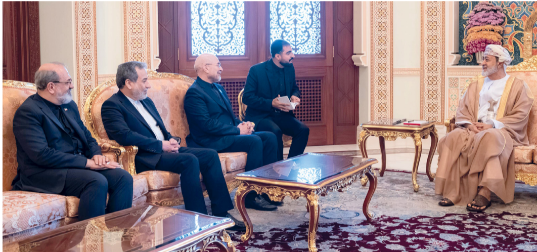
جلالته والوفد الإيراني يبحثان القضايا ذات الاهتمام المشترك

مسقط - العُمانية: استقبل حضرة صاحب الجلالة السلطان هيثم بن طارق المعظم، حفظه الله ورعاه، معالي الدكتور محمد باقر قاليباف رئيس مجلس الشورى بالجمهورية الإسلامية الإيرانية وبمعيته معالي الدكتور سيد عباس عراقجي وزير الخارجية الإيراني.