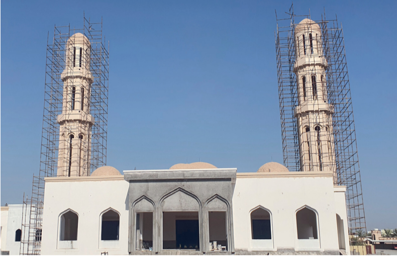
مساحة جامع الشرس بالمنصعة الإجمالية تبلغ ٤٢٨٠ متراً