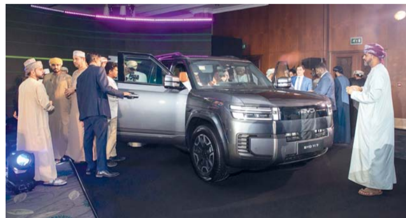
تقدم بي واي دي قيادة تجمع بين الجرأة والتنوع والمتعة

الثمانية القياسية، كما تحتوي على مساحة ركاب تزيد عن ٣,٣ متر مربع، ومساحة تخزين تبلغ ١٨١٣ لترا عند طي المقاعد الخلفية. وتمتلك محرك ذي القوة الإجمالية البالغة ٤٨٠ حصاناً وتقنية بطاريات «بليد» من شركة «بي واي دي»، وتوفر «Ti 7» مدى قيادة يصل إلى ٧٣٥ كم وفقاً لمعيار «WLTP»، ومدى قيادة كهربائية بالكامل يصل إلى ١٠٥ كم، وتسارع من صفر إلى ١٠٠ كم لكل ساعة في ٥,٣ ثانية فقط، وتمتلك أوضاع وإعدادات قيادة متعددة التضاريس وتكمن قدرتها على جميع أنواع الطرق، كما تتميز السيارة بمستوى أمان شامل مع مجموعة متكاملة من تقنيات مساعدة السائق. وتتوفر سيارة «بي واي دي Ti 7» الجديدة كلياً الآن للعرض والحجز في صالة عرض «بي واي دي».