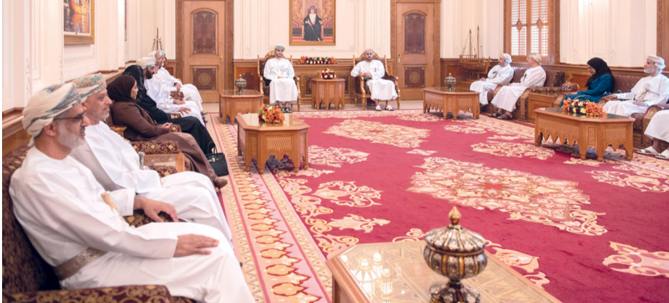
تبادل الرؤى البناءة في كل ما من شأنه تحقيق الصالح العام

مسقط - العُمانية: استقبل صاحب السمو السيد ذي يزن بن هيثم آل سعيد نائب رئيس الوزراء للشؤون الاقتصادية مع عدد من أصحاب السمو والمعالي أعضاء مجلس الوزراء بمبنى المجلس في مسقط معالي الشيخ عبدالله بن عبدالله الخليفي رئيس مجلس الدولة والمكرمين أعضاء مكتب المجلس، حيث عقد اجتماع مشترك لتعزيز مجالات التعاون والتنسيق المستمر بين مجلس الوزراء ومجلس عُمان وكافة مؤسسات الدولة. واستعرض أثناء الاجتماع عدد من الموضوعات، من بينها دور الاستراتيجيات القطاعية في تعزيز التنمية في المحافظات، كما تم تبادل الرؤى البناءة في كل ما من شأنه الارتقاء بالجهود المبذولة وبما يحقق الصالح العام.