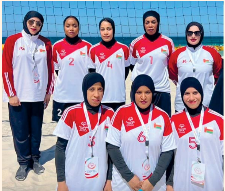
فريق الكرة الطائرة الحاصل على الميدالية الذهبية

توج الأولمبياد الخاص العماني مشاركته في دورة الألعاب الشاطئية العاشرة للأولمبياد الخاص لمنطقة الشرق الأوسط وشمال أفريقيا ٢٠٢٦ بالجمهورية التونسية بحصد ميداليتين ملونتين، تمثلت في الذهبية في منافسات كرة الطائرة الشاطئية والفضية في منافسات الترياثلون، وتعكس النتائج التطور المتواصل لرياضة الأولمبياد الخاص العماني ونجاح البرامج التدريبية والتأهيلية التي ينفذها على مدار العام لتمكين الأشخاص ذوي الإعاقة الفكرية وتعزيز حضورهم في المحافل الإقليمية والدولية. وتم اختيار البطل مجاهد السرحني متحدثاً رسمياً ممثلاً لمنطقة الشرق الأوسط وشمال أفريقيا ضمن برنامج القادة الشباب. وأكد سيف بن محمد الربيعي رئيس مجلس إدارة الأولمبياد الخاص العماني أن الإنجاز يعكس ثمرة العمل المؤسسي والتخطيط المستمر الذي تنفذه المؤسسة بالتعاون مع