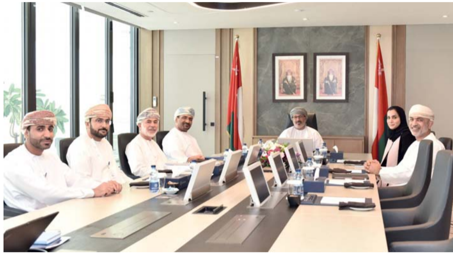
مناقشة تقرير تقييم ضوابط تسجيل شركات الوساطة العمانية وغير عمانية