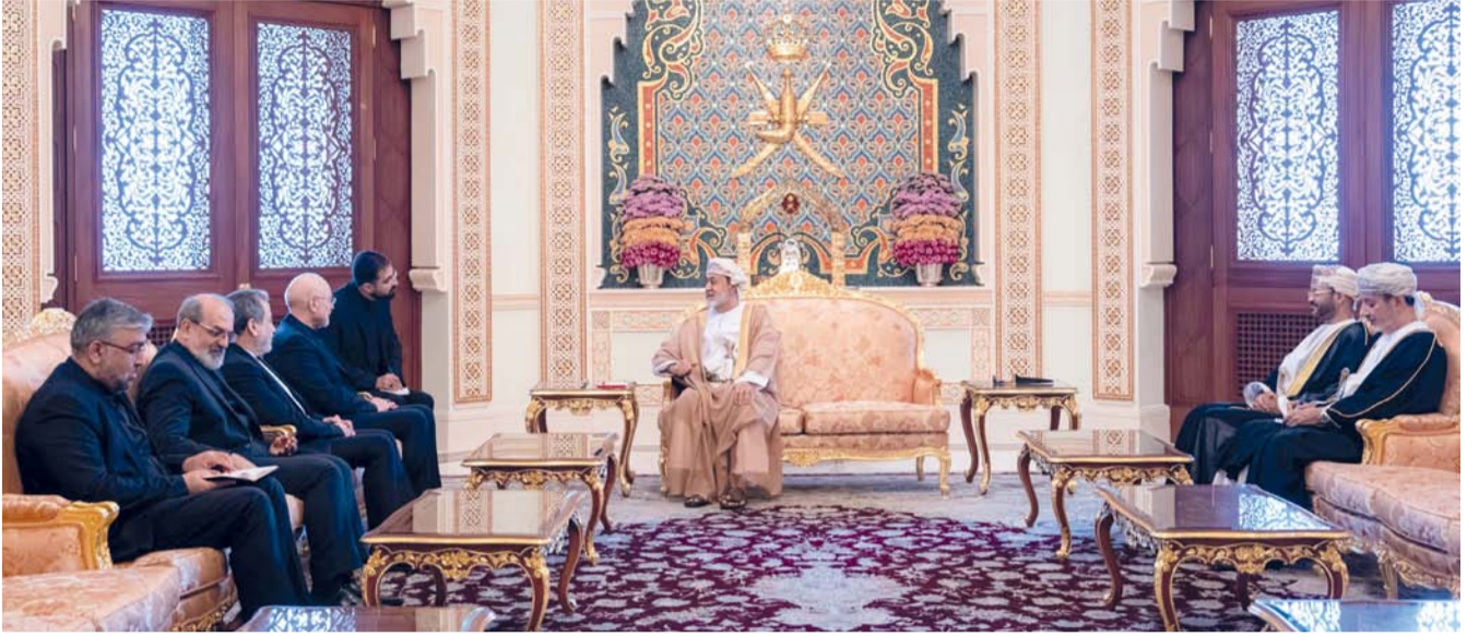
■ جلالة السلطان يعرب عن دعمه وأمنيته للمفاوضات الإيرانية. الأميركية بالتوفيق والنجاح وصولاً إلى تسوية سلمية ونهائية لكافة الملفات العالقة

حضرت المقابلة من الجانب العماني معالي السيد بدر بن حمد البوسعيدي وزير الخارجية، ومعالي الشيخ عبدالعزيز بن عبدالله الهنائي السفير المتجول بوزارة الخارجية، فيما حضرها من الجانب الإيراني سعادة السفير موسى فرهنك، سفير الجمهورية الإسلامية الإيرانية المعتمد لدى سلطنة عُمان وعدد من المسؤولين.