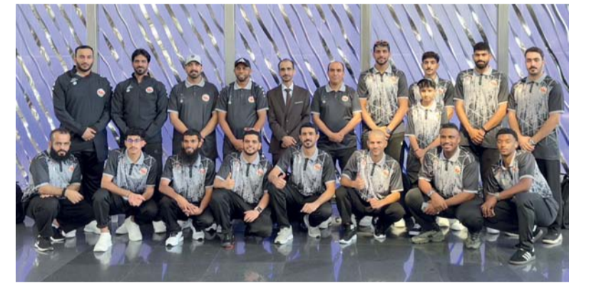
بعثة منتخبنا الوطني لكرة القدم للصالات للصلم

أعلنت عُمان للإبحار عن فتح باب التسجيل للمشاركة في النسخة الخامسة عشرة من أسبوع المصنعة للإبحار الشراعي، الذي يُقام بإشراف اللجنة العمانية للرياضات البحرية وبدعم من شركة النهضة للخدمات خلال الفترة من ١٥ إلى ٢١ أكتوبر ٢٠٢٦ في منتجج باريسلو المصنعة. وتأتي النسخة الخامسة عشرة لتحقي مسيرة امتدت خمسة عشر عاما، نجحت خلالها البطولة في ترسيخ مكانتها على أجندة الإبحار الشراعي الإقليمية والدولية، واستقطاب أعداد متزايدة من البحارة من مختلف دول العالم. كما لعبت دوراً مهماً في تنمية المواهب الوطنية وإعداد أجيال من البحارة للمنافسة في المحافل الخارجية. ومن المنتظر أن تستقطب نسخة هذا العام أكثر من ١٠٠ بحار وبحارة يمثلون عدداً من الدول، في منافسات تجمع بين التحدي الرياضي وتبادل الخبرات. وستقام منافسات البطولة عبر ست فئات من القوارب تشمل: فئة قوارب الأوبتمست للناشئين، وفئة قوارب إلكا ٤،