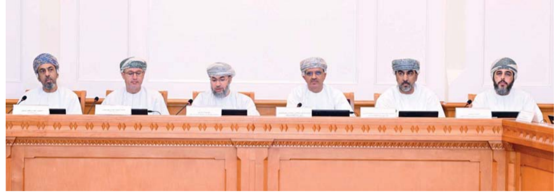
أهمية تبني نماذج إدارية تسهم في تعزيز كفاءة المؤسسة

اليوم.. «الدولة» يناقش قانون النظام الموحد لدول المجلس مسقط.. «الوكيل» يسقط أعمال الجلسة لكمة معالي الشيخ رئيس المجلس إلى جانب اعتماد محضر الجلسة الثامنة لدور الانعقاد العادي الثالث من الفترة الثامنة ومناقشة رأي اللجنة الاجتماعية والناقشة بشأن «مشروع القانون (النظام) الموحد بشأن إدارة الموارد الوراثية النباتية للأغذية والزراعة لدول المجلس بالتعاون لدول الخليج العربية».