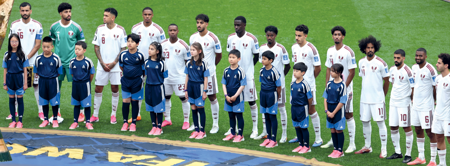
■ المنتخب القطري

بوسني شرس لا يرمي المذبل بسهولة، كما أظهر أمام إيطاليا في ملحق التصفيات، تحتاج إلى الكثير من العمل الفني والمجهود الاستثنائي من اللاعبين.. والأهم التوظيف السليم لقدراتهم. وقبل مواجهة قد تكون الأخيرة لمدرّب منتخب أسبانيا الأسبق مع قطر في حال المغادرة، يأمل لوبيتيغي في عدم الاكتفاء بتأهيل الدولة الخليجية الصغيرة إلى المونديال عبر التصفيات بل تسجيل الفوز الأول في رصيدها.