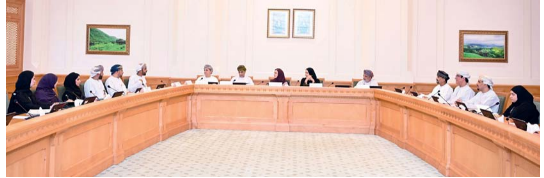
تعزيز الحماية القانونية وآليات التكامل بين الجهات المعنية

اليوم.. «الدولة» يناقش قانون النظام الموحد لدول المجلس مسقط.. «الوكيل» يسقط أعمال الجلسة لكمة معالي الشيخ رئيس المجلس إلى جانب اعتماد محضر الجلسة الثامنة لدور الانعقاد العادي الثالث من الفترة الثامنة ومناقشة رأي اللجنة الاجتماعية والناقشة بشأن «مشروع القانون (النظام) الموحد بشأن إدارة الموارد الوراثية النباتية للأغذية والزراعة لدول المجلس بالتعاون لدول الخليج العربية».