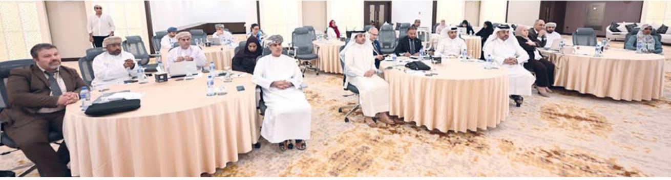
مناقشة الحلقات التشاورية للغذاء والصحة

القدرات الوطنية وتطوير التشريعات الزراعية العربية. وأضاف الأستاذ الدكتور المدير العام للمنظمة العربية للتنمية الزراعية: تأتي هذه الحلقة ضمن سلسلة الحلقات المستمرة لتطوير مجال سلامة الغذاء، حيث تهدف هذه الحلقة إلى الحوكمة الفعالية لمنظومة الصحة العامة والصحة النباتية وسلامة الغذاء وتطوير التشريعات والسياسات المنظمة للعمل والتكامل بين المؤسسات الوطنية والإقليمية وبناء أنظمة عربية متطورة للرصد والتتبع والإنذار المبكر وتطوير برامج بناء القدرات والبحث العلمي والتدريب. بعدها بدأت فعاليات الحلقة التشاورية بعدد من الجلسات العلمية والفنية على أن يستكمل الفعاليات صباح أمس بعقد عدد من الجلسات العلمية لمناقشة المحاور الموضوعية في جدول أعمال الحلقة.