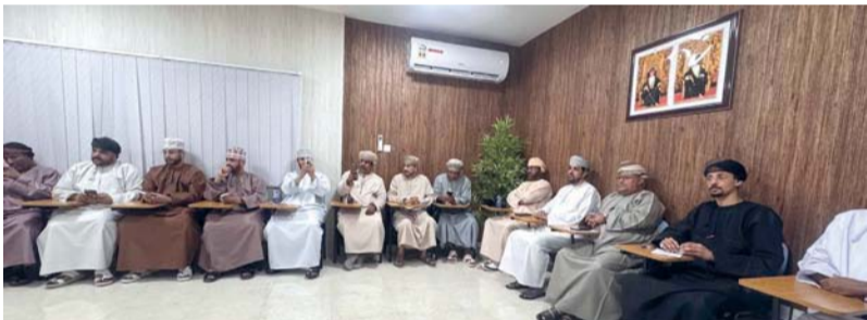
استعراض المبادرات والأنشطة التوعوية والمجتمعية

يوسع نطاق الاستفادة من خدمات الفحص والتوعية. وأوضحت أن العربة ستبدأ أعمالها هذا العام في ولاية مرياط اعتباراً من الأول من يوليو المقبل ولمدة أسبوعين، يصاحبها تنفيذ محاضرات توعوية حول أهمية الفحص المبكر، والتغذية الصحية، وآليات الفحص الذاتي للمرأة. وبعد ذلك ستنتقل إلى ولاية صلالة لتتمركز في المركز الصحي بالسعادة حتى نهاية شهر أغسطس.