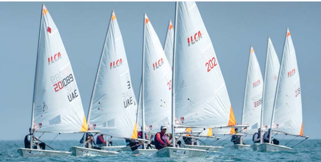
البطولة تشهد استقطاب أعداد متزايدة من البحارة

المواهب وصل قدراتها على مدى الأعوام الماضية. فمُنذ انطلاقها، تحولت إلى منصة دولية تستقطب البحارة من مختلف أنحاء العالم، ونفخر اليوم برؤية العديد من البحارة الذين انطلقت مسيرتهم من المصنعة وهم يشاركون في أبرز البطولات العالمية، بما يؤكد نجاحها في إعداد أجيال من البحارة وتعزيز حضور سلطنة عُمان على خارطة الإبحار الدولية. ٤