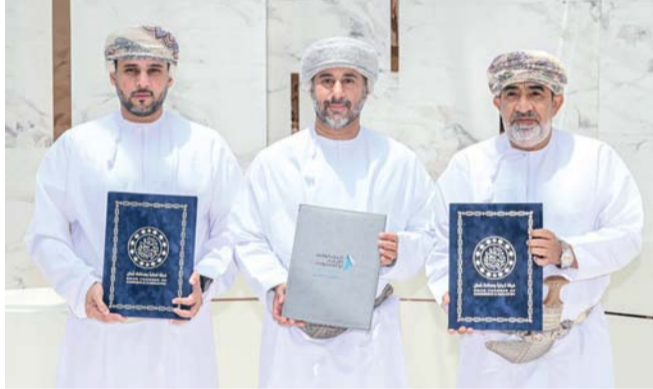
تعزيز المذكرة الشراكة المؤسسية بين الجانبين في عدة مجالات

والتحليلات الاقتصادية، ورفد القطاع الخاص بمعلومات دقيقة تساهم في رفع كفاءة التخطيط واتخاذ القرار. وأضاف سعادته: إن الغرفة تنظر إلى المعرفة الاقتصادية باعتبارها أحد المكونات الرئيسية لتعزيز تنافسية بيئة الأعمال، لذلك تولي اهتماماً متزايداً بتطوير قدراتها البحثية والتحليلية وإعداد الدراسات والتقارير الاقتصادية واستطلاعات الرأي ومؤشرات الأعمال التي تعكس واقع الأسواق وتدعم متخذي القرار في القطاعين العام والخاص. وأشار سعادته إلى أن المذكرة تؤسس لمرحلة جديدة من التعاون البناء بين الجانبين في مجالات تبادل البيانات والمعلومات الإحصائية، وتنفيذ الدراسات والبحوث المشتركة، وتطوير قواعد معرفية متخصصة، وتأهيل الكوادر الوطنية وبناء القدرات في مجالات التحليل الاقتصادي والإحصائي، بما يعزز جودة المخرجات البحثية ويرتقي بمستوى الرصد والتحليل الاقتصادي. وأوضح سعادته أن الغرفة، بصفتها الممثل الرسمي للقطاع الخاص، حرصت على إنشاء شركات استراتيجية مع المؤسسات الوطنية ذات الاختصاص، بما يضمن توفير بيئة معلوماتية أكثر تكاملاً وموثوقية، ويساهم في تعزيز دور القطاع الخاص كشريك فاعل في التنمية الاقتصادية. وأضاف سعادته أن هذه الشراكة تعكس التوجه الوطني نحو تعظيم الاستفادة من البيانات والإحصاءات في دعم التنمية المستدامة، وتعزيز الجاهزية الاقتصادية، ورفع كفاءة السياسات والمبادرات الاقتصادية، بما ينسجم مع مستهدفات رؤية «عمان ٢٠٤٠»، ويعزز مكانة سلطنة عُمان كجاذبة للاستثمار والأعمال. من جهته أكد صاحب السمو السيد الدكتور أهدم بن تركي آل سعيد رئيس مجلس أمناء مركز الدراسات والبحوث الاقتصادية بالبحرين، أن هذه الشراكة تتيح الاستفادة المثلى من المؤشرات والإحصاءات الوطنية في دعم الدراسات