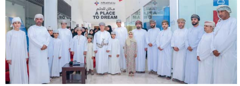
يهدف البرنامج لتنمية الوعي الاقتصادي والريادي لدى النشء

مسقط. العُمانية: تواصل سلطنة عُمان تعزيز توجهها نحو مستقبل الطيران من خلال تبني تقنيات النقل الجوي المتقدم، في إطار ينسجم مع مستهدفات رؤية «عمان ٢٠٤٠»، والاستراتيجية الوطنية للطيران ٢٠٤٠، بما يدعم الابتكار والاستدامة ورفع كفاءة منظومة النقل الجوي. ويعد النقل الجوي المتقدم أحد المسارات الحديثة في صناعة الطيران، إذ يعتمد على طائرات متقدمة، بما في ذلك الطائرات الكهربائية والمسيرة، لتقديم حلول نقل جوي مرنة تدعم الخدمات اللوجستية والصحية والإنسانية، مع الإسهام في تقليل الانبعاثات ورفع كفاءة استخدام المجال الجوي. وفي هذا الإطار، شهدت سلطنة عُمان تنفيذ تجربة تطبيقية للشحن الجوي باستخدام طائرة مسيرة، تم خلالها نقل شحنة من الأدوية والمستلزمات الطبية بوزن ١٠٠ كيلوجرام من الكلية التقنية العسكرية بمسقط إلى الجبل الأخضر، لمسافة قاربت ١٠٠ كيلومتر. وتمثل هذه التجربة نموذجاً تطبيقياً واعدداً لاستخدامات النقل الجوي المتقدم في دعم سلاسل الإمداد، خاصة في المناطق ذات الطبيعة الجغرافية