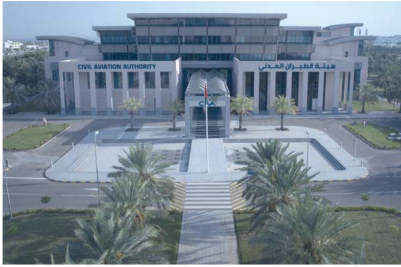
هيئة الطيران المدني

التزامها بالمعايير والممارسات الدولية الموصى بها، بما يضمن تكامل هذه التقنيات مع منظومة الطيران المدني القائمة، والحفاظ على أعلى مستويات السلامة وكفاءة استخدام الأجواء ويمثل النقل الجوي المتقدم فرصة استراتيجية لإعادة تطوير حلول نقل ذكية تخدم القطاعات الصحية واللوجستية والخدمية، وتدعم الاستخدام الأمثل للمجال الجوي. وتؤكد هذه الخطوات على أن سلطنة عُمان لا تكفي برسم الرؤى المستقبلية، بل تضيء خطوات مدروسة نحو ترجمة إلى مراحل تنفيذية عملية، ضمن أطر تنظيمية واضحة وشراكات متخصصة، بما يعزز مكانتها ضمن المنظومة الإقليمية والدولية للطيران المدني، ويدعم مسيرتها التنموية طويلة المدى.