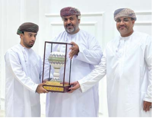
تكريم الداعمين والمساهمين في بهلاء ■ تصوير: أحمد الحروي