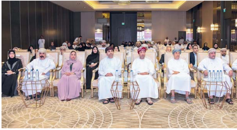
الاحتفال يؤكد أهمية الاعتماد كأحد الركائز الأساسية للبنية الأساسية

مختصين من مركز الاعتماد العماني وعدد من المختبرات والمقيمين الفنيين؛ بهدف التعريف بإجراءات التقييم والاعتماد وتعزيز الوعي بالماركسات الدولية المعتمدة في هذا المجال. وجدير بالذكر أن هذه الفعالية جاءت ضمن جهود وزارة التجارة والصناعة وترويج الاستثمار الرامية إلى تطوير منظومة الجودة الوطنية وتعزيز تنافسية الاقتصاد العماني، من خلال رفع كفاءة جهات تقويم المطابقة، وتمكين المختبرات الوطنية، ودعم الابتكار والاستدامة، بما يسهم في تعزيز ثقة المستثمرين والمستهلكين، وتسهيل تفاعل المنتجات والخدمات العمانية إلى الأسواق الإقليمية والعالمية.