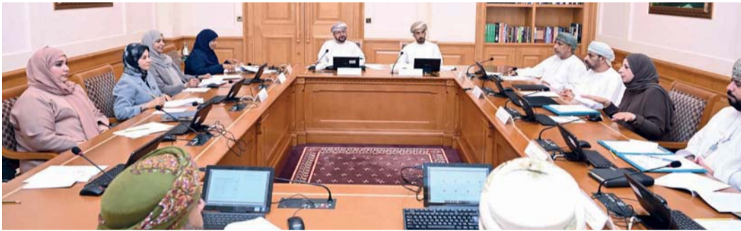
.. واجتماع فرعية التعليم والبحث