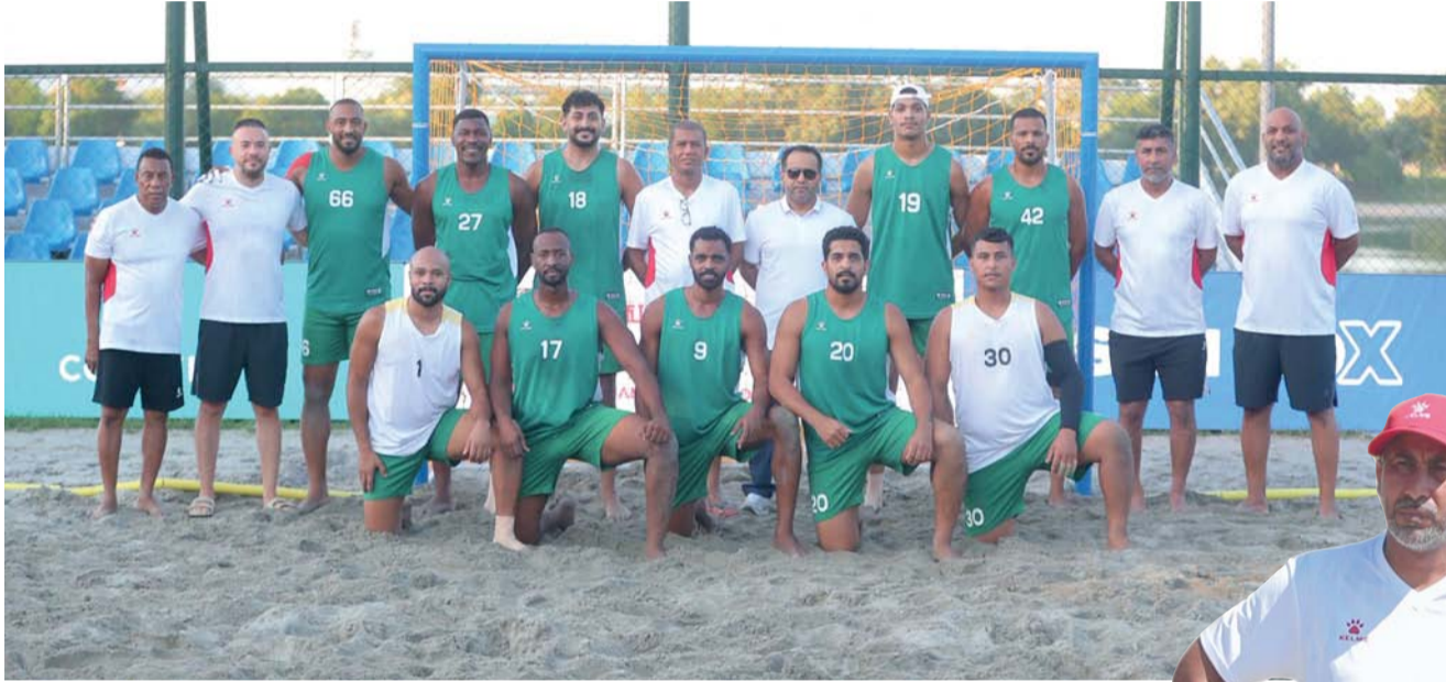
منتخبنا الوطني لكرة اليد الشاطئية

٢٠٠٩ وجاء بالمركز الفامن وكانت المشاركة الثالثة في البطولة التي استضافتها سلطنة عمان بالمدينة الرياضية بالمصنعة عام ٢٠١٢ م وحقق المركز السادس وفي المشاركة الرابعة التي اقيمت في البرازيل عام ٢٠١٤ حقق المنتخب المركز السابع وفي المشاركة الخامسة التي اقيمت في المجر عام ٢٠١٦ م جاء في المركز السادس وفي المشاركة السادسة التي استضافتها تايلاند عام ٢٠١٧ م حصل المنتخب على المركز التاسع في المشاركة السابعة في روسيا عام ٢٠١٨ م وتأهل لكأس العالم التي كان من المقرر لها ان تقام في ايطاليا عام ٢٠٢٠ م ولكن لم تتم بسبب جائحة فيروس كورونا والمشاركة القادمة كانت في كأس العالم بالبحرين عام ٢٠٢٣ م وحقق المركز الخامس عشر وتعد هذه المشاركة التاسعة في تاريخ منتخبنا بكرة اليد عام ٢٠٢٦ م.