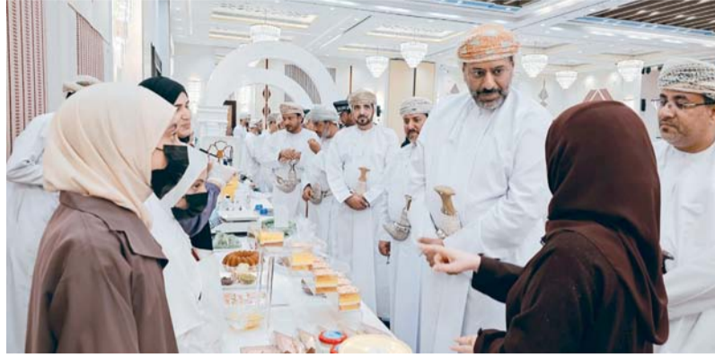
افتتاح المعرض المصاحب في نزوى

نزوى. من سالم السالمي: بهلاء. من مؤمن الهنائي: