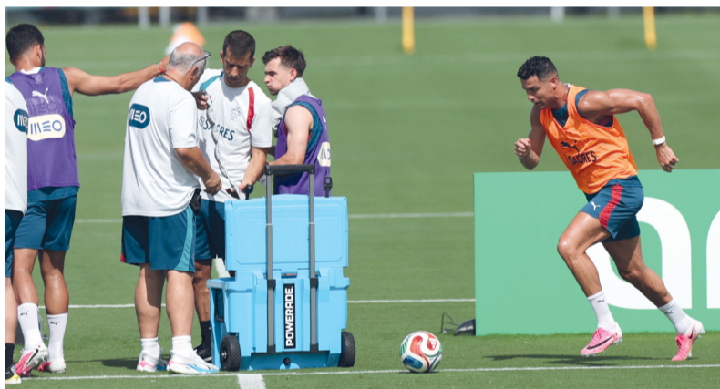
■ مهاجم المنتخب البرتغالي كريستيانو رونالدو خلال الحصص التدريبية الأخيرة

وبات المنتخب البرتغالي مطالباً بملاحقة صدارة المجموعة، وقد تتبرخ آماله مبكراً في حال تعثره في الجولة الثانية، علماً بأنه لم يفشل تاريخياً سوى مرة واحدة فقط في تحقيق الفوز في أول مباراتين له في كأس العالم. ومع ذلك، يمكن لأبطال دوري الأمم الأوروبية (٢٠١٩ و٢٠٢٥) الاعتماد على ديناميكية إيجابية، إذ لم يخسروا سوى مباراة واحدة من آخر ١٤ مواجهة دولية (١٠ انتصارات و٣ تعادلات). لكن تسجيلهم فوزاً واحداً فقط في آخر أربع مباريات في نهائيات كأس العالم (تعادل واحد وخسارتان) يدفعهم إلى التحلي بالحنز. وشنت الصحافة البرتغالية هجوماً على المنتخب، معتبرة أن رونالدو أصبح «بحد ذاته مشكلة». لكن الجناح الفرنسي سكو كونسيساو شدد الأمد على أنه لا يوجد أي شعور لدى اللاعبين بضرورة تمرير الكرة إلى رونالدو إذا كان هناك زملاء آخرون في مواقع هجومية أفضل. وقال «لا نشعر بالحاجة إلى تمرير الكرة إليه. أمرها لمن أراه في أفضل موقع وخالياً من الرقابة».