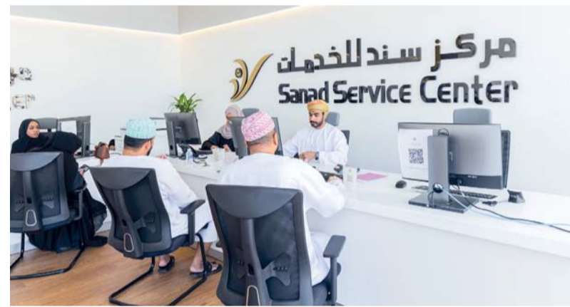
استمرار جهود الوزارة في تطوير واستدامة مراكز سند

القطاعات الاقتصادية الحيوية الداعمة للتنوع الاقتصادي، حيث بلغت الاستثمارات فيه نحو ٤,٣ مليار ريال عُماني، فيما وصلت مساهمته في الناتج المحلي إلى ٢,٣٥ مليار ريال عُماني في حين بلغت قيمة إعادة التصدير في السوق العُماني ٢,١ مليار ريال عُماني، كما بلغت قيمة الواردات ١٧,٢ مليار ريال عُماني، ما يعكس الدور المحوري للقطاع في دعم التجارة والاستثمار والتنمية الاقتصادية. وأكد السديري أهمية تعزيز التكامل بين مختلف الجهات المعنية لتطوير المنظومة اللوجستية، والاستفادة من المقومات التي تتمتع بها محافظة الظاهرة لدعم النمو الاقتصادي وجذب الاستثمار.