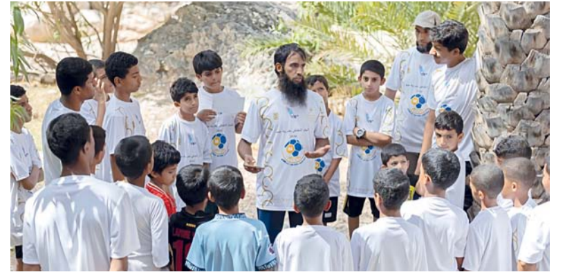
تعريف المشاركين بمعالم وتاريخ القرية

من جهته تحدث الدكتور زكريا الحرمي في مداخلته حول الإبداع النقدي والثقافي