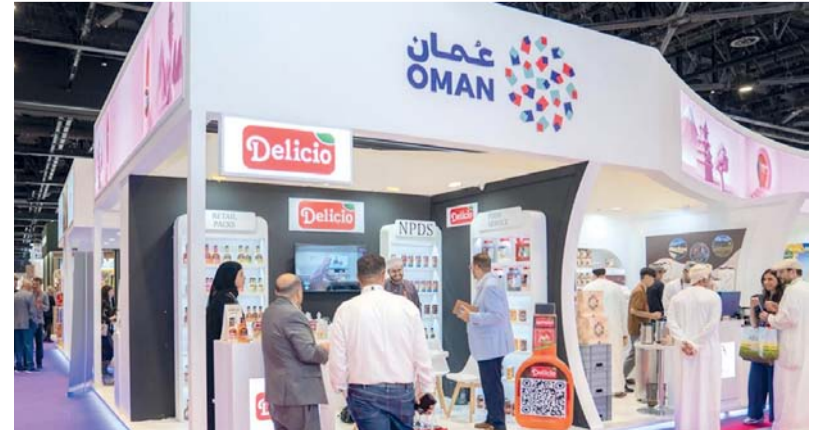
جناح سلطنة عمان المشارك في المعرض

الصغيرة والمتوسطة «ريادة» يعمل على تحقيق مجموعة من الأهداف الاستراتيجية، من أبرزها تعزيز الصادرات العُمانيّة، ودعم المؤسسات الصغيرة والمتوسطة، وجذب الاستثمارات النوعية إلى قطاع الصناعات التحويلية، إلى جانب تعزيز العلاقات التجارية والاستفادة من الاتفاقيات الاقتصادية بما يسهم في زيادة حجم التبادل التجاري وترسيخ مكانة سلطنة عُمان كمركز صناعي وتجاري حيوي. وتأتي مشاركات الفريق الدولية في إطار دعم مستهدفات التنوع الاقتصادي، وتعزيز تنافسية المنتج العُماني، وفتح آفاق جديدة أمام الشركات الوطنية للوصول إلى الأسواق العالمية، بما يسهم في زيادة الصادرات غير النفطية، وجذب الاستثمارات، وترسيخ حضور سلطنة عُمان على خارطة التجارة والصناعة الدولية.