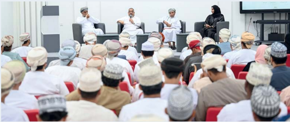
الفعالية حضرها عدد من الكتاب والمهتمين بالشأن الثقافي والأدبي

المتعلقة بمجلس التعاون الخليجي. كما كان الراحل أيضاً عضواً في مجلس إدارة النادي الثقافي في إحدى مراحلها، ومن مؤسسي الدعم الوطني للكتاب العماني في النادي.