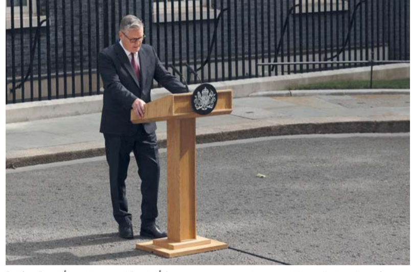
رئيس الوزراء البريطاني كير ستارمر يبدي بتصريح بشأن استقالته من منصبه أمام مقر رئاسة الوزراء في داوونينج ستريت أمس.

لندن . أ ف ب: أعلن رئيس الوزراء البريطاني كير ستارمر استقالته أمس الإثنين بعد أقل من عامين في منصبه، في ولاية اتسمت بانتكاسات سياسية وبشعبية متدنية جدا. وقال ستارمر في كلمة أمام مقر رئاسة الوزراء في داوونينج ستريت إن «كل قرار اتخذته كان هدفا وضعت له في البلد الذي أحبه أولا. ولهذا السبب ساستقيل من قيادة حزب العمال». وأضاف ستارمر إن عملية اختيار زعيم جديد لحزب العمال ستنتقل في يوليو، وإنه سيبقي رئيسا للوزراء إلى أن يتم اختيار خلفه، على أن يتولى الأخير منصبه قبل عودة البرلمان من عطلة الصيف في سبتمبر. ومن المقرر أن يؤدي خصمه الرئيسي، السياسي المخضرم أندري بورن، اليمين نائبا في البرلمان بعد فوزه الخميس في انتخابات فرعية حاسمة، ما يتيح له العودة إلى البرلمان ويمهد له الطريق للترشح لرئاسة الحزب. وأضاف ستارمر «سأبقى في