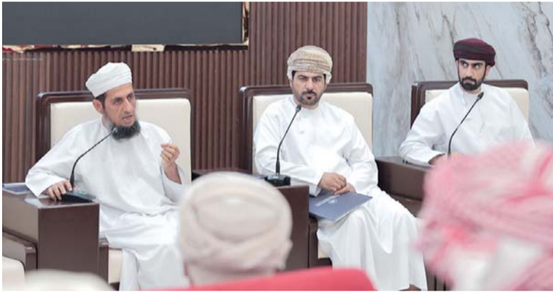
أهمية تعزيز التكامل بين مختلف الجهات المعنية لتطوير المنظومة اللوجستية