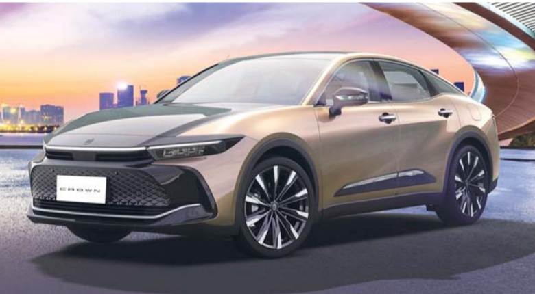
باقة مزايا حصري لعشاق كراون

المتقدمة حيث تشمل هذه المجموعة تقنيات متطورة مثل نظام ما قبل الاصطدام، ونظام تثبيت السرعة التكيفي بالرادار، ونظام المساعدة على الخروج الآمن المبتكر، الذي يستخدم أجهزة استشعار لمراقبة النقطة العمياء من أجل حماية الركاب أثناء خروجهم كما توفر شاشة الكاميرا للرؤية البانورامية بزوايا ٣٦٠ درجة سهولة في التنقل عبر الأماكن الضيقة مما يضمن راحة بال