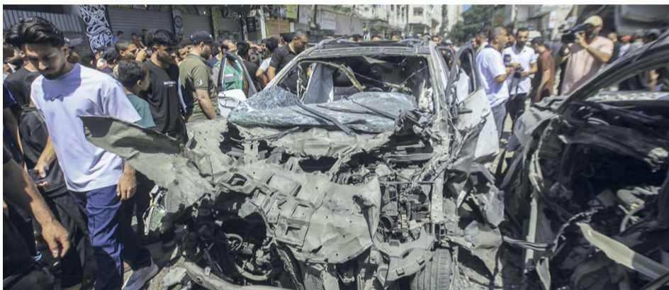
فلسطينيون يتفقدون سيارات متضررة بعد استهداف طائرات «إسرائيلية» مُسيّرة لمركبات مدنية في منطقة حي الرمال في مدينة غزة أمس.