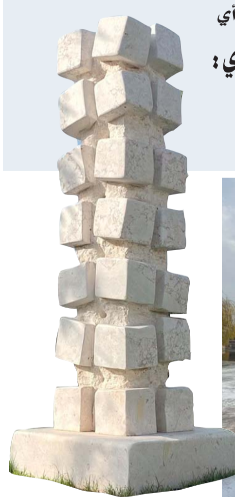
تجارب مختلفة لعدد من الخامات والتقنيات النحتية