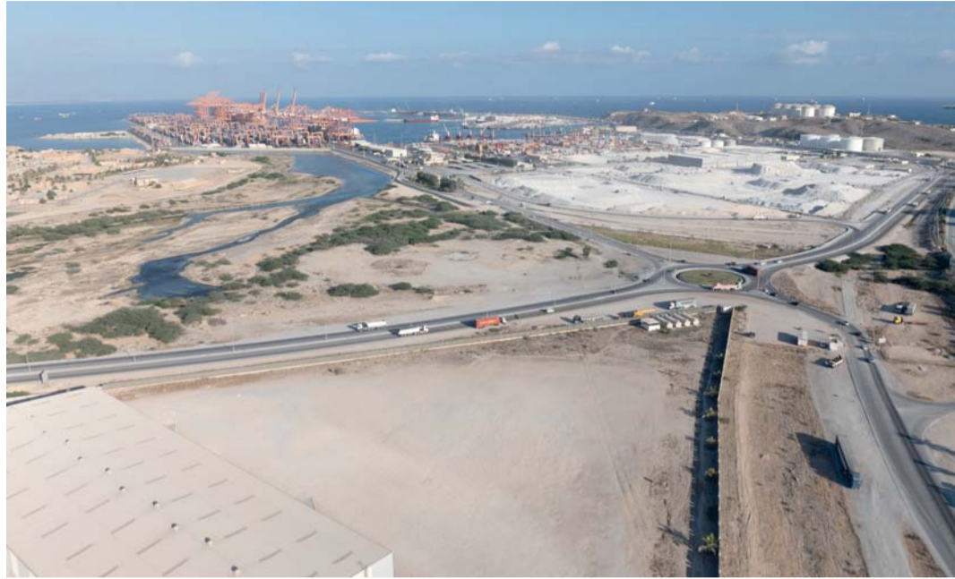
أسهمت المنطقة في تطوير الصناعات البتروكيماوية والتحويلية

ومع دخولها عقدها الثالث تواصل المنطقة الحرة بصلالة ترسيخ مكانتها كوجهة عالمية للاستثمار والصناعة والخدمات اللوجستية، مستندة إلى موقعها الاستراتيجي وبنيتها الأساسية المتطورة وتنوع موارد محافظة ظفار بما يسهم في دعم مستهدفات رؤية عُمان ٢٠٤٠ وتعزيز التنوع الاقتصادي وخلق قيمة مضافة مستدامة للاقتصاد الوطني.