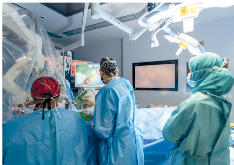
العملية تُعد من الإجراءات السوبرميكروسكوبية الدقيقة والمتقدمة

مسقط - العمانية: نجح فريق مشترك من المدينة الطبية الجامعية، ممثلاً بقسم جراحة التجميل والتجميل بمستشفى جامعة السلطان قابوس، وقسم جراحة الأورام في مركز السلطان قابوس المتكامل لعلاج وبحوث أمراض السرطان، في إجراء أول عملية من نوعها في سلطنة عمان لتوصيل الأوعية المفاوية بالأوردة بعد استئصال الغدد المفاوية للورم. وتعد العملية من الإجراءات السوبرميكروسكوبية الدقيقة والمتقدمة، حيث تعتمد على توصيل الأوعية المفاوية الدقيقة جداً، تقل قطرها عن ٠.٥ ملمتر بالأوردة، بهدف تحسين تصريف السائل المفاوي بعد استئصال الغدد المفاوية، مما يسهم في تقليل التورم المفاوي والأعراض المصاحبة له.