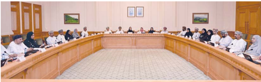
.. واجتماع فرعية اللجنة الاجتماعية والثقافية

وسياسات فاعلة إلى جانب المقترحات التي تعزز التبني المؤسسي للبحوث، وتوسيع نطاق الاستفادة منها بما يدعم كفاءة النظام التعليمي، ويحقق مستهدفات التنمية الوطنية. كما استضافت اللجنة الفرعية المنبثقة من الاجتماعية والثقافية بمجلس الدولة والمشكلة لمناقشة دراسة «سياسات وتشريعات دور الأسرة العمانية في حماية منظومة القيم في ظل التحول الرقمي»، عدداً من المختصين من وزارة التعليم ووزارة التنمية الاجتماعية برئاسة