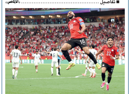
نجم المنتخب المصري محمد صلاح يحتفل بتسجيله الهدف الثاني لفرقة ضد نيوزيلندا أمس

فانكوفر «كندا». وكالات: حقق المنتخب المصري الفوز الأول في تاريخ مشاركاته في كأس العالم لكرة القدم، وجاء على حساب نظيره النيوزيلندي ١-٠ صباح أمس في فانكوفر الكندية، ما وضعه على مشارف التأهل إلى دور الـ ٣٢ لنسخة ٢٠٢٦ المقامة في أميركا الشمالية. وحولت مصر تخلفها بهدف لفن سورمان (١٥) إلى فوز بفضل مصطفى عبد الرؤوف «زيكو» (٥٨) ومحمد صلاح (٦٧) والبديل محمود حسن «تريزيغيه» (٨٢)، رافعة رصيدها إلى ٤ نقاط في صدارة المجموعة السابعة، بفارق نقطتين عن كل من إيران وبلجيكا اللتين تعادلتا مساء الأحد أيضاً ٠-٠.