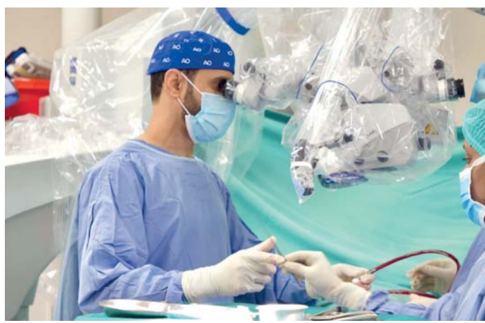
المبادرة تشمل إجراء العمليات الجراحية والأشعة في المستشفيات الخاصة

الاتفاق حول قيم التكافل والعطاء، وتعزيز جودة الحياة، وتقليص الفجوة الصحية، وتسريع الوصول إلى الخدمات الصحية بين شرائح المجتمع.