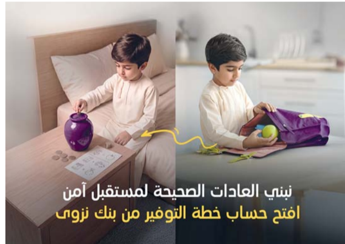
بني العادات الصحية لمستقبل آمن افتح حساب خطة التوفير من بنك نزوى

يعزز بنك نزوى التزامه بترسيخ العادات المالية السليمة، من خلال مواصلة تشجيع عملائه على تبني نهج منظم في الادخار عبر حساب الودعية المتكررة وقد تم تصميم هذا الحل لدعم تطلعات العملاء في تحقيق أهدافهم المالية طويلة الأجل، حيث يوفر الحساب تغطية تكافلية مجانية على الحياة، إلى جانب معدلات ربح تنافسية، مما يمكن العملاء من تنمية مدخراتهم بثقة أكبر، وبما يتوافق مع مبادئ الشريعة الإسلامية. ويقدم برنامج الودعية المتكررة إطارا مرنا ومنظما للادخار إذ يتيح للعملاء اختيار مدة تتراوح من سنة واحدة وحتى عشر سنوات مع حد أدنى لفتح الحساب يبلغ ٥ ريالات عمانية لكافة الفئات كما يوفر البرنامج إمكانية الإيداع الشهري بمبالغ تبدأ من ٥ ريالات عمانية للأطفال و١٠ ريالات عمانية للأفراد البالغين ووفقا لمعدلات الربح الخاصة ببرنامج الودعية المتكررة، حيث تبدأ من ٢,٠٩٪ لمدة ١٢ شهرا، وترتفع تدريجيا لتصل إلى ٣,٧٠٪ لمدة ١٢ شهرا و سيجصل عملاء الودائع المتكررة المؤهلون على تغطية تكافل مجانية تصل إلى ٥٠,٠٠٠ ريال عماني، ما يوفر لهم ولعائلاتهم مزيدا منطمأنينة والأمان المالي، ويعزز من المزايا التي يقدمها المنتج دون تحميل العملاء أي تكاليف إضافية.