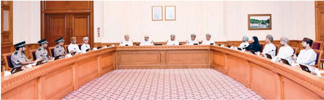
اجتماع اللجنة القانونية بمجلس الدولة

وفي السياق ذاته استعرضت اللجنة مع وزارة التنمية الاجتماعية السياسات والبرامج الوطنية المعتمدة في مجال حماية الطفل وتمكين الأسرة وتعزيز استقرارها، وبحث والتحريات الاجتماعية التي تواجه الأسر في ظل التأثيرات الرقمية، وجهود الوزارة في مجال التوعية المجتمعية وبناء قدرات الأسر في التوجيه والمتابعة إلى جانب مناقشة أوجه تطوير السياسات والبرامج ذات العلاقة، وتعزيز التكامل المؤسسي بين الجهات المعنية بما يدعم الأسرة ويعزز دورها في حماية منظومة القيم المجتمعية.