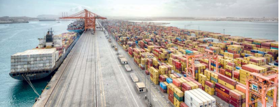
ارتفاع حجم الإنفاق العام الفعلي بنسبة ٧ في المائة

ملايين ريال عماني بزيادة قدرها ٨٦ مليون ريال عماني مقارنة بالمعتمد، ويأتي ذلك تنفيذاً للأوامر السامية بتثبيت أسعار بيع الوقود. وسجلت الميزانية العامة للدولة بنهاية عام ٢٠٢٥ عجزاً مالياً بنحو ٤٦١ مليون ريال عماني مقارنة بالعجز المقدر في الميزانية بنحو ٦٢٠ مليون ريال عماني؛ نتيجة لارتفاع الإيرادات النفطية.