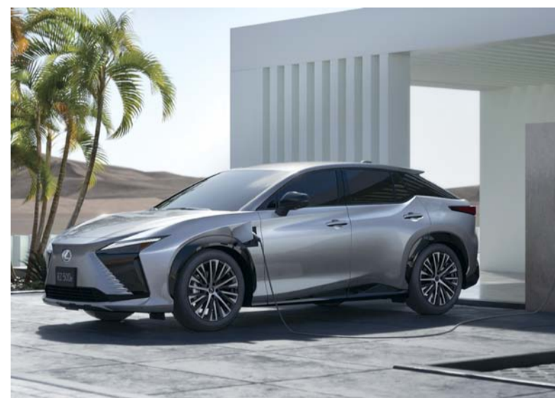
تمثل سيارة أر زد ٥٠٠ إي أول سيارة كهربائية بالكامل في سلطنة عُمان

لتوفير قوة جر وثبات فائقين أثناء التسارع والانطلاق في خط مستقيم ويتم تعديل عزم الدوران ديناميكياً للحد من التمايل وتوفير استجابة