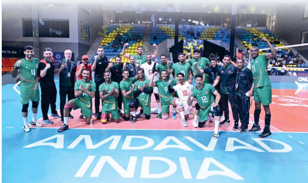
فرحة لاعبي المنتخب بالفوز في المباراة الافتتاحية