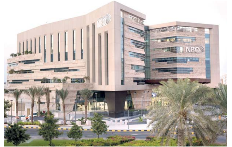
البنك الوطني العماني