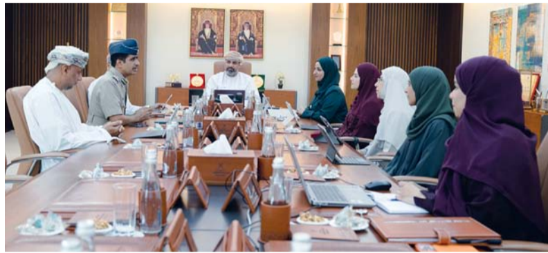
استعراض أفضل الممارسات العالمية في مجال ضمان جودة التعليم

وخطوات تنفيذية، وأهمية هذا الاعتراف في تعزيز المكانة المؤسسية للهيئة وترسيخ حضورها على المستوى الدولي وفق أفضل الممارسات العالمية في مجال ضمان جودة التعليم. وفي ختام الاجتماع، أكد المجلس أهمية مواصلة الجهود الرامية إلى تطوير منظومة ضمان جودة التعليم في سلطنة عُمان، ودعم المبادرات والمشاريع الاستراتيجية التي تساهم في تحقيق مستهدفات الهيئة، وتعزيز جودة مخرجات التعليم بما ينسجم مع الأولويات الوطنية.