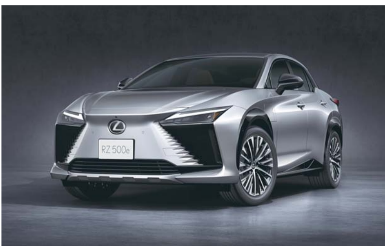
تمتيز لكرس بإجراءات شاملة للحد من الضوضاء

وتتميز بإجراءات شاملة للحد من الضوضاء ويقلل الهيكل السفلي المغطى بالكامل وغطاء المحرك المحكم والزجاج العازل للصوت ومواد عزل الصوت، بالإضافة إلى كاتمات صوت إضافية في أرضية المقصورة الخلفية من تسرب الضوضاء الخارجية كما يقلل اللاصق عالي التخميد المطبق على أرضية الهيكل من الاهتزازات، بينما تعمل مواد امتصاص الصوت الموضوعة استراتيجياً في جميع أنحاء