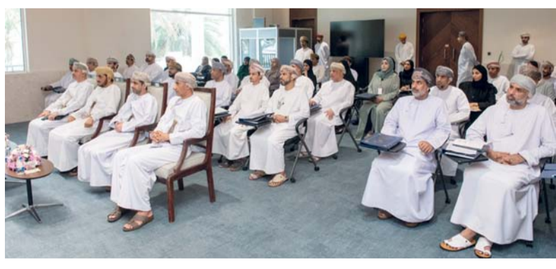
تعزيز الوعي بالتوجهات الاستراتيجية للدولة

والاجتماعية والتنمية. وأوضح سعادته أن البرنامج يهدف إلى ترسيخ مجموعة من المبادئ والمرتكزات التي تقوم عليها عملية صنع القرار، وفي مقدمتها تحقيق التوازن بين التنمية الاقتصادية والاستقرار الاجتماعي، وتعزيز مبادئ العدالة والمساواة، وترسيخ سيادة القانون، بما يساهم في بناء مجتمع مزدهر ومستقر وقادر على مواكبة المتغيرات الإقليمية والدولية.