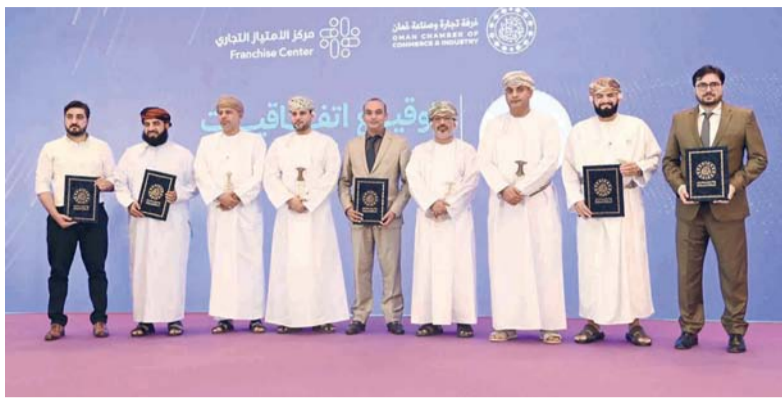
توقيع ٦٢ اتفاقية منح امتياز تجاري لعدد من العلامات التجارية

كما تم خلال الحفل توقيع ٦٢ اتفاقية منح امتياز تجاري لعدد من العلامات التجارية العمانية من العلامات التجارية العمانية في ٧ دول، وهي سلطنة عُمان، والولايات المتحدة الأمريكية، وجمهورية باكستان الإسلامية، والمملكة العربية السعودية، وجمهورية الكوادر، ودولة قطر، ودولة الكويت.