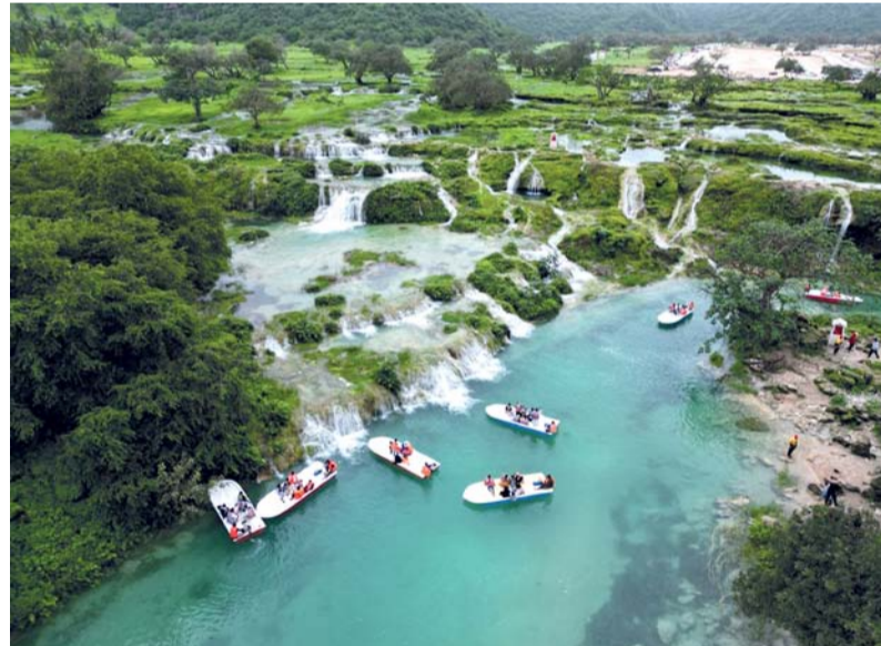
تعزيز تغذية الخزانات الجوفية وزيادة تدفقات العيون المائية (صورة إرشيفية)

وأضاف أن المنخفض الجوي الذي تأثرت به محافظة ظفار خلال الفترة من ١٥ إلى ٢٥ أغسطس ٢٠٢٥ أسهم في تعزيز الحصيلة المطرية للموسم، من خلال رفع معدلات الهطول وتنشيط جريان الأودية والشلالات وزيادة معدلات التغذية الجوفية. وبين أن نتائج التحليل الهيدرولوجي أظهرت استجابة إيجابية للخزانات الجوفية تمثلت في ارتفاع مناسيب المياه وزيادة تدفقات بعض العيون المائية عقب نزوة الهطول خلال شهري يوليو وأغسطس، واستمرار هذه الاستجابة خلال الأشهر اللاحقة، بما يؤكد الدور الحيوي لموسم الخريف في تعزيز استدامة الموارد المائية بالمحافظة. وأوضح أن إجمالي المياه المتدفقة من العيون المائية