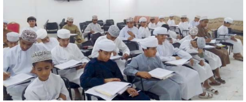
المركز يستضيف ٢٦ طالباً من مختلف محافظات سلطنة عُمان

وأوضحت: أن مشاركة سلطنة عُمان في المعرض تميزت بالتركيز على تقديم الثقافة العُمانية بأسلوب حديث يجمع بين الكتب والمنشورات التعريفية والمواد البصرية والذي منح الجناح حيوية أكبر وساعد في إيصال الرسالة الثقافية والإعلامية بصورة مؤثرة.