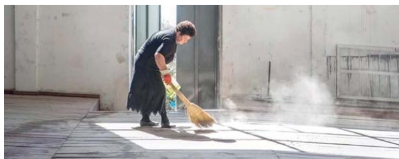
الكشف عما يختبئ خلف المشهد الظاهر في الصورة

وتبدو صور شتراوس دعوة إلى إعادة النظر في الأشياء المألوفة، فالخط الذي يبدو في الظاهر عصباً بصرياً بسيطاً يتحول إلى مدخل للتفكير في الانقسامات والحواسج والعلاقات الإنسانية، كما تتجلى الأعمال في إيجاد حالة من التأمل لدى المتلقي، إذ تدفعه إلى تجاوز القراءة المباشرة للصورة والبحث عن المعاني التي تستتر خلفها. وتأتي إقامة هذين المعرضين ضمن رؤية مهرجان الصورة التي تركز على القصص غير المرئية والعمليات التي تحدث بعيداً عن الأضواء ووضوح الرؤية فيها، ولعل هذا ما يؤكد عنوان المهرجان (خلف الكوايس)، الذي يشير إلى ما يجري وراء الأحداث، ويدعو في الوقت نفسه إلى اكتشاف ما تخفيه الصور من طبقات دلالية وتجارب إنسانية فريدة.