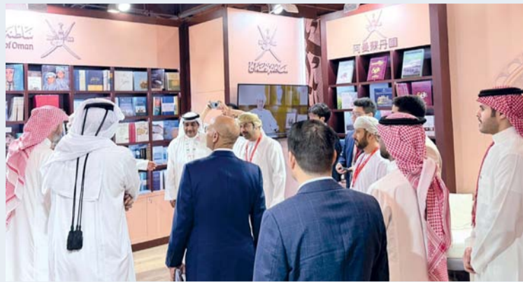
جناح سلطنة عُمان يضم محتوى ثقافياً ومعرفياً يعكس الهوية العُمانية

وعكست هذه الآراء تنوع الانطباعات حول المشاركة العُمانية في معرض بكين الدولي للكتاب والتي أسهمت في إبراز الهوية الثقافية العُمانية، والتعريف بإصداراتها ومؤسساتها الثقافية، إلى جانب فتح آفاق جديدة للتعاون في مجالات النشر والترجمة والتبادل الثقافي بين سلطنة عُمان والصين.