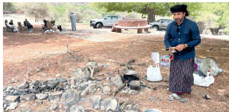
عرض أعمال توثق جوانب من المجتمع العُماني وقصصه المهملة

ومن المقرر أن يواصل المشاركون خلال الأيام المقبلة تطوير الأفكار التي خرجوا بها من الزيارات الميدانية وتحويلها إلى مشاريع أفلام وثائقية متكاملة، ضمن رحلة تدريبية تمتد من البحث والاستكشاف إلى كتابة السيناريو والتصوير والإنتاج، وصولاً إلى عرض أعمال توثق جوانب من المجتمع العُماني وقصصه المهملة.