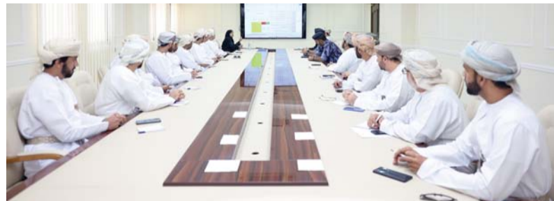
الوثيقة أداة أساسية لإدارة التحديات المعقدة والمخاطر المتغيرة

لاعتمادها بصيغتها النهائية، بما يساهم في تعزيز كفاءة اتخاذ القرار، ورفع مستوى جاهزية