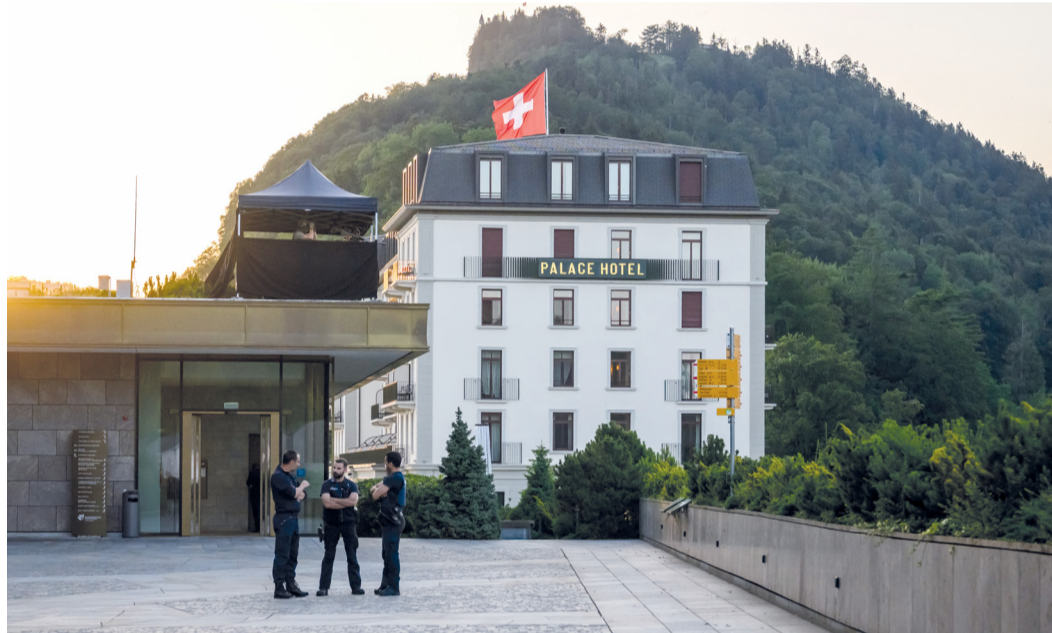
عناصر من الشرطة تقف بجوار مبنى في مجمع فندق بورجنشتوك المطل على بحيرة لوسيرن في سويسرا، قبيل انطلاق جولة جديدة من المفاوضات بين الولايات المتحدة وإيران بهدف إنهاء الحرب في الشرق الأوسط.

جنيف - عواصم - وكالات: بدأت في سويسرا جولة جديدة من المفاوضات بين الولايات المتحدة وإيران بهدف إنهاء الحرب في الشرق الأوسط استناداً إلى مذكرة التفاهم الموقعة بين الطرفين، حيث تشهد المفاوضات اجتماعاً رباعياً بين الولايات المتحدة وإيران والوسطاء، علاوة على لقاءات ثنائية.