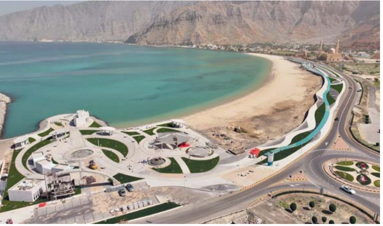
المشروع يشكل ركيزة أساسية في دعم توجهات التنمية السياحية بالمحافظة

والخدمات تشمل مشى بطول ٨٠٠ متر وأكشاكاً تجارية متنوعة، ومرقفاً لتأجير القوارب، ومطعماً بتصميم عصري وإطلالة مباشرة على البحر، ومنطقة مخصصة لألعاب الأطفال، ونوافير مائية تجميلية، ومساحات خضراء ومناطق للتشجير، فضلاً عن جلسات خارجية مظلة ومرافق خدمية مساندة. وأوضح أن مشروع الواجهة البحرية بولاية بغاء يجسد نقلة نوعية في تطوير المرافق السياحية والترفيهية بمحافظة مسندم، من خلال الإسهام في تعزيز الجذب السياحي للولاية، وتحسين المشهد الحضري والجمالي للمنطقة الساحلية، وتوفير بيئة ملائمة للأنشطة البحرية والفعاليات المجتمعية.