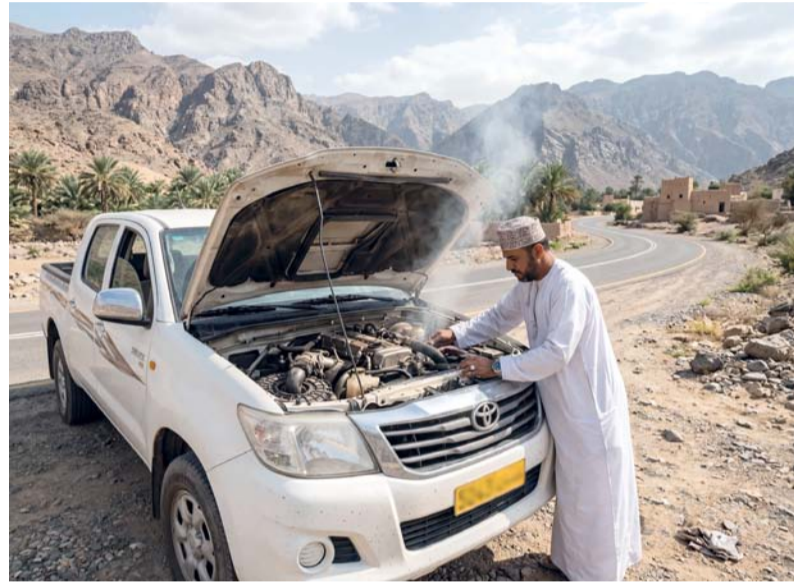
فحص نظام التبريد ومستوى سائل التبريد

ارتفاع درجات الحرارة يؤثر على كفاءة المركبات ويعرضها للأعطال الفنية