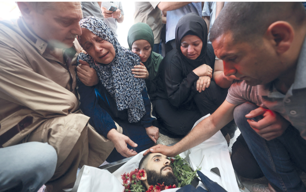
أقرب المصور الصحفي الشهيد أحمد وشاح مراسل قناة الجزيرة يودعونه بعد ارتقائه في قصف إسرائيلي، استهدف مخيم البريج وسط قطاع غزة.

الأربعاء .. مبادرات جديدة تعزز منظومة البيانات الوطنية مسقط - العُمانية: يطلق المركز الوطني للإحصاء والمعلومات يوم الأربعاء المقبل تطبيق «أرتاج»، التفاعلي والويب التنبؤي للجهات الإدارية للدولة ومشروع مستودع البيانات المركزي، حيث يأتي تنفيذ هذه المبادرات في إطار جهود المركز الرامية إلى تعزيز منظومة البيانات الوطنية وترسيخ الثقافة الإحصائية، وتوظيف التقنيات الحديثة لدعم التنمية وصناعة القرار المبني على الأدلة، إلى جانب تعزيز التكامل المؤسسي والنحو الرقمي في الجهاز الإداري للدولة بما يسهم مع مستهدفات رؤية عمان ٢٠٤٠. تفاصيل.....ص ٩