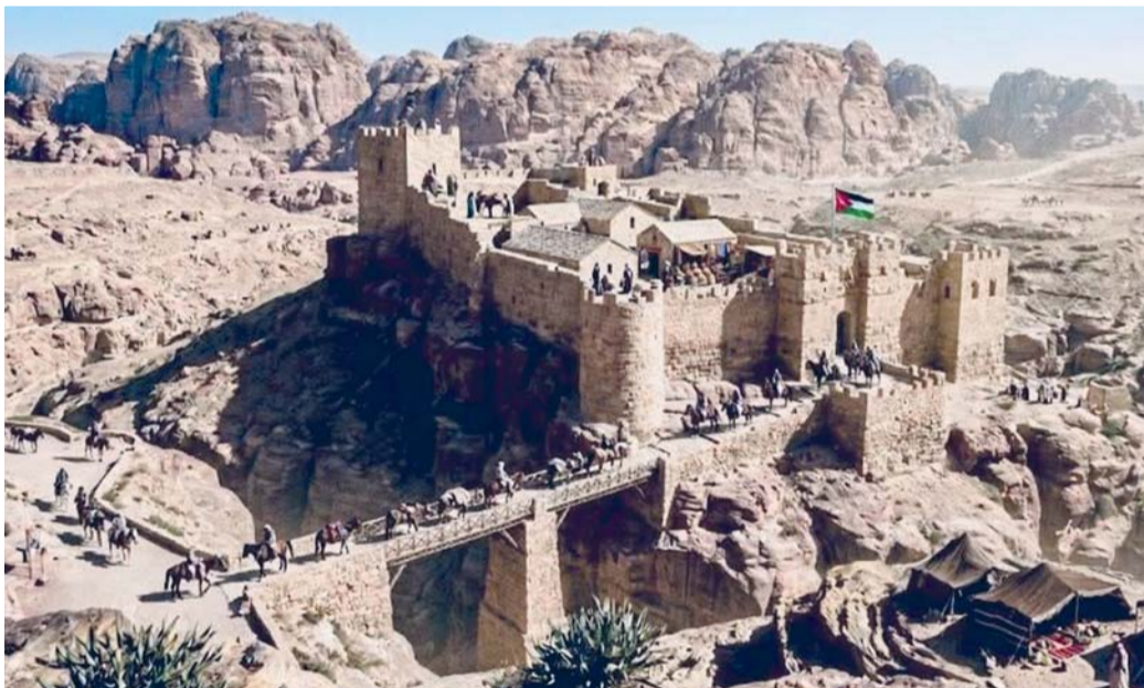
القلعة من أبرز القلاع التي أنشئت في بلاد الشام خلال فترة الحروب الصليبية

تبدأ يوم غد الاثنين أولى فعاليات برنامج (ثقافة وفن) في موسمه الثاني والذي تنظمه إدارة الثقافة والرياضة والشباب بمحافظة الظاهرة، وذلك من خلال إقامة اول فعالية والتي تأتي بعنوان (تصميم المطبوعات القماشية)، ضمن سلسلة من البرامج والأنشطة الموجهة للناشئة خلال الإجازة الصيفية.