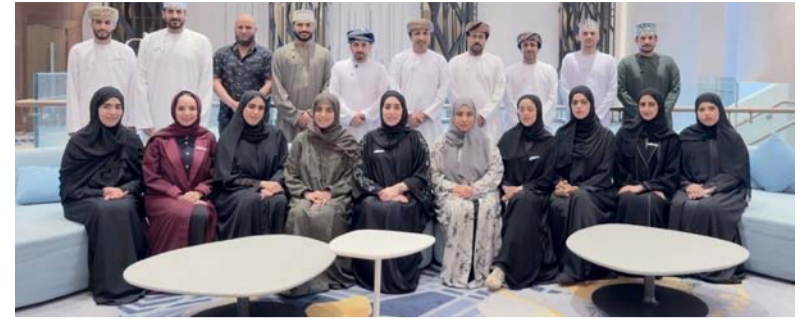
البرنامج يمكن المصانع الوطنية من تبني أفضل الممارسات العالمية في مجالات الكفاءة التشغيلية