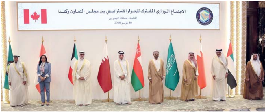
■ الاجتماع الخليجي الكندي يناقش سبل تعزيز التعاون في المجالات الاقتصادية والعلمية

والقى وفد سلطنة عُمان المشارك بياناً أشار فيه إلى أهمية هذه المناسبة في تجديد الالتزام بالمبادئ التي أرسيتها الاتفاقية والبناء على ما تحققت من إنجازات خلال العقدتين الماضيتين. وأشار البيان إلى أن النظام الأساسي للدولة الصادر بالمرسوم السلطاني رقم (٢٠٢١/٦) أكد التزام الدولة برعاية الأشخاص ذوي الإعاقة وتعزيز المساواة وتكافؤ الفرص. وأوضح البيان أن سلطنة عُمان شهدت خلال العام الماضي تطوراً تشريعياً مهماً تمثل في صدور قانون حقوق الأشخاص ذوي الإعاقة بموجب المرسوم السلطاني رقم (٢٠٢٥/٩٢)، الذي يجسد التزام سلطنة عُمان بأحكام الاتفاقية الدولية، ويكرس مبادئ عدم التمييز وتكافؤ الفرص والدمج الكامل، ويعزز حقوق الأشخاص ذوي الإعاقة في التعليم الدامج والرعاية الصحية وغيرها من المجالات، إلى جانب إرساء آليات مؤسسية للرصد والتقييم والمتابعة.