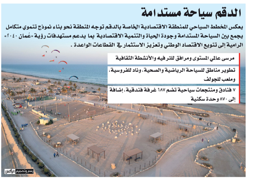
اسم وتصميم المهندس

ويستند المخطط إلى مقومات طبيعية وسياحية متنوعة تتمثل في الشواطئ الرملية الممتدة والتكوينات الصخرية الفريدة والمناظر الطبيعية الساحلية، إلى جانب موقعه الاستراتيجي القريب من ميناء الدقم ومطار الدقم، بما يدعم سهولة الوصول والحركة السياحية والاستثمارية.