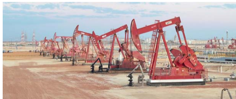
■ الوزارة تدعم التوجه نحو استخدام التقنيات الحديثة في رفع كفاءة استخراج النفط

في تنفيذ مشروع «رياح ١» و«رياح ٢» بسعة إنتاجية تصل إلى ٢٠٠ ميغاواط، ويعدان من أوائل المشروعات عالمياً المرتبطة بالنفط والغاز وبلغت نسبة إنجاز المشروعين حوالي ٤٢ بالمائة ومن المتوقع أن يسهما في خفض ٧٤٠ ألف طن من انبعاثات ثاني أكسيد الكربون سنوياً عند بدء تشغيلها في الربع الأخير من العام الجاري في منطقة الامتياز رقم (٦). وأشار إلى أنه يجري أيضاً تنفيذ مشروع الطاقة الشمسية الكهروضوئية في شمال منطقة الامتياز رقم (٦) بقدرته تصل إلى ١٠٠ ميغاواط، حيث بلغت نسبة إنجازها ٥١ بالمائة ومن المتوقع تشغيله في الربع الثاني من عام ٢٠٢٦ م، ليساهم في تقليل أكثر من ٢٢٠ ألف طن من الانبعاثات سنوياً.