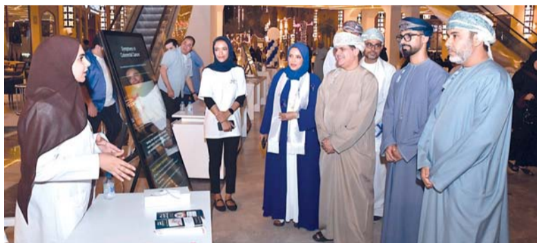
الكشف المبكر يُعد العامل الأهم في رفع نسب الشفاء

مراجعة الطبيب، إلى جانب استعراض أحدث الوسائل المتبعة في التشخيص والعلاج.