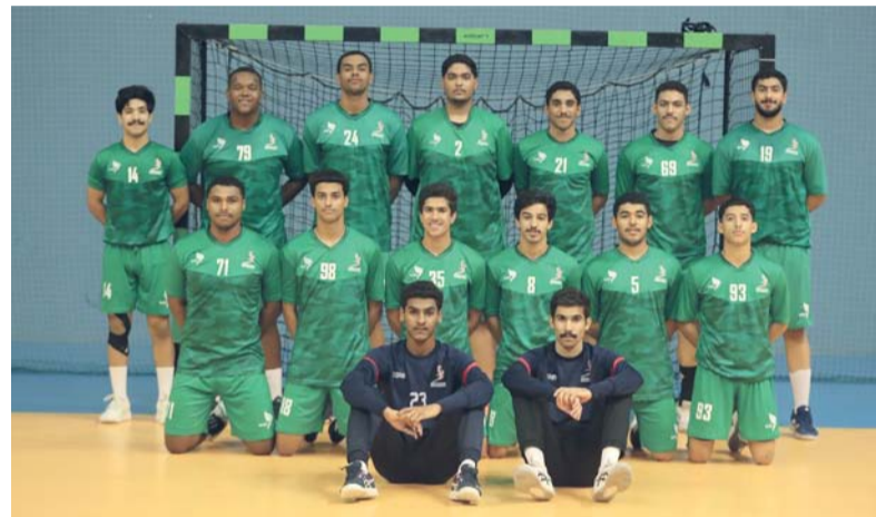
■ منتخب الشباب لكرة اليد

أدائهم إلى جانب معالجة الملاحظات الفنية التي ظهرت خلال المباراتين الوديتين اللتين خاضهما المنتخب مؤخراً أمام المنتخب اليمني واللتين شكلتا أولى التجارب الدولية للفريق تحت قيادته. كما تمثل البطولة فرصة مهمة للمنتخبات الخليجية المشاركة لقياس مدى جاهزيتها قبل البطولة الآسيوية خاصة أن جميعها تطمح إلى تحقيق نتائج إيجابية والمنافسة على بطاقات التأهل إلى بطولة العالم، ويواصل منتخبنا الوطني حالياً برنامجته الإعدادي المكثف من خلال التدريبات اليومية المسائية التي تقام في الصالة الرئيسية