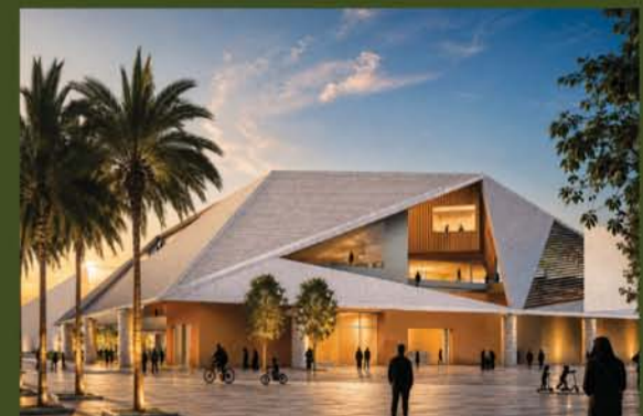
المركز الثقافي والاجتماعي Cultural and Community Centre