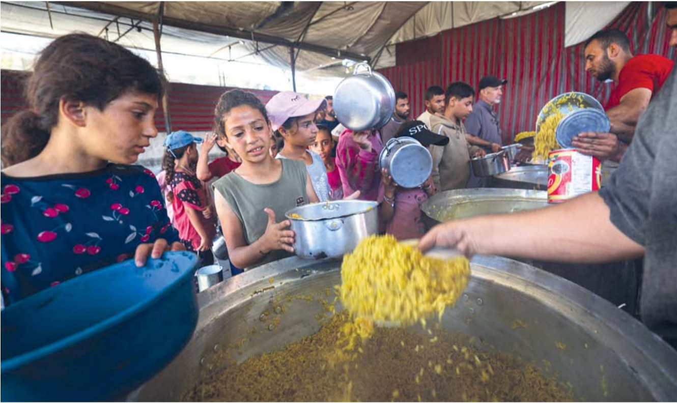
فلسطينيون نازحون يجتمعون لتلقي وجبات ساخنة وزعها أحد المطابخ الخيرية في مخيم النصيرات للاجئين الفلسطينيين وسط قطاع غزة