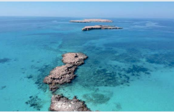
تسليط الضوء على أهمية محمية جزر الديمانيات الطبيعية

نظمت المديرية العامة لمستشفى خولة يوماً توعوياً حول سرطان القولون والمستقيم في إطار جهوده المستمرة لتعزيز الوعي الصحي لدى أفراد المجتمع ونشر الثقافة الوقائية حول الأمراض المزمنة والأورام، وتسليط الضوء على أهمية الكشف المبكر ودوره في