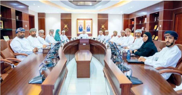
■ من اجتماع مجلس إدارة اللجنة الأولمبية