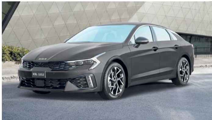
■ كيا K5 تجمع بين تقنيات السلامة المتقدمة والميزات الفاخرة

تواصل سيارة «كيا K5» الصالون الشهيرة تحقيق نجاح باهر في سلطنة عمان بتصميمها المميز وانسابيتها. وكجزء من حملة الصيف الحالية، يُمكن للعملاء الآن الاستفادة من خصومات رائعة ومزايا جذابة على هذه السيارة الصالون المتطورة. ضُمت «K5»، لأولئك الذين يتوقون إلى لحظات مشوقة في كل رحلة، فهي تجمع بين تقنيات السلامة المتقدمة والمظهر والميزات الفاخرة مع راحة بال تامة. وتقدم حملة الصيف هذه مزايا مالية كبيرة، تبدأ بخصومات تصل إلى ١١٠٠ ريال عماني، تُضاف مباشرة إلى سعر السيارة كخصم خاص بالإضافة إلى العرض النقدي الممتد.