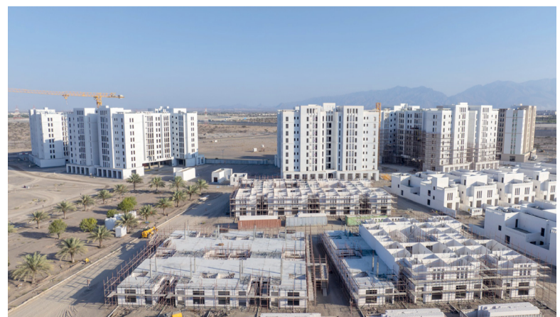
أسعار العقارات التجارية شهدت نمواً بنسبة ١٥,٩ بالمائة

مسقط. العُمانية: سجّل مؤشر الرقم القياسي لأسعار العقارات في سلطنة عُمان ارتفاعاً بنسبة ١٥,٩ بالمائة في الربع الأول من عام ٢٠٢٦ مقارنة بالفترة ذاتها من عام ٢٠٢٥. وأشارت البيانات الصادرة عن المركز الوطني للإحصاء والمعلومات إلى أن أسعار العقارات