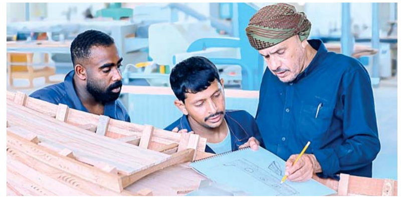
البرنامج يهدف إلى تأهيل كوادر وطنية متخصصة في هذا المجال الحرفي والتراثي

وتهدف إلى تعريف المشاركين بأساسيات الطباعة الفنية باستخدام قالب اللينو، حيث يتم تعريفهم على مراحل إعداد التصميم وتنفيذها عملياً، قبل تطبيقها يدوياً بأساليب إبداعية تعكس أفكارهم وميولهم الفنية. وتنمية المهارات الفنية والحرفية لدى المشاركين، وتعزيز قدراتهم على الابتكار والتعبير عن الذات من خلال الأعمال اليدوية. ويأتي تنظيمها ضمن جهود الإدارة الرامية إلى توفير بيئة ثقافية وفنية