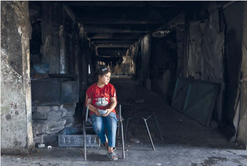
فتاة فلسطينية تجلس داخل مجمع مدرسة تؤولي نازحين في مخيم جباليا للاجئين شمال قطاع غزة.