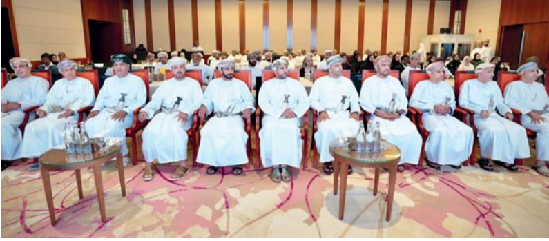
المركز يعزز منظومة التحكيم التجاري وتسوية المنازعات