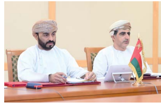
الوفد المشارك في الاجتماع

وشهد الاجتماع تبادل الرؤى والأفكار حول أبرز التحديات التي تواجه إدارات المجالس والبرلمانات العربية في ظل المتغيرات المتسارعة، وسبل الاستفادة من التقنيات الحديثة والابتكارات الإدارية في تطوير بيئات العمل البرلماني، وتعزيز التكامل والتعاون بين الأمانات العامة بما يخدم الأهداف المشتركة للبرلمانات العربية.