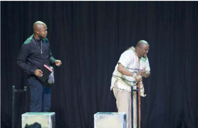
■ العرض يتناول قضايا الإيمان والصداقة والتسامح

موتسوري، فيما تولى فورتشن موغا أتينغ تصميم الإضاءة. تناول العرض قضايا الإيمان والصداقة والتسامح، مؤكداً قدرة الإنسان على تجاوز الانقسامات العنصرية والاختلافات الفكرية. ويطرح العمل رؤية ترمز بين التأمل والفكاهة، مسلطاً الضوء على مخاطر التعصب الديني، وكيف يمكن للمعتقدات المتباينة أن تكون جسراً للتقارب والتفاهم بدلاً من أن تتحول إلى أسباب للفتنة والانقسام.