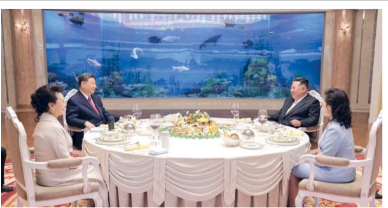
الزعيم الكوري الشمالي كيم جونج أون وزوجته ري سول جو إلى جانب الرئيس الصيني شي جينبينج وزوجته بنج لي يوان وهم يتناولون الغداء في دار ضيافة كوموسوان الحكومية في بيونج يانج قبل أن يختم الرئيس الصيني زيارته لكوريا الشمالية.

على أهمية القوة المشتركة متعددة الجنسيات في مواجهة التهديدات المتطرفة بمنطقة بحيرة تشاد، مؤكدة أن التعاون الأمني الإقليمي يظل عنصرا أساسيا في مكافحة الإرهاب والعنف المسلح، مشيرة إلى أن الحلول الأمنية وحدها لن