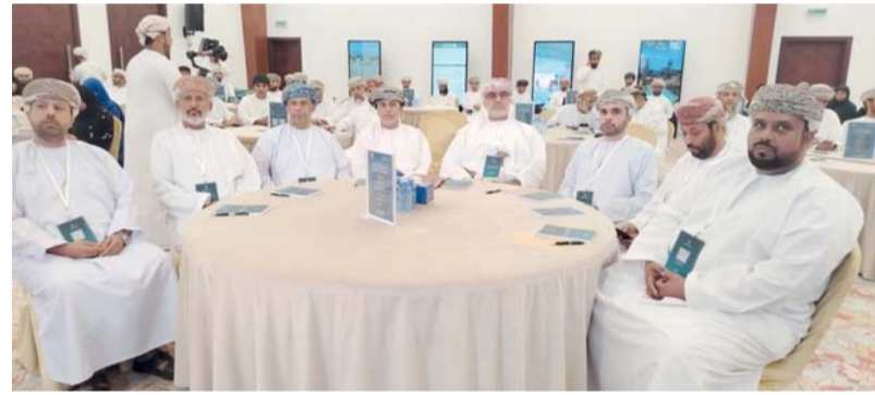
استعراض المؤشرات والنتائج التي تحققت خلال الفترة الماضية

دعاء والطايبين بتكلفة ٦٦١ ألف ريال عُمانى ونسبة إنجاز بلغت ٤٠ بالمائة، ومشروع تطوير مهقى حاور بتكلفة ١٥٣ ألف ريال عُمانى ونسبة إنجاز ٩٥ بالمائة، وإنشاء وتطوير ٩ ملاعب للأطفال بولايات المحافظة بتكلفة ٥٧٧ ألف ريال عُمانى. وأوضح سعادته بأن بلدية شمال الشرقية تنفذ خلال عام ٢٠٢٦ جملة من المشاريع الخدمية والتطويرية في كافة ولايات المحافظة بتكلفة تقدر بـ ٣٤٥ مليوناً، و١٦ ألفاً، و٩٠٠ ريال عُمانى، أبرزها مشاريع رصف الطرق الداخلية بطول ١٧٠ كم بتكلفة ١٧ مليوناً و ٨٦٠ ألف ريال عُمانى، ومشاريع صيانة الطرق المتضررة بتكلفة ٥ ملايين، و٨٢٩ ألف ريال عُمانى، بالإضافة إلى مشاريع تشمل أعمال صيانة وتخطيط الطرق بتكلفة ٨٥٠ ألف ريال عُمانى، ومشاريع المُنْتَهات والمعاشي بتكلفة مليون، و٣٠٥ ألف ريال عُمانى، ومشاريع الإنارة والتجميل بتكلفة ٦٦٦ ألفاً، و٩٠٠ ريال عُمانى، ومشاريع المرافق الخدمية المتمثلة في تكملة الأعمال بقاعات متعددة الأغراض بمبلغ وقدره ١٨٠ ألف ريال عُمانى، هذا إلى جانب مشاريع