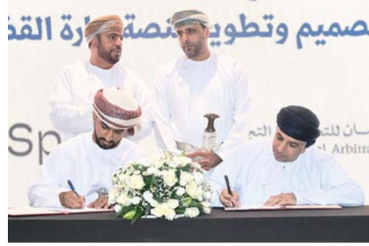
الاتفاقية تسهم في تطوير منظومة التحكيم التجاري بسلطنة عُمان

ويتوافق مع أفضل الممارسات والمعايير الدولية المعتمدة في مؤسسات التحكيم الرائدة حول العالم. وأكد على أن إصدار القواعد الجديدة للمركز جاء ثمره دراسة متعمقة للتجارب الدولية الحديثة، ومراجعة شاملة للتطورات التي شهدتها قطاع التحكيم خلال السنوات الأخيرة، وقد روعي في هذه القواعد تعزيز الكفاءة الإجرائية، وتسريع الفصل في المنازعات، والاستفادة من التقنيات الحديثة، بالإضافة إلى ترسيخ مبادئ الحوكمة والشفافية والعدالة. بدوره أوضح الدكتور عبدالله بن ناصر المنذري الرئيس التنفيذي مركز عمان للتحكيم التجاري أهداف الشعار والألوان الرسمية الجديدة للمركز، مستعرضاً القواعد الجديدة للمركز وأهمية تطويرها بما يتواءم مع المعطيات الحديثة في مجال التحكيم الدولي، والممارسات المتجددة في التجارة الدولية، حيث تهدف إلى تعزيز كفاءة الإجراءات، وتحقيق المساواة بين أطراف النزاع، وتوفير إطار مهني واضح يساهم في الوصول إلى أحكام عادلة وفق القواعد المعتمدة وما يتفق عليه الأطراف.