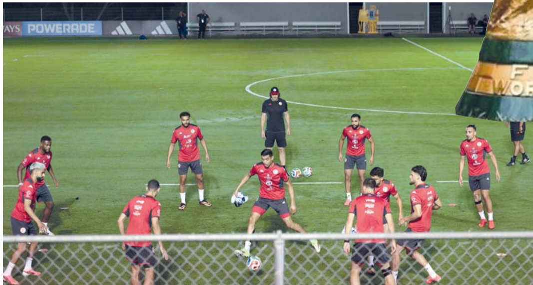
لاعبو المنتخب التونسي في حصة تدريبية بالمكسيك.

لوس أنجلوس. أ.ب.ب: ثلاثة بلدان مضيفة، و٤٨ منتخبا، وكثير من المتابع... إنها كأس عالم غير مسبوقة، تصطبغ بالتوترات الدولية وتداعيات رئاسة ترامب، وتنتقل الخميس في مكسيكو حيث قد تعكر الاحتجاجات الاجتماعية أجواء العرس الكروي. للمرة الثالثة في التاريخ بعد ١٩٧٠ و١٩٨٦، سيحظى ملعب أستيا الأسطوري بشرف احتضان، الخميس عند الساعة ١٣:٠٠ (١٩:٠٠ ت غ)، أول المباريات الـ١٠٤ في البطولة، لقاء المكسيك وجنوب إفريقيا، في إعادة لمباراة افتتاح مونديال ٢٠١٠. انعكاساً لطموحات فيفا العملاقة في عهد جاني إنفانتينو، ستقام البطولة للمرة الأولى في ١٦ ملعباً، يفصل بين بعضها ما يصل إلى ٤٠٠٠ كيلومتر، من غوادالاخارا إلى فانكوفر، ومن لوس أنجلوس إلى بوسطن، في صيغة تعرضت لانتقادات بسبب بصمتها البيئية. على مدى نحو ستة أسابيع، وحتى النهائي في ١٩ يوليو في إيست رانزفورد قرب نيويورك، سيعيش عشاق الكرة المستديرة على وقع نجوم اللعبة الكبار، الذين يغيب منهم القليل، وسيكتشفون منتخبات «غريبة» لم يسبق لها الظهور على هذا المستوى، لكنها استفادت من توسيع البطولة من ٣٢ إلى ٤٨ منتخبا، مثل الرأس الأخضر وهايتي وكوراساو. لن يكون أمام الأرجنتين بقيادة ليونيل ميسي (٣٨ عاماً)