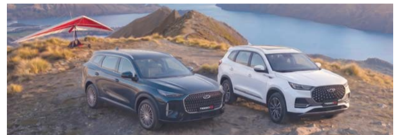
تشكيلة متنوعة من سيارات شيري ٢٠٢٦ تتضمنها الحملة

جميع أنماط الحياة، ويُمكن لعشاق سيارات الصالون الاختيار بين «أريزو ٥» الاقتصادية، و«أريزو ٦» المتطورة بأنظمة السلامة المحسنة، كما تتميز فئة السيارات الرياضية متعددة الاستخدامات بتنوعها، حيث تضم «تيجو ٧» المدججة