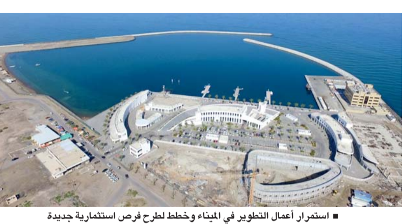
استمرار أعمال التطوير في الميناء وخطط ل طرح فرص استثمارية جديدة

مُعدّة الاستخدامات. وأوضحت وزارة الثروة الزراعية والسمكية وموارد المياه أن المشروع يتضمن عدداً من المكونات الرئيسية، فمن خلال القطاع السمكي واللوجستي يشمل الميناء مصفاً بحرياً متطوراً لقوارب وسفن الصيد، وسوق أسماك حديثاً ومكثفاً بمواصفات صحية وعالمية، ومصانع للتجفيف ومخازن تبريد، بالإضافة إلى عدد من الورش البحرية.