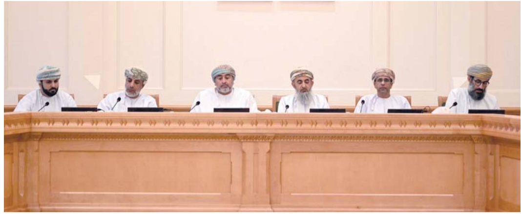
المختصون استعرضوا التحديات التي تواجه المراكز والمكتبات الثقافية الأهلية

التقت لجنة الإعلام والسياحة والثقافة بمجلس الشورى صباح أمس سعادة السيد سعيد بن سلطان البوسعيدي وكيل وزارة الثقافة والرياضة والشباب للثقافة، وذلك في إطار الدراسة التي تقوم بها اللجنة للدراسة التي بشأن «تعزيز دور المراكز والمكتبات الثقافية الأهلية وتعزيز أثرها في المجتمع»، ضمن جهودها الرامية إلى الوقوف على واقع هذه المؤسسات الثقافية واستكشاف سبل تطويرها وتمكينها من أداء أدوارها المعرفية والثقافية والتنمية على نحو أكثر فاعلية واستدامة.