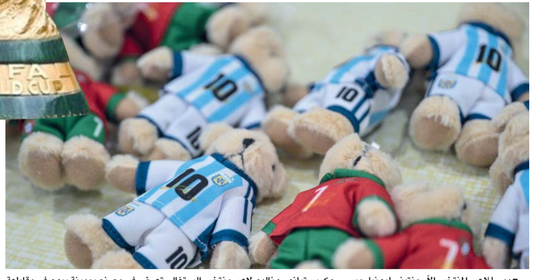
دمي لاعبي المنتخب الأرجنتيني ليونيل ميسي، وكريستيانو رونالدو لاعب منتخب البرتغال، تعرض في مصنع بمدينة بيوو في مقاطعة تشيجانغ شرق الصين، عشية انطلاق مونديال ٢٠٢٦ اليوم.