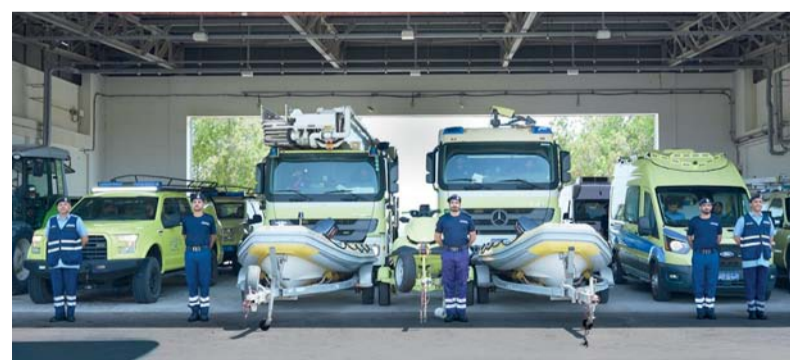
تعزيز منظومة الاستجابة للطوارئ والسلامة البحرية