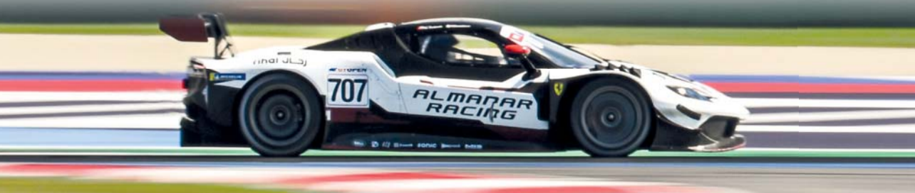
سيارة فريق المنار على حلبة ميزانو الإيطالية