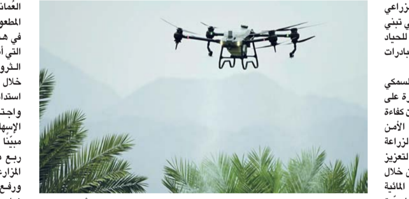
تبنى التقنيات الزراعية الحديثة وتوسع الرقعة الخضراء ركيزة أساسية في تحقيق مستهدفات الحياد الصفري

العُماني والريمان والتين والفرصاد والسرر المطعوم. وقال: إن من أبرز المبادرات الوطنية في هذا الجانب مبادرة «أوكيو الخضراء» التي أطلقتها شركة أوكيو بالشراكة مع وزارة الثروة الزراعية والسمكية وموارد المياه خلال الفترة (٢٠٢٢ - ٢٠٢٥م). بهدف تعزيز استدامة الزراعة وتحقيق قيمة اقتصادية واجتماعية للمجتمع المحلي، إلى جانب الإسهام في الحد من الانبعاثات الكربونية، مبيّنًا أن المبادرة تستهدف زراعة أكثر من ربع مليون شجرة مخمرة، وتزويد المزارعين بشتلات عالية الجودة والإنتاجية، ورفع العائد الاقتصادي عبر التوسع في زراعة الفاكهة التجارية، فضلاً عن دعم المحتوى المحلي وإشراك المؤسسات الصغيرة والمتوسطة. ونكر أن الوزارة نفذت مشروعاً لزراعة نحو ٣.٠٠٠ شجرة ميس بدعم من شركة تنمية نفط عمان، بهدف دراسة ملامحتها البيئية المحلية وقدرتها على امتصاص الكربون، لافتاً إلى أن الدراسات البحثية أجرتها المديرية العامة للبحوث الزراعية والحيوانية أظهرت أن الشجرة متكاملة النمو يمكن أن تنمض نحو ٢٢ كيلوجراماً من الكربون سنوياً، فيما يمكن لمساحة زراعية تقدر بـ (١٠) أفدنة أن تسهم في امتصاص نحو ٣٠ طناً من الكربون سنوياً في الظروف المثالية. وأردف أن برنامج توزيع الشتلات الذي يأتي ضمن المبادرة شمل توزيع ١٩٨.٨٠٢ شتلة للحقول التجارية، و١٦.٢٤٥ شتلة لتعويضات الأنواع المانخية، و٤.٧٢٠ شتلة للمزارعين، إضافة إلى ٤.٣٠٠ شتلة للمستثمرين، ومتوقعاً أن تسهم المبادرة بعد خمس سنوات في إنتاج أكثر من ١٠.٢٩٠ طناً من الفاكهة بقيمة سوقية تقدرية تصل إلى ٤.٣ مليون ريال عماني، إلى جانب الإسهام في امتصاص نحو ٨.٠٠٠ طن سنوياً من غاز ثاني أكسيد الكربون.