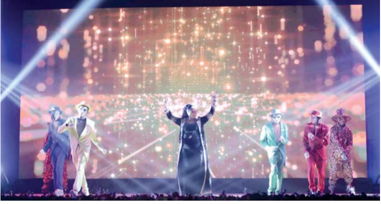
«قهوة ساخنة»، رحلة تطوف حول الفقد والوحدة والخوف من الآخر

وشهد المهرجان كذلك إقامة معرض مصاحب تجول فيه صاحب السمو السيد مروان بن تركي آل سعيد محافظ ظفار والضيوف، وضم عدداً من الأركان المتنوعة، من بينها ركن التصوير، وركن (حيث تحاك قصص العالم)، والمعرض التراثي التقليدي، ومعرض الزبي العُماني النسائي، وركن مسرح العرائس (الدمى)، وركن الابتكار والإبداع، وركن مجلس أوفير، إلى جانب ساحة الفنون الشعبية التي عكست ثراء الموروث الثقافي العُماني وتنوعه.