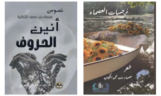
بعض إصدارات عصماء الكحالية

برزت عصماء بنت محمد الكحالية كاتبة وشاعرة وروائية على الساحة الثقافية العمانية من خلال اشتغالها الأدبية المتنوعة التي جمعت بين الشعر الفصيح والنثر الأدبي والقضايا المجتمعية والتنمية البشرية، صدر لها خمسة أعمال تنوعت بين أجناس أدبية مختلفة (الشعر الفصيح، والخواطر النثرية، وأدب الرسائل، والمقالات)، وتوجت مسيرتها الفكرية مؤخراً بصدور عملها الخامس وهو عبارة عن رواية بعنوان (رسالة لم يتمها القدر). بجانب مقالاتها التي ناقشت قضايا المجتمع والتطوير الذاتي في عدة منصات صحفية محلية وخليجية وعربية، وحظيت إصداراتها بإشادات نقدية، من نقاد وشعراء وكتاب. عصماء الكحالية سجلت حضوراً مميزاً من خلال مشاركتها في العديد من المحافل والفعاليات الأدبية وتوسعت إلى إبداع لغة أدبية تجمع بين أصالة الموروث اللغوي ومعاصرة القضايا الإنسانية، ليكون الحرف جسراً يعبر بالوعي المجتمعي نحو آفاق التنمية والفكر الرصين، وترسيخ حضور الأدب العُماني الشباب في المحافل الدولية وتوثيق الروابط الثقافية بين الشعوب.