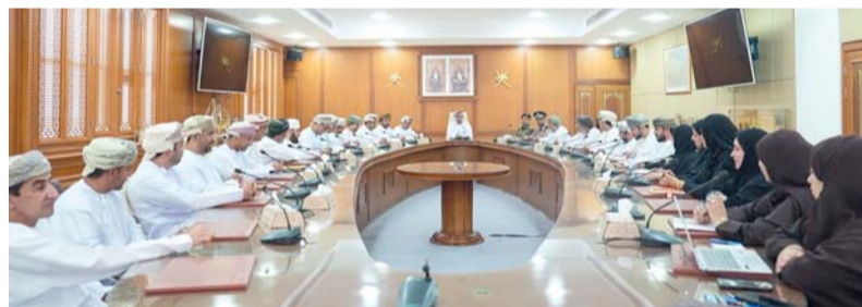
بحث تعزيز حضور الشباب وتمكينهم

ويأتي تنظيم هذا البرنامج في إطار جهود تكاملية بين المؤسسات الحكومية في المحافظة