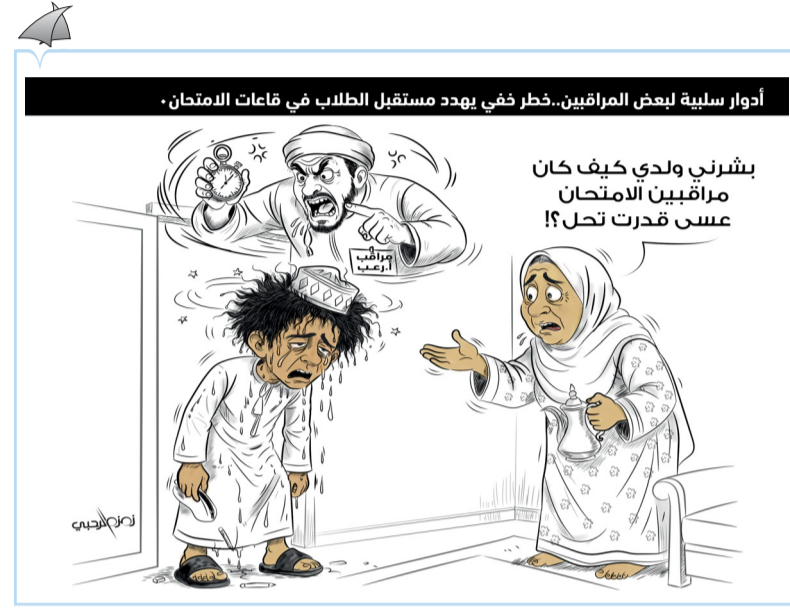
أدوار سلبية لبعض المراقبين.. خطر خفي يهدد مستقبل الطلاب في قاعات الامتحان.