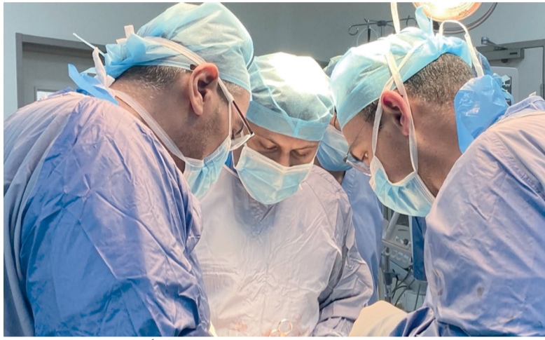
■ استئصال الورم بحجم حوالي ١٢ سنتيمتراً

مع الحفاظ على أعلى معايير السلامة الجراحية للمريضة. وأضاف أن هذا النوع من العمليات الجراحية المعقدة كان يُجرى سابقاً في المستشفى السلطاني، إلا أن نجاح إجرائها في مستشفى صور المرجعي يعكس تطور الخدمات الطبية المتخصصة في محافظات سلطنة عُمان، ويعزز من قدرة المستشفيات في المحافظات على التعامل مع الحالات المعقدة. ولفت إلى أن إجراء مثل هذه العمليات يعد نقلة نوعية في المنظومة الصحية في سلطنة عُمان، ويؤكد نجاح جهود وزارة الصحة في تعزيز القدرات الجراحية المتقدمة في مختلف المحافظات.