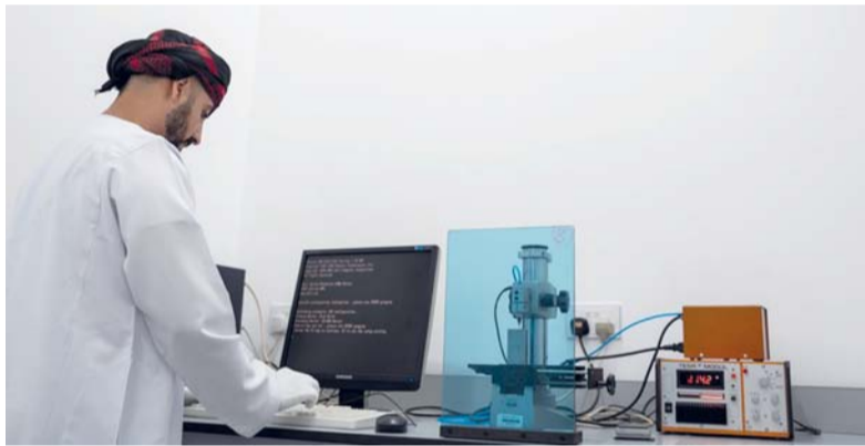
الاعتماد يسهم في تسهيل التجارة الدولية وتقليل العوائق الفنية أمام التبادل التجاري

رئيس قسم التسجيل بمركز الاعتماد العُماني أن المركز يولي اهتماماً كبيراً بتعزيز حضوره الإقليمي والدولي، حيث تم رفع ملف مركز الاعتماد العُماني (OMAC) إلى الجهاز العربي للاعتماد للحصول على الاعتراف الدولي، ويجري حالياً استكمال متطلبات مرحلة تقييم النظراء، التي تمثل خطوة محورية في مسار الاعتراف الدولي، كما يواصل المركز جهوده نحو الحصول على العضوية في منظمة التعاون العالمي للاعتماد، بما يسهم في تعزيز الاعتراف الدولي بمنظومة الاعتماد الوطنية ويدعم تنافسية الاقتصاد العُماني. وأكد على أن الاعتماد يسهم في تسهيل التجارة الدولية وتقليل العوائق الفنية أمام التبادل التجاري، من خلال تعزيز الاعتراف بنتائج الاختبارات والتقارير