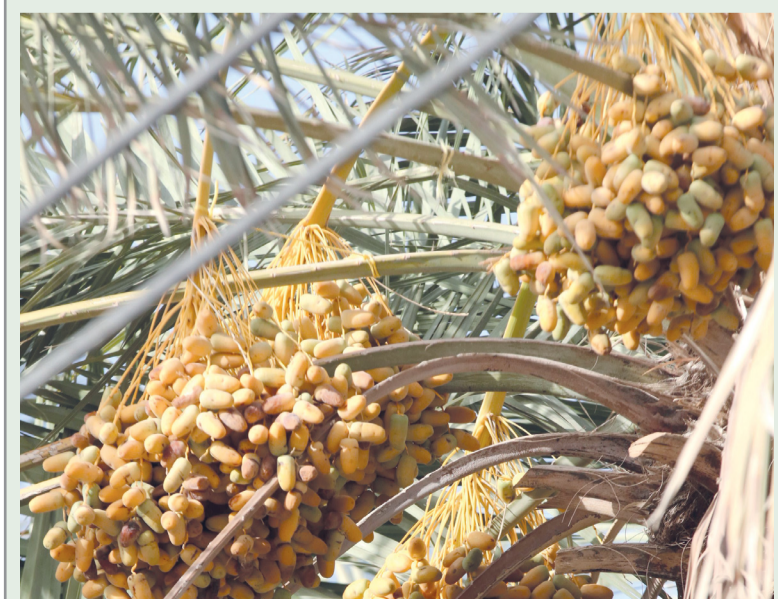
■ عملية الطناء في مزارع سوق عبري

عبري. من سعيد الغافري: المنادة حضوراً واسع النطاق، حيث يتم معاينة حجم ونوعية وجودة الثمار، وتحرير عملية الطناء والأسعار. وسجلت مؤشرات الطناء هذا الموسم أسعاراً متفاوتة تتراوح ما بين ٢٠ ريالاً للنغال و ٥٠ ريالاً للخلاص و ١٥ ريالاً للخرايف الأخرى.