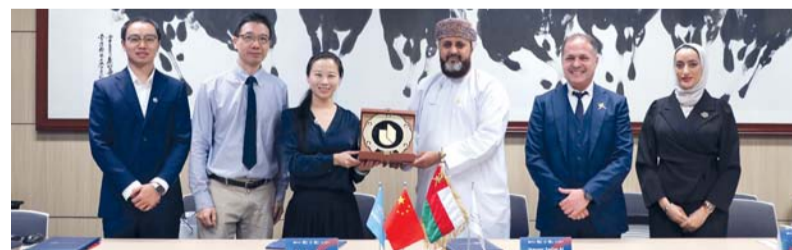
مذكرة التفاهم تهدف إلى تطوير الكفاءات الرقمية لأعضاء الهيئة الأكاديمية والإدارية