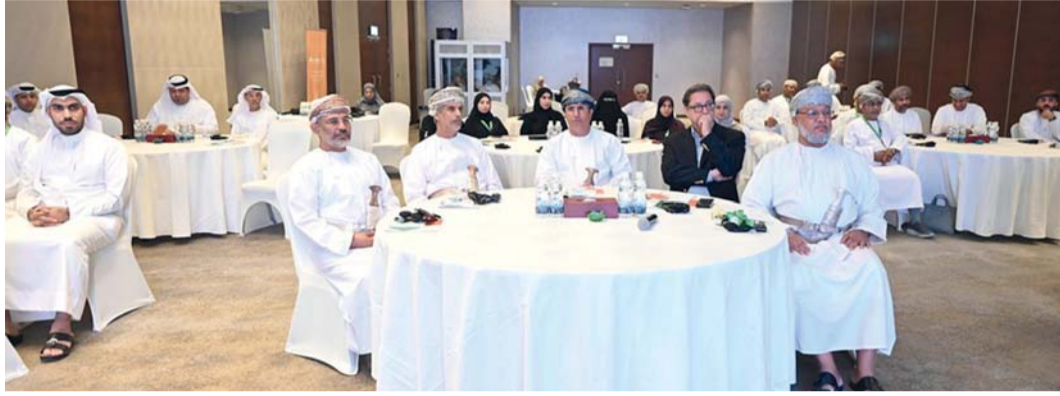
■ الحلقة تهدف إلى رفع كفاءة إدارة المزارع وزيادة الإنتاجية وتعزيز كفاءة استخدام الموارد الطبيعية

تستعرضت حلقة عمل مشروع الخدمات الاستشارية في مجال استخدام التقنيات الحديثة والذكاء الاصطناعي في إدارة المزرعة، الأساسيات والاحتياجات وهيكل المشروع وكيفية زيادة الإنتاجية وتحسين جودة المنتج بدول مجلس التعاون لدول الخليج العربي.