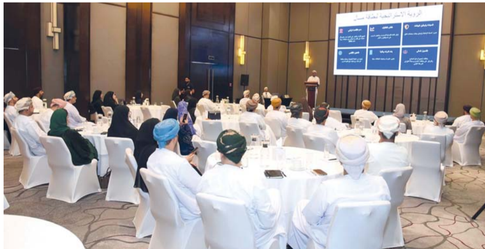
■ الندوة تسهم في تعزيز الثقة في الخدمات الرقمية وتحفيز الاستثمار في التقنيات المالية الحديثة

نحو الاقتصاد الرقمي وتعزيز الشمول المالي بما يتوافق مع مستهدفات رؤية «عمان ٢٠٤٠».