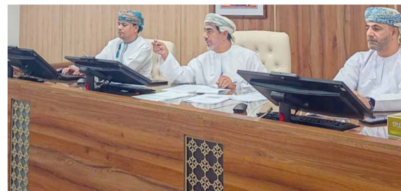
الارتقاء بمستوى جودة الخدمات القضائية