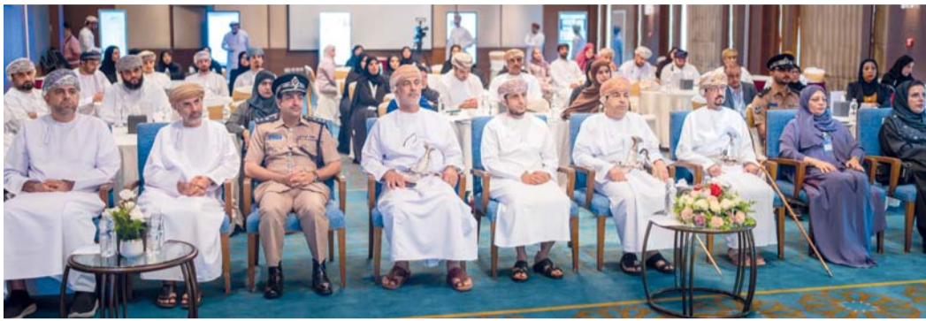
دعم منظومة البحث العلمي والابتكار وتعزيز الشراكات المعرفية

أبعاد وتطبيقات البيانات البحثية المفتوحة، حيث استعرضت أحدث التوجهات والممارسات المرتبطة بالبيانات المفتوحة والعلم المفتوح ودورها في دعم البحث العلمي والابتكار. وخرج الملقي بعدد من التوصيات التي أكدت أهمية تعزيز ثقافة البيانات المفتوحة وتوسيع نطاق الاستفادة منها في دعم البحث العلمي والابتكار وصناعة القرار، وتعزيز التعاون بين المؤسسات، وبناء القدرات الوطنية في مجالات تحليل البيانات والتقنيات الحديثة، بما يواكب مستهدفات رؤية «عمان ٢٠٤٠» ويعزز بناء اقتصاد معرفي مستدام.