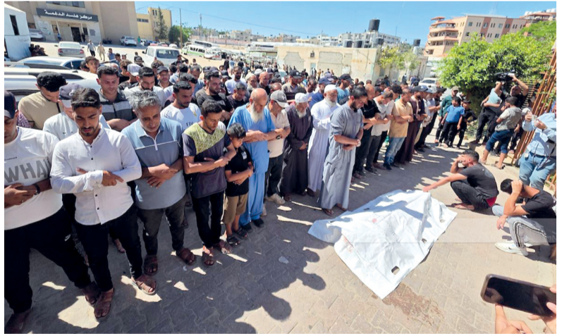
فلسطينيون يشيعون أحد الشهداء الذين ارتقوا بقصف «إسرائيلي» في خان يونس جنوب قطاع غزة - الصورة من وفا.

تستكمل المديرية العامة للتعليم في المحافظات الاستعدادات لامتحانات دبلوم التعليم العام للفصل الدراسي الثاني (الدور الأول) للعام الدراسي ٢٠٢٥ - ٢٠٢٦ م، بعد غد الخميس. تفاصيل ..... ص ٣