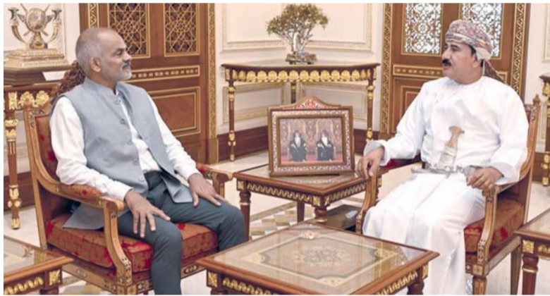
سلطان العُماني يستقبل سريغفاس جودافارثي

الودية وبحث مسار العلاقات الثنائية وسبل تعزيزها خدمة للمصالح المشتركة للبلدين الصديقين، كما تم التطرق إلى بعض القضايا والمستجدات على الساحتين الإقليمية والدولية.