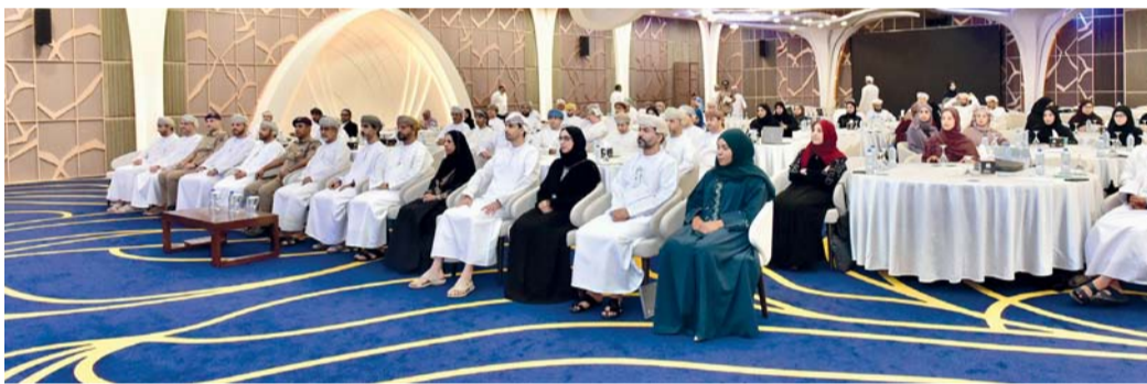
تعزيز مواءمة الخطط التنفيذية للمحافظات

والتكامل بين المستوى المركزي والمحافظات والجهات الصحية المختلفة؛ بما يحقق الأثر المنشود على صحة المجتمع وجودة الخدمات الصحية خلال السنوات الخمس المقبلة.