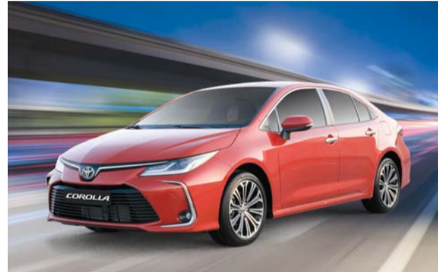
■ كورولا تلي احتياجات القيادة اليومية

مساعدة الكبح، كما تعزز ميزات نظام توزيع قوة الكبح إلكترونياً ونظام مراقبة ضغط الإطارات من التحكم بالسيارة.