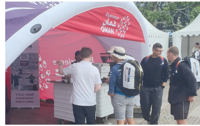
■ الركن التعريفي للوزارة يستقطب جمهوراً كبيراً من الرياضيين

يستقطب جمهوراً كبيراً من الرياضيين ومحبي السفر من مختلف دول العالم، بالإضافة إلى بث مواد فيلمية ترويجية عن سلطنة عُمان خلال البث المباشر لسباق كأس أوروبا وتعزيز ظهور الهوية الترويجية في جميع مسارات السباق. وتعمل الوزارة من خلال هذه المشاركة على الترويج لعدد من السباقات التي تستضيفها سلطنة عُمان، من أبرزها سباق الرجل الحديدي للمسافة الكاملة في محافظة مسقط، وسباق الرجل الحديدي ٧٠,٣ في محافظة ظفار، إلى جانب بطولة الشرق الأوسط ٧٠,٣ في مسقط، والتي تعطل محطات رياضية عالمية تستقطب نخبة من الرياضيين وتتيح تجارب سياحية فريدة في مختلف محافظات سلطنة عُمان.