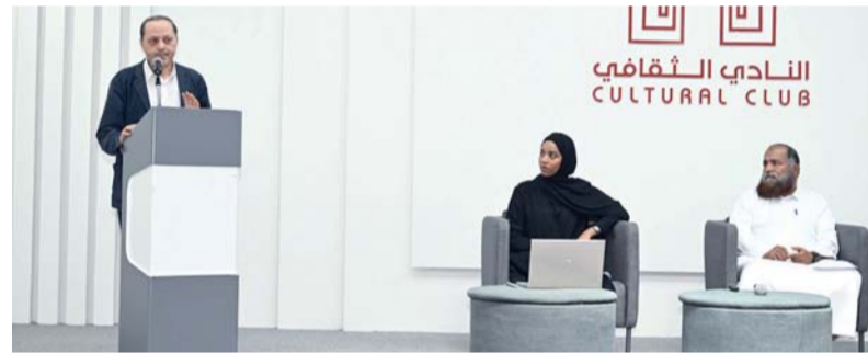
الندوة شهدت حواراً مفتوحاً بين المتحدثين والحضور

إيجاباً على جودة الترجمة في البيئة الأكاديمية. جمود المدرس اللغوي العربي وغياب المراجعات النقدية التي تستند إلى التطورات الحديثة في الدراسات اللغوية، مما انعكس على المناهج التعليمية وأسهم في بروز إشكالات تربوية تتعلق بتعليم اللغة والترجمة. وأشار إلى أن الاعتماد المفرط على أدوات الذكاء الاصطناعي من قبل بعض طلبة الترجمة أدى إلى إضعاف مهاراتهم اللغوية والترجمية، مؤكداً على أهمية ترسيخ استخدام هذه التقنيات وتوظيفها بما يخدم تنمية الكفاءات اللغوية بدلاً من إضعافها أو تعزيز التبعية لأداة. وشهدت الندوة حواراً مفتوحاً بين المتحدثين والحضور،