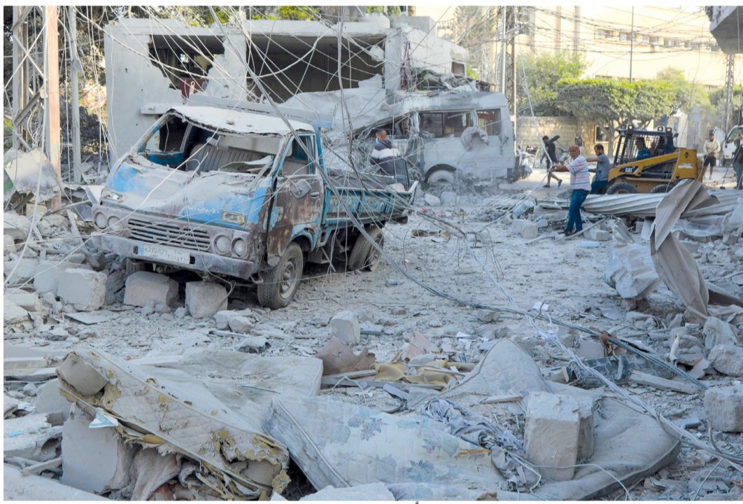
عمال يزيلون الأنقاض التي خلفها العدوان «الإسرائيلي» على صور جنوب لبنان.

طهران - عواصم وكالات: عاد القصف الإيراني «الإسرائيلي» المتبادل؛ حيث أعلن الجيش الإسرائيلي، استهداف منظومات الدفاع الاستراتيجية التابعة للقوات الإيرانية، فيما قصفت إيران «إسرائيل» بالصواريخ وحملت أميركا مسؤولية استئناف الأعمال العدائية. وحملت طهران الولايات المتحدة مسؤولية استئناف الأعمال العدائية في الشرق الأوسط. وقال المتحدث باسم وزارة الخارجية الإيرانية إسماعيل بقائي في مؤتمره الصحفي الأسبوعي: إن أحداً لا يصدق أن النظام «الإسرائيلي» سيقدم على أي عمل «من دون تنسيق وتعاون مسبقين مع الولايات المتحدة». وأضاف أنه لا يمكن فصل أفعال النظام «الإسرائيلي» في المنطقة عن السياسات الأميركية. تفاصيل ..... ص ٩