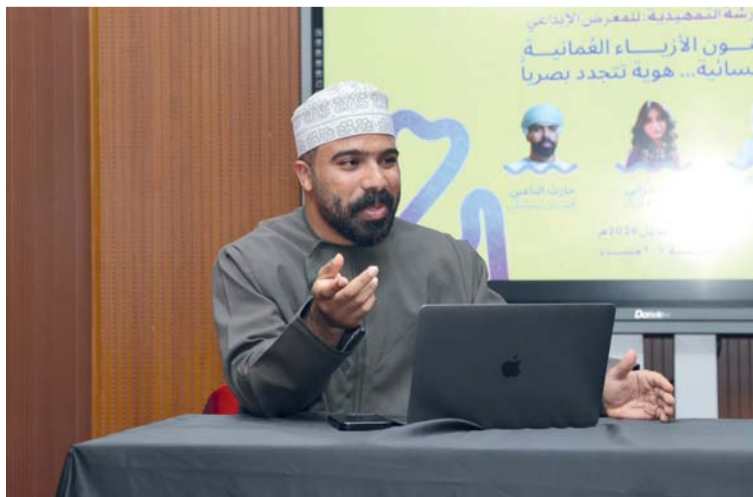
المعرض يأتي ثمره لثلاث حلقات فنية

والتصوير الضوئي والفن الرقمي ضمن تجربة فنية معاصرة تجمع بين الصورة والرمز، وتقدم تشكيلات بصرية مبتكرة تستلهم تفاصيل الأزياء العمانية بما تحمله من زخارف والأوان وخامات ورموز جمالية تعكس تراث الموروث الثقافي العُماني. كما أن المعرض يشكل فرصة لتوثيق الأزياء العمانية بمختلف مدارسها الجغرافية، من أزياء الجبل والبادية والسهل والساحل، وتقديمها كرموز بصرية تحمل بصرية تحمل قصصاً إنسانية وثقافية تعبر عن التنوع في المجتمع العُماني، ما يجعله منصة للتواصل الثقافي محلياً ودولياً. كما يشكل المعرض فرصة لتوثيق الأزياء العمانية بمختلف أنماطها الجغرافية، من أزياء الجبل والبادية والسهل والساحل، وتقديمها كرموز بصرية تحمل قصصاً إنسانية وثقافية تعبر عن التنوع الذي يخرز به المجتمع العُماني، بما يعزز من حضور هذا الموروث الثقافي محلياً ودولياً، ويفتح آفاقاً جديدة للتواصل الثقافي والتعريف بالأزياء العمانية وقيمتها الحضارية والجمالية للأجيال القادمة.