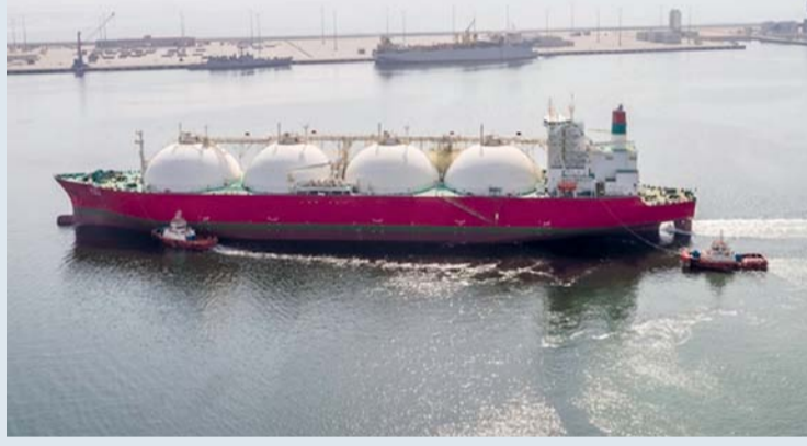
ارتفاع متوسط الإنتاج اليومي من النفط العماني بنسبة ٧.٥ بالمائة بنهاية شهر أبريل 2026م