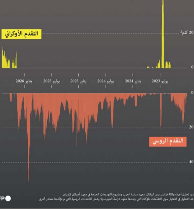
المصدر: تحليل أجريته وكالة فرانس برس لبيانات معهد دراسة الحرب وصندوق التهديدات العرجة في معهد أوكيانا كيريزين. لا يأخذ التحليل في الاعتبار سوى التقلبات المؤكدة التي رصدها معهد دراسة الحرب، ولا يشمل التقلبات الروسية التي لم يوثقها مصدر آخر.

في شهري أبريل ومايو، استعاد الجيش الأوكراني 403 كيلومترات مربعة من الروس في شرق أوكرانيا تمثل التقدم اليومي على الأرض متوسط المساحة المحققة خلال الـ 1٤ يوما الماضية