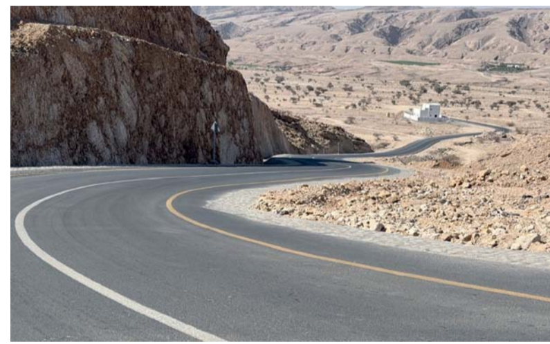
■ المشروعات تسهم في تعزيز الترابط بين القرى والتجمعات السكنية

«ضنك - العُمانية: بلغت نسبة الإنجاز في مشروعات الطرق الداخلية بولاية ضنك بمحافظة الظاهرة نحو ٩٧٪، ضمن الجهود المتواصلة لتطوير البنية الأساسية، وتعزيز شبكة الطرق الداخلية بما يسهم في تحسين الحركة المرورية وربط القرى والتجمعات السكنية بمختلف الخدمات والمرافق الحيوية.