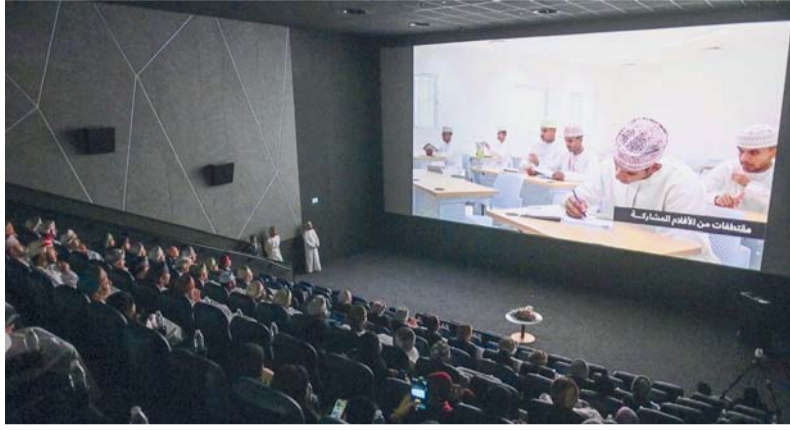
تتراوح مدة الفيلم المشارك بين دقيقة وثلاث دقائق

واشترطت وزارة الثقافة والرياضة والشباب أن تتراوح مدة الفيلم المشارك بين دقيقة وثلاث دقائق، وأن يكون العمل من تصوير وإنتاج الطالب نفسه، مع إتاحة المشاركة الفردية أو الجماعية بما لا يزيد على ثلاثة طلبة في الفريق الواحد. كما تتيح المسابقة حرية اختيار الأسلوب الفني المناسب، سواء كان تمثيلاً أو توثيقياً أو قصصياً أو من خلال اللقطات اليومية، مع ضرورة الالتزام بالمحتوى المناسب والقيم العامة، وتصميم ملصق (بوستر) للفيلم يعبر عن فكرته ومضمونه. ودعت الوزارة الطلبة الراغبين في المشاركة إلى إرسال أعمالهم وفق الشروط الملغاة، مؤكدة على أن آخر موعد لاستلام المشاركات هو أول أكتوبر ٢٠٢٦ م، على أن تُعرض الأعمال الفائزة خلال حفل ختامي خاص يتم فيه تكريم الفائزين والاحتفاء بإبداعاتهم السينمائية.