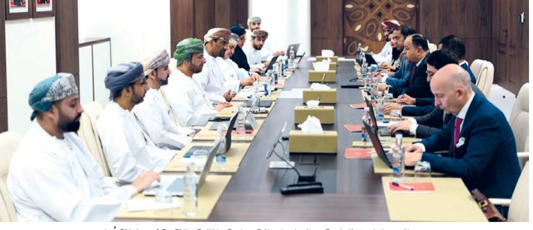
الاجتماعات تتناول تقييم التطورات الاقتصادية والمالية والنقدية في سلطنة عُمان

تفويضات برنامج التحفيز الاقتصادي والمالي، وأولويات المرحلة المقبلة، بما يسهم في دعم النمو الاقتصادي المستدام وتعزيز متانة القطاع الخاص. وتشكّل هذه المشاورات منصة للحوار وتبادل وجهات النظر حول السياسات المناسبة لتعزيز مرونة الاقتصادية والاستقرار المالي، ومواصلة الحوار البناء بين الطرفين. ومن المقرر أن تختتم البعثة أعمالها في 15 يونيو الجاري؛ إذ ستعرض ملاحظاتها الأولية على الجهات المعنية، ثم إصدار البيان الختامي للبعثة.