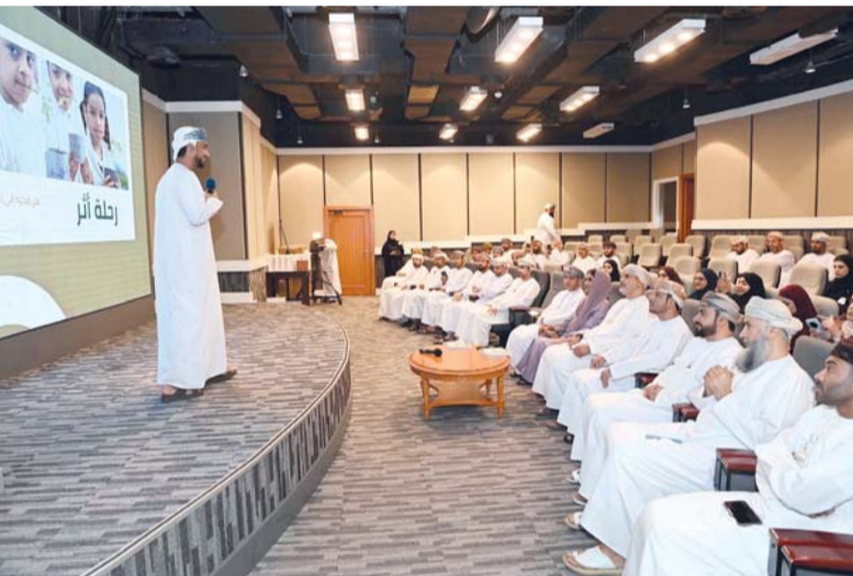
تعزيز برامج الاقتصاد الدائري والحد من التلوث

وأوضحت أن العالم يواجه تحديات بيئية متسارعة تتمثل في تغير المناخ، وفقدان التنوع الأحيائي، وتدهور النظم البيئية، والتلوث مختلف أشكاله، وهي تحديات تتجاوز الحدود الجغرافية وتتطلب استجابة جماعية قائمة على الشراكة والمسؤولية المشتركة، مؤكدة أن سلطنة عُمان تواصل ترسيخ نهج التنمية المستدامة باعتباره خياراً استراتيجياً يوازن بين متطلبات النمو الاقتصادي والمحافظة على الموارد الطبيعية، انسجاماً مع مستهدفات رؤية عُمان ٢٠٤٠، والتزامات سلطنة عُمان الدولية في مجالات البيئة والمناخ. وأشارت إلى أن سلطنة عُمان حققت خلال السنوات الماضية خطوات نوعية في مجال حماية البيئة وصون التنوع الأحيائي، من خلال التوسع في إدارة المحميات الطبيعية، وتنفيذ المبادرات الوطنية للتشجير واستعادة النظم البيئية، وتعزيز برامج الاقتصاد الدائري، والحد من التلوث، إلى جانب الجهود الوطنية الرامية إلى تحقيق الحياد الصفري الكربوني بحلول عام ٢٠٥٠. ولفتت إلى أن هيئة البيئة تؤمن بأن مواجهة التحديات البيئية تتطلب شراكة حقيقية بين مختلف القطاعات الحكومية والخاصة والأكاديمية والمجتمعية، وأن الاستثمار في البيئة هو استثمار في مستقبل الاقتصاد والمجتمع وجودة الحياة. وشهد الاحتفال تقديم عدد من أوراق العمل جاءت بعنوان جهود سلطنة عُمان في العمل المناخي، وورقة بعنوان الحراك الشبابي العربي في مواجهة التغير المناخي، وورقة بعنوان تمكين الجيل القادم، بالإضافة إلى استعراض تجربة مبادرة سفراء المناخ.