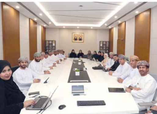
■ مناقشة الصورة العامة لقطاع المدارس الخاصة

وعدد المدارس الخاصة في سلطنة عمان للعام الدراسي «٢٠٢٥-٢٠٢٦م»، والتوزيع الجغرافي لها للعام الدراسي «٢٠٢٥-٢٠٢٦م»، وتفصيل الهيئة التعليمية وفئات المدارس، والترخيص واللوائح المنظمة للعمل، واللائحة التنظيمية الصادرة بالقرار الوزاري: (٢٨٧/٢٠١٧م)، والجزاءات الإدارية الواردة بالمادة (١١٩) من اللائحة التنظيمية، والبرامج التعليمية الدولية المعتمدة للتطبيق في المدارس الخاصة، والمؤسسات المانحة لها والناهج التعليمية والتعبئة في المدارس الخاصة والمخالفات الشائعة المتعلقة بوضع الهيئة التعليمية في المدرسة الخاصة، وجوانب المتابعة فيما يتعلق بالأمن والسلامة المدرسية.