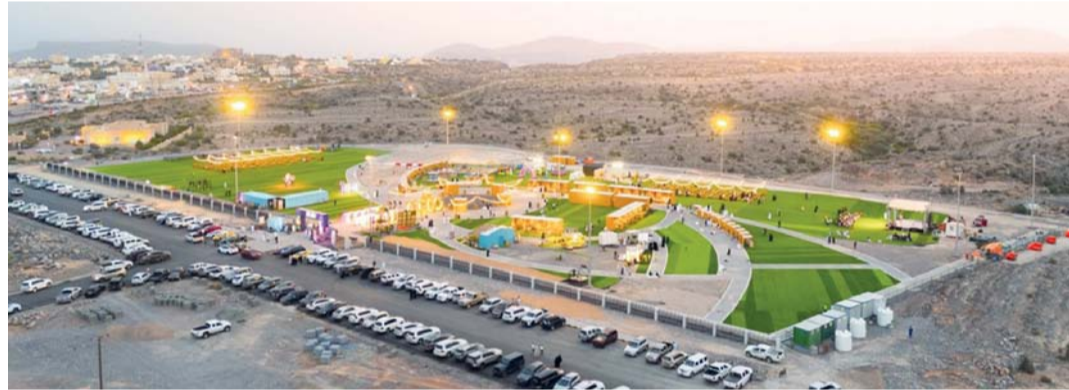
■ المهرجان منصّة متكاملة تسهم في إبراز الفرص الاقتصادية والسياحية والاستثمارية

المشروعات التنموية والسياحية، من بينها مشروع حديقة الجبل الأخضر وميدان الاحتفالات بسبخ قطنة، إلى جانب مشروعات تطوير المرافق والخدمات العامة، الأمر الذي يعزز جاهزية الولاية لاستقبال أعداد متزايدة من الزوار خلال المواسم السياحية المقبلة.