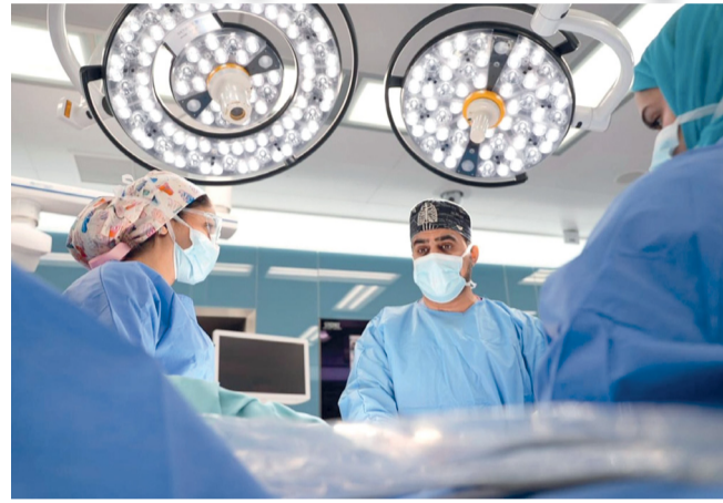
استخدام المنظار ثلاثي الأبعاد في العملية

التوغل. واستغرقت العملية نحو ثلاث ساعات، وتمكنت المريضة من تجاوز مارك الوالتي، استشاري أول جراحة أورام