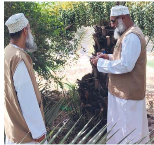
عملية الخرص تتم عبر تقدير كمية التمور على النخيل

أداء هذه الفريضة على الوجه الصحيح. وأشادت اللجنة بتعاون المواطنين وتجاوبهم مع فرق الخرص، مؤكدة على أن الزكاة