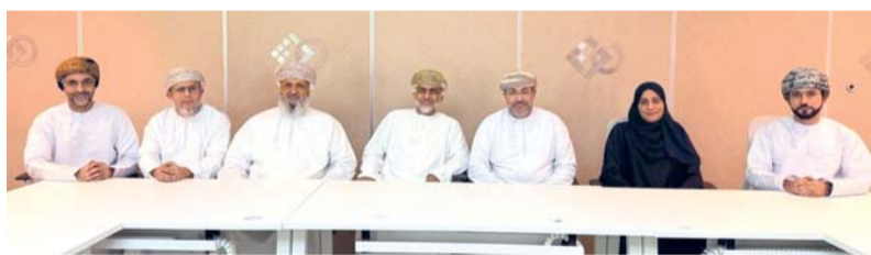
■ تعزيز موازنة مخرجات التعليم والتدريب

صحة - العُمانية: أطلق البرنامج الوطني للتشغيل مشروعاً وطنياً لتمكين مسارات الشهادات الاحترافية بالكليات المهنية خلال اجتماع عقد بحضور ممثلين من المديرية العامة للكليات المهنية بوزارة العمل، وإدارة الكلية المهنية بصح، والشركة المنفذة للمشروع. ويهدف المشروع إلى تعزيز موازنة مخرجات التعليم والتدريب مع المتطلبات المهنية المتجددة، ورفع جاهزية الكفاءات الوطنية من خلال تمكينها من اكتساب الشهادات الاحترافية والمهارات التخصصية التي تتطلبها الوظائف الحالية والمستقبلية. ويُنفذ المشروع في مرحلته الأولى بالكليات المهنية بولاية صحح باعتبارها المحطة الأولى لتطبيق نموذج مسارات الشهادات الاحترافية على مستوى الكليات المهنية في سلطنة عُمان، تمهيداً للاستفادة من مخرجات التجربة وتوسيع نطاق تطبيقها مستقبلاً، بما يعزز كفاءة منظومة التعليم والتدريب المهني ويرفع قدرتها على تلبية احتياجات سوق العمل. واستعرض الاجتماع أهداف المشروع ومنهجية تنفيذه وخطة العمل والجدول الزمني للمراحل التنفيذية، إلى جانب مناقشة مخرجات المرحلة الأولى التي تشمل تحديد الشهادات الاحترافية ذات الأولوية، وتحليل متطلبات الاعتماد