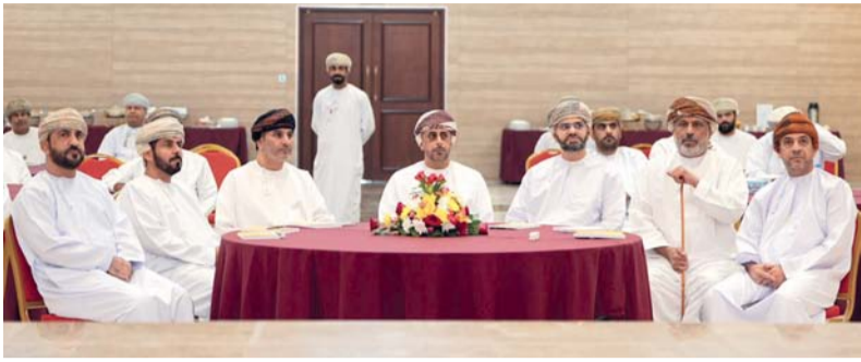
دعم التوجهات الوطنية المرتبطة بقطاع الطاقة