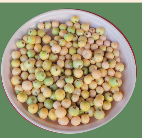
ثمار «القو» تحتوي على العديد من الفوائد الصحية