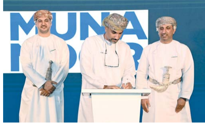
■ إطلاق البرنامج شهد توقيع وثائق لـ ٩ مشاريع للمنشآت الصناعية

وأضافت: إن الشراكة بين الجهات المنفذة والمصانع المشاركة تمثل نموذجاً متكاملًا للتعاون والتكامل بين مختلف الأطراف، بما يسهم في رفع كفاءة المصانع الوطنية ودعم التحول نحو التصنيع الرشيق بصورة مستدامة، إلى جانب المساهمة في إعداد خارطة تحول تقنية تعزز الأتمتة والتصنيع الذكي، وترفع من تنافسية القطاع الصناعي الوطني.