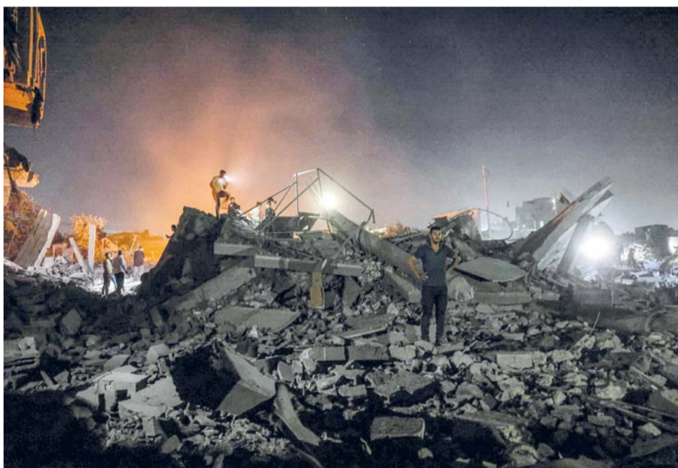
أشخاص وفرق الحماية يتجمعون في موقع القصف على خان يونس جنوب قطاع غزة في وقت متأخر من مساء أمس الأول.

والقدس المحتلة . «الوطن» . وكالات: وخلال الأيام الأخيرة، صدع جيش الاحتلال عدوانه على قطاع غزة، ويرتكب يوميا مجازر في معظم المناطق، فيما يتوسع احتلاله لمساحات جديدة من القطاع، وسط صمت من المبعوث الأميركي للسلام، والولايات المتحدة التي ضمنت الاحتلال في اتفاق وقف إطلاق النار. وبلغ عدد الشهداء من وقف النار في قطاع غزة بأكتوبر العام المنصرم، ٩٥٠ شهيدا، ومئات الجرحى. وتواصل قوات الاحتلال الإسرائيلي خرق اتفاق وقف إطلاق النار في قطاع غزة، عبر القصف الجوي والمدفعي تجاه أماكن النازحين، إلى جانب عمليات النفس والتدمير داخل ما يعرف بالخط الأصفر، مع الاستمرار في القيود على حركة البضائع والمساعدا والسفر.