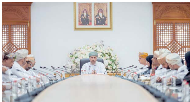
استعراض تعزيز قيم المواطنة والعمل الجماعي بشمال الباطنة

وطالبة من مختلف مدارس المحافظة. يتضمن البرنامج تنفيذ سلسلة من الحلقات التدريبية التطبيقية في مجالات الروبوت التعليمي والذكاء الاصطناعي والطاقة المتجددة والابتكار العلمي وتقنية النانو والمبتكر الصغير ونظم المعلومات الجغرافية والأمن السيبراني والنمذجة باستخدام الطابعات ثلاثية الأبعاد. وتقام البرامج التدريبية في عدد من المواقع التعليمية المتخصصة، تشمل مركز العلوم والتكنولوجيا، ومركز ابن النضر بولاية سمائل ومراكز الابتكار بمدارس الشيخ أحمد بن عبدالله الكندي وطيمساء والجبل الأخضر والشيماء وأم قيس الأسدية، إضافة إلى قاعات مصادر التعلم بمدارس مدينة التراث وحى السعد بولاية بهلاء والطوق بولاية إزكي وفاطمة بنت الزبير بولاية الحمراء والشهامة بولاية منح. ويسعى البرنامج إلى تنمية مهارات الابتكار والتفكير التصميمي لدى الطلبة وتعزيز ثقافة البحث العلمي والتجريب وتطوير مهارات استخدام التقنيات الحديثة. وقال موسى بن خليفة الهنائي مدير دائرة الابتكار العلمي والذكاء الاصطناعي بالمديرية العامة للتعليم بمحافظة الداخلية: يمثل البرنامج الصيفي (جيل يصنع المستقبل) محطة تعليمية نوعية تستثمر أوقات الطلبة خلال الإجازة الصيفية في اكتساب مهارات المستقبل من خلال التدريب العملي والتجريب المباشر، والعمل على مشاريع ابتكارية ترتبط بالتقنيات الحديثة والعلوم التطبيقية وقد حرصت الدائرة على تنوع المسارات التدريبية وتوزيعها على عدد من المراكز المتخصصة في مختلف ولايات المحافظة بما يتيح فرصاً أوسع للاستفادة من موهبة الطلبة.