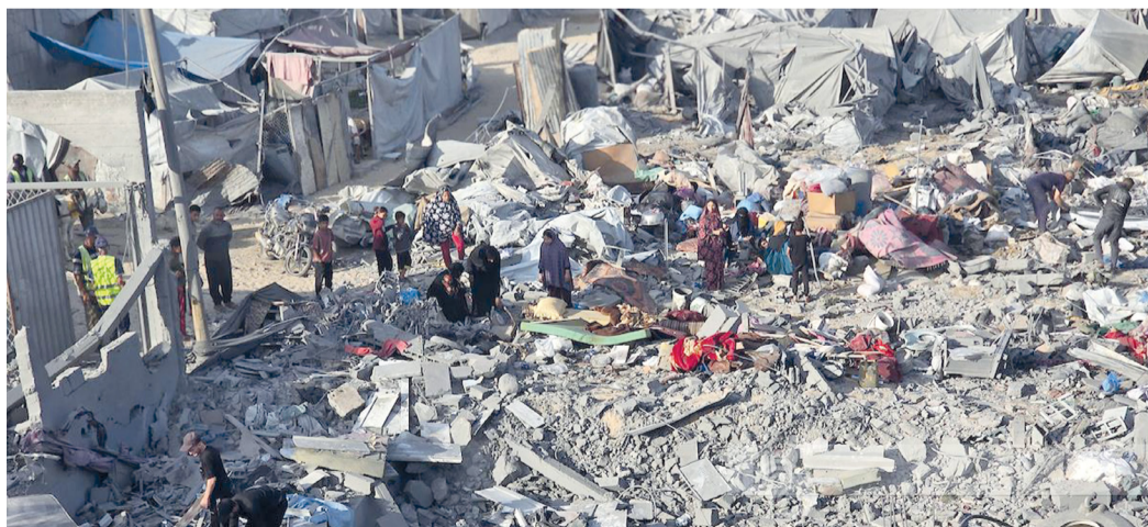
فلسطينيون يعانون آثار الدمار الذي خلفته غارة جوية «إسرائيلية» استهدفت خيام ومسكن النازحين في منطقة الواسي جنوب خان يونس.

القدس المحتلة. «الوطن». وكالات: وأصيب ٤ جراء استهداف «إسرائيلي» نفذته ظهر أمس زوارق حربية في منطقة العطارطة ببلدة بيت لاهيا شمال قطاع غزة. وأفادت مصادر محلية أن قوات الاحتلال أطلقت النار وقنابل دخانية وإتارة ومدفعية، شمال مخيم البريج وسط قطاع غزة. كما قصفت مدفعية الاحتلال شمال قطاع غزة، والمناطق الشرقية لمدينة خان يونس جنوب القطاع. إلى ذلك قتل «إسرائيلي» وأصيب ٥ آخرون بعملية إطلاق نار في عدة مواقع بمناطق «كوخاف يائير» و«تسور يتسحاق» وأفادت مصادر أنه تم تنفيذ إعدام ميداني بحق أحد منفذي العملية وهو من عرب ٤٨، فيما أُلقي القبض على الآخر. وأكدت وسائل إعلام وقوع ٦ إصابات في مواقع مختلفة، مشيرة إلى «مقتل شخص واحد، وإصابة شخص بحالة خطيرة، و٤ إصابات تتراوح بين الطفيفة والمتوسطة». تفصيل: «الاقتصادي»