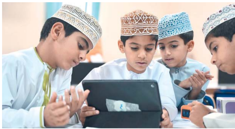
تنمية مهارات الابتكار والتفكير العلمي والتقني للطلبة في الداخلية

التنفيذ اللامركزي متعدد المواقع من خلال توزيع البرامج التدريبية والحلقات التخصصية على عدد من مراكز الابتكار وقاعات مصادر التعلم بالمحافظة بما يتيح للطلبة الاستفادة من بيئات تعليمية متخصصة ومتنوعة، ويسهم في تفعيل مراكز الابتكار وتحويلها إلى حاضنات للمشروعات والأفكار العلمية والتقنية. يستهدف البرنامج طلبة المدارس من الصف الخامس حتى الصف الحادي عشر إلى جانب المعلمين في مجالات العلوم والتقنية والابتكار ومواد STEM وتقنية المعلومات ومعلمي ومشرفي مراكز الابتكار، حيث يبلغ عدد المشاركين ما يقارب ألف طالب