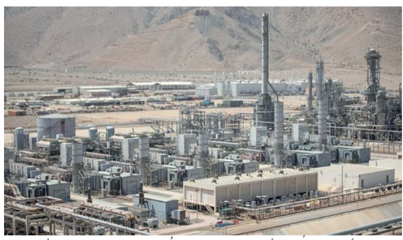
18 ملياراً و٧٧٢ مليوناً و١٠٠ ألف متر مكعب إنتاج سلطنة عُمان من الغاز الطبيعي بنهاية شهر أبريل 2026م

مسقط - العُمانية: شهد إنتاج سلطنة عُمان من الغاز الطبيعي شاملاً الإنتاج المحلي والاستيراد ارتفاعاً بنسبة ٤.٦ بالمائة، ليبلغ 18 ملياراً و٧٧٢ مليوناً و١٠٠ ألف متر مكعب حتى نهاية شهر أبريل الماضي، مقارنة بالفترة المماثلة من عام 2025م والبالغة 17 ملياراً و٩٤١ مليوناً و٣٠٠ ألف متر مكعب. وأوضحت البيانات الصادرة عن المركز الوطني للإحصاء والمعلومات أن إنتاج الغاز المصاحب ارتفع بنسبة ١.٣ بالمائة حتى نهاية شهر أبريل الماضي، ليصل إلى 4 مليارات و١٢٨ مليوناً و١٠٠ ألف متر مكعب مقارنة بالفترة نفسها من عام 2025م والبالغة 4 مليارات و٧٦ مليوناً و٦٠٠ ألف متر مكعب. وبيّنت الإحصاءات أن إنتاج الغاز غير المصاحب (مع الاستيراد) ارتفع بنسبة ٥.٦ بالمائة ليبلغ 14 ملياراً و٦٤٤ مليون متر مكعب حتى نهاية شهر أبريل الماضي، مقارنة بـ 13 ملياراً و٨٦٤ مليوناً و٧٠٠ ألف متر مكعب للفترة ذاتها من عام 2025م. أما على مستوى الاستهلاك، فارتفع استهلاك الغاز الطبيعي في المشروعات الصناعية بنسبة ٥.٨ بالمائة ليبلغ 9 مليارات و٨٦٥ مليوناً و٢٠٠ ألف متر مكعب حتى نهاية شهر أبريل الماضي، مقارنة بـ 9 مليارات و٣٢١ مليوناً و٢٠٠ ألف متر مكعب للفترة المماثلة من عام 2025م. كما ارتفع استخدام الغاز في محطات توليد الطاقة حتى نهاية شهر أبريل الماضي، بنسبة ١٢.٧ بالمائة ليصل إلى 4 مليارات و٩١٣ مليوناً و٢٠٠ ألف متر مكعب مقارنة بـ 4 مليارات و٣٥٨ مليوناً و٧٠٠ ألف متر مكعب للفترة نفسها من عام 2025م. كما أظهرت البيانات أن استهلاك الغاز في حقول النفط (يشمل الفاقد وفروقات العادات ومعامل النقل) انخفض بنسبة ٥.٧ بالمائة ليبلغ 3 مليارات و٩٣٠ مليوناً و٨٠٠ ألف متر مكعب حتى نهاية شهر أبريل الماضي، مقارنة