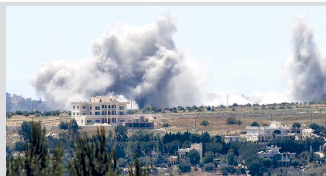
الدخان يتصاعد جراء قصف إسرائيلي قرب قرية كفر تبت، كما يُرى من مدينة مرجعيون المجاورة في جنوب لبنان.

واشنطن . عواصم . وكالات: أعلن الجيش الأمريكي إسقاط مسيرتين إيرانيتين قال إنهما كانتا تهددان حركة الملاحة في مضيق هرمز فيما يجري وزير الداخلية الباكستاني محادثات وصفته (برفيعة المستوى) في طهران. وكتبت القيادة المركزية الأمريكية (سنكوم) على منصة إكس «في وقت سابق أمس، أسقطت القوات الأميركية في الشرق الأوسط مسيرتين إيرانيتين أحاديتي الاستخدام كانتا تهددان حركة الملاحة الدولية في مضيق هرمز» إلى ذلك يتواجد وزير الداخلية الباكستاني محسن نقوي في طهران في إطار الجهود الدبلوماسية المستمرة لإسلام آباد لتعزيز الحوار بين إيران والولايات المتحدة.