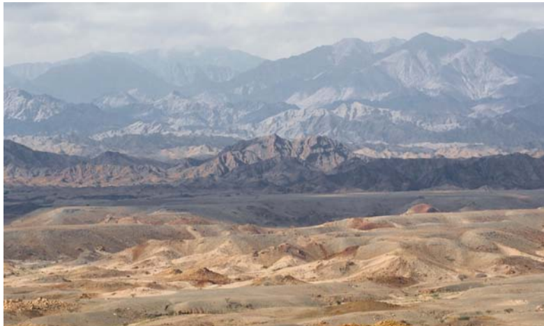
جميع الأنشطة المرتبطة بالهيدروجين في سلطنة عُمان تخضع لأطر تنظيمية وفنية واضحة

وقالت الوزارة إن الاهتمام بالهيدروجين الجيولوجي لا يعني بالضرورة وجود فرص تطوير أو استثمار جاهزة في الوقت الراهن، إذ يتطلب الأمر استكمال برامج جمع البيانات وإجراء الدراسات الجيولوجية والجيوكيميائية والفنية المتخصصة وتحليل نتائجها وفق الأسس العلمية المعمدة قبل التوصل إلى أي استنتاجات تتعلق بالإمكانات الاقتصادية أو الجسدية التجارية.