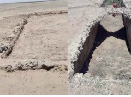
موقع ميناء عيذاب الأثري

القاهرة . العمانية: كشفت البعثة الأثرية المصرية التابعة للجلس الأعلى للآثار، والعاملة بموقع ميناء عيذاب الأثري بمنطقة حلايب على ساحل البحر الأحمر عن مجموعة من خزانات وصهاريج المياه الضخمة، إلى جانب عدد من المباني والمنشآت الخدمية. ويُلقي الاكتشاف الأثري بحسب بيان لوزارة السياحة والآثار المصرية، الضوء على البنية الأساسية لميناء عيذاب، أحد أبرز وأهم الموانئ المصرية خلال العصور الإسلامية الذي كشف جانباً مهماً من المنشآت الخدمية التي اعتمد عليها ميناء عيذاب التاريخي، حيث مثلت صهاريج المياه عنصراً أساسياً في دعم النشاط الملاحي والتجاري، فضلاً عن توفير احتياجات الحجاج الوافدين إلى الميناء في طريقهم إلى الأراضي المقدسة.