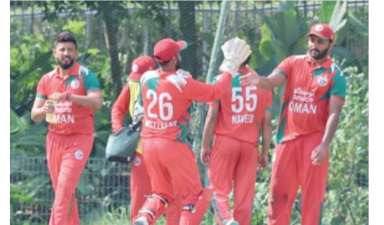
من مباراة المنتخب ضد هونغ كونغ