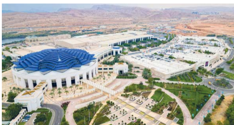
الاختيار يعكس مكانة السلطنة المتنامية على خارطة صناعة المعارض والمؤتمرات

شهد الأسبوع الماضي العديد من الأحداث الاقتصادية والتي منها، انتخاب الاتحاد العالمي لصناعة المعارض، سلطنة عُمان ممثلة في مركز عمان للمؤتمرات والمعارض لرئاسة الاتحاد للفترة ٢٠٢٧ - ٢٠٢٨، بما يعكس مكانتها المتنامية على خارطة صناعة المعارض والمؤتمرات والفعاليات العالمية.