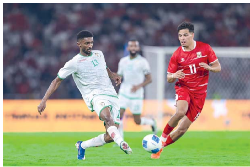
من لقاء المنتخب امام اندونيسيا

لذلك، فمن الصعب جدا ان نرى الفريق هذا المساء بنفس الشكل أو الأداء سواء الفردي أو الجماعي، وعلى السكتيوي ان يظهر للوسط الرياضي بأن ما حدث في مباراة إندونيسيا هو إلا درس لكافة الاطراف ويعتبره مثل ما يقال رب ضارة نافعة، على ان يقدم لنا الاحمر اليوم مباراة كاملة العمل وأن يستفيد من كل تفاصيلها حتى يأخذ الجميع جرعة ثقة كبيرة قبل المراحل القادمة إن شاء الله تعالى.