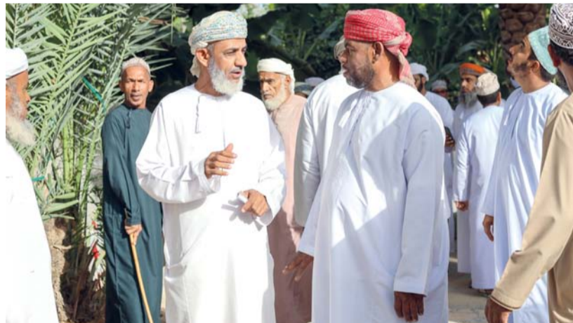
«الدلال» يقوم بالمناداة وإدارة الميزانية ويقوم المشرف بمتابعة التسجيل والحسابات المالية

يُعدُّ طناء النخيل في سلطنة عمان عادة يتوارثها الأبناء عن الأجداد في صورة تجسد عبق الماضي التقليد بالمستقبل المشرق هذا ما تملّهُ «قرية عز» في ولاية القابل من هذه التظاهرة الجميلة التي تمثل ملحمة تراثية واقتصادية وهي تحيي «القيظ» حيث يحرص عليها الجميع فهي تظاهرة سنوية تجمع بين الاستثمار والتكافل الاجتماعي، وتوثق ارتباط الإنسان بالأرض تبدأ مع تباشير القيث وإعلان الصيف عند قدومه وبما تشهده من حراكا اقتصاديا واجتماعيا فريداً ليتجدد الموعد السنوي.