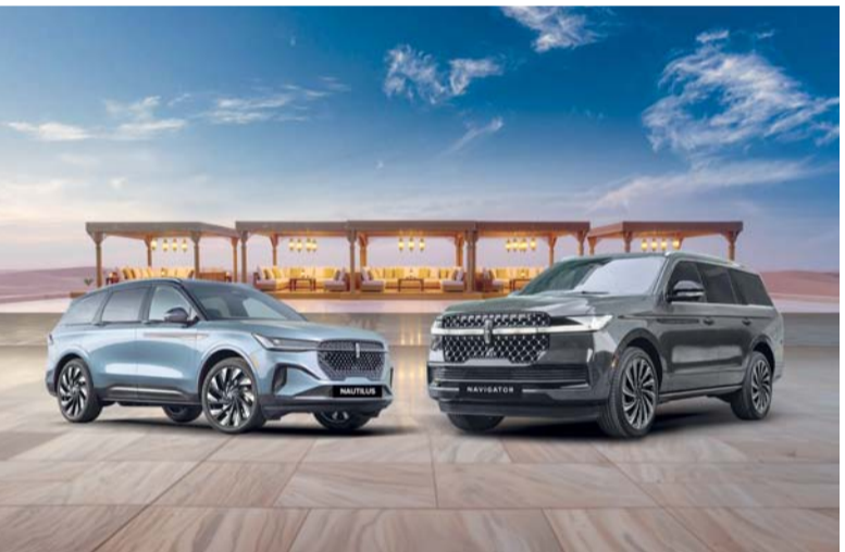
صورة خبير لينكون

أما سيارة أفياثور، فجمع بين الأداء العالي والأناقة، حيث توفر مساحة داخلية واسعة بثلاثة صفوف ونظام تعليق متكيف متطور لتوفير تجربة قيادة سلسة وراقبة لجميع الركاب. وتقدم سيارة كورساير محركاً قوياً بقوة ٢٦٠ حصاناً، مزودة بنظام لينكون Co-Pilot360™ 2.0 Vision وشاشة لمس نابضة بالحياة مقاس ١٣.٢ بوصة تعمل بنظام سينك ٤ المتطور. وتأتي سيارات لينكون في العربة لتسويق السيارات.