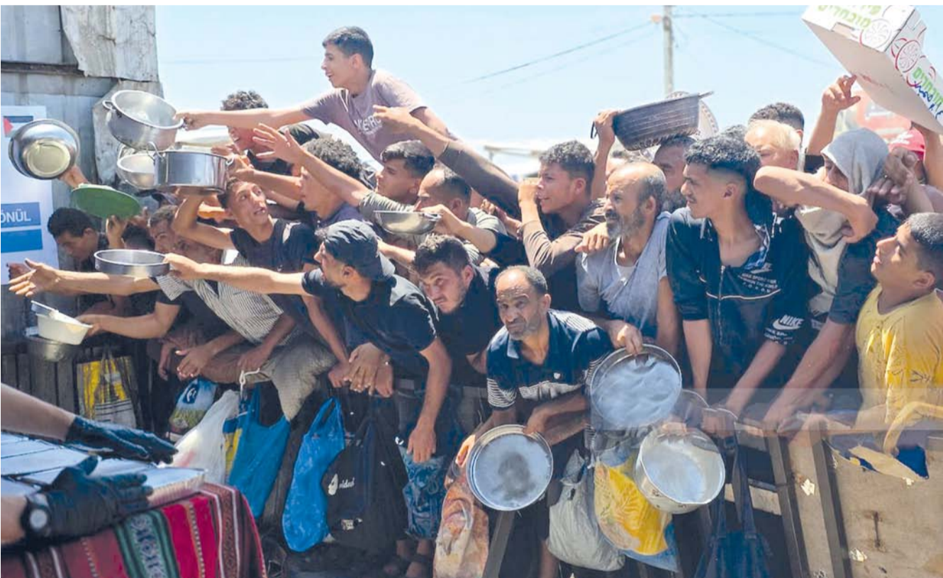
نازحون يتجمعون للحصول على الطعام من مطبخ خيري في خان يونس جنوب قطاع غزة، وسط نقص مستمر في الإمدادات الغذائية نتيجة الهجمات الإسرائيلية والقيود المفروضة على دخول المساعدات إلى القطاع.

بجروح متفاوتة. وفي مدينة غزة، تعرض حي التفاح شرقي المدينة لقصف مدفعي إسرائيلي، فيما شهدت المناطق الشمالية الغربية إطلاق نار من الأليات العسكرية الإسرائيلية. كما أطلقت طائرات مسيّرة من نوع «كواد كوبتر» النار شرقي مدينة غزة، بالترزامن مع إطلاق نار من الأليات الإسرائيلية شمالي مخيم البريج وسط القطاع وشرقي مدينة خان يونس. وامتدت الاعتداءات إلى مناطق شرق خان يونس ومواسي رفح، حيث شهدت قصفاً مدفعياً وإطلاق قنابل إنارة وبخان، في حين استهدفت قصف مدفعي محيط دوار عباس كيلاني في شارع الشيماء شمالي بيت لاهيا. وتراقت هذه التطورات مع تنفيذ قوات الاحتلال عمليات نسف واسعة شمال شرق مدينة خان يونس، وسط استمرار القصف وإطلاق النار في عدد من المحاور