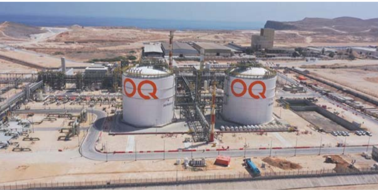
المؤسسة تؤكد على نجاح الهيكل السياتي الذي تبنته سلطنة عُمان بعد عام ٢٠٢٠

الجاف كمرکز إقليمي للصناعات والخدمات البحرية. وأدت هذه الجهود إلى تحقيق نتائج ملفقة خلال الفترة بين عامي ٢٠٢١ و ٢٠٢٥، حيث سجل صافي الربح لشركة أسيا لحوض الجاف نمواً سنوياً مرمكاً بلغ ٦٥,٩ بالمائة، فيما ارتفعت الإيرادات بمعدل نمو سنوي مركب قدره ١٦,٢ بالمائة، كما حققت الشركة نتائج تشغيلية قياسية عبر تنفيذ ٢٥٨ مشروعاً خلال عام ٢٠٢٥ بنمو بلغ ١١ بالمائة مقارنة بعام ٢٠٢٤، إلى جانب تحسين الإنتاجية التشغيلية بنسبة ٢٢ بالمائة، وفي قطاع الفعاليات وسياحة الأعمال، برز مركز عُمان للمؤتمرات والمعارض كأحد النماذج التي نجحت في تعزيز استدامتها التشغيلية والمالية رغم التحديات التي شهدها القطاع خلال السنوات الأخيرة، حيث عمل منذ تأسيسه في بيئة تتسم بتقلبات قطاع الفعاليات وسياحة الأعمال، مع اعتماد نسبي في مراحلها الأولى على الدعم الحكومي لتغطية بعض متطلبات التشغيل، وزادت التحديات مع تأثر حركة المؤتمرات والفعاليات الدولية بالعوامل الجيوسياسية والإقليمية، ما أثر سلباً على تدفق الفعاليات والإيرادات التشغيلية.