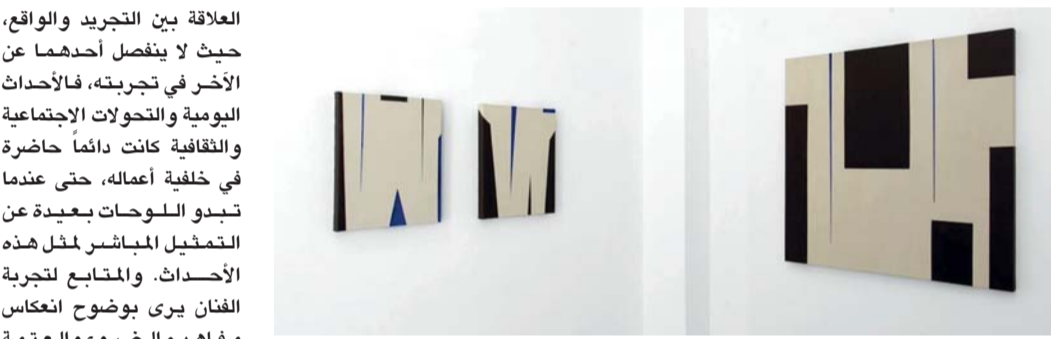
لغة بصرية خاصة تستند إلى التأمل والاختزال

القاهرة . العمانية: كشفت البعثة الأثرية المصرية التابعة للجلس الأعلى للآثار، والعاملة بموقع ميناء عيذاب الأثري بمنطقة حلايب على ساحل البحر الأحمر عن مجموعة من خزانات وصهاريج المياه الضخمة، إلى جانب عدد من المباني والمنشآت الخدمية. ويُلقي الاكتشاف الأثري بحسب بيان لوزارة السياحة والآثار المصرية، الضوء على البنية الأساسية لميناء عيذاب، أحد أبرز وأهم الموانئ المصرية خلال العصور الإسلامية الذي كشف جانباً مهماً من المنشآت الخدمية التي اعتمد عليها ميناء عيذاب التاريخي، حيث مثلت صهاريج المياه عنصراً أساسياً في دعم النشاط الملاحي والتجاري، فضلاً عن توفير احتياجات الحجاج الوافدين إلى الميناء في طريقهم إلى الأراضي المقدسة.