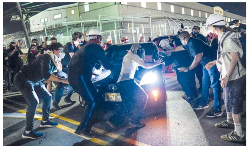
مظاهرون يحاولون منع مركبة من مغادرة ديلاني، التي تُستخدم كمركز احتجاج تابع لإدارة الهجرة والجمارك الأميركية (ICE)، في نيويورك، نيو جيرسي احتجاجاً على ما وصفوه بسوء الأوضاع في السجن.