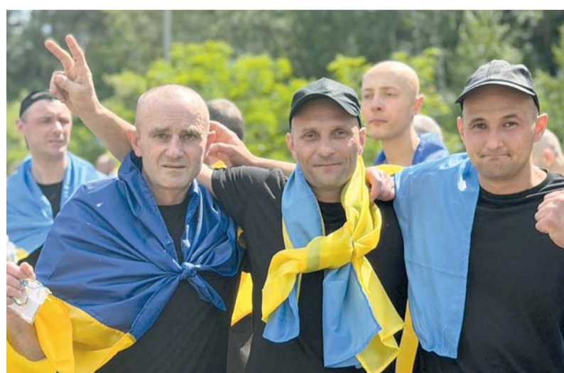
أسرى حرب أوكرانيون سابقون ملفوفون بالأعلام الأوكرانية يلوحون بعلمات النصر خلال عملية تبادل أسرى مع روسيا شملت ١٨٥ شخصاً من كل جانب في موقع لم يُكشف عنه عصر أمس الأول.

الخاضعة للسيطرة الأوكرانية لهجمات متكررة، بالترزامن مع ضربات متبادلة تستهدف المناطق الحدودية الروسية. واعترضت القوات الروسية ٢٥ طائرة مسيّرة ليل الجمعة السبت في المنطقة المحيطة بمدينة سان بطرسبورج حيث يُعقد منتدى اقتصادي مهم، وفق ما أعلن حاكم المنطقة. وقال الحاكم ألكسندر دروزدينكو على تلغرام «أسقطت ٢٥ طائرة مسيّرة فوق منطقة لينينجراد. العمليات القتالية مستمرة». وخلال افتتاح منتدى سان بطرسبورج الاقتصادي الدولي، قصفت مسيرات أوكرانية منشأة نفطية وموقعا عسكريا متجاورين. واستقبل الضيوف الوفود إلى الضيفات بعمود من الدخان الأسود في الخلفية.