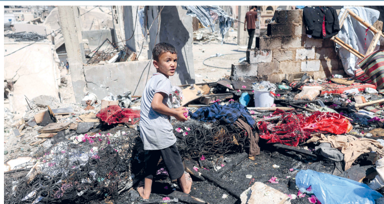
طفل فلسطيني وسط الدمار الذي خلفه قصف «إسرائيل» في خان يونس جنوب قطاع غزة.