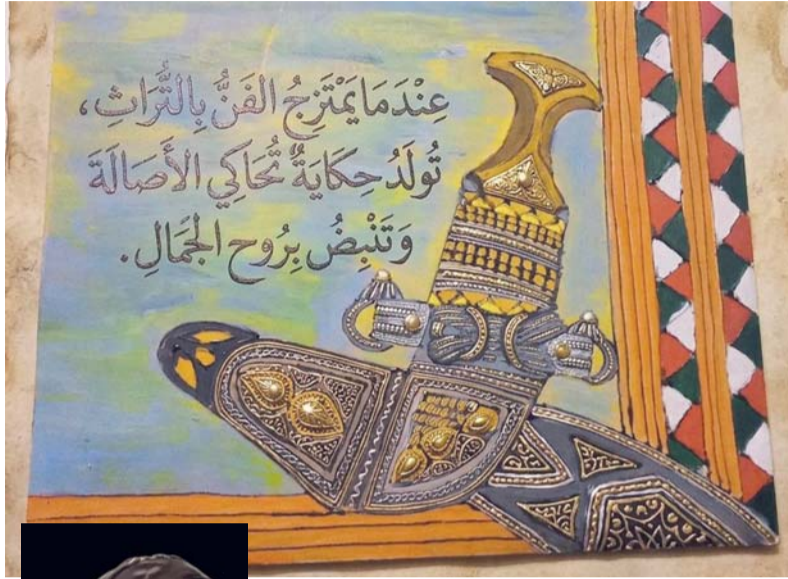
كتب . سعيد الغافري:

لشأن الفنان أن أي تجربة تمثل نموذجاً واعياً للفن متعدد الأدوات، توازن دقيق بين الفكرة والتقنية، والسعي المستمر إلى تطوير الأسلوب والرؤية، مما يمنح مجمل الأعمال طابعاً ناضجاً وقابلاً للاستمرار. وأشارت: الفنان ليس معزولاً عن محيطه، بل شريك في تشكيل الوعي الثقافي، فالعمل الفني الحقيقي هو ذلك الذي يجمع بين الجمال والرسالة، ويقدم محتوى ذاتية تخاطب عقل المتلقي ووجدانه في آن واحد، فالنماذج التي تتركز على التعبير، والتأثير وصناعة المعنى.