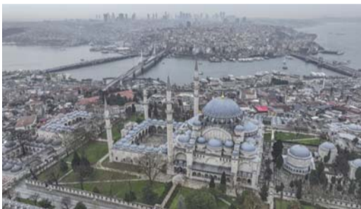
جامع السلعيانية صرح معماري يجسد الحضارة العثمانية