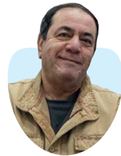
أ.د. محمد الدعيمي كاتب وباحث أكاديمي عراقي

Foreign Language المكتسبة أن تحل محل اللغة الأم، كما يستحيل عليها أن تضم نفسها في كيان المرء ووجوده مهما طالبت الأيام والعقود: اللغة هويتك... ٣