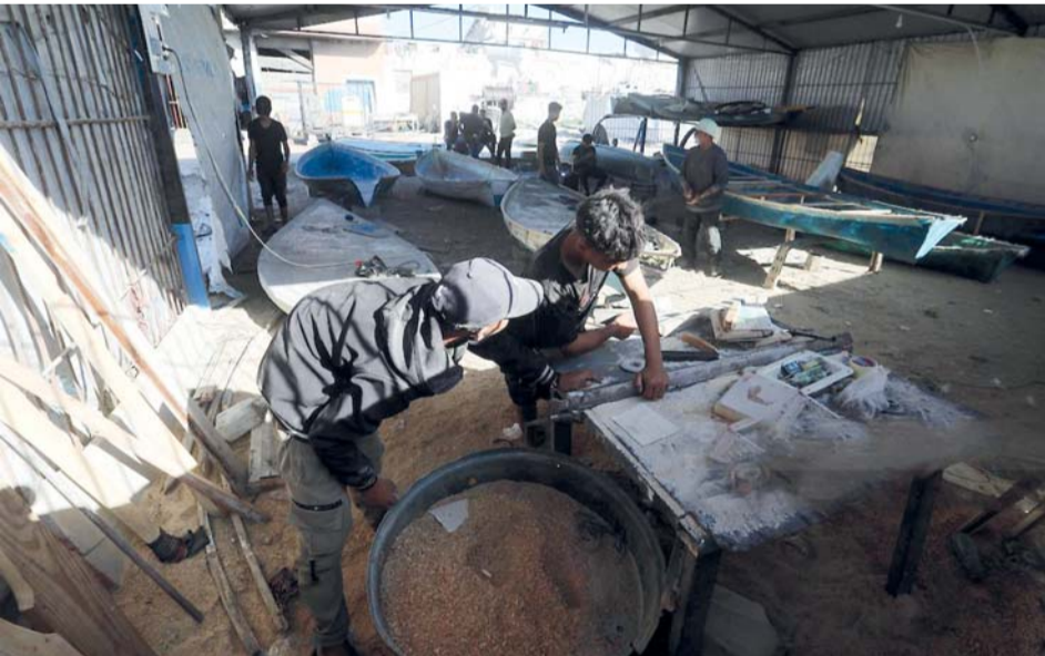
فلسطينيون يرممون قوارب متضررة جراء العدوان «الإسرائيلي» في ميناء غزة باستخدام أخشاب مستخرجة من مبانٍ مدمرة، في ظل نقص المواد الأساسية وارتفاع تكاليف الترميم بسبب إغلاق المعابر واستمرار الضربات «الإسرائيلية»، تفاصيل ..... ص ٨

واصلت قوات الاحتلال «الإسرائيلي» خروقاتها لوقف إطلاق النار في قطاع غزة، ما أسفر عن شهيدين، كما نفذت عمليات قصف ونسف واسعة خاصة شرق خان يونس وغزة. وأفادت مصادر بارقاء شهد بقصف من مسيرة «إسرائيلية» صباح أمس على منطقة المرقاة وسط قطاع غزة. واستشهدت فلسطينية في مشفى ناصر بخانيونس متأثرة بجراحها جراء قصف الاحتلال في مخيم غيث قبل أسبوع. وأفادت الأنباء أن قوات الاحتلال نفذت ما لا يقل عن ٨ عمليات نسف شرق خان يونس الليلة قبل الماضية فجر أمس، حيث سمع دوي انفجارات هائلة نتيجة ذلك. كما نفذت قوات الاحتلال عملية نسف مماثلة شرق غزة، ووفق مصادر متطابقة، فإن قوات الاحتلال تواصل تدمير ما تبقى من منازل ومبان داخل نطاق ما يعرف بالخط الأصفر. إلى ذلك، قصفت مدفعية الاحتلال شرق مدينة غزة، في حين أطلقت ألبيات الاحتلال النار بكثافة شرق خان يونس جنوب قطاع غزة.