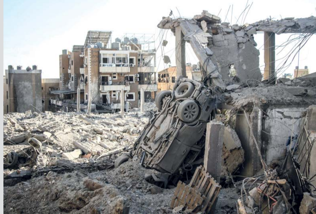
أثار الغارات الجوية الإسرائيلية على منطقة برج الشمالي قرب مدينة صور جنوب لبنان.

ما أفادت الوكالة الوطنية للإعلام الرسمية. في المقابل، تبني حزب الله هجمات على القوات الإسرائيلية المتوغلة في جنوب لبنان.