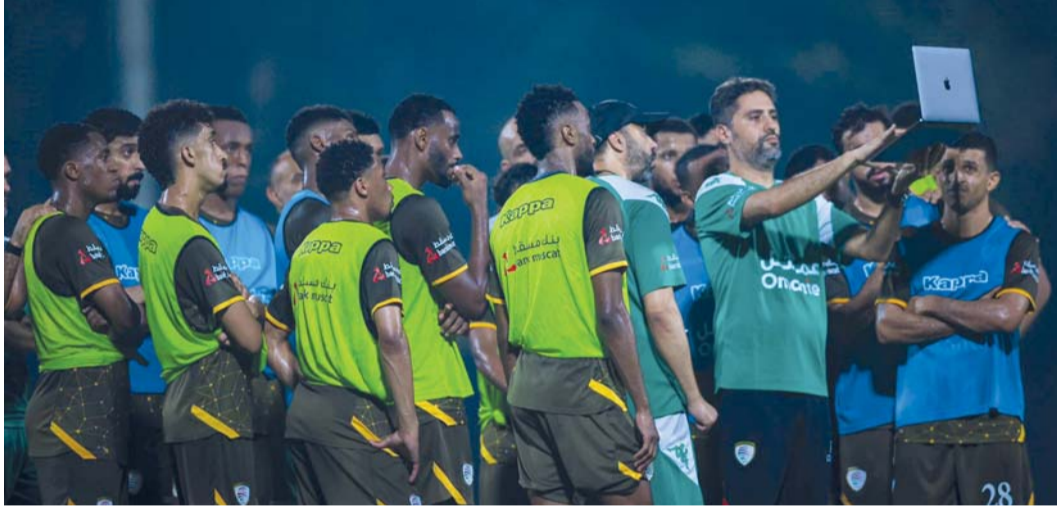
لاعبو الأحمر يستمعون لتعليمات الجهاز الفني قبل انطلاق التدريب

يخوض منتخبنا الوطني الأول لكرة القدم في تمام الساعة الخامسة مساء غد بتوقيت السلطنة، مباراة ودية دولية أمام نظيره المنتخب الإندونيسي، وذلك على استاد جيلورا يونج كارنو في العاصمة الإندونيسية جاكارتا، حيث يتواجد الأحمر الكبير في معسكره الخارجي هناك بقيادة المغربي طارق السكتيوي الذي أخذ على عاتقه مشروعاً طويلاً المدى لمدة أربعة أعوام لقيادة الكرة العمانية لمستقبل مشرق وأفضل، لمواجهة الغد تعتبر تجربة قوية ومثيرة للغاية، خاصة وأن المنتخب الإندونيسي قدم مستويات رائعة في تصفيات كأس العالم الأخيرة، ووصل إلى