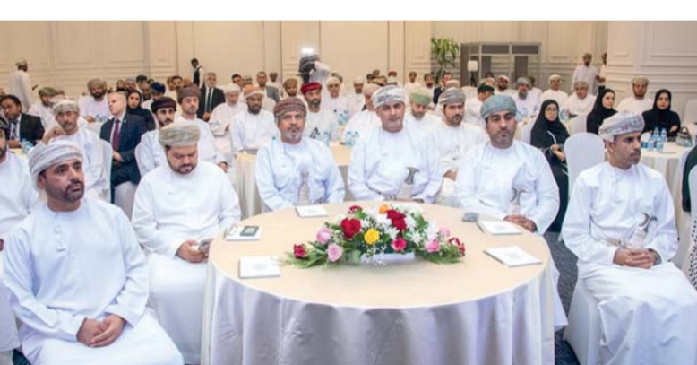
الحلقة ناقشت آليات رفع ترتيب سلطنة عمان في المؤشرات الدولية المرتبطة بالقطاع

التعريف بقطاع النقل واللوجستيات وأبرز المنجزات والمبادرات الاستراتيجية التي تنفذها سلطنة عُمان لترسيخ مكانتها مركزاً لوجستياً عالمياً، والتطورات المتسارعة التي شهدتها المنظومة اللوجستية إضافة إلى تأسيس مركز عُمان للوجستيات وإطلاق عدد من البرامج الوطنية المتخصصة في هذا القطاع إلى جانب تسليط الضوء على عدد من الفرص الاستثمارية الواعدة في النقل واللوجستيات. وتأتي هذه الحلقة ضمن سلسلة من حلقات العمل التي تنظفها غرفة تجارة وصناعة عُمان في إطار تعزيز الشراكة والتكامل بين القطاعين العام والخاص، وبحث التحديات والفرص التنموية والاستثمارية في مختلف القطاعات الاقتصادية.