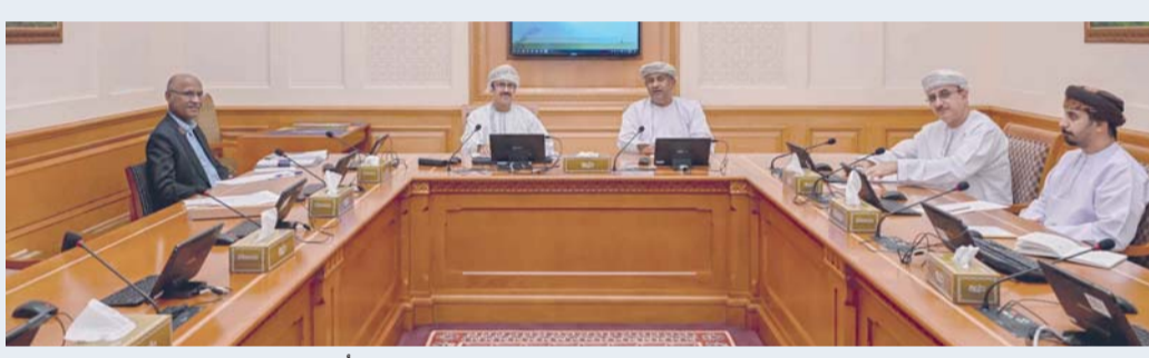
الدراسة تبحث سبل تحفيز القطاع الخاص على توظيف العُمانيين

والمتوسطة في إيجاد فرص عمل جديدة للمواطنين. وتبحث الدراسة كذلك سبل تحفيز القطاع الخاص على توظيف العُمانيين، والنظر في آليات تعزيز مواهبة مخرجات التعليم مع احتياجات سوق العمل، إلى جانب مراجعة التشريعات والإجراءات والقيود التنظيمية التي قد تحد من إيجاد فرص عمل للباحثين، بما يسهم في رفع كفاءة سوق العمل وتعزيز قدرته على استيعاب الكفاءات الوطنية.