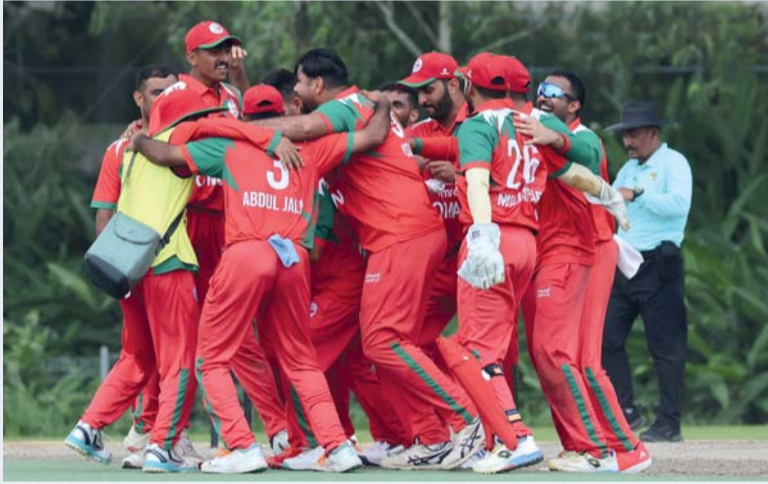
فرحة لاعبي المنتخب بالفوز والتأهل

حقق المنتخب الوطني للكريكت إنجازاً تاريخياً بصعوده إلى دورة الألعاب الآسيوية باليابان والمزمع إقامتها خلال الفترة من 17 سبتمبر إلى 3 أكتوبر ، وذلك بعد أن نجح في تحقيق الفوز على نظيره المنتخب البحريني بفارق 20 نقطة وذلك ضمن منافسات المجموعة الثانية للتصفيات الآسيوية المؤهلة إلى دورة الألعاب الآسيوية باليابان، في المباراة التي أقيمت أمس الأربعاء على ملعب سنغافورة الوطني للكريكت. وجاء الفوز الثاني على التوالي للمنتخب العُماني في منافسات المجموعة الثانية بعد ختام مواجهات التصفيات.