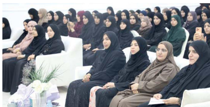
تطوير بيئات التعليم المبكر والارتقاء بالممارسات التربوية