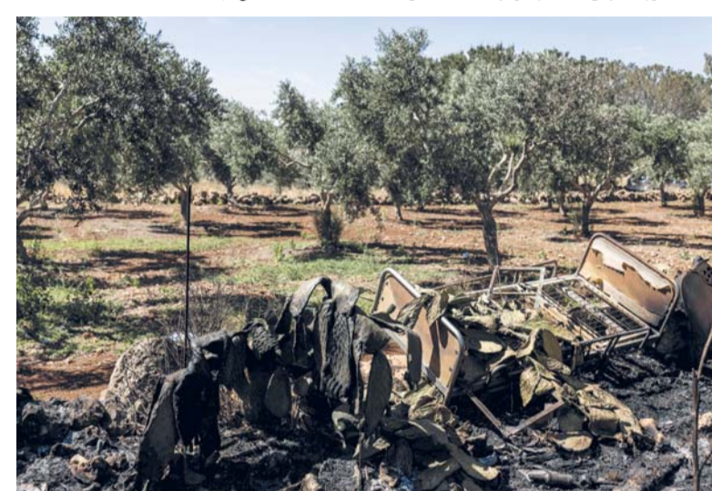
دمار في مزرعة أغنام أضرم فيها مستوطنون إسرائيليون النار في قرية أبو فلاح الفلسطينية وسط الضفة الغربية المحتلة.

واصلت قوات الاحتلال الإسرائيلي خروقاتها لوقف إطلاق النار في قطاع غزة، ونفذت عمليات قصف ونسف واسعة خاصة شرق خان يونس وغزة. وأفادت مصادر بارشقاء شهيد بقصف من مسيرة إسرائيلية صباح أمس على منطقة المغرقة وسط قطاع غزة. وأفادت الأنباء أن قوات الاحتلال نفذت ما لا يقل عن ٨ عمليات نسف شرق خان ونس فجر أمس، حيث سمع دوي انفجارات هائلة نتيجة ذلك. كما نفذت قوات الاحتلال عملية نسف مماثلة شرقي غزة. ووفق مصادر متطابقة، فإن قوات الاحتلال تواصل تدمير ما تبقى من منازل ومبان داخل نطاق ما