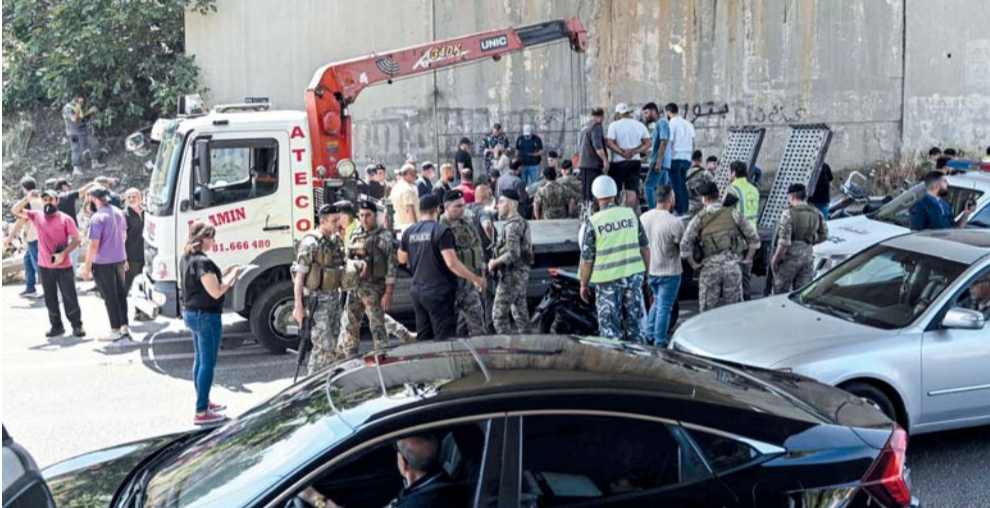
قوات الأمن اللبنانية تقف بجوار شاحنة سحب تُزيل المركبة التي قُتل ركبها في غارة جوية «إسرائيلية» بطائرة مسيرة على طريق خلدة السريع عند المدخل الجنوبي لبيروت أمس.

ترامنا مع محادثات واشنطن.. قتلى في غارات «إسرائيلية» على لبنان