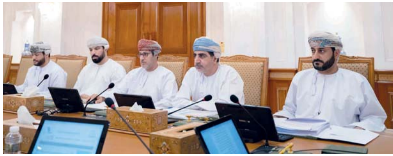
الاجتماع تطرق إلى بحث إطلاق برنامج تمكين العلامات التجارية المحلية

استعرض مكتب مجلس الشورى خلال اجتماعه أمس جملة من تقارير اللجان الدائمة بشأن عدد من الرغبات المبداء التي انتهت من دراستها مؤخرًا تمهيداً لرفعها ومناقشتها خلال جلسات المجلس الاعتيادية المقبلة، أبرزها تقرير الرغبة المبداء المقدمة من لجنة الخدمات والمرافق العامة حول «تعزيز كفاءة خدمات الكهرباء والمياه في سلطنة عُمان» حيث تهدف الرغبة إلى تحليل واستقراء واقع التحديات التي تواجه خدمتي الكهرباء والمياه في سلطنة عمان، وتقديم المقترحات والتوصيات التي من شأنها تعزيز جودة خدمات الكهرباء والمياه ورفع مستويات رضا المستفيدين، والتي جاء من بينها تشديد الرقابة على الشركات المشغلة لضمان مراعاة الخصائص الجغرافية المختلفة لكل ولاية، والتأكيد على استمرار نسب التخفيض على