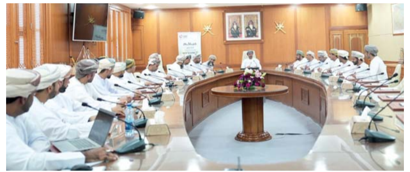
الإطلاع على مبادرة «منهل نماء» إحدى المبادرات الاستراتيجية

استعرضت شركة نماء لخدمات المياه جهودها في الارتقاء بجودة الخدمات المقدمة للمشاركين، وتعزيز كفاءة العمليات التشغيلية بحضور اللقاء سعادة المهندس مسعود بن سعيد الهاشمي محافظ جنوب الباطنة، وبدر بن محمد السعيد مدير عام بلدية جنوب الباطنة، وممثلي شركة نماء لخدمات المياه، وأعضاء المجلس البلدي والمختصين من الجانبين وذلك بمكتب محافظ جنوب الباطنة في إطار تعزيز التعاون والتنسيق المشترك بما يساهم في تطوير خدمات المياه وتحقيق استدامتها في مختلف ولايات المحافظة. وجرى خلال اللقاء استعراض جهود شركة نماء لخدمات المياه في الارتقاء بجودة الخدمات المقدمة للمشاركين، وتعزيز كفاءة العمليات التشغيلية، إلى جانب التوسع في تطبيقات التحول الرقمي والخدمات الإلكترونية بما يساهم في تسهيل وصول المستفيدين إلى خدمات الشركة وتحسين تجربة المشتركين. كما تم خلال اللقاء مناقشة عدد من الموضوعات ذات الاهتمام المشترك المتعلقة بتطوير قطاع المياه بالمحافظة، وبحث سبل تعزيز الشراكة المجتمعية والاستفادة من الملاحظات والمقترحات الواردة من المستفيدين، بما يدعم جهود تحسين الخدمات ورفع مستويات الرضا، إضافة إلى استعراض فرص التعاون مع الجهات المعنية لمعالجة التحديات التشغيلية وتعزيز استدامة خدمات المياه. واطلع سعادة المحافظ والحضور على مبادرة «منهل نماء» التي