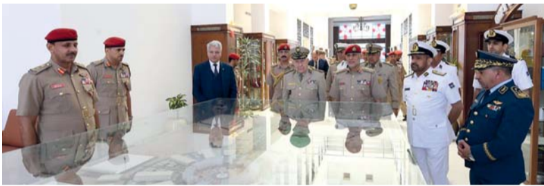
الوفد يستمع إلى إيجاز عن رسالة الكلية التعليمية