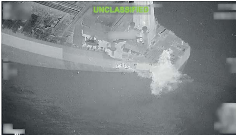
صورة من فيديو نشرته القيادة المركزية الأميركية تظهر ما وصفه الجيش الأميركي بأنه ضربة صاروخية شنها على ناقلة النفط «إم/تي ليكسي» التي ترغف علم بوتسوانا، وهي ناقلة نفط فارغة كانت تحاول الإبحار إلى ميناء إيراني.

كما أعلنت الهيئة العامة للطيران المدني تفعيل خطة الطوارئ في مطار الكويت الدولي بعد استهداف مبنى الركاب «سي ١» بطائرات مسيرة وصواريخ وتعليق الرحلات الجوية وتحويل الرحلات إلى مطارات بديلة حتى إشعار آخر.