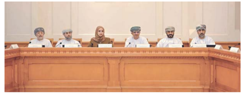
استعراض الفرص المتاحة لتطوير الأطر التنظيمية والتشريعية

الفواتير خلال أشهر الصيف، مع تكثيف الحملات التوعوية لتعزيز الترشيد الاستهلاكي، ووضع آلية واضحة لتوصيل خدمة المياه والصرف الصحي للمخططات السكنية الجديدة ومواكبة التوسع العمراني. جاء ذلك ضمن أعمال مكتب المجلس العادي الخامس عشر لدور الانعقاد العادي الثالث من الفترة العاشرة (٢٠٢٣-٢٠٢٧م)، الذي عقد برئاسة معالي الشيخ خالد بن هلال المعولي رئيس المجلس وبحضور أصحاب السعادة أعضاء المكتب وسعادة الشيخ