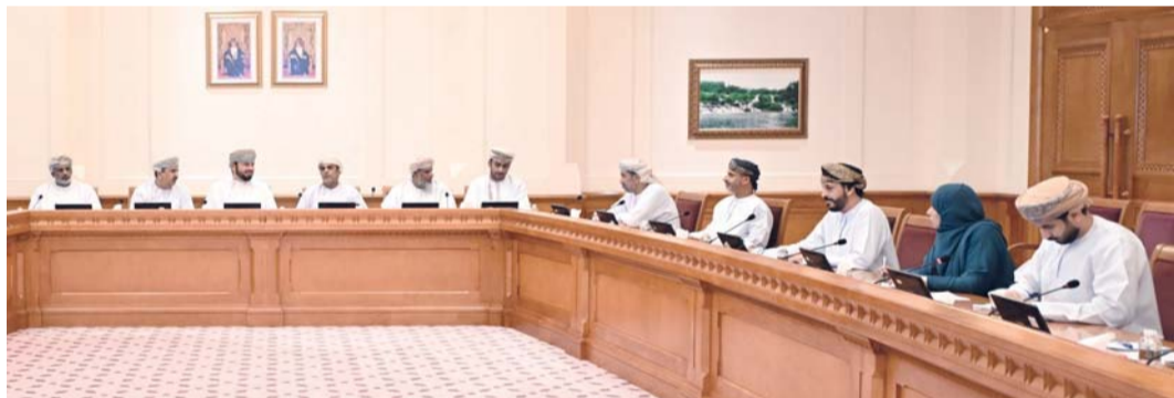
اجتماع لجنة الأمن الغذائي والمائي بالشورى

والسمكية وموارد المياه إلى جانب تقييم الجلسة الاعتيادية لبيان معالي وزير الثروة الزراعية والسمكية وموارد المياه التي تم مناقشتها مؤخراً من قبل أصحاب السعادة أعضاء المجلس.