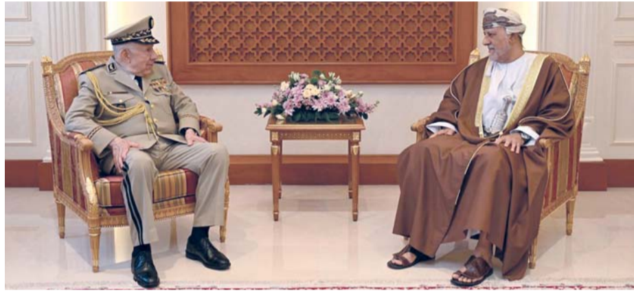
شهاب بن طارق يستقبل السعيد شنقريحة

خمس الرئيسي رئيس أركان قوات السلطان المسلحة بمكتبه بمعسكر المرتفعة، الفريق أول السعيد شنقريحة الوزير المنتدب لدى وزير الدفاع الوطني رئيس أركان الجيش الوطني الشعبي بالجمهورية الجزائرية الديمقراطية الشعبية والوفد المرافق له الذي يزور سلطنة عُمان حالياً. ولدى وصول الضيف الزائر مقر رئاسة أركان قوات السلطان المسلحة أجريت له مراسم استقبال رسمية، حيث أدى حرس الشرف التحية العسكرية، وعزفت مجموعة من فرقة الموسيقى