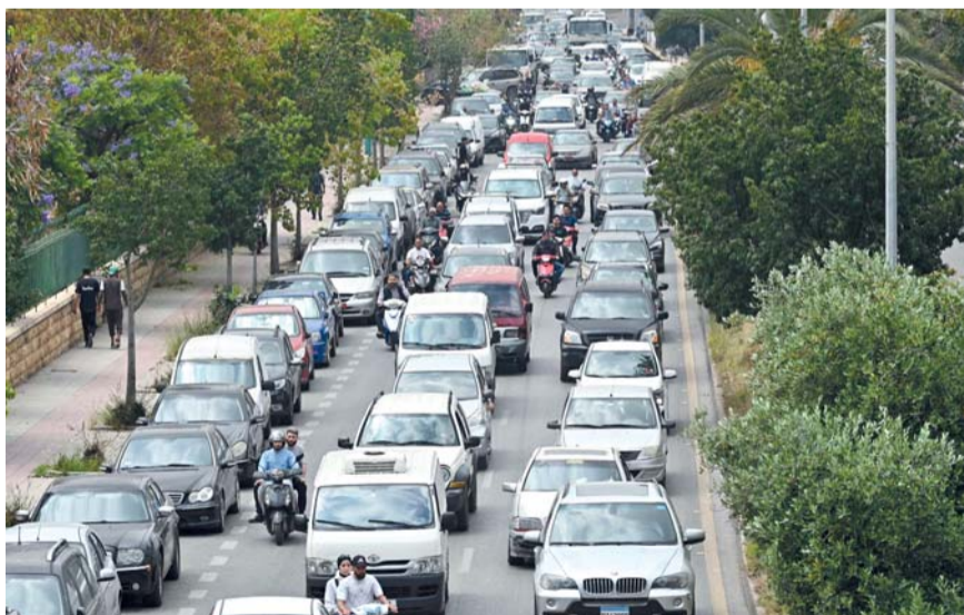
لبنانيون ينزحون من الضاحية الجنوبية بعد إعلان «إسرائيل» اعتزامها شن هجمات.

أميركا ترى مسار المفاوضات «على ما يرام» .. وإيران لا تنطبق له النووي واشنطن - عواصم - وكالات: اعتبر الرئيس الأمريكي دونالد ترامب أن الأمور تسير على ما يرام في ما يتعلق بالمفاوضات مع إيران. وشدد في منشور على منصته «تروث سوشيل» على أن طهران ترغب حقًا في إبرام اتفاق مع الولايات المتحدة، وإنه سيكون اتفاقًا جيدًا لواشنطن وحلفائها، من جانبها أكدت وزارة الخارجية الإيرانية أنه لا توجد حاليًا أي مناقشات مع الولايات المتحدة حول برنامج طهران النووي. وقال المتحدث باسم الوزارة إسمايل بقائي خلال مؤتمر صحفي أسبوعي «نعرف متى يحين الوقت المناسب للتحرّك في ما يتعلق بالملف النووي. لم نُجر أي مفاوضات حول تفاصيل هذا الملف حتى الآن. في هذه المرحلة، تبقى أولويتنا إنهاء الحرب».