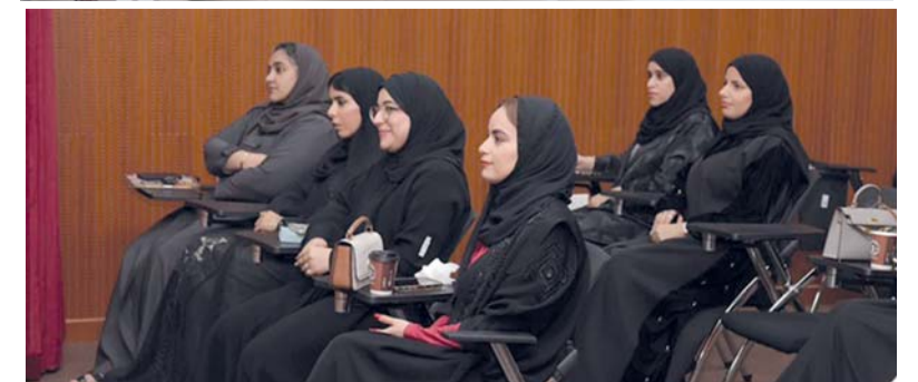
■ المعرض رؤية بصرية نوعية كونه يوثق واقع فنون الأزياء العمانية النسائية