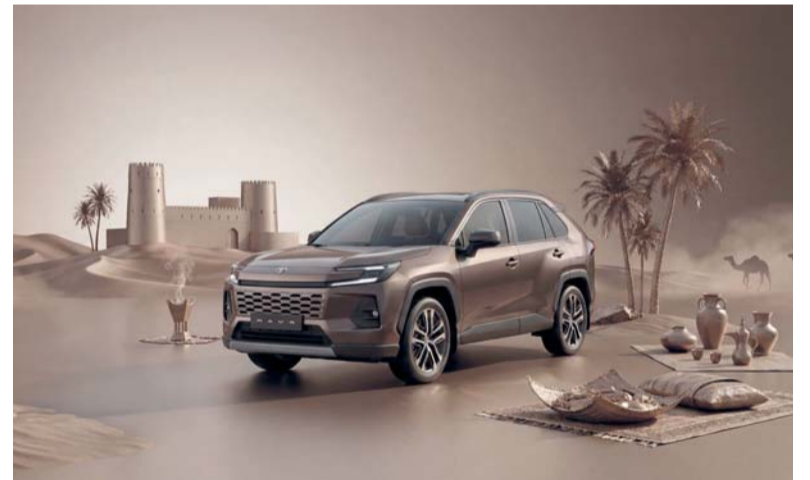
حملة صيفية بطرازات متنوعة من سيارات تويوتا

وتوفر بطاقات «الجوهر» الائتمانية العديد من الامتيازات المصممة لتلبية أسلوب الحياة العصري، بما في ذلك ميزات التأمين المجاني للسفر، وإمكانية الاستفادة من برنامج المكافآت عبر جمع النقاط لكل معاملة، كما توفر البطاقة الوصول إلى مجموعة كبيرة من الصالات في مطارات العالم، بالإضافة إلى الصالات الموجودة في مطار مسقط وصلالة والدقم. كما يمكن لحاملي بطاقة «الجوهر» الائتمانية الاستفادة