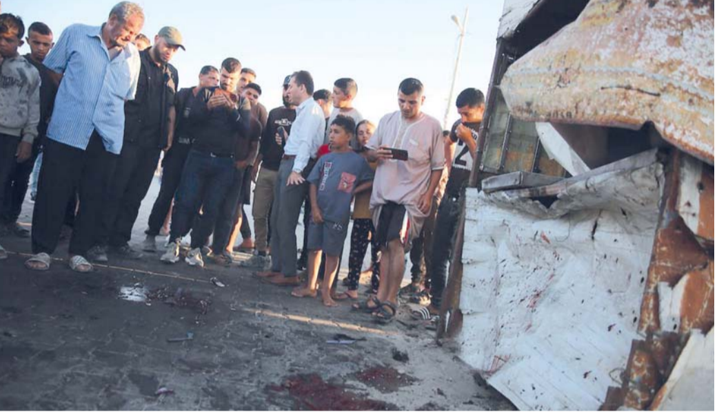
فلسطينيون يعاينون موقع القصف «الإسرائيلي» على ميناء غزة.

مستشفى الشفاء إثر القصف. وفي وقت سابق، استشهد فلسطيني متأثراً بجروحته التي أصيب بها جراء قصف الاحتلال محيط سوق فراس وسط مدينة غزة. وأصيب عدد جليل من مسيرة «إسرائيلية» بمنطقة «بلوك ٩» في مخيم البريج وسط قطاع غزة. وأفاد مصدر أن قوات الاحتلال نفذت عملية نسف شرق مدينة غزة، بالتزامن مع تجدد القصف المدفعي «الإسرائيلي» على مناطق شرق حي الزيتون جنوب شرق المدينة.