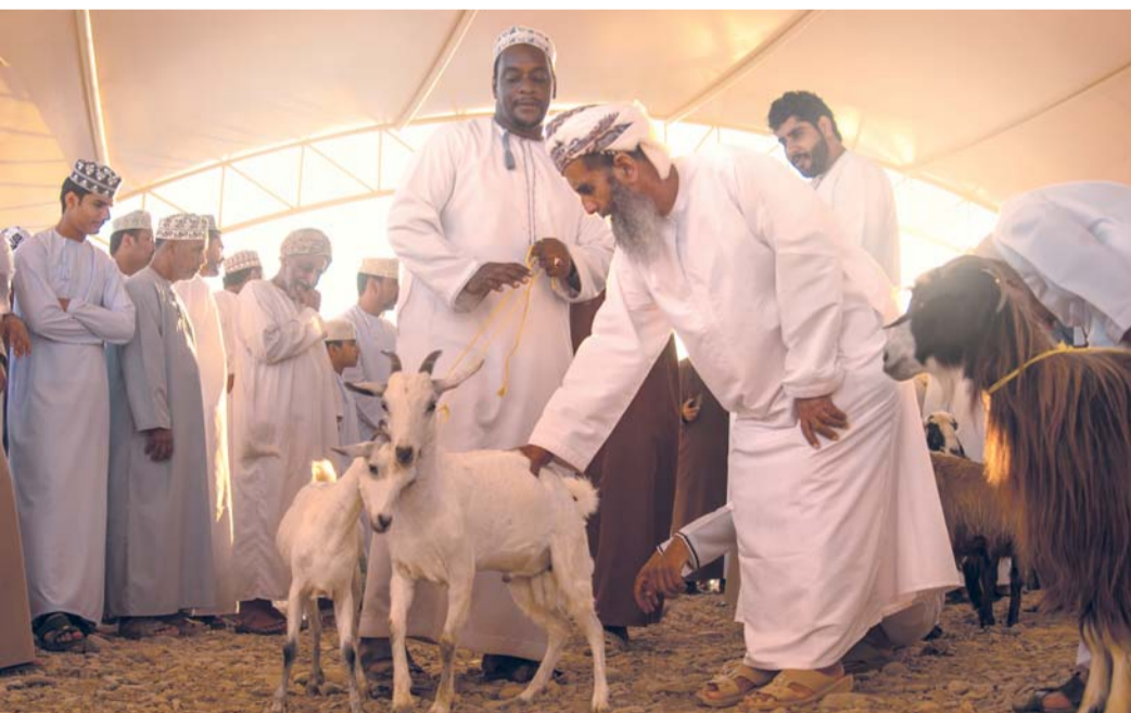
■ المشاهد تم من أدوات المصور من أدوات الضوئية

المعاني والحروف، محاورها بصرية تجعل العاشق للصورة يتأمل تفاصيلها المغمة بعق الفكره ولهب المشاعر وجميل الإحساس. قام (الحجري) بالتنقل بين الولايات العمانية ورصد مشاهد بصرية فائقة الروعة والتعبير وقرب لنا المشهد لعيشه كواقع ملموس نستشعر اللحظة ومع تقدم الزمن تتحول المشاهد عبر الصورة إلى ذكريات كقصيدة شاعر كتب حروفها بقافية الذهب التي لا تصدى ولا ينكسر وزنها لحظة الإلقاء والخطابة. ■