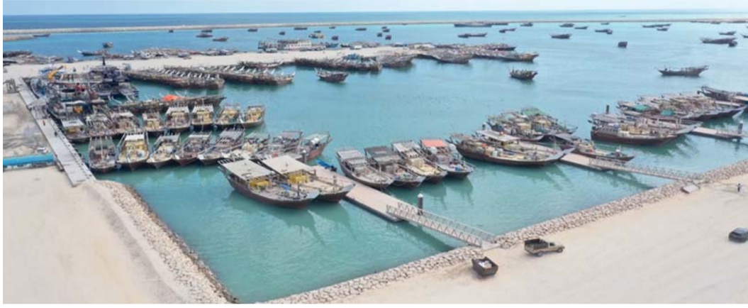
تنظيم مواسم الصيد وتطبيق أنظمة التتبع والمراقبة يسهم في مكافحة الصيد غير القانوني

تشارك سلطنة عُمان ممثلة في وزارة الثروة الزراعية والسمكية وموارد المياه دول العالم الاحتفال باليوم الدولي لمكافحة الصيد غير القانوني دون إبلاغ ودون تنظيم والذي يصادف الخامس من يونيو من كل عام. وجاءت فكرة الاحتفال بهذا اليوم عام ٢٠١٥م عندما اقترحت منظمة الأغذية والزراعة للأمم المتحدة (الفاو) يوم ٥ يونيو تحديداً وهو التاريخ الذي دخلت فيه اتفاقية تدابير دولة الميناء حيز التنفيذ رسمياً بوصفها معاهدة دولية وصك دولي ملزم وموقوف تماماً على قضية مكافحة الصيد غير القانوني دون إبلاغ أو تنظيم. ويُعرّف الصيد غير القانوني بأنه أنشطة الصيد السمكي بصورة تخالف القوانين واللوائح والأنظمة المعمول بها المتمثل في: الصيد بدون ترخيص قانوني والصيد في المناطق أو المواسم المحظورة وباستخدام معدات ووسائل