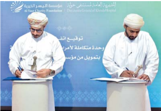
إنشاء وحدة متكاملة لأمراض الرئة

ضمن إطار تعزيز الشراكة بين القطاعين العام والمجتمعي ودعماً للمبادرات الصحية في سلطنة عُمان.