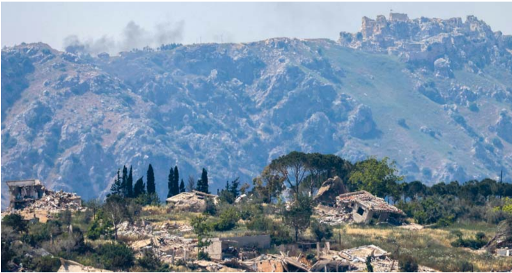
مبان مدمرة في قرية كفر كلا جنوب لبنان، ودخان يتصاعد في الأفق خلف قلعة الشقيف أو شقيف أرنون، وذلك عقب غارة جوية «إسرائيلية».

في بيروت. وكالات: اعتبر الرئيس اللبناني جوزاف عون أن بلده يواجه «عدواناً إسرائيلياً شرساً»، فيما عقد مجلس الأمن جلسة طارئة بعد إعلان «إسرائيل» السيطرة على مرتفع استراتيجي في جنوب لبنان ونوسيع عملياتها. وقال عون في بيان إن لبنان «يواجه عدواناً إسرائيلياً شرساً ومداناً»، متعهداً «العمل لإنهاء معاناة اللبنانيين عموماً والجنوبيين خصوصاً ووضع حد لعداوتهم». من جانبه أعلن «حزب الله» اللبنانيين في بيانين منفصلين