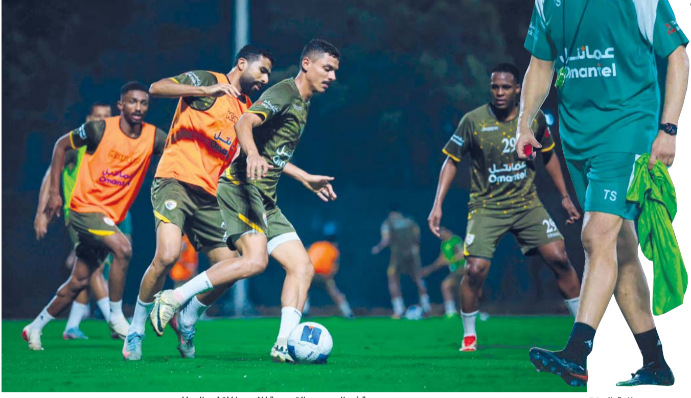
جدية في الحصة التدريبية للاعب المنتخب الوطني