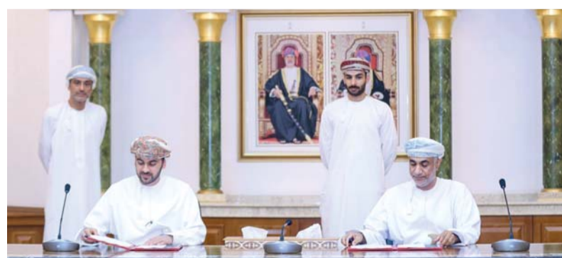
التوقيع على الاتفاقية

ويؤمل أن يسهم المشروع في تحسين انسيابية الحركة المرورية وخدمة الأحياء السكنية والمشاريع الحيوية والخطط العمرانية الواقعة على امتداد الطريق، إلى جانب تعزيز كفاءة أنظمة تصريف المياه السطحية ورفع جاهزية البنية الأساسية، بما يدعم جهود بلدية مسقط في بناء شبكة طرق أكثر كفاءة وأماناً واستدامة.