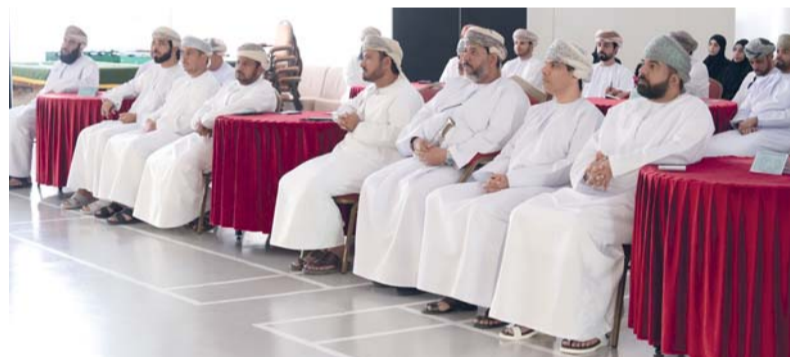
■ بناء قدرات الكوادر المختصة بالتخطيط والتنمية المحلية