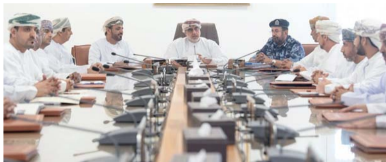
المجلس البلدي بشمال الشرقية استعرض الموضوعات المرتبطة بالتنمية المحلية

عدداً من الموضوعات الخدمية والتنموية، إلى جانب استعراض الجهود المبذولة في التعامل مع تأثيرات المخفضات الجوية الأخيرة، في إطار تعزيز التكامل المؤسسي ورفع كفاءة الاستجابة لمختلف التحديات. ترأس الاجتماع سعادة محمود بن يحيى الذهلي محافظ شمال الشرقية بحضور أعضاء المجلس البلدي بالمحافظة.