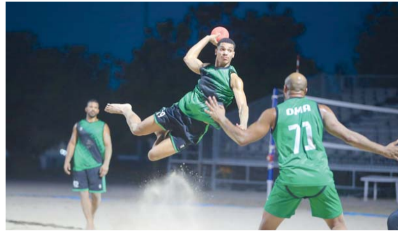
معنويات عالية للاعب منتخبنا في التدريبات اليومية بمجمع بوشر

جاهزية المنتخب قبل التوجه إلى المعسكر الخارجي في كرواتيا والذي يتخلله خوض بطولة ودية دولية خلال الفترة من ١٨ إلى ٢١ يونيو الجاري بمشاركة ٨ منتخبات. ويسعى الجهاز الفني من خلال البطولة الودية إلى منح اللاعبين فرصة أكبر للاحتكاك واكتساب المزيد من الخبرة إضافة إلى الوقوف على المستويات الفنية والبدنية وتجربة عدد من الخطط الفنية ومعالجة بعض الملاحظات قبل