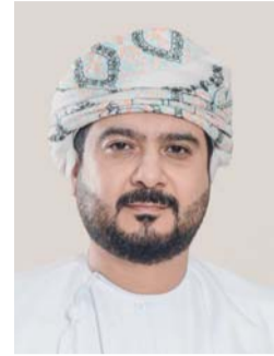
■ قيس اليوسف

اللوجستية، الأمر الذي يعزز الحاجة إلى كوادر وطنية مؤهلة تجمع بين التأهيل الأكاديمي والخبرة العملية. وقال معالي قيس بن محمد اليوسف رئيس الهيئة العامة للمناطق الاقتصادية الخاصة والمناطق الحرة إن تطوير الدقم لا يعتمد على البنية الأساسية والاستثمارات فحسب بل يرتبط أيضاً بتمكين الشباب العُماني من بناء مستقبل مهني واعد في القطاعات الاقتصادية والصناعية التي تشهد نمواً متسارعاً، مؤكداً أن البرنامج التدريبي يتيح للطلبة فرصة التعرف المباشر على هذه القطاعات ويسهم في تعزيز التواصل المبكر بين الشركات والقطاعات الوطنية المستقبلية. من جانبه أوضح