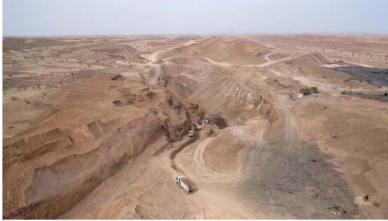
■ قطاع المعادن في محافظة جنوب الباطنة يسهم في دعم التنمية الاقتصادية