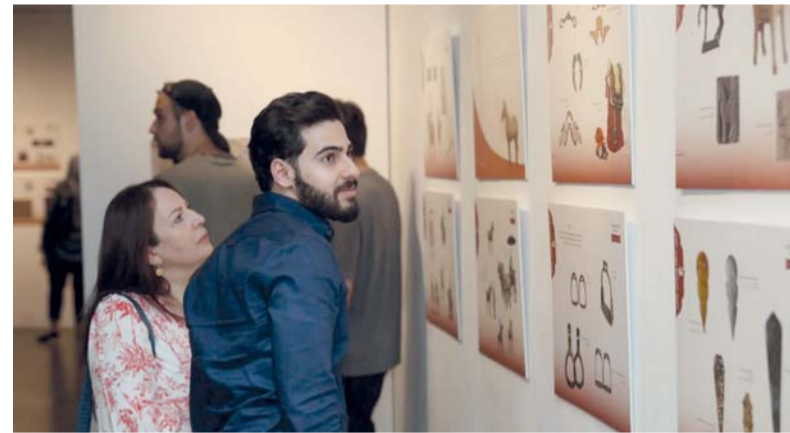
المعرض يقدم تجربة تجمع بين جماليات الشكل وعمق الدلالة

وأكدت هذه المعالجات البصرية على قدرة الفنانين على توظيف الحركة والإيقاع الخطي لإضفاء الحيوية على المشهد، مع المحافظة على الاقتصاد في التفاصيل الذي يُعد سمة أساسية في الفن الصيني التقليدي. ومن الناحية الفنية، اتسمت الأعمال المعروضة بمهارة عالية في استخدام الخطوط الحرة التي تشكل جوهر الرسم بالحبر الصيني، فالخط هنا لا يؤدي وظيفة شكلية فقط، بل يتحول إلى عنصر تعبيرى قادر على نقل الإحساس بالحركة والوزن والفراغ أيضاً، وقد بدأ من الأعمال المعروضة اعتماد الفنانين على خبراتهم الطويلة