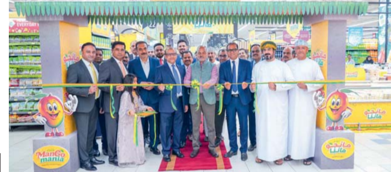
■ لحظة إطلاق مهرجان مانجو مانيا في لولو بوش

أطلقت مؤخرًا لولو بوش مهرجانها السنوي «مانجو مانيا» برعاية سعادة جي. في. سرينيفاس السفير الهندي المقيم لدى سلطنة عمان. ويضم مهرجان هذا العام تشكيلة استثنائية من أكثر من ٧٠ صنفًا من المانجو من مختلف أنحاء العالم، بما في ذلك الهند واندونيسيا وماليزيا وسريلانكا وأوغندا واليمن وكولومبيا.. وغيرها الكثير، بالإضافة إلى المنتجات المحلية العُمانية. ويُعد لولو أيضًا من أكبر موردي وموزعي المنتجات العُمانية الطازجة في البلاد، حيث تدعم باستمرار المزارعين المحليين وتوفر لعملائها أجود أنواع المانجو الموسمية. ومن أبرز الأصناف المعروضة (الفونسو وكيسار وبادامي ومانجو تايلاند الأخضر الحلو ومانجو تيمور ومانجو العماني الأخضر.. وغيرها) إلى جانب عرض مجموعة متنوعة من الفاكهة الطازجة. ويسلط المهرجان الضوء على تنوع استخدامات