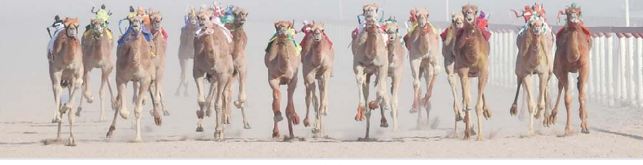
رصد جوائز قيمة لاصحاب المراكز الاولى

مجلس إدارة النادي وبعض من رؤساء الفرق الأهلية حيث احتكمت المباراة الى الركلات الترجيحية ليتوج من خلالها فريق المدة بطلا لكأس السوبر بنادي المصنعة. وقد اتسمت المباراة النهائية بالإثارة وضياح الفرص كما شهدت حضوراً جماهيرياً وتنافساً قويا وقد كرم راعي المباراة الحكام وفريق القرط الوصيف والميداليات الفضية وتكريم فريق المدة بطل السوبر بالميداليات الذهبية وكأس البطولة.