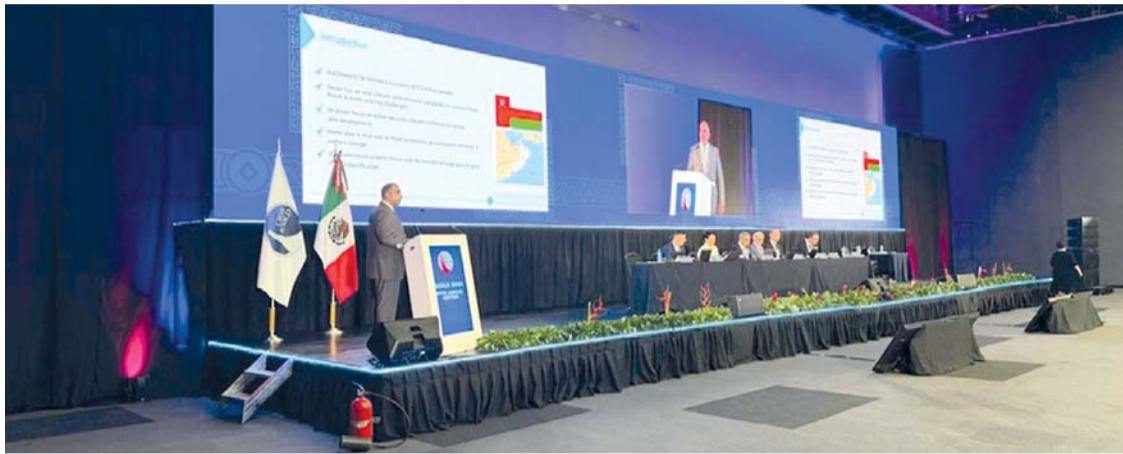
رفع كفاءة إدارة الموارد المائية

جدير بالذكر أن اللجنة العُمانية للسدود الكبيرة تختص بمتابعة عضوية سلطنة عُمان في اللجنة الدولية للسدود الكبيرة، وتعزيز التعاون الفني وتبادل المعرفة والخبرات مع المؤسسات واللجان الدولية ذات العلاقة.