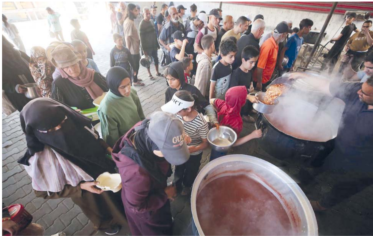
فلسطينيون يصطفون للحصول على وجبات غذائية مجانية من إحدى التكتيات في مخيم النصيرات وسط قطاع غزة.