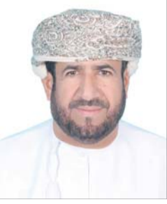
■ جمعة البكري

المواد الخام من تلك المحاجر إضافة إلى وجود ٤ تراخيص لم يبدأ العمل بها موزعة على ولايتي الرستاق ونخل.