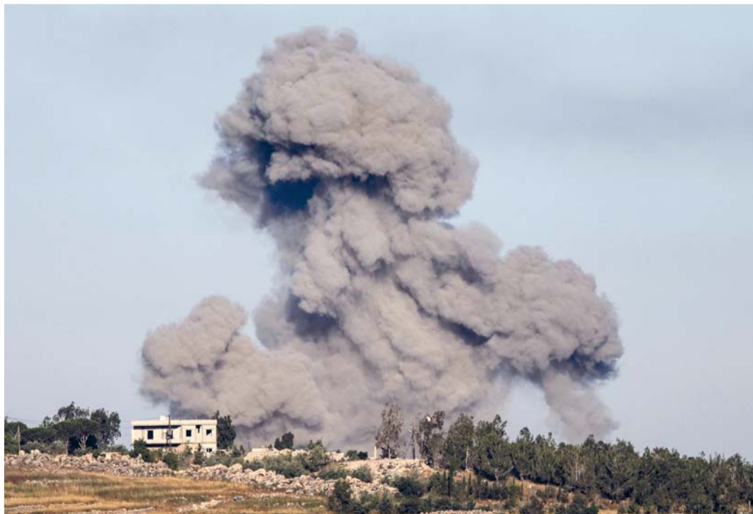
صورة ملتقطة من منطقة مرجعيون في جنوب لبنان تظهر تصاعد الدخان بعد غارة جوية إسرائيلية على قرية أرنون.

على تلجرام صباح أمس إن القوات «عبرت نهر اللباني ووسعت هجماتها إلى شمال النهر، فيما تتوسع العمليات في هذه الأثناء إلى مناطق إضافية». وكان رئيس الوزراء اللبناني نواف سلام اعتبر أن لبنان يواجه «تصعيداً إسرائيلياً خطيراً وغير مسبوق خلال الأيام الأخيرة»، مؤكداً أنه شدد مع رئيس الجمهورية جوزاف عون على «ضرورة تكثيف الجهود السياسية والدبلوماسية للوصول إلى وقف سريع وفعلي وثابت لإطلاق النار». وسيطرت القوات الإسرائيلية على جبل استراتيجي تعلوه قلعة بناها الصليبيون في جنوب لبنان، فيما يعد أعمق توغل منذ أكثر من ربع قرن.