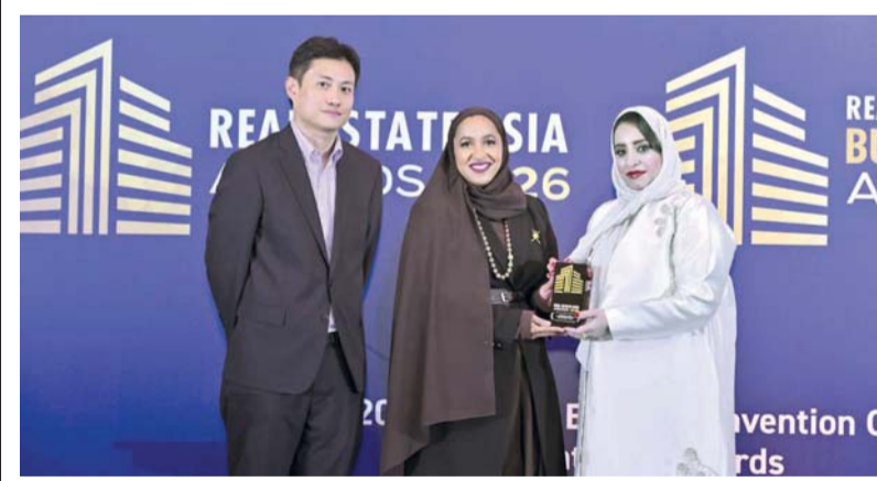
■ الفوز يسهم في مواصلة مدينة العرفان لمخطتها العمراني المتكامل