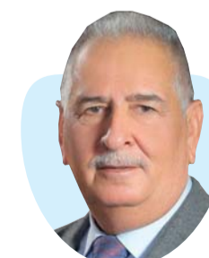
وليد الزبيدي كاتب عراقي