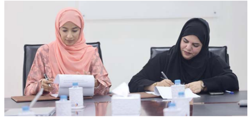
■ دعم الجوانب البحثية والعلمية والمهنية

تطلق المنطقة الاقتصادية الخاصة بالدقم بالتعاون مع جامعة السلطان قابوس في السابع من يونيو الجاري برنامجاً تدريبياً صيفياً يستمر لمدة أسبوعين بمشاركة ١٨ طالباً وطالبة من مختلف التخصصات الأكاديمية بهدف تعزيز جاهزية الكفاءات الوطنية وربط المخرجات التعليمية بمتطلبات سوق العمل في القطاعات الاقتصادية والصناعية الواعد. ويعد البرنامج للطلبة فرصة التدريب العملي داخل عدد من الشركات والمؤسسات العاملة بالدقم تشمل مصفاة الدقم، وأسياح للحوض الجاف، والشركة العُمانية للصهريج (أوتكو) وشركة