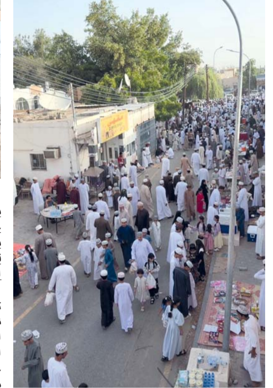
■ إقبال كبير من المتسوقين والباعة في سوق نخل

من (٩٠) ريالاً عمانياً إلى (٢٤٠) ريالاً عمانياً، وسعر رأس الغنم المستورد الواحد من (١٥٠) ريالاً عمانياً إلى (١٩٠) ريالاً عمانياً، كما توافرت مختلف البضائع والسلع بأشكالها مثل الهدايا والألعاب والملابس والمكسرات، وكذلك المواد المستخدمة في ذبح الأضاحي كالكساكين وغيرها من البسكويت والكحك.