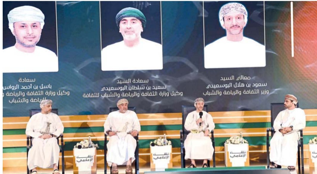
حديث الوزير حول المرحلة القادمة لقطاعات الثقافة والرياضة والشباب

واستعرض اللقاء مشروع الاستراتيجية الوطنية للشباب، التي يتم إعدادها وفق نهج تشاركي وميداني شمل تنفيذ ٢٢ مختبراً في ١١ محافظة، بمشاركة ٢٥٠٠ شاب وشابة من الفئة العمرية ١٥-٣٥ سنة، إلى جانب استطلاع وطني شارك فيه أكثر من ١٠٠٠ شاب وشابة، وباستخدام أدوات منهجية لتحليل واقع الشباب وفق منهجيات علمية وممارسات عالمية، ومواءمة الاستراتيجية مع الخطة التنموية الخمسية الحادية عشرة، لا سيما محور الشباب وريادة الأعمال.