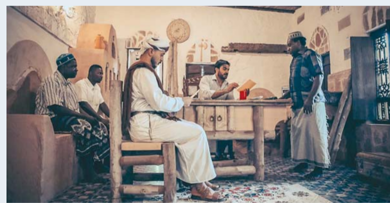
■ السينما في سلطنة عُمان تمثل منصّة فكرية وثقافية

بكفاءة عالية. ووضح أن انخفاض الكلفة الإنتاجية في سلطنة عُمان مقارنة بالدول الأخرى يشكل عاملاً جاذباً رئيساً لشركات الإنتاج العالمية التي تبحث عن الجودة العالية والتكلفة المناسبة. داعياً إلى تفعيل مشروعات الإنتاج المشترك بين المخرجين العُمانيين وشركات الإنتاج العربية والعالمية، فهذه الشركات تفتح آفاقاً واسعة لتبادل الخبرات، وبناء جسور التواصل بين السينما المحلية والديولية، وتمنح الكوادر والمواهب الوطنية فرصاً واعدة للعمل في بيئات احترافية متقدمة، مما يعكس إيجاباً على جودة الأفلام العُمانية لتنافس بقوة في المهرجانات الدولية. وأشار إلى أن العادات والتقاليد العُمانية، وقيم الضيافة والترابط الاجتماعي، تمنح الصورة السينمائية عمقاً إنسانياً ملفتاً، حيث يمزج التراث المادي المتمثل في القلاع والبيوت القديمة والأسواق الشعبية، مع التراث غير المادي كالفنون التقليدية والحكايات الشفوية، ليشكل معاً رموزاً بصرية أصيلة توثق الهوية العُمانية في السينما المعاصرة، وتصنع لغة بصرية تبرز خصوصية المكان بروح وصورة صادقة تفهمها مختلف الثقافات. ■