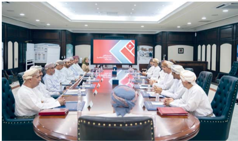
اللجنة ناقشت أبرز التحديات التي تواجه الفرق الوطنية وسبل معالجتها

مسقط - العُمانية: عقدت اللجنة الوطنية للتنافسية أمس اجتماعها الدوري الأول لهذا العام، برئاسة معالي الدكتور خميس بن سيف الجابري وزير الاقتصاد، وبحضور أصحاب المعالي والسعادة، وممثلي القطاع الخاص أعضاء اللجنة. واستعرض الاجتماع مستجدات المؤشرات الدولية التي يتابعها المكتب الوطني للتنافسية بالتنسيق مع الجهات ذات العلاقة، حيث استعرض المكتب نتائج سلطنة عُمان المقدمة في عدد من المؤشرات الدولية، أبرزها تقدم سلطنة عمان ٥ مراتب في مؤشر الابتكار العالمي لتصل إلى المرتبة الـ ٦٩ عالمياً من أصل ١٣٩ دولة، إلى جانب تحقيق مُستهدف رؤية عُمان ٢٠٣٠ في مؤشر الحرية الاقتصادية لتكون ضمن أفضل ٤٠ دولة عالمياً بحلولها المرتبة الـ ٣٩ من أصل ١٧٦ دولة شملها