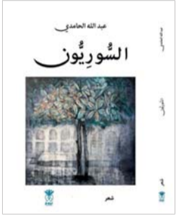
■ غلاف الكتاب

بنية الديوان قائمة على التقطيع والتشظي، وهو اختيار فني يعكس موضوعه، فكما أن الواقع السوري ممزق، تأتي القصيدة على هيئة مقاطع متجاورة، أشبه بشظايا ذاكرة تحاول أن تلتئم. هذا الأسلوب يمنح النص ديناميكية خاصة، لكنه قد يفرض على القارئ جهداً تأويلياً أكبر، وهو ثمن جمالي يبدو الشاعر مستعداً لدفعه. في المحصلة، يقدم (السوريون) تجربة شعرية ناضجة، تمزج بين الحس الإنساني العميق والوعي التاريخي، وتطرح سؤال الهوية في زمن الانهيار. إنه ديوان لا يكتفي بوصف المساة، بل يسعى إلى فهمها، وربما إلى تجاوزها عبر الشعر. إنه يؤكد أن الهوية السورية، وإن جُرحت، تمتلك قدرة فريدة على الترميم، فبين شظايا الذاكرة المتناثرة، يظل هناك دائماً نور يتسلل من شقوق القصيدة، ليعلم أن السوري، الذي اختبر الموت والمنفى، هو نفسه الذي يمتلك سر الانبعاث من جديد، ليصنع وقتاً يليق بأحلامه. ■