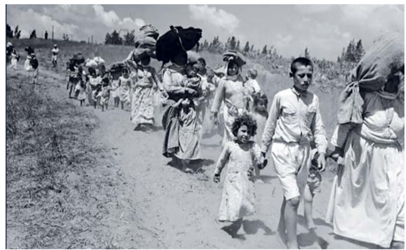
■ القضية الفلسطينية حاضرة في الوعي الثقافي التركي

من الشعراء الأتراك فلسطين بلغة وجدانية ركزت على الألم الإنساني والتمسك بالأرض، فيما اتجه روائيون أتراك إلى تقديم شخصيات فلسطينية تعيش تجربة المنفى والقتل، في محاولة لربط التجربة الفلسطينية بقيم الحرية والعدالة والكرامة الإنسانية. ويرى نقاد أتراك أن حضور النكبة الفلسطينية في الأدب التركي المعاصر يعكس التقارب الثقافي والتاريخي بين الشعبين التركي والفلسطيني، فضلاً عن تأثير القضية الفلسطينية في الرأي العام التركي على المستويين الشعبي والثقافي. يذكر أن فلسطين تبقى حاضرة في المشهد الأدبي التركي، ليس بوصفها حدثاً من الماضي، بل قضية مستمرة تجد صداها في ضمير الأدباء والقراء على حد سواء. ■