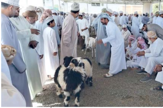
■ أعلى سعر لرأس الأغنام في سوق عبري ٣٥٠ ريالاً