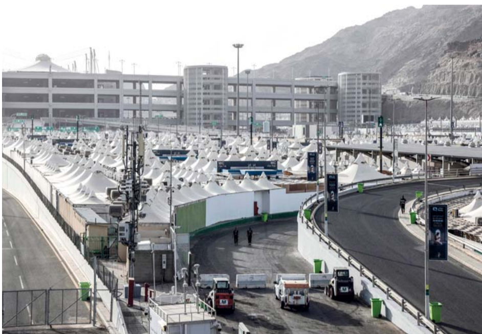
مخيمات الحجاج في مشعر منى حيث يقضي ضيوف الرحمن يوم التروية اليوم استعداداً للوقوف على صعيد عرفات في ركن الحج الأعظم غداً.

يبدأ ضيوف الرحمن حجاج بيت الله الحرام مناسك الحج اليوم بيوم التروية، على أن يقف الحجاج بعرفة يوم غد الثلاثاء في ركن الحج الأعظم ثم المبيت بمنزلة، ورمي الجمرات، وأداء طواف الإفاضة وطواف الوداع، وأكملت بعثة الحج العمانية للعام الحالي استعداداتها التنظيمية والخدمية لاستقبال الحجاج العُمانيين القادمين إلى الديار المقدسة أداء مناسك حج هذا العام، وسط منظومة متكاملة من الخدمات والإجراءات التي تهدف إلى توفير أقصى درجات الراحة والرعاية لضيوف الرحمن. وقد سلمت البعثة مخيم منى وعرفات إلى شركات الحج المعتمدة، وجاءت عملية التسليم بعد الانتهاء من أعمال التجهيز والتأهيل بالمخيم، والتأكد من جاهزية المرافق والخدمات الأساسية، بما يشمل مواقع الإقامة، والتجهيزات الفنية، والخدمات الصحية والإعاشية، إلى جانب استيفاء متطلبات السلامة والراحة للحجاج.