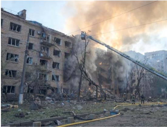
رجال الإطفاء يعملون على إخماد حريق اندلع في موقع مبنى متضرر بشدة، عقب غارات روسية على العاصمة الأوكرانية كييف .

كييف . د.ب.أ: شنت روسيا هجوماً واسع النطاق خلال الليل على العاصمة الأوكرانية كييف بطائرات مسيرة وصواريخ باليستية، وفقاً لما قاله مسؤولون أوكرانيون صباح أمس. وكانت القوات الجوية الأوكرانية قد حذرت على منصة تليجرام خلال الليل من هجوم روسي محتمل يتضمن صاروخ «أوريشنيك» الجديد متوسط المدى. وقال المسؤول العسكري في كييف، نيمور تكتاشينكو، إن ٤٠ مبنياً قد تضررت، وكتب على تليجرام أن شخصاً واحداً على الأقل قد قتل وأصيب نحو ٢٠ آخرين. وأفاد رئيس البلدية فيتالي كلينتشكو أيضاً بتضرر العديد من المباني، بما في ذلك مبان شاهقة ومدرسة واحدة على الأقل، وحث سكان المدينة على البقاء في الملاجئ في الساعات الأولى من صباح يوم أمس.