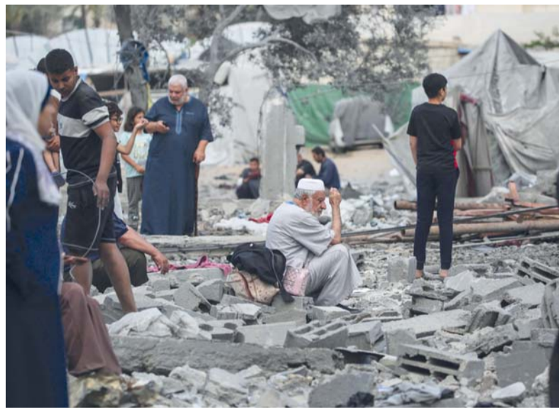
فلسطينيون بين الأنقاض في موقع مبنى سكني دمرته غارة «إسرائيلية» في دير البلح بوسط قطاع غزة.