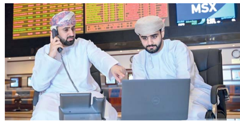
تمديد التداول سيسهم في جذب شريحة أوسع من المستثمرين