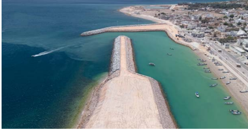
أعمال التأهيل شملت حماية كواسر الأمواج وتحسين حركة الملاحة البحرية

ووضّح أن هذه الجهود تأتي اهتماماً بالصياد العماني باعتباره شريكاً أساسياً في منظومة الأمن الغذائي والتنمية الاقتصادية، مشيراً إلى أن الوزارة تعمل باستمرار على تنفيذ المشروعات والمبادرات التي تسهم في تحسين بيئة العمل ورفع الإنتاجية وتحقيق الاستدامة للموارد البحرية.