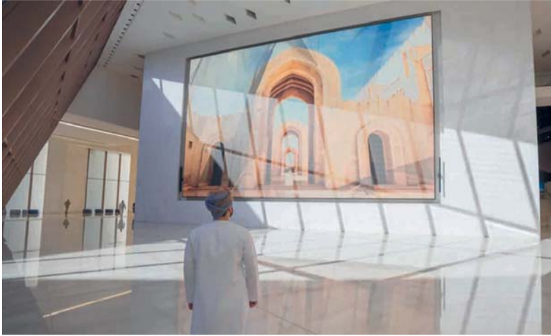
المحافظة تولي اهتماماً متزايداً لدعم المحتوى المحلي وربط المشروعات السياحية والتنموية بالمجتمع

وفي جانب البنية الأساسية، تواصل محافظة الداخلية بالتعاون مع وزارة النقل والاتصالات وتقنية المعلومات تنفيذ منظومة متكاملة من مشروعات الطرق والبنية الأساسية بإجمالي استثمارات تتجاوز ١٠٠ مليون ريال عُمان، تشمل طرقاً داخلية وتنموية واستراتيجية تدعم الحركة السياحية والاقتصادية والعمرانية بالمحافظة، وتسهم في رفع جاهزية المواقع السياحية وتحسين تجربة التنقل والوصول بين مختلف الولايات والمقاصد الطبيعية والتراثية. وتولي المحافظة اهتماماً متزايداً بدعم المحتوى المحلي وربط المشروعات السياحية والتنموية بالمجتمع المحلي من خلال تمكين المؤسسات الصغيرة والمتوسطة والأسر المنتجة، والحرفيين ورواد الأعمال، وإيجاد فرص استثمار وتشغيل مرتبطة بالمواسم والفعاليات والمواقع السياحية، بما يعزز الأثر الاقتصادي والاجتماعي للمشروعات ويرفع إسهام المجتمع المحلي في التنمية السياحية المستدامة. كما تعمل المحافظة على تعزيز التكامل بين القطاعين العام والخاص وتشجيع الاستثمار في المجالات السياحية والخدمية والعمرانية من خلال المتابعة الميدانية للمشروعات، ورفع جاهزية المواقع، وتحسين بيئات الاستثمار، بما يدعم استدامة التنمية ويرفع كفاءة تنفيذ المشروعات بالمحافظة.