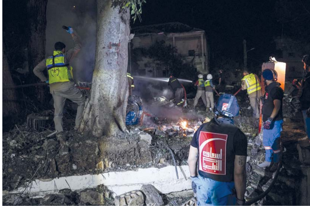
فرق الطوارئ اللبنانية تعمل على إخماد حريق اندلع في مركز للدفاع المدني عقب غارة إسرائيلية على مدينة النبطية جنوب لبنان . (أ.ب.ف.ب)

وشن الطيران الحربي الإسرائيلي أيضاً ثلاث غارات متتالية على بلدة دير قانون النهر في قضاء صور ما أسفر عن وقوع إصابات فيما استهدفت غارات أخرى بلدتي أرزون وصريفا في القضاء ذاته.