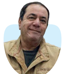
أ.د. محمد الدعيمي كاتب وباحث أكاديمي عراقي

أما «المؤرخون الأنتيكون» فهم هؤلاء الهواة الذين انصب ولعهم في جمع اللقى الأثرية التاريخية القديمة أثناء وبعد حملات حفر المواقع الأثرية، على سبيل الفوز باللقب النادرة التي لا تقدر بثمن.. ﷻ