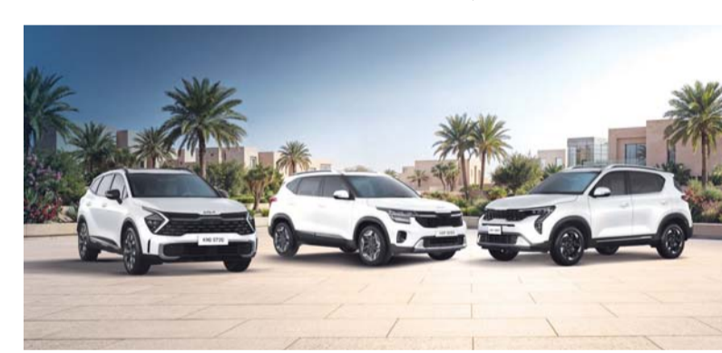
تشكيلة واسعة من طرازات كيا تشملها الحملة

طراز ٢٠٢٦، سيلتوس طراز ٢٠٢٦، سبورتاج ١,٥ لتر طراز ألفا تيربو ١,٥ لتر طراز ٢٠٢٦ يسري معدل الفائدة الخاص فقط لعملاء التجزئة الأفراد، وتخضع لموافقة الائتمان والتخليص من قبل شركات تمويل محددة أما الطرازات الأخرى والصفقات التي يزيد أجلها عن المشار إليه أعلاه، فإنه ينطبق عليها شروط وأحكام، كما يتم تعزيز راحة البال للمالكين من خلال باقة خدمة شاملة لمدة ٣٠,٠٠٠ كم أو ثلاث سنوات، أيهما أسبق.