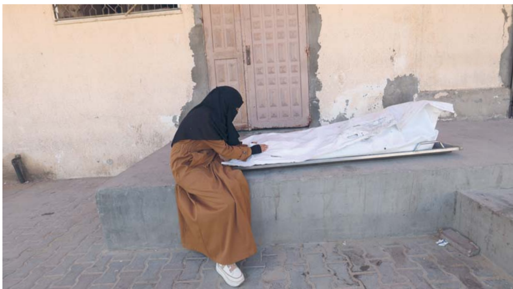
فلسطينية تجلس إلى جوار أحد نوابها من الشهداء بعد استهداف مبنى سكني في غارة جوية إسرائيلية في دير البلح بوسط قطاع غزة .