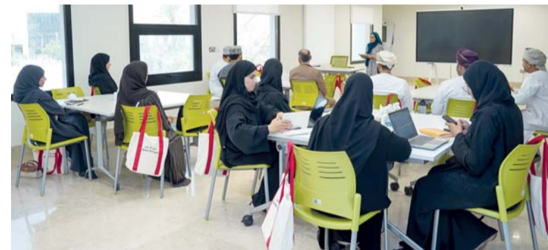
الحلقات تناقش التحديات التي تواجهها المؤسسات الصغيرة والمتوسطة

هذا القطاع الحيوي وتوفير بيئة أعمال محفزة تساعد المؤسسات على النمو والتطور. ويواصل بنك مسقط تقديم مجموعة متكاملة من الخدمات والحلول المصرفية المصممة خصيصاً لتلبية احتياجات المؤسسات الصغيرة والمتوسطة، انطلاقاً من دوره كشريك فاعل في دعم الاقتصاد الوطني، حيث يواصل البنك التعاون مع هيئة «ريادة»، والجهات الحكومية والخاصة ذات العلاقة لتنفيذ مبادرات وبرامج تسهم في دعم