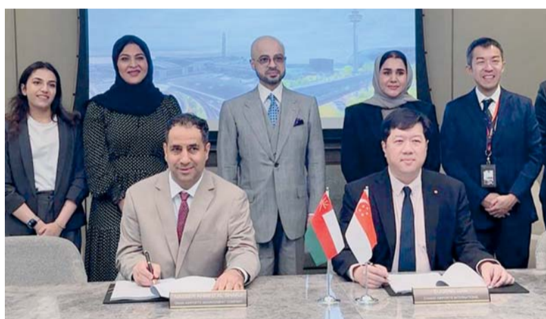
الاتفاقية تسهم في تحقيق قيمة مضافة لسلطنة عُمان

مطارات عُمان: من خلال هذه الشراكة، نتطلع إلى تبادل أفضل الممارسات والارتقاء بجميع مراحل تجربة المسافرين. ونؤمن بأن الارتقاء المستمر بتجربة المسافرين يشكل ركيزة أساسية لتحقيق التميز والنجاح المستدام في قطاع المطارات. من جانبه، قال يوجين غان، الرئيس التنفيذي لشانجي للمطارات الدولية: يسرّ شانجي للمطارات الدولية مواصلة هذه الشراكة مع مطارات عُمان على المدى الطويل، مشيراً إلى أن سلطنة عُمان لا تزخر فقط بتاريخ عريق وإرث ثقافي غني، بل تتمتع أيضاً بطبيعة متنوعة وأسرة، إلى جانب ما تشتهر به من كرم الضيافة وحفاوة الاستقبال. كما تتعمق بالأمم من الاستقرار، وتشكل واحدة من الهدوء حتى في ظل الظروف الاستثنائية. ونحن على ثقة بأن هذه الشراكة ستسهم في تحقيق نتائج متميزة لمطار مسقط. كما تأتي هذه الاتفاقية في إطار الجهود المستمرة لتعزيز تنافسية مطار مسقط الدولي وترسيخ مكانته كبوابة طيران رائدة على مستوى المنطقة. ويعكس توقيع هذه الاتفاقية التزام الطرفين المشترك بدعم المبادرات المستدامة واستكشاف فرص جديدة تسهم في تحقيق قيمة مضافة لسلطنة عُمان والمنطقة بشكل عام.