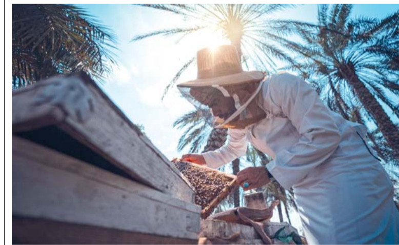
■ المحافظة تشهد ازدهاراً مستمراً في أعداد النحالين والمربين

جهداتها الميدانية والإرشادية الرامية إلى مساندة مربحي النحل في مختلف ولايات المحافظة تشمل تنظيم زيارات دورية ومستمرة للتواصل المباشر مع النحالين والوقوف على احتياجاتهم، بالإضافة إلى إيجاد الحلول الفورية والناجعة لأي تحديات أو عوائق قد تواجههم في بيئات التربية. وتزخر ولايات المحافظة بحراك متميز في قطاع تربية النحل، وتعد من المناطق الرائدة التي تشهد ازدهاراً مستمراً في أعداد النحالين والمربين الحريصين على تطوير هذه الحرفة وإنتاج أجود أنواع العسل المحلي.