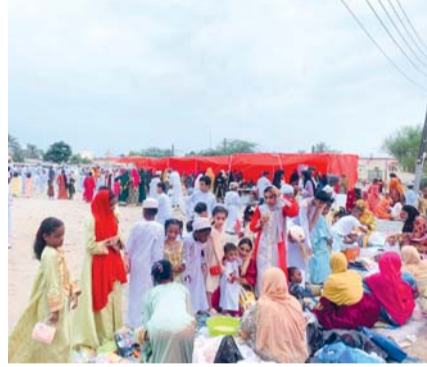
■ تنوع في المعروضات والمنتجات بهيئة المصنعة