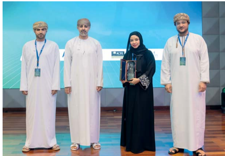
الجائزة تحفيزاً للاستمرار في تطبيق أفضل ممارسات التدقيق

نزوى العُمانية: تشهد محافظة الداخلية حراكاً تنموياً متسارعاً يشمل تطوير البنية الأساسية والفضاءات العامة والمواقع التراثية والوجهات السياحية، إلى جانب التوسع في المشروعات الاستثمارية المرتبطة بالسياحة والترفيه والخدمات، بما يواكب مستهدفات «رؤية عُمان ٢٠٤٠» في مجالات المدن المستدامة والتنوع الاقتصادي وجودة الحياة. وتواصل المحافظة في ترسيخ مكانتها كإحدى أبرز الوجهات السياحية والتنموية في سلطنة عُمان، عبر منظومة متكاملة من المشروعات والاستثمارات النوعية التي تعيد تشكيل تجربة الزائر، وتعزز جودة الحياة، وترفع تنافسيتها على خارطة السياحة والاستثمار، في ظل توجهات تستهدف بناء نموذج تنموي يجمع بين استدامة التراث وتنشيط البنية الحديثة وتنشيط الاقتصاد المحلي. ووفقاً للبيانات الصادرة عن المركز الوطني للإحصاء والمعلومات تشهد الحركة السياحية بمحافظة الداخلية تنامياً ملحوظاً، حيث ارتفع عدد الفنادق من ١٥٦ فندقاً في عام ٢٠٢٤ إلى ٢٠٩ فنادق في عام ٢٠٢٥، فيما ارتفع عدد النزلاء من ٢٧٧ ألف نزيل في عام ٢٠٢٤ إلى أكثر من ٣٤٠ ألف نزيل خلال العام الماضي، بنسبة نمو تجاوزت ٢٢ بالمائة، ما يعكس تنامي جاذبية المحافظة وتوسع الاستثمارات المرتبطة بالإيواء والخدمات