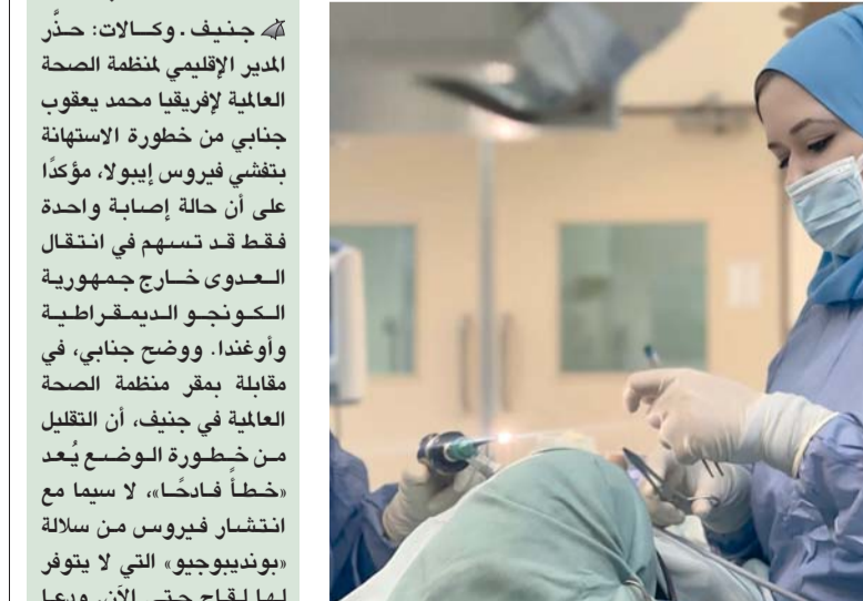
■ استخدام تقنيات متقدمة للوصول إلى الورم واستئصاله

مسقط. العمانية: نجح فريق طبي متعدد التخصصات بمستشفى النهضة، في إجراء عملية جراحية دقيقة ومعقدة لاستئصال ورم سرطاني متقدم من الأنف والجيوب الأنفية، كان ممتداً إلى مجرى العين وقاع الجمجمة والغدة النخامية، باستخدام تقنية المنظار عبر الأنف دون الحاجة إلى أي شقوق جراحية خارجية. واستغرقت العملية الجراحية نحو أربع ساعات، وشهدت مشاركة فريق طبي متكامل من قسم الأنف والأذن والحنجرة وجراحة العيون بمستشفى النهضة، إلى جانب فريق من جراحة الأعصاب من مستشفى خولة في إطار تعاون متعدد التخصصات يعكس مستوى التكامل الطبي والخبرة التخصصية التي تتمتع بها المديرية العامة لمستشفى خولة.