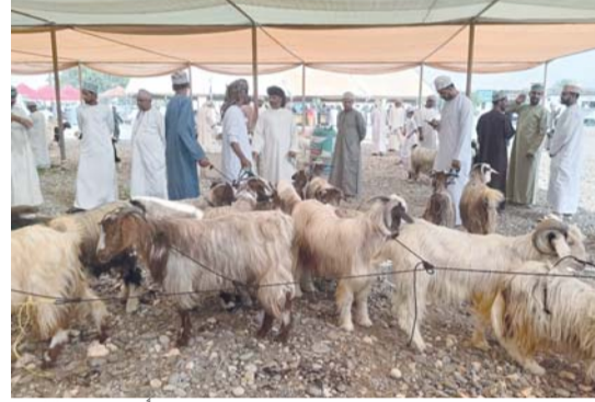
■ سعر رأس الغنم المحلي تراوح من (٩٠) إلى (٢٤٠) ريالاً في سوق قريات