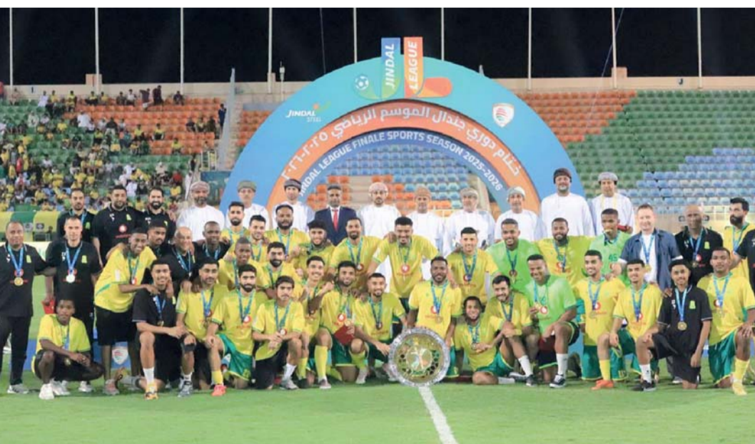
تتويج السيب بدرع الدوري

الذي سجل هبوطاً مبكراً من الدوري لأسباب كثيرة سبق ذكرها في مناسبات سابقة، وبعثت بآماله أن الموسم القادم سيكون حامياً في الدرجة الأولى ومن الصعب التكهّن بمناقض بذاته للهبوط للأضواء.