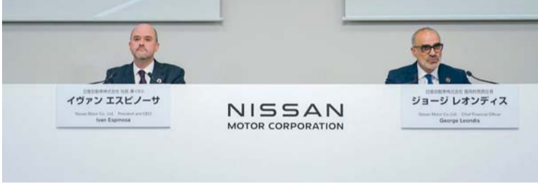
نيسان تؤكد على التزامها بتحقيق أرباح تشغيلية إيجابية

الرسوم الجمركية. وقدمت الشركة توقعات النالية إلى بورصة طوكيو للسنة المالية المنتهية في ٣١ مارس ٢٠٢٧، والمحسنة وفق أسلوب حقوق الملكية للمشروع المشترك لنيسان في الصين. وقال إيفان إسبينوزا الرئيس والرئيس التنفيذي لشركة نيسان: مثلت السنة المالية ٢٠٢٥ عاماً من التنفيذ الناجح لخطة التعافي حيث عززنا أساس أعمالنا وبدأنا نشهد تقدماً ملموساً في أداءنا المالي، وفي الوقت ذاته، وضعتنا توجهاً طويلاً للأمد من خلال رؤية «نكا» التنقل للحياة اليومية، وقد تجاوزنا مرحلة التعافي، وندخل الآن مرحلة النمو.