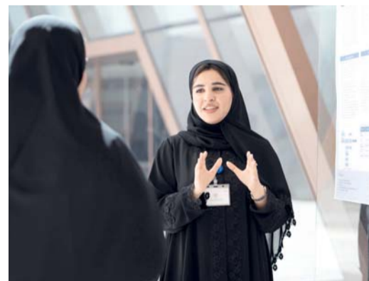
تعزيز وعي الطلبة ودعمهم للانطلاق نحو سوق العمل

يعتمد على الذكاء الاصطناعي والطائرات بدون طيار للكشف المبكر عن أمراض النباتات في القطاع الزراعي، فيما جاء في المركز الثاني مشروع AI-Based Smart Proctoring System for Exam Cheating Detection والمخصص في مراقبة الاختبارات واكتشاف حالات الغش باستخدام تقنيات الذكاء الاصطناعي، بينما حصل على المركز الثالث مشروع Smart IoT-Based Safety and Security System for University Meeting Hall and Classroom، الذي يقدم نظاماً ذكياً للأمن والسلامة يعتمد على تقنيات إنترنت الأشياء للقاءات الدراسية وقاعات الاجتماعات الجامعية.