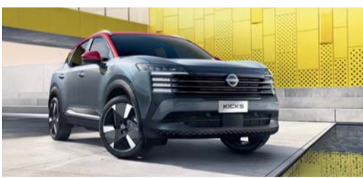
كيس الجديدة بمعايير جديدة وتقنيات حديثة

كليا رؤية العلامة المستقبلية من خلال تصميمها الجريء وتقنياتها المتقدمة وتجربة القيادة الديناميكية التي تقدمها، وتم تطويرها لتلبية تطلعات العملاء المتنامية في سلطنة عمان، مع تعزيز مكانتها ضمن فئة السيارات الكروس أوفر المدجة.