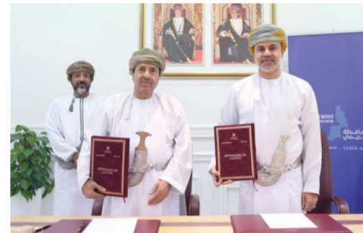
النظام يشمل مختلف أنواع الوثائق المتداولة بالمحافظة

يضمن حفظ الوثائق ذات القيمة الإدارية والتاريخية وحماية الذاكرة الوطنية. ويشمل النظام مختلف أنواع الوثائق المتداولة بمحافظة البريمي، حيث يتم تصنيفها وفق منهجية علمية واضحة، مع تحديد مدد استبقائها خلال المرحلتين الجارية والوسيلة، إلى جانب تنظيم عمليات تداول الوثائق بين التقسيمات الإدارية المختلفة وفق إجراءات معتمدة تساهم في تعزيز كفاءة العمل وسرعة الوصول إلى المعلومات. كما ترحل الوثائق ذات القيمة الدائمة بعد انتهاء مدد استبقائها إلى هيئة الوثائق والمحفوظات الوطنية لحفظها ضمن الذاكرة الوطنية، فيما يتم إتلاف الوثائق التي انتهت مدد حفظها وفق جداول الاستبقاء المعتمدة وبما يتوافق مع الأنظمة واللوائح المنظمة للعمل الوثائقي. ويجسد اعتماد النظام توجه محافظة البريمي نحو تطوير منظومة إدارة الوثائق ورفع كفاءة الأداء المؤسسي، بما يواكب مستهدفات التحول الإداري ويعزز جودة العمل المؤسسي وفق أفضل الممارسات المعتمدة.