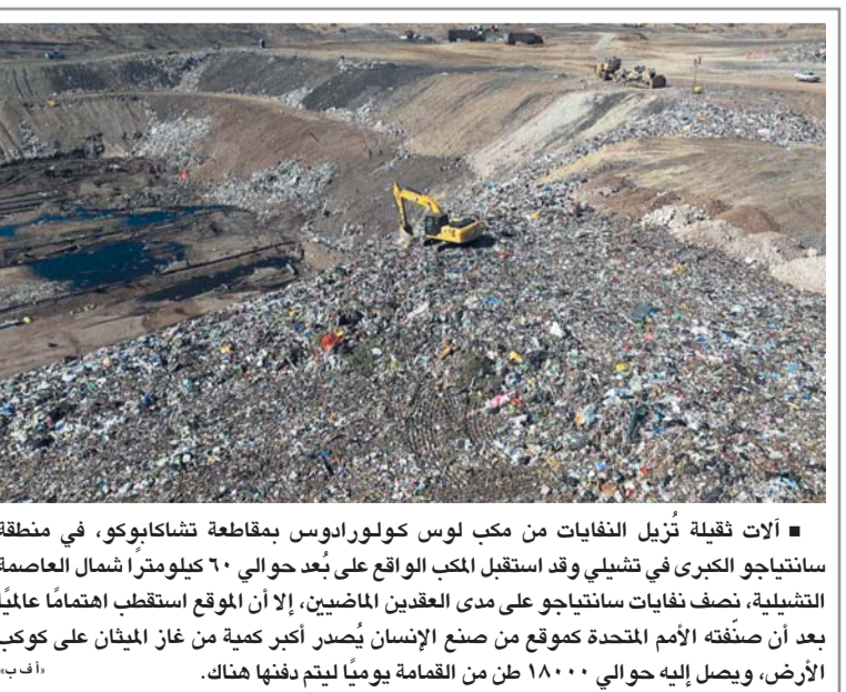
آلات ثقيلة تُزيل النفايات من مكب لوس كولورادوس بمقاطعة تشاكابوكو، في منطقة سانتياجو الكبرى في تشيلي وقد استقبل المكب الواقع على بُعد حوالي ٦٠ كيلومترًا شمال العاصمة التشيلية، نصف نفايات سانتياجو على مدى العامين الماضيين، إلا أن الموقع استقطب اهتمامًا عالميًا بعد أن صنفته الأمم المتحدة كموقع من صنع الإنسان يُصدر أكبر كمية من غاز الميثان على كوكب الأرض، ويصل إليه حوالي ١٨٠٠٠ طن من النمامة يوميًا ليتم دفنها هناك.

موسكو. وكالات: طور خبراء من مؤسسة الطاقة النووية الروسية «روس أتوم» تقنية مبتكرة لإنتاج مادة «كوبالتات الليثيوم المعدل عالي الجهد»، وهي مادة أساسية تدخل في صناعة الكاثود (القطب الموجب) للبطاريات عالية القدرة، مما يسهم في تعزيز كفاءة تخزين الطاقة بشكل ملحوظ. وتمتاز المادة الجديدة بتركيب كيميائي وشكل بلوري مطور، ما يسمح برفع جهد شحن البطارية وزيادة سعة الطاقة في خلايا التغذية بنسبة تتجاوز ١٥ بالمائة مقارنة بالتقنيات التقليدية المستخدمة حاليا، مع الحفاظ على استقرار البطارية خلال عمليات الشحن والتفريغ المتكررة لفترات طويلة. وقد صممت هذه المادة بشكل خاص لتلبية احتياجات الأجهزة الإلكترونية المحمولة، والأدوات الكهربائية، بالإضافة إلى تطبيقات متقدمة في قطاعي الطيران والفضاء التي تتطلب أداءً عاليًا وفترات تشغيل طويلة دون الحاجة لإعادة الشحن. وأكد ألكسندر سيلينزيف، القائم بأعمال المدير العام لشركة «روس أتوم للكيمياء» على أن هذا الابتكار يمثل خطوة استراتيجية نحو توطيد صناعة مواد كيمياء البطاريات، وتقليل الاعتماد على الاستيراد، مشيرًا إلى أن النماذج التجريبية تخضع حاليًا لعمليات الاعتماد والتقييم من قبل الشركاء التجاريين.