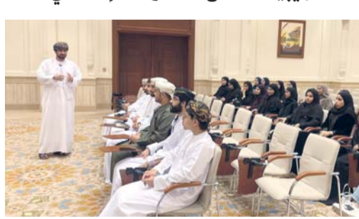
الحلقة شهدت مناقشة عدد من التجارب الإعلامية الناجحة

في مدينة (إيموزار كندر) بالملكة المغربية. ويأتي هذا التتويج بعد تحقيق الفيلم المركز الثاني في النسخة الثالثة من مسابقة جائزة تواصل لأفلام القصيرة التي نظمتها وزارة الثقافة والرياضة والشباب، في تأكيد على الحضور المتصاعد للعمل محلياً ودولياً، وما يحمله من