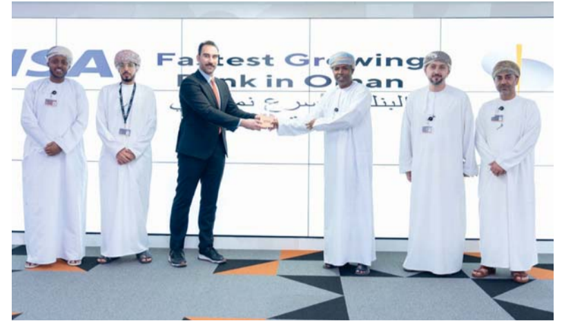
الجوائز تعكس قدرات البنك على تحقيق نمو في منظومة المدفوعات