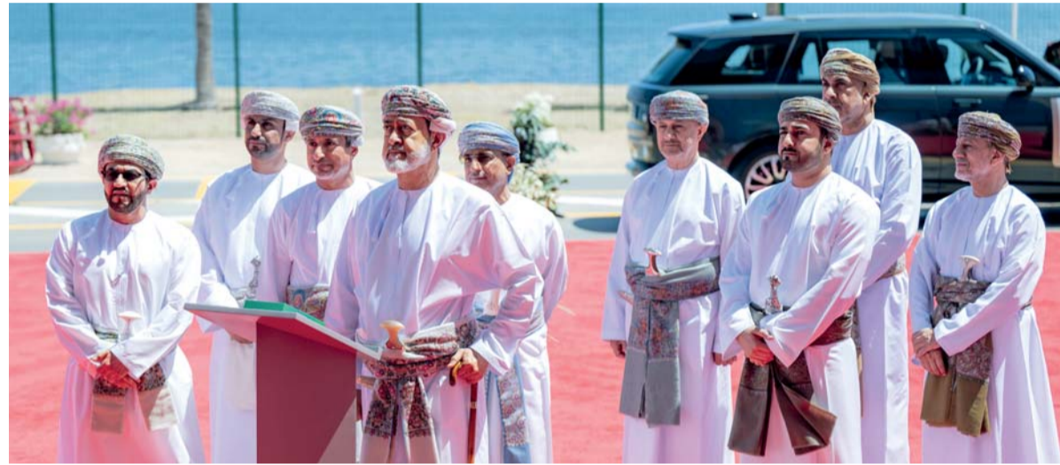
جلالة السلطان يتفضل بإزاحة الستار التذكري إيداناً بالافتتاح الرسمي لمركز العمليات المتكاملة «بيت الهيثم» الذي يعد المركز الرئيسي للتحكم والسيطرة بقطاع الطاقة في سلطنة عُمان.

رأي «الوطن»، كراسي بحثية تصنع الاقتصاد المعرفة التوق إلى المعنى وبرنامج وزارة التنمية الاجتماعية دور مجلس الدولة في تعزيز الهوية الوطنية «مسقط الكبرى».. مدينة تصافح المستقبل فن الدبلوماسية .. دوسمات فريق العمل النموذجي،