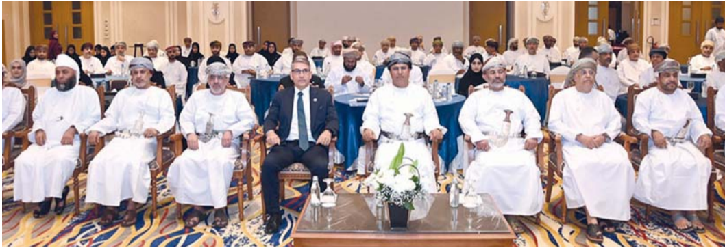
الحلقة تسهم في رفع الكفاءة الفنية لموظفي الحجر الزراعي وتعزيز الربط بين الجانبين النظري والتطبيقي العملي