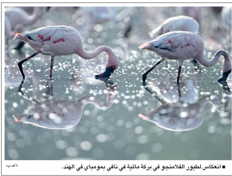
انعكاس لطيور الفلامنجو في بركة مائية في نافي بمومباي في الهند.

طوكيو. وكالات: تزايدت وتيرة اقتراض شركات التكنولوجيا الكبرى لتمويل الذكاء الاصطناعي مع كشف شركة الفابت عن خططها لإصدار أول سندات مقومة بالين الياباني، بينما استعدت شركة أمازون ل طرح سنداتنا الأولى بالفرنك السويسري. وتؤكد مبيعات السندات بأسواق الديون الخارجية كيف أن الإنفاق المتزايد على الذكاء الاصطناعي يدفع شركات التكنولوجيا الأميركية إلى جذب المستثمرين من خارج الولايات المتحدة في سباق محفوف بالمخاطر. ومن المتوقع أن تنفق شركات التكنولوجيا الكبرى أكثر من ٧٠٠ مليار دولار على البنية الأساسية للذكاء الاصطناعي هذا العام، وهو ارتفاع حاد عن ٤١٠ مليار دولار في ٢٠٢٥. ودفع ذلك الشركات إلى الاعتماد أكثر على الديون بعد أن استخدمت تدفقاتها النقدية الضخمة لسنوات. ولم تفصح الفابت، الشركة الأم لجوجل، وأمازون عن حجم الإصدارات. ومن المتوقع أن يبلغ إجمالي إصدارات الفابت عدة مئات من مليارات الين مضافًا أنه من المتوقع تحديد الشروط هذا الشهر. ولم يكن هذا المصدر محلولًا بالتحدث في هذا الشأن وطلب عدم الإفصاح عن هويته. ولم ترد الفابت على سؤال من رويترز بشأن حجم الطرح. ووكلت الفابت كلا من ميزوهو وبنك أوف أمريكا ومورجان ستانلي للعمل على هذه الصفقة.