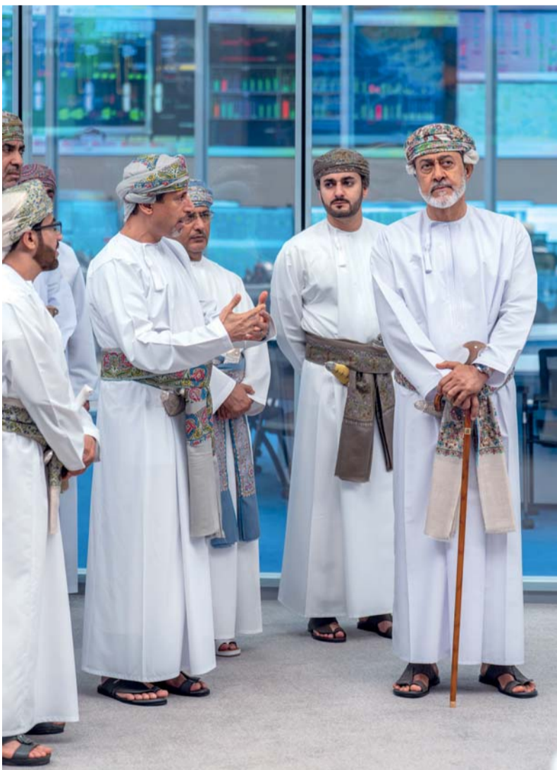
■ .. ويطلع على المعرض الحائطي الذي يوثق أهم المحطات التاريخية للشركة ورحلة التحول والتحول الرقمي وتنمية الكفاءات الوطنية.

رافق جلالة السلطان خلال الزيارة صاحب السمو السيد ذي يزن بن هيثم آل سعيد نائب رئيس الوزراء للشؤون الاقتصادية، ومعالي سلطان بن سالم الحسيني وزير المالية، ومعالي الدكتور حمد بن سعيد العوفي رئيس المكتب الخاص، ومعالي عبد السلام بن محمد المرشدي رئيس جهاز الاستثمار العماني، ومعالي أنور بن هلال الجابري وزير التجارة والصناعة وترويج الاستثمار.