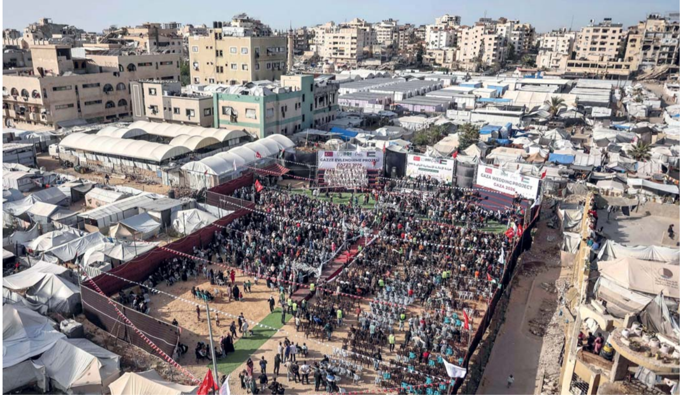
فلسطينيون يتجمعون في حفل زفاف جماعي في مدينة غزة.

مدينة غزة مع قصف مدفعي استهدف المنطقة ذاتها. كما أطلقت زوارق حربية للاحتلال نيرانها باتجاه ساحل مدينة غزة، وفي وسط القطاع، تعرضت المناطق الواقعة شمال شرق مخيم البريج لقصف مدفعي «إسرائيلي». تأتي هذه التطورات في سياق خروقات متواصلة من قوات الاحتلال لاتفاق وقف إطلاق النار، الذي دخل حيز التنفيذ في العاشر من أكتوبر الماضي. إلى ذلك شهد الحدود المحيطة بقطاع غزة تحولات ميدانية متسارعة، في ظل أعمال هندسية وعسكرية واسعة ينفذها الجيش الإسرائيلي، تشمل شق طرق