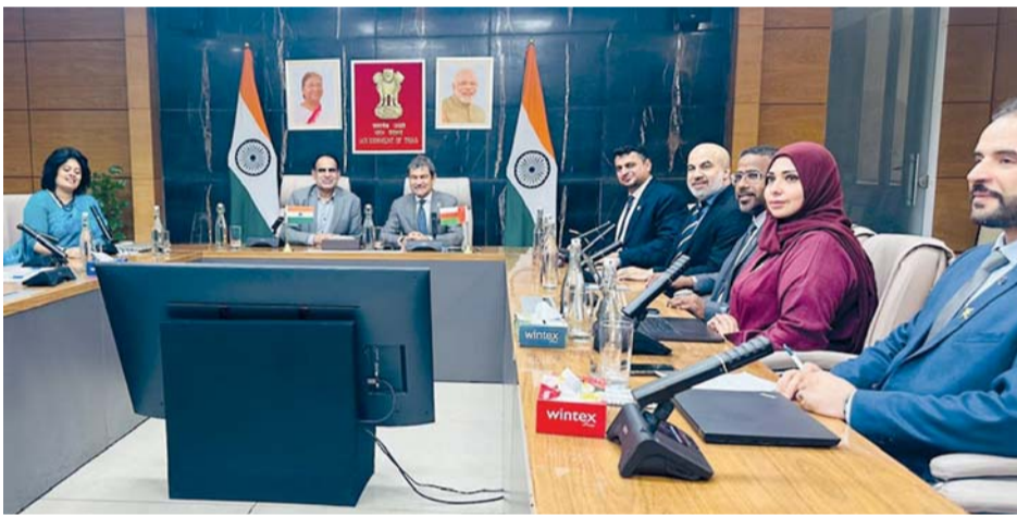
الجانبان أكدا على تعزيز التعاون الاقتصادي والتجاري والاستثماري بين البلدين

المنتجات الوطنية وإيجاد فرص استثمارية واعدة للقطاع الخاص في البلدين. وأشار المشاركون إلى أن العلاقات العمانية الهندية تشهد نمواً متسارعاً في مختلف المجالات الاقتصادية والتجارية، مدعومة بالروابط التاريخية المتينة بين البلدين، والرغبة المشتركة في تطوير الشراكة الاستراتيجية بما يواكب المتغيرات الاقتصادية العالمية ويعزز الاستقرار والتنمية المستدامة. واختتمت الاجتماعات بالتأكيد على مواصلة التنسيق الفني خلال المرحلة المقبلة لاستكمال المتطلبات التنفيذية للاتفاقية، والعمل على تعزيز التواصل بين الجهات المعنية والقطاع الخاص، بما يضمن تحقيق الاستفادة القصوى من الاتفاقية ويدعم مستهدفات التنوع الاقتصادي في سلطنة عمان ورؤية البلدين المستقبلية للتعاون الاقتصادي.