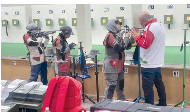
من تدريبات منتخب الرماية في صالة لوسيل للرمية