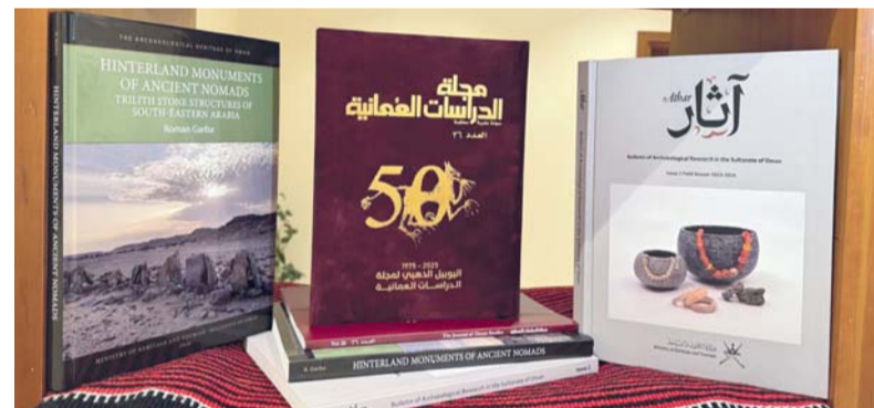
فعاليات المعرض تقام خلال الفترة من ١٤ وحتى ٢٣ مايو الجاري

التراث الأثري العُماني حول آثار أحجار التريليث الثلاثية في مناطق البدو القدماء جنوب شرق شبه الجزيرة العربية. واختتمت مشرفة فعاليات ومعارض الكتب بدائرة وزارة الدراسات العُمانية بوزارة التراث والسياحة حديثها بأن المشاركة في معرض الدوحة الدولي للكتاب في نسخة هذا العام تأتي ضمن الخطة السنوية المعتمدة للوزارة وبالتنسيق المشترك مع وزارة الثقافة والرياضة والشباب للمشاركة في أهم وأبرز المعارض الدولية للكتاب التي تنمو سنوياً ويمكن تحقيق الاستفادة المثلى من مناصاتها وفعاليتها، ومن الحضور الرسمي والثقافي والجماعي والتغطية الإعلامية التي تحظى به سلطنة عُمان سياحياً وثقافياً على الساحة الدولية.