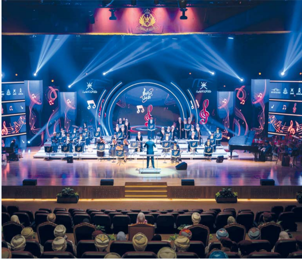
لوحات فنية عبّرت عن رسالة الفرقة وما تحمله من معانٍ إنسانية ملهمة.

مسقط. العُمانية: برعاية كريمة من السيدة الجليلة حرم جلالته السلطان حفظها الله ورعاها. دشنت وزارة التنمية الاجتماعية، على مسرح قيادة الحرس السلطاني العُماني، فرقة «ترانيم الأمل»، في مبادرة إنسانية وفنية تجسد الاهتمام الكرمي بتمكين أصحاب الهمم والاحتياجات الخاصة، وفتح آفاق أرحب أمامهم للتعبير عن مواهبهم وإمكاناتهم، وإبراز شغفهم، وصل طاقاتهم الإبداعية عبر الموسيقى والفنون.