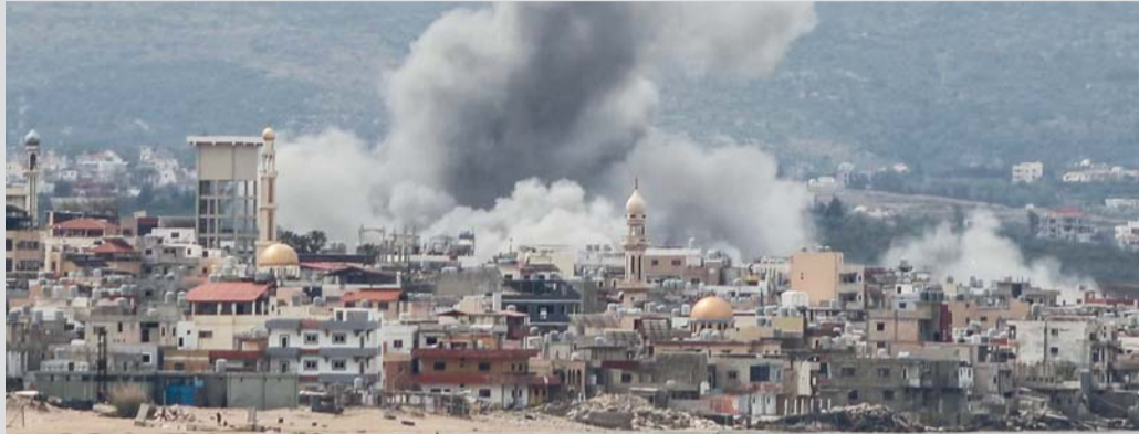
دخان يتصاعد من موقع غارة جوية «إسرائيلية»، استهدفت منطقة رأس العين بجنوب لبنان.

بيروت. أ.ف.ب: أفادت الوكالة الوطنية للإعلام اللبنانية الرسمية بأن غارة «إسرائيلية» على بلدة كفرديون في الجنوب إلى مستشفيات صور. من جهة أخرى وجه الجيش «الإسرائيلي» صباح أمس «إندازاً» عاجلاً، إلى سكان بلدة سحر في سهل البقاع شرق لبنان، دعاهم فيه إلى إخلاء منازلهم فوراً، تمهيداً لغارات. وتأتي الغارات في وقت يستعد لبنان وإسرائيل، لعقد جولة محادثات في ١٤ و ١٥ مايو في واشنطن في محاولة لإنهاء الحرب.