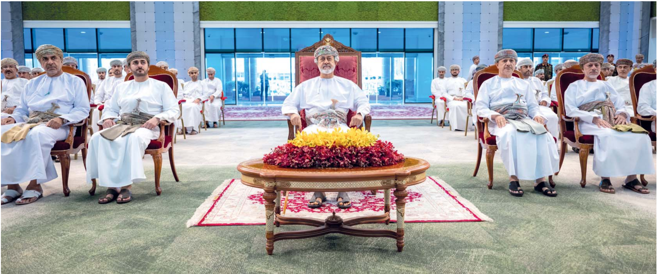
■ جلالة السلطان يشاهد عرضاً مرئياً تناول أبرز مراحل تطور الشركة وما حققته من نتائج في قطاع النفط والغاز وجهودها في تطوير بيئة العمل ورفع مستويات الأداء.