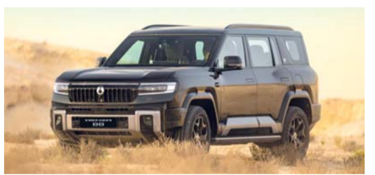
سيارة دينزا B8 توفر تجربة قيادة سلسة ومريحة

تواصل «دينزا B8» ترسيخ مكانتها كسيارة رياضية متعددة الاستخدامات «هايبرد» فاخرة في سلطنة عمان، ومقدمة بذلك مزيجاً متطوراً من التكنولوجيا المتقدمة والأداء القوي، حيث جاء تصميمها بسبعة مقاعد وتوفر تجربة قيادة سلسة ومريحة. وتعتمد «دينزا B8» على بنية ميكانيكية فائقة،