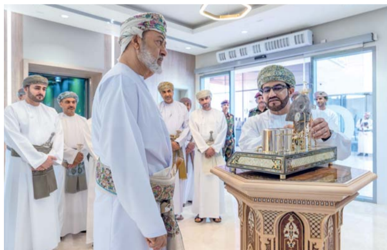
■ .. ويطلع على المعرض الحائطي الذي يوثق أهم المحطات التاريخية للشركة ورحلة التحول المؤسسي وزيادة الإنتاج

مسقط - العمانية: تفضل حضرة صاحب الجلالة السلطان هيثم بن طارق المعظم - حفظه الله ورعاه - بقاء صباح أمس بزيارة كريمة إلى شركة تنمية نفط عمان بمحافظة مسقط للاطلاع على أبرز المشروعات والتطورات في قطاع الطاقة.