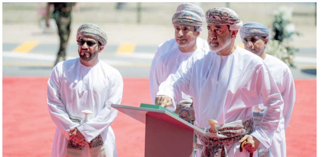
■ جلالته يزج الستار التذكري إيداناً بالافتتاح الرسمي لمركز العمليات المتكاملة «بيت الهيثم»