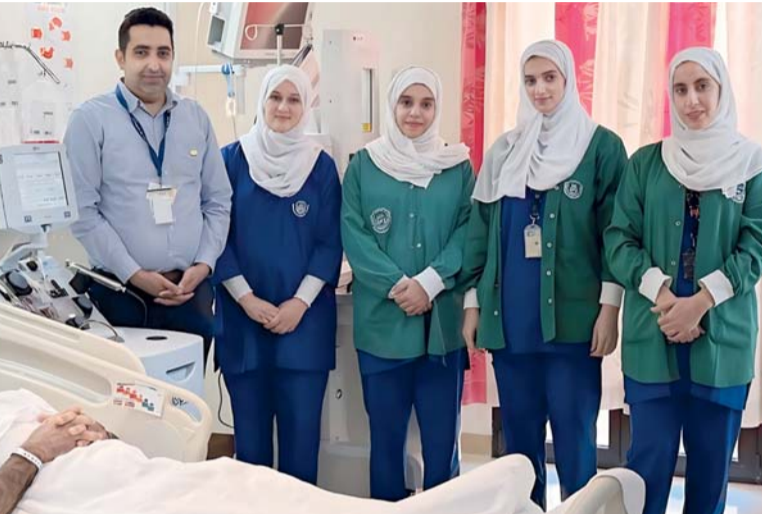
إنجاز طبي يعكس تطور خدمات علاج أمراض الدم والأورام في سلطنة عُمان