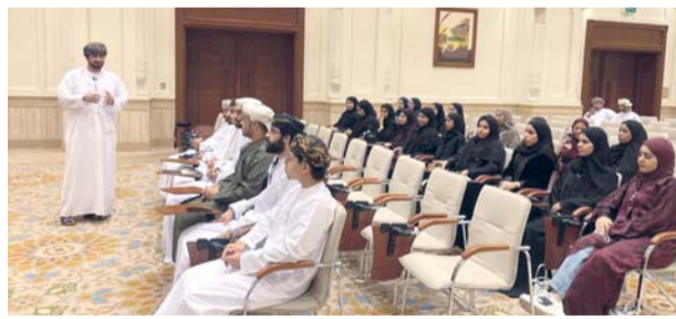
الحلقة شهدت مناقشة عدد من التجارب الإعلامية الناجحة