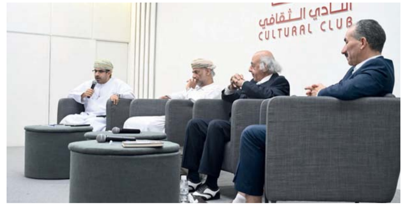
ابن رشد أحد أبرز أعلام الفكر الفلسفي في الحضارة العربية والإسلامية