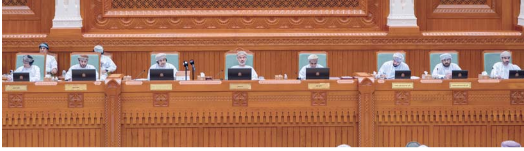
مناقشة تعزيز الأمن الغذائي وتحقيق الاستدامة

والخدمات، طالب أصحاب السعادة بإنشاء سوق مركزي وسوق للخضار واللحوم في عدد من ولايات سلطنة عمان، مؤكداً على الحاجة المتزايدة لهذه الخدمات الأساسية، إلى جانب أهمية تطوير البنية التحتية المرتبطة بالقطاعات الزراعية والسمكية. كما طرح أصحاب السعادة عدداً من المقترحات المرتبطة باستدامة الموارد المائية وتعزيز الأمن الغذائي، من بينها استغلال مياه الصرف الصحي المعالجة في زراعة الأعلاف والحشائش بدلاً من هدرها، بما يسهم في تقليل الاعتماد على الاستيراد وتعزيز الإنتاج المحلي. وفي سياق متصل، ناقش أصحاب السعادة إمكانية استغلال الأراضي الزراعية خارج سلطنة عمان عبر الاستثمار أو الاستئجار بأسعار مناسبة، مسالطين عن مدى تبني الوزارة مثل هذه المبادرات ضمن خططها المستقبلية.