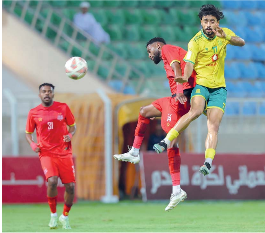
■ من مواجهة ظفار والسيب بالجولة الماضية

في مجمع الرساق ، هناك مباراة يؤديها الرساق صاحب الضيافة بمقابلة تأدية واجب ليس إلا ، حيث هبط الفريق رسميا للمظالم وليست لديه أي أهداف حاليا في دوري الأضواء ، ومن الممكن أن يرحب مدربه بلاعبين شباب لتجربتهم وتثبيتهم للموسم القادم بالأولى ، فالقوة بالنسبة له حاله حال التعادل ولن يشفع له بأي شيء يذكر ، أما الطرف الآخر وهو عبري فالمباراة بالنسبة له حياة أو موت ، فالفريق يحتل المركز قبل الأخير وهو المركز الذي يرافقه من خلاله الرساق للمظالم، رصيده من النقاط (٢٠) وأي ضياع للنقاط يعني عودته للأولى التي كان بها في الموسم الماضي لولا قرار الاتحاد بإعادته للأضواء حاله حال نادي صور ، عبري يدرك بأن مباراة اليوم بالنسبة له نهائي كبير، خاصة وأنه سيلتقي بظفار في الجولة القادمة وهو واحد الفرق المهتدة بالهبوط كذلك ، وبعدها سيلتقي السيب وهو الذي يأمل أن يحقق رقما قياسيا في عدد النقاط بهذا الموسم وقبلها رد الاعتبار بعد أن تلقى خسارته الوحيدة بهذا الموسم على يد عبري بالدور الأول والتي أثارت العديد من التساؤلات في حينه ، لذلك فإن عبري أمام فرصة كبيرة للخروج من المأزق ولو لوقت قصير خاصة وأنه يلاقي فريقا لا ناقة له ولا جمل من مباراة اليوم.