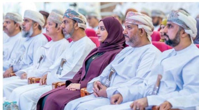
بناء منظومة تعليمية قائمة على الجودة والابتكار والتنافسية.

إلى بناء منظومة تعليمية قائمة على الجودة والابتكار والتنافسية. ويشارك في المؤتمر عدد من المؤسسات الأكاديمية والعسكرية والتعليمية من داخل سلطنة عُمان، من بينها جامعة السلطان قابوس، والكلية العسكرية التقنية، وأكاديمية السلطان قابوس لعلوم الشرطة، والجامعة العربية المفتوحة، وكلية الدراسات المصرفية والمالية، والمدينة الطبية للأجهزة الأمنية والعسكرية. وألقى الدكتور محمد بن راشد المعمرى كلمة قال فيها: إن الجودة لم تعد خياراً تنظيمياً، بل أصبحت نهجاً استراتيجياً يسهم في بناء بيئة تعليمية قائمة على التطوير والتحسين المستمر والمؤتمراً يمثل منصة علمية لتبادل الخبرات والمعارف وأفضل الممارسات في مجالات الجودة والتميز المؤسسي.