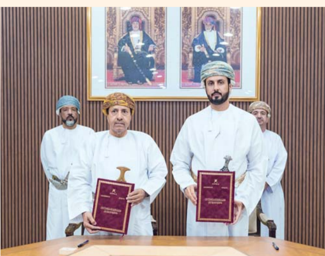
اعتماد النظام خطوة تعكس حرص الجانبين على تطوير العمل الوثائقي

المؤسسات في إدارة وثائقها وفق أسس علمية ومهنية. ويشمل النظام مختلف أنواع الوثائق المتداولة في المحافظة، حيث يتم تصنيفها وفق منهجية علمية واضحة، مع تحديد مدد استبقائها عبر المرحلتين الجارية والوسيلة، إلى جانب تطبيق إجراءات تنظيمية دقيقة لتنظيم عمليات تداول الوثائق بين التقسيمات الإدارية المختلفة. كما ترجل الوثائق ذات القيمة الدائمة بعد انتهاء مدد استبقائها إلى هيئة الوثائق والمحفوظات الوطنية لحفظها ضمن الذاكرة الوطنية، فيما يتم إتلاف الوثائق التي انتهت مدد حفظها وفقاً لجدول الاستبقاء المعتمدة وبما يتوافق مع الأطر القانونية والتنظيمية المعمول بها. ويجسد هذا الاعتماد مستوى التقدم الذي تحقّقه محافظة الظاهرة في تطبيق منظومة إدارة الوثائق، ويؤكد التزامها بتعزيز الحوكمة المؤسسية ورفع كفاءة الأداء الإداري وفق أفضل الممارسات المهنية المعتمدة.