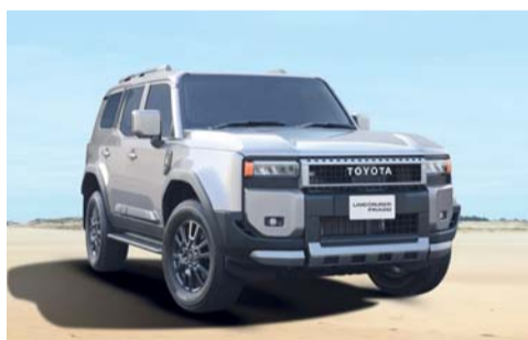
■ لاند كروزر برادو بخيارين من المحركات

الأن. وتُعدّ مقصورة «لاند كروزر برادو» مثلاً رائعاً للراحة والتنوع، حيث صُممت لتتنوع لما يصل إلى سبعة ركاب وشاشة عرض عرضة عالية الدقة بالكامل مقاس ١٢,٣ بوصة، وشاشة عدادات رسومية مقاس ١٢,٣ بوصة، وشاشة عرض على الزجاج الأمامي، بالإضافة إلى ميزة الشحن اللاسلكي والاتصال السلس عبر «أبل كاربلاي»، و«أندرويد أوتو»، كما توفر أحدث أنظمة تويوتا للسلامة مثل: نظام تثبيط السرعة التكيّفي بالرادار، ونظام المساعدة على الخروج الآمن، ونظام التنبية من حركة المرور الخلفية.. وغيرها الكثير. وبدعم جودة منتجات تويوتا في سلطنة عمان شبكة شركة سعود بهوان للسيارات من مراكز قطع الغيار والخدمة المنتشرة في كافة أنحاء سلطنة عمان.