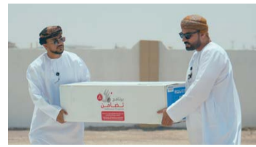
أكثر من ١٦٠ أسرة عمانية تستفيد من «تضامن» هذا العام

على قيام المختصين في وزارة التنمية الاجتماعية ووزارة الإسكان والتخطيط العمراني باستلام الطلبات ودراستها ووضع قوائم المستحقين وبعد ذلك يتولى فريق مختص عمل دراسة للحالات والتعرف على احتياجات الأسر من الفئات المستهدفة بهدف توفيرها لهم وتلبية احتياجاتهم الأساسية. وتحققاً لتجاوب أسرع في توفير احتياجات الأسر المستحقة، ويكون بشكل دوري فقد تم العمل هذا العام على توزيع