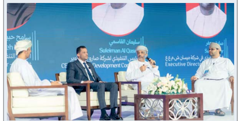
أحدى الجلسات في المؤتمر

أنهى مجلس الشورى، مناقشة بيان معالي الدكتور سعود بن حمود الحبسي وزير الثروة الزراعية والسمكية وموارد المياه، الذي استمر لمدة يومين متتاليين، خلال أعمال جلسات المجلس الاعتيادية الثامنة عشرة والتاسعة عشرة لدور الانعقاد العادي الثالث (٢٠٢٥ - ٢٠٢٦م) من الفترة العاشرة (٢٠٢٣ - ٢٠٢٦م)، والتي عُقدت برئاسة معالي خالد بن هلال المعولي رئيس المجلس، وبحضور أصحاب السعادة أعضاء المجلس وسعادة الشيخ أحمد بن محمد النذابي أمين عام مجلس الشورى. وشهدت جلسة المجلس التاسعة عشرة التي واصل فيها أصحاب السعادة أعضاء المجلس مناقشة البيان، وطرح العديد من الملاحظات التي ركزت على جملة من التحديات والموضوعات المرتبطة بقطاعات الزراعة والثروة الحيوانية والسمكية وموارد المياه في سلطنة عمان، إلى جانب مناقشة سبل تعزيز الأمن الغذائي وتحقيق الاستدامة ودعم المزارعين والصيادين والمربيين، بما يواكب مستهدفات رؤية «عمان ٢٠٤٠». وقد أكد أصحاب السعادة أعضاء المجلس خلال مناقشتهم المعالي الوزير على أهمية مراجعة الاشتراطات المرتبطة بالتعرفة الزراعية والخدمات المقدمة للمزارعين، مشيرين إلى معاناة عدد من أصحاب المزارع مع الإجراءات المرتبطة بطلبات التراخيص الدورية، وإخضاع المزارع الصغيرة لإجراءات وصفوها بالمرهقة ولا تتناسب مع طبيعة ومساحات تلك المزارع. وفي ذات الجانب، شد أصحاب السعادة على أهمية دعم المحاصيل