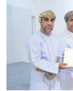
التوثيق يسهم في حفظ هذا الإرث اللغوي وتعزيز حضوره في الذاكرة الوطنية

تعزيز الوعي بقيمة اللغات العمانية ودورها في نقل المعرفة والتاريخ والتجارب الإنسانية المتوارثة. من جانبه أوضح الدكتور طالب بن سيف الخضوري مدير عام البحث وتداول الوثائق بالهيئة، أن مشروع توثيق اللغة البطهرية يأتي ضمن برامج دائرة التاريخ الشفوي الهادفة إلى توثيق اللغات واللهجات العمانية المهدهة بالاندثار، وفق منهجيات علمية متخصصة تعتمد على المقابلات الميدانية والتسجيلات الصوتية والمرئية. وأشار إلى أن الهيئة تعمل على بناء أرشيف علمي متكامل