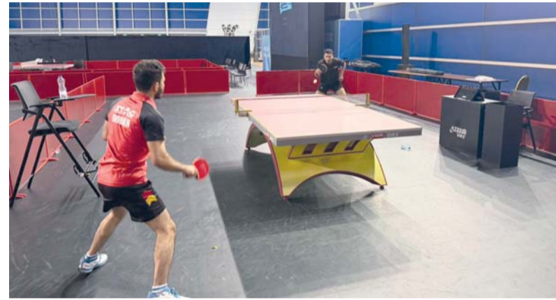
من تدريبات لاعبي منتخبنا الوطني لكرة الطاولة