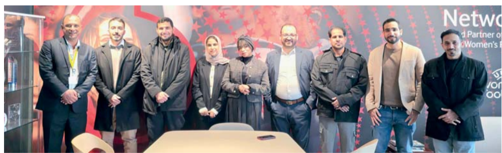
صورة جماعية للوفد المشاركة خلال زيارته إحدى المؤسسات

بعدم الشركات التقنية سريعة النمو وربطها بمنظومات أعمال عالمية، إلى جانب House of Startups التابعة لغرفة تجارة لوكسمبورغ، والتي تجمع الجهات الحكومية والقطاع الخاص ورواد الابتكار ضمن بيئة متكاملة تدعم التعاون وتبادل الخبرات. وأتاحت هذه الزيارة فرصة مميزة للوفد الاطلاع على نماذج عملية لإدارة المشتريات المركزية على نطاق واسع، وآليات دمج الشركات ذات الإمكانيات العالية ضمن منظومات أعمال دولية، إلى جانب التعرف على دور البيئات المنظمة في دعم التعاون وتحفيز النمو التجاري والابتكار.