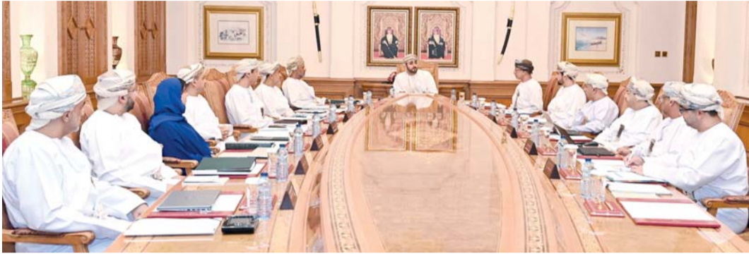
دعم مسيرة البحث العلمي وتعزيز منظومة الابتكار

بما يعزز حضور سلطنة عُمان في المحافل العلمية الدولية، ويرسخ مكانتها في منظومة البحث العلمي والابتكار عالمياً.