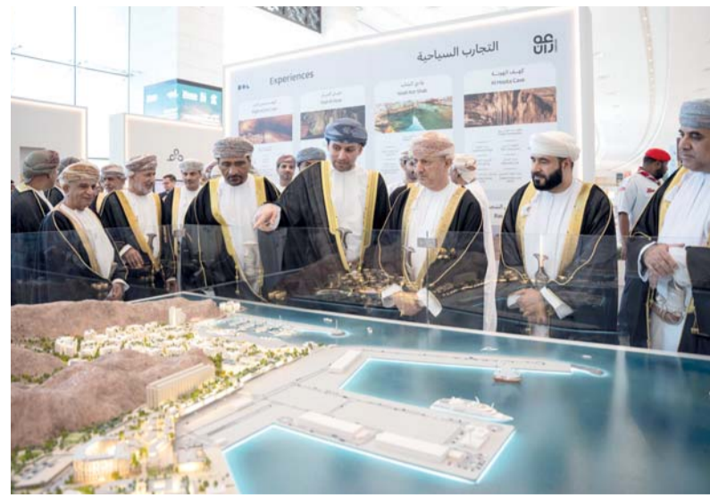
المعرض منصة مهمة لتسليط الضوء على دور تطوير الجهات السياحية المتكاملة

مشيرا إلى أن مجموعة عُمران، تنظر إلى التنمية بوصفها ممكناً طويل الأمد للتنوع الاقتصادي وصناعة القيمة المستدامة. وقد صُممت مشاريعنا للارتقاء بالعرض السياحي في سلطنة عُمان، وتجسيد هويتها الثقافية، وتعزيز القيمة المحلية المضافة، ودعم النمو المتوازن.