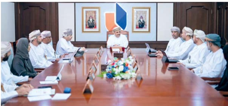
مجلس الجامعة يعقد اجتماعه الثاني

يعقد مجلسا الدولة والشورى «الأربعاء» الجلسة المشتركة الثانية لدور الانعقاد العادي الثالث من الفترة الثامنة لمجلس عمان برئاسة معالي الشيخ عبد الملك بن عبدالله الخليلي رئيس مجلس الدولة، وبحضور معالي خالد بن هلال المعولي رئيس مجلس الشورى، والمخبرين وأصحاب السعادة أعضاء مجلسي