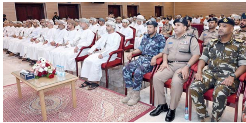
تعزيز الوعي المجتمعي ورفع الجاهزية

الريستاق. من منى الخروصية: تصوير: سعيد البحري