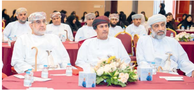
الاحتفال شهد استعراض مجموعة من النماذج الوطنية الشابة