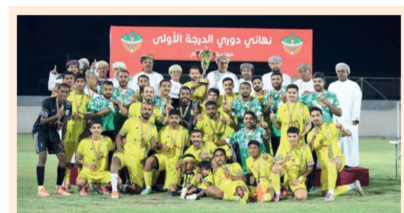
■ فرحة لاعبي فريق التضامن بالتتويج