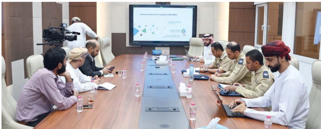
■ إنشاء الشبكة ستسهم في رفع دقة القياسات المخبرية ويعزز ربط المعايير الوطنية بالنظام الدولي

الأساسية الوطنية للقياسات المرجعية، ورفع دقة القياسات المخبرية وتقليل الارتباط في الكميات الفيزيائية المرتبطة بقيمة الجاذبية، بما في ذلك الوزن والضغط والعزم واللزوجة، وبما يسهم في دعم المختبرات الوطنية وتطوير قدراتها الفنية. وأضاف: إن الشبكة ستسهم في رفع دقة القياسات المخبرية وتقليل الارتباط في مختلف الكميات الفيزيائية، ويعزز ربط المعايير الوطنية بالنظام الدولي، بما يدعم التوجه الخليجي نحو تطبيق أفضل الممارسات العالمية في القياس والمعايرة.