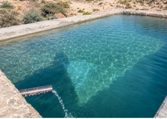
أعمال الصيانة شملت تنظيف العيون وإزالة الرواسب والمخلفات المتركمة

صلالة . العُمانية: نفذت المديرية العامة للثروة الزراعية والسكانية وموارد المياه بمحافظة ظفار أعمال صيانة وتأهيل لعيون المياه «كلي» و«دون» بولاية صلالة و«أزغوت» بولاية رخيوت، الواقعة في أعماق الأودية وبين التكوينات الجبلية، في ظروف ميدانية شاقة تنقسم بوعورة التضاريس وطبيعة المواقع الجبلية ضمن جهودها الرامية إلى الحفاظ على مصادر المياه الطبيعية وتعزيز استدامتها والاستفادة منها بما يخدم الأهالي والمجتمعات المحلية. وتعد عين «كلي» من الينابيع العذبة الواقعة شمال منطقة عدونب بولاية صلالة، وتبعد نحو ٧ كيلومترات سيراً على الأقدام، فيما تقع عين «دون» شمال موقع شلال عين كور بولاية صلالة، وتتطلب الوصول إليها السير لمسافة نحو ٤ كيلومترات عبر الأودية والمنحدرات الجبلية، أما عين «أزغوت» بولاية رخيوت فتقع على مسافة تقدر بـ ١٠ كيلومترات عبر مسارات جبلية شديدة الوعورة، ما استدعى تنفيذ أعمال تأهيل وصيانة في مواقع يصعب الوصول إليها. شملت أعمال الصيانة تنظيف العيون وإزالة الرواسب والمخلفات المتركمة، وإنشاء أحواض لتجميع المياه وسقي الماشية.