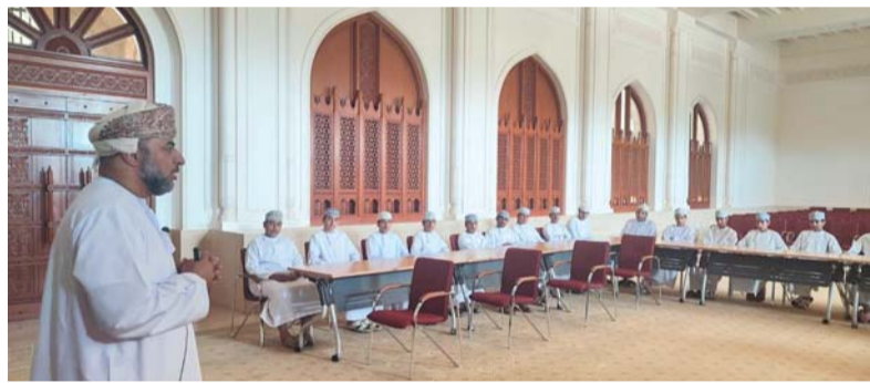
المحاضرة هدفت إلى التعريف بالذكاء الاصطناعي

إنتاج المهام الدراسية، مثل التلخيص، والمراجعة، والترجمة، وإعداد الرسومات التوضيحية، وذلك من خلال عرض أمثلة تطبيقية مباشرة باستخدام عدد من التطبيقات والمواقع المجانية. كما تناول الحاضر مجموعة من القواعد الأساسية للاستخدام الآمن والمسؤول لأدوات الذكاء الاصطناعي في المجال التعليمي، من أبرزها: عدم مشاركة البيانات الشخصية، واستخدام هذه الأدوات كمساند للتعليم لا كبديل لجهد الطالب، إلى جانب التأكيد على أن الذكاء الاصطناعي أداة مساعدة لا تخفي عن دور المعلم أو الكتاب المدرسي. واختتمت المحاضرة بعرض مجموعة من الأفكار الإبداعية والأنشطة التفاعلية التي يمكن للطلبة الاستفادة منها في دراستهم، مثل إعداد بطاقات مراجعة وأسئلة تدريبية