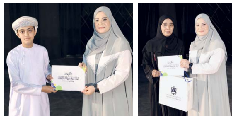
■ تكريم الفائزين في المسابقات

اهتمام المديرية العامة للتعليم بمحافظة شمال الشرقية برعاية الموهوبين والمبدعين، وتحفيز الطلبة على التميز والإبداع، وتميزهم وإنجازاتهم المشرفة على مستوى المحافظة. ويأتي هذا الاحتفال في إطار