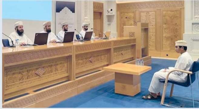
■ عدد المراكز ارتفع إلى ٢٨ مركزاً موزعة على جميع المحافظات

حتى نوفمبر القادمين لتبدأ بعدها فوراً التصفيات النهائية للمسابقة. جدير بالذكر أن هذه المسابقة تتكون من سبعة مستويات، الأول حفظ القرآن الكريم كاملاً، والثاني حفظ ٢٤ جزءاً متتالياً، والثالث حفظ ١٨ جزءاً متتالياً، والرابع حفظ ١٢ جزءاً متتالياً، والسادس حفظ ٦ أجزاء متتالية شرط أن يكون المتسابق من مواليد ٢٠١٢ م فأعلى، والسادس حفظ ٤ أجزاء متتالية شرط أن يكون المتسابق من مواليد ٢٠١٦ م فأعلى، والسابع حفظ جزئين متتاليين شرط أن يكون المتسابق من مواليد ٢٠١٩ م فأعلى.