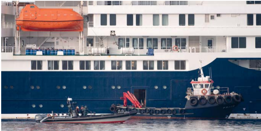
قوارب تستخدم في عمليات الإجلاء تقترب من سفينة الرحلات البحرية «إم في هوندوس» التي ترفع العلم الهولندي، والمصابة بفيروس هانتا، في ميناء جراناديا دي ابونا الصناعي بجزيرة تينيريفي في جزر الكناري الإسبانية.

جراناديا دي ابونا (إسبانيا) . ا.ف.ب: وصلت سفينة الرحلات البحرية «إم في هوندوس» التي رُصد فيها تفشي فيروس هانتا، فجر أمس إلى جزيرة تينيريفي الإسبانية في جزر الكناري، قبل إجلاء أكثر من ١٠٠ من الركاب وأفراد الطاقم. وسجلت منظمة الصحة العالمية حتى الآن ست حالات إصابة مؤكدة بفيروس هانتا من بين ثماني حالات مشتبه بها، بما في ذلك ثلاث وفيات جراء هذا الفيروس المعروف والناشر والذي لا يوجد له أي لقاح أو علاج. ويمكن أن يسبب هذا المرض متلازمة تنفسية حادة، لكن منظمة الصحة العالمية أكدت أنه ليس مثل كوفيد ١٩، الذي تسبب في جائحة لا تزال حاضرة في أذهان العالم. ودخلت «إم في هوندوس» ميناء جراناديا دي ابونا الصغير في جنوب جزيرة تينيريفي في المحيط الأطلسي، وسيبقى جزء من الطاقم على متن السفينة التي ستواصل رحلتها إلى هولندا. من هذا الميناء الصناعي، أعلنت وزيرة الصحة الإسبانية مونیکا جارسيا جوميز أن «جميع الترتيبات جاهزة لوصول السفينة مع توفير جميع الضمانات الصحية العامة اللازمة». وأضافت أن نتيجة فحص لمریضة نقلت إلى المستشفى في أليكانتي جاءت سلبية لفيروس هانتا.