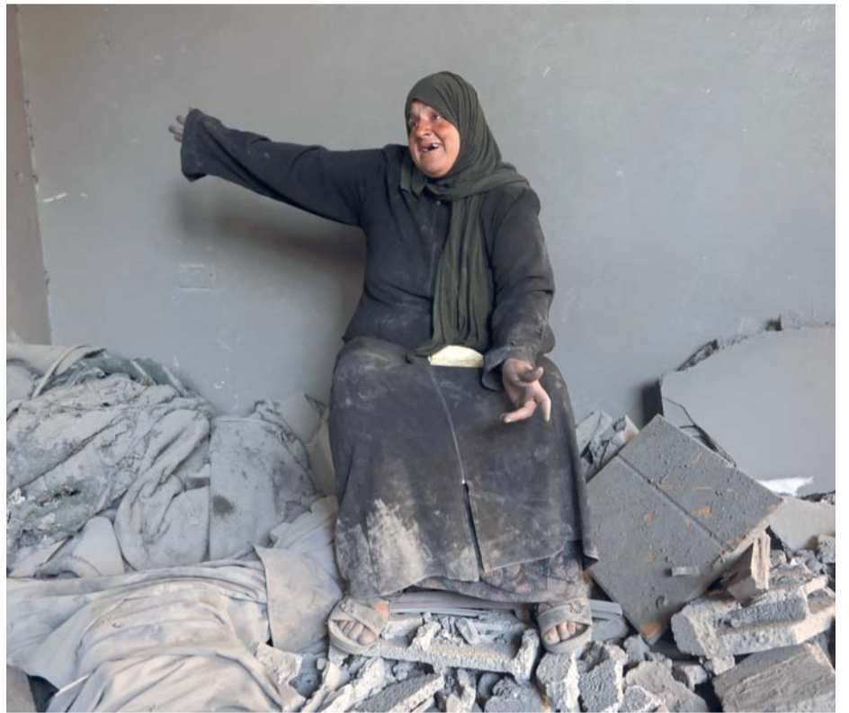
■ فلسطينية تجلس وسط أنقاض مبنى مدمر، بعد يوم من غارة «إسرائيلية» على مخيم الشاطئ للاجئين في مدينة غزة.

تواصل قوات الاحتلال «الإسرائيلي» خرق اتفاق وقف إطلاق النار في قطاع غزة لليوم ٢١٣ توالياً، عبر تكثيف القصف الجوي والمدفعي واستهداف مناطق مأهولة بالنازحين، إلى جانب عمليات النسف والتدمير داخل ما يُعرف بـ«الخط الأصفر»، مع استمرار القيود المفروضة على حركة البضائع والمساعدات والسفر. واستشهد اثنان من الفلسطينيين وأصيب آخرون في قصف طائرة مسيرة «إسرائيلية» مركبة مدنية في محيط جمعية إعمار بحي الأمل شمال غرب مدينة خان يونس. كما استشهد فلسطيني، فجر أمس، وأصيب آخرون إثر استهداف طائرة مسيرة مجموعة قرب دوار مكّي في مخيم المغازي وسط قطاع غزة. كما أصيب فلسطيني جراء قنبلة ألقتها طائرة مسيرة «إسرائيلية» على منطقة الشاوش شمال مدينة رفح جنوب القطاع. ووفق معطيات نشرتها وزارة الصحة، وصل ٥ شهداء و١٥ إصابة إلى مستشفيات القطاع في آخر ٤٨ ساعة. وفي جنوب القطاع، استهدف قصف «إسرائيلي» المنطقة الشرقية من بلدة القرارة شمال شرق مدينة خان يونس، بالترافق مع إطلاق طائرات «كواد كابتير» النار في محيط منطقة الميناء غرب مدينة غزة.