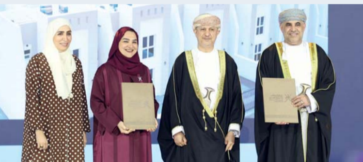
مشاريع تنموية وإسكانية تنفذها الجمعية

مبادرة «معاً نبني... معاً نحقق الأثر» تأتي من منطلق من رؤية عُمان ٢٠٢٤ في تحقيق ملامح النهضة المتجددة والتي نقلنا يوماً بعد يوم من إنجاز إلى إنجاز أكبر وإلى مشاريع تنموية واقتصادية كبيرة، وتعد جمعية دار العطاء واحدة من الجمعيات المواكبة لذلك التطور بعد أن حققنا في مجال برنامج «سكني مأماني» إنشاء أكثر من ٢٢٠ منزلاً حتى الآن، وكان مشروع حي العطاء في صنعاء على ٣ مخططات وهي حي