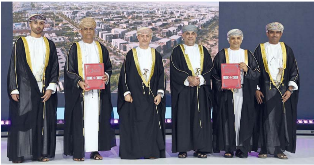
الإعلان عن حزمة من الاتفاقيات والمشروعات الاستراتيجية