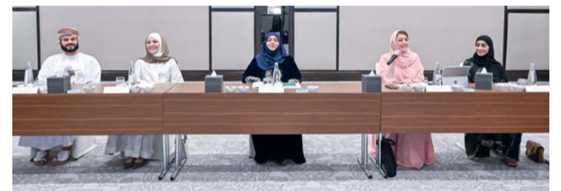
■ استعراض أبرز المبادرات الوطنية والبرامج الخاصة بالمرأة

استعرض سعادة الدكتور يحيى بن بدر المعولي محافظ محافظة جنوب الشرقية أبرز المشروعات والمبادرات التنموية المنفذة خلال الفترة (٢٠٢٣ - ٢٠٢٥ م)، والتي شملت تطوير الطرق الداخلية، ورقمنة الخدمات، وتنفيذ مبادرات مجتمعية ومشروعات تنموية بالشراكة مع القطاع الخاص، إلى جانب استعراض ملامح خطة المحافظة لعام ٢٠٢٦ م، ومؤشرات تنافسية المحافظات، وأولويات العمل المستقبلية، وذلك خلال اللقاء الإعلامي الموسع «محافظة جنوب الشرقية.. أثر مستدام»، الذي نظّمته المحافظة، بحضور أصحاب السعادة السادة والمسؤولين والإعلاميين وممثلي المؤسسات الإعلامية وذلك بقاعة المشاركين بولاية صور. وتناول اللقاء ملامح الحراك التنموي الذي تشهده محافظة جنوب الشرقية عبر عروض مرئية استعرضت المشروعات والمبادرات النوعية في القطاعات السياحية والاقتصادية والخدمية والثقافية، إضافة إلى مشروعات البنية الأساسية والتحول الرقمي،