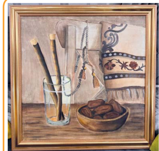
من أعمال المعرض التي جسدت التراث العماني