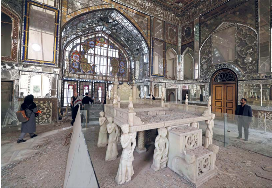
■ زوار يتجولون في أرجاء قصر جولستان التاريخي المتضرر في طهران حيث أفاد مسؤول ثقافي رفيع المستوى في طهران بأن الغارات الأميركية و«الإسرائيلية» ألحقت أضراراً بما لا يقل عن ١٢٠ متحفاً وموقعاً ثقافياً وتاريخياً في جميع أنحاء الدولة.

تستعد لكافة السيناريوهات. ومع قرب موعد زيارة الرئيس الأميركي دونالد ترامب للصين هذا الأسبوع، تتزايد الضغوط لوضع حد للحرب التي أججت أزمة طاقة عالمية، وتمثل تهديداً متزايداً للاقتصاد العالمي. من ناحيتها قالت بريطانيا، التي تعمل مع فرنسا على مقترح لضمان سلامة العبور بالمضيق بمجرد استقرار الأوضاع في المنطقة، إنها ستسرع سفينة حربية إلى الشرق الأوسط، استعداداً لمثل تلك المهمة التي ستشارك فيها عدة دول. وأعلنت هيئة بحرية بريطانية تلقي بلاغ عن حادث استهداف ناقلة بضائع على بعد ٢٣ ميلاً شمال شرق الدوحة، مشيرة إلى إصابتها بمقذوف. وأضافت الهيئة أن حريقاً اندلع في الناقلة عقب الحادث، قبل أن تتم السيطرة عليه. وقال مركز عمليات التجارة البحرية البريطانية إنه لم ترد تقارير تفيد بوقوع خسائر بشرية أو أضرار بيئية.