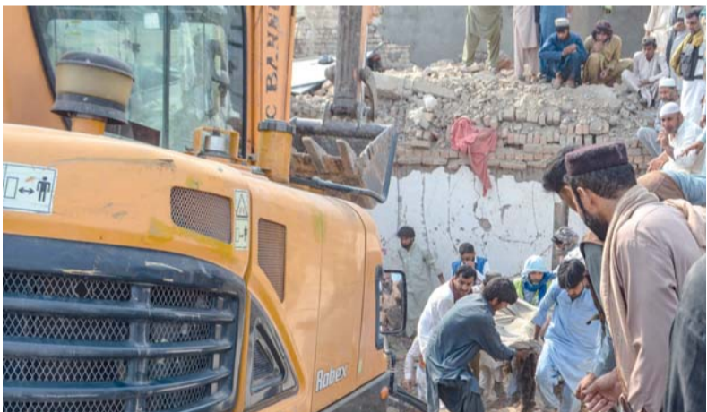
■ أشخاص يحملون جثمان أحد الضحايا عند نقطة تفتيش تابعة للشرطة الباكستانية تضررت جراء هجوم بسيارة مفخخة نفذها مسلحون في منطقة فاتح خيل بمدينة بانو الباكستانية.

في إقليم خيبر بختونخوا الحدودي في ظل موجة من التطرف انقلبت العلاقات بين إسلام آباد وكابل. وأوضح مسؤولون أن مسلحين اقتحموا نقطة تفتيش تابعة للشرطة بعد انفجار السيارة وقتلوا النار، مضيقين أنهم استخدموا أيضاً طائرات مسيرة صغيرة في الهجوم. وأفاد مسؤول إداري رفيع المستوى في بانو طالباً عدم نشر اسمه بأن «المسلحين استخدموا في هجومهم طائرات رباعية المراوح إلى جانب أسلحة ثقيلة». وأضاف «المهاجون أخذوا معهم أثناء انسحابهم عناصر من الشرطة وأسلحة من المركز».