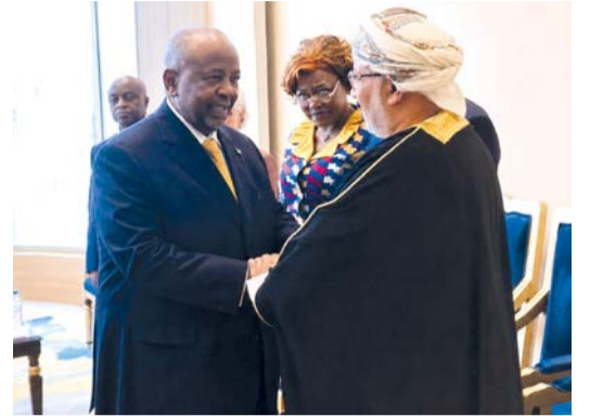
■ تحيات وتهاني جلالته السلطان للرئيس ونقلها وزير الاقتصاد