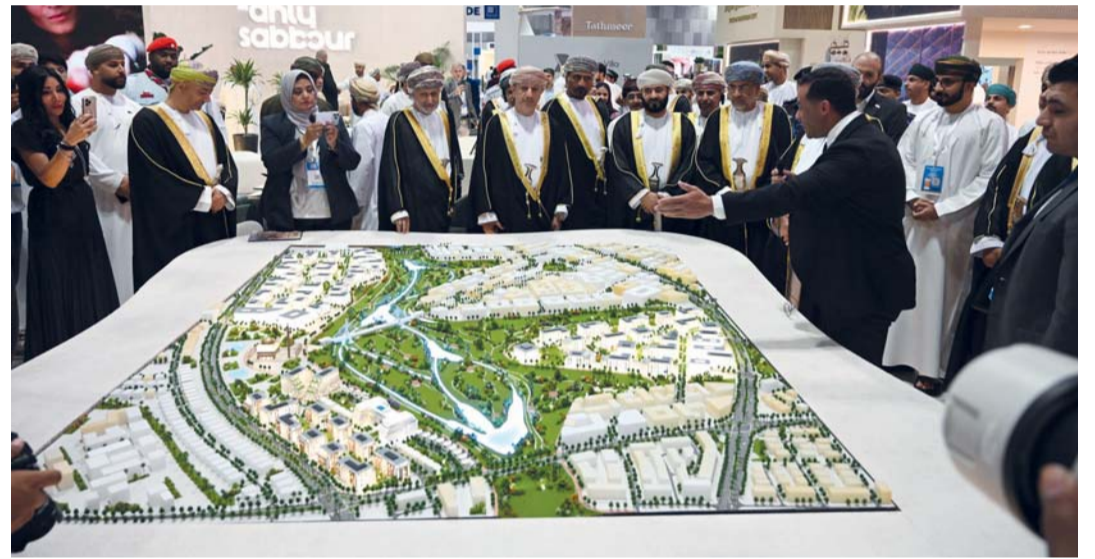
استكشاف الخيارات الإسكانية والمشاريع العقارية المتاحة عن قرب