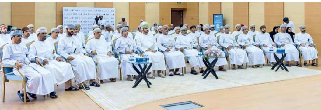
■ اللقاء يبرز ملامح الحراك التنموي في المحافظة