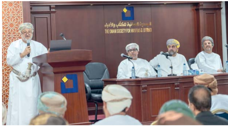
تدشين شعار فريق عمل الصندوق الدولي للتنوع الثقافي على هامش الندوة

ودورهما في دعم التنمية المستدامة والتنوع الاقتصادي وتمكين الشباب وإيجاد فرص العمل، مستعرضاً جهود منظمة اليونسكو في حماية وتعزيز تنوع أشكال التعبير الثقافي، ودور الصندوق الدولي للتنوع الثقافي في دعم المشروعات والسياسات الثقافية التي تسهم في تعزيز الابتكار وبناء مجتمعات شاملة ومستدامة. وبين الدكتور عامر بن محمد العيسري عضو الجمعية العمومية للكتاب والأدباء، أهمية الثقافة