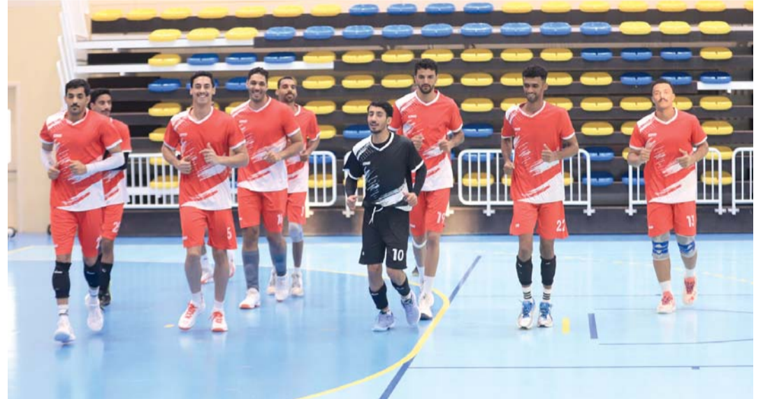
من الحصص التدريبية لمنتخب الطائرة

المنافسات في ١٠ منشآت رياضية مجهزة بأحدث التقنيات تشمل: قبة أسباير، وصالة رياضة المرأة، ومجمع حمد للرياضات المائية، ونادي قطر الرياضي، وصالة الاتحاد القطري للبيارد والسوكر، ونادي الغرافة الرياضي، وميدان لوسيل للراماية، ونادي قطر للسباق والفروسية، وصالة الاتحاد القطري للبولينغ، وصالة تحيل الرياضية.