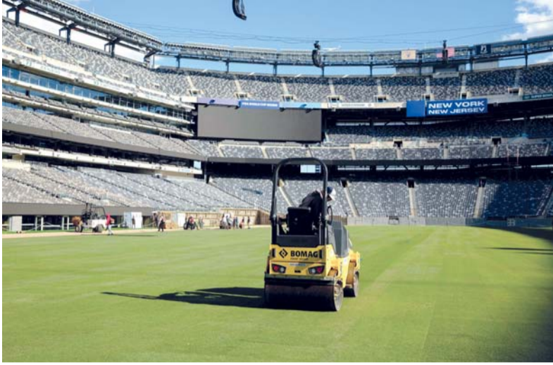
يقوم العمال بتركيب أرضية ملعب نيويورك نيو جيرسي (الذي تم تغيير اسمه مؤقتاً من ملعب ميتلايف) استعداداً لكأس العالم لكرة القدم ٢٠٢٦

بيليندا، والمغنية وكاتبة الأغاني ليل داونز، إلى جانب المغنية الجنوب إفريقية تايلو فرقة لوس أنجليس أوليس التي تقدم موسيقى الكومبيا المكسيكية التقليدية. وقال رئيس فيفا جاني إنفانتينو في بيان «ستتقسم العالم هذه اللحظة، وهكذا ستبدأ هذه البطولة». احتفال عالمي حقيقي». وتواجه