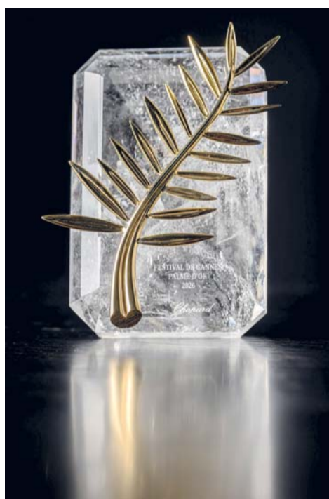
جائزة السعفة الذهبية يتم تصويرها في حلقات عمل شوبارد للمجوهرات الراقية، في ميرين بالقرب من جنيف.

وأضافت أن الجهاز الجديد صُمم ليعمل كعضو اصطناعي «حي»، عبر دمج خلايا قادرة على إفراز الأنسولين داخل بنية وعائية تحاكي الأنسجة الطبيعية في الجسم. ويتميز الجهاز عن المحاولات التجريبية السابقة بقدرته على توفير تدفق دموي فوري ومستقر للخلايا، وهو ما قد يحسن بقاءها ووظيفتها لفترات أطول، ويقلل الحاجة إلى أدوية تثبيط المناعة التي تستخدم عادة بعد عمليات الزراعة.