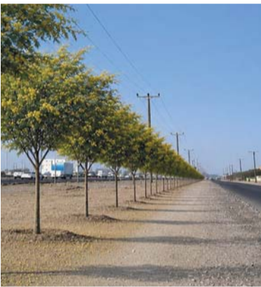
تطوير وتشجير مسافة تمتد لثلاثة كيلومترات موزعة على مواقع رئيسية

تواصل بلدية جنوب الباطنة تنفيذ مشروعها المتكامل لتشجير وتطوير شارع السلطان قابوس في ولاية بركاء والمصنعة، ضمن خطة استراتيجية تهدف إلى تعزيز المشهد الحضري وتحقيق الاستدامة البيئية في أحد أهم المحاور الحيوية بالمحافظة.