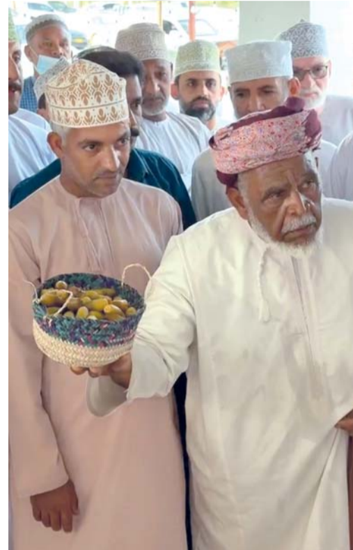
عرض أولى تباشير رطب نخلة النغال في عرصة مسلمات

بدأت في بلدة مسلمات بولاية وادي المعاول بمحافظة جنوب الباطنة أولى تباشير رطب نخلة النغال، حيث تم عرض أول كمية منه بلغ وزنها حوالي كيلوجرام خلال المناداة عليه بعرضة مسلمات، حيث بلغ سعر الكيلو ١٣ ريالاً عُمانياً نظراً لشدة التنافس على شراء الرطب مع بداية موسم نظراً لندرته. تجدر الإشارة إلى أن أسعار الرطب تبدأ بالانخفاض التدريجي مع بداية شهر يونيو.