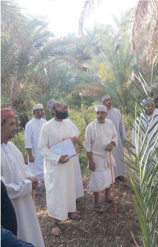
عملية طناء النخل في قرية بوة