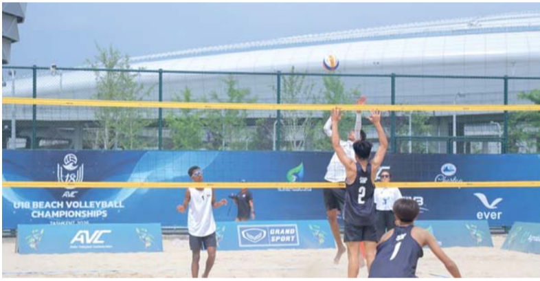
من مشاركات منتخب الطائرة الشاطئية في البطولة

ضربت أندية الرستنق والسويق والشباب وصحار موعدا مع المربع الذهبي للبطولة الأولى للاعبين أندية الباطنة المقامة حاليا على ملعب فريق شباب بديعوه بتنظيم وإشراف رابطة قدامى لاعبي نادي السويق ، حيث تصدر الرستنق الدور التمهيدي برصيد (٩) نقاط وجاء السويق ثانيا برصيد (٧) نقاط وتلاه الشباب بذات الرصيد متخلفا بفارق الأهداف وحل نادي صحار رابعا برصيد (٦) نقاط ، فيما خرج المصنعة وصحم من المنافسة على اللقب بعد أن جمعا (٥) نقاط لكل منهما وفي المركزين الخامس والسادس على التوالي ،