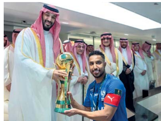
ولي العهد السعودي محمد بن سلمان يسلم كأس الملك إلى اللاعب الدوسري

الدوسري الذي استغل كرة داخل منطقة الجوز وسددها بقوة داخل الشباك. وفي الوقت بدل الضائع من الشوط الأول، منح هيرنانديز التقدم للهلال بعدما استغل ارتباك الدفاع وسدده كرة قوية على يسار كوساني. وفي الشوط الثاني، واصل الهلال أفضليته وكاد يضيف هدفاً ثالثاً لولا تألق كوساني أمام محاولة هيرنانديز، بينما افتقدت هجمات «الزعيم» للخطورة الحاسمة رغم السيطرة الميدانية. وفي الدقائق الأخيرة، أهدر الصربي سيرغي سافيتش فرصة محققة بعدما سد جوار القائم، قبل أن يضع سلطان مندش أخطر فرص الخلود عندما أطاح بالكرة خارج الرمي رغم خلوه من الحارس.