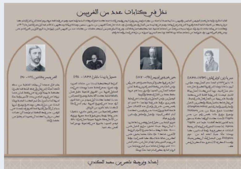
إعداد وترجمة ناصر من محمد الكندي

البراعة الميكانيكية ليست من عادات العرب، وقد شعرت ببعض الدهشة عندما وجدت، في أحد الجداول القريبة من الطريق، طاحونة دقيق تعمل بالطاقة المائية. كانت آلة بدائية وصغيرة الحجم إلى حد ما، لكنها كانت أول نموذج من هذا النوع أراه مقعداً في الجزيرة العربية، رغم أنني لاحقاً لاحظت والأودية، تتوزع البلدة بين حقول النخيل وتغطي مساحة تقارب ٤ أميال مربعة، حيث تحتوي مزارع النخيل على ٢٥,٠٠٠ نخلة، تاركة مساحة صغيرة لأنواع الزراعة الأخرى. ويضيف: يقع الحصن على ارتفاع بين صخرة القمة المذكورة وتل يُسمى جبل لبنان، وهو حالياً خارج الخدمة، تشتهر نخل بينابيعها الحارة، وأكبر مجموعة منها تشمل حمام الفوارة وحوالي ٢٠ ينبوعاً آخر، تقع بين الحدائق في شبه رأس الوادي، بينما توجد مجموعة ثانية على الجانب الآخر من القرية، وأشهرها حمام عديسة. هذه الينابيع الجزيرة العربية.