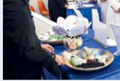
إقامة ندوات على هامش المعرض

كما تراجعت الممارسات غير التنافسية إلى نحو ١٤ حالة خلال عام ٢٠٢٤م، في مؤشر يعكس ارتفاع مستوى الامتثال وترسيخ مبادئ الشفافية في السوق. وعلى صعيد المؤشرات الدولية، سجلت سلطنة عمان