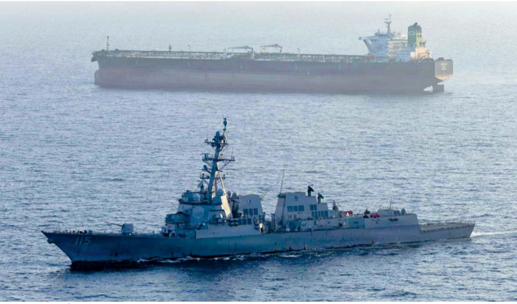
صورة نشرتها البحرية الأميركية للمدمرة الصاروخية الموجهة يو إس إس رافائيل بيرالتا من فئة أرلي بيرك، وهي تُنفذ حصاراً بحرياً على ناقلة النفط الخام ستريم.

تقديرها أن مساحة التسرب النفطي تخطت كيلومترا مربعا حتى يوم الخميس الماضي.