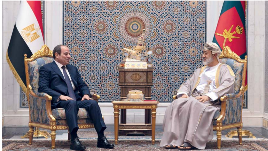
■ اللقاء بحث عدداً من القضايا التي تشهدها المنطقة وتداعياتها السياسية والاقتصادية والأمنية

عمان، وكان حضرة صاحب الجلالة السلطان هيثم بن طارق المعظم - حفظه الله ورعاه - في مقدمة مُستقبلي فخامته عند سُلْم الطائرة لدى وصوله إلى المطار السلطاني الخاص. كما كان في الاستقبال بمعمة جلالته، معالي الفريق أول سلطان بن محمد النعماني وزير المكتب السلطاني، ومعالي السيد بدر بن حمد البوسعيدي وزير الخارجية، ومعالي الدكتور حمد بن سعيد العوفي رئيس المكتب الخاص، ومعالي الشيخ عبد العزيز بن عبد الله الهنائي السفير المتجول في وزارة الخارجية، وأعضاء سفارة جمهورية مصر العربية بمسقط. ورافق فخامة الضيف معالي اللواء أركان حرب أحمد علي محمد رئيس ديوان رئيس الجمهورية، ومعالي الدكتور بدر أحمد عبدالعاطي وزير الخارجية والتعاون الدولي والمصريين بالخارج، ومعالي المستشار عمر مروان مدير مكتب رئيس الجمهورية، وسعادة السفير ياسر شعبان سفير جمهورية مصر العربية المعتمد لدى سلطنة عُمان. وغادر البلاد فخامة الرئيس عبد الفتاح السيسي رئيس جمهورية مصر العربية الشقيقة، والوفد الرسمي المرافق لفخامته، وكان في مقدمة مُودعي فخامته بالمطار السلطاني الخاص حضرة صاحب الجلالة السلطان هيثم بن طارق المعظم - حفظه الله ورعاه - وبمعمة جلالته عدد من كبار المسؤولين.