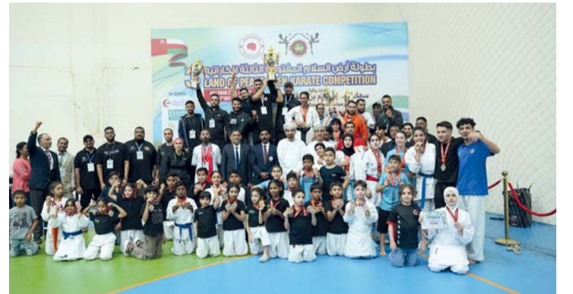
لقطة جماعية للمشاركين وأصحاب المراكز الأولى

وشهدت الفعاليات مشاركة واسعة، حيث بلغ عدد المشاركين في سباق الأكوائلون ٨٠ متسابقا، فيما شارك ٤٥ متسابقا في سباق الكيك، و٣٠ متسابقا في سباق