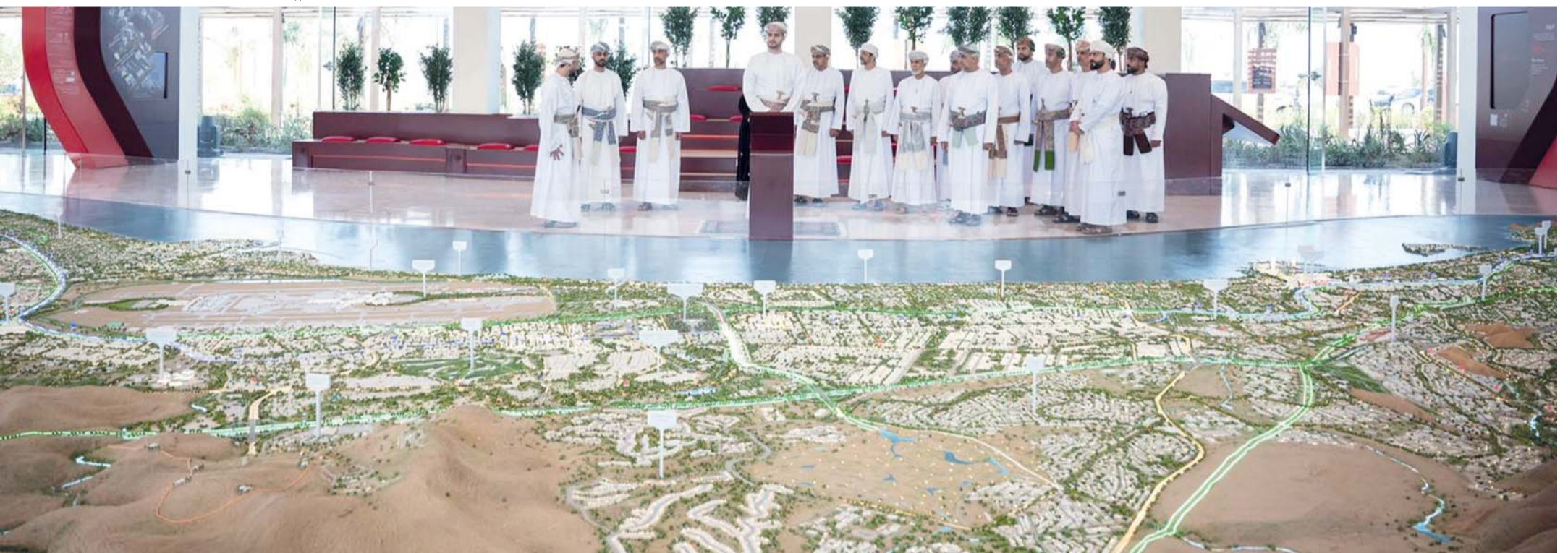
■ المُدن المستقبلية تجسّد نماذج متقدمة للمُدن المؤنسة التي تضع الإنسان في صميم التخطيط الحضري وتُعزّز جودة الحياة.