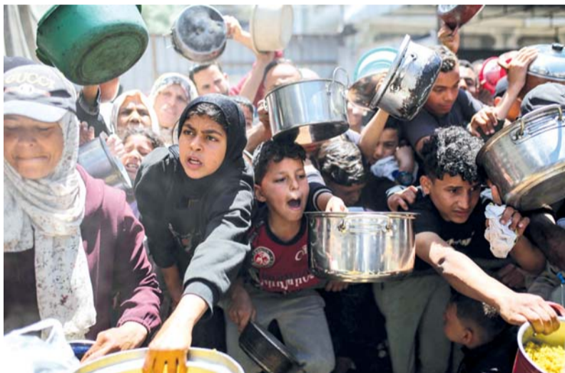
فلسطينيون يتجمعون للحصول على وجبة ساخنة في مخيم النصيرات للاجئين الفلسطينيين وسط قطاع غزة.

بمقر الأمم المتحدة في نيويورك، حيث سرد المتحدث الأمامي بيانات حول أوضاع الفلسطينيين نقلًا عن تقارير مكتب تنسيق الشؤون الإنسانية (أوتشا). وأشار حق إلى أن عمليات هدم المنازل التي نفذها مستوطنون إسرائيليون في الضفة الغربية، خلال الأسبوع الأول من مايو الجاري، أدت إلى نزوح ٤٢ فلسطينيا، بينهم ٢٤ طفلا. وأضاف أن قرابة ٤٠ ألف شخص نزحوا في جميع أنحاء الضفة الغربية منذ بداية العام الماضي، جراء الممارسات الإسرائيلية. وأوضح أن جيش الاحتلال الإسرائيلي والمستوطنين المسلحين الذين يشنون هجمات تحت حماية الجيش، يواصلون اعتداءاتهم دون توقف في جميع مدن الضفة الغربية. ولفت إلى أن هجمات المستوطنين تستهدف «الفلسطينيين وممتلكاتهم الذي هم السكان الأصليين للمنطقة». وتشهد الضفة الغربية بما فيها القدس الشرقية تصاعدا في العمليات العسكرية الإسرائيلية، بما يشمل اقتحامات واعتقالات وإطلاق نار واستخدامات مفرط للوقوة، بالتوازي مع اعتداءات متزايدة ينفذها مستوطنون ضد الفلسطينيين وممتلكاتهم.