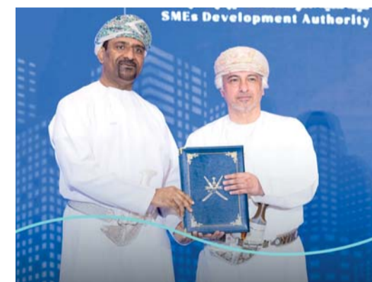
الاتفاقية تهدف إلى تقديم حلول مالية مبتكرة

المنتج والخدمات المصرفية المختلفة التي تتناسب مع احتياجات المؤسسات الصغيرة والمتوسطة، بما يسهل على أصحاب الأعمال الوصول إلى حلول مصرفية تدعم طموحاتهم