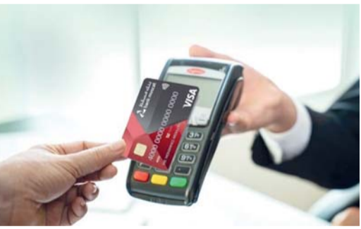
أجهزة نقاط البيع تسجل أداء قويا

مع جهود الوزارة الرامية إلى تعزيز مرونة الإنفاق، وتطوير بيئة أعمال جاذبة تواكب تطلعات المستهلكين، وتدعم استدامة النمو الاقتصادي في الأسواق والمتاجر المحلية.