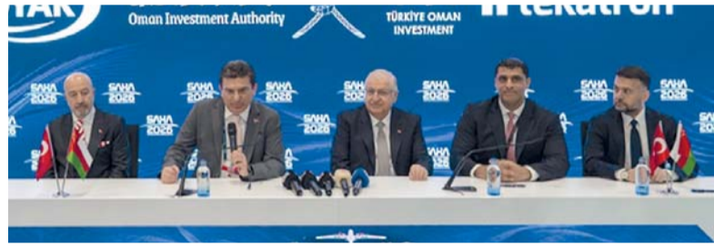
الاتفاقية تقوم بتفعيل نهج البعد العماني في الاستثمارات الخارجية

المشترك في عام ٢٠٢٥، بشراكة بين جهاز الاستثمار العماني وصندوق «أوباك» التركي الحكومي برأسمال ٥٠٠ مليون دولار أمريكي (٢٥٠ مليون دولار أمريكي لكل طرف)، ويهدف الصندوق إلى تعزيز الاستثمارات المشتركة، ونقل التقنية، ودعم قطاعات متنوعة مثل التعدين، واللوجستيات، والصناعة، والزراعة، والطاقة المتجددة.