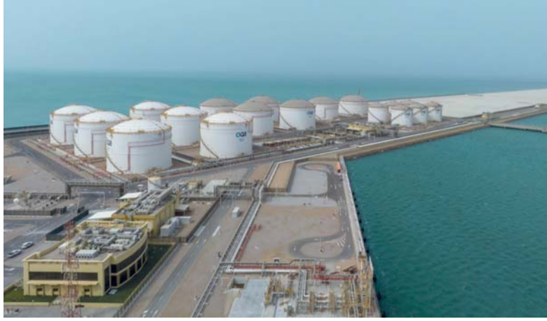
ارتفاع طفيف تسجلته منتجات المصافي في سلطنة عمان

في حين تراجعت صادراته بنسبة ٢٢,٨ بالمائة، لتبلغ ٤٧ ألفا و٢٠٠ طن متري، مقابل ٦١ ألفا و٢٠٠ طن متري في الفترة المماثلة من العام الماضي.