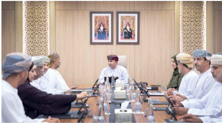
اجتماع المجلس العُماني للاختصاصات الطبية

■ شهد الأسبوع الماضي عدداً من الفعاليات والأحداث والمناسبات.. حيث شاركت سلطنة عُمان، في الاجتماع الوزاري الذي عُقد عبر الاتصال المرئي بتنظيم مشترك من الجمهورية الإيطالية وجمهورية كرواتيا، لبحث عدد من القضايا الدولية المتعلقة بالأمن الغذائي والتعاون الدولي ليجدد التأكيد على النهج الدبلوماسي الثابت الذي تتبعه سلطنة عُمان في دعم التعاون الدولي والحوار البناء، باعتباره أحد المرتكزات الأساسية لمعالجة التحديات العالمية المشتركة، وفي مقدمتها قضايا الأمن الغذائي والاستقرار الاقتصادي والتنمية المستدامة. وفي المداخلة التي قدمها معالي السيد بدر بن حمد البوسعيدي وزير الخارجية تمت الإشارة إلى ما يشهده العالم من تحديات متسارعة، سواء المرتبطة بالتوترات الجيوسياسية أو التغيرات المناخية أو اضطرابات الأسواق العالمية، حيث أصبحت قضايا الأمن الغذائي تتطلب شراكات دولية أكثر تكاملاً ومرونة.. لتأتي دعوة سلطنة عُمان إلى تعزيز الحوار والتعاون تسهم في ترسيخ مقاربة تقوم على التفاهم وتبادل المصالح وتحقيق الاستقرار الإقليمي والدولي، بعيداً عن السياسات الأحادية أو التصعيد الذي قد يفاقم الأزمات الإنسانية والاقتصادية.