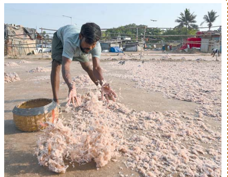
عامل ينثر الروبيان الطازج لتجفيفه على شاطئ في مومباي بالهند

ميونخ. د.ب.أ: أعلن عمدة مدينة ميونيخ الجديد السماح مجدداً بممارسة رياضة ركوب الأمواج على الموجة الاصطناعية الشهيرة في «الحديقة الإنجليزية» بالمدينة الألمانية، بعد تعليق النشاط إثر حادث مميت وبموجب القرار المعدل الذي صدر بعد ساعات من تشكيل الائتلاف الجديد في مجلس المدينة، سيسمح فقط لراكبي الأمواج ذوي الخبرة باستخدام موجة «إيسباخ» في ميونيخ. وقال العمدة الجديد، دومينيك كراوزه: «ركوب الأمواج على جدول إيسباخ جزء من أسلوب الحياة في ميونيخ، وموجة إيسباخ تعد من معالم مدينة ميونيخ».