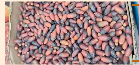
أولى تباشير موسم رطب نخلة «قش بطاش»

بدأت في ولاية نزوى أولى تباشير موسم رطب نخلة «قش بطاش» موسم القيقظ لهذه العام، حيث استبشر الأهالي ببدء الموسم بفرحة كبيرة لما تمثله من بُعد اجتماعي واقتصادي.