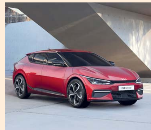
السيارة صممت بتقنيات وأنظمة حديثة

و صُممت سيارة EV6 على منصة كيا العالمية المعيارية الكهربائية (E-GMP) المخصصة، وتتميز بأرضية مسطحة توفر مساحة داخلية واسعة للغاية كما جاءت لتتعامل معها بكل سهولة بفضل بطارياتها التي تبلغ سعتها ٧٧,٤ كيلووات لكل ساعة تصل إلى ٥٢٨ كيلومترا بشحنة كاملة كما يتوفر خيار بطارية بسعة ٥٨ كيلووات لكل ساعة كما يمكن الدفع على كامل العجلات الوصول إلى سرعة ١٠٠ كيلومتر لكل ساعة في غضون ٣,٥ ثانية فقط.