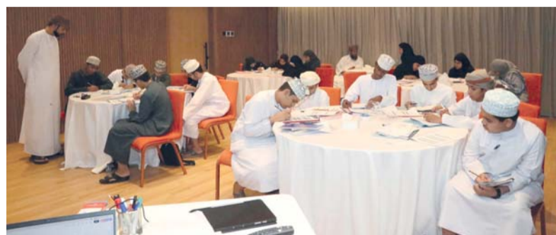
تقديم محتوى علمي متخصص لتنمية مهارات التفكير العليا

■ جانب مجالات العلوم المتعمقة في الكيمياء، والفيزياء، والأحياء، ويركز البرنامج على تدريب الطلبة على حل مسائل أولمبيادات سابقة، وتنفيذ الواجبات والأنشطة العلمية المصاحبة، إلى جانب الاختبارات القصيرة التي تسهم في تعزيز جاهزيتهم العلمية والتنافسية. ويخضع الطلبة خلال المعسكر لتدريب مكثف لمدة أسبوع في كل مادة بواقع (١٠) ساعات يومياً، على أن يختتم البرنامج باختيار تصفية نهائي لاختيار الطلبة المجددين في كل أولمبياد، تمهيداً لتشكيل الفرق الوطنية التي ستمثل سلطنة عُمان في المحافل الإقليمية والدولية. يسهم هذا النوع من المعسكرات التدريبية الحضورية في تنمية عدد من المهارات لدى الطلبة، من أبرزها: الانضباط، وتنظيم الوقت، والاعتماد على النفس، وتعزيز القدرة على التحليل، والتفكير المنطقي، وابتكار الحلول، واكتساب استراتيجيات متقدمة في التعامل مع المسائل العلمية والرياضية. يأتي تنفيذ هذا المعسكر ضمن جهود وزارة التعليم في رعاية الطلبة المهوبين، وتعزيز الثقافة العلمية الحديثة، والارتقاء بمهاراتهم العلمية والمعرفية، وإعدادهم للمنافسة المشرفة، بما يدعم حضور سلطنة عُمان في الأولمبيادات العلمية الإقليمية والدولية.