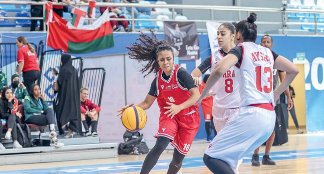
مشاركة نسائية ناجحة في دورات الألعاب