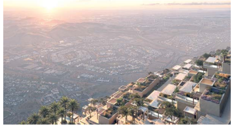
مشروع رواسي يسهم في تعزيز الاستثمارات السياحية النوعية المتكاملة

شهد الأسبوع الماضي العديد من الأحداث الاقتصادية العامة..