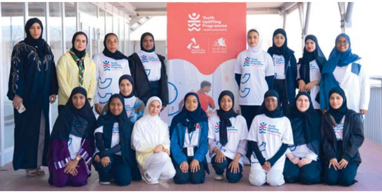
البرنامج يهدف إلى تنمية قدرات الشباب العُماني وصل مهاراته

الوطنية ويواكب التوجهات الاقتصادية العالمية ويعزز من القدرة على الاستفادة من أفضل الممارسات والتجارب الدولية في مختلف المجالات الاقتصادية والمالية. وقَّعت وزارة التراث والسياحة على اتفاقية تطوير المجمع السياحي المتكامل «رواسي» في مرتفعات جبل بوشر بمحافظة مسقط، ويقدم مفهوماً يجمع بين السياحة الجبلية والاستشفائية والإقامة الفاخرة ضمن بيئة طبيعية متكاملة.