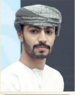
جيفر الراشدي شاعر عماني