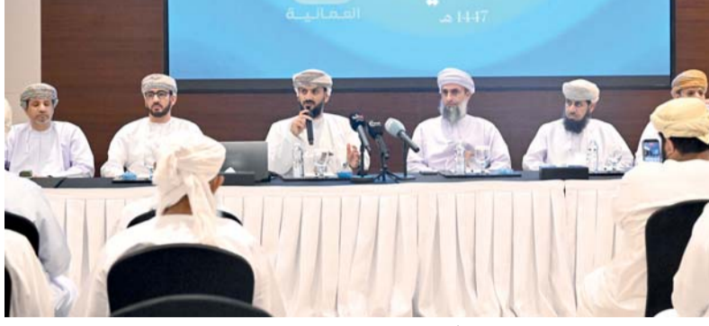
استحدثت آلية ذكية لمتابعة حركة الحافلات بشكل مباشر

ضمن شركات الحج بإشراف مباشر من البعثة لخدمة ضيوف الرحمن. وتطرق البعثة إلى مستجدات تطوير المخيمات في منى وعرفات، والتي شملت أسقفاً حديثة لتوزيع التبريد، وإنارة متكاملة، وأرضيات محسنة، وتطويراً شاملاً للمرافق؛ بهدف تقليل الأثر الصحي السلبي وتحسين مستوى الراحة والخدمات المقدمة للحجاج.