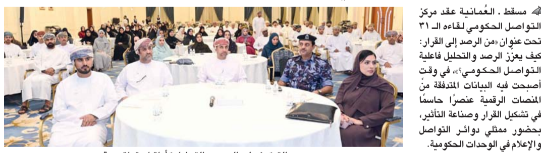
التركيز على الرصد والتحليل كأداة استراتيجية

منهجية وتحليلًا عميقًا يدعم اتخاذ القرار الحكومي. وأضاف سعادته أن التحدي اليوم لم يعد في توفر البيانات، بل في القدرة على فهمها، وتحليلها، واستخلاص دلالاتها، وتوظيفها في الوقت المناسب وهنا يكمن التحول حيث الانتقال من رصد يصف، إلى تحليل يفسر، إلى قرار يستبق. وأشار سعادته إلى أن التجارب المتميزة في بعض الجهات الحكومية أثبتت أن وجود إطار عمل واضح للرصد والتحليل يساهم في تسريع الاستجابة، وتوحيد الخطاب الإعلامي، وتعزيز الشفافية، بما يعمق ثقة المجتمع بالمؤسسات ويعزز الشراكة الفاعلة معها، عبر بناء تواصل قائم على