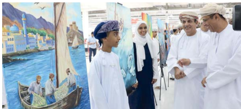
المعرض شهد مشاركة ٢٥٠ طالباً وطالبة

انطلقت فعاليات معرض الإبداعات الطلابية الثامن بعنوان (أوه يا مال)، والذي تنظمه وحدة الفنون التشكيلية بدائرة تطوير الأداء المدرسي بالمديرية العامة للتعليم بمحافظة جنوب الباطنة، رعى الحفل حمد بن علي السرحاني مستشار وزير التعليم لشؤون الإدارة التربوية، وحضور الدكتور ناصر بن سالم الغنوصي مدير عام تعليمية المحافظة وعدد من المسؤولين التربويين والمشرفين وإدارات المدارس والطلبة، واحتضنه مركز رامن للتسويق بولاية بركاء. يجسد المعرض رؤية تربوية وفنية متكاملة تساهم في ربط الفن بالهوية الوطنية واستلهام عناصر البيئة العُمانية لا سيما الحياة البحرية، وشهد مشاركة أكثر من