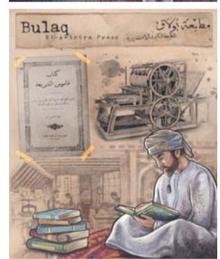
الارتباط بالأرض مفردة الفنانة في قصص الأطفال العمانية