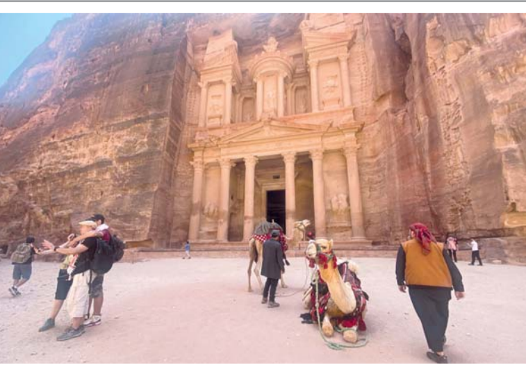
سياح يزورون آثار مدينة البتراء النبطية القديمة جنوب الأردن، وهي مدينة أثرية تاريخية تقع في محافظة معان تشتهر بعمارتها المنحوتة بالصخور

سيدني . د. ب. أ: رصد الباحثون في أستراليا نوعاً جديداً منقرضاً من حيوان الكوالا يحظى «بشفاه كبيرة ومتحركة»، وذلك بعد إعادة فحص حفريات في متحف بيرث. وتوصل فريق بقيادة كيني ترافولون، أمين قسم الثدييات في متحف ويسترن أستراليا، إلى أن الحفريات التي طالما تم الافتراض أنها من ضمن النوع الحديث من الكوالا، تخص فعلياً نوعاً منفصلاً كان غير معروف سابقاً. وقد تم التوصل لاكتشاف بعدما أعاد العلماء فحص جمجمة حفرية من كهف موندلين في نهر مارجريت، على بعد ٣٠٠ كيلومتر جنوب بيرث. وقال ترافولون «الحفيرة تنتمي بسماوات لم نرها في الكوالا الحديثة، مما دفعنا لإجراء المزيد من التحقيقات». وقام الباحثون بتحليل عشرات العظام من عيّنات أحفورية في مجموعة المتحف، وقارنوا الجحاجم والأسنان و العظام بمؤخرة الجمجمة مع الهياكل العظمية للكوالا الحديثة من الساحل الشرقي بأستراليا. وتوصلوا إلى وجود اختلافات واضحة بين بقايا العيّنات الغربية وما رصده في جنوب شرق الدولة. وقال ترافولون «التجاويف العميقة في الوجنة تضمنت عضلة وجه كبير، مما يشير إلى أن الحيوان ربما كان لديه شفاه كبيرة ومتحركة غير اعتيادية، من المحتمل تحريك أوراق الكافور أو ربما لتوسيع فتحتي الأنف لتعزيز حاسة الشم واكتشاف الطعام من مسافات أبعد».