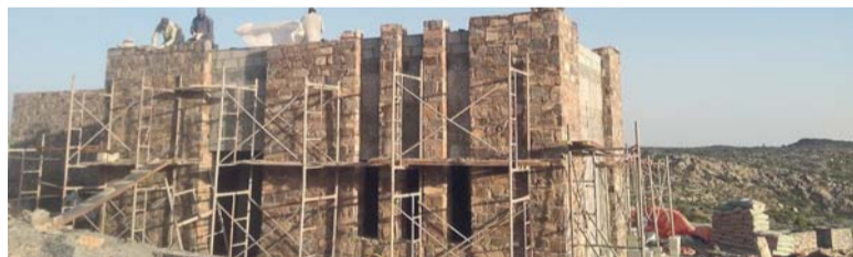
■ المشروع سيسهم في تنشيط الحركة السياحية والاقتصادية في ولاية الحمراء