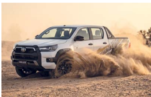
■ هايلوكس توفر مجموعة شاملة من الميزات النشطة

كما تم تجهيز «هايلوكس» بمجموعة شاملة من الميزات النشطة يشمل ذلك أنظمة أساسية مثل: نظام منع انغلاق المكابح، ونظام التحكم في الثبات السيارة، ونظام المساعدة عند بدء صعود التلال، ونظام التحكم النشط في الجر بفضل الوسائد الهوائية الأمامية ووسائد لحماية ركبة السائق.. وغيرها الكثير من المزايا. ويمكن زيارة صالات عرض تويوتا في سلطنة عمان لتجربة تشكيلة فئات «هايلوكس». ■