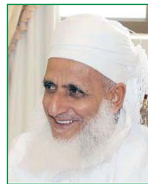
يجيب عن أسئلتكم سماحة الشيخ العلامة أحمد بن حمد الخليبي المفتي العام للسلطنة