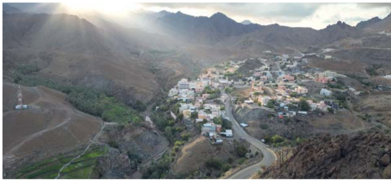
■ قرية «الخد» تتميز بالعديد من التنوع الطبيعي كالجبال والأودية والعيون

على أن يلي ذلك الترويج لها عبر المنصات الرسمية، مشيراً إلى أن هناك بعضاً من المسارات بالقرية تصلح لمحبي رياضات المشي والتي من بينها: المسار من مسجد الغربي (مسجد الفريق) نزولاً إلى وادي الخبين وصعوداً إلى سد وادي الملحاء ثم الانعطاف إلى قبيل البلاد ومواصلة المسير إلى ملعب فريق الخد الرياضي ومنها الرجوع إلى نقطة البداية من خلال شعبة قره (بمسافة تقدر بين ١٠ إلى ١٢ كيلو متراً)، ومسار من المجلس العام عبر شعبة قره وسيح السلم إلى وادي اللحم وصولاً إلى قرية كتم والعودة بنفس المسار (يقدر بمسافة ٧ كيلو مترات)، والمسار من المجلس العام باتجاه قلعة المنزة وصعود القلال إلى جبل الأحور الشرقي وصولاً إلى العلام (أبراج حجرية)، ثم النزول إلى رحبة الخيس، ثم إلى اللحم عبر قرية كتم والرجوع بوادي اللحم إلى نقطة البداية (ويقدر بمسافة ما بين ١٠ - ١٣ كيلو متراً)، ومسار من وسط القرية عبر وادي الخبين ومن ثم صعود أحد الأغوار للعبور والرجوع عبر وادي الملحاء مروراً على سد وادي الملحاء ومنه إلى نقطة البداية (بمسافة ١٠ كيلو مترات).