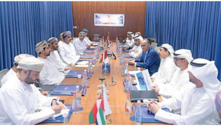
■ اللقاء بحث فرص التعاون الاقتصادي والاستثماري وتبادل الخبرات

العربية المتحدة، وسمو الشيخ أحمد بن سعيد آل مكتوم رئيس هيئة دبي للطيران المدني، إلى جانب عدد من المسؤولين والمستثمرين ورواد الأعمال في مختلف القطاعات الاقتصادية. وبحث اللقاءات فرص تعزيز التعاون الاقتصادي والاستثماري، وتبادل الخبرات والمعرفة في مجالات تطوير المناطق الاقتصادية والحررة، وتقنيات الصناعة المتقدمة، وأنماط الحياة في المدن الاقتصادية، وأفضل الممارسات في تحسين بيئة الأعمال، بما يدعم تنافسية المناطق الاقتصادية ويعزز جذب الاستثمارات النوعية وسلاسل الإمداد الإقليمية. كما تم عقد لقاء مع الشركة المشغلة للمنطقة الاقتصادية الخاصة بالروضة مناقشة مستجدات المشروع وبحث فرص الدعم المطلوبة وتعزيز القيمة المحلية المضافة.