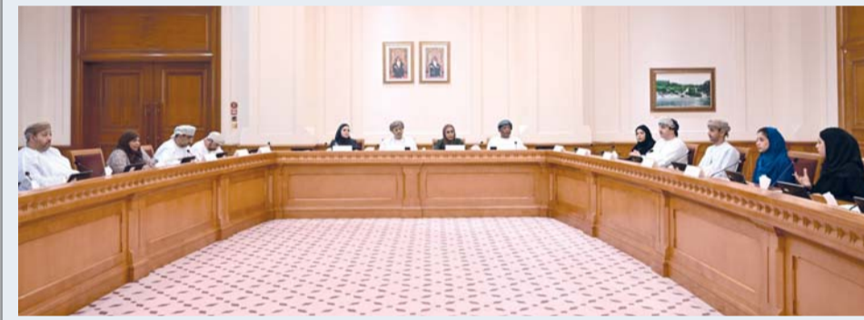
■ اللقاء ناقش أثر الإسقاطات السكانية حتى عام ٢٠٤٠م

عقدت اللجنة الخاصة المشكلة لدراسة «التركيبة السكانية وأثرها على مستقبل التنمية في سلطنة عمان» بمجلس الدولة أمس اجتماعها السادس لدور الإنعقاد العادي الثالث من الفترة الثامنة برئاسة المكرمة الدكتورة عائشة بنت حمد الدرهمي رئيسة اللجنة، وبحضور المزمين أعضاء اللجنة. واستضافت اللجنة خلال اجتماعها عدداً من المعنيين في وزارة الإسكان والتخطيط العمراني وذلك للاستئناس برؤيات الوزارة حول موضوع الدراسة وأثرها على مسارات التنمية المستدامة في سلطنة عمان. وناقش الاجتماع أثر الإسقاطات السكانية حتى عام ٢٠٤٠م بمختلف سيناريواتها على برامج التخطيط العمراني واستراتيجياته، وعلاقة التخطيط العمراني والمدن الحديثة بالقطاعات التنموية (الاقتصادية، والصحية، والتعليمية، والاجتماعية)، إضافة إلى علاقة التخطيط العمراني بالنمو السكاني للوافدين، وآليات تحقيق التوازن في هذا الجانب.