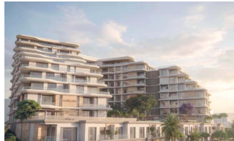
■ المشروع يلبي توقعات العملاء الباحثين عن أسلوب الحياة العصري

تعد قرية «الخد»، إحدى قرى وادي حبيي بولاية صحار بمحافظة شمال الباطنة، وجهة سياحية للكثير من زوار المحافظة خلال فصل الصيف، وذلك لما تتميز به من مناخ معتدل صيفاً، وغنية بالمعالم التاريخية والثقافية وتنوع محاصيلها الزراعية المختلفة التي يتم زراعتها في ممرجات بانخة بالجبال، ومن أبرز مزارعها التين والحمضيات المختلفة والمانجو والعنب والبر والشعير والثوم والبصل.. وغيرها من المنتجات الزراعية والتي يتم ربيها بالعديد من الأفلاج والعيون منها: فلاج السويدي، وفلاج الظاهر، وفلاج البلاد، وفلاج حبل العجمه، وفلاج حبل الرواشد، وفلاج المنزة، وفلاج الخطوه، وفلاج الضاحيه، وفلاج حويل الخضري، وفلاج البسوس، وفلاج الوقان، وفلاج الحياء، وفلاج الخبين، وفلاج حبل الزام، وفلاج الحويل، حيث تعتبر أفلاج غيلية، كما أن تمازج التضاريس الجبلية والمناظر الطبيعية والمزارع في القرية جعلها وجهة مفضلة لمحبي الطبيعة وعشاق التصوير وممارسة رياضة المشي عبر العديد من الطرق