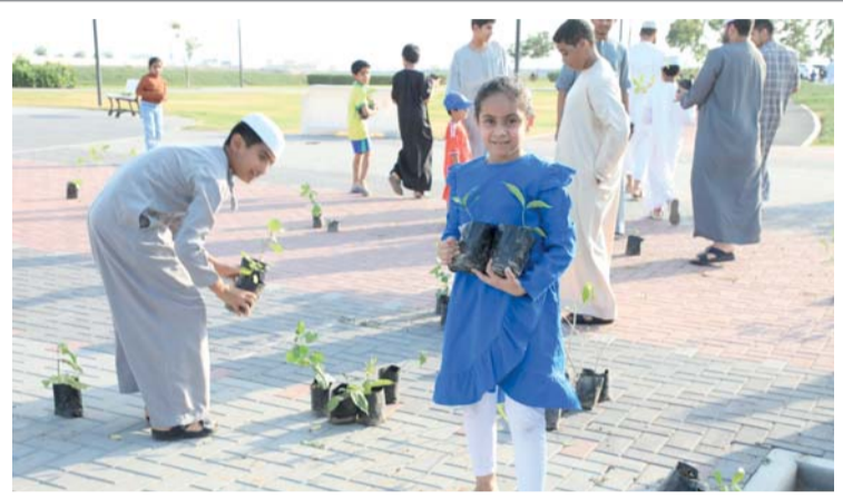
تحسين المظهر العام وزيادة المساحات الخضراء