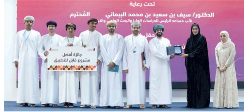
المشروع الفائز يتمثل في تطوير منصة رقمية ذكية موحدة

الحوكمة والجودة والكفاءة والشفافية، بالتكامل مع مختلف الشركاء محلياً ودولياً، وفي مقدمتهم وزارة الحج والعمرة بالمملكة العربية السعودية الشقيقة.