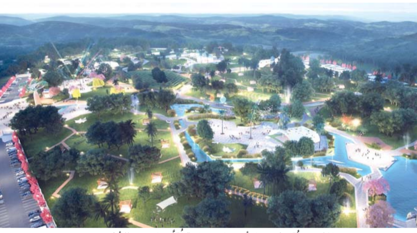
المشروع يُقام في سهل أتين على مساحة تقدر بنحو ٢٧٠ ألف متر مربع

صلالة - العُمانية: وقَّعت محافظة ظفار أمس مع وزارة الطاقة والمعادن على عقد إنشاء مشروع «متنزه أتين الطبيعي» بولاية صلالة، بتكلفة بلغت أكثر من ٤ ملايين ريال عُماني، وذلك بحضور صاحب السُّمو السيد مروان بن تركي آل سعيد محافظ ظفار. يُقام المشروع في سهل أتين بولاية صلالة على مساحة تقدر بنحو ٢٧٠ ألف متر مربع، ويُعد وجهة ترفيهية وسياحية متكاملة تستهدف توفير تجربة تجمع بين الطبيعة والراحة والأنشطة العائلية، إذ يشتمل المشروع على قناة مائية، ومناطق مخصصة للألعاب والترفيه، ومطاعم، واستراحات، ومنطقة للفعاليات والأنشطة، إلى جانب مرافق عامة متكاملة. ويتميز المشروع بكونه ثمرة شراكة مجتمعية بين محافظة ظفار والمؤسسة التنموية للمسؤولية الاجتماعية لقطاع الطاقة وشركة تنمية نفط عُمان، بما يعكس تكامل الأدوار بين الجهات الحكومية والقطاع الخاص والمجتمع المحلي، للإسهام في تنشيط الحركة السياحية، لاسيما خلال موسم الخريف، وتعزيز الاستفادة من المقومات الطبيعية التي تزخر بها المحافظة.