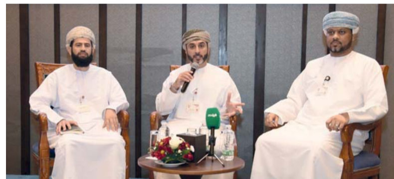
■ اللقاء سلط الضوء على الصناديق الاستثمارية التي تدار من قبل «ميثاق»