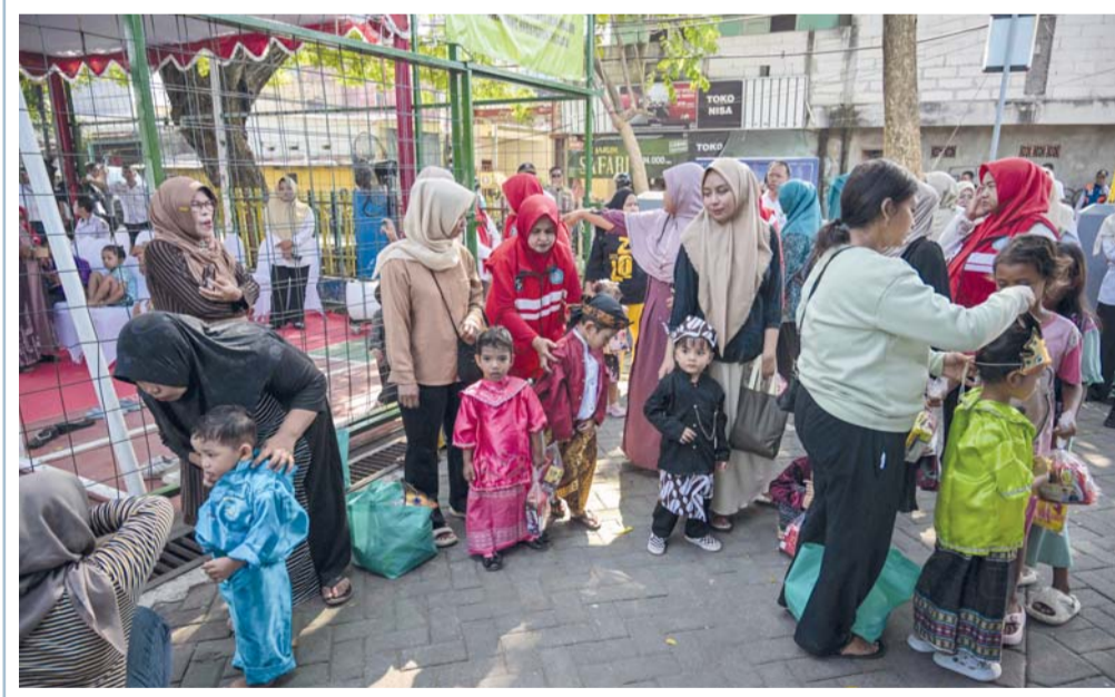
أمهات وأطفالهن ينتظرون دورهم لتلقي لقاح الحصبة والحصبة الألمانية كجزء من البرنامج الصحي الحكومي لمكافحة أمراض الطفولة في سورابايا عاصمة إقليم جاوة الشرقية وثاني أكبر مدينة في إندونيسيا.

طهران . د. ب. أ: ذكرت إدارة خدمات الطوارئ في طهران أن حريقاً نشب بمركز تسوق بالقرب من العاصمة الإيرانية تسبب في وفاة ثمانية أشخاص وإصابة ٤٠ آخرين. ونشب الحريق مساء الثلاثاء في مركز تسوق أرغافان في بلدة أنديشه بطهران. ولم يتضح سبب نشوب الحريق. ونكرت هيئة الإذاعة والتلفزيون الإيرانية (إيريب) أن السلطات تحقق في ملابسات الحريق. وأظهرت لقطات تلفزيونية رجال الإطفاء وهم يخدمون الحريق، فيما تتصاعد أعمدة كثيفة من الدخان الأسود من المبنى متعدد الطوابق.