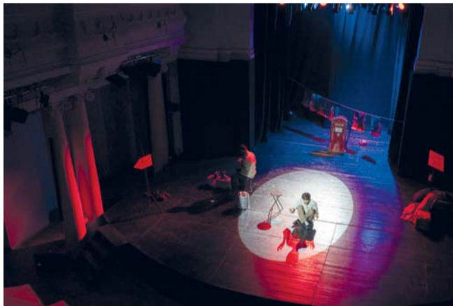
«ليلة السبت» مسارات نفسية متداخلة وتجربة إنسانية عميقة