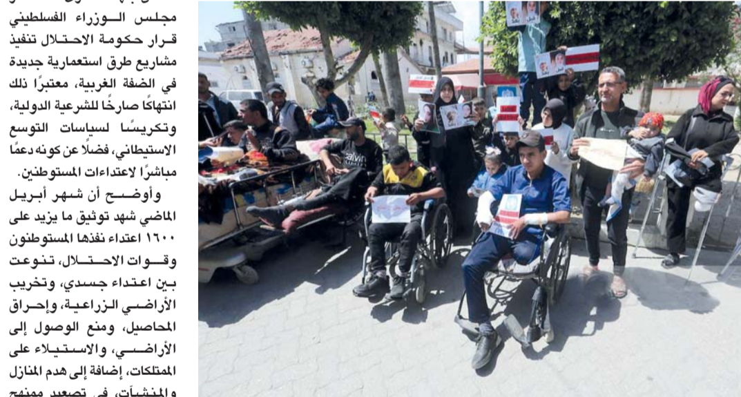
جرى جلاء العدوان الإسرائيلي على غزة ينظمون وقفة بعنوان «من حقي أتعالج» للمطالبة بالسفر للعلاج.

القدس المحتلة. وفا: حذر رئيس الوزراء الفلسطيني محمد مصطفى من بداية تفشي أمراض خطيرة بين النازحين في قطاع غزة، بفعل التدهور الكبير في الأوضاع الصحية والبيئية، داعيا منظمة الصحة العالمية ومختلف الجهات الدولية إلى تحمل مسؤولياتها. وقال رئيس الوزراء الفلسطيني في جلسة مجلس الوزراء إن «بداية تفشي أمراض خطيرة في القطاع يأتي جراء التدهور الكارثي لتلوث المياه وتدمير أنظمة الصرف الصحي». ومارتب عليه من تصاعد كبير في انتشار القوارض والبعض يفعل منع الاحتلال إدخال مستلزمات النظافة والصحة، ومستلزمات وآلات معالجة الأكوام الضخمة من النفايات ومياه الصرف الصحي المنتشرة بين التجمعات السكنية من جهة أخرى، استنكر مجلس الوزراء الفلسطيني قرار حكومة الاحتلال تنفيذ مشاريع طرق استعمارية جديدة في الضفة الغربية، معتبرا ذلك انتهاكا صارخا للشرعية الدولية، وتكريسا لسياسات التوسع الاستيطاني، فضلا عن كونه دعما مباشرا لاعتداءات المستوطنين. وأوضح أن شهر أبريل الماضي شهد توثيق ما يزيد على ١٦٠٠ اعتداء نفذها المستوطنون وقوات الاحتلال، وتنوعت بين اعتداء جسدي، وتخريب الأراضي الزراعية، وإحراق المحاصيل، ومنع الوصول إلى الأراضي، وإضافة إلى هدم المنازل، والمنشآت، في تصعيد ممنهج يستهدف تقويض مقومات الحياة الفلسطينية.