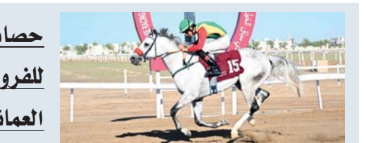
حصاد نوعي للفروسية العمانية

بركاء . العُمانية: ختم الاتحاد العُماني للفروسية والسباق موسم (٢٠٢٥-٢٠٢٦) في مشهد رياضي مميز، عكس حجم التطور الذي تشهده رياضات الفروسية في سلطنة عُمان، سواء على صعيد سباقات الخيل أو الألعاب المصاحبة، وسط تنافس لافت بين المؤسسات الحكومية ومراكز الفروسية الخاصة، إلى جانب بروز أسماء شابة واعدة في مختلف المسابقات.