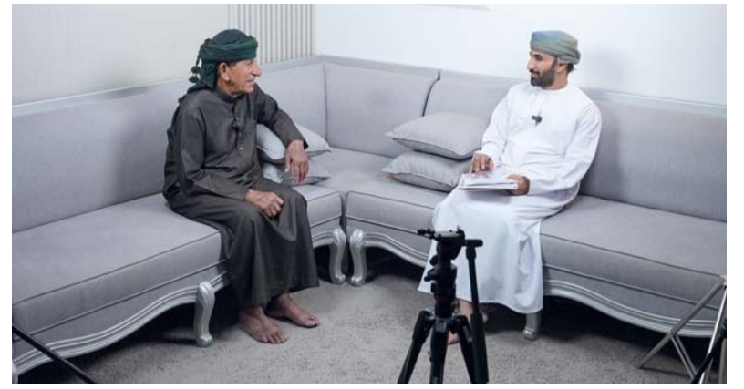
الرواية الشفوية تعد رافداً مهماً للمعرفة الوطنية

المجتمع، إلى جانب إبراز التحولات الاجتماعية والاقتصادية والثقافية من خلال تجارب الأفراد وشهاداتهم المباشرة، بما يعزز من موثوقية المحتوى التاريخي وثرائه. وفي هذا السياق، يعمل فريق التاريخ الشفوي على تغطية نطاق جغرافي واسع يشمل مختلف محافظات سلطنة عُمان، مستهدفاً شرائح متعددة من المجتمع، الأمر الذي يعزز شمولية المادة الموثوقة وتنوعها، ويسهم في بناء أرشيف وطني غني يدعم الباحثين والدارسين في مختلف التخصصات. وتعد الرواية الشفوية أداة هامة للمعرفة الوطنية، حيث تسهم في بناء محتوى علمي موثوق يخدم الباحثين والمهتمين، إذ تنفذ المقابلات وفق منهجية علمية دقيقة تشمل التسجيل والتوثيق والأرشيف الرقمي، بما يضمن حفظ المادة وإتاحتها وفق أفضل الممارسات المهنية، ويعزز من توظيفها عبر منصات رقمية حديثة تواكب التحول الرقمي في إدارة الوثائق والمحفوظات.