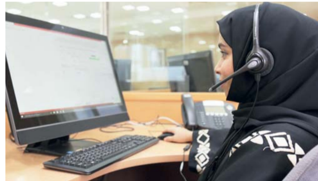
الاستطلاع يوفر بيانات دقيقة حول سلوكيات استهلاك المياه

مسقط . العمانية: سجل إجمالي عدد المركبات المسجلة في سلطنة عُمان ارتفاعاً بنسبة ٥,٥ بالمائة حتى نهاية شهر مارس ٢٠٢٦م، ليبلغ مليوناً و٨٧٣ ألفاً و٨٠٣ مركبات، مقارنة بالفترة ذاتها من عام ٢٠٢٥م. وأظهرت بيانات صادرة عن المركز الوطني للإحصاء والمعلومات أن المركبات الخصوصية استحوذت على النصيب الأكبر من إجمالي المركبات المسجلة في سلطنة عُمان، بنسبة ٧٩,٢ بالمائة وبعد مليون و٤٨٤ ألفاً و٧١٨ مركبة، تلتها المركبات التجارية بنسبة ١٤,٨ بالمائة وبعد ٢٧٦ ألفاً و٨٨٧ مركبة، ثم مركبات التاجير بنسبة ٢,٤ بالمائة وبعد بلغ ٤٤ ألفاً و٩٥٨ مركبة، فيما توزعت النسب المتبقية بين مركبات الأجرة، والمركبات الحكومية.. وغيرها. أما من حيث الألوان، فقد تصدر اللون الأبيض للمركبات قائمة الألوان الأكثر تسجيلاً بنسبة ٤٢,٢ بالمائة، وبعد ٧٨٩ ألفاً و٨٥٠ مركبة، تلاه اللون الفضي بنسبة ١٢,٨ بالمائة وبعد ٢٤٠ ألفاً و٦٧٥ مركبة، تلتها المركبات الرمادية بنسبة ١٠,٥ وبعد ١٩٧ ألفاً و٦٨٣ مركبة. وفيما يتعلق بسعة المحرك، سجلت المركبات ذات سعة المحرك بين ١٥٠٠ إلى ٣٠٠٠ سم 3 أعلى نسبة من إجمالي المركبات المسجلة بلغت ٥٤,٤ بالمائة، بعد مليون و١٩٠ ألفاً و٧٥٩ مركبة، تلتها فئة المركبات بين ٣٠٠١ إلى ٤٥٠٠ سم 3 بنسبة ٢٢,١ بالمائة لتبلغ ٤١٣ ألفاً و٧١٩٩ مركبة. وبينت الإحصاءات أن المركبات التي يقل وزنها عن ٣ أطنان شكلت النسبة الأكبر من إجمالي المركبات المسجلة، بنسبة ٩٠,٧ بالمائة، وبعد مليون و٦٩٩ ألفاً و٩٨٨ مركبة.