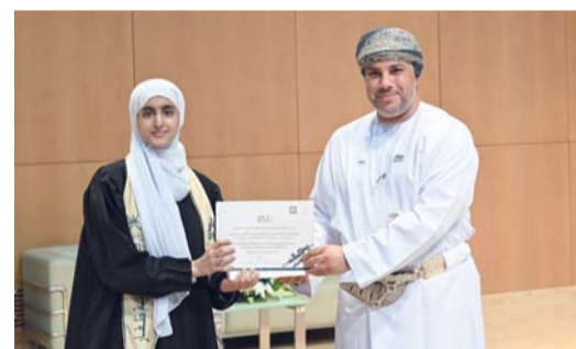
تسليم الشهادات والجوائز للطلبة المجيدين

مسقط . العُمانية: احتفلت المديرية العامة للتعليم بمحافظة ظفار، بتكريم الطلبة المجيدين في التحصيل الدراسي للفصل الدراسي الأول من العام الدراسي الحالي ٢٠٢٥ / ٢٠٢٦م، البالغ عددهم (٦١٢) طالباً وطالبة بمجمع السلطان قابوس الشباني للثقافة والترفيه بصلالة. رعى الاحتفال صاحب السمو السيد مروان بن تركي آل سعيد محافظ ظفار. وقالت الدكتورة ميزون بنت بحيث الشكري المديرية العامة للمديرية العامة للتعليم بمحافظة ظفار في كلمة ألقاها إن وزارة التعليم انتهجت نهجاً علمياً رصيناً في رعاية الطلبة وتنمية قدراتهم من خلال توفير بيئات تعليمية محفزة وبرامج نوعية تسهم في صقل مهاراتهم وإكسابهم المعارف والخبرات التي تؤهلهم للمنافسة والتميز. وتضمن برنامج الاحتفال كلمة الطلبة المكرمين، وفقرة طلابية بعنوان «حوار الأجيال»، وعرضاً طلابياً إنشادياً بعنوان «بلاد السلام»، إلى جانب لوحة فن البرعة. وفي الختام، قام صاحب السمو محافظ ظفار راعي المناسبة بتسليم الشهادات والجوائز للطلبة المجيدين في التحصيل الدراسي بمدارس تعليمية ظفار حيث شمل التكريم الطلبة من الصف الخامس إلى الصف الثاني عشر وفق النسب العليا المعتمدة، وتكريم طلبة التربية الخاصة وطلبة التعليم المهني والتقني (تخصص السفر والسياحة)، إلى جانب تكريم المؤسسات والجهات المسهمة في تنظيم الاحتفال.