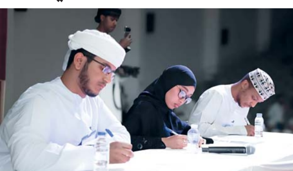
المنافسات تستمر أسبوعاً كاملاً