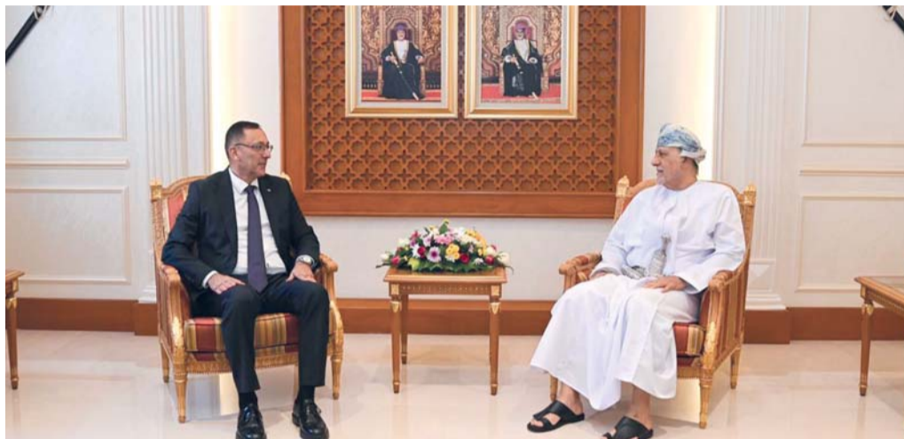
شهاب بن طارق يستقبل أحمد الرويضي

مسقط . العُمانية: استقبل صاحب السمو السيد شهاب بن طارق آل سعيد نائب رئيس الوزراء لشؤون الدفاع، بمكتبه بمعسكر المرتفعة سعادة أحمد محمود الرويضي سفير دولة فلسطين المعتمد لدى سلطنة عُمان. وقد رحب صاحب السمو السيد نائب رئيس الوزراء لشؤون الدفاع بسعادة السفير، وتم خلال المقابلة استعراض العلاقات الثنائية الوطيدة التي تجمع سلطنة عُمان ودولة فلسطين الشقيقة، إلى جانب تبادل وجهات النظر وبحث عدد من المستجدات على الساحتين الإقليمية والدولية.