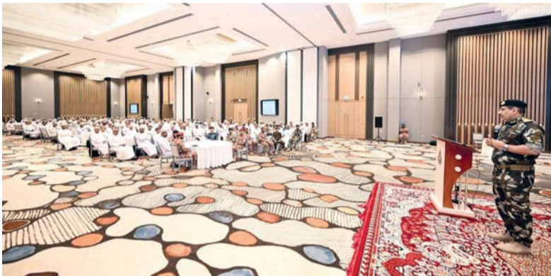
التأكيد على جاهزية البعثة