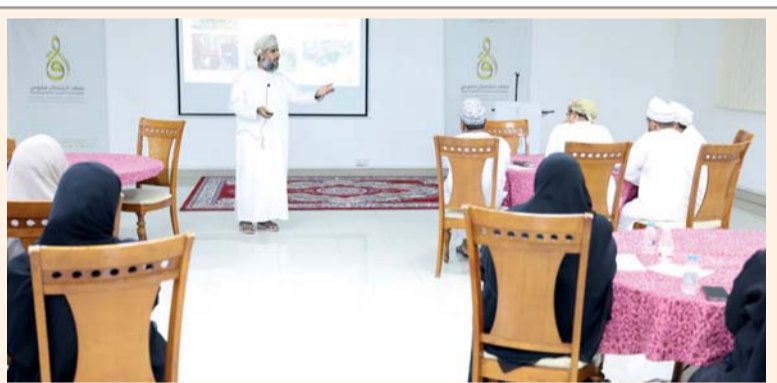
البرنامج يولي اهتماماً خاصاً بتوظيف التكنولوجيا في تعليم اللغة العربية