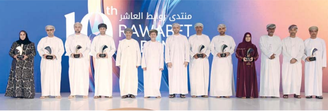
■ التكامل بين الشركات يعد ضرورة لتعظيم العوائد الاقتصادية وتحقيق الأثر المستهدف

جائزة دعم المؤسسات الصغيرة والمتوسطة والشركات الناشئة فضاء لتميزها في دعم وتمكين المؤسسات الصغيرة والمتوسطة ودمجها في سلاسل التوريد. كما يأتي فوز عائلته بجائزة الاستثمار الاجتماعي عن مشروع «مقروء» الذي تميز بابتكار نوعي لخدمة ذوي عسر القراءة كأول مبادرة من نوعها باللغة العربية.