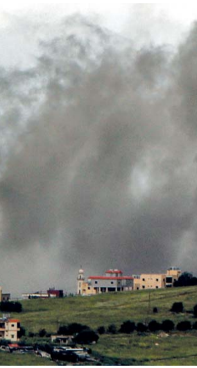
الدخان يتصاعد جراء غارة جوية «إسرائيلية» على قرية كفر تبنيت جنوب لبنان.

عواصم . العُمانية: بلغ سعر نفط عمان الرسمي تسليم شهر يوليو القادم ١٠٦ دولارات أميركية و١٦ سنتاً. وشهد سعر نفط عُمان أمس ارتفاعاً بلغ ٤ دولارات أميركية و١٢ سنتاً، مقارنة بسعر يوم الاثنين والبالغ ١٠٢ دولار أميركي و٤ سنتات. وعلى الصعيد العالمي تراجعت أسعار النفط أمس بعد قفزة قاربت ٦ بالمائة في الجلسة السابقة. وانخفضت العقود الآجلة لخام برنت لشهر يوليو القادم ٦٨ سنتاً، أو ٠,٦ بالمائة، إلى ١١٣,٧٦ دولار للبرميل، وانخفض خام غرب تكساس الوسيط الأميركي ١,٥٩ دولار، أو ١,٥ بالمائة.