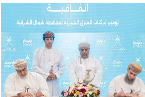
التوقيع على الاتفاقية

إبراء . من ماجد المحرزي والعُمانية: وقّع مكتب محافظ شمال الشرقية على اتفاقية توفير مركبات لفرق الخيرية بولايات المحافظة مع الشركة العُمانية الهندية للسماذ «أوميفكو» في إطار تعزيز الشراكة بين القطاعين الحكومي والخاص، وانسجاماً مع التوجهات الوطنية الداعمة لتعزيز العمل المجتمعي. تتضمن الاتفاقية توفير عدد من المركبات لفرق الخيرية في جميع ولايات محافظة شمال الشرقية ونياحة سمد الشأن بولاية المسيبي، إذ تهدف هذه الاتفاقية إلى رفع كفاءة الأداء الميداني للفرق وتوسيع نطاق خدماتها الإنسانية، وبموجب الاتفاقية البرمة يتولى مكتب المحافظ الإشراف على تنفيذ المشروع وفق الأطر التنظيمية والفنية المعتمدة. وتؤكد هذه الاتفاقية على التزام الجانبين بتعزيز مبادرات المسؤولية الاجتماعية وترسيخ التكامل المؤسسي، بما يعكس إيجاباً على تنمية المجتمع المحلي، حيث تمتد مدة تنفيذ الاتفاقية لعامين كاملين، مع الالتزام بتطبيق أعلى معايير الحوكمة والشفافية في التنفيذ، بما يحقق الأهداف التنموية المرجوة ويعزز استدامة العمل الخيري بالمحافظة. وقع على الاتفاقية من جانب مكتب محافظ شمال الشرقية سعادة محمود بن يحيى الذهلي محافظ شمال الشرقية، ومن جانب الشركة العُمانية الهندية للسماذ «أوميفكو» عبد الله بن حميد الهشامي الرئيس التنفيذي المالي للشركة.