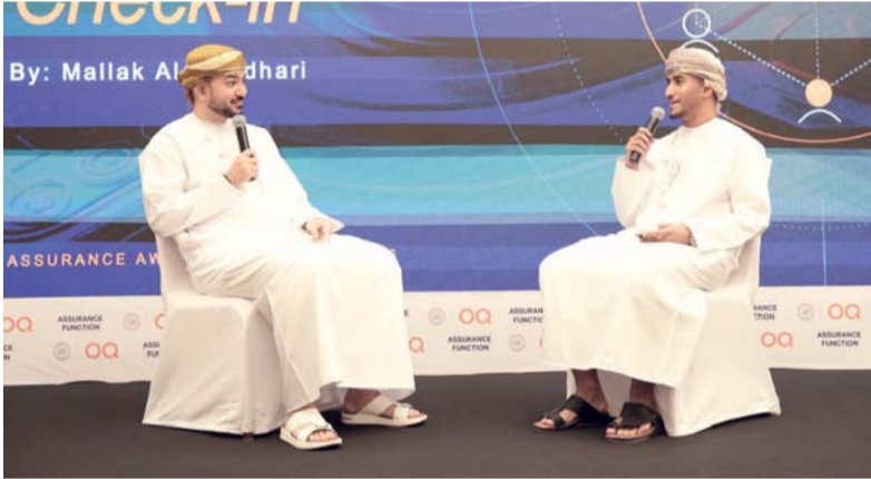
المبادرة تسهم في تعزيز ممارسات الحوكمة وإدارة المخاطر