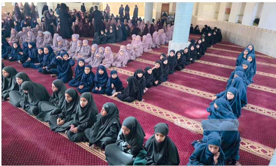
■ فتيات يشاركن في حلقات تحفيظ القرآن الكريم في خان يونس جنوب قطاع غزة.

الشهداء منذ بدء وقف إطلاق النار في 10 أكتوبر الماضي إلى 830 شهيداً، إضافة إلى 2345 إصابة، إلى جانب تسجيل 767 حالة انتقال. من جانب آخر دعت محافظة القدس أبناء الشعب الفلسطيني إلى شد الرحال إلى المسجد الأقصى والتواجد المكثف فيه لأفئدة مخططات تقودها منظمات إسرائيلية لاقترام المسجد يوم الجمعة بعد القادم. وحذرت محافظة القدس، في بيان صحفي أوردته وكالة الأنباء والمعلومات الفلسطينية (وفا)، من «حملة تقودها ما تسمى «منظمات الهيكل»، بالتعاون مع شخصيات سياسية في حكومة الاحتلال، لفرض اقتحام المسجد الأقصى المبارك يوم الجمعة الموافق 10 من الشهر الجاري، في خطوة تصعيدية خطيرة تهدف إلى تغيير الواقع التاريخي والقانوني القائم في المسجد الأقصى، وفرض سوابق غير مسبوقة تمس بحرمة المكان ومكانته الدينية».