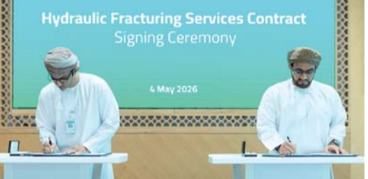
العقد يسهم في تنويع الاقتصاد الوطني على المدى البعيد