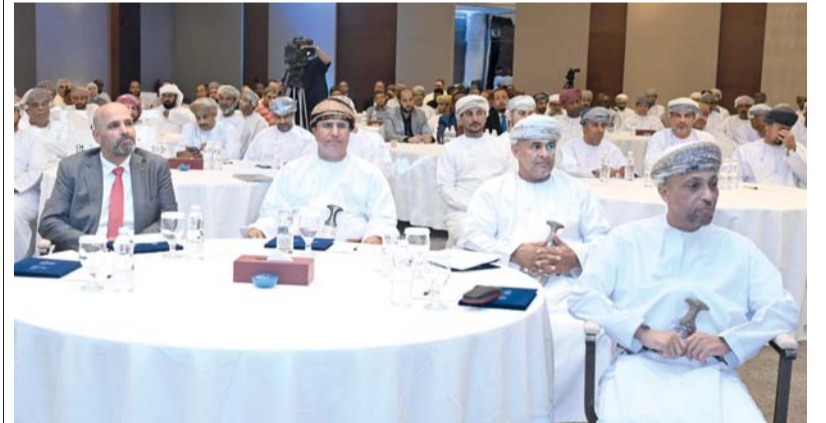
الملتقى فرصة مهمة لتبادل أفضل الممارسات لتنمية قطاع الثروة الحيوانية