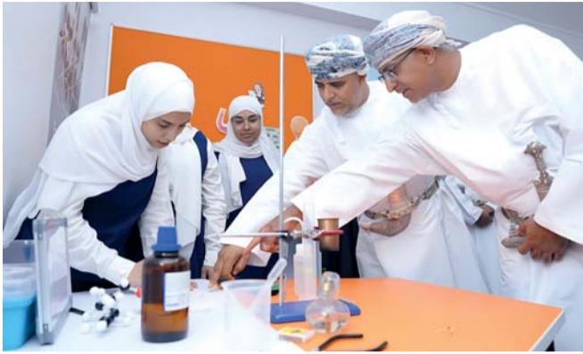
تمكين الطلبة وتعزيز مهاراتهم التعليمية والحياتية

الوظيفي والدعم السلوكي والانفعالي، مما يساهم في تحسين التحصيل الدراسي، وتعزيز الانتباه والتركيز، وتنمية المهارات الحركية والتواصلية، إضافة إلى دعم الجوانب النفسية والانفعالية. وفي السياق ذاته يهدف مشروع «ستيم عمان» إلى تطوير أساليب تدريس العلوم والتقنية والهندسة والرياضيات بأسلوب تفاعلي قائم على التطبيق العملي وربط التعلم بالحياة اليومية. ويستهدف المشروع طلبة الصفوف من الثامن إلى العاشر، حيث تم تطبيقه في (15) مدرسة موزعة على أربع ولايات بالمحافظة. ويمثل تنفيذ هذين المشروعين نموذجاً للتكامل بين دعم التربية الخاصة وتطوير التعليم العام، من خلال الجمع بين التأهيل المهني والتطبيق الميداني والشراكة مع القطاع الخاص، بما ينعكس إيجاباً على جودة التعليم وتمكين الطلبة في محافظة جنوب الشرقية.