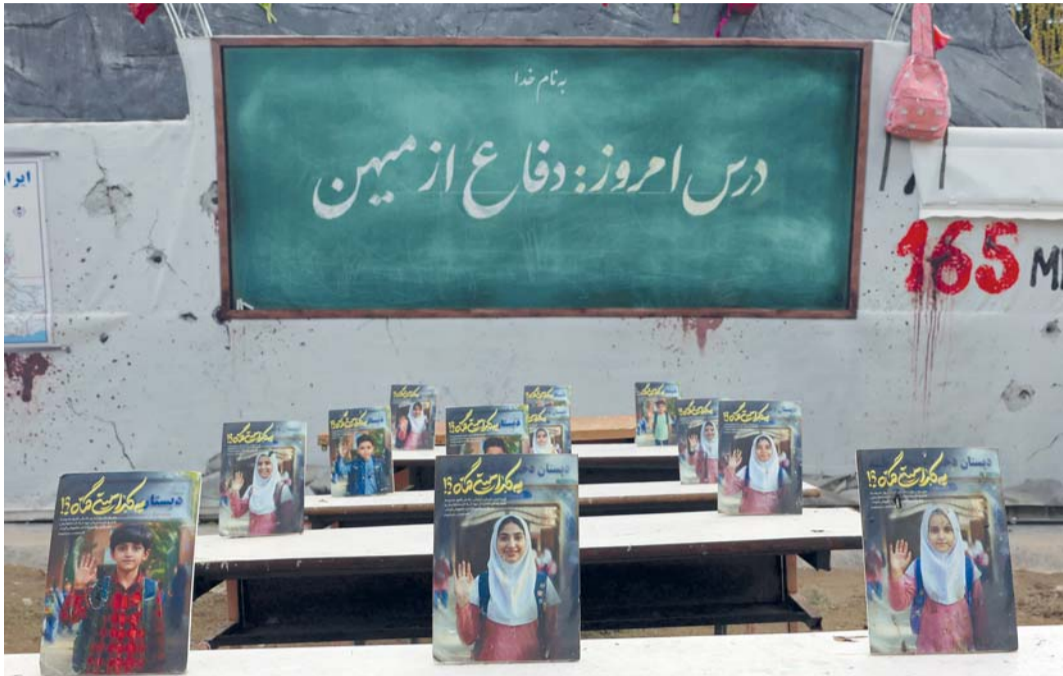
■ نصب تذكاري يصور فصلاً دراسياً رمزياً لأطفال مدرسة ميناب، معروضاً في ساحة بطهران حيث وقع هجوم دام على المدرسة في اليوم الأول من الحرب ما أسفر عن مقتل ٧٣ فتى و٤٧ فتاة.

وأعلن الرئيس الأميركي أن الولايات المتحدة ستواكب السفن في مضيق هرمز اعتباراً من الإثنين، وأشار إلى أن «دولا من مختلف أنحاء العالم» طلبت ذلك. وجاء في منشور له «خدمة لمصالح إيران»