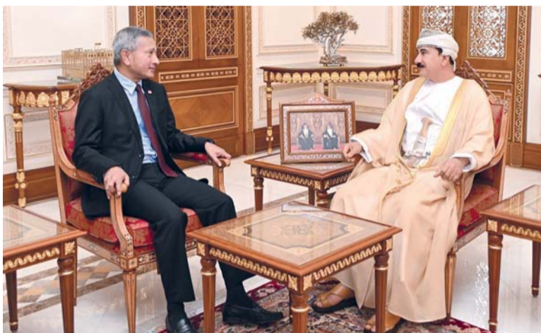
سلطان النعماني يستقبل فيفيان بالكريشنان

مسقط. العُمانية: استقبل معالي الفريق أول سلطان بن محمد النعماني وزير المكتب السلطاني بمكتبه معالي الدكتور فيفيان بالكريشنان وزير خارجية جمهورية سنغافورة والوفد المرافق له. جرى خلال المقابلة استعراض العلاقات الثنائية ومجالات التعاون القائمة بين سلطنة