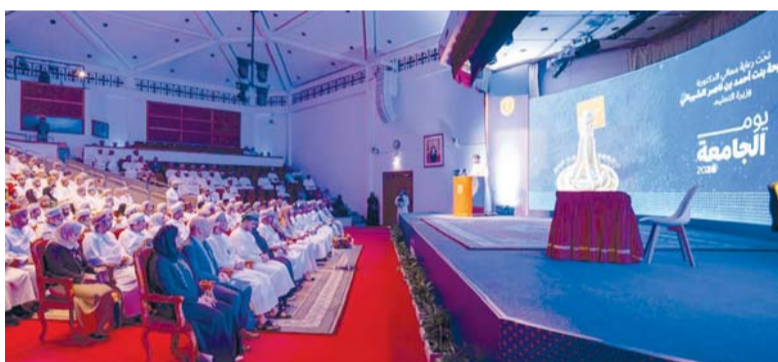
بلغ عدد البحوث الفائزة 9 بحوث

كما تم توقيع رسالة تفاهم بين جامعة السلطان قابوس وشركة أوكسيدنتال عُمان، شملت مجالات البحث العلمي والتدريب وتطوير الكفاءات، وذلك في خطوة تعزز التعاون القائم بين الجانبين، وترسخ الربط بين القطاعين الأكاديمي والصناعي.