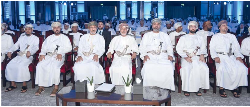
الملتقى يناقش استشراف مستقبل العقود الهندسية