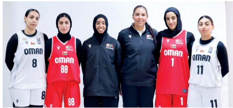
■ منتخب السلة الثلاثي

كما يخوض منتخب كرة السلة (٣×٣) للسيدات المنافسات بوفد يضم أربع لاعبات واثنين من الأجهزة الفنية والإدارية.