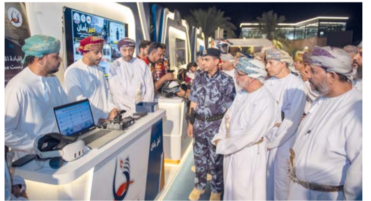
رفع مستوى الوعي المروري لدى أفراد المجتمع واتباع الإرشادات المرورية في الطرق العامة

أسبوع المرور في «الواحة مول» بولاية صحار مسرح خاص بالطفل قدمت فقرات توعوية بأساليب تفاعلية جاذبة.