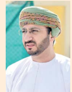
■ معتمد الزنجالي

ويضم الوفد الرسمي لبطولة السلطنة عُمان كلاً من صاحب السمو السيد عزان بن قيس آل سعيد رئيساً للبعثة، وعبدالله بن محمد باخمالف أمين عام اللجنة الأولمبية العُمانية، والدكتور مروان بن جمعة آل جمعة نائب رئيس البعثة، ويدر