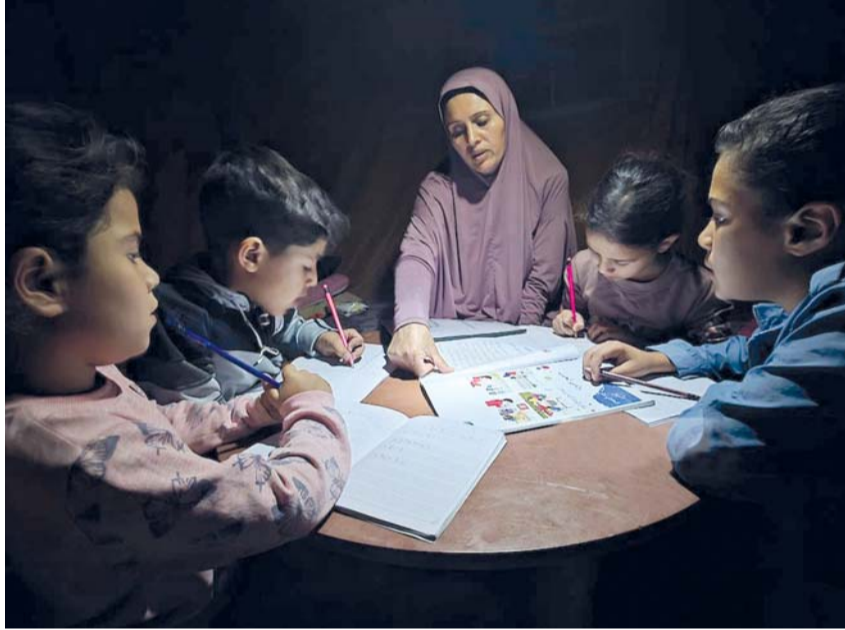
أم تدرس أبناءها وأبناء شقيقتها الذين فقدوا والدتهم داخل خيمة في مواصي خان يونس، وسط انقطاع تام للكهرباء وتدهور الأوضاع المعيشية في قطاع غزة.

طهران. عواصم. وكالات: قال المتحدث باسم وزارة الخارجية الإيرانية إسماعيل بقائي إن بلاده تدرس الرد الأميركي على إيران ومبادرة ذات النقاط الأربع عشرة، فيما كشفت مصادر وصفتها وسائل إعلام باكستانية بالمطلعة أن المفاوضات بين واشنطن وطهران أحرزت تقدماً ملحوظاً خلال الفترة الأخيرة. وقال بقائي لقد «تلقينا الرد الأميركي عبر باكستان، ولن نطرق إلى التفاصيل لأنها قيد المراجعة».