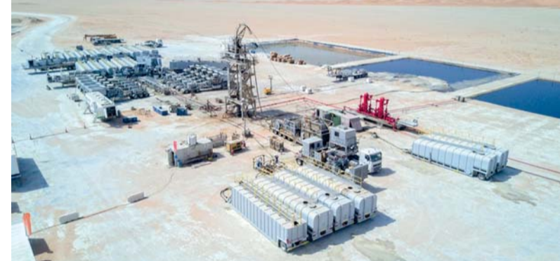
الشراكة تعزز تنافسية قطاع الطاقة في سلطنة عُمان

مكاتبها كمشروع وطنية في استخراج احتياطي الهيدروكربونات، ويعد نمواً على المدى الطويل في سوق تنافسية، مؤكداً على التزام الشركة الدائم بتعزيز الشراكات المستدامة وتقديم قيمة مضافة عبر قطاع الطاقة. ومن خلال هذه الشراكات، تعزز شركة تنمية نفط عُمان دورها في استدامة قطاع الطاقة وتنويع الاقتصاد الوطني على المدى البعيد، والاعتماد على الابتكار وعقد الشراكات وتطوير الكفاءات الوطنية.