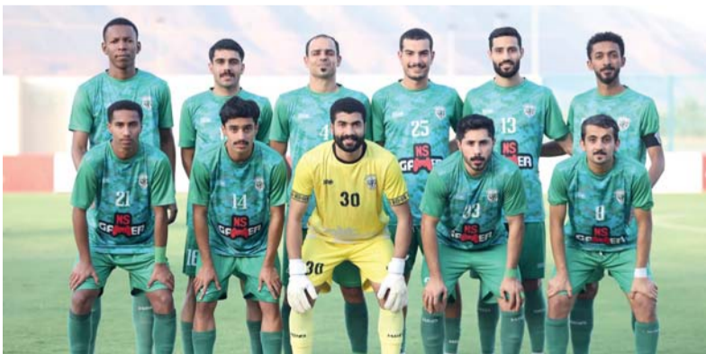
■ فريق سمائل

مباراة هي بمثابة الفرصة الحقيقية لتحقيق هدف كل من الفريقين، خاصة وأننا في سباق الامتار الاخيرة التي لا تحتتمل الهفوات إطلاقاً، ولا تلتفت لعطايا الآخرين، فالجميع الآن يحتاج إلى النقاط الكاملة دون نقصان، خاصة وأن هناك فرقا تترصد بكليهما سواء كانت في مراكز المقدمة أو صراع الهبوط، فمن يكسب التحدي في أمسية اليوم.