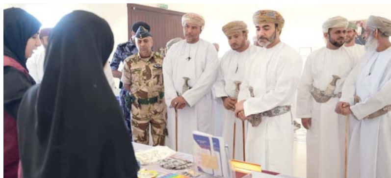
تعزيز الوعي المجتمعي بمخاطر المؤثرات العقلية

الندوة أربعة محاور رئيسية؛ ركز المحور الصحي على الآثار الصحية للمخدرات والمؤثرات العقلية، فيما استعرض المحور الأمني دور الجهات المختصة في مكافحة هذه الظاهرة والعقوبات المترتبة عليها، وسلط المحور الإعلامي الضوء على دور وسائل التواصل الاجتماعي بين مخاطر الترويج وأهمية التوعية، إلى جانب محور مجتمعي يعزز دور الأسرة في الوقاية وشهدت الندوة تدشين كتيب