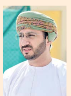
■ معتمد الزنجالي

ويتضمن كذلك جدول الاعمال مناقشة تشكيل اللجان بالاتحاد وهي اللجنة المالية ولجنة المسابقات ولجنة المنتخبات ولجنة التسويق والاعلام ولجنة نشر اللعبة والتطوير الفني او اي لجان يراها المجلس مناسبة بالإضافة الى مناقشة توصيات اجتماع الموظفين والمدربين وتعيين خبير فني وكبير مدربين ومدربين الدعوة الواردة من الاتحاد الدولي والاتحاد الآسيوي الخاص