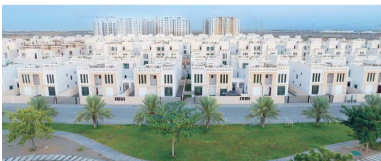
دعم وتعزيز الاستقرار الاجتماعي

وقال إن إدارة بنك الإسكان العماني تحرص على أن يصل التمويل السكني إلى مختلف محافظات سلطنة عُمان دون استثناء، وأن يكون أداة حقيقية لاستقرار الاجتماعي وتحسين جودة الحياة للمواطنين، والتوسع في حجم وعدد التمويلات خلال عامي ٢٠٢٤ و٢٠٢٥، مشيراً إلى أن هذا التوجه يعكس بوضوح سعي الإدارة المستمر لتبسيط الإجراءات وتسريع تقديم الخدمات عبر التحول الرقمي والشراكات المصرفية الفاعلة.