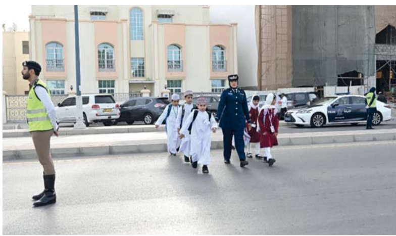
■ تعزيز ثقافة السلامة المرورية

مسقط، «الوطن»: تبدأ اليوم فعاليات أسبوع المرور الخليجي الثامن والثلاثين الذي تنظمه شرطة عُمان السلطانية بشعار «أعبر بأمان» ويستمر حتى ٧ مايو الجاري، بمشاركة المؤسسات الحكومية وشركات القطاع الخاص ذات العلاقة. ووضَّح العميد مهندس علي بن سليم الفلاحي مدير عام المرور بشرطة عُمان السلطانية لوكالة الأنباء العُمانية أن شعار أسبوع المرور الخليجي لهذا العام «أعبر بأمان» يحمل رسالة توعوية تركز على حماية المشاة والحد من حوادث الدهس ويعكس عدة دلالات، منها تعزيز ثقافة السلامة المرورية في استخدام ممرات المشاة والالتزام بالإشارات المرورية، كما يقلل العبور الآمن من الحوادث والإصابات خصوصاً في الأماكن المزدحمة، والطرق السريعة أمام المدارس والأسواق. وقال إن أسبوع المرور الذي تنظمه شرطة عُمان السلطانية معتملة بالإدارة العامة للمرور من أهم الفعاليات التوعوية والتي لها دور في تعزيز السلامة على الطريق، حيث تمثل أهمية في رفع الوعي المروري والحد من الحوادث المرورية، إضافة إلى تثقيف الطلبة وتعزيز المسؤولية المجتمعية من خلال دعم الشراكة المؤسسية بين مختلف