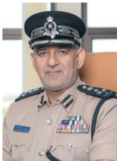
■ علي الفلاحي

المراكز التجارية والأماكن الخاصة في كافة المحافظات، وتنظيم المحاضرات والدورات التثقيفية في المدارس والجامعات والجهات الحكومية والخاصة وعقد اللقاءات الإذاعية والتلفزيونية وإقامة ندوة تشاورية تشاركية مع عدة جهات حكومية وخصوصاً حول موضوع سلامة المشاة مسؤولية الجميع. وأكد على أن واقع السلامة المرورية في سلطنة عُمان يشهد تحسناً ملحوظاً خلال السنوات الماضية ويُعزى ذلك للجهود المبذولة من قبل الإدارة العامة للمرور على كافة الأصعدة الرقابية والإصلاحية. وحول تأثيرات التقنيات الحديثة في تعزيز السلامة المرورية أشار العميد مهندس علي بن سليم الفلاحي مدير عام المرور بشرطة عُمان السلطانية إلى أن التقنيات الحديثة أسهمت في إحداث نقلة نوعية في تقليل الحوادث المرورية من خلال التوجه الذي سعت إليه الإدارة العامة للمرور نحو استخدام تقنيات الذكاء الاصطناعي في رصد المخالفين للمخالفات التي نص عليها قانون المرور ولائحته التنفيذية، مما أسهم في تقليل الحوادث المرورية. وأفاد بأن الحملات التوعوية التي تنفذها الإدارة العامة للمرور ممثلة في معاهد السلامة المرورية تقوم بدور محوري في نشر ثقافة السلامة المرورية والسياسة الوقائية من خلال إعداد خطط وبرامج توعوية تستهدف جميع فئات المجتمع، والذي يتم من خلال