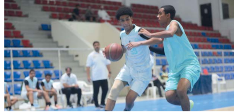
مباريات جيدة قدمها لاعبو المراكز

اختتم منتخبنا الوطني للشباب لكرة القدم معسكره الداخلي بمحافظة مسقط يوم أمس بعد أن خاض تجربة ودية أمام منتخب الجيش السلطاني العماني يوم الجمعة انتهت بالتعادل الإيجابي بهدف لكل فريق في مباراة أتحاحت لجهاز الفني فرصة مهمة لتقييم جاهزية اللاعبين وجاءت هذه المواجهة ضمن برنامج الإعداد الذي يقوده المدرب الوطني حمد العزاني حيث سعى من خلاله إلى الوقوف على المستويات الفنية والبدنية لعناصر المنتخب ومدى استيعابهم وتطبيقهم للخطط والتكتيكات التي تم العمل عليها طوال فترة المعسكر الداخلي. ويعد هذا المعسكر محطة أساسية في إطار تحضيرات المنتخب للمشاركة في بطولة