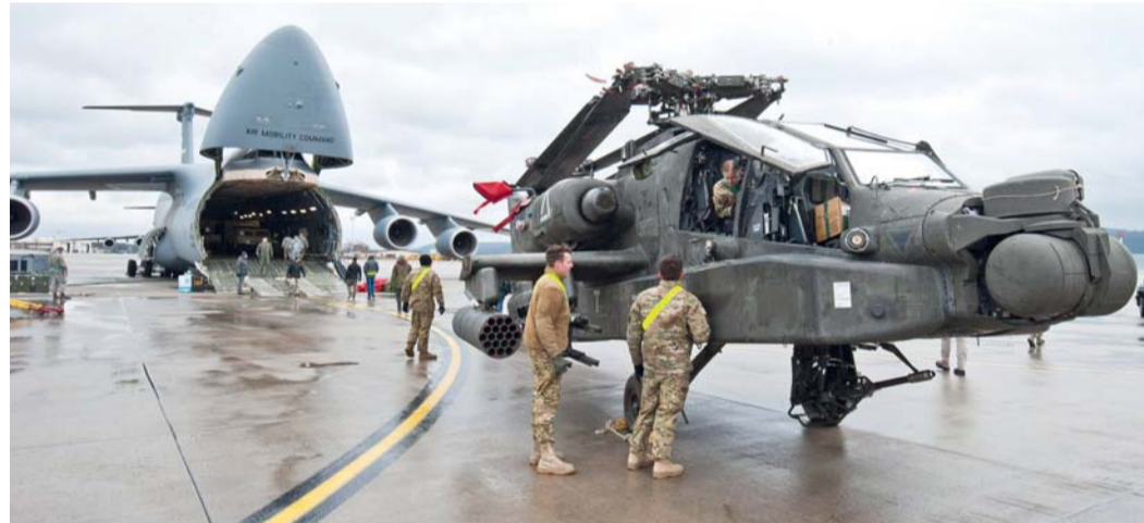
مروحية هجومية من طراز AH-64 أباتشي تقف أمام طائرة نقل من طراز غلاكسي C-5 في قاعدة رامشتاين الجوية الأميركية غرب ألمانيا.

وكان دونالد ترامب قد أثار في الأيام الماضية إمكانية تقليص القوات العسكرية الأميركية المتمركزة في ألمانيا، العضو في حلف شمال الأطلسي (ناتو)، عقب تصريحات أدلى بها المستشار فريدريش ميرتس.