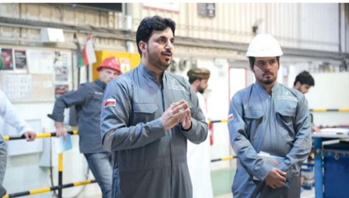
■ الاحتفال يؤكد على أهمية الحركة النقابية في سلطنة عمان

الاحتفال يؤكد على أهمية الحركة النقابية في سلطنة عمان. واعتمد الاتحاد العام لعمال سلطنة عُمان جائزة العمل النقابي، لتكريم عدد من النقابات العمالية والجهات الحكومية والمنشآت الخاصة ومؤسسات المجتمع المدني أو ممثلي هذه الجهات، التي تسهم في دعم العمل النقابي وتطويره؛ بما يساعد على تحقيق التوازن في سوق العمل، ويضمن الاستقرار الاقتصادي والاجتماعي، وتهدف الجائزة إلى تحفيز كل الفئات المستهدفة لبذل المزيد من الجهد المستمر وتطوير الحركة النقابية. يُذكر أن إجمالي عدد النقابات العمالية في سلطنة عُمان حتى نهاية شهر ديسمبر ٢٠٢٥ بلغ نحو ٣٤٠ نقابة عمالية.