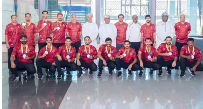
لقطة جماعية لمنتخب القدم الشاطئية