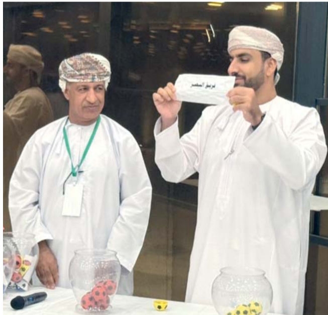
من سحب قرعة البطولة

من جانبها اكدت اللجنة المنظمة للبطولة اكتمال كافة الاستعدادات لانطلاق المنافسات التي يتوقع ان تشهد حضورا جماهيريا واسعا.