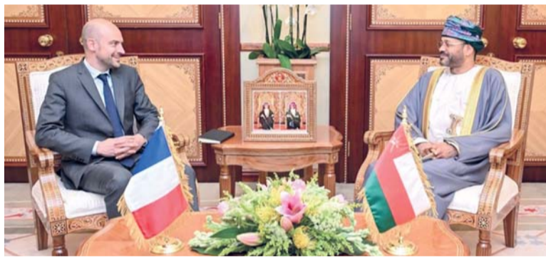
بدر بن حمد يستقبل جان نويل بارو

العماني سعادة السفير إدريس بن عبد الرحمن الخنجري، المندوب الدائم لسلطنة عمان لدى الأمم المتحدة والمنظمات الدولية في جنيف، وعن معهد الأمم المتحدة سعادة ميشيل جايلز - ماكدونو، الأمينة العامة للمساعدة للأمم المتحدة والمديرة التنفيذية لمعهد الأمم المتحدة للتدريب والبحث.