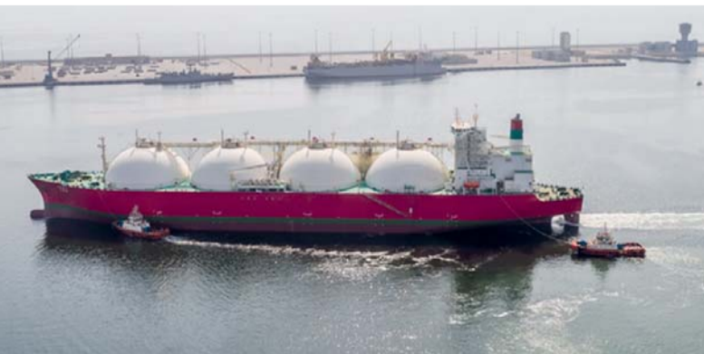
■ ارتفاع إجمالي إنتاج سلطنة عمان من النفط بنسبة ٤,٨ بالمائة مارس الماضي

ارتفاع إجمالي إنتاج سلطنة عمان من النفط بنسبة ٤,٨ بالمائة مارس الماضي. وأظهرت الإحصاءات الأولية الصادرة عن المركز الوطني للإحصاء والمعلومات أن متوسط سعر النفط انخفض بنسبة ١٦,٥ بالمائة ليبلغ ٦٢,٩ دولار أميركي للبرميل حتى نهاية شهر مارس ٢٠٢٦، مقارنة بـ ٧٥,٣ دولار أميركي للبرميل خلال الفترة المماثلة من عام ٢٠٢٥. وأعلى صعيد الإنتاج، فارتفع متوسط الإنتاج اليومي من النفط بنسبة ٤,٨ بالمائة، ليبلغ مليوناً و٣٤٠ ألف برميل يومياً حتى نهاية شهر مارس ٢٠٢٦، مقارنة بـ ٩٨٦ ألفاً و٨٠٠ برميل يومياً خلال الفترة المماثلة من العام الماضي.