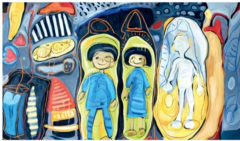
■ ألوان ألواح الفنان تتراوح بين الأصفر والبرتقالي الدافئ والرمادي الغامضة

تعريف للشخصية، بل يصبح أثراً عابراً وميضاً حقيقيّة روحية وجودية يصعب الإمساك بها، مما يفتح حواراً عميقاً بين الذات وبين الذاكرة الجماعية حول ما لا يمكن تقييده أو نسيانه. ■ كنت من مؤسسي (جماعة الدائرة) التي أحدثت هزة في المشهد التشكيلي العماني عام ١٩٩٩، بعد مرور أكثر من ربع قرن، هل تعتقد أن (الدائرة) اكتسبت، أم أن الفن العماني ما زال بحاجة إلى (دوائر) جديدة من التمرد الفني؟