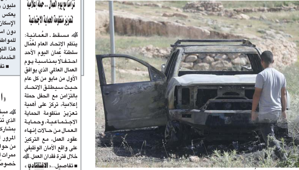
فلسطيني يعاين مركبة أحرقتها المستوطنون في وادي الرخيم قرب بلدة يطا جنوب الخليل. الصورة من وفاء، القدس المحتلة. «الوطن».. وكالات: