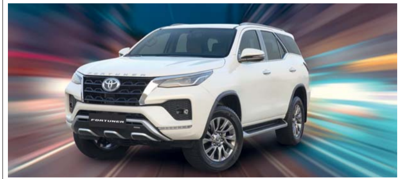
فورشر بمواصفات متميزة

تتميز تجربة قيادة تويوتا «فورشر» بمجموعة محركاتها الرائعة والمصممة لتلبية الاحتياجات الخاصة لكل سائق، ويوفر محرك الأسطوانات الأربع سعة ٢,٧ لتر قوة ١٦٤ حصاناً وعزم دوران ٢٥٠,٠ كجم لكل متر، كما يوفر محرك سعة ٤,٠ لتر نحو ٦ أسطوانات على شكل «V» أداءً مذهلاً، بقوة ٢٣٥ حصاناً وعزم دوران ٣٨,٣ كجم لكل متر مما يمكنه من اجتياز الطرق الوعرة والطرق السريعة المفتوحة بكل سهولة، ويعمل كلا المحركين بتناغم تام مع ناقل حركة آلي متطور ٦ سرعات مما يضمن سلاسة تغيير التروس مع تحسين استهلاك الوقود في جميع الرحلات من الطرق الساحلية إلى الكثبان الرملية الصحراوية. ويستقبل الركاب في فورشر بمقصورة راقية، حيث تم الاهتمام بأبواب التفصيل بعناية فائقة وتمتيز المقصورة بمقاعد جلدية فاخرة وكسوة جلدية وتطعيمات خشبية على عجلة القيادة المزودة بمبدلات