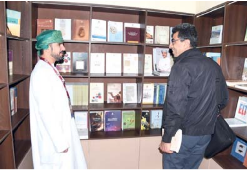
■ الجناح العماني يضم باقة متنوعة من الإصدارات الحديثة