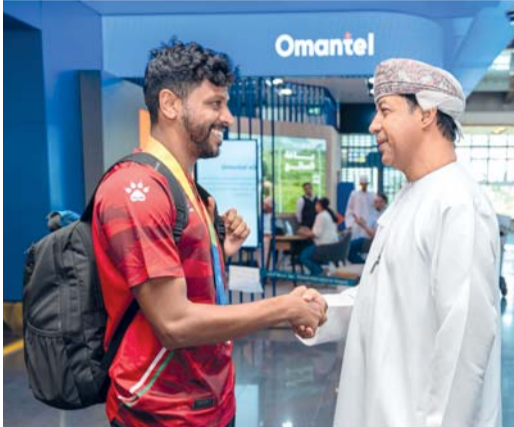
من استقبال البعثة