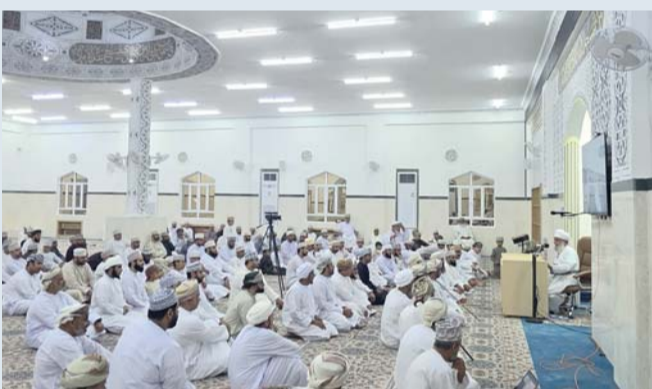
■ المسجد بني وفق الطراز الإسلامي بهندسة معمارية بديعة

المواضع، وغرفة خاصة للإمام وتم تزويد المسجد بأجهزة التحكم بالصوتيات والمراقبة. وألقى الشيخ سالم النعماني محاضرة دينية بعنوان: «رسالة المسجد... من لها» تناول فيها المكانة العظيمة للمسجد ودوره المركزي في تنشئة الأجيال وصناعة الإنسان الصالح الذي يعمر الأرض بالخير والهدى، مبيناً أن المسجد لم يكن عبر التاريخ مجرد مكان أداء الصلوات بل كان مدرسة تربوية ومنارة علم، ومركز إشعاع روحي واجتماعي يلتقي فيه الناس على كلمة سواء. وتوقف الشيخ عند دور القائمين على المسجد من أئمة ومؤنثين ومعلمين، موضحاً بأن مسؤوليتهم تتجاوز أداء الشعائر لله.