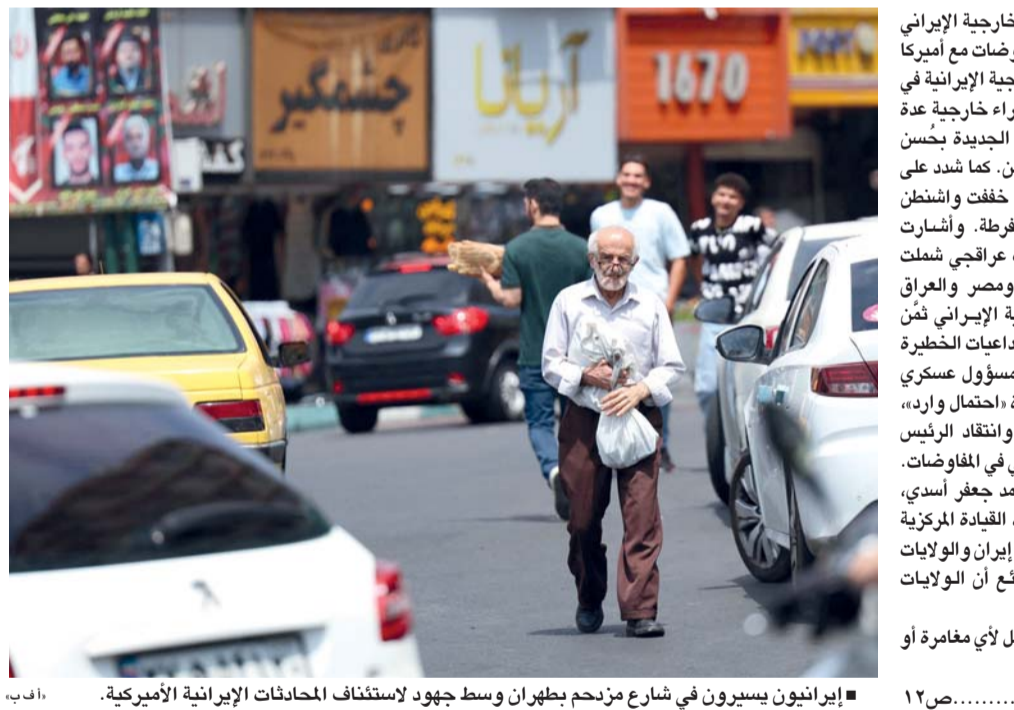
إيرانيون يسرون في شارع مزدحم بطهران وسط جهود لاستئناف المحادثات الإيرانية الأميركية.

طهران. عواصم. وكالات: أعلن وزير الخارجية الإيراني عباس عراقجي دخول جولة جديدة من المفاوضات مع أميركا بوساطة باكستان، حيث ذكرت وزارة الخارجية الإيرانية في بيان أن عراقجي أكد خلال اتصالات مع وزراء خارجية دول بالمنطقة، أن طهران تدخل المفاوضات الجديدة بحسن نية لإنهاء الحرب رغم انعدام الثقة بواشنطن. كما شدد على أن إيران مستعدة لمواصلة الدبلوماسية إذا خففت واشنطن من خطابها التهديدي وغيرت مطالبها المفرطة. وأشارت وزارة الخارجية الإيرانية إلى أن اتصالات عراقجي شملت وزراء خارجية تركيا وقطر والسعودية ومصر والعراق وأذربيجان. وأضافت أن وزير الخارجية الإيراني ضمن مساعي بعض دول المنطقة للحيلولة دون التدهبات الخطيرة لأي عدوان عسكري جديد. من جانبه قال مسؤول عسكري إيراني إن تجدد الحرب مع الولايات المتحدة «احتمال وارد»، في ظل استمرار تعثر محادثات السلام وانتقاد الرئيس الأميركي دونالد ترامب لأحدث مقترح إيراني في المفاوضات. ونقلت وكالة أنباء فارس الإيرانية عن محمد جعفر أسدي، نائب رئيس الفتح في مقر خاتم الأنبياء القيادة المركزية للقوات المسلحة، قوله إن «تجدد الصراع بين إيران والولايات المتحدة احتمال وارد، وقد أظهرت الوقائع أن الولايات المتحدة لا تلتزم بأي وعود أو اتفاقيات». وأضاف «القوات المسلحة مستعدة بالكامل لأي مغامرة أو لأي عمل متهور من جانب الأميركيين». تفاصيل... ص ١٢