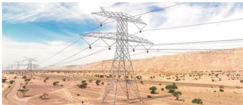
الشركة تواصل العمل على بناء شبكة نقل كهرباء أكثر كفاءة واستدامة

موتوقية في المنطقة، حيث اختتمت الشركة العام المنصرم بتحقيق نسبة موثوقية تصل إلى ٩٩,٩٩٩٤٪، وفقاً لأعلى معايير التشغيل والصيانة العالمية، إلى جانب أكثر من ١١٦ محطة كهرباء تعمل بكفاءة.