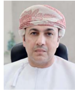
■ أحمد العزري

بدأت وزارة التعليم، ممثلة بمركز القبول الموحد، فتح باب التسجيل للالتحاق بمؤسسات التعليم العالي للعام الأكاديمي (٢٠٢٦/٢٠٢٧م)، وذلك خلال الفترة من ٢٩ أبريل وحتى ٤ يونيو القادم، عبر نظام قبول مطور بحلة تقنية حديثة، يأتي في إطار تحول رقمي شامل يهدف إلى تقديم تجربة أكثر سهولة ونقاء وكفاءة للطلبة، وفتح النظام لطلبة بدوالم التعليم العام وما يعادله للعام الدراسي (٢٠٢٥/٢٠٢٦م) التقديم إلكترونياً عبر موقع المركز، مع إمكانية استعراض البرامج والتخصصات المتاحة واختيار المسارات الأكاديمية التي تتوافق مع تطلعاتهم المستقبلية. وأوضح أحمد بن محمد العزري مدير عام مركز القبول الموحد بوزارة التعليم: إن المركز نفذ إعادة هندسة شاملة لنظام القبول الموحد، بما يعكس توجهه نحو بناء منظومة رقمية متطورة تواكب أحدث المعايير التقنية وتتناسب لاحتياجات الطلبة، مبيناً أن النظام الجديد يقدم تجربة استخدام أكثر سلاسة من خلال تصميم حديث لشاشات التسجيل والخدمات المتاحة، وأشار إلى أن رحلة الطالب تبدأ عبر شاشة دخول مطورة تتبع إنشاء الحساب بإدخال البيانات الأساسية مثل الرقم المدني والبريد الإلكتروني ورقم الهاتف ورقم الجلوس، ليحصل مباشرة على بيانات الدخول، فيما تم تطوير الصفحة الرئيسية لتكون لوحة تحكم مركزية متكاملة تمكن الطالب