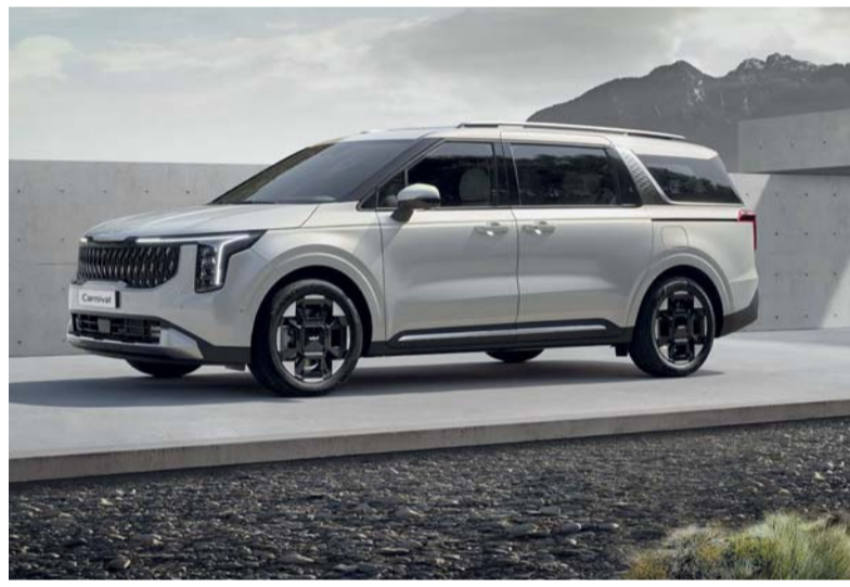
كيا كرنفال تجسد معايير جديدة للتميز

تواصل كيا كرنفال ترسيخ مكانتها كخيار أمثل للعائلات في سلطنة عُمان بمزيج راقٍ من الراحة والابتكار والفخامة حيث صممت لتلبية احتياجات العائلات الكبيرة التي تولي أهمية قصوى للأناقة والجودة لتحول كل رحلة إلى تجربة سفر من الدرجة الأولى. ويكمن سر جاذبية كيا كرنفال في قدرتها على استيعاب ما يصل إلى سبعة ركاب حيث جاء تصميمها المتطور على قاعدة متوسطة الحجم تتوفر فيها مقصورة داخلية مساحة الأفضل في فئتها، بالإضافة إلى سعة تخزين واسعة للأمتعة تصل إلى ٦٢٧ لتراً كما تحتوي على شبكة الرايدير الأمامية غير اللامعة، والمصابيح الأمامية بتقنية إل إي دي، وقضبان فوق السقف الأنيقة، وعجلات الألمنيوم اللافتة للنظر قياس ١٩ بوصة. وصممت المقصورة لتكون بمثابة صالة متنقلة، حيث تتميز بتشطيبات فاخرة وتقنيات تركز على راحة العملاء كما تعزز من الإضاءة المحيطة القابلة للتخصيص والزجاج العازل للصوت ذو الطبقات المزدوجة. أمدت كيا مجموعة من ميزات «الطاقة الذكية»، في كرنفال لتسهيل الحياة العائلية بحيث يمكن فتح أو إغلاق الأبواب المنزلة الكهربائية الذكية الأولى من نوعها في العالم