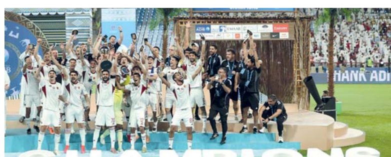
تتويج فريق الوحدة

من جهته، فشل العين في احراز أول بطولة من البطولات الثلاث التي ينافس عليها هذا الموسم، حيث يحتاج إلى ثلاث نقاط في آخر ثلاث مراحل ليتوج بلقب الدوري، ويلعب مع الجزيرة في نهائي كأس الإمارات في ٢٢ ايار/مايو.