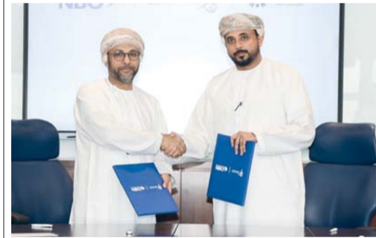
مسقط. «الوطن»: توقيع الاتفاقية تجسد التزام البنك بتعزيز المشاريع الشبابية

ناجحة، من خلال تقديم الدعم العملي، وتعزيز المهارات، وربطهم بفرص تسهم في تطوير أعمالهم وتوسيع نطاقها. وتجسد هذه الاتفاقية التزام البنك الراسخ بدعم المؤسسات الصغيرة والمتوسطة والمشاريع الناشئة، حيث يسعى البنك بالتعاون مع شركة إلى الإسهام في تحقيق الأهداف الوطنية لتنمية قطاع ريادة الأعمال، وتمكين القطاع الخاص، وبناء اقتصاد تنافسي قائم على التنوع والاستدامة.