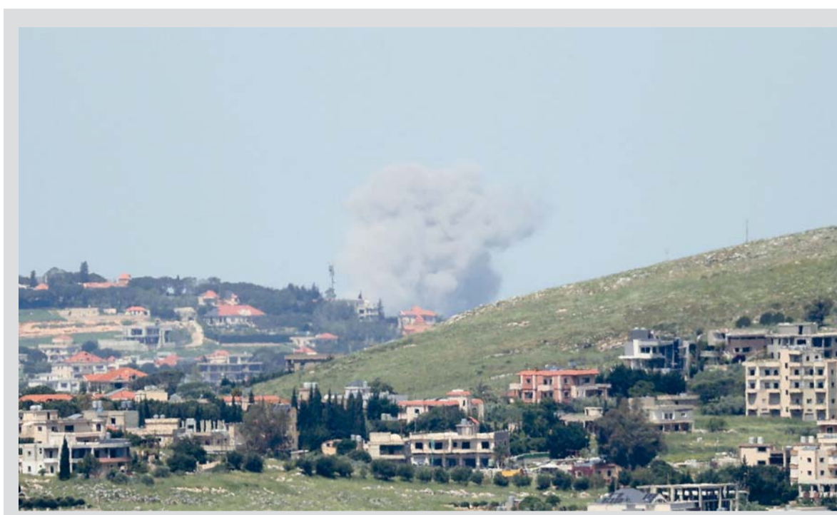
الدخان يتصاعد من موقع غارة جوية إسرائيلية استهدفت قرية دوير جنوب لبنان قرب النبطية.

كما تواصلت المسؤولة الأوروبية مع نظراء خليجيين، وفق المصدر ذاته.