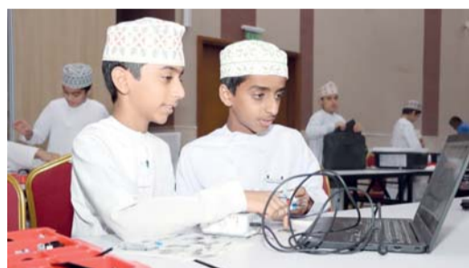
■ شارك في المسابقة ١٠٠ طالب