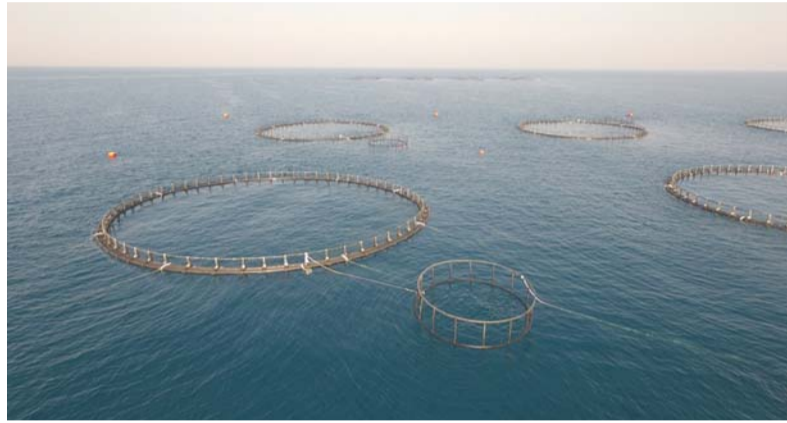
■ الاستزراع السمكي يعدّ نموذجاً متقدماً لقطاع واحد يقوده الاستثمار المتنامي

وأضاف أن الاستزراع السمكي التكامل يمثّل أحد الأنماط الداعمة، حيث يقوم على دمج الاستزراع السمكي ضمن أنظمة زراعية أو مائية متكاملة، بما يسهم في تحسين كفاءة استخدام الموارد. وأشار إلى أن سلطنة عُمان تستهدف رفع إنتاج الاستزراع السمكي إلى نحو ٢٥٢ ألف طن بحلول عام ٢٠٣٠ في إطار خطط التوسع وتعزيز الاستدامة. وأكد المدير العام لتنمية الموارد السمكية بوزارة الثروة الزراعية والسمكية وموارد المياه على أن قطاع الاستزراع السمكي يُعدّ نموذجاً متقدماً لقطاع واحد يقوده الاستثمار المتنامي، ويُتوقع أن يكون أحد أبرز روافد الاقتصاد الوطني خلال المرحلة القادمة.