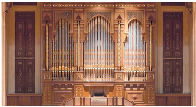
■ المشروع يقوم على فكرة التبادل الفني العميق بين الموسيقيين

بالعود والفرقة الشرقية عزفاً على الأرغن إلى جانب العود وعزف فرقة موسيقية شرقية، ليفتح حواراً بين لغات موسيقية مختلفة. مدة كل عرض ساعة واحدة، والمقاعد محدودة. يُختتم البرنامج صباح الخميس المقبل بمحاضرة مفتوحة بعنوان (الأرغن) يقدمها كلاوديو أسترونينو، تسلط الضوء على هذه الآلة الموسيقية التي كانت معروفة باسم (ملك الآلات)، وتتميز بفخامة الصوت، وحدته، وتعدّ الألوان اللحنية، وتختلف من أنابيب معدنية، أو خشبية تصدر الأصوات الموسيقية بعد مرور الهواء المضغوط عبره. ■