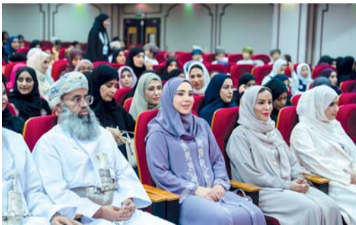
■ الحفل تضمن تقديم أوبريت غنائي وقصائد شعرية وفقرات غنائية متنوعة