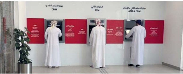
افتتاح الفرع تأكيد على التزام البنك للوصول إلى قاعدة أوسع من الزبائن