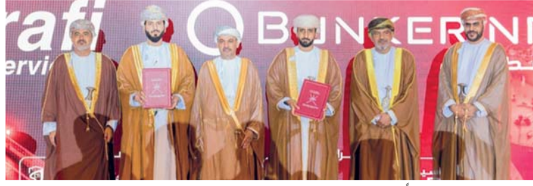
الاندماج استجابة للتطور المتسارع في متطلبات سلاسل الإمداد البحرية واحتياجات السوق

اندماج شركتين عمانيتين متخصصتين في تزويد السفن بالوقود البحري غرفة تجارة وصناعة عمان تشارك في اجتماع اتحاد الغرف الخليجية