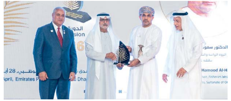
التكريم يأتي في ظل التطور الذي يشهده قطاع التمور بسلطنة عمان