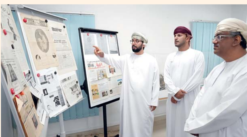
■ البرنامج يهدف لغرس قيم الاعتزاز بالماضي والانطلاق منه نحو المستقبل