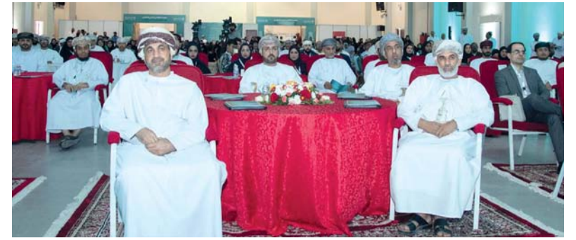
المحاور المقدمة تعكس الالتزام بربط البحث العلمي باحتياجات المجتمع

ووضّح سعادته أن بلدية شمال الشرقية بالمحافظة نفذت ١٤٥ كم من الطرق في العام الماضي، بتكلفة بلغت ٢٥ مليوناً و٥٠٤ آلاف و٨٦٠