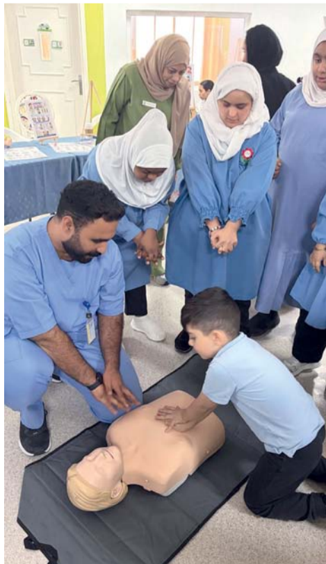
تقديم عرض مبسط حول الإنعاش القلبي.