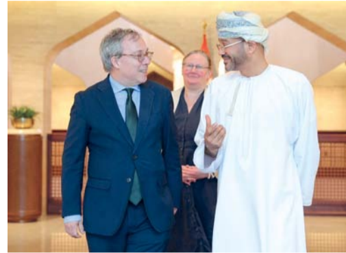
بدر بن حمد يلتقي بإدوارد لويلين

استمع اللورد إلى مراثيات معالي السيد وزير الخارجية بشأن أهمية صون أمن وسلامة الممرات البحرية والمضائق الاستراتيجية، وفي مقدمتها مضيق هرمز، وضرورة ضمان استياحية حركة الملاحة الدولية، بما يسهم في حماية سلاسل الإمداد العالمية وتعزيز الاستقرار الاقتصادي.