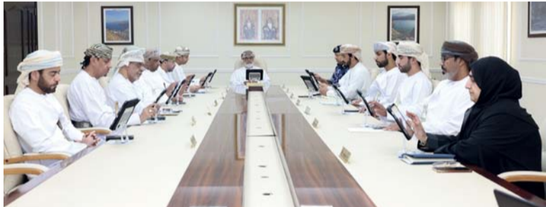
تحسين البنية الأساسية للمشروعات في مسندم

وناقش المجلس كذلك مشروعات البنية الأساسية، ومن أبرزها شبكة الصرف الصحي وتصريف المياه، وفتح مسارات طرق داخلية، ورفص مسارات النخل باستخدام الطوب المتشابك بولاية مدحاء. وفي ختام الاجتماع، تم استعراض عدد من المقترحات التطويرية، من بينها استحداث جيب تخطيطي بمربع السبابة بولاية ليماء بولاية خصب. ويأتي هذا الاجتماع في إطار حرص المجلس على متابعة سير المشروعات التنموية، والارتقاء بمستوى الخدمات المقدمة للمواطنين في مختلف ولايات محافظة مسندم.