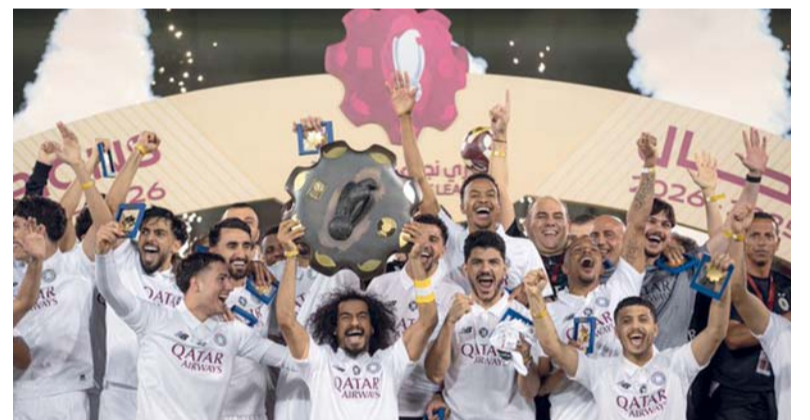
تتويج السد بلقب الدوري القطري

بعد مواجهة مثيرة انتهت بالتعادل ٣ / ٣. وفي المرة الثانية، وبعد تأكيد حسم اللقب، استعاد السد كبرياءه بعد توديع دوري أبطال آسيا من دور الثمانية بالخسارة أمام فيسيل كوبي الياباني بركلات الترجيح بعد التعادل ٣ / ٣ في الوقتين الأصلي والإضافي من المباراة التي أقيمت يوم ١٦ أبريل/نيسان.