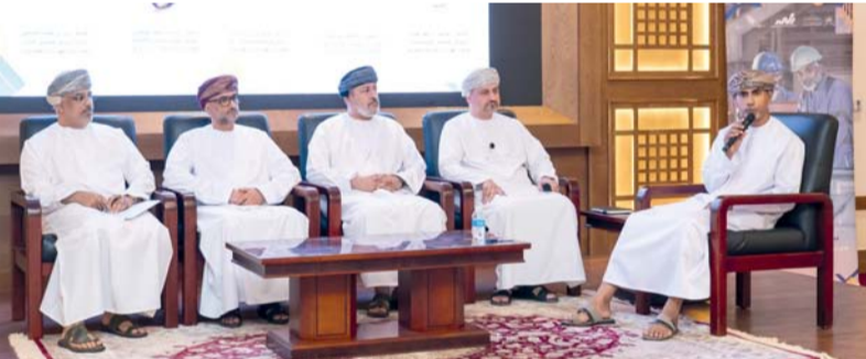
اللقاء استعرض الاستراتيجية الوطنية للمعايير المهنية وآليات تطبيق الاعتماد المهني

نظمت وزارة العمل لقاءً تعريفياً بمنظومة المعايير المهنية، تحت رعاية سعادة سعيد بن عبدالله البلوشي وكيل الوزارة لقطاع تنمية الموارد البشرية، وبحضور ممثلين من الجهات الحكومية والقطاع الخاص وعدد من القيادات في القطاعات الاقتصادية. هدف اللقاء إلى مناقشة التوجه نحو التحول الفعلي في تطبيق منظومة المعايير المهنية، باعتبارها أداة مباشرة لقياس الكفاءة وتنظيم الممارسة المهنية ورفع موثوقية التقييم والاعتماد. وشهد اللقاء استعراض الاستراتيجية الوطنية للمعايير المهنية وآليات تطبيق الاعتماد المهني، حيث قدم الدكتور محمد بن مصطفى النجار عرضاً شاملاً حول الاستراتيجية، تناولت مركزاتها وأهدافها وآليات ربط المعايير بمنظومة التأهيل والتقييم والاعتماد، بما يسهم في رفع جودة الكفاءات وتعزيز مواءمة مخرجات التعليم والتدريب مع احتياجات سوق العمل، إلى جانب استعراض نماذج تنفيذية من قطاعات الطاقة والمعادن والهندسة والصناعة، والتي أظهرت نتائج ملموسة في رفع جودة الكفاءات وتحسين جاهزية القوى العاملة وتعزيز ثقة سوق العمل. وأكد زاهر بن عبدالله آل الشيخ مدير دائرة المعايير المهنية بوزارة العمل على أن المعايير المهنية لم تعد إطاراً تنظيمياً فقط، بل أداة حقيقية لضبط السوق ورفع الكفاءة، مشيراً إلى أن تطبيقها بدأ يحقق نتائج