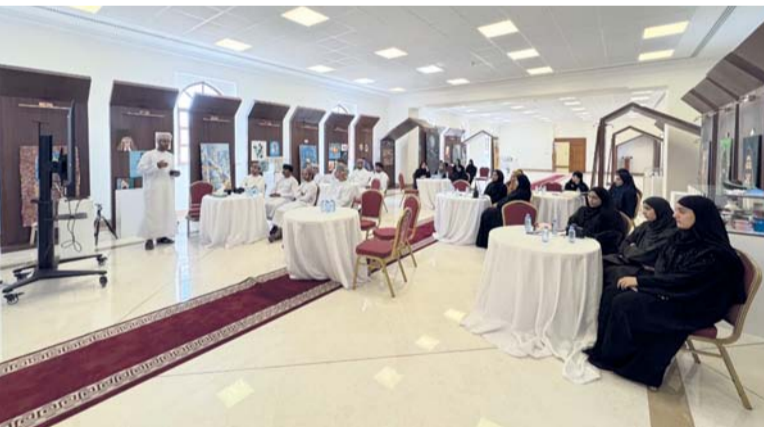
■ الحلقة شهدت مشاركة ٢٠ متدرباً من الموظفين وهوأة التصوير الفوتوغرافي، تصوير الخطاب الشفهي.

بهلاء. من مؤمن الهنائي: نظم مكتب والي بهلاء صباح امس الثلاثاء حلقة تدريبية بعنوان (أساسيات التصوير الضوئي)، بحضور