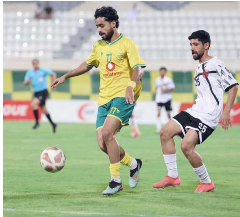
■ السيب يضرب شبك الرساق برباعية ويقرب من التتويج