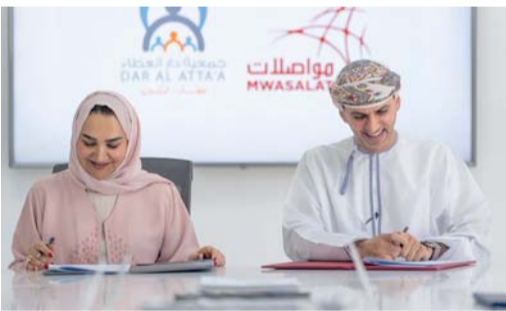
دعم ورعاية حافلة المكتبة المتنقلة