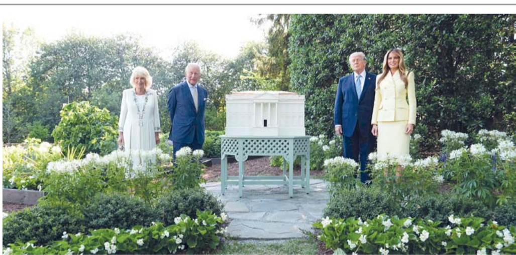
الرئيس الأميركي دونالد ترامب وقرينته ميلانيا ترامب، والملك تشارلز الثالث ملك بريطانيا والملكة كاميليا يقفون أمام نموذج لقاعة الرقص المقترحة من قبل ترامب، أثناء جولتهم في مبنى البيت الأبيض.

كابول. أ.ف.ب: قتل الجيش الباكستاني سبعة مدنيين على الأقل وأصاب ٨٥ آخرين في ولاية حدودية أفغانية، وفق ما أفاد مسؤول صحي أفغاني. وقال مظهر مخلص، مدير الصحة العامة في الإقليم، «أحضر ٨٥ جريحا وسبع جثث، من مناطق حدودية وأسند آباد، مشيرا إلى أن جميع الضحايا مدنيون». وبحسب أرقام الأمم المتحدة الصادرة في مارس، قتل ٧٦ مدنيا أفغانيا على الأقل منذ بدء النزاع في أواخر فبراير، بالإضافة إلى ما لا يقل عن ٢٥٠ قتيلًا في غارة على مستشفى لمعالجة الإدمان في ١٦ مارس. وقال المتحدث باسم حكومة