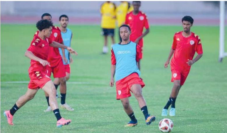
من الحصص التدريبية لمنتخب الشباب

ويأمل الجهاز الفني أن يحقق منتخبنا أقصى استفادة ممكنة من هذا المعسكر سواء على مستوى الإعداد البدني أو الانسجام الفني بما يعزز من فرصه في الظهور بصورة مشرفة في بطولتي كأس العرب وتصفيات كأس آسيا للشباب.