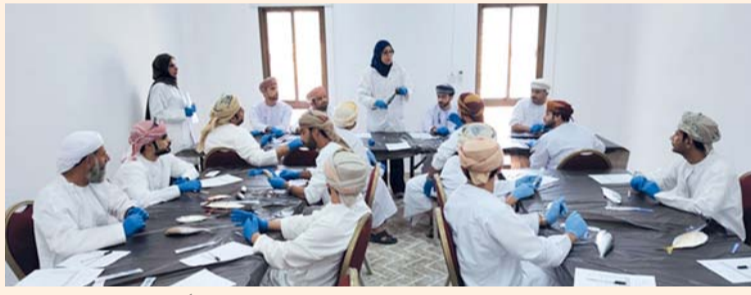
الحلقة تناقش التقويم الحسي للتغيرات الحسية للأسماك

المخبري للأسماك وكيفية التعرف على الأسماك الطازجة وتحديد الجودة للأسماك والمنتجات البحرية وأهم أمراض الأسماك وكيفية معرفة تلك الأمراض من الفحوصات المخبرية ومسبباتها ومخاطر تلك الأمراض. ويشمل البرنامج التدريبي تطبيقاً عملياً لتفريغ الأسماك ودراستها ومعرفة التقويم الحسي للتغيرات الحسية للأسماك والتغيرات الأحيائية والكيميائية والفيزيائية للأسماك. ويحاضر في الحلقة التدريبية عدد من المختصين من مركز سلامة وجودة الغذاء بوزارة الثروة الزراعية والسمكية وموارد المياه، ويشارك فيها المختصون في مجال ضبط جودة الأسماك ومراقبي الأسواق السمكية والعاملين في المختبرات من وزارة الثروة الزراعية والسمكية وموارد المياه.