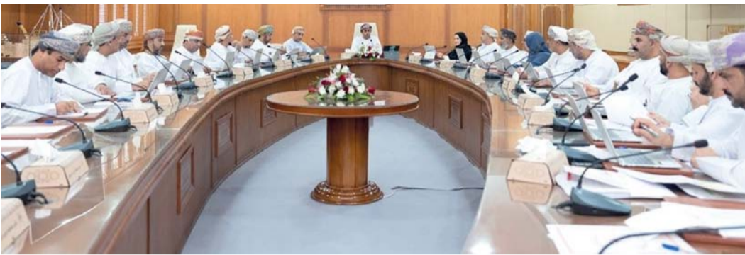
تطوير البنية الأساسية والارتقاء بمستوى الخدمات جنوب الباطنة

وتنمية المحافظة، والشؤون الصحية والبيئية، والشؤون الاجتماعية، تمهيدا لاعتماد ما يلزم بشأنها.