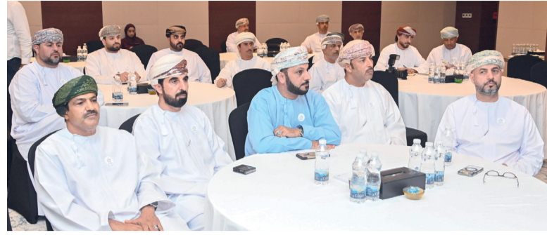
■ «فك كربة»، تكشف في المؤتمر الصحفي أبرز النتائج التي حققتها

وتواصل مبادرة «فك كربة»، مسيرتها الإنسانية تحت شعارها الدائم: «الإنسان يستحق فرصة ثانية»، جسدة أسمي معاني التضامن المجتمعي، مؤكدة دورها في تعزيز الاستقرار الأسري والاجتماعي في سلطنة عمان.