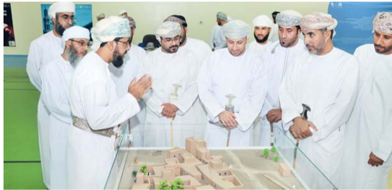
■ الفعالية تهدف إلى إظهار الجوهر الحضاري لسلطنة عُمان