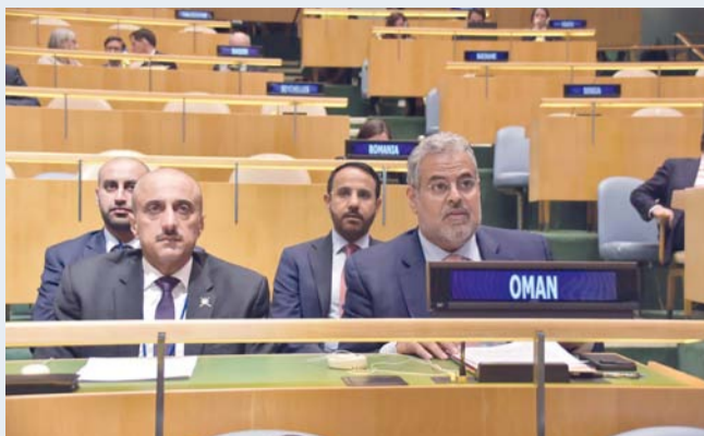
تأكيد على دعم الجهود الدولية الرامية إلى نزع السلاح

الدائم لسلطنة عُمان لدى الأمم المتحدة، بياناً باسم الدول الأعضاء في المؤتمر، أكد فيه على أن إنشاء منطقة خالية من الأسلحة النووية وضرورة ملحة لتعزيز الأمن والاستقرار في المنطقة، ويجسد التزاماً دولياً قائماً يتطلب تضامناً في الجهود لتنفيذه. وركز البيان على التحديات المتصاعدة التي تواجه منظومة نزع السلاح وعدم الانتشار، بما في ذلك استمرار تطوير الترسانات النووية وتصاعد الخطاب المرتبط باستخدامها، محذراً من تداعيات ذلك على السلم والأمن الدوليين، ومؤكداً في الوقت ذاته على أهمية تعزيز العمل متعدد الأطراف والتوصل إلى نتائج توافقية تعيد الزخم إلى مسار المعاهدة. كما شددت سلطنة عُمان، بصفتها رئيسة الدورة السابعة، على ضرورة الحفاظ على نهج توافقي شامل وغير انتقائي في معالجة قضايا نزع السلاح في المنطقة، داعية جميع دول الشرق الأوسط إلى الانخراط البناء في هذا المسار، بما يعزز الثقة المتبادلة ويهدد الطريق نحو ترتيبات إقليمية أكثر استقراراً وأماناً. وتؤكد سلطنة عُمان من خلال هذه المشاركة الفاعلة على التزامها الراسخ بدعم الجهود الدولية الرامية إلى نزع السلاح ومنع الانتشار، وتعزيز الحلول السلمية القائمة على الحوار والتفاهم، بما يسهم في بناء نظام دولي أكثر توازناً وأماناً.