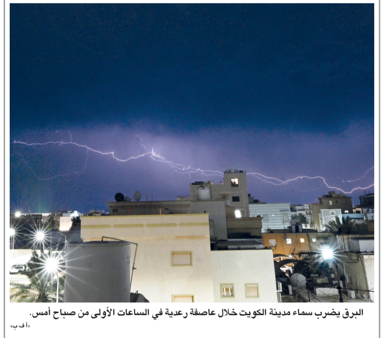
البرق يضرب سماء مدينة الكويت خلال عاصفة رعدية في الساعات الأولى من صباح أمس.

لبؤة إفريقية تدعى أسالي تطل من حظيرتها بعد عرض اثنين من أشبالها للجمهور في حديقة حيوانات ويربي المفتوحة على مشارف ملبورن. وتُصنّف الأسود الإفريقية ضمن الأنواع المعرضة للخطر في القائمة الحمراء للاتحاد الدولي لحفظ الطبيعة، حيث لم يتبق منها سوى ٢٣ ألف أسد في البرية في جميع أنحاء إفريقيا جنوب الصحراء الكبرى.