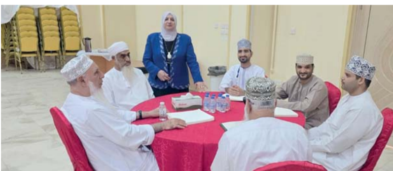
البرنامج يعزز من تمكينهم لدخول سوق العمل

كبيراً بالجوانب التطبيقية، من خلال تدريب المشاركين على إعداد دراسات الجدوى الاقتصادية بشكل عملي، بما يساعدهم على فهم الجوانب المالية للمشاريع، واتخاذ قرارات مدروسة تقلل من المخاطر وتعزز فرص النجاح والاستدامة. وأكد الصباحي على أن هذا البرنامج يمثل نموذجاً عملياً للتمكين، حيث لا يقتصر على نقل المعرفة، بل يسعى إلى بناء الثقة وتعزيز روح المبادرة لدى المشاركين، وتمكينهم من تجاوز التحديات وتحويلها إلى فرص حقيقية للنجاح.