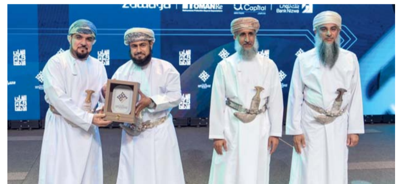
الرعاية تجسد توجهات البنك نحو ترسيخ القيم المجتمعية