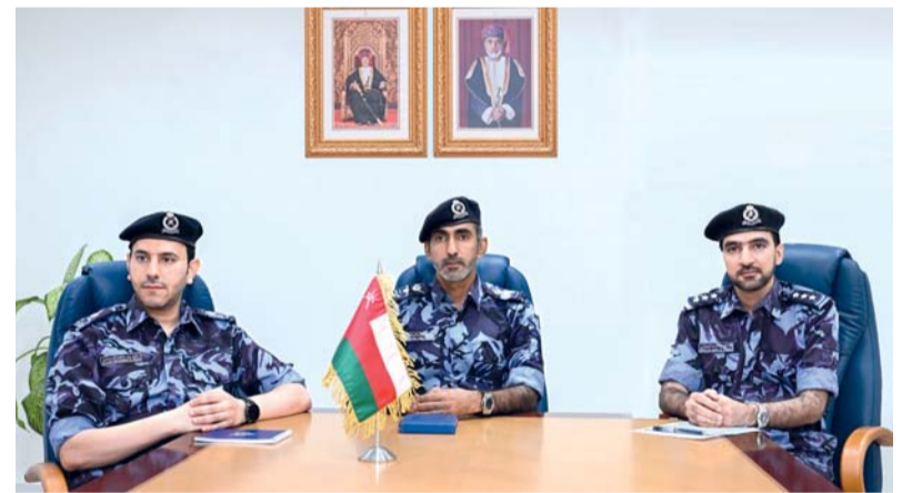
تعزيز التعاون المشترك في مجال التوعية الإعلامية الأمنية