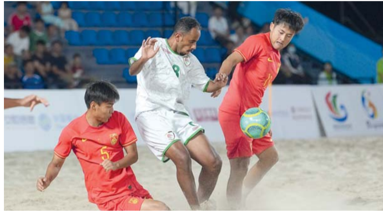
منتخب القدم قدم مستوى جيداً في الدورة ويطمح للذهبية