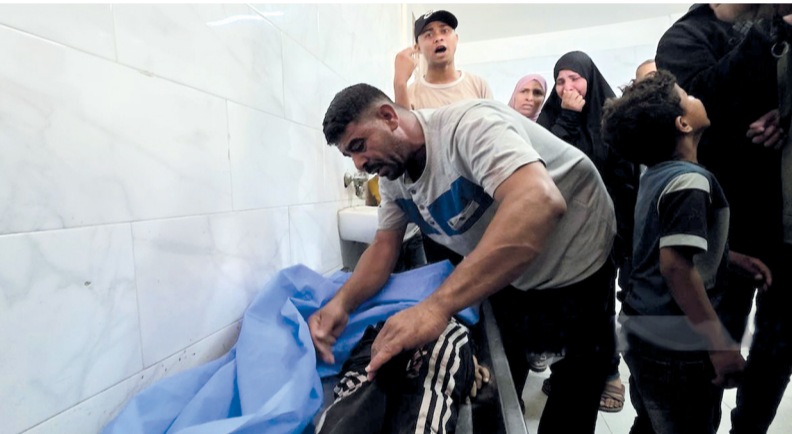
فلسطينيون ينقلون جثمان طفل شهيد إلى مجمع ناصر الطبي حيث استشهد جراء استهداف «إسرائيلي» لمجموعة في خان يونس جنوب قطاع غزة.

استشهد طفل (9 سنوات) جراء غارة «إسرائيلية» استهدفت دوار أبو حميد في مدينة خان يونس جنوب قطاع غزة صباح أمس، في استمرار لخروقات الاحتلال لوقف إطلاق النار. وصباح أمس أصيبت امرأة برصاص قوات الاحتلال شمال قطاع غزة، بالتزامن مع قصف مدفعي واستهدافات طالت مناطق شمال وشرق القطاع، بينها بيت لاهيا ومخيم جباليا، إضافة إلى قصف شرق مدينة خان يونس جنوبا.