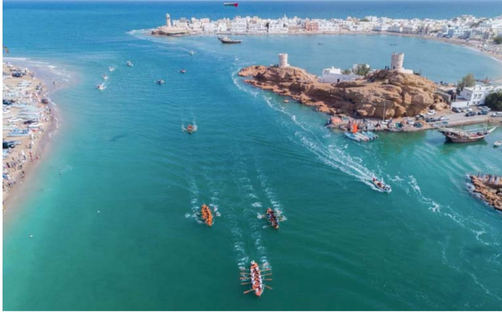
المحافظة تتمتع بالعديد من المقومات السياحية الجاذبة

صور . العمانية: حظيت محافظة جنوب الشرقية في ظل النهضة المتجددة بقيادة حضرة صاحب الجلالة السلطان هيثم بن طارق المعظم . حفظه الله ورعاه . بالعديد من المشروعات التنموية الشاملة التي تترجم أولويات رؤية عُمان ٢٠٤٠، بهدف تحقيق تنمية متوازنة تعزز من التنافسية مع محافظات سلطنة عُمان الأخرى بما يعود بالخير والنفع عليها.