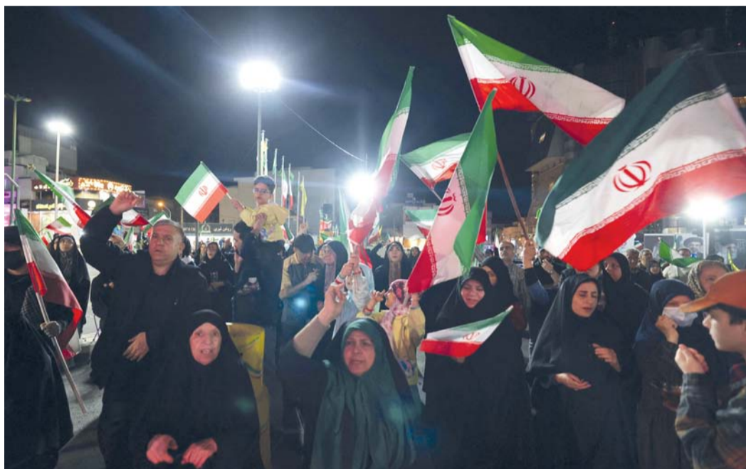
إيرانيون يلوحون بالأعلام في مسيرة تضامنية بساحة صادقية بطهران.

طهران. عواصم. وكالات: طلبت إيران ضمانات (موثوقة بها) بعدم شن هجوم أميركي «إسرائيلي» آخر عليها، فيما شكك الرئيس الأميركي دونالد ترامب في مقترح يقضي بفتح مضيق هرمز مقابل رفع الحصار عن الموانئ الإيرانية.