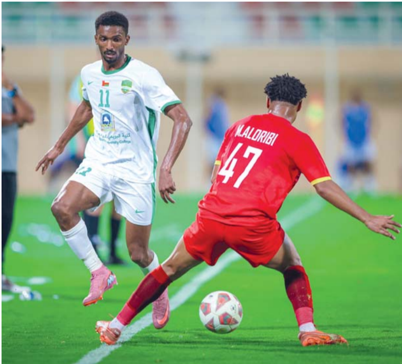
■ النهضة يتفوق على ظفار بهدف نظيف في مباراة متوسطة

أيضاً بنفس الرصيد (٢٠ نقطة)، لكنه حقق فوزاً مهماً قد يكون نقطة تحول. صحم ومن ثم يليه ظفار خسرا اللقاء بهما في هذه الجولة، الأول خسر على ملعبه وبين جماهيره أمام عبري ١ / ٢، وهي خسارة مؤلمة للغاية وضعته في موقف محرج وبالمركز العاشر برصيد (٢١) نقطة، وهو ذات الرصيد من النقاط الذي بحوزة ظفار الذي يقبع في المركز التاسع والذي خسر مباراته وقدم أداء سيء للغاية أمام النهضة بمجمع البريمي صفر/١ ما يعني أنه بات مهدداً بشكل قوي في العودة للأولى مجدداً.