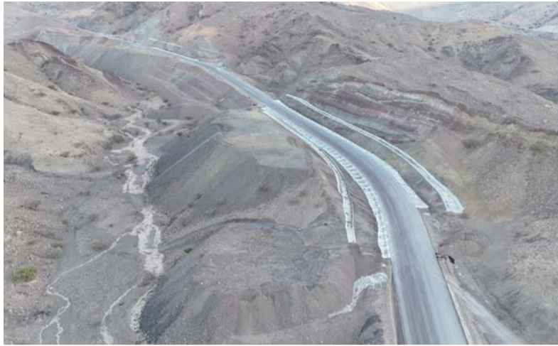
المحافظة شهدت تنفيذ عدد من المشروعات الاستراتيجية

وأفاد سعادته بأن محافظة شمال الشرقية تُعد واحدة من أبرز الوجهات السياحية في سلطنة عُمان، لما تمتلكه من مقومات طبيعية وتتنوع جغرافي وثقافي يجعلها وجهة مثالية للسياحة الشتوية، مشيراً إلى أن الموسم السياحي الشتوي الماضي شهد مؤشرات إيجابية في نسب الإشغال والإيرادات، حيث وصلت معدلات الإشغال في بعض الفترات إلى ١٠٠ بالمائة، مما يعكس الإقبال المتزايد على الوجهات السياحية بالمحافظة.