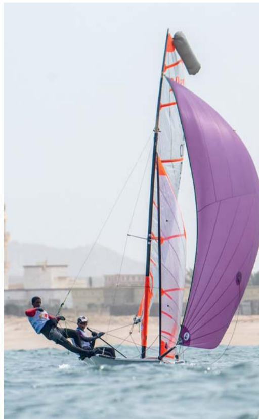
تدريبات مكثفة لبحارتنا

وأوضح أن المنافسة أمام فرق أوروبية قوية، تمنح البحارة فرصة كبيرة في تطوير مهاراتهم، وتعزيز خبراتهم، وتمكينهم من تقديم