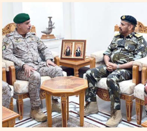
عبد الله الرئيسي يستقبل عبدالعزيز البلوي

مسقط - العمانية: التقى معالي السيد بدر بن حمد البوسعيدي وزير الخارجية، باللورد إدوارد لويلين، المدير العام السياسي بوزارة الخارجية والتنمية في المملكة المتحدة، جرى خلال اللقاء بحث عدد من الموضوعات ذات الاهتمام المشترك، وفي مقدمتها مستجدات الأوضاع في المنطقة وتداعياتها، حيث تبادل الجانبان وجهات النظر إزاء سبل تعزيز التهذفة وخفض التصعيد، والدفع نحو الحلول السياسية والدبلوماسية المستدامة.