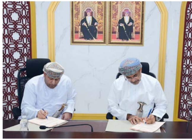
العقود تسهم في تنويع مصادر الدخل وتعزيز دور القطاعات غير النفطية في الاقتصاد الوطني

في إطار جهود الوزارة لتعزيز الاستثمار في قطاع الاستزراع السمكي ودعم منظومة الأمن الغذائي إلى جانب الإسهام في تنويع مصادر الدخل وتعزيز دور القطاعات غير النفطية في الاقتصاد الوطني.