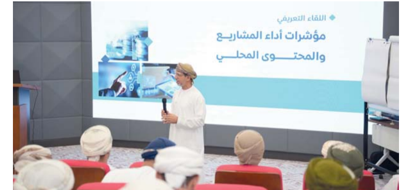
اللقاء يساهم في رفع كفاءة تنفيذ المشاريع الحكومية

التنفيذ، وكفاءة التكامل والتقويم والتطوير. وأكدت المهندسة زكية بنت عبد الله البوصافية مديرة مكتب متابعة تنفيذ رؤية «عُمان ٢٠٤٠»، بالهيئة على أن هذا اللقاء يمثل خطوة مهمة نحو رفع جاهزية الجهات الحكومية في التعامل مع مؤشرات أداء المشاريع والمحتوى المحلي، مشيرة إلى أن اللقاء يهدف إلى توحيد منهجية القياس بين الجهات، وتعزيز فهمها للمؤشرات وآلية احتسابها، بما يساهم في تحسين جودة الأداء ورفع كفاءة تنفيذ المشاريع الحكومية. وأضافت: إن الهيئة تحرص من خلال هذه المبادرات على تمكين الجهات الحكومية وتقديم الدعم اللازم لها، بما يعزز من كفاءة التخطيط والتنفيذ، ويحقق التكامل المؤسسي في إدارة المشاريع، وصولاً إلى تحقيق الأثر المستدام المنشود.