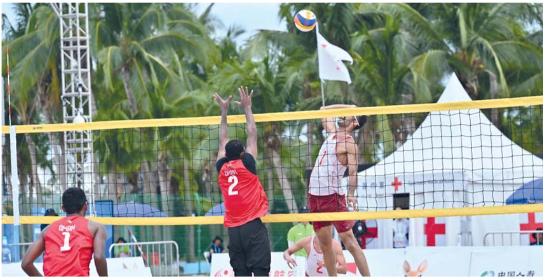
من لقاء منتخبنا وإيران