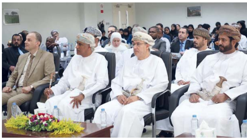
الكتاب يظل ركيزة أساسية في بناء الوعي وصناعة المستقبل

تقديرًا لدعمه ورعايته لهذه التحولات التي يشهدها الكتاب الطبي ودوره في دعم مخرجات التعليم الطبي وربطها بالتقنيات الحديثة. وشهد الحفل تكريم عدد من أعضاء الهيئة التدريسية من مؤلفي الكتب الحديثة، تقديرًا لإسهاماتهم العلمية وذلك نظير إصداراتهم العلمية والأدبية التي تسهم في إثراء المكتبة العربية وتعزيز المحتوى الأكاديمي إضافة تكريم عددا من المشاركين في هذه المناسبة. كما قام رئيس الجامعة بتقديم هدية تذكارية لراعي الحفل