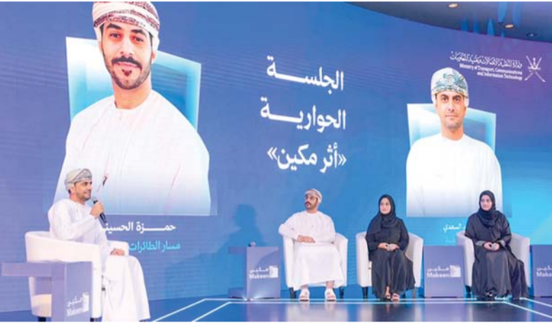
«مكين» تجمع بين التدريب التطبيقي وتحفيز الابتكار ودعم تأسيس الشركات التقنية