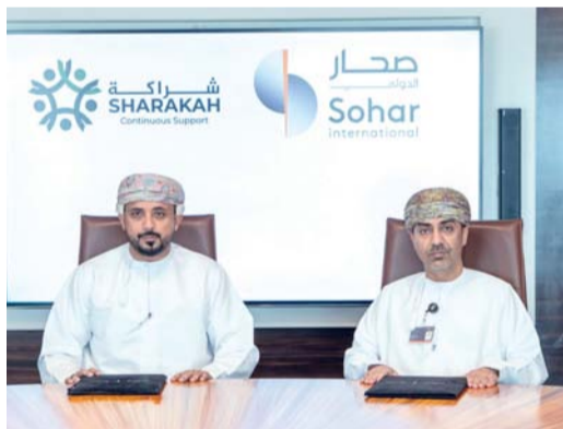
المذكرة تسهم في تسريع نمو المؤسسات التي تقودها النساء

ومع استمرار نمو هذه المنظومة، أصبحت الحاجة لبناء القدرات الرقمية لدى رواد الأعمال أكبر، مع ضرورة توفير دعم مستمر في بناء القدرات، وتوفير أنظمة دعم مناسبة. ومن خلال تعاوننا مع شراكة، تقدم نموذجاً تطويرياً يدمج بين بناء المهارات العملية والتواصل المباشر مع خبرات القطاع والتعرف على وجهات النظر المؤسسية. وستتمد النسخة الثانية من البرنامج على مدى ثمانية أشهر، محافظة على مساراتها الأساسية في التحول الرقمي، والإرشاد والتوجيه، والتخطيط التجاري، وبناء القدرات، مع إدخال تحسينات