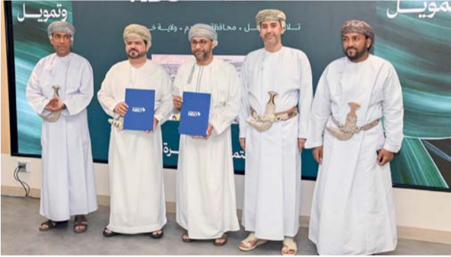
الاتفاقيات خطوة نوعية في تعزيز تكامل منظومة التمويل العقاري

تمثل خطوة نوعية في تعزيز تكامل منظومة التمويل العقاري، كما أنها تساهم في تيسير رحلة التملك السكني عبر توفير حلول مرنة ومتنوعة، بما يدعم استدامة الطلب في مشاريع الأحياء السكنية المتكاملة. وأضاف أن مشروع «تلال النخيل» الذي سيقام في ولاية خصب بمحافظة مسندم يعد أحد المشاريع الرائدة ضمن برنامج الأحياء السكنية المتكاملة «صروح»، حيث يمتد على مساحة تقارب ٦٥٠ ألف متر مربع، ويضم نحو ٦٥٠ وحدة سكنية سوف يستفيد حوالى ٧٠ بالمائة من الأهالي بالمحافظة الموجودين على قائمة الانتظار لدى وزارة الإسكان والتخطيط العمراني مشيراً إلى أن التكلفة الاستثمارية تتجاوز ٧٠ مليون ريال عماني. حضر حفل توقيع الاتفاقيات سعادة المهندس حمد بن علي الزواني، وكيل وزارة الإسكان والتخطيط العمراني للإسكان والرؤساء التنفيذيين للبنوك والمؤسسات التمويلية.