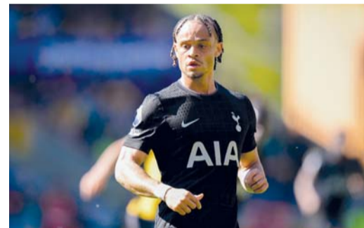
■ تشافي سيمونز

إينستغرام «يقولون إن الحياة قد تكون قاسية، واليوم أشعر بذلك، مضيغاً انتهى موسمي بشكل مفاجئ وأنا أحاول فقط استيعاب ما حدث. بصراحة، انفطر قلبي. لا شيء يبدو منطقياً. وتابع «كل ما أردته هو القتال من أجل فريقتي، والأن انتزعت مني القدرة على القيام بذلك، إلى جانب كأس العالم. تمثيل بلادي هذا الصيف... انتهى». وتشكل إصابة سيمونز