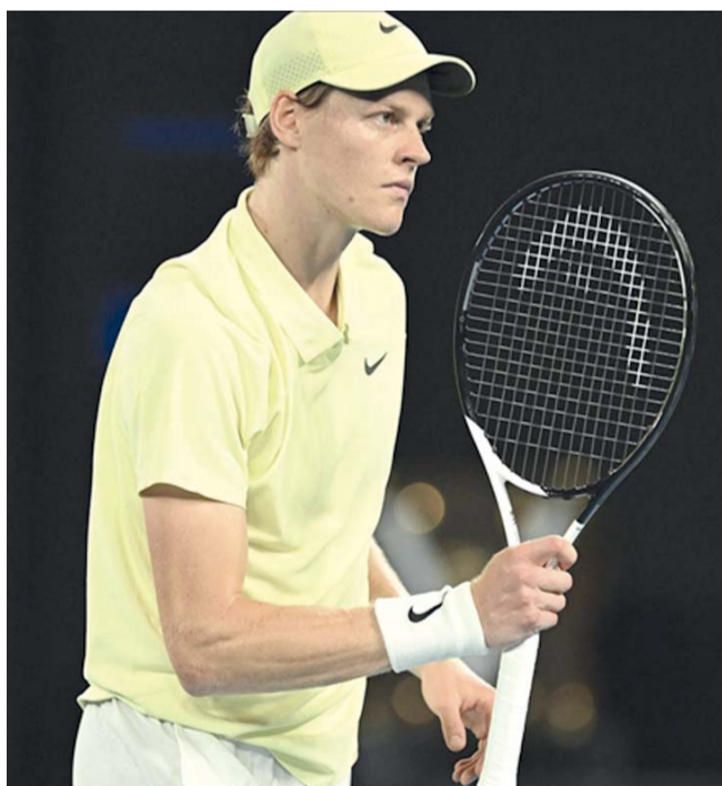
■ يانيك سينر

وتلقتي جوف في الدور ثمن النهائي مع نوسكوف. وكانت جوف بلغت نهائي دورة مدريد قبل سنة وخسرت أمام البيلاروسية أرينا سابالينكا، وهي الآن تدافع عن ٣٣٠٠ نقطة من رصيدها في موسم الملاعب الترابية وصولاً إلى بطولة رولان جاروس مطلع يونيو. وقالت الفائزة بلقبين كبيرين «اشحبت في إنديان ويلز، وأنا لست من النوع الذي يحب الانسحاب، لذلك لم أرد أن انسحب مرة أخرى اليوم، لذا أنا سعيدة لأنني تمكنت من إنهاء المباراة.» وأضافت «بدأت أشعر بتحسن، ولم أعد أشعر برغبة في التقني. أعطوني بعض الحبوب، وهذا ساعدني بالتأكد.» وتابعت «لكنني كنت مرهقة جداً... الجزء الأول كان مجرد محاولة للحفاظ على الطعام في معدتي. وبعد أن أعطوني ما يساعدي، أصبحت فقط أشعر بالغبان