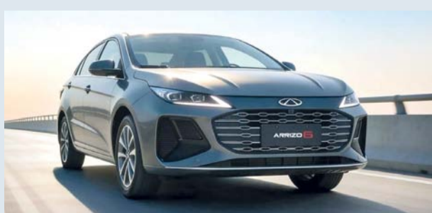
«أريزو ٦ برو» توفر قيادة عملية وفخمة في آن واحد

رقمي متكامل بسلاسة مع أجهزة «ابل كارلاي» و«أندرويد أوتو». ويُعزى الأداء المتميز لسيارة «أريزو ٦ برو»، إلى محرك توربيني متطور يوفّر مزيداً مثالياً من القوة وكفاءة استهلاك الوقود، ويتيح ناقل الحركة ثنائي القابض تسارعاً سلساً وقيادة فائقة النعومة. ولتلبية مختلف تفضيلات القيادة، تتضمن سيارة الصالون أوضاع قيادة متعددة ونظام توجيه كهربائي مما يسمح للسائق بتخصيص استجابة السيارة سواءً كان يقود في شوارع المدينة الضيقة أو على الطرق السريعة الطويلة. كما تعد السلامة ركناً أساسياً في