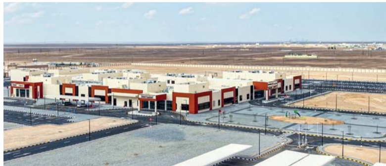
المستشفى يقام على مساحة تبلغ ٢٠٠ ألف متر مربع

مسقط - النعمانية: استقبل معالي الفريق أول سلطان بن محمد النعماني وزير المكتب السلطاني بمكتبه سعادة الدكتور إدريس أحمد ميا سفير الجمهورية العربية السورية بمناسبة انتهاء مهام عمله سفيراً لبلاده لدى سلطنة عُمان. وقد أعرب معالي الفريق أول عن بالغ شكره لسعادته على جهوده التي بذلها في دعم وتعزيز العلاقات القائمة بين البلدين الشقيقين خلال فترة عمله، من جانبه أعرب سعادته عن عميق اعتزازه وتقديره للتعاون الذي حظي به خلال فترة عمله في سلطنة عُمان.