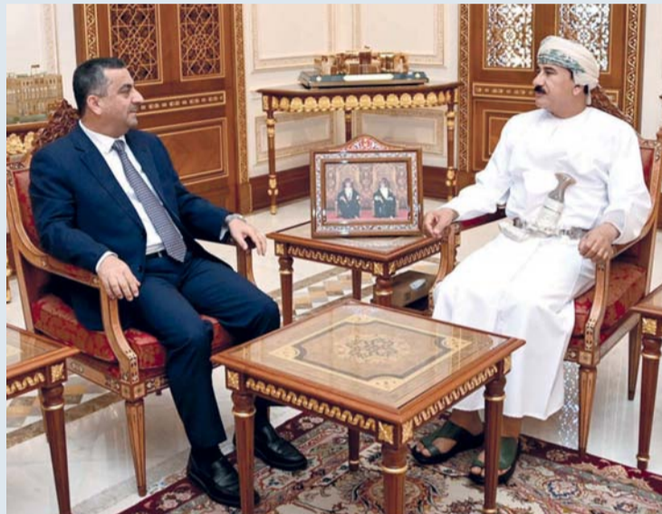
سلطان النعماني يستقبل إدريس أحمد

مسقط - النعمانية: استقبل معالي الفريق أول سلطان بن محمد النعماني وزير المكتب السلطاني بمكتبه سعادة الدكتور إدريس أحمد ميا سفير الجمهورية العربية السورية بمناسبة انتهاء مهام عمله سفيراً لبلاده لدى سلطنة عُمان. وقد أعرب معالي الفريق أول عن بالغ شكره لسعادته على جهوده التي بذلها في دعم وتعزيز العلاقات القائمة بين البلدين الشقيقين خلال فترة عمله، من جانبه أعرب سعادته عن عميق اعتزازه وتقديره للتعاون الذي حظي به خلال فترة عمله في سلطنة عُمان.