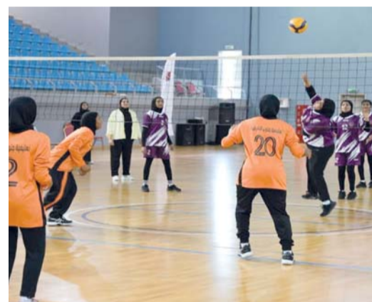
من منافسات الدوري المدرسي لكرة الطائرة

حيث أقيمت في اليوم الأول (٢٥) مباراة من (خمس) جولات، بواقع خمس مباريات في كل جولة، وقد جاءت نتائج الجولة الأولى بفوز تعليمية شمال الباطنة على تعليمية شمال الشرقية ٠/٣، وفازت تعليمية جنوب الباطنة على تعليمية البريمي بنتيجة ١/٣، كما فازت تعليمية الداخلية على تعليمية الظاهرة بنتيجة ٠/١. وحققت تعليمية مسقط فوز كبير على تعليمية الوسطى بنتيجة ٢/١٣، وانتهى اللقاء الخامس بفوز تعليمية جنوب الشرقية على تعليمية الوسطى بنتيجة ٢/٥. الجولة الثانية استهلته بفوز تعليمية شمال الباطنة على تعليمية البريمي بنتيجة ٣/٦، كما فازت تعليمية الداخلية على تعليمية جنوب الباطنة، وفازت تعليمية شمال الشرقية على تعليمية البريمي بنتيجة ١/٦، وفازت تعليمية جنوب الباطنة على تعليمية الظاهرة بنتيجة ٢/٣. كما فازت تعليمية مسقط على تعليمية جنوب الشرقية بخمسة نظيفة، وفازت تعليمية ظفار على تعليمية الوسطى بنتيجة ١/٢، في ختام