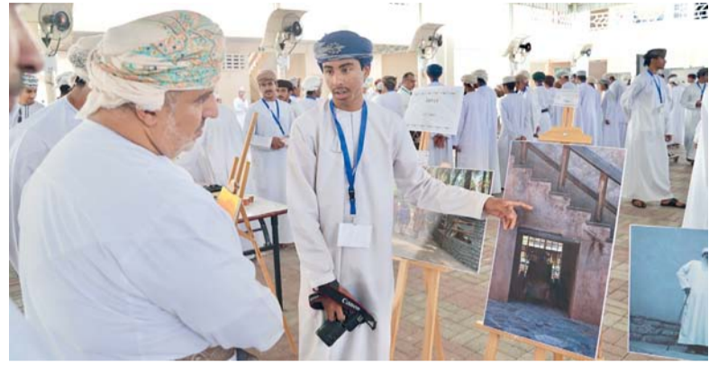
«وجهاً» يمثل تجربة تعليمية متكاملة هدفت إلى إبراز مهارات الطلبة

وفي ختام الفعالية، قام راعي الحفل بتكريم المشاركين والجهات الداعمة، كما قدّم طلبة التخصص هدية تذكارية لراعي المناسبة، في لفحة تعبر عن تقديرهم للدعم الذي حظي به المعرض. ويجسد معرض (وجهاً) نموذجاً فاعلاً للتكامل بين التعليم النظري والتطبيق العملي، ويسهم في تعزيز الوعي بالتخصصات المهنية والتقنية، بما يدعم توجهات سلطنة عُمان نحو إعداد جيل يمتلك المهارات اللازمة لمواكبة متطلبات التنمية المستدامة وسوق العمل.