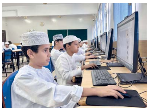
البرنامج يستهدف (٣٦٥) طالباً وطالبة

١. تدعو وزارة الدفاع الموردين المسجلين لديها للاشتراك في المناقصة الآتية: ٢. يمكن الحصول على شروط ومستندات المناقصة من مكتب أمانة لجنة المناقصات بمعسكر المرتفعة بالجوابة رقم (١٤) أثناء الدوام الرسمي ما بين الساعة التاسعة إلى الواحدة بعد الظهر. ٣. يجب تقديم شهادة استيفاء التعمين الصادرة من وزارة العمل بفترة صلاحية لا تتجاوز شهراً من تاريخ إصدارها بحيث يتم تقديمها عند شراء مستندات المناقصة. ٤. تدفع رسوم المناقصة من خلال استخدام بطاقات الفيزا إلكترون أو بطاقات «الفيزا» الائتمانية الصادرة من البنوك العاملة بالسلطنة.