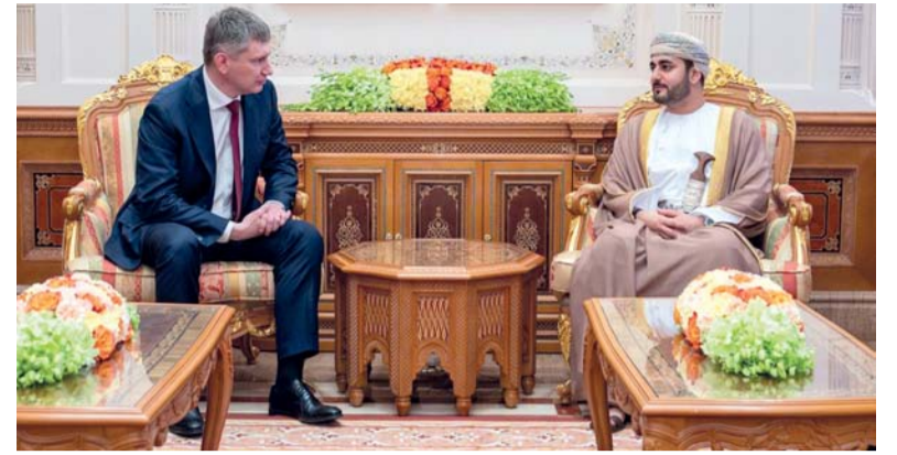
■ بحث الفرص الواعدة في عدد من القطاعات ذات الأولوية بما يسهم في تعزيز الشراكات الاقتصادية

عقد مجلس الدولة لقاء إعلامياً بعنوان «رؤية تواصل إقرار، بحضور سعادة خالد بن أحمد السعدي الأمين العام والمكرمين رؤساء اللجان المختلفة وممثلي وسائل الإعلام المختلفة من الصحفيين والإعلاميين من مختلف المؤسسات الإعلامية الحكومية والخاصة. وأكد سعادة الأمين العام أن اللقاء يأتي في إطار التواصل الفعال وإتاحة المعلومات لوسائل الإعلام بما يعكس أداء المجلس وفق اختصاصاته التي حددها قانون مجلس عمان وتقديم عرض شامل لأبرز أعمال المجلس في مجالات التشريع، والميزانية العامة للدولة، وخطة التنمية إلى جانب الدراسات التي يقدمها للحكومة. وأضاف سعادته: نأمل أن يكون هذا اللقاء مساحة للحوار البناء والنقاش الهادف بما يسهم في التوعية بأدوار مجلس الدولة ضمن جهود مسيرة التنمية الشاملة وتعاطيه مع القضايا والملفات الوطنية، منوهاً بإيمان دور وسائل الإعلام في شريك أساسي في إيصال المعلومة الصحيحة وسط الكم الهائل من المعلومات التي تضح بها وسائل التواصل. وقال سعادة الأمين العام: عهدنا بالإعلام العماني الذي يقدم رسالة وطنية وإنسانية، ويضفي بخطوات مترقنة ونهج رصين هادئ صادق