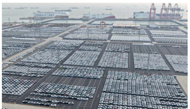
سيارات صينية الصنع تنتظر إعادة شحنها للتصدير في ميناء بمدينة سوتشو، بمقاطعة جيانجسو شرقي الصين.

ستوكهولم. بكين. وكالات: أفاد معهد ستوكهولم الدولي لأبحاث السلام (سيبري) بأن الإنفاق العسكري العالمي ارتفع إلى مستوى قياسي في عام ٢٠٢٥، مسجلاً العام الحادي عشر على التوالي من الزيادات مدفوعاً بالحروب والتوترات الجيوسياسية. وأظهرت بيانات «سيبري» أن الإنفاق المعدل حسب التضخم ارتفع بنسبة ٢.٩٪ على أساس سنوي ليصل إلى ما يقرب من ٢.٨٩ تريليون دولار، مما يرفع الزيادة خلال العقد الماضي إلى ٤١٪. ووفقاً للتقرير، كانت الزيادة أبطأ مما كانت عليه في عام ٢٠٢٤، مما يعكس انخفاضاً في الإنفاق العسكري الأميركي على المساعدات لأوكرانيا، رغم أن واشنطن زادت الاستثمار في قدراتها النووية والتقليدية الخاصة. وقال خبير «سيبري» ديجو لوبيز دا سيلفا إن الولايات المتحدة ظلت أكبر منفق عسكري في العالم بفارق كبير، ومن المتوقع أن ترفع نفقاتها مرة أخرى بعد الإعلان عن خطط لزيادة الإنفاق.