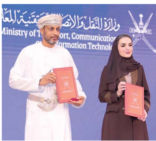
المذكرات تهدف إلى تمكين الكفاءات العمانية

الحضور الدولي لسلطنة عُمان من خلال الانضمام إلى اتفاقيات عالمية. وفيما يتعلق بالتوجهات المستقبلية، أوضح سعادته أن المرحلة المقبلة ستركز على تعظيم الأثر الاقتصادي من خلال تأهيل ١٠,٠٠٠ باحث عن عمل خلال السنوات الخمس القادمة عبر مسارات رئيسية: مسارجاهية لسوق العمل، الذي يستهدف توفير أكثر من ٥,٠٠٠ فرصة تدريبية نوعية مرتبطة باحتياجات السوق، ومسار بناء القدرات، الذي يوفر ٥,٠٠٠ فرصة تدريبية لتعزيز المهارات والمعارف التقنية، كما بين أن المبادرة ستنتقل إلى مرحلة التمكين المرتبطة مباشرة بالتوظيف والإنتاجية، مع التوسع في البرامج النوعية