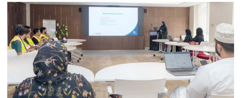
البرنامج شهد تنفيذ حزمة من الأنشطة التدريبية والتطبيقية

الرقمي والاستدامة. كما اختتم البرنامج التدريبي بتنفيذ جلسات حوارية، قدم خلالها المدربون عرضاً متميزاً عكست مدى استفادتهم من البرنامج، إلى جانب استعراض أبرز المهام والمشروعات التي شاركوا فيها عبر مختلف الدوائر الفنية والإدارية، وتسلط الضوء على التحديات التي واجهوها وكيفية تعاملهم معها، إضافة إلى طرح مجموعة من المقترحات النوعية لتطوير البرنامج وتعزيز أثره على المستويين الفردي والمؤسسي. وقال إسحاق الحرصي مدير عام الموارد البشرية (بالوكالة) في الشركة: أن البرنامج يأتي امتداداً لنهج الشركة في الاستثمار في الكفاءات الوطنية الشابة، وترسيخ دورها في دعم المنظومة التعليمية وتعزيز الشراكة في مؤسسات التعليم العالي، مشيراً إلى أن هذه المبادرات تسهم في إعداد جيل مؤهل يمتلك المهارات والمعارف اللازمة لمواجهة متطلبات المرحلة المقبلة. وأضاف: نفخر بما حققه