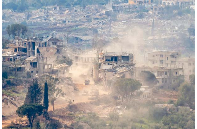
دبابات ومركبات عسكرية إسرائيلية تسير على الطريق بين منازل مدمرة في جنوب لبنان.

موسكو. وعواصم وكالات: وصل وزير الخارجية الإيراني عباس عراقجي روسيا في سياق تحرك دبلوماسي حيث قالت طهران ان عراقجي يناقش تطورات ما بعد الحرب وسط ابناء عن رسائل متبادلة بين واشنطن وطهران. وقال عراقجي لدى وصوله إلى روسيا إن هدف زيارته «مناقشة التطورات المتعلقة بالحرب والتشاور مع أصدقائنا». وأضاف أن «المطالب المبالغ فيها، من جانب واشنطن هي التي أتت إلى فشل الجولة السابقة من المفاوضات