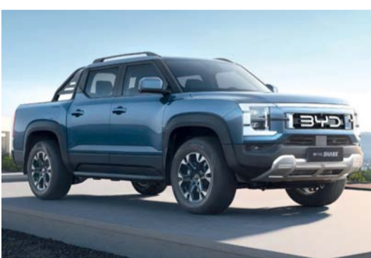
شاحنة شارك ٦ أداة مثالية للعمل

بجماليات على شكل سمكة القرش القوية ويكتمل مظهرها الجريء وخطوطها الديناميكية بمجموعة ألوان راقية تشمل الأبيض اللطيف والأسود الداكن والرمادي الأطلسي والأخضر الرمادي. أما في الداخل فتوفر قمرة القيادة العائمة المستقبلية ملاذاً فاخراً مليئاً بالتكنولوجيا البيئية وتتميز المقصورة الداخلية بنظام معلومات وترفيه بشاشة ١٢,٨ بوصة، وشاشة عرض عمودية، ونظام تحكم مناخي ثنائي المناطق