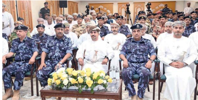
■ تعزيز التوعية المجتمعية بخطورة المجازفة في مجاري الأودية