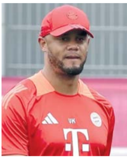
■ فنسان كومباني

وفي المواجهة الثانية، يملك أرسنال، وصيف ٢٠٠٦، تفوقاً معنوياً على أتليكو مدريد، بعد أن هزمه ٤-٠ في دور المجموعة في أكتوبر، لكن هذا لن يكون كافياً في المسابقة القارية التي حقق فيها أتليكو، وصيف ١٩٧٤ و ٢٠١٤، مفاجأة مدوية باقصائه لموطنه برشلونة في ربع النهائي (٢-٠، ١-٠).