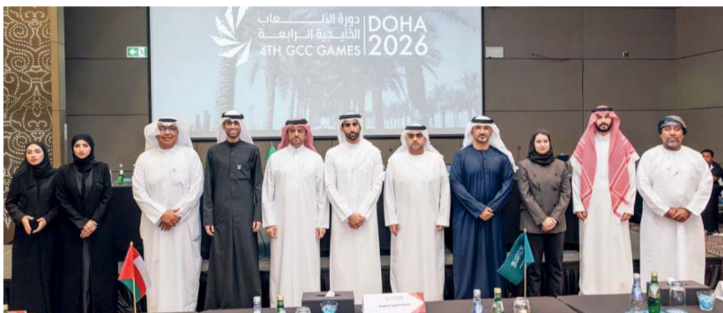
صورة جماعية لمديري البعثات الرياضية الخليجية في الاجتماع التحضيري للدورة

رفعت اللجان العاملة في دورة الألعاب الخليجية الرابعة «الدوحة ٢٠٢٦» من وتيرة تحضيراتها مع اقتراب العد التنازلي لانطلاق الحدث الخليجي المرتقب، والمقرر إقامته خلال الفترة من ١١ إلى ٢٢ مايو المقبل. وتأتي هذه الاستعدادات في إطار الحرص على إخراج نسخة استثنائية تعكس مكانة دولة قطر التنظيمية والرياضية وتؤكد قدرتها على استضافة كافة الأحداث والفعاليات الإقليمية والدولية وفق أعلى المعايير العالمية.