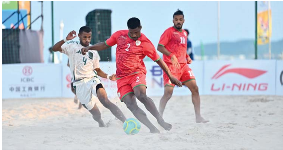
■ من مباراة منتخبنا والسعودية