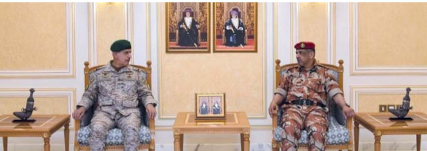
حامد سكرون يستقبل عبدالعزيز البلوي

مسقط - النعمانية: استقبل اللواء الركن حامد بن أحمد سكرون رئيس أكاديمية الدراسات الاستراتيجية والدفاعية في مكتبه بمعسكر بيت الفلج اللواء الركن عبدالعزيز بن أحمد البلوي قائد القيادة العسكرية الموحدة لدول الخليج العربي والوفد العسكري المرافق له. وقد رحب اللواء الركن رئيس أكاديمية الدراسات الاستراتيجية والدفاعية بقائد القيادة العسكرية الموحدة لدول مجلس التعاون لدول الخليج العربية، وتبادل الجانبان عدداً من الموضوعات العسكرية ذات الاهتمام المشترك.