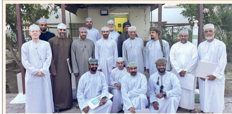
■ اللقاء شهد نقاشات ثرية حول تجارب الفنانين وأساليبهم المختلفة