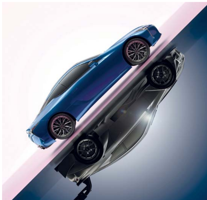
التصميم الخارجي للسيارة يمثل تحفة فنية

تماماً مع أجل كاربلاي، وأندرويد أوتو، ونظام صوتي من مارك ليفينسون محيطي فاخر مكون من ١٣ مكبر صوت.. وغيرها الكثير. وتولي لكزس أهمية قصوى لراحة البال من خلال تجهيز سيارة «إل سي ٥٠٠» بنظام لكزس للسلامة بلس، حيث صُممت هذه المجموعة من تقنيات السلامة النشطة لمنع الحوادث وحماية الركاب، وتشمل: