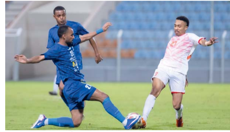
دورينا على صفيح ساخن... وغياب الجماهير أمر سلبي

بعد خسارته أمام النهضة (٢-١) في الجولة الماضية، ما زاد من الضغوط على الفريق للعودة سريعًا، النصر فريق منظم، يمتلك خبرة كبيرة في التعامل مع المباريات الكبرى، وصحار يعتمد على البروق القتالية والهجمات المرتدة، لكنه يعاني دفاعيًا، النصر يعلم بأنه لا بد من الفوز لمواصلة مطاردة السيب المتصدر والحفاظ على مركز الوصافة في حالة عدم اللحاق بالسيب، أما صحار فهدفه استعادة التوازن والهروب من دوامة التراجع. النصر يدرك أن أي تعثر جديد قد يعيده عن حلم اللقب، لذلك سيدخل المباراة بعقلية «لا مجال للفهوات»، ومن خلال الواقع فإن النصر الأقرب على الورق، لكن صحار قادر على إحداث المفاجأة إذا أحسن استغلال الفرص.