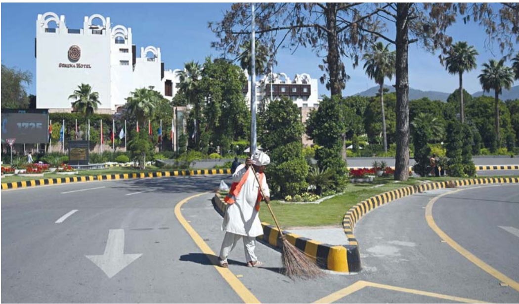
■ عامل نظافة يكنس شارعاً أمام فندق سيرينا، الذي استضاف الجولة الأولى من محادثات السلام الأميركية الإيرانية بعد أن أعادت السلطات فتح المنطقة الحمراء في إسلام آباد.

طهران . عواصم . وكالات: أكد وزير الخارجية الإيراني عباس عراقجي أن طهران تنتظر لسترة مدى جدية واشنطن بشأن الدبلوماسية كسبيل لوضع حد نهائي للحرب في الشرق الأوسط حيث يعود عراقجي إلى باكستان قبل سفره إلى روسيا وذلك بعد أن ألغى الرئيس الأميركي دونالد ترامب مساء السبت زيارة كانت مرتقبة لمبعوثيه ستيف ويتكوف وجاريد كوشنر إلى إسلام آباد. وبعيد إعلان البيت الأبيض أن المبعوثين ستيف ويتكوف وجاريد كوشنر سيتوجهان إلى إسلام آباد أكد ترامب أنه ألغى الخطوة.