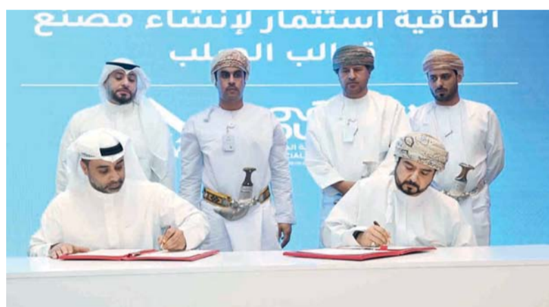
الاتفاقيات تمثل امتداداً للجهود المتواصلة لاستقطاب الاستثمارات النوعية

كما تم توقيع اتفاقية استثمار لإنشاء مشروع تصنيع المواد الفعالة للأغذية المستخدمة في بطاريات الليثيوم للمركبات الكهربائية بالمنطقة الحرة بصلاصة بتكلفة استثمارية تبلغ ٣٥ مليون ريال عماني، وسيتم تنفيذ المشروع من قبل شركة «جي إف سي إل إي» للمواد المتقدمة، حيث يُعد المشروع ثاني مشروع للشركة في قطاع المركبات الكهربائية في