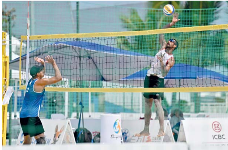
مباراة منتخبنا وكازاخستان