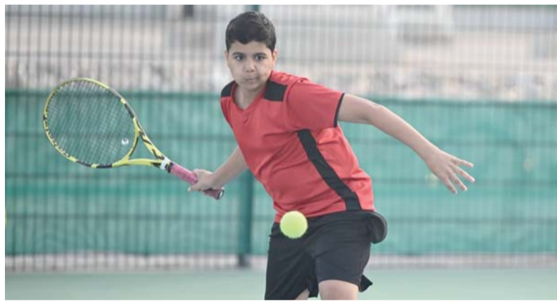
البطولة تشهد مشاركة جيدة من مختلف الأعمار السنوية

رصيدهم حيث عمل الاتحاد على احتساب نقاط التصنيف للاعبين في كل بطولة من البطولات المحلية والتي ستستخدم اللاعبين كذلك في تمثيل المنتخبات الوطنية في المشاركات القارية والدولية.