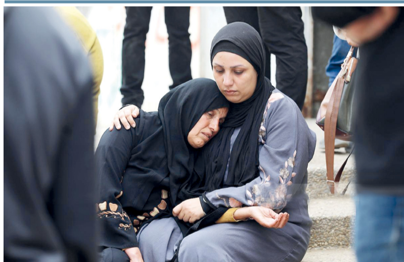
فلسطينية تواسي قريبة شهيد فلسطيني قبل تشييعه في مستشفى الشفاء في حي الشيخ رضوان بمدينة غزة.

فلسطينية تواسي قريبة شهيد فلسطيني قبل تشييعه في مستشفى الشفاء في حي الشيخ رضوان بمدينة غزة. باكستان تترقب عودة عراقجي وترامب ينتظر «الوثيقة الأفضل» بين طهران وواشنطن، زيارة جديدة لوزير الخارجية الإيراني عباس عراقجي، ضمن مساعي إنهاء الحرب، فيما ينتظر الرئيس الأميركي دونالد ترامب ما يمكن وصفه بـ«الوثيقة الأفضل» من إيران. وسيلح عراقجي في إسلام آباد للمرة الثانية، وهذه المرة غداً إلغاء ترامب زيارة كان يتوقع أن يجريها مبعوثه ستيف ويتكوف وجاريد كوشنر. وأوردت وكالة «ارنا» الرسمية أن بعض أعضاء الوفد المرافق لعراقجي عادوا إلى طهران للتشاور والحصول على التعليمات اللازمة بشأن القضايا المرتبطة بإنهاء الحرب، على أن يلتحقوا به في إسلام آباد. وفي واشنطن، أكد ترامب أن الإيرانيين «قدموا إلينا وثيقة كان يجب أن تكون أفضل مما هي عليه»، وأنه بعد إلغاء الزيارة «قدموا وثيقة جديدة أفضل، دون أن يبدي بتفاصيل». تفاصيل.....ص ٩