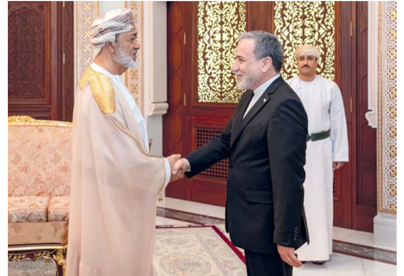
■ اللقاء بحث جهود الوساطة والمساعي الرامية إلى إنهاء النزاعات وتعزيز فرص التوصل إلى حلول سياسية مستدامة

ظلّ التحديّات الإقليمية الرّهانة. حضر المقابلة معالي السيد بدر بن حمد البوسعيدي وزير الخارجية، وسعادة إسماعيل بقائي المتحدث الرّسمي ورئيس مركز الدبلوماسية العامة والإعلام في وزارة الخارجية الإيرانية، وسعادة السفير موسى فرهنك سفير الجمهورية الإسلامية الإيرانية المعتمد لدى سلطنة عُمان.