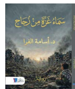
■ غلاف الرواية