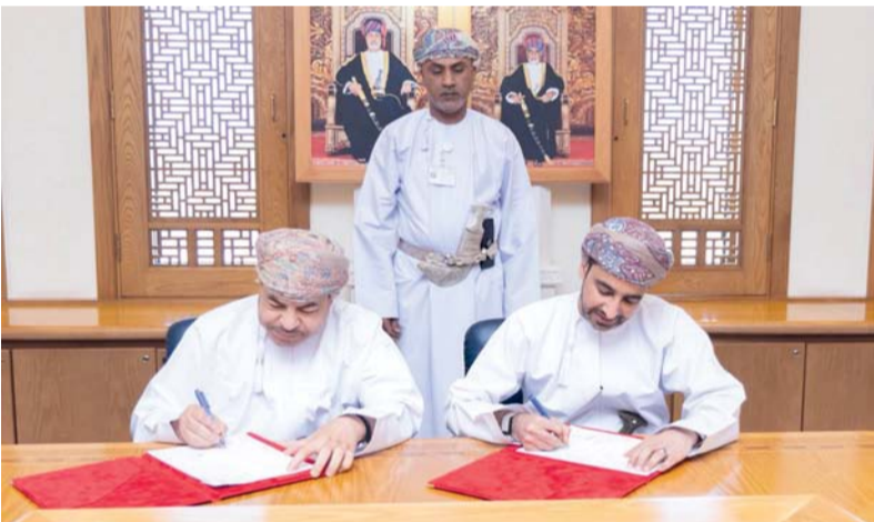
■ الإسهام في إعداد وتأهيل الكوادر الوطنية

مسقط . العُمانيّة: استقبل حضرة صاحب الجلالة السلطان هيمن بن طارق المعظم، حفظه الله ورعاه . أمس بقصر البركة العامر، معالي الدكتور سيد عباس عراقجي وزير خارجية الجمهورية الإسلامية الإيرانية، وفي مُستهل المقابلة، نقل معالي الضيف تحيّات فخامة الرّئيس مسعود بزشكيان رئيس الجمهورية الإسلامية الإيرانية