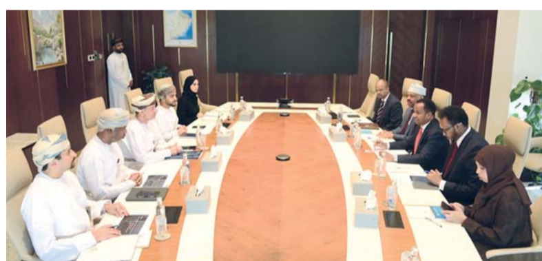
■ استعراض سبل تعزيز التعاون وتبادل الخبرات بين الجانبين

جهاز الاستثمار العُماني امس علي وزير الشؤون الخارجية والتعاون الدولي بجمهورية الصومال الفيدرالية والوفد المرافق له الذي يزور سلطنة