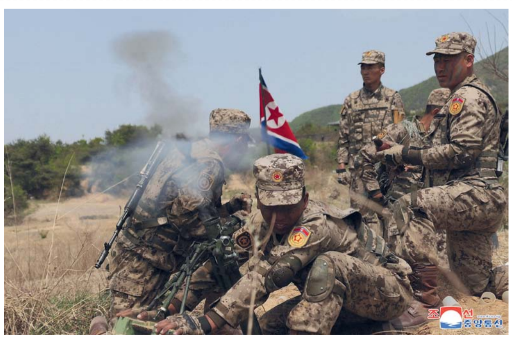
■ مناسفة لإطلاق قذائف الهاون بين وحدات المدفعية الخفيفة التابعة لوحدة مشتركة كبيرة مختلفة من الجيش الشعبي الكوري في موقع غير مُعلن عنه في كوريا الشمالية.

تايبه . د.ب.أ: رصدت وزارة الدفاع الوطني التايوانية ٢٨ طائرة عسكرية وثمان سفن حربية تابعة للصين بين الساعة السادسة صباح أمس الأحد. وذكرت الوزارة أن ١٨ من الطائرات الـ ٢٨ عبرت الخط الفاصل ودخلت منطقة تحديد الدفاع الجوي الشمالية والوسطى والجنوبية الغربية لتايوان. وردا على ذلك، نشرت تايبان طائرات وسفن حربية وأنظمة صاروخية ساحلية لمراقبة نشاط جيش التحرير الشعبي الصيني، حسب موقع تايبان نيوز. ورصدت وزارة الدفاع الوطني منذ بداية الشهر الجاري طائرات عسكرية صينية ١٨٧ مرة وسفناً ٢٠٧ مرات. ومنذ سبتمبر ٢٠٢٠، زادت بكين استخدامها لتكتيكات المنقطة الرمادية بزيادة عدد الطائرات العسكرية والسفن البحرية العاملة حول تايبان بشكل تدريجي.