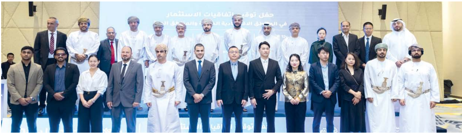
الاتفاقيات خطوة مهمة في مسار تعزيز التنوع الاقتصادي في المحافظات

وجاءت الاتفاقية الثانية لإنشاء مصنع متخصص في تصنيع منتجات البنية الأساسية وتنسيق المواقع والأسمنت باستثمار يبلغ ٥ ملايين ريال عماني من قبل