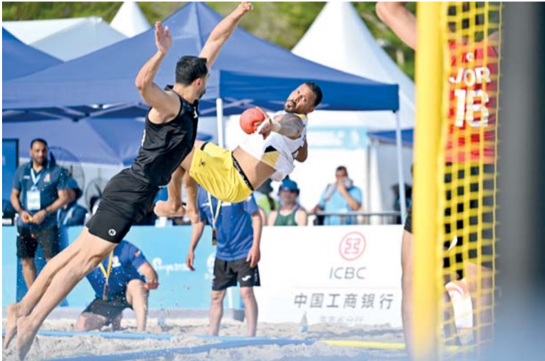
من مباراة منتخبنا ونظيره الأردني في مسابقة كرة اليد الشاطئية