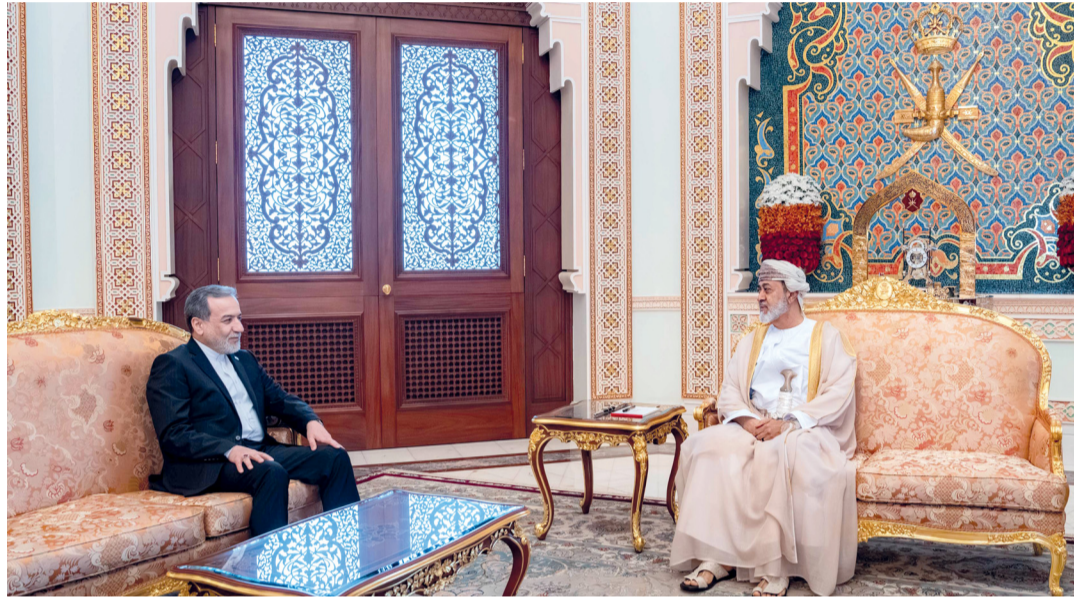
جلالة السلطان يتشاور مع وزير الخارجية الإيراني حول مستجدات الأوضاع في المنطقة وجهود الوساطة والمساوي الرامية إلى إنهاء النزاعات.

جلالة السلطان يهنئ رؤساء جنوب إفريقيا وتوجو وملك هولندا