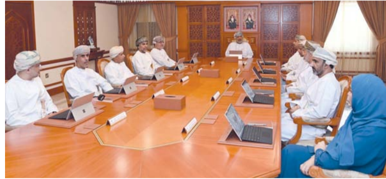
اجتماع اللجنة الرئيسية لانتخابات المجالس البلدية

شهد الأسبوع الماضي عدداً من الفعاليات والأحداث والمناسبات... حيث استقبل معالي السيد بدر بن حمد البوسعيدي وزير الخارجية، معالي الدكتور خليل الرحمن، وزير خارجية جمهورية بنجلاديش الشعبية، بديوان عام وزارة الخارجية.