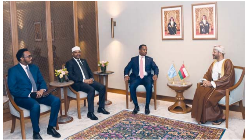
بدر بن حمد يستقبل عبد السلام عبيد

مسقط، العُمانية: استقبل معالي السيد بدر بن حمد البوسعيدي وزير الخارجية بديوان عام الوزارة، معالي عبد السلام عبيد علي وزير الشؤون الخارجية والتعاون الدولي في جمهورية الصومال الفيدرالية الشقيقة في إطار الزيارة الرسمية التي يقوم بها إلى سلطنة عُمان.