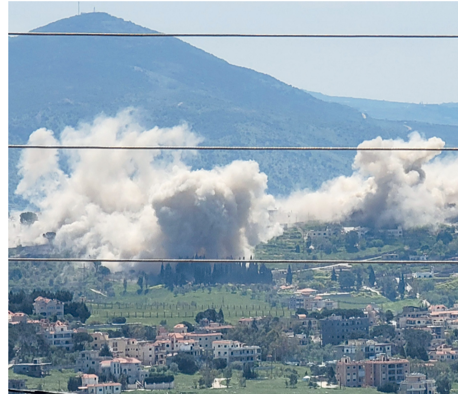
الدخان يتصاعد جراء انفجارات في قرية الخيام جنوب لبنان حيث يفجر الجيش «الإسرائيلي» منازل سكنية.

إسلام آباد . عواصم . وكالات: استقبلت باكستان مبعوثين من إيران والولايات المتحدة سعياً لإعادة المفاوضات لإنهاء الحرب التي شنتها الولايات المتحدة و«إسرائيل» على إيران، حيث يحمل المبعوثون الإيرانيون الرد على المقترحات الأميركية. والتقى وزير الخارجية الإيراني عباس عراقجي قائد الجيش الباكستاني الجنرال عاصم منير، بحضور وزير الداخلية الباكستاني ومستشار الأمن القومي. وقالت مصادر أمنية باكستانية إن عراقجي جاء ومعه رد على المقترحات الأميركية التي تم نقلها خلال زيارة منير ل طهران التي استمرت ثلاثة أيام الأسبوع قبل الماضي. وقالت وزارة الخارجية في بيان إن الوزير الإيراني «سيبحث آخر التطورات الإقليمية والجهود الجارية من أجل السلام والاستقرار الإقليميين». وكان البيت الأبيض قد أعلن أن المبعوث الأميركي الخاص ستيف ويتكوف وصهر الرئيس دونالد ترامب، جاريد كوشنر يتوجهان إلى إسلام آباد لإجراء محادثات مع مسؤولين إيرانيين، لكن لم يخضع بعد ما إذا كانا سيلتقيان عراقجي بعد أن استبعدت إيران المفاوضات المباشرة. تفاصيل: «ص»