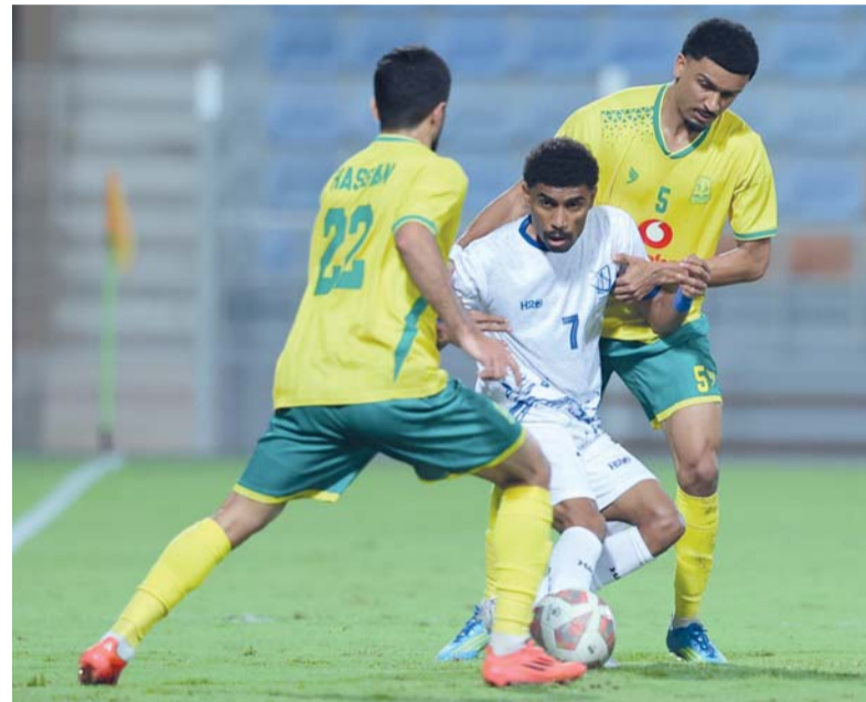
■ السيب يسعى لمواصلة صدارته للدوري