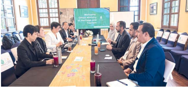
الجانبان العماني والتايلاندي استعرضا نماذج الشراكة مع القطاعين العام والخاص

وناقش اجتماع لجنة التعاون التجاري عدد من الموضوعات ذات الصلة بتعزيز العمل الخليجي المشترك، ومستجدات مفاوضات اتفاقيات التجارة الحرة مع الدول والتكتلات الدولية، إلى جانب متابعة تنفيذ قرارات المجلس الأعلى. واستعرضت اللجنة مستجدات القوانين التجارية في دول مجلس التعاون لاسيما مشروع نظام المنافسة الخليجي، والإطار التشريعي الموحد للتجارة الإلكترونية، إضافة إلى بحث التحديات المرتبطة بالسجل التجاري في نقاط الدخول الأولى لأغراض الفسخ الجمركي وأهمية معالجتها بما يساهم في تسهيل الإجراءات وتعزيز انسيابية التجارة البينية.