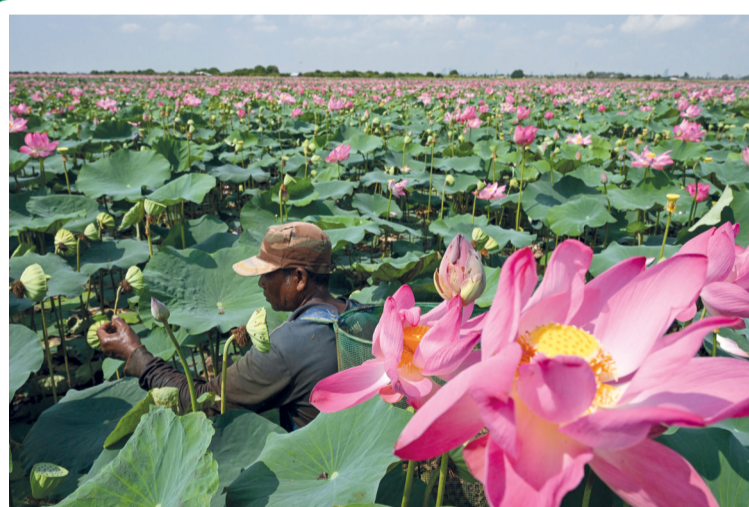
■ مزارع يقطف ثمار اللوتس من حقل في مقاطعة كاندال بكمبوديا.

جنيف . وكالات: أعلنت منظمة الصحة العالمية اعتماد أول دواء للملاريا في العالم مخصص للرضع. وبمناسبة اليوم العالمي للملاريا الذي يوافق الـ٢٥ من أبريل قالت المنظمة إن نسخة الدواء المركب «أرتيميثير لوميفانترين» صممت خصيصاً لحدثي الولادة والرضع الذين يصل وزنهم إلى ٥ كيلوجرامات. ومن المؤمل أن يساهم هذا الدواء في سد فجوة في الرعاية الصحية لنحو ٣٠ مليون رضيع يولدون سنوياً في المناطق الموبوءة بالملاريا في أنحاء إفريقيا، ويُعالج العديد منهم، حتى الآن، بجرعات مخصصة للأطفال الأكبر سناً، وهو ما ينطوي على خطر حدوث آثار جانبية.