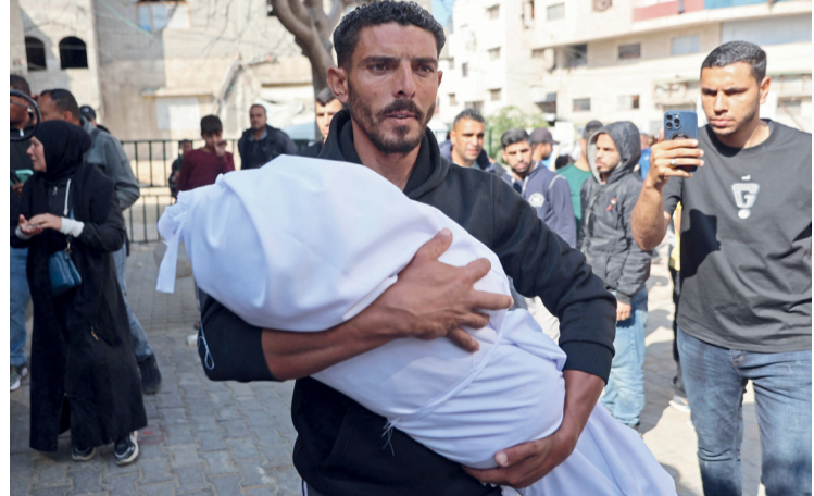
فلسطيني يحمل جثمان طفل شهيد قبل تشييعه من مستشفى في مدينة غزة أمس.

في اليوم العالمي للملاريا.. تأكيد على تعزيز الترصد وتتبع مصدر العدوى مسقط . العمانية: شاركت سلطنة عُمان دول العالم الاحتفاء باليوم العالمي للملاريا (٢٥ أبريل من كل عام) عبر شعار «عازمون على القضاء على الملاريا: القدرة في أيدينا، والواجب بنادينا»، حيث تواصل وزارة الصحة في سلطنة عمان جهودها المتقدمة والمتكاملة في مكافحة الملاريا.. وتطبق الوزارة استراتجية وطنية محدثة تحت مسمى «الاستراتيجية الوطنية لمنع عودة انتقال الملاريا»، وتركز هذه الاستراتيجية على تعزيز الترصد الوبائي وتصنيف الحالات وتتبع مصدر العدوى لضمان عدم فقدان أي حالة إلى جانب الكشف المبكر والعلاج الفوري والفعال لقطع سلسلة العدوى مع توفير العلاج مجاناً لجميع الجنسيات. تفاصيل: «ص»