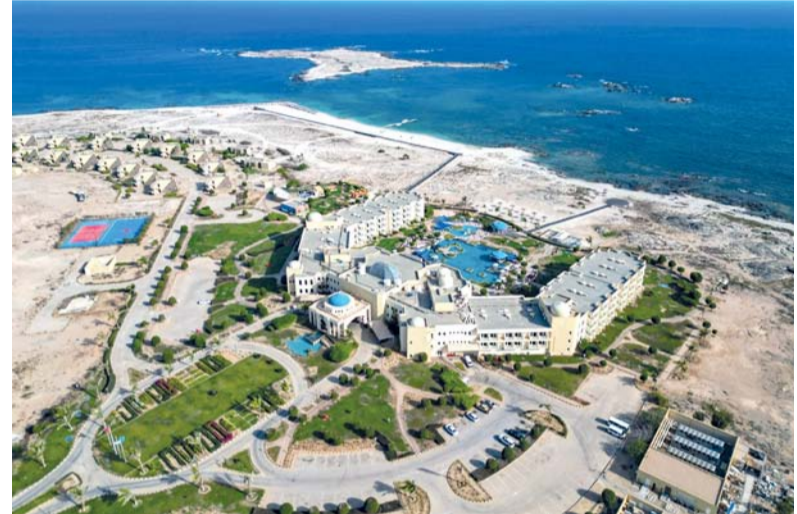
خدمات الإقامة سجلت نمواً بنسبة ١٧ بالمائة بنهاية ديسمبر ٢٠٢٥ م

بنحو ٣٣١ مليون ريال عُمانى في الربع المقابل من عام ٢٠٢٤، فيما سجل إسهام السياحة في الناتج المحلي الإجمالي ٣ بالمائة خلال الربع الرابع من عام ٢٠٢٥. وعلى مستوى الأنشطة الاقتصادية بالأسعار الجارية، وضح التقرير أن خدمات الإقامة سجلت نمواً بنسبة ١٧ بالمائة لتبلغ ٢٥٢,١ مليون ريال عُمانى بنهاية ديسمبر ٢٠٢٥، كما ارتفعت مساهمة الخدمات الأخرى بنسبة ١٨ بالمائة لتصل إلى ١٩٧,٩ مليون ريال عُمانى، في حين زادت خدمات المطاعم بنسبة ٣,٥ بالمائة لتبلغ ١٩٨,٩ مليون ريال عُمانى، وسجلت خدمات النقل نمواً بنسبة ١,١ بالمائة لتصل إلى ١٩٦,٥ مليون ريال عُمانى. وفي المقابل، تراجعت خدمات وكالات السفر والحجز بنسبة ١٢,٢ بالمائة لتسجل ١٧٤,٩ مليون ريال عُمانى بنهاية ديسمبر ٢٠٢٥، بارتفاع نسبيته ٥,٥ بالمائة، فيما سجل إجمالي الاستهلاك نحو مليار و٧٩ مليون ريال عُمانى، مرتفعاً بنسبة ٤,٤ بالمائة مقارنة بالفترة نفسها من عام ٢٠٢٤.