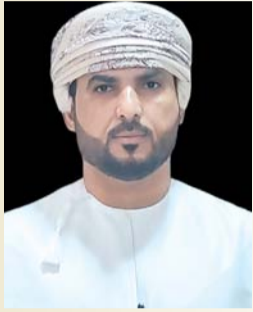
طاهر العميري شاعر عماني