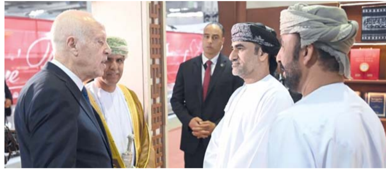
الحضور تجول في جناح سلطنة عُمان

خلف الفرح والغيوم القرمزية تضيء أيامهم مشرفة ضحكاتهم بالملح تتقافز أحلامهم مثل السناجب بغصن الريح، بل المطر أصواتهم والشجر. تندرج الشمس خصلة ناعمة من ذهب يتدرج الوقت موسيقا وأصابع يذوب الثلج بأطرافها وطيور سال الندى بأهدابها والسهر. في درهم للأغاني المبهجة يورق الأسفلت، وأرواحهم نحو النايين تلهث ظامية مسرعة مثل الظبا للظلال الباردة عن فخاخ العمر وثبوت أثنائها الصدى والشجر. تحففوا من جراح أيامهم من وهم أسلافهم صادقوا الأشجار، وتبادلوا الأناخب والأمنيات الراضية. نادموا الساحات، وتشاركوا الطرقات وعيونهم ينتزه الضوء على جدرانها والقرم. من يسأل الوقت عن أيام فاض الوجع بأسرارها والزمن! من يوقض الذاكرة في حفلة اللذة القصوى! تضيق العبارة، تتسع دايرة. يتقارب الحلم، يخضر المدى، والسما تمسح بمبديها البنفسجي عن طيور الثلج حزن الليالي وأزتيك العمر.