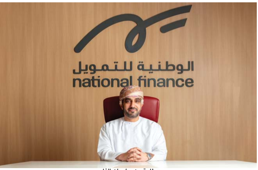
طارق بن سليمان الفارسي

في ظل التنافس المتنامي في القطاع المالي والمصرفي، أصبحت الشركات تطوّر مواردها وإمكاناتها للابتكار في تطوير عملياتها التشغيلية، والاستثمار في الكفاءات البشرية، وصنع الفرص لإيجاد مساحات جديدة للريادة السوقية. وفي هذا السياق، تمكّنت الشركة الوطنية للتمويل من أن تؤسس مكانتها الرصينة على خريطة الاقتصاد الوطني، ليس عبر النمو المالي المشهود عليه فحسب، وإنما عبر كسر الأرقام المحققة خلال السنوات الماضية بأخرى أقوى، إلى جانب تعزيزها لركائز الاستدامة، والتحول الرقمي، والتميز في خدمة العملاء. وفي حوار مع طارق بن سليمان الفارسي الرئيس التنفيذي للشركة الوطنية للتمويل، كشف الرئيس التنفيذي عن أهم المحطات التي قادت الوطنية للتمويل إلى تحقيق الريادة في السوق على مختلف الأصعدة المتعلقة بالقيادة الاستراتيجية، والأداء المالي، وإدارة وتمكين الكفاءات الوطنية، وفيما يلي مضابط الحوار : * كيف تقيّمون الأداء المالي للشركة خلال عام ٢٠٢٥، وما أبرز العوامل التي ساهمت في تحقيق هذا الأداء؟ * استطاعت الوطنية للتمويل تحقيق أداء مالي قوي وتنافسي خلال عام ٢٠٢٥، حيث يعكس ذلك الانضباط في التنفيذ، وكفاءة العمليات التشغيلية، والجدارة في إدارة المخاطر بفعالية. وقد ارتفع الربح قبل الضريبة إلى ١٨,٢٠ مليون ريال عُمانى مقارنة بـ ١٤,٢٥ مليون ريال عُمانى في عام ٢٠٢٤، فيما بلغ صافي الربح