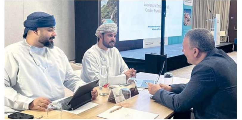
المرحلة المقبلة تركز على توسيع نطاق التوزيع الرقمي للتجارب السياحية

شهد الأسبوع الماضي العديد من الأحداث الاقتصادية والتي منها، تم بمدينة بولينا بتايلاند عقد سلسلة لقاءات ثنائية بين سلطنة عُمان ومملكة تايلاند لبحث أوجه التعاون وتبادل الخبرات في مجالات تطوير الوجهات السياحية وسياحة الأعمال والاستدامة، مع عدد من المسؤولين في الجهات المتخصصة، برئاسة معالي السيد إبراهيم بن سعيد البوسعيدي وزير التراث والسياحة، والوفد المرافق.