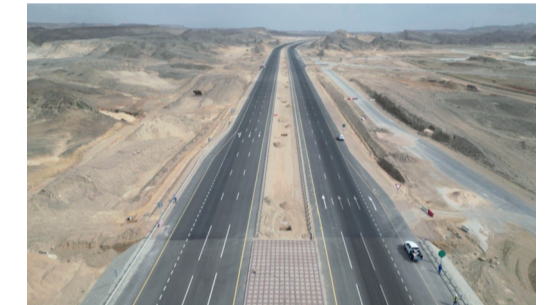
مشروعات الطرق بالمنطقة تستهدف تعزيز جاذبية الدقم وتهيئتها لاستقطاب المزيد من الاستثمارات

إسلام آباد . عواصم . وكالات: استقبلت باكستان مبعوثين من إيران والولايات المتحدة سعياً لإعادة المفاوضات لإنهاء الحرب التي شنتها الولايات المتحدة و«إسرائيل» على إيران، حيث يحمل المبعوثون الإيرانيون الرد على المقترحات الأميركية. والتقى وزير الخارجية الإيراني عباس عراقجي قائد الجيش الباكستاني الجنرال عاصم منير، بحضور وزير الداخلية الباكستاني ومستشار الأمن القومي. وقالت مصادر أمنية باكستانية إن عراقجي جاء ومعه رد على المقترحات الأميركية التي تم نقلها خلال زيارة منير ل طهران التي استمرت ثلاثة أيام الأسبوع قبل الماضي. وقالت وزارة الخارجية في بيان إن الوزير الإيراني «سيبحث آخر التطورات الإقليمية والجهود الجارية من أجل السلام والاستقرار الإقليميين». وكان البيت الأبيض قد أعلن أن المبعوث الأميركي الخاص ستيف ويتكوف وصهر الرئيس دونالد ترامب، جاريد كوشنر يتوجهان إلى إسلام آباد لإجراء محادثات مع مسؤولين إيرانيين، لكن لم يخضع بعد ما إذا كانا سيلتقيان عراقجي بعد أن استبعدت إيران المفاوضات المباشرة. تفاصيل: «ص»