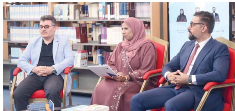
المشاركون في الجلسة الحوارية

المعرفة والذائقة، فهي في الحقل العلمي وسيلة دقيقة لنقل المفاهيم والمصطلحات، وتيسير تداول المعرفة بين المجتمعات العلمية، وهي في الحقل الأدبي فعل إبداع يعيد بناء النص في لغة جديدة، ويحفظ روحه وإيقاعه وصوره وخلفياته الثقافية. ومن هذا المنطلق، دارت الجلسة في مسارين متكاملين: الترجمة العلمية، والترجمة الأدبية، مع عناية خاصة بما يثيره كل مسار من أسئلة تتصل بالدقة، والأسلوب، وسياق التلقي.