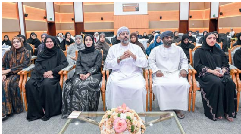
توفير دعم عملي مباشر لـ ٤٠ فئات ذوي الإعاقة الذهنية