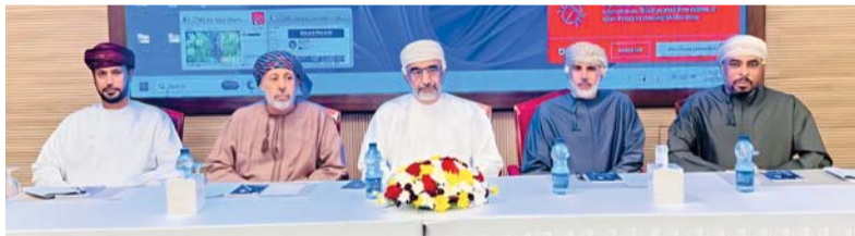
اللقاء شهد استعراضاً لعدد من التجارب والمبادرات

التواصل الاجتماعي، ووجدت أن هناك إقبال كبير من الناس، وبالأخص المجتمع العماني كان ينهز من هذه الجماليات، كونه من النادر من يقوم بنشر مثل هذا المحتوى، وهذا أعطاني دافعاً أكبر أن أوصل طريق شغفي وأستكشف وأنشر المزيد من المواقع. وأضاف: نظير المحتوى الذي كنت أقوم بنشره، جاءتني فرصة من شركة كويتية لتسيير رحلة في سلطنة عمان لـ ١٢ فرداً من مختلف الدول، وأحسبها الفرصة الذهبية بالنسبة لي لأعلن انطلاقتي من هذه الرحلة، حيث أعلنت انطلاقتي في سنة ٢٠١٧ فعلياً، وكونت مؤسسة خاصة لي تعتبر من أوائل المؤسسات في هذا القطاع على المستوى المحلي،