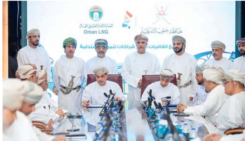
التوقيع على إحدى الاتفاقيات

وأكد سعادة المحافظ أن هذه الاتفاقيات تمثل امتداداً متقدماً للشراكات المؤسسية الفاعلة، وخطوة استراتيجية نحو تعظيم الأثر التنموي من خلال مبادرات تستند إلى أولويات واضحة واحتياجات حقيقية للمجتمع المحلي، مشيراً إلى أن تنوع المشاريع يعكس روية تنموية متكاملة تجمع بين الكفاءة الاقتصادية والبعد الاجتماعي. وأضاف: إن مشروع الطرق الجبلية يأتي ضمن جهود تكاملية بين المحافظة والشركة العمانية للغاز الطبيعي المسال وشركة «أوميفكو» لتعزيز البنية الأساسية وتحسين الربط بين التجمعات السكانية، فيما يشكل مشروع «مسار قهوان» رافداً استراتيجياً لتنشيط القطاع السياحي وتهيئة بيئة جاذبة للاستثمار.