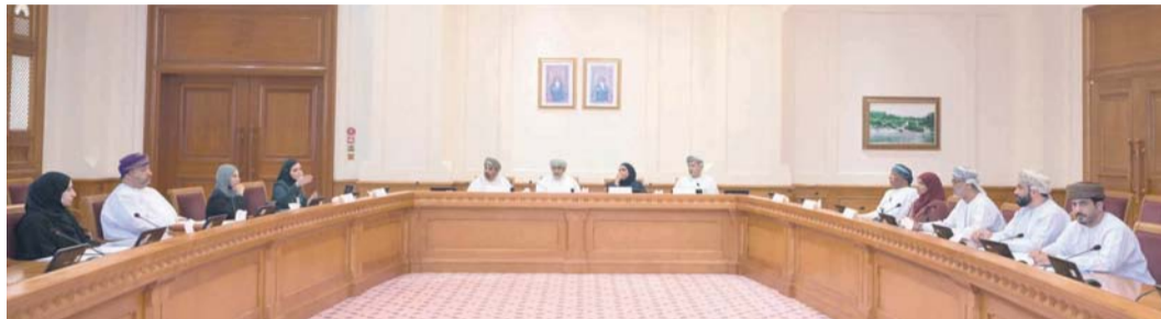
تقييم كفاءة مخرجات التدريب

والمطلوبات التنموية، ومدى توافق البيانات الإحصائية بين المركز الوطني لإحصاء والمعلومات والجهات الحكومية ذات الصلة، إلى جانب حصر المراكز التدريبية المعتمدة لدى المركز وتوزيعها على مختلف المحافظات، واستعرضت إحصاءات البرامج التدريبية للباحثين عن عمل وللعمال في القطاع الحكومي والخاص؛ بهدف تقييم كفاءة مخرجات التدريب ومدى مواكبتها لاحتياجات سوق العمل.