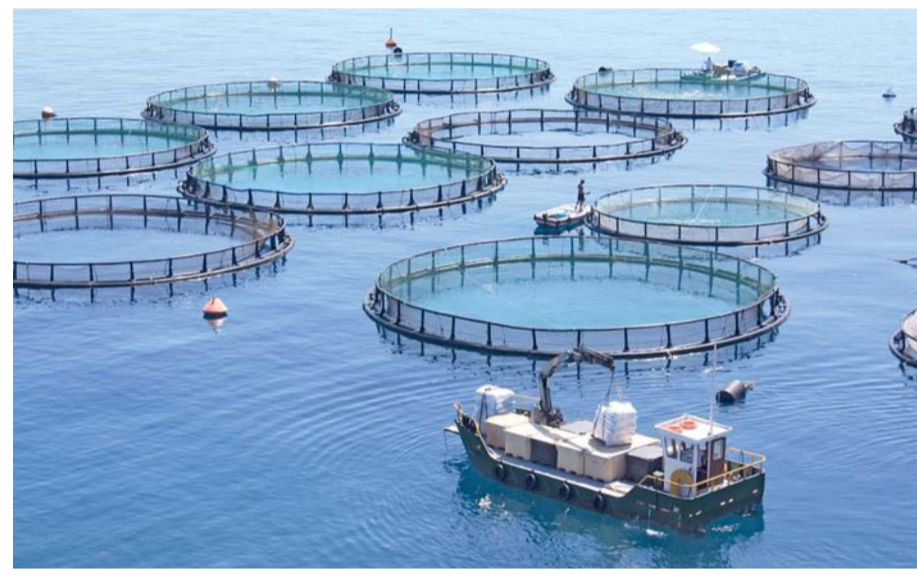
الفرص تعكس التوجه نحو استقطاب استثمارات نوعية تعتمد على التقنيات الحديثة

موضحاً أن الوزارة تعمل بالتعاون مع وزارة التجارة والصناعة وترويج الاستثمار ومنظمة «استثمر في عمان» ووزارة الإسكان والتخطيط العمراني في الترويج لهذه الفرص الاستثمارية في الأسواق المستهدفة، من خلال توحيد الجهود وتكامل الأدوار بين الجانب الفني والترويجي، بما يعزز جاذبية المشروعات للمستثمرين ويرفع من فرص تحويلها إلى استثمارات قائمة. وأضاف: إن هذا التكامل المؤسسي يسهم في تهيئة البيئة المناسبة لتنفيذ المشروعات، والدعم الفني، والأطر الأساسية، والتنظيمية الداعمة، بما يعزز تنافسية القطاع ويحقق مستهدفات الأمن الغذائي والاستدامة في سلطنة عمان. وتأتي هذه الحزمة ضمن توجه سلطنة عمان لتعزيز منظومة الأمن الغذائي كأحد مرتكزات التنويع الاقتصادي، بما يدعم الإنتاج المحلي ويرفع كفاءة سلاسل الإمداد ويسهم في تحقيق الاستدامة الشاملة لقطاع الأمن الغذائي. وتتيح منصة «استثمر في عمان» للمستثمرين الاطلاع على تفاصيل هذه الفرص، بما يشمل البيانات الفنية والقيم الاستثمارية ونماذج التشغيل، ويدعم جاهزية المشروعات للتنفيذ ويسهم في تسريع اتخاذ القرار الاستثماري.