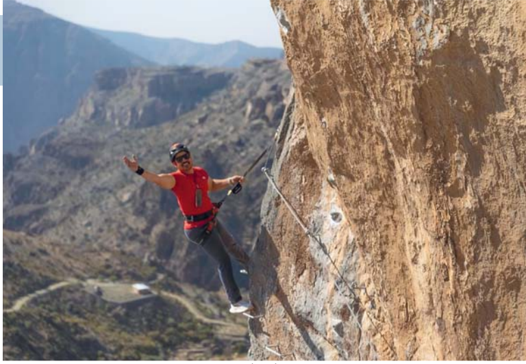
المغامر يجب أن يكون متمكناً فنياً من إدارة المغامرة بكل معطياتها

والدفاع المدني، فأنا أرى أن هذه الدورات دسمة وتقدم بمستوى عالمي واحترافي. وعما يميز الطبيعة العمانية من منظور مغامر ومصور في هذا المجال، سواء على مستوى السياحة البيئية أو تنظيم الفعاليات أو صناعة المحتوى المتخصص يقول: الفرص في هذا القطاع لا تعد ولا تحصى، كون هذا المجال ناشئاً ويمكن من خلاله إيجاد المشاريع والاستثمارات، فالطبيعة العمانية مؤهلة لأن تستقطب جميع أنواع الاستثمارات، مثل الأسلاك الانزلاقية والتلفريك وحدائق المغامرات الطبيعية المتكاملة، والمسارات الجبلية للدرجات الهوائية والعديد من التجارب التي يمكن استثمارها بالطريقة الصحيحة.