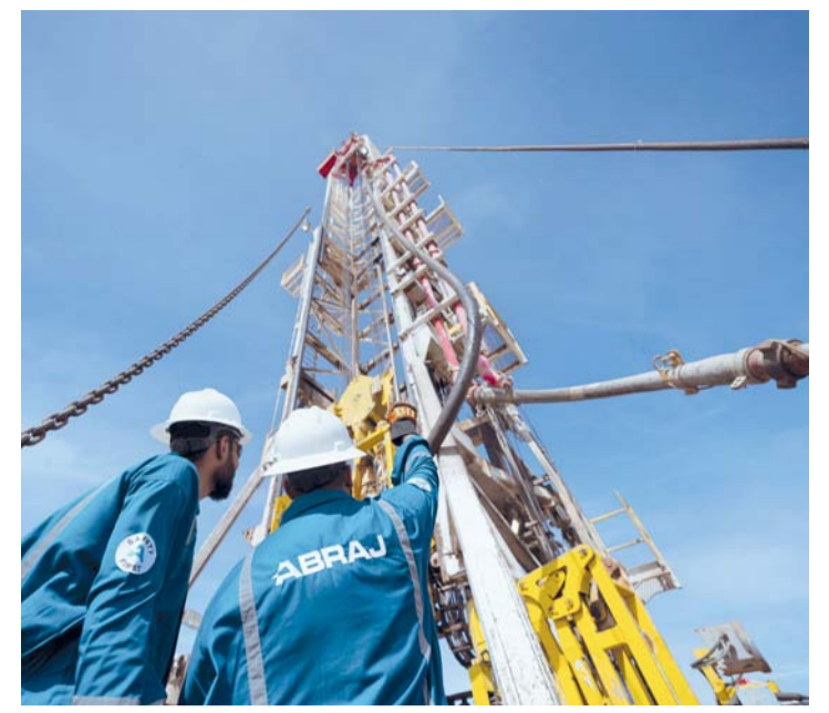
■ الشركة تحافظ على مكانتها الريادية في السوق المحلي