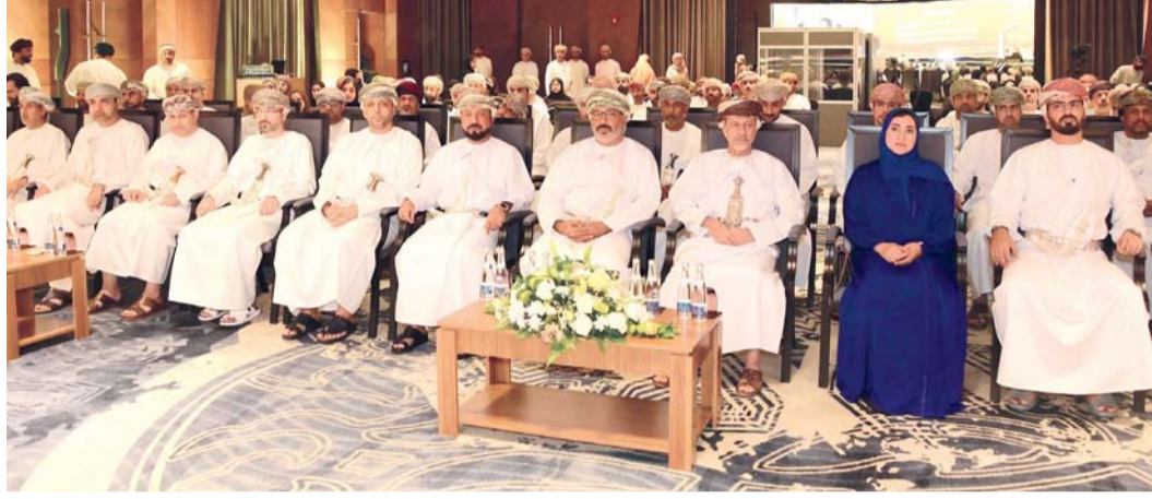
■ المنصة تقدم منظومة رقمية متكاملة لإدارة بيانات سلاسل التوريد