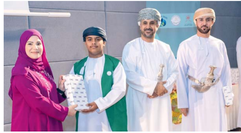
تكريم الطلبة المجيدين