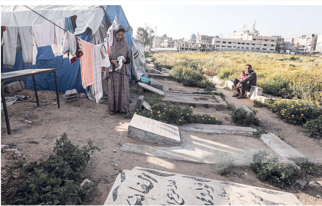
نازح فلسطيني يعيش مع أسرته في ظروف غير إنسانية في خيمة داخل مقبرة بدير الجبل وسط قطاع غزة بعد نزوحه من بيت حانون.

استشهد أمس ستة فلسطينيين، منهم امرأتان، بنيران قوات الاحتلال الإسرائيلي، مع مواصلة انتهاك اتفاق وقف إطلاق النار في قطاع غزة. كما استشهد فلسطينيان أحدهما طفل في الـ١٣ من عمره، في هجوم لمستوطنين على قرية في شمال الضفة الغربية المحتلة، بحسب ما أفاد الهلال الأحمر الفلسطيني. واقتحم مستوطنون مجدداً أسس المسجد الأقصى المبارك، بحماية مشددة من قوات الاحتلال الإسرائيلي. وأفادت مصادر بأن ١٥٢ مستعمراً اقتحموا باحات المسجد، وقاموا برفع علم الاحتلال وأداء طقوس تلمودية استفزازية داخله. تفاصيل ..... ص ٩