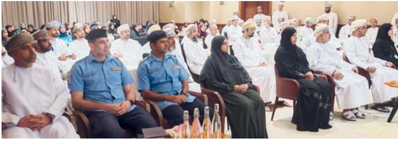
مناقشة أحدث المستجدات للرعاية الصحية الأولية