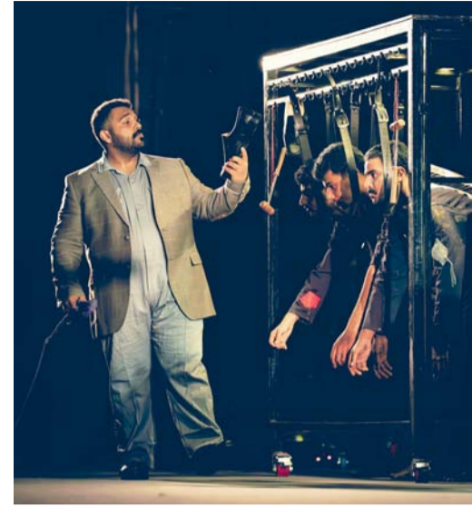
مشهد من العروض المسرحية

تُختتم اليوم العروض المسرحية المرافقة للمهرجان المسرحي الجامعي الثامن، الذي انطلق مطلع هذا الأسبوع في جامعة التقنية والعلوم التطبيقية بنزوى، على أن يُسدل الستار غدا الخميس بحفل ختامي يُعلن خلاله عن الأعمال الفائزة والجوائز الفردية، في ختام أسبوع حافل بالتجارب المسرحية والإبداع الطلابي. وقد شهدت أيام المهرجان تنوعاً لافتاً في العروض المسرحية التي قدمتها فروع الجامعة المختلفة، حيث قدمت امس الأول مسرحية (حذاء ليلة زفاف) لفرع الرستاق، والتي تناولت صراع الإنسان مع مسارات مفروضة عليه وما يرافقه من صراع داخلي بين الرغبة والواقع. فيما جاء العرض المسائي من فرع صحر عبر مسرحية (الذين يصفقون من الداخل)، التي ناقشت تناقضات الفكر الإنساني بين الظاهر والخفي. أما يوم امس فقدمت في الفعرة الصباحية مسرحية (برهوت) لفرع المصنعة، والتي تدور حول رحلة إلى بئر غامض يسعى أبطالها لاكتشاف أسرارها، لتقدمهم إلى صراعات