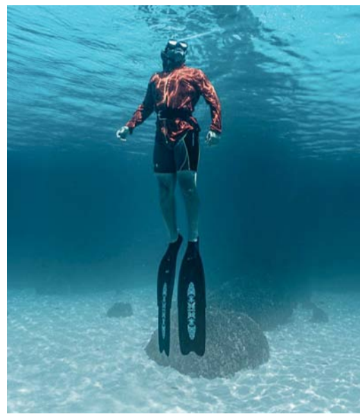
المغامرة هي الخروج عن المألوف والانغماس في واقع الطبيعة

وأضاف: أهم محظوظون بوجود دورات تدريبية تؤهلهم ليكونوا جاهزين بإمكانيات احترافية مع مركز تدريب المغامرة،