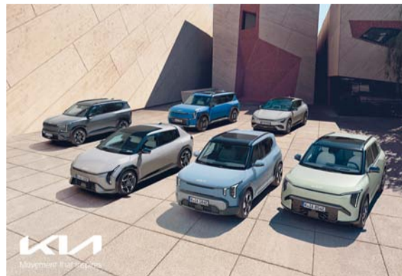
■ تشكيلة متنوعة من طرازات كيا الكهربائية

حصدت مؤخرا «كيا» لقب «أفضل مصنع» في جوائز TopGear.com للسيارات الكهربائية لعام ٢٠٢٦. وتكرّم هذه الجوائز السنوية، التي تُقام للعام السابع على التوالي، أفضل السيارات الكهربائية المتوفرة حاليا في المملكة المتحدة، وتشيد بالمصنعين الذين يقودون التحول نحو السيارات الكهربائية.