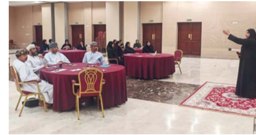
الحلقة تهدف إلى تمكين المشاركين من إدراك مفاهيم إدارة الأداء الحديثة

للتعامل مع ضغوطات العمل الحكومي بكفاءة، وتحويل ثقافة العمل من التركيز على الأنشطة إلى التركيز على النتائج والمخرجات، وركزت الحلقة التدريبية على محورين أساسيين هما: فلسفة الأداء ومنظومة القياس في اليوم الأول وتقنيات رفع الإنتاجية والذكاء العلمي في اليوم الثاني. وتأتي هذه الحلقة ضمن خطة