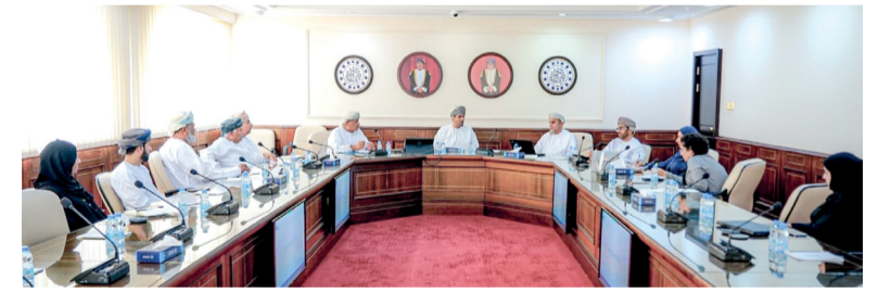
الاجتماع ناقش التحديات التي تواجه سوق العمل في سلطنة عُمان

لجنة التعليم والتدريب والابتكار بالغرقة تبحث مواءمة المخرجات مع احتياجات سوق العمل مسقط . «الوطن»: وتعزيز التكامل بين المؤسسات التعليمية والقطاعات الاقتصادية لتحسين فرص التوظيف. وفي محور التدريب والتأهيل المهني، أشار أعضاء اللجنة إلى عدد من التحديات، من بينها تفاوت جودة البرامج التدريبية ومحدودية قدرتها الاستيعابية، إضافة إلى الحاجة إلى تطوير مسارات مهنية واضحة، وبناء نظام متكامل للتدريب على رأس العمل. وأكدت اللجنة أهمية التعليم والتدريب المهني كخيار استراتيجي يسهم في تسريع اندماج الشباب في سوق العمل وتعزيز مهاراتهم العملية. كما ناقش الاجتماع قضايا التعمين والمسميات الوظيفية، حيث تم التأكيد على وجود تفاوت في بعض المسميات، التي تؤثر على دقة بيانات سوق العمل، إلى جانب تفاوت مستويات الأجور. ودعت اللجنة إلى توحيد المسميات الوظيفية وتعزيز أنظمة الإشراف والإدارة داخل المؤسسات، بما يسهم في تحسين بيئة العمل ورفع الكفاءة الإنتاجية.