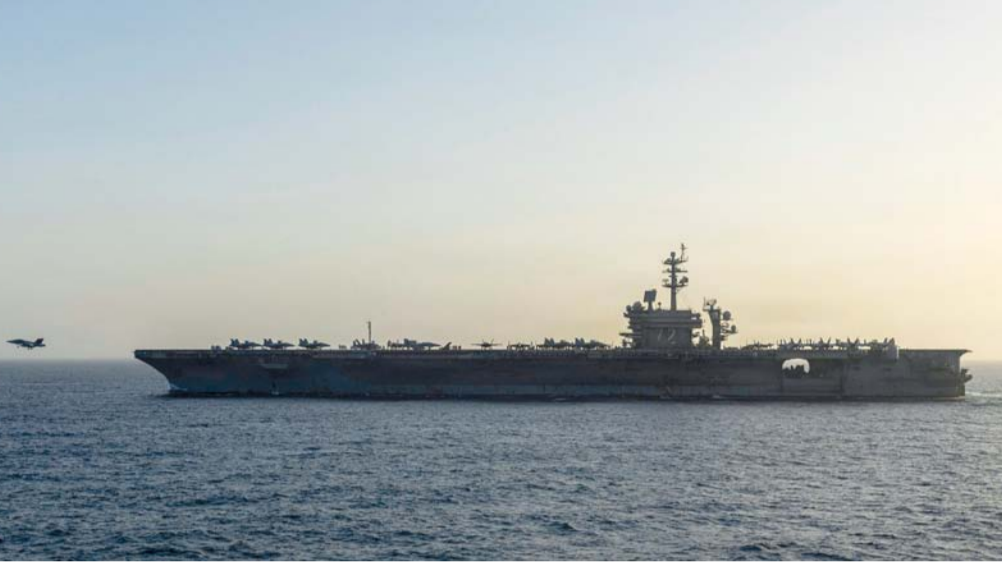
صورة نشرتها البحرية الأمريكية لحاملة الطائرات «يو إس إس أبراهام لينكولن» وهي تُجري عمليات في بحر العرب.

واشنطن - عواصم - وكالات: قال الرئيس الأميركي دونالد ترامب إن الولايات المتحدة احتجزت بالقوة سفينة شحن ترفع العلم الإيراني قرب مضيق هرمز، بعد محاولتها اختراق الحصار البحري فيما تسود الضبابية حول استئناف المحادثات الرامية لإنهاء الحرب التي شنتها الولايات المتحدة وإسرائيل على إيران. وقال ترامب في منشور على وسائل التواصل الاجتماعي إن السفينة تم تحذيرها من قبل مدمرة صواريخ موجهة تابعة للبحرية الأمريكية بضرورة التوقف، لكنها لم تستجب. وأضاف: «قامت سفينتنا البحرية بإيقافها تماما عن الحركة من خلال إحداث ثقب في غرفة المحركات». وقال ترامب إن قوات مشاة البحرية الأمريكية (المارينز) أصبحت تحتجز سفينة الشحن التي تسمى «توسكا»، مضيفا أنهم «يتفقدون ما على متنها». ويعد هذا الاستيلاء تصعيدا في التوتر المتبادل مع إيران بشأن حركة الملاحة في المضيق، ويأتي في وقت كانت فيه الولايات المتحدة تستعد لجولة ثانية من المحادثات المباشرة مع طهران، بينما تقرب هدنة هشة من الانتهاء. وأكد الجيش الأميركي أن مدمرة أميركية أطلقت عدة طاقات، باتجاه السفينة التي ترفع العلم الإيراني، وفقا لشبكة (سي إن إن). يأتي لك فيما أفاد الإعلام