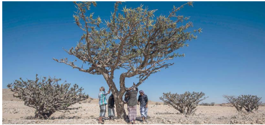
■ التسجيل يساهم في حماية اللبان العماني وتعزيز قيمته التسويقية في الأسواق الدولية

■ مسقط، العُمانية: سجلت سلطنة عُمان اللبان العماني دولياً كمؤشر جغرافي في المنظمة العالمية للملكية الفكرية «الويبو». ويُعد إصدار شهادة التسجيل الدولي إنجازاً يعكس المكانة الراسخة لهذا المنتج العريق في الهوية العمانية، وفي التجارة العالمية المرتبطة بالتراث والمنتجات الأصيلة. ■