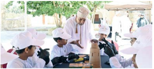
الفعالية هدفت إلى التعريف بالتراث الثقافي وأهميته التاريخية والحضارية

صلالة . العُمانية: نظمت المديرية العامة للتراث والسياحة بحفاظة ظفار امس، بالتعاون مع شركة الحافة للتطوير والاستثمار فعالية بمناسبة يوم التراث العالمي تحت شعار (التراث الحي والاستجابة للطوارئ)، وذلك بمجمع التراث الثقافي بمنطقة الحافة. وهدفت الفعالية إلى التعريف بالتراث الثقافي وأهميته التاريخية والحضارية، وإبراز جهود الجهات والمؤسسات المعنية في حمايته وصونه، إلى جانب تعزيز الوعي المجتمعي بأهمية المحافظة على الموروث الثقافي، وترسيخ مفاهيم الاستدامة في التعامل مع المواقع والمقتنيات التراثية، بما يسهم في نقلها للأجيال القادمة. كما ركزت الفعالية على أهمية الاستجابة للطوارئ في حماية التراث، من خلال تسليط الضوء على الممارسات والإجراءات المتبعة للحفاظ على المواقع التاريخية والمقتنيات الثقافية في الحالات الاستثنائية، والتأكيد على دور الشراكة بين المؤسسات الحكومية والخاصة والمجتمع في صون هذا الإرث الإنساني. واشتمل برنامج الفعالية على جولة تعريفية أطلع خلالها المختصون والمهتمون بالشأن التراثي وطلبة المدارس على قصة الموقع والمواقع التاريخية المرتبطة به، إضافة إلى التعرف على مواد البناء التقليدية وأساليب الترميم، وتجربة ترميم الأواني الفخارية، وتركيب مجسمات مصغرة لبيوت تراثية، إلى جانب أنشطة تفاعلية تضمنت تولين معالم تاريخية مرفقة بمعلومات تعريفية عنها، لتعزيز الجانب المعرفي والتطبيقي لدى المشاركين.