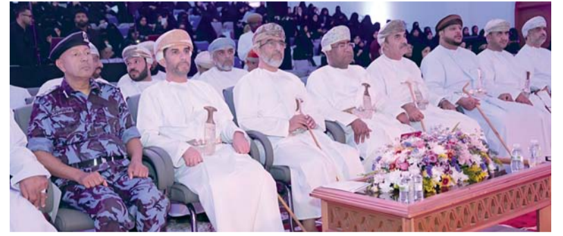
■ توجيه الطلبة نحو مسارات معرفية وفكرية تسهم في خدمة المجتمع

يؤديه المعلم في العملية التعليمية، بوصفه ركيزة أساسية في بناء الأجيال، وغرس قيم المواطنة والتسامح، وتوجيه الطلبة نحو مسارات معرفية وفكرية تسهم في خدمة المجتمع حيث بلغ عدد المكرمين ٢٥٠ مجيداً من مختلف الفئات شملت المشرفين ومديري المدارس ومساعديهم، والمعلمين والمعلمات، والمنسقين والأخصائيين والفنيين، إضافة إلى مرضي وممرضات الصحة المدرسية، وألقى عبدالله بن علي الفوري المدير العام للمديرية العامة للتعليم بمحافظة جنوب الشرقية، كلمة أكد فيها أن هذا التكريم يجسد تقدير المجتمع للجهود المخلصة التي يبذلها أعضاء الهيئة التعليمية في تنمية مهارات الطلبة، وتعزيز قدراتهم في التفكير الناقد والاتصال الفاعل، إلى جانب توظيف التكنولوجيا في التعليم وتهئية بيئات تعليمية محفزة قائمة على الثقة والاحترام المتبادل. وأشار إلى أن دور المعلم لم يعد مقتصرًا على نقل المعرفة، بل امتد ليضم الإرشاد والتوجيه وتنمية الفكر، ومساعدة الطلبة على الاستفادة من التقنيات الحديثة.