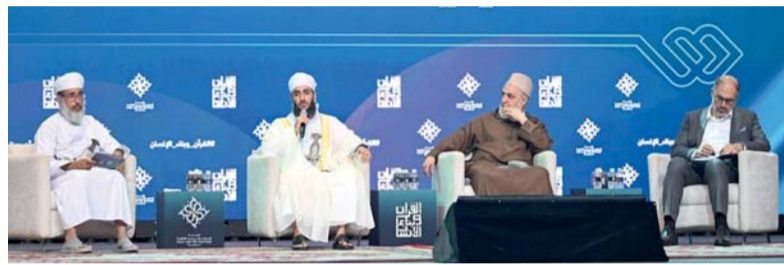
■ إحدى جلسات الندوة

وموازينته. ولفت إلى أنه لا تزال الإنسانية اليوم تعيش حيرة واضطراباً بين مناهج فكرية منقطعة عن الوعي، ولا شك أن المخرج من هذا الواقع المضطرب إنما يكون بالعودة إلى البوصلة القرآنية، التي تحقّق التوازن بين الروح والجسد، وتضمن كرامة الإنسان، وتعزّز بناء الأمة. وأكد أن التوجيهات السامية لحضرة صاحب الجلالة السلطان هيثم بن طارق المعظم. حفظه الله ورعاه. أولت العناية بالقيم الأخلاقية والسلوكية، ونوّعت بأهمية البصيرة المستمدة من العقيدة السمحة التي سار عليها أبناء هذا الوطن عبر العصور، مع ضرورة استلهام الموروث الوطني، والتمسك بمبادئه وقيمه الأصيلة، وانسجاماً مع هذا التوجيه السامي، واستحضاراً لمستهدفات رؤية «عُمان ٢٠٤٠»، لا سيما ما يتعلق بمحور الإنسان والمجتمع، فإن بناء إنسان معزّز بهويته، واع بقيمه، متوازن في فكره وسلوكه، يمثل أولوية وطنية كبرى.