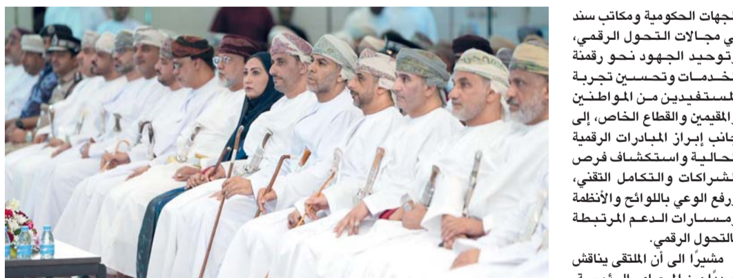
■ الملتقى يناقش التحديات المرتبطة بالأنظمة التقليدية والموارد البشرية

إعلان تعديل الشكل القانوني تعلن شركة (افلاك للأعمال الدولية) والمقيدة بامانة السجل التجاري تحت رقم (١٧/١٣٤٤٠) انها بصدد تعديل شكلها القانوني من (تاجر فرد) إلى (شركة محدودة المسؤولية) وفقاً للمادة رقم (٣١) من قانون الشركات التجارية رقم ٢٠١٩/١٨ وتعديلاته. وكل من له اعتراض على ذلك عليه ان يقدم باسباب اعتراضه لامانة السجل التجاري بوزارة التجارة والصناعة وترويج الاستثمار خلال شهرين من تاريخ نشر هذا الاعلان.