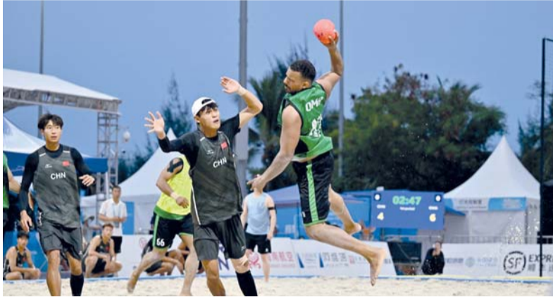
من اللقاء الودي بين منتخبنا الوطني لكرة اليد أمام الصين