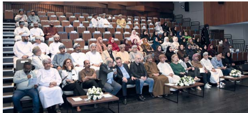
■ دشّن الميثاق يعكس مدى الوعي المتقدم بأهمية الدور الذي يؤديه الإعلام

مشروع إنسان، وأمل وطن، وأحد أهم ركائز التنمية المستدامة. ومن هنا، فإن مسؤولية حمايته إعلامياً، وتقديم محتوى يراعي خصوصيته، ويعزز قيمه، وينمي قدراته، تعد مسؤولية مشتركة تقع على عاتق الجميع، وفي مقدمتهم العاملون في الحقل الإعلامي. مشيرة إلى أن العالم يشهد في السنوات الأخيرة تطوراً هائلاً في وسائل الإعلام الرقمية، وما صاحبها من تحديات متزايدة، أثرت بشكل مباشر على الأطفال، سواء من حيث المحتوى أو السلوك أو الهوية، الأمر الذي يستدعي وجود إطار أخلاقي ومهني واضح، يظلم هذا الحضور، ويضع الحدود الفاصلة بين حرية النشر ومسؤولية التأثير. بعدها أقيمت دومينيك ماري برادلي رئيسة الاتحاد الدولي للصحفيين كلمة أكدت فيها على أن حماية حقوق الأطفال في الإعلام مسؤولية إنسانية ومهنية، تتطلب التزاماً بمعايير تحافظ على كرامة الطفل وخصوصيته.