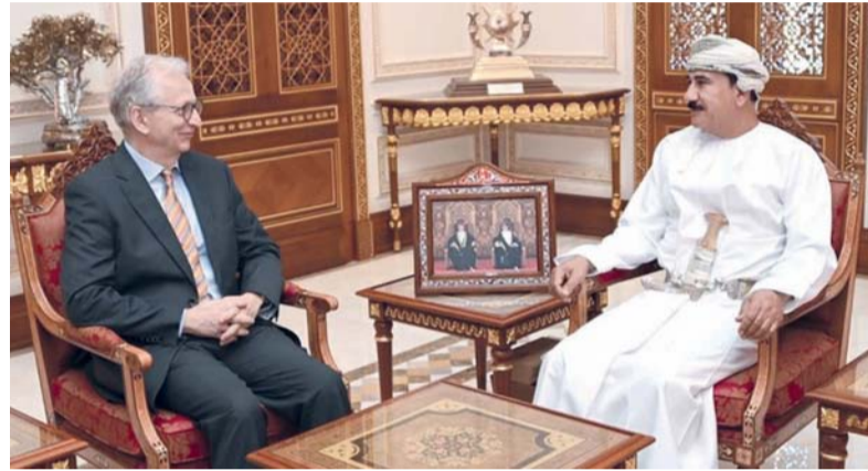
سلطان النعماني يستقبل توماس فريدرش

تفصيلاً إلى سلام دائم ومستدام يحقق الأمن والاستقرار للشعب اليمني الشقيق. حضر ألمانيا الاتحادية المعتمد لدى المقابلة سعادة سفير جمهورية سلطنة عُمان.