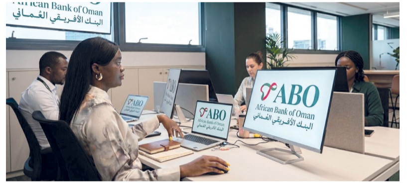
البنك سيسهم في تعزيز تدفقات رأس المال والتجارة والاستثمار

لواندا . العُمانية: أعلن في العاصمة الأنغولية لواندا أمس عن تأسيس البنك الأفريقي العماني تجسيدياً لمستهدفات رؤية «عمان ٢٠٤٠» الرامية إلى تنويع مصادر الدخل وتعزيز الحضور الاستثماري الخارجي. وتأتي هذه الخطوة لتعكس جهود سلطنة عمان الرامية نحو تعزيز حضورها المالي في الأسواق الأفريقية الصاعدة، وترسيخ دورها كمصدر للخبرات المالية والمؤسسية في القطاع المالي الدولي. ويمثل إطلاق البنك محطة جديدة في مسار تعميق العلاقات الاقتصادية بين سلطنة عمان والقارة الأفريقية، ويأتي تأسيسه في ظل التحولات الاقتصادية التي تشهدها أنغولا ضمن خططها التنموية طويلة المدى «استراتيجية أنغولا ٢٠٥٠»، والتي تركز على تنويع الاقتصاد، وتسريع برامج الخصخصة، وتطوير البنية الأساسية، وفتح القطاعات الإنتاجية أمام الاستثمار الدولي. وصرح صاحب السمو نائب رئيس الوزراء للشؤون الاقتصادية قائلاً: «نبارك تأسيس البنك الأفريقي العماني (ABO) الذي يُجسد نهج الدبلوماسية الاقتصادية التي أرسى دعائمها