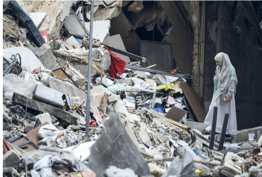
لبنانية تسير وسط انقاض مبنى دمره العدوان «الإسرائيلي» في منطقة حارة حريك بضواحي بيروت الجنوبية.

طهران . عواصم . وكالات: خيم الغموض مساعي عقد جولة محادثات إيرانية أميركية جديدة في إسلام آباد بين إيران وأميركا بعدما رفضت إيران تأكيد مشاركتها فيها بعد هجوم أميركي على سفينة شحن إيرانية، وذلك قبل يومين من انتهاء مهلة وقف إطلاق النار بين البلدين. واتهمت وزارة الخارجية الإيرانية الولايات المتحدة بعدم الجدية بشأن المسار الدبلوماسي وابتهاك وقف إطلاق النار القائم منذ أسبوعين، مشيرة إلى أن طهران لم تقر بعد إن كانت ستخوض جولة المفاوضات. وكان الرئيس الأميركي دونالد ترامب أعلن إرسال وفد إلى العاصمة الباكستانية، في محاولة لاستئناف المحادثات الرامية إلى وضع حد دائم للحرب التي شنتها الولايات المتحدة وإسرائيل على إيران في ٢٨ فبراير. وبعد ساعات قليلة من تصريحاته، أفاد الإعلام الرسمي الإيراني بأن طهران لا تخطط حالياً للمشاركة في محادثات جديدة مع الولايات المتحدة. وأشارت وكالة (إرنا) إلى المطالب «غير المعقولة وغير الواقعية، ل واشنطن»، والتغير المتكرر في مواقفها، والناقضات المستمرة، واستمرار ما يُسمى الحصار البحري، مضيفة أنه «في هذه الظروف، لا توجد آفاق واضحة لمفاوضات منمّرة». وتكرّرت هذه التصريحات على لسان المتحدث باسم الخارجية الإيرانية إسماعيل بقائي الإثنين، إذ أشار إلى أنه «بينما تدعي الولايات المتحدة الدبلوماسية واستعدادها للمفاوضات، تقوم بتصرفات لا تلبّ باي شكل من الأشكال على أنها جديّة بشأن المضي قدماً في العملية الدبلوماسية». واعتبر أن سيطرة واشنطن على سفينة شحن إيرانية وحصارها لمواثي الجمهورية الإسلامية والتأخر في تطبيق الهدنة في لبنان كلها انتهاكات واضحة لوقف إطلاق النار. وأضاف «لا خطط لدينا بشأن الجولة المقبلة من المفاوضات ولم يجر اتخاذ أي قرار في هذا الصدد».