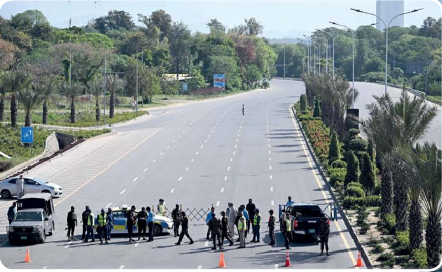
أفراد أمن باكستانيون عند نقطة تفتيش على طريق مغلق مؤقتاً بالقرب من فندق سيرينا في المنطقة الحمراء بإسلام آباد وسط ترقب لمفاوضات بين الولايات المتحدة وإيران.