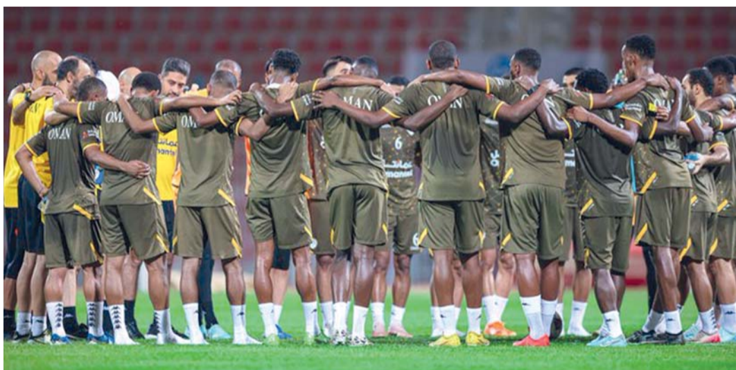
من الحصة التدريبية للمنتخب بقيادة السكتيوي

قبل موسمين من الآن، إلا أن الإصابات المتلاحقة وظروف عمله في مرات أخرى ساهمت في عدم تواجده مع الأحمر في الاستحقاقات السابقة.