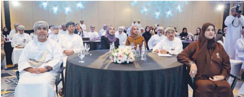
تطوير منظومة الجودة وفق أفضل الممارسات الدولية