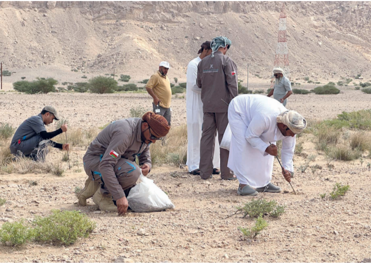
تعزيز الغطاء النباتي والحفاظ على التنوع الأحيائي