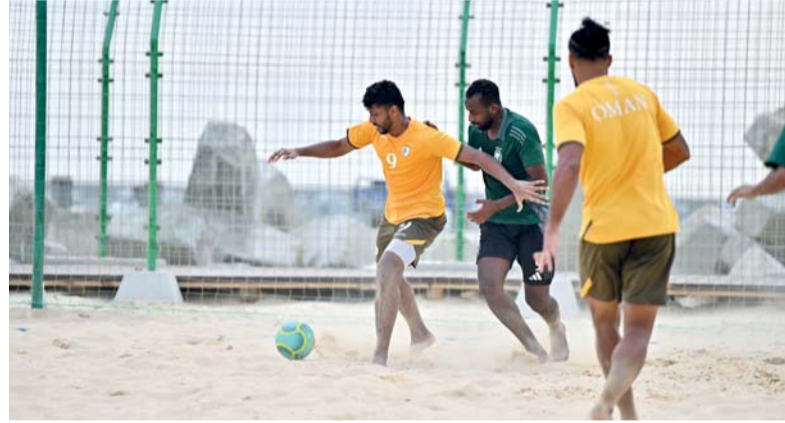
مباراة ودية بين أحمر الشواطئ والمنتخب السعودي

المشاركات، بقوله: اعتقد أن لاعبينا يمتلكون الخبرة الكافية للتعامل مع أجواء هذه البطولات، وهذا أمر مهم جداً في المباريات الكبيرة، كما أن الجانب التكتيكي موجود بطبيعة الحال، لكن في كرة اليد الشاطئية لا يكون الفارق التكتيكي كبيراً جداً، لأن أسلوب اللعب معروف تقريباً، سواء في الأدوار الهجومية أو الدفاعية. تدريبات القدم من جانبه يواصل المنتخب الوطني لكرة القدم تدريباته الجدية وذلك استعداداً للقاء