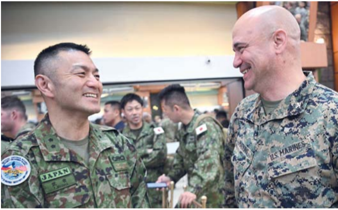
لواء من قوات الدفاع الذاتي اليابانية يتحدث إلى ضابط من مشاة البحرية الأمريكية في افتتاح مناورات «باليكاتان» (كتفا لكتف) العسكرية المشتركة السنوية في معسكر أغوينالدو بمدينة كوزون، إحدى ضواحي مانيلا.

نيوزيلندا وفرنسا وكندا. واعتبر المتحدث باسم القوات الأمريكية، الكولونيل روبرت بان، أن مناورات