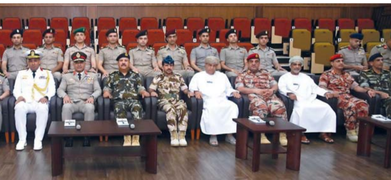
الوفد يزور كلية الدفاع الوطني

عن الكلية وبرامجها التدريبية والتعليمية، كما قام بجولة شملت مرافق الكلية وما تحويه من أقسام وأنظمة وتجهيزات. وقام الوفد بزيارة إلى كلية الدفاع الوطني بأكاديمية الدراسات الاستراتيجية والدفاعية، وكان في استقباله لدى وصوله الكلية بمعسكر بيت الفلج اللواء الركن بحري علي بن عبدالله الشديدي أمر كلية الدفاع الوطني. واستمع الوفد الزائر إلى إيجاز عن كلية الدفاع الوطني وما تتضمنه من مرافق وتجهيزات، واطلع على أقسام الكلية المتنوعة.