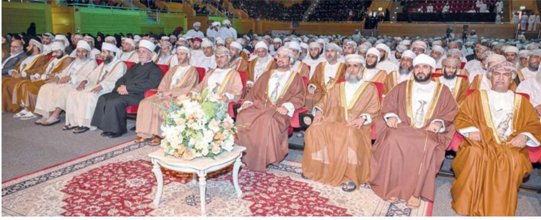
■ التأكيد على دور القرآن الكريم في بناء الإنسان معرفياً وأخلاقياً

بداً مسقط. الغمائية: بدأت أعمال ندوة «القرآن وبناء الإنسان» التي تنظمها مؤسسة الإمام جابر بن زيد الوقفية، تحت رعاية معالي السيد خالد بن هلال الجوسعيدي، وزير ديوان البلاط السلطاني، وتستمر يومين. وتهدف الندوة إلى تسليط الضوء على دور القرآن الكريم في بناء الإنسان معرفياً وأخلاقياً، واستكشاف إمكانات تفعيل حضوره في صناعة مستقبل إنساني قائم على التربية والقيم والهوية.