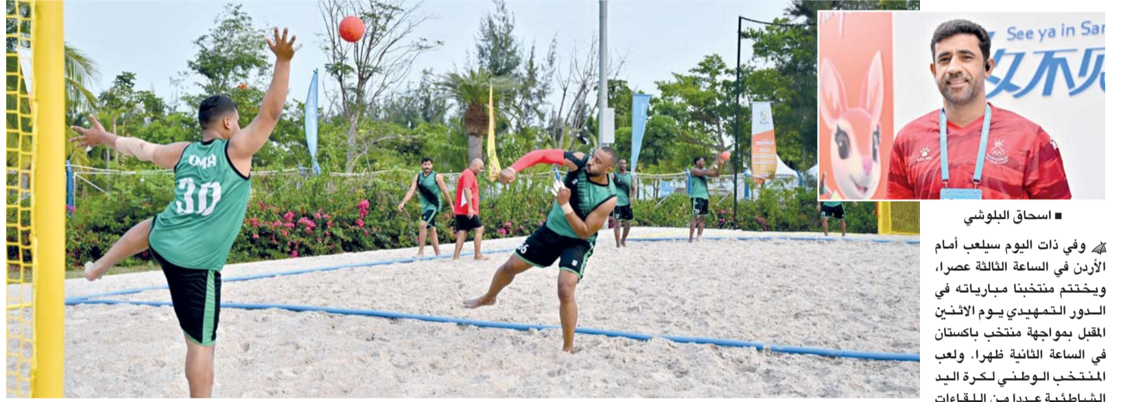
لاعبو منتخب اليد الشاطئية في الحصة التدريبية

وعلى صعيد الحضور الجماهيري، قال شيانغ بيهاي، أمين عام اللجنة الأولمبية الصينية، رئيس اللجنة المنظمة لدورة الألعاب الآسيوية الشاطئية، نائب عمدة بلدية سانيا والأمين العام للجنة المنظمة لدورة الألعاب الآسيوية الشاطئية السادسة التي تحتضنها مدينة سانيا خلال الفترة من ٢٢ إلى ٣٠ أبريل الجاري: تشهد مبيعات التذاكر ارتفاعاً ملحوظاً مع اقتراب موعد انطلاق الدورة، حيث طرحت اللجنة المنظمة أكثر من ٩٠ ألف تذكرة بأسعار مناسبة تتراوح بين ٢٥ وحتى ١٩٠ يوان صيني (ريال واحد وحتى ١٠ ريالاً عماني)، وتحظى منافسات الكرة الطائرة الشاطئية وكرة السلة الثلاثية وكرة القدم الشاطئية بأعلى نسب الإقبال، في ظل الشعبية الكبيرة لهذه الألعاب، خصوصاً بين فئة الشباب، كما تم توسيع قنوات بيع التذاكر لتشمل عدة منصات إلكترونية، كما أسهم في تسهيل عملية شراء وتعزيز الوصول إلى الجمهور، مع اعتماد نظام التحقق بالاسم الحقيقي لضمان التنظيم والعدالة.