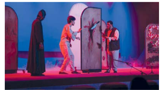
المهرجان يستمر خمسة أيام