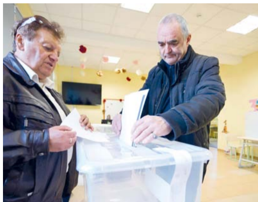
ناخب يدلي بصوته في مركز اقتراع للانتخابات البرلمانية في صوفيا