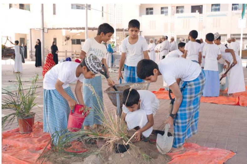
■ ترسيخ السلوكيات الإيجابية المستمدة من القيم الأصيلة

والزراعة المدرسية وترشيد الطاقة بمشاركة أولياء الأمور والمجتمع المحلي بما يعكس دور المدرسة في تعزيز الشراكة المجتمعية ونشر الوعي البيئي. وأكدت إدارتا المدرستين أن المشروع يمثل خطوة نوعية نحو بناء شخصية الطالب المتكاملة من خلال الدمج بين الهوية الوطنية والسلوك البيئي المسؤول بما يسهم في إعداد جيل معزز بقيمه ومدرسه ودوره في الحفاظ على مكتسبات الوطن وتنميتها. وقالت مديرة مدرسة صومرة: يأتي مشروع الهوية العمانية والسمت العماني ليجسد توجه المدرسة نحو بناء وعي متكامل لدى الطلبة يجمع بين الاعتزاز بالهوية الوطنية وترسيخ ممارسات الاستدامة.