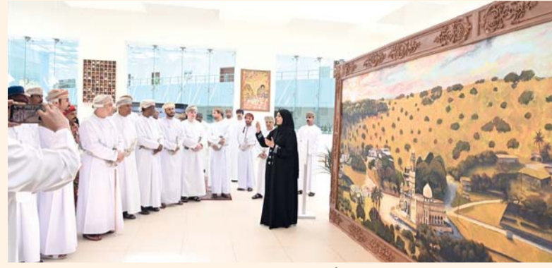
المبادرة تمزج بين أصالة الإرث في محافظة ظفار والفن المعاصر

عمل مصاحبة، تستهدف تدريب الشباب على إتقان تقنيات الخزف الظفاري التقليدي، بما يسهم في نقل هذا الفن إلى