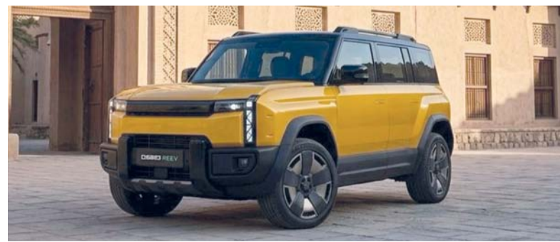
iCAUR 03T توفر قيادة راقية وقدرات شحن سريعة

كما تُعد iCAUR، علامة تجارية جديدة كلياً طورتها مجموعة «شيري» وصممت خصيصاً للسوق العالمي مدعومة بإرث «شيري» العريق في التصنيع وابتكاراتها الرائدة، كما تعقل سوقاً استراتيجياً رئيسياً لسيارات «iCAUR»، في الشرق الأوسط وتمثل العلامة التجارية حصرياً في سلطنة عمان شركة السيارات العالمية الجديدة. كما تعمل «iCAUR» على بناء نظام خدمات شامل، وإطلاق مجموعة متنوعة من العروض المتميزة، وإنشاء شبكة مجتمعية عالمية من خلال هذا النهج وتتطور العلامة التجارية لتتجاوز كونها شركة تصنيع سيارات تقليدية، لتصبح شركة عالمية متكاملة للنظام البيئي، مدفوعة بخبرة صنع في الصين.