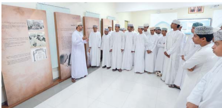
المعرض حط رحاله في محطته الثانية بالكامل والوافي

الشرقية. ويهدف المعرض إلى نشر الثقافة الوثائقية والتعريف بأهمية الوثائق والمحفوظات في حفظ تاريخ سلطنة عُمان بوصفها مصادر أصيلة للمعرفة، إلى جانب ترسيخ الهوية الوطنية لدى الطلبة، وتعزيز قيم المواطنة، من خلال إبراز التاريخ العُماني العريق، واستحضار إسهامات الإنسان العُماني عبر مختلف الحقب. ويجسد المعرض من خلال محطاته المتنقلة نموناً تفاعلياً في تقديم المادة الوثائقية، يقربها إلى فئة الطلبة بأساليب حديثة، ويسهم في بناء وعي تاريخي راسخ لدى الأجيال الناشئة، بما يعزز من حضور الذاكرة الوطنية في وجدان المجتمع.