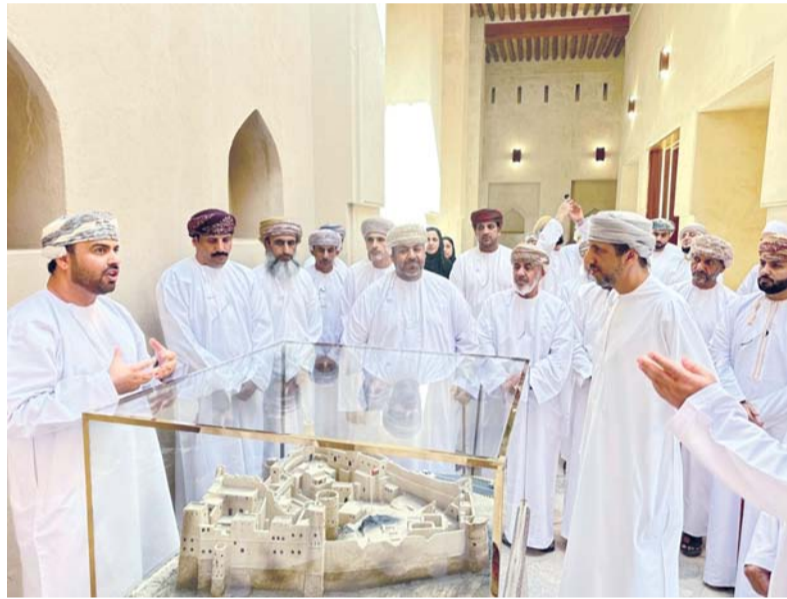
بهلاء. من مؤمن الهنائي:

شهدت ولاية بهلاء بمحافظة الداخلية افتتاح متاحف قلعة بهلاء لتشكّل إضافة نوعية للمشهد الثقافي والسياحي وتفتح آفاقاً جديدة أمام الزوار والباحثين للاطلاع على تاريخ عريق يمتد لقرون، تحت رعاية معالي السيد إبراهيم بن سعيد البوسعيدي وزير التراث والسياحة بحضور سعادة الشيخ سعيد بن علي بن أحمد الصلف العيموي والي بهلاء. استهلّت الفعالية بعروض تقليدية قدمتها فرقة الفنون الشعبية بولاية بهلاء التي صعدت باهازيج الرزحة في أجواء جسدت عمق الموروث الثقافي العماني بعدها القت سياً الأثرية المشرفة الإدارية لشركة المراسيم للسياحة والاستثمار كلمة افتتاحية رحبت فيها بالحضور مؤكدة أهمية هذا المشروع في إبراز الهوية التاريخية والحضارية للولاية.