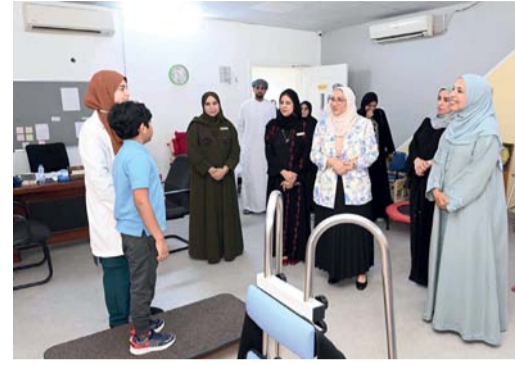
■ تقديم برامج تعليمية وتأهيلية متكاملة

المنتشرة في عدد من المحافظات، بما يسهم في دعم جهود الدمج المجتمعي وتمكين هذه الفئة من اكتساب المهارات الحياتية والتعليمية. وتستهدف الجمعية الأطفال من ذوي الإعاقة السمعية والذهنية والحركية المزوجة، إضافة إلى اضطراب التوحد ومتلازمة داون، ضمن الفئة العمرية من (٤ إلى ١٤) عاماً، كما تقدم برامج للتهيئة ما قبل المهنية للفئة العمرية من (١٥ إلى ٢٣) عاماً، بما يواكب قدراتهم ويعزز فرص اندماجهم في المجتمع.