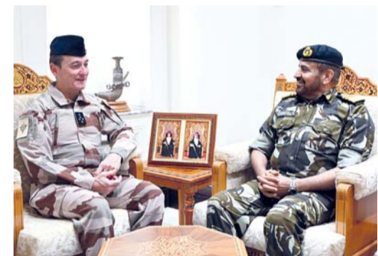
... ويستقبله عبد الله الرئيسي

مستقط . العُمانيّة: استقبل صاحبُ السُّمو السيد شهاب بن طارق آل سعيد نائب رئيس الوزراء لشؤون الدفاع بمكتبه بمعسكر المرتفعة الفريق أول طيار فابيان ماندون رئيس أركان القوات المسلحة بالجمهورية الفرنسية والوفد المرافق له. استعراض العلاقات الطيبة بين البلدين الصديقين، كما تم تناول مستجدات الأوضاع الإقليمية والدولية وتبادل وجهات النظر لتعزيز المصالح المشتركة، ومناقشة عدد من الموضوعات ذات الاهتمام المشترك. حضر المقابلة الفريق الركن بحري رئيس أركان قوات السلطان المسلحة، وسعادة سفير الجمهورية الفرنسية المعتمد لدى سلطنة عُمان. استقبل معالي الفريق أول سلطان بن محمد التعماني وزيرُ المكتب السلطاني بمكتبه