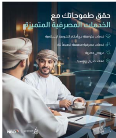
تقديم حلول مصرفية سلسلة ومميزة

إلى جانب خدمات تسهّل إنجاز المعاملات اليومية بسلاسة، كما تشمل الباقة خدمة التحويل من وإلى المطار، ودخولاً مجانيًا إلى صالات المطارات في أكثر من ١٠٠٠ موقع حول العالم، بالإضافة إلى مجموعة من العروض الحصرية والخصومات عبر شركاء مختارين، مما يمنح العملاء مزيداً من القيمة ويعزز تجربتهم المصرفية.