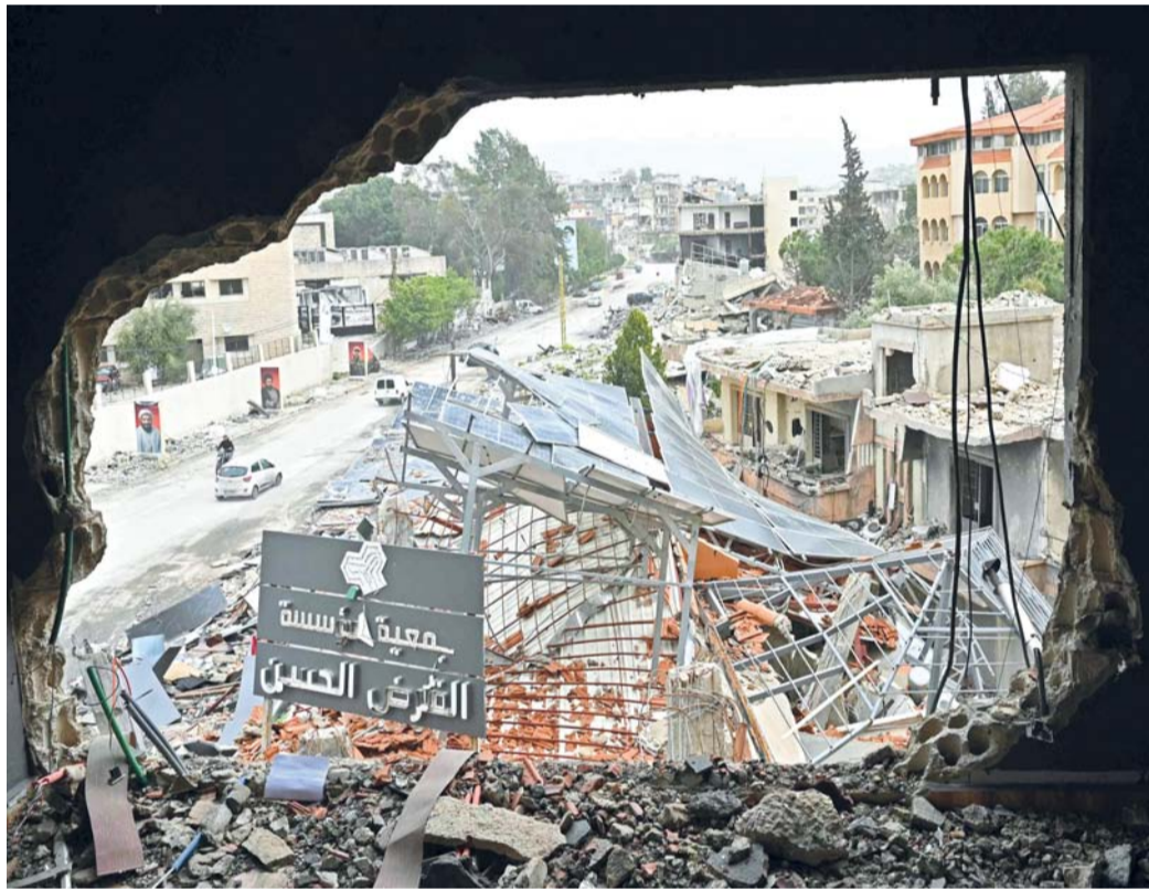
نازحون لبنانيون يعمرون بمبانٍ مدمرة أثناء عودتهم إلى مدينة النبطية جنوب لبنان.

بيروت. وكالات: أعلن الجيش الإسرائيلي مقتل أحد جنوده خلال اشتباكات في جنوب لبنان، بعد أن دخل وقف إطلاق النار المؤقت حيز التنفيذ الأسبوع الماضي. وأفاد الجيش في بيان له بمقتل جندي في الكتيبة ٧١٠٦، اللواء ٧٦٩، خلال اشتباكات في جنوب لبنان دون تقديم مزيد من التفاصيل ليرتفع إجمالي عدد القتلى في الحرب الدائرة منذ ستة أسابيع بين إسرائيل وحزب الله إلى ١٥. وتعد هذه هي المرة الثانية التي يعلن فيها الجيش الإسرائيلي عن مقتل أحد جنوده في جنوب لبنان منذ بدء الهدنة التي أعلنتها الولايات المتحدة لمدة عشرة أيام الجمعة الماضي، في إطار جهود أوسع لإنهاء الحرب في الشرق الأوسط بشكل دائم. وأفادت وكالة الأنباء اللبنانية الرسمية بأن الجيش الإسرائيلي نفذ مجدداً عمليات هدم في مدينة بنت جبيل في جنوب لبنان، حيث بقيت قواته في ظل وقف إطلاق النار. وأوردت الوكالة الوطنية للإعلام «يكر العدو الإسرائيلي عمليات تفجير المنازل في مدينة بنت جبيل، مشيرة إلى عمليات مماثلة