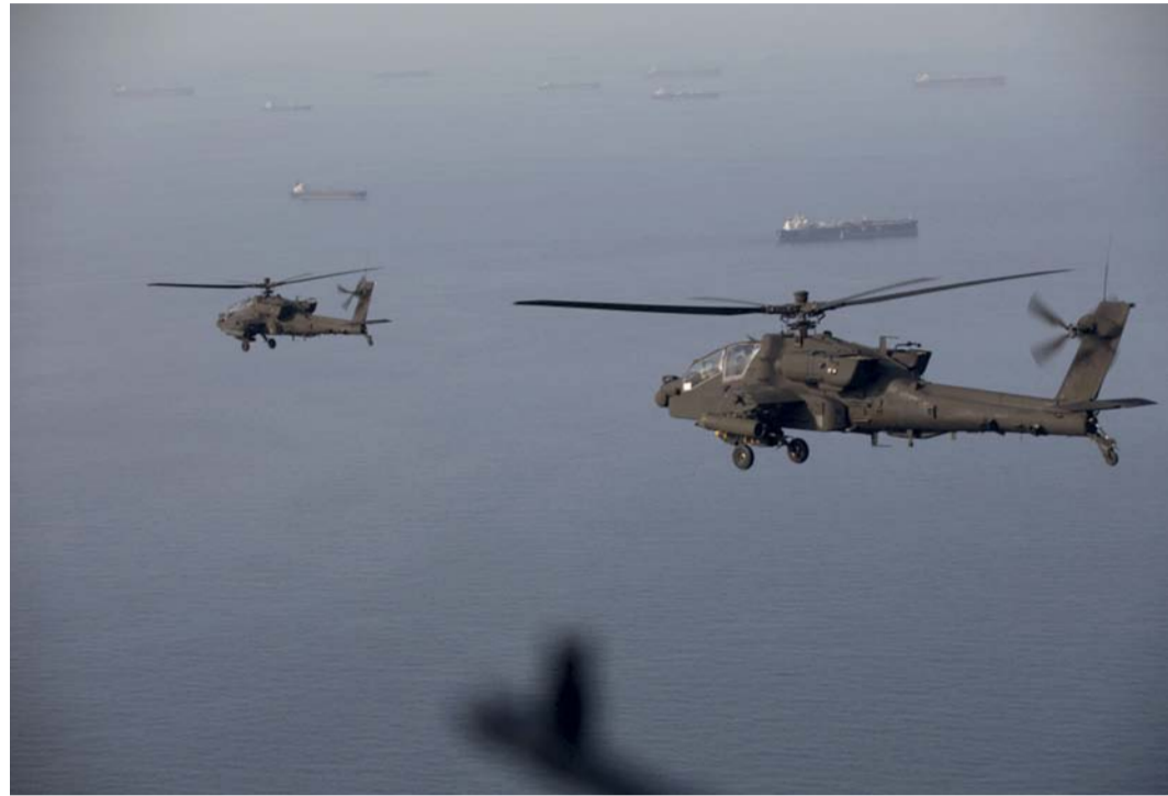
صورة نشرتها القيادة المركزية الأمريكية لمروحيات أباتشي تحلق في دورية فوق مضيق هرمز.