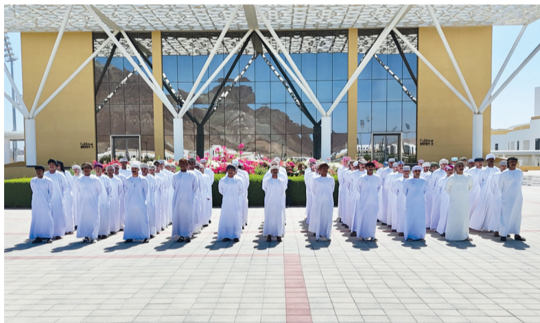
الدفعة الجديدة تأتي ضمن مبادرة إسناد أعمال المناولة في المنافذ البرية إلى شركات القطاع الخاص