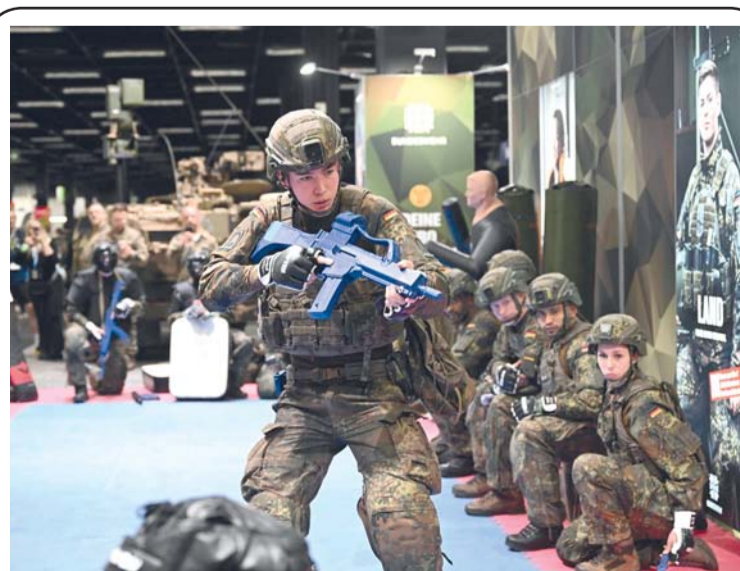
جنود من الجيش الألماني (البوندسفير) يؤدون تدريبات قتالية في جناح الجيش في معرض FIBO التجاري للصحة واللياقة البدنية والعافية في كولونيا، غرب ألمانيا.

وقالت سيسكا كلافيهو، الأمينة العامة للهيئة الوطنية للانتخابات، أعلى سلطة قضائية انتخابية في البيرو، لإذاعة «أر بي بي»، إنها تتوقع «صدور نتائج الانتخابات الرئاسية اللازمة لتحديد المرشحين اللذين سيخوضان جولة الإعادة، بحلول منتصف مايو تقريبا». وبعد فرز ٩٣،٤٪ من الأصوات الأحد قبل الماضي، كانت المرشحة اليمينية كيكو فوجيموري متقدمة بنسبة ١٧٪، يليها اليساري روبرتو سانتشيز بـ ١٢٪ من الأصوات والمحافظ المتشدد رافاييل لوبيز أليانغا بـ ١١،٩٪. وعزت كلافيهو بطء فرز الأصوات إلى مراجعة أكثر من ١٥ ألف بطاقة اقتراع متنازع عليها. ودعا لوبيز أليانغا، رئيس بلدية ليما السابق، إلى إلغاء الانتخابات زاعماً حصول تزوير لكن من دون تقديم أي أدلة.