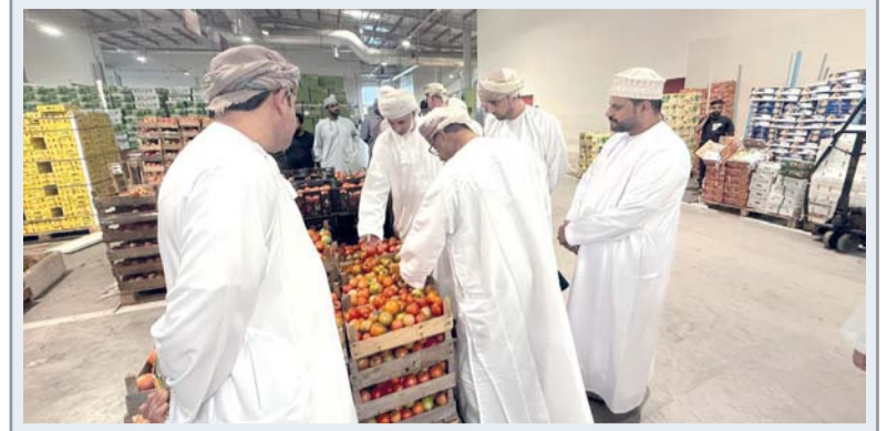
الزيارة تسهم في الالتزام بالإجراءات المنظمة للسوق

تأتي هذه الندوة في إطار الجهود الرامية إلى تعزيز كفاءة قطاع إعادة تدوير خردة الألمنيوم في سلطنة عُمان من خلال بحث أحدث الممارسات وتطوير آليات العمل في هذا القطاع، إلى جانب مراجعة أبرز التوصيات التي خرجت بها النسختان السابقتان. ومن المتوقع أن تشهد الندوة مشاركة واسعة تتجاوز ١٠٠ مشارك، يمثلون مختلف الجهات ذات العلاقة، بما في ذلك المؤسسات الحكومية، وشركات القطاع الخاص المعنية بقطاع صناعة الألمنيوم وجمع وإعادة