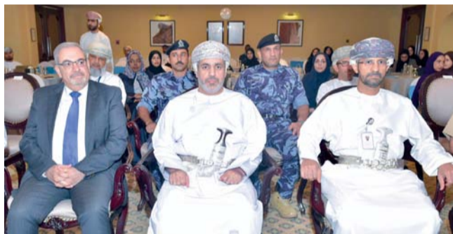
■ تعزيز الجاهزية الصحية الوطنية ورفع كفاءتها

يُختتم التمرين بجلسة نقاش تقنية تحت إشراف خبراء من منظمة الصحة العالمية والمركز الوطني لإدارة الطوارئ والمخاطر الصحية؛ لاستخلاص الدروس المستفادة وتحديد فرص التحسين. ويأتي هذا التمرين ضمن إطار جهود سلطنة عمان المستمرة لتطوير منظومة الأمن الصحي الوطني؛ إذ يهدف إلى اختبار كفاءة العمليات التشغيلية وتحديد الفجوات المحتملة في مواجهة الأزمات الصحية، بما يعزز من موقع سلطنة عُمان في تقارير التقييم الذاتي السنوي (SPAR) المرتبطة بالوائح الصحية الدولية. تجدر الإشارة إلى أن مخرجات هذا التمرين من المتوقع أن تسهم في تحديث خطط التأهب الوطنية، وتعزيز برامج بناء القدرات، بما يدعم تطوير نظام صحي مرن قادر على التعامل بكفاءة عالية مع مختلف المخاطر الصحية.