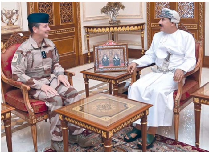
... ويستقبله سلطان التعماني