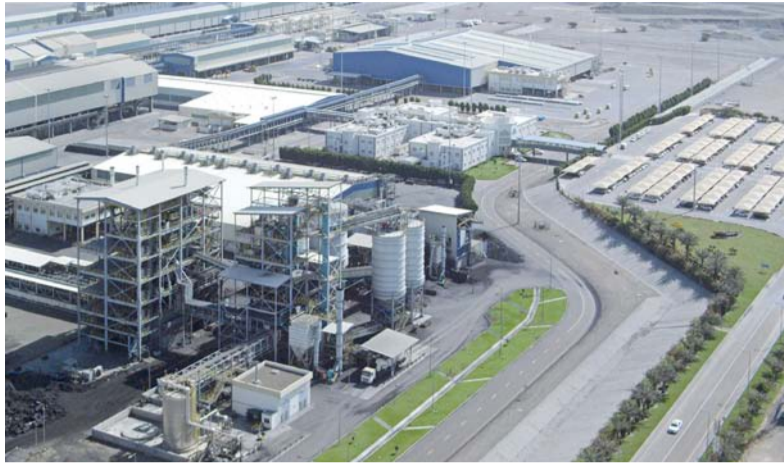
الندوة تجمع مختلف الأطراف المعنية بقطاع صناعة الألمنيوم والبيئة

الألمنيوم والبيئة في سلطنة عُمان، لتبادل الخبرات ومناقشة التحديات والفرص المرتبطة بإعادة تدوير خردة الألمنيوم. وأكد في تصريح لوكالة الأنباء العُمانية أن الشركة تسعى من خلال هذه المبادرة إلى دعم تطوير أطر فعالة لإدارة وحوكمة هذه الخردة، وتبني أفضل الممارسات المستدامة بما يعزز كفاءة عمليات التدوير ويسهم في ترسيخ مبادئ الاقتصاد الدائري.