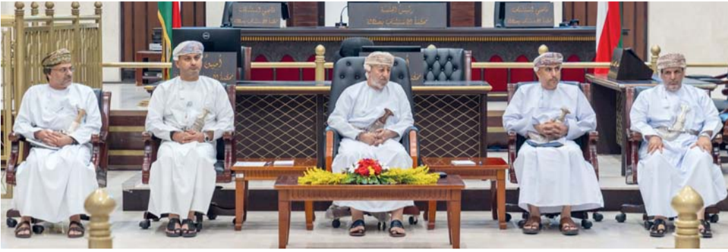
ظفار - «الوطن» :

زار معالي السيد محمد بن سلطان البوسعيدي نائب رئيس المجلس الأعلى للقضاء، المرفق القضائي بمحافظة ظفار، بمرافقة أصحاب السعادة عيسى بن حمد العزري أمين عام المجلس الأعلى للقضاء، وسعادة نصر بن خميس الصواوي المدعي العام، للاطلاع على واقع العمل القضائي وأعمال الادعاء العام، وبحث سبل تطويرها بما يعزز جودة الخدمات العدلية ويحقق العدالة الناجزة.