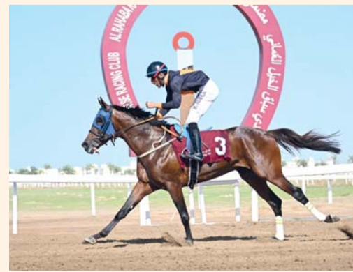
لحظة الوصول الى خط النهاية