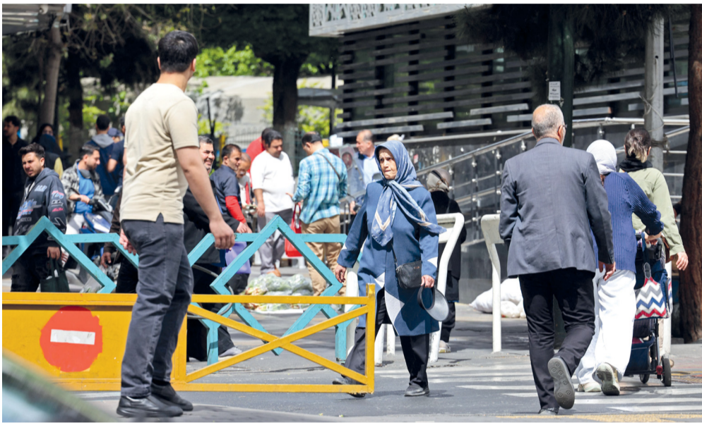
إيرانيون يسيرون في ساحة ولي عصر بطهران في ترقب استئناف المحادثات بين إيران والولايات المتحدة.

طهران - عواصم - وكالات: أجمعت التصريحات الإيرانية والأميركية على وجود تقدم نحو استئناف المحادثات الرامية إلى إنهاء الحرب التي شنتها الولايات المتحدة وإسرائيل، على إيران، فيما تبقى فجوات كبيرة بين الجانبين دفعت الجانب الإيراني للقول إن الاتفاق بعيد المنال.