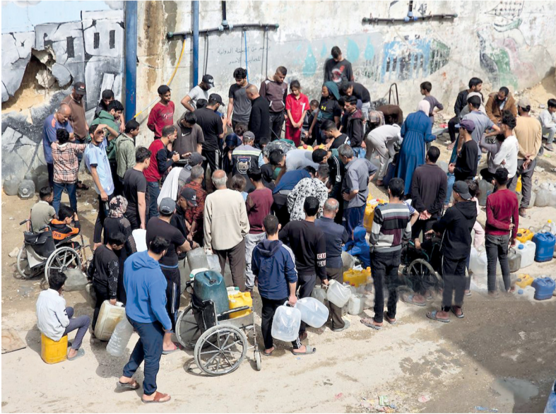
فلسطينيون يتجمعون للحصول على مياه الشرب في ظل أزمة نقص المياه في خان يونس جنوب قطاع غزة.

وانطلقت دعوات فلسطينية واسعة لتصعيد المواجهة والمقاومة واستهداف الاحتلال ومستوطنيه بالضفة الغربية.