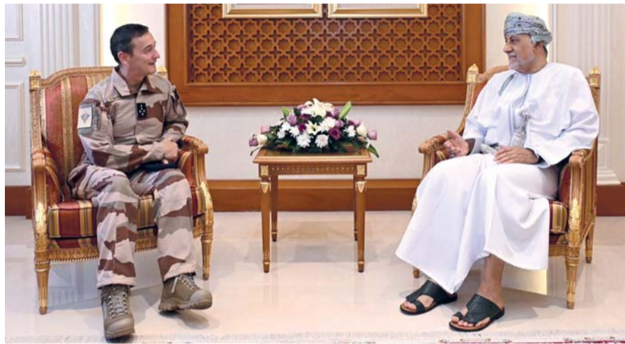
شهاب بن طارق يستقبل فابيان ماندون

عُمان حالياً، ولدى وصول الفريق أول طيار رئيس أركان القوات المسلحة بالجمهورية الفرنسية مقر رئاسة أركان قوات السلطان المسلحة أجريت له مراسم استقبال رسمية، حيث أدى حرس الشرف الحتيّة العسكرية، وعزفت مجموعة من فرقة الموسيقى العسكرية سلام الشرف، ثم استعرض الضيف حرس الشرف. وقام الفريق أول طيار فابيان ماندون رئيس أركان القوات المسلحة بالجمهورية الفرنسية والوفد المرافق له بزيارة إلى مركز الأمن البحري، وكان في استقباله لدى وصوله العميد الركن بحري عادل بن حمود البوسعيدي رئيس مركز الأمن البحري، وخلال الزيارة استمع الضيف الزائر والوفد المرافق له إلى إيجاز عن أدوار مركز الأمن البحري وجهوده في المحافظة على أمن وسلامة البيئة والملاحة في المناطق البحرية لسلطنة عُمان، كما أطلع على مرافق المركز وما رُوّد به من تقنيات وأنظمة حديثة.