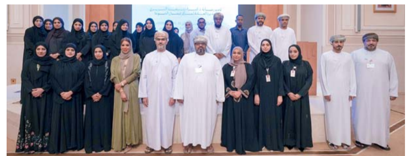
■ رفع كفاءة الخدمات التشخيصية المقدمة