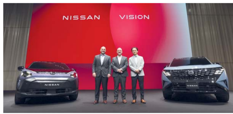
لحظة تدشين مجموعة من طرازات نيسان الجديدة

مع تجربة قيادة ديناميكية بدون الحاجة إلى الشحن. وتأتي نيسان جوك الكهربائية ضمن الفئة العالمية الأساسية «Core»، في أوروبا حيث يجمع بين التصميم الجريء والتحول الكهربائي الكامل والميزات الذكية. وتأتي نيسان إكستيرا ضمن الفئة الرائدة «Heartbeat» في الولايات المتحدة، وتجسد روح المغامرة، مع هيكل قوي قائم على الإطار وتصميم علمي. أما نيسان سكايلين تأتي ضمن الفئة الرائدة «Heartbeat» في اليابان وترتكز على الأداء والدقة وتجربة قيادة موجهة للسائق. وفي فئة السيارات الفاخرة ستظل «إيفينيتي» عنصرًا مهما ضمن استراتيجيتنا لمنتجات نيسان وسيتم إحياء العلامة من خلال طرح طرازات جديدة ومحدثة، بدءاً من سيارة «كيو إكس ٦٥» (QX65) الرياضية متعددة الاستخدامات الجديدة كلياً لعام ٢٠٢٧م هذا الربع وسيتبع ذلك أربعة طرازات إضافية منها سيارة رياضية متعددة الاستخدامات هجينة متوسطة الحجم جديدة، وسيارة سيدان بمحرك «٧٦» موجهة لسائقين رياضيي متنافسين، التي تستدعي تكتيك القيادة الميدانية وتعزيز آليات الاستجابة الفورية لمختلف الممارسات التي قد تطل بتوازن السوق أو تمس بحقوق المستهلك. وأسفرت الحملات الرقابية المكثفة منذ بداية مارس إلى منتصف إبريل من العام الجاري عن رصد أكثر من ٥٠٠ مخالفة، تضمنت تسجيل ١٧٢ مخالفة مرتبطة برفع الأسعار. حيث تركزت النسبة الأكبر منها في قطاع الخضراوات والفواكه، وتوزعت هذه المخالفات في المحافظات ذات النشاط التجاري المرتفع، تصدرتها محافظة مسقط تلتها محافظة جنوب الباطنة، ثم محافظة شمال الشرقية، ومحافظة شمال الباطنة، فيما سجلت باقي المحافظات مخالفات محدودة، وبناءً على ذلك تعاملت الهيئة مع المخالفين باتخاذ الإجراءات القانونية اللازمة وفق ما يتلاءم مع كل مخالفة.