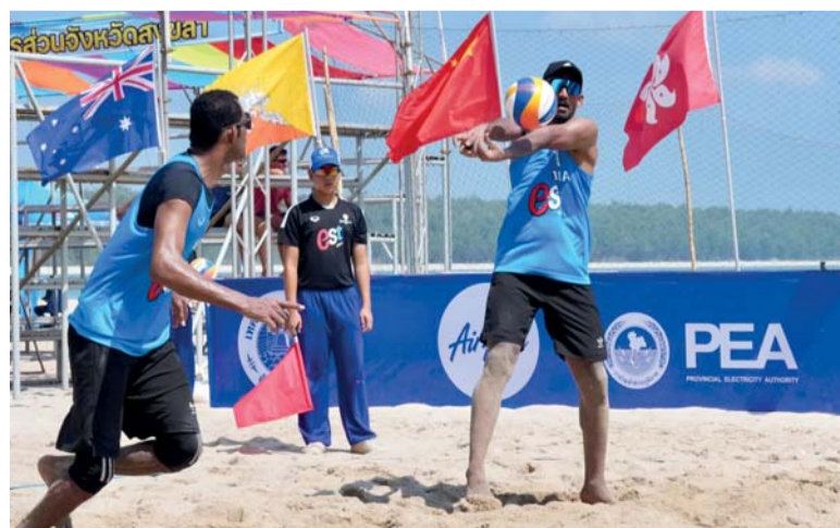
لاعبة المنتخب خلال مشاركتها في الجولة الآسيوية

انهى منتخبنا الوطني لكرة الطائرة الشاطئية مشاركته في منافسات الجولة الآسيوية التي تستضيفها تاييلاند وذلك بعد الخسارة التي تعرض لها المنتخب في منافسات دور ال