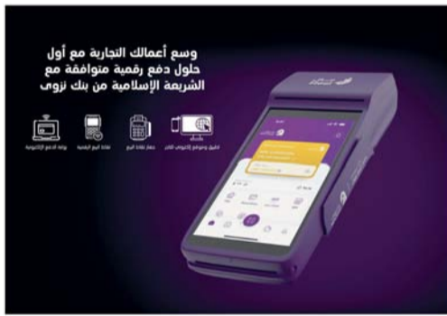
الخدمة تقدم معاملات سريعة وأمنة تلبي احتياجات بيئة الأعمال

أطلق بنك نزوى، حلول دفع جديدة، ليصبح بذلك أول بنك إسلامي في سلطنة عمان يقدم أجهزة نقاط البيع المتوافقة مع أحكام الشريعة الإسلامية. وتشتمل هذه الحلول أجهزة نقاط البيع، وأجهزة الدفع الإلكتروني. وقد صُممت هذه الحلول