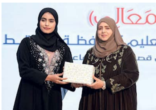
تكريم الهيئات التعليمية والإدارية