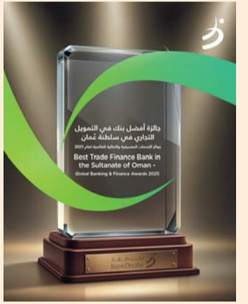
التكريم يعكس التزام البنك بتقديم حلول عالمية في التمويل