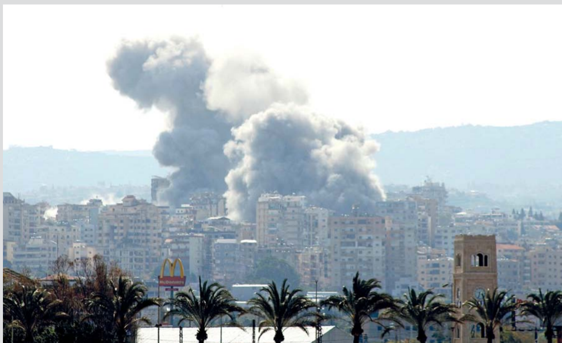
دخان كثيف يتصاعد خلف أشجار النخيل بموقع شهد غارة جوية إسرائيلية استهدفت منطقة الحوش قرب مدينة صور الساحلية اللبنانية.

الدبلوماسية الإيرانية والسلامة الدولية، ويزيد بشكل واضح من خطر التصعيد في منطقة الشرق الأوسط، وفي بكن تعهد الرئيس الصيني شي جينبينج بأن تؤدي بلاده «دورا بناء» في تعزيز محادثات السلام في الشرق الأوسط، وفق ما نقلته وسائل إعلام صينية رسمية. وقالت وكالة أنباء الصين الجديدة «شينخوا» إن شي جينبينج «شدد على موقف الصين المبني على تعزيز السلام والحث على الحوار مؤكداً أن بلاده ستواصل أداء دور بناء في هذا الصدد».