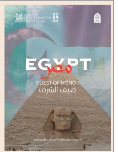
■ المهرجان يسعى لترسيخ مكانته كمنصة احترافية لدعم المواهب الصاعدة وصناع السينما

الجزائر . العُمانية: تحتفي مدينة عنابة الجزائرية ما بين ٢٤ و ٣٠ أبريل الجاري بالدورة السادسة لمهرجان الفيلم المتوسطي، وتأتي جمهورية مصر ضيف شرف هذه الدورة. وجاء هذا الاختيار في ضوء مساعي المهرجان في تعزيز جسور الحوار السينمائي بين ضفتي المتوسط، وتقديراً للمكانة الرائدة لمصر كإحدى أهم دول حوض المتوسط في مجال الإنتاج السينمائي إضافة لدورها التاريخي في تشكيل الوعي البصري العربي. وأوضح منظمو المهرجان أن العلاقات السينمائية المصرية الجزائرية شهدت محطات بارزة على مدى خمسة عقود تجلت في أعمال فنية خالدة، من بينها فيلم (عودة الابن الضال) للمخرج يوسف شاهين، الذي شكّل نموذجاً فنياً لتلاقي الطاقات الإبداعية بين البلدين. وفي هذا السياق، جاءت ملصقة المهرجان تجسيدا لهذه الشراكة، وهي إهداء فني من المصمم المصري الشاب، هشام علي، إلى مهرجان عنابة، كتعبير صادق عن عمق العلاقات