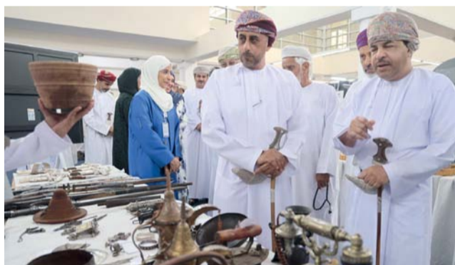
■ الحضور يتجولون في أركان المعرض المصاحب