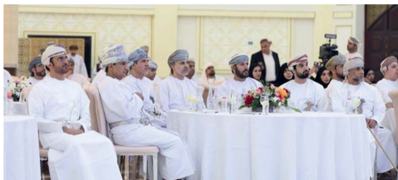
اللقاء يستعرض أبرز مؤشرات الأداء في المحافظة

خلال عام ٢٠٢٥، استقطبت أكثر من (٣٧٥،٤٠٠) زائر، وأسهمت في تنشيط الحركة الاقتصادية وتعزيز الجذب السياحي، إلى جانب دعم المؤسسات الصغيرة والمتوسطة. وشهد اللقاء جلسة نقاشية تفاعلية، طرحت خلالها تساؤلات واستفسارات ممثلي وسائل الإعلام ومنصات التواصل الاجتماعي حول أبرز القضايا المرتبطة بالخدمات والمشروعات التنموية بالمحافظة. وأكد سعادة السيد الدكتور حمد بن أحمد البوسعيدي محافظ البريمي أهمية دور وسائل الإعلام كشريك فاعل في إبراز المنجزات التنموية، مشيراً إلى أن الحكومة ماضية في تنفيذ مشروعاتها وخطتها وفق رؤية ترتكز على تحسين جودة الخدمات وتعزيز كفاءة الأداء. وأشار سعادته إلى أن المحافظة تشهد تحركاً اقتصادياً متنامياً انعكس في ارتفاع مؤشرات القيمة السوقية والقوة الشرائية، ما يعزز جاذبيتها كمنطقة محفزة للاستثمار، كما تُمنح الدور الإيجابي للمجتمع، ولا سيما فئة الشباب، في دعم مسيرة التنمية والمساهمة في دفع عجلة العمل والإنتاج.