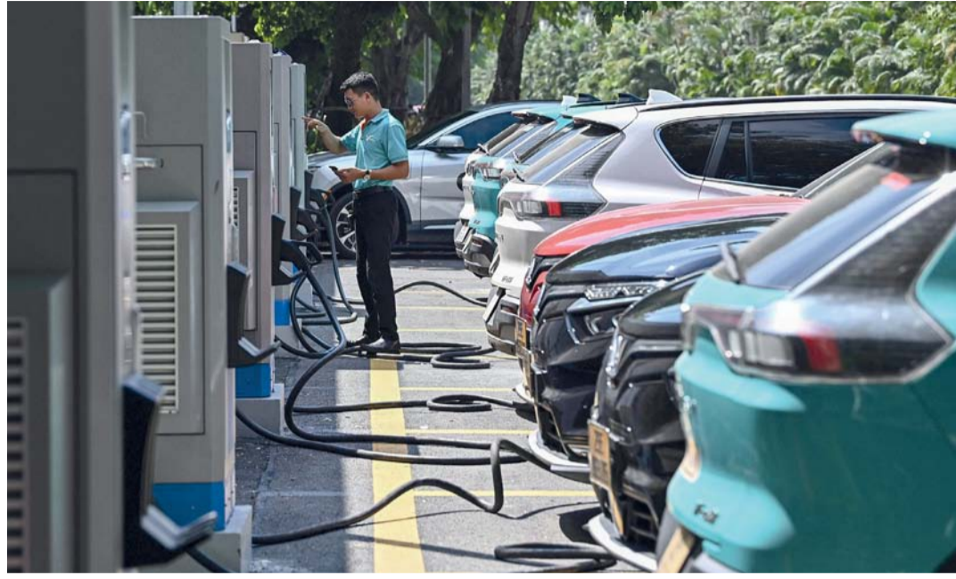
سائق يقوم بشحن سيارته الكهربائية في محطة شحن بهانوي حيث شهدت مبيعات السيارات الكهربائية ارتفاعاً ملحوظاً في جنوب شرق آسيا وذلك بعد ارتفاع أسعار النفط.

وفي أسواق المعادن النفيسة الأخرى، ارتفعت الفضة بنسبة ٠,٩٪ وصعد البلاتين بنسبة ٠,١٪، فيما زاد البلاتينوم بنسبة ٠,٢٪.