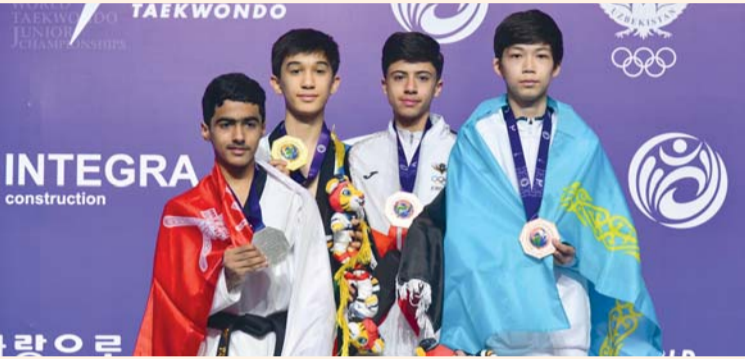
فرحة لاعبا بالتتويج بالميدالية الفضية مع بقية أبطال الفئة