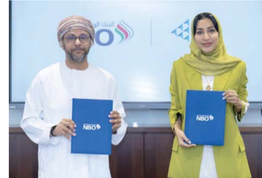
التعاون يسهم في دفع عجلة التنمية الاقتصادية

يواصل البنك الوطني العماني تعاونه مع مؤسسة «إنجاز عُمان» لدعم الشباب العُماني من خلال برنامجي «أموالي مستقبلي» وبرنامج «مسابقة الشركة»، بهدف تمكين الكفاءات الوطنية من اكتساب مهارات أساسية في الثقافة المالية وريادة الأعمال، من خلال مبادرات فاعلة تنسجم مع المهج الأكاديمي المعتمد من وزارة التعليم، حيث تؤكد هذه الجهود التزام البنك الراسخ بدعم الشباب العُماني في أنحاء سلطنة عُمان. ويسعى برنامج «أموالي مستقبلي» إلى إكساب طلبة المدارس المعارف الأساسية في الثقافة المالية وإدارة الأموال، وتمكينهم من اتخاذ قرارات مالية حكيمة، بينما يستهدف برنامج