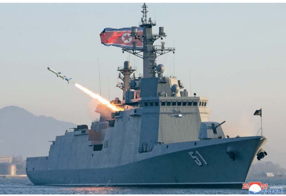
الدمرة تشوي هيون تجري تجربة إطلاق صاروخ كروز في موقع لم يُكشف عنه في كوريا الشمالية.

بيونج يانج. وكالات: أفادت وكالة الأنباء المركزية الكورية بأن كوريا الشمالية أجرت تجربة لصواريخ كروز استراتيجية وأخرى مضادة للسفن الحربية، في إطار اختبارات الكفاءة التشغيلية للدمرة «تشوي هيون». ووضحت الوكالة أن الزعيم كيم جونج أون أشرف على التجربة برفقة كبار مسؤولي الدفاع وقادة البحرية. وأضافت أنه تم إطلاق صاروخين كروز استراتيجيين وثلاثة صواريخ مضادة للسفن، بهدف اختبار نظام القيادة المتكامل للأسلحة في المدمرة، وتدريب الأطقم على إجراءات الإطلاق، والتحقق من دقة أنظمة الملاحة المتطورة لمقاومة التشويش. وبينت أن صواريخ الكروز حلقت لمدة تراوحت بين ٧٨٦٩ و ٧٩٢٠ ثانية، فيما حلقت الصواريخ المضادة للسفن قبالة الساحل الغربي، وأصابت أهدافها بدقة عالية.