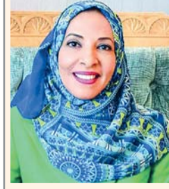
■ مديحة الشيبانية

ترعى معالي الدكتورة مديحة بنت أحمد بن ناصر الشيبانية وزيرة التعليم مساء اليوم الأربعاء تخريج الفوج الأول من حملة شهادات المراحل السادسة والثامنة في الأداء الموسيقي لبرنامج شهادات المدارس الملكية البريطانية