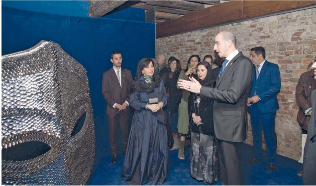
■ التجربة الفنية تعكس القيم الإنسانية والتوازن بين الإنسان ومحيطه

مسقط . العُمانية: تشارك سلطنة عُمان في بينالي البندقية الدولي للفنون ٢٠٢٦، في دورته الـ ٦١، تحت شعار (In Minor Keys)، للتركيز على إبراز التعبيرات الإنسانية العميقة في التجارب الفنية المعاصرة، وهو ما يتقاطع مع توجه سلطنة عُمان في تقديم محتوى ثقافي يعكس مفاهيم التوازن والانسجام والعناية. خلال الفترة من ٩ مايو إلى ٢٢ نوفمبر ٢٠٢٦ م في مدينة البندقية الإيطالية، بإشراف وزارة الثقافة والرياضة والشباب. وتشارك سلطنة عُمان ضمن جناح وطني يعكس رؤيتها الثقافية ويعزز حضورها على الساحة الفنية العالمية من خلال عرض فني يُقام في موقع (الأرسينالي).