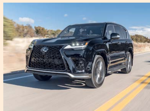
إل إكس ٦٠٠ بمزايا استثنائية

للسائق ونظام صوتي غامر من مارك ليفيغسون مكون من ٢٥ مكبر صوت ولراحة جميع الركاب وزوت السيارة الرياضية متعددة الاستخدامات بمقاعد مدفأة ومهواة، ونظام تحكم مناخي رباعي المناطق، ونظام ترفيه مزدوج للمقاعد الخلفية بشاشات مقاس ١١,٦ بوصة، كما منحت الأولوية للجانب العملي، حيث زودت بمستشعر «القدم» الذي يتيح الوصول بسهولة إلى منطقة الأمتعة. أما نظام لكزس للسلامة فهو متقدم ويحظى بالسائقون بدعم نظام ما قبل الاصطدام، ونظام التنبؤ عند مغادرة المسار مع مساعد التوجيه، ونظام مراقبة النقطة العمياء لضمان الوعي التام على الطريق، كما زودت السيارة بنظام شامل من ١٠ وسائد هوائية بما في ذلك وسائد هوائية لحماية الركبة لكل من السائق والراكب الأمامي، ويضمن هذا الهيكل الواقي المتين أن تكون كل رحلة عائلية آمنة بقدر ما هي فاخرة. ويمكن زيارة صالات عرض سعود بهوان للسيارات لتجربة قيادة هذه السيارة الرياضية الرائدة متعددة الاستخدامات.