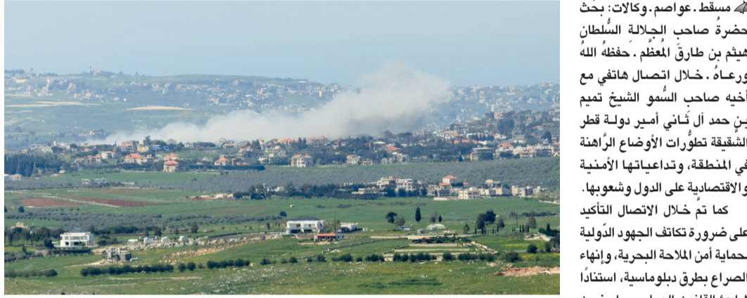
دخان يتصاعد من موقع غارة جوية «إسرائيلية»، استهدفت منطقة في قرية زوتر جنوب لبنان.

سندات تنمية حكومية بـ ٨٠ مليون ريال مع خيار الزيادة مسقط - العُمانية: أعلن البنك المركزي العُماني، نيابة عن حكومة سلطنة عُمان ممثلة بوزارة المالية، طرح الإصدار رقم ٨٣ من سندات التنمية الحكومية بقيمة ٨٠ مليون ريال عُمانِي مع خيار الزيادة (على