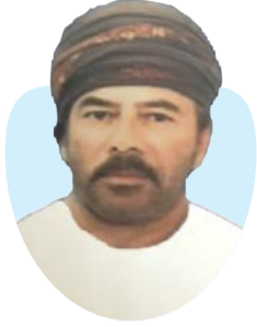
ناصر بن سالم الجهمي كاتب عماني