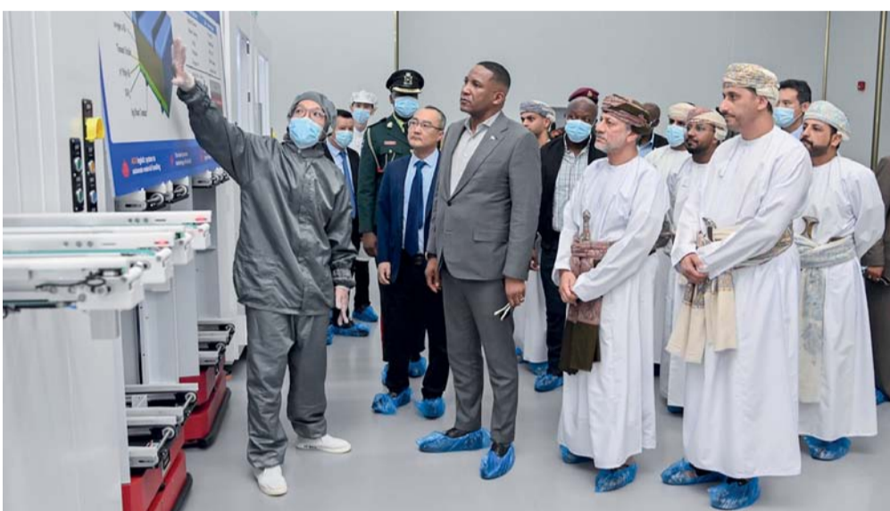
الرئيس الضيف يزور ميناء صحار والمنطقة الحرة

الرئيس البوتسواني يطلع على المنظومة المتكاملة لميناء صحار والمنطقة الحرة