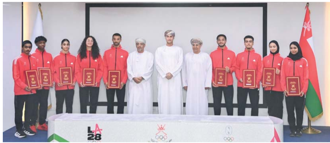
■ اللاعبون المستفيدون من اتفاقيات الدعم الأولمبي بالدفع الأولى.

وتهدف الدورة إلى تعزيز انتشار الرياضات الشاطئية، وتوفير منصة تنافسية للرياضيين في بيئة مفتوحة، إلى جانب دعم التبادل الثقافي بين الدول المشاركة، وترسيخ القيم الأولمبية المتمثلة في التميز والصدق والاحترام، في ظل أجواء رياضية وسياحية مميزة تتمتع بها المدينة المستضيفة.