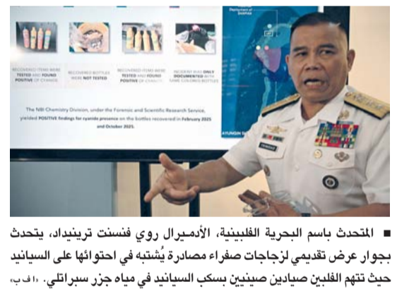
■ المتحدث باسم البحرية الفلبينية، الأدميرال روي فنست ترينيداد، يتحدث بجوار عرض تقديمي لزيارات صفراء مصادرة يُشبهه في احتوائها على السيناريو حيث تهجم الفلبين صيادين صينيين بسكب السيناريو في مياه جزر سبراتلي.

٤. بكين. د.ب.أ: صرح المتحدث باسم قيادة المسرح الجنوبي لجيش التحرير الشعبي الصيني تشاي شي تشن بأن القوات البحرية التابعة للقيادة أجرت دوريات روتينية في الفترة من ٩ إلى ١٢ أبريل في بحر الصين الجنوبي. وقال تشاي إن الفلبين حشدت دولا من خارج المنطقة للقيام بما يسمى «دوريات مشتركة»، مما أثار المشاكل في بحر الصين الجنوبي وقوض السلام والاستقرار في المنطقة، وفقا لوكالة الأنباء شينخوا الصينية. وشدد على أن قوات القيادة ستعمل بحزم على حماية سيادة الصين الإقليمية وحقوقها ومصالحها البحرية. وستحافظ بقوة على السلام والاستقرار الإقليميين.