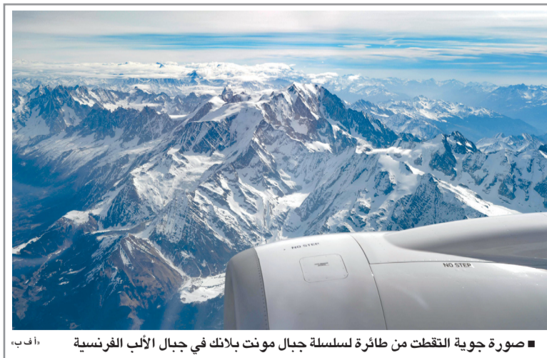
صورة جوية التقطت من طائرة لسلسلة جبال مونت بلانك في جبال الألب الفرنسية

سيدني - د.ب.أ: تسبب إعصار مايلا في فيضانات وانهدامات أرضية شديدة في بابوا غينيا الجديدة، مما أسفر عن وفاة ١١ شخصاً على الأقل مع اعتبار منطقة بوجانفيل ذات الحكم الذاتي من بين المناطق الأكثر تضرراً، حسبما قال مسؤولون ووسائل إعلام. وتعرضت قرى بأكملها للدمار جراء العاصفة التي ضربت المناطق الساحلية بكامل قوتها. وذكرت صحيفة بوست كوربييه، نقلاً عن السلطات، أن ثمانية أشخاص لاقوا حتفهم في انهيار أرضي ليلي عندما طمر منزل تحت الطين. وأفادت هيئة الإذاعة العامة في بابوا غينيا الجديدة (إن بي سي) بأن التقديرات الأولية تشير إلى تضرر أكثر من ١٠ آلاف شخص، ويحتاج ما يقرب من ٢٠ ألف آخرين لمساعدة عاجلة في أنحاء بوجانفيل. وقال سكان لإذاعة (إيه بي سي) الأسترالية إن العديد من الوفيات كانوا من الأطفال. ووقعت الكارثة يوم الخميس لكن لم يتم الإبلاغ عنها إلا الآن بسبب صعوبات في الاتصالات.