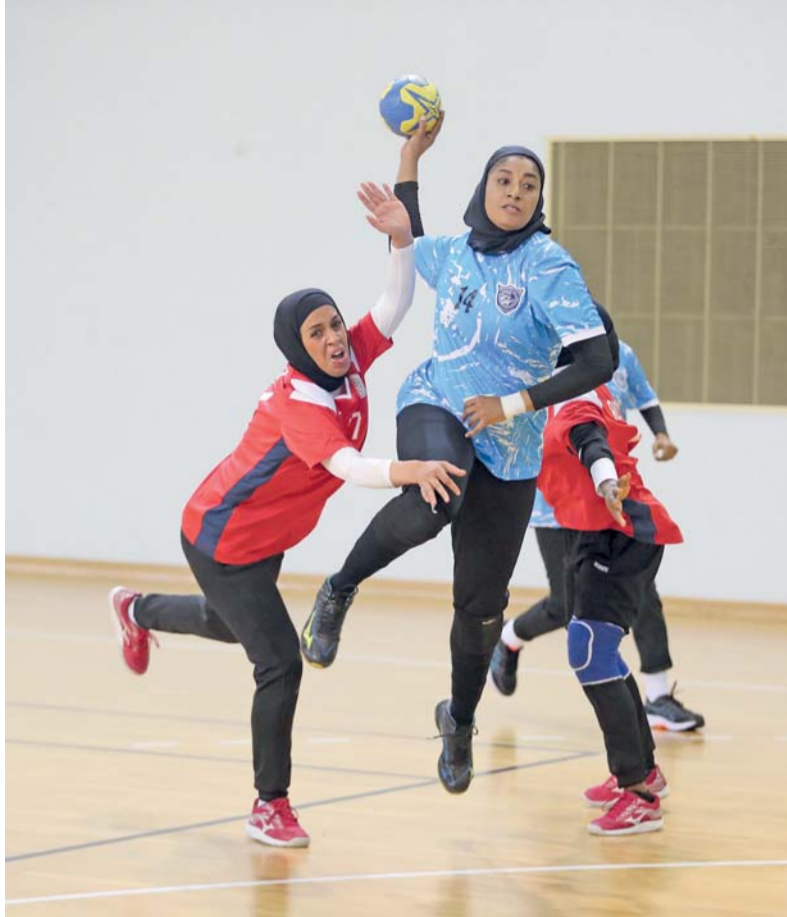
■ مباريات الدوري النسائي لكرة اليد

أعلنت لجنة المسابقات بالاتحاد العماني لكرة اليد عن جدول مباريات وشروط وقواعد الدوري النسائي للموسم الرياضي ٢٠٢٦/٢٠٢٥ م والذي سينطلق في ٢٣ من الشهر الجاري بمشاركة خمسة أندية هي: صلالة، ومصيرة، والعامرات، والاتحاد، وصحم. ويعد الدوري النسائي ختام مسابقات الموسم الرياضي الحالي الذي شهد تنظيم سلسلة من البطولات المتنوعة منذ شهر أغسطس الماضي شملت دوري الناشئين والشباب ودوري الدرجة الثانية ودوري الدرجة الأولى إلى جانب كأس السوبر ومسابقة درج الوزارة الخامسة عشرة ودوري الناشئين لكرة اليد الشاطئية. ويأتي تنظيم هذه المسابقات المتعددة في إطار حرص الاتحاد على دعم وتطوير مختلف الفئات العمرية والعمل على صقل المواهب بما يسهم في اختيار أفضل العناصر لتمثيل المنتخبات الوطنية في