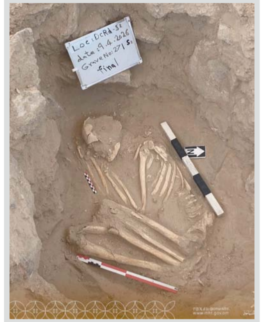
الاكتشافات تعود إلى أواخر الألف الثاني

وعن علاقته بالكاميرا يؤكد بأنها تتجاوز كونها أداة لتصبح وسيلة تعبير ومنبراً ينقل من خلاله تفاصيل الحياة بصدق واحساس عميق مؤكدا أن التصوير يمثل له قيمة مضافة يمنح حياته معنى من خلال ترك اثر ايجابي ونقل جمال البيئة العمانية في مختلف تجلياتها من موسم السورد في الجبل الاخضر إلى تفاصيل حياة النخلة والإنسان مرورا بتوثيق الارث الحضاري والتاريخي كما يوثق بعدسته مشاهد طبيعية آخاذة في