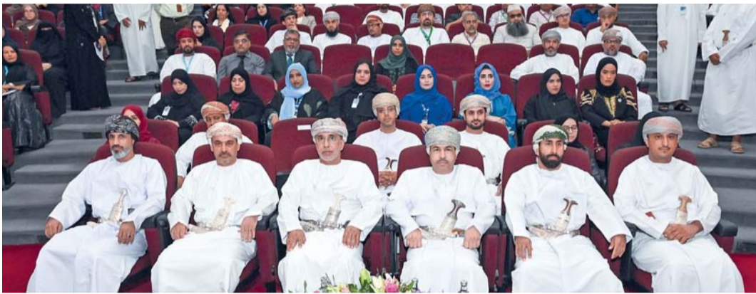
تعزيز مكانة سلطنة عُمان كوجهة استثمارية

مسقط. العُمانية: بدأت أعمال المؤتمر الدولي الأول حول استدامة الأعمال "تعزيز منظومة الابتكار والاستثمار في سلطنة عُمان" تحت رعاية معالي ناصر بن خميس الجشمي رئيس جهاز الضراب، والذي عُقد بجامعة التقنية والعلوم التطبيقية فرع مسقط بالشراكة مع وزارة التجارة والصناعة وترويج الاستثمار وتسيير يومين.