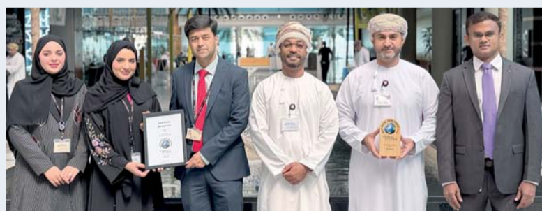
الجائزة تعكس أداء بنك مسقط في تعزيز منظومته الرقمية

الوصول إلى الخدمات المصرفية المقدمة لهم بسلاسة وسرعة و يواصل البنك جهوده ومساهمته في الاستثمار في التحول الرقمي للارتقاء بالمزاي والتسهيلات. وأعلن بنك مسقط مؤخراً عن إطلاق خدمة التمويل الفوري إلكترونياً عبر تطبيق الهاتف المحمول، في خطوة تعكس التزام البنك بالتميز الرقمي والابتكار المستدام، إذ تتيح هذه الخدمة الجديدة للزبائن المؤهلين التقدم بطلب الحصول على تمويل شخصي واستلام المبلغ خلال دقائق معدودة، دون الحاجة إلى زيارة الفروع أو استكمال أي إجراءات ورقية، إذ يتم إيداع مبلغ التمويل مباشرة في حساب الراتب بمجرد إتمام الطلب والتحقق منه عبر رمز التحقق (OTP)، وذلك من خلال خطوات بسيطة وسلسة عبر التطبيق.