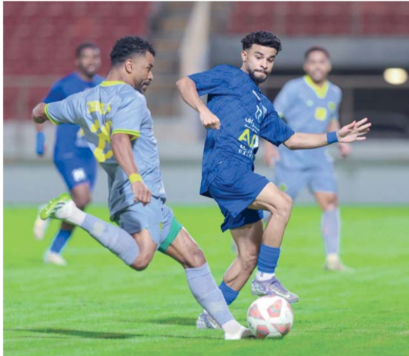
النصر يضغط على السيب والخابورة يتراجع لمراكز الخاسر

من جهته، واصل نادي النصر مطاردته للمتصدر، بعدما أن تمكن من تحقيق انتصار ثمين من أمام الخابورة بهدفين دون رد، الفوز جاء