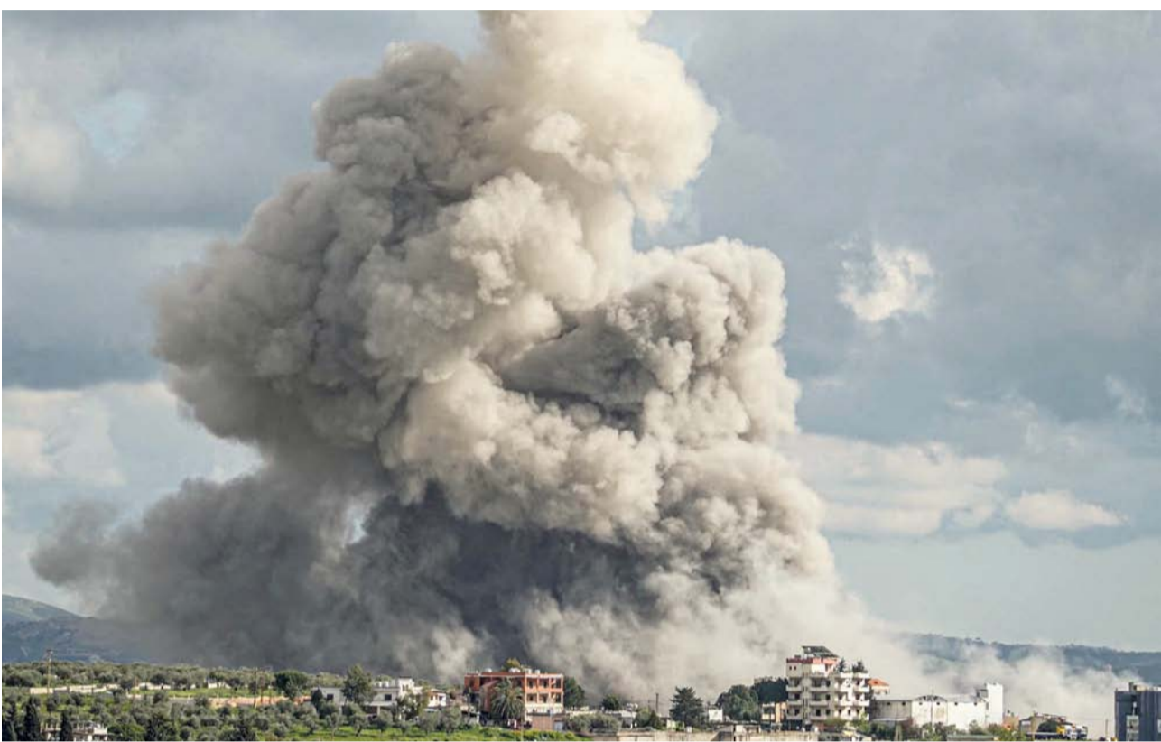
الدخان يتصاعد من موقع غارة جوية إسرائيلية استهدفت منطقة في مدينة النبطية جنوب لبنان.