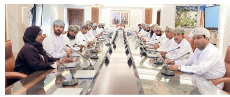
المجلس البلدي بمحافظة الداخلية خلال اجتماعه أمس

التقت لجنة الشباب والموارد البشرية بمجلس الشورى أمس بسعادة محمود بن عبدالله العويضي رئيس مجلس إدارة بنك التنمية وعدد من المختصين بالبنك، وذلك في إطار سعي اللجنة للاطلاع على أبرز المبادرات والبرامج التمويلية المقدمة من بنك التنمية لدعم المبادرات الشبابية التي من شأنها أن تدعم استمرارية وديمومة المشاريع الصغيرة والمتوسطة إلى جانب إيجاد فرص عمل للشباب في مختلف القطاعات. وقدم المختصون ببنك التنمية عرضاً مرئياً استعرضوا خلاله دور البنك في إيجاد بيئة جاذبة لتشجيع الشباب في ريادة الأعمال وأبرز مؤشرات البنك لعام ٢٠٢٥، وتضمن العرض كذلك إحصائيات بعدد المشروعات الممولة بمختلف القطاعات الاقتصادية خلال الفترة (٢٠٢١ - ٢٠٢٥)م، ومقدار المخصصات التمويلية التي يقدمها البنك سنوياً ومدى مواكبتها مع الطلبات المقدمة. كما تم الحديث عن أبرز التسهيلات والخدمات المساندة