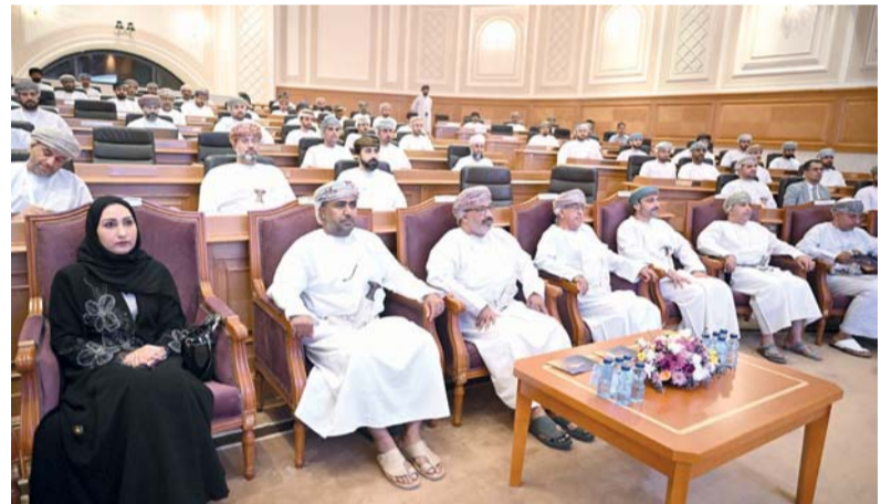
الندوة تركز على تعزيز التكامل بين الأنظمة الرقابية ومنها التكامل الإلكتروني

مرونة تستجيب للاحتياجات المستقبلية قبل ظهور التحديات. وتستهدف الندوة أعضاء الجهات الرقابية، وصناع القرار، وواضعي السياسات العامة والتنفيذية في الوحدات الحكومية والقطاع الخاص، إضافة إلى العاملين في مجالات التدقيق الداخلي، وإدارة المخاطر، والامتثال، والرقابة على الأداء، والتفتيش القضائي والإداري، والمهتمين بالشأن الرقابي والقانوني. وستخرج الندوة بجملة من التوصيات العملية الرامية إلى تعزيز مكانة سلطة عُمان كمركز إقليمي دولي في مجال الرصد الاستباقي ورفع مؤشر كفاءة النظام الرقابي الاستباقي ضمن منظومة الحوكمة الوطنية، وتطوير برامج وطنية للتدقيق المتقدم والتدقيق الوقائي، وتعزيز التعاون بين مختلف المؤسسات الرقابية، بما يساهم في تحقيق مستهدفات رؤية عُمان ٢٠٤٠، وتعزيز تنافسية الاقتصاد الوطني عبر منظومة رقابية استباقية ونكية.