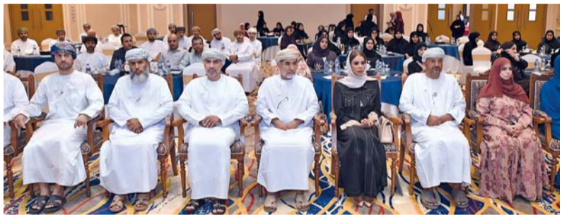
تطبيق أفضل الممارسات والمعايير الدولية