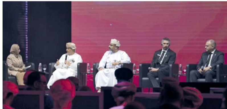
قطاع الطيران يقوم بدور مهم في تعزيز تنافسية الاقتصاد العماني إقليمياً وعالمياً

كما بلغت إيرادات طيران السلام نحو ١٣٧ مليون ريال عماني خلال العام ٢٠٢٥م في انعكاس لدوره المتنامي في دعم قطاعي الطيران والسياحة في سلطنة عُمان من خلال توفير خيارات سفر اقتصادية تعزز الربط الجوي مع الأسواق الإقليمية والدولية. وخلال اللقاء الإعلامي السنوي المشترك الذي عقد أمس في مركز عمان الدولي للمؤتمرات والمعارض بحضور عدد من أصحاب المعالي والسعادة ومديري العموم والرؤساء التنفيذيين في القطاع الخاص وممثلي وسائل الإعلام المختلفة تم استعراض مؤشرات النمو والتقدم في مطارات عمان والطيران العماني وطيران