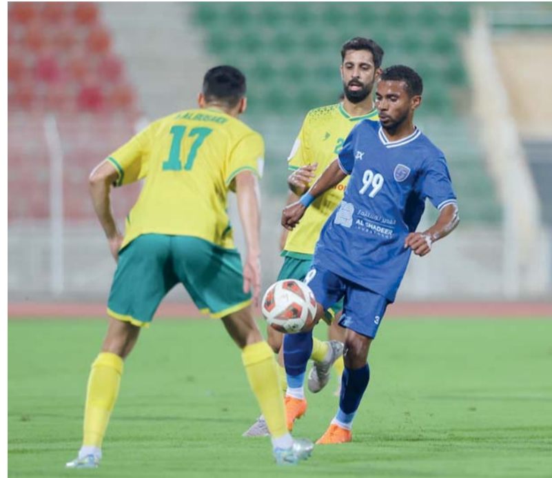
السيب واصل زحفه بثبات متخطياً عقبة صحم بثنائية

دخل دوري جندال منعطفه الحاسم، ومعه ارتفعت وتيرة الإثارة بشكل لافت، بعدما حملت مباريات الأسبوع العشرين العديد من النتائج الثقيلة والمفاجآت، التي أعادت ترتيب أوراق المنافسة سواء في القمة أو القاع، لتؤكد أن الأسابيع الستة المقبلة ستكون على صفيح ساخن، وهذا مؤشر على أن ما تبقى من دورينا سيكون مرهقا للأندية سواء التي تلطم لمعانقة اللقب أو الحصول على مركز متقدم أو الفرق التي تصارع من أجل الهروب من السقوط لدوري المظالم الذي لن يرحم من يسقط له خاصة وأن المنافسة ستكون شديدة عكس المواسم السابقة، فمن المتوقع عودة فرق عريقة لدائرة التنافس من جديد بعد فترة من التجميد إذا لم يتم إعادة دوري الدرجة الثانية للواجهة مجدداً، وبات على هذه الفرق أن تعيد رسم طريقها للخروج من هذا المأزق وعليها أن تدرك أن فقدان أي نقطة يعني مصيراً مجهولاً ربما لن يكون سعيداً في نهاية المطاف بعد أن انقسم دورينا إلى ثلاثة أقسام، الأول صراع ثلاثي على اللقب بين السيب والنصر والشباب، والثاني صراع تحسين المراكز الذي يبدأ من النهضة الرابع وحتى نادي عمان، والثالث صراع الهبوط الذي يبدأ من ظفار صاحب المركز الثامن برصيد (٢١) نقطة وحتى المركز الأخير الذي يقبع فيه الرساق برصيد (٨)