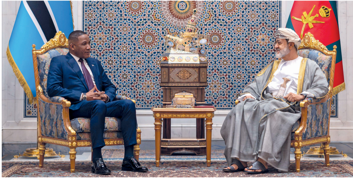
جلالة السلطان أثناء استقباله رئيس جمهورية بوتسوانا بقصر البركة العامر حيث عقدا جلسة مباحثات تناولت أوجه التعاون بين البلدين

حققت مطارات عُمان والطيران العُماني وطيران السلام أداءً إيجابياً خلال العام الماضي ٢٠٢٥ م، مدعوماً بنمو الإيرادات وتعزيز الكفاءة التشغيلية والتوسع في شبكة الوجهات والخدمات، في خطوة تعكس دخول منظومة الطيران في سلطنة عُمان مرحلة جديدة من النمو، وتعزيز حضورها على خريطة الطيران الإقليمية والدولية. تفاصيل: «القطيب»