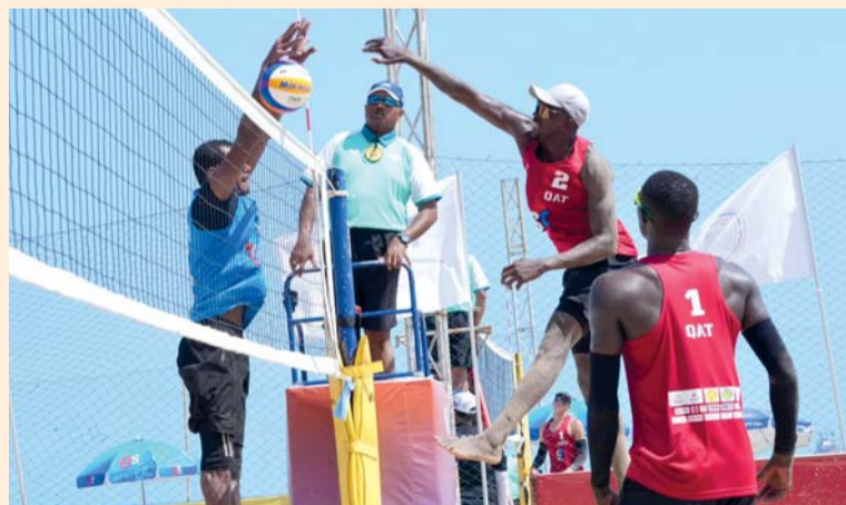
■ لاعب المنتخب في محاولة تصدي لسيدة لاعب المنتخب القطري

بدأ منتخبنا الوطني لكرة الطائرة الشاطئية مشاركته في منافسات البطولة الآسيوية التي ينظمها الاتحاد الآسيوي لكرة الطائرة والتي تقام منافساتها في تايلاند وسط مشاركة كبيرة من المنتخبات الآسيوية والتي وصلت إلى ٢٩ فريقا يمثلون أبرز المنتخبات الآسيوية وبمشاركة ذلك منتخبنا استراليا ونوزيلاند في هذه الجولة حيث تستعد جميع المنتخبات الآسيوية للمشاركة في منافسات دورة الألعاب الآسيوية الشاطئية المقرر أن تنطلق يوم ٢٢ من الشهر الحالي بالصين وتأتي مشاركة المنتخب في هذه البطولة ضمن برنامج الإعداد للالعاب الشاطئية. وافق منتخبنا الوطني مشواره في منافسات الجولة الآسيوية بخسارة من المنتخب القطري بنتيجة ١/٢ بعد أن وقع في المجموعة الثانية والتي تضم بجوار منتخبنا قطر وهونج كونج. وتمكن المنتخب من الفوز في المباراة الثانية أمام