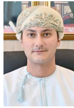
■ عزان بن قيس

توقع اليوم «الثلاثاء» اللجنة الأولمبية العمانية اتفاقيات الدعم القاري المدعوم من قبل التضامن الأولمبي الدولي لعدد من الرياضيين العمانيين وذلك تحت رعاية صاحب السمو السيد عزان بن قيس آل سعيد رئيس اللجنة الأولمبية العمانية في الساعة الثانية عشرة ظهرا بالإكاديمية الأولمبية العمانية بمبنى اللجنة الأولمبية العمانية