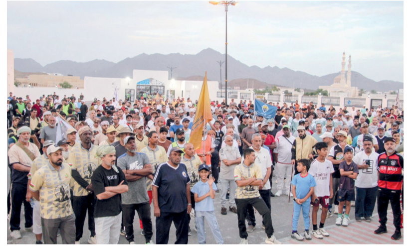
تعزيز ثقافة المشي والنشاط البدني

انطلق المسار من أمام سبلة الغشب لمسافة (٨) كيلومترات في رحلة استكشافية للبلدة، حيث تنقل المشاركون بين البساتين والمزارع ومسارات الأفلاج، مروراً بالبيوت الأثرية والتحصينات القديمة، ما أتاح لهم التعرف على ملامح الهندسة العمانية والبيئة الزراعية التي تميز البلدة. هدفت الفعالية إلى تعزيز ثقافة المشي والنشاط البدني، والتعريف ببلدة الغشب كوجهة سياحية وتاريخية، بجانب دعم السياحة الداخلية وإبراز مميزات الرستاق في سياحة المغامرات. واختتمت الفعالية بتكريم الفرق المشاركة والجهات الداعمة.