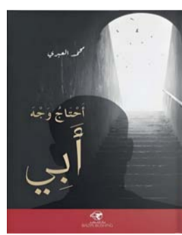
غلاف إصدار احتجاج وجه أبي

يقال كاهل الشاعر، وإن كان عبثاً فهو كما تفضلت جميل. * نلاحظ في قصيدة (عميق كتهنيدة عشق) أن الإيقاع هادئ جداً يشبه فعل (التهنيدة) ذاتها، هل تعتمد أن تعكس الموسيقى الداخلية الحالة الشعورية للنص؟ وكيف تقود الوزن ليخدم اللحظة الوجدانية دون أن تضحي بمرئونة المعنى؟ الإيقاع الهادئ في هذا النص هو تلذذ واستمتاع بالتغني بهذا الكائن المحلق، النابع من الداخل، والمسافر بك في عوالمه، المترافقة معه تهنيداً، المتناسبة موسيقياً من لقاء نفسها، النافذة إلى كل جميل، وما اتفاق الوزن ومرئونة المعنى إلا من صدق هذه اللحظة الوجدانية التي أخذت بتلابيب القلب. * في نصوصك، تبدو الذات (متأملة) أكثر منها (منفصلة)، فهل الشعر بالنسبة لمحمد العبري هو وسيلة للهروب من ضجيج العالم المعاصر، أم هو محاولة لإعادة ترتيب فوضى هذا العالم؟ الحياة كلها تأمل، والشاعر جزء من