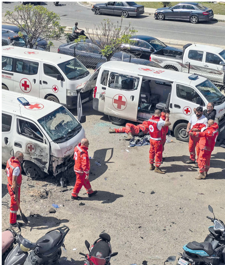
متطوعو الصليب الأحمر اللبناني يعاونون الأضرار التي لحقت بسيارات الإسعاف التابعة لهم في موقع غارة جوية إسرائيلية، استهدفت مقرهم في مدينة صور.

مسقط - العُمانية: بلغ سعر نفط عُمان الرسمي تسليم شهر يونيو ١٠٥ دولارات أميركية و ٨٣ سنتاً. وشهد سعر نفط عُمان أمس ارتفاعاً بلغ ٥ دولارات أميركية و ٦٤ سنتاً مقارنة بسعر يوم الجمعة الماضي البالغ ١٠٠ دولار أميركي و ١٩ سنتاً. تجدر الإشارة إلى أن المعدل الشهري لسعر النفط الخام العُماني تسليم شهر أبريل الجاري بلغ ٨٦ دولاراً أميركياً و ١٥ سنتاً للبرميل، مرتفعاً ٥ دولارات أميركية و ٩٨ سنتاً مقارنة بسعر تسليم شهر مارس الماضي. تفاصيل: «القطيب»