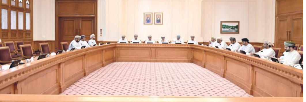
اللقاء استعرض التسهيلات والخدمات المساندة في تطوير المشاريع الناشئة