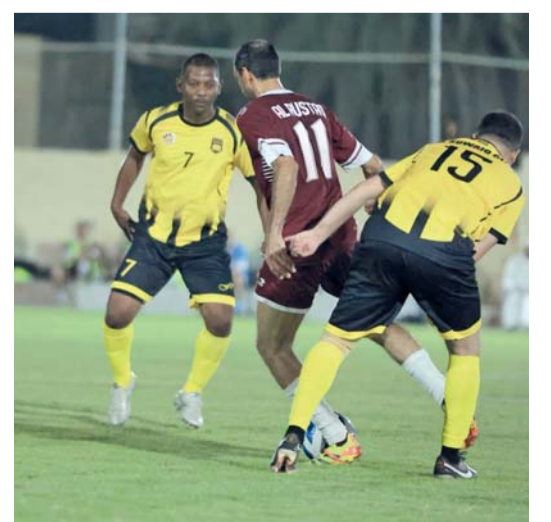
من لقاء السويق والرساق