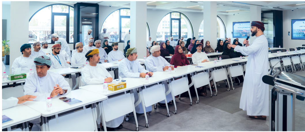
زيارة الإعلاميين والصحفيين لمبنى الوزارة للتعرف عن قرب على مشاريع الوزارة

وشهدت الملكية الرقمية نقلة نوعية في الموثوقية وسهولة الوصول في خطوة تعكس التوجه نحو التحول الرقمي الشامل، تم الانتقال إلى إصدار سندات الملكية الرقمية، ضمن منظومة متكاملة تهدف إلى تبسيط الإجراءات وتعزيز تجربة المستخدم ويتميز هذا التحول بعدد من المزايا، أبرزها: رفع مستوى الموثوقية والأمان من خلال استخدام رمز الاستجابة السريعة (QR) الذي يتيح التحقق الفوري من بيانات العقار.