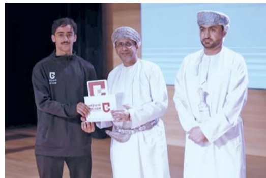
■ تكريم أحد اللاعبين المحيدين