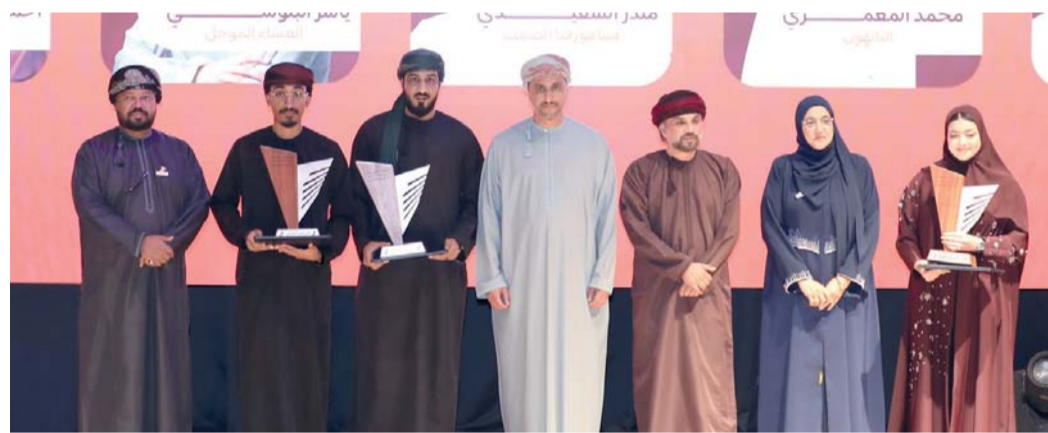
صورة جماعية للفائزين في المسابقة

مسقط. العُمانية: نظم النادي الثقافي جلسة حوارية بعنوان (تخيّل تاريخ الأخر في الرواية العُمانية المعاصرة) وذلك في إطار الجهود المستمرة لتعزيز الحراك الثقافي والنقدي في سلطنة عُمان. وقد استعرضت الندوة التي أدارها الدكتور خالد بن علي المعري، مفهوم (تخيّل الأخر) وتمثلاته في السرد الروائي، وأهمية استحضار (تاريخ الأخر) في الرواية، وكيفية إعادة تشكيله أدبياً بما يعكس تفاعل الثقافات وتداخلها في النص السرد العُمني. وقدم الدكتور حسني مليطات الأستاذ المساعد في كلية التربية والآداب بجامعة صحار ورقة عمل تناول فيها مفهوم (تخيّل الأخر) وأثره في إثراء البناء الروائي، مشيراً إلى أن الرواية العُمانية باتت أكثر انفتاحاً على استحضار تجارب إنسانية وثقافات مغايرة، بما يساهم في توسيع أفق السرد وتعميق أبعاده الفكرية. واتخذ من رواية (سر الموريسي) للكاتب محمد العجمي نموذجاً تطبيقياً. من جانبه، استعرض الدكتور محروس محمود القلبي، أستاذ النقد الأدبي والأدب المقارن بـ جامعة السلطان قابوس، في ورقته البحثية مفهوم «الصورة الذهنية للأخر في الرواية العُمانية تأمل معرفي مشترك» ضمن حقل الدراسات الأدبية المقارنة، منظرًا إلى ما يعرف (Imagologie) أو علم دراسة الصورة، وما أثاره من نقاشات نقدية بين المدارس الغربية المختلفة.