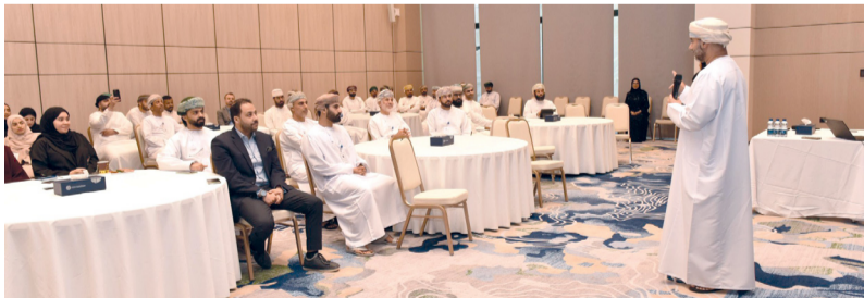
■ الجلسة سلطت الضوء على جهود تعزيز منظومة التكنولوجيا المالية

استضافت هيئة الخدمات المالية بالتعاون مع إيراك (مجمع التكنولوجيا المالية في سلطنة عُمان) جلسة نقاشية بعنوان «ضمان الامتثال الشرعي في منصات التكنولوجيا المالية، قدمها صاحب السمو السيد الدكتور أدهم آل سعيد، أستاذ مساعد في الاقتصاد بجامعة السلطان قابوس، وبحضور سعادة عبدالله بن سالم السالمي، الرئيس التنفيذي للهيئة، وعدد من المهتمين وممثلي شركات التكنولوجيا المالية ذات العلاقة. وسلطت الجلسة الضوء على الجهود المستمرة لتعزيز منظومة التكنولوجيا المالية في سلطنة عُمان من خلال نهج تنظيمي متكامل يقوده كل من هيئة الخدمات المالية والبنك المركزي العماني. وشملت أبرز التطورات