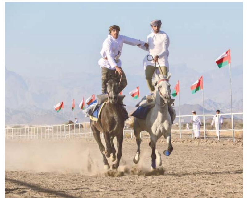
■ من فعاليات مهرجان الفروسية والسباق بولاية بهلاء

ويأتي هذا الاختيار تتويجا للجهود المتواصلة التي يبذلها الاتحاد العماني لكرة اليد في تأهيل وتطوير الكوادر الإدارية والفنية بما يواكب تطلعات المرحلة المقبلة ويعزز من حضور السلطنة في مختلف دوائر صنع