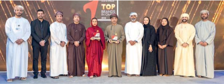
■ الجائزة دليل على توجه البنك على القيمة المستدامة والابتكار الهادف

التي يضعها زبائننا وشركاؤنا في مسيرتنا، ودليلاً على نجاح نهجنا في بناء هوية مؤسسية ترتكز على القيمة المستدامة والابتكار الهادف، مؤكداً أن قوة الهوية التجارية تنبع من وضوح رؤيتنا، والتزامنا بتقديم تجارب مصرفية متطورة تواكب تطورات الزبائن وتسهم في تمكينهم من تحقيق طموحاتهم بثقة.