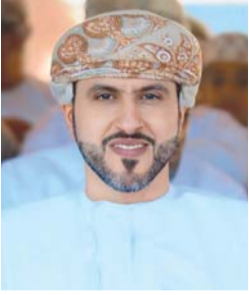
■ حمدان السعدي

الله تفتتح في تمام الساعة السابعة مساء اليوم البطولة الأولى لقدامى لاعبي أندية الباطنة، وذلك تحت رعاية الشيخ الدكتور حمدان بن سباع السعدي نائب رئيس مجلس إدارة نادي السويق وبحضور عدد من الشخصيات الرياضية الداعمة لهذه الفكرة، البطولة ستقام مبارياتها على ساحة ملعب فريق شباب بديعوه (الوعد الصادق) وذلك خلال يومي الخميس والجمعة من كل إسبوع، وستطلق البطولة بقاء نادي السويق مع نظيره نادي الرستاق، فيما تشهد أمسية الغد مباراتين تجمع الأولى بين نادي صحم ونادي صحار في لقاء ديربي منتظر عند الرابعة والنصف، فيما يلعب نادي الشباب مع نظيره نادي المصنعه عند الساعة السابعة مساء.