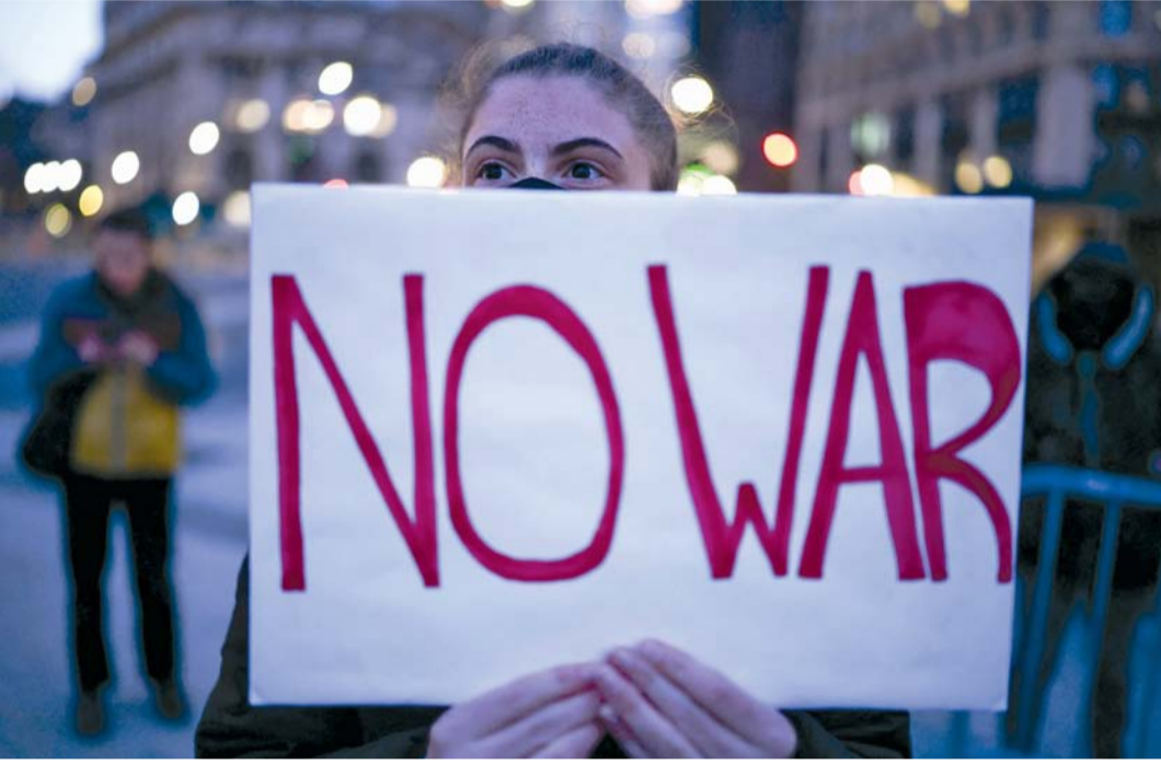
مظاهرة تحمل لافتة خلال احتجاج ضد العمليات العسكرية الأمريكية في إيران في حي مانهاتن بمدينة نيويورك