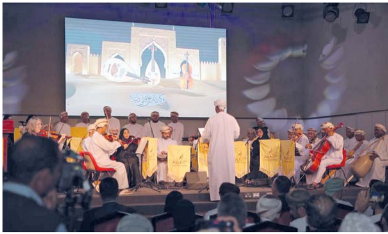
الجلسة ضمت عدداً من الأكاديميين والخبراء والممارسين في الحقل الموسيقي

كما خلصت الجلسة إلى أهمية التكامل المؤسسي بين الجهات الثقافية والأكاديمية، وتفعيل دور البحث العلمي في تطوير الدراسات الموسيقية، إلى جانب تبني مبادرات نوعية تستهدف الشباب، وتوفير لهم منصات للإبداع والتجريب ضمن بيئة تحترم الخصوصية الثقافية وتستوعب متطلبات الحداثة. وتنعكس هذه الجلسة توجهاً وطنياً متنامياً نحو إعادة الاعتبار للفنون بوصفها رافداً استراتيجياً للتنمية الثقافية، ووسيلة لتعزيز الحضور العُماني في المشهد الفني الإقليمي والدولي، عبر مقاربة متوازنة تجمع بين صون التراث واستشراف المستقبل.