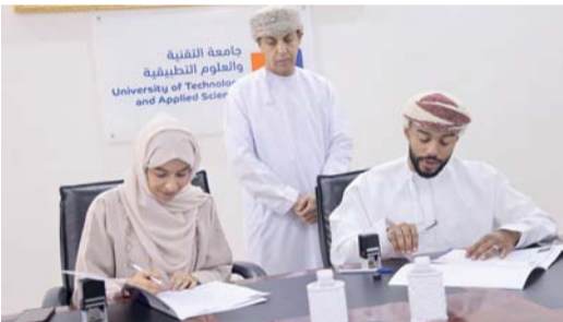
الرساق. من سيف الغافري :

وقعت جامعة التقنية والعلوم التطبيقية، ممثلة في كلية التربية بالرساق، مذكرة تعاون مع معهد ETRADING، للتدريب في مجال التداول، انطلاقاً من الرغبة المشتركة في مد جسور التعاون بين القطاع الأكاديمي والقطاع التدريبي وتماشياً مع رؤية «عمان ٢٠٤٠» في تأهيل الكوادر الوطنية المتخصصة، بهدف تنفيذ حزمة من البرامج التدريبية التي تستهدف الطلبة (المعلمين المستقبليين)، وموظفي