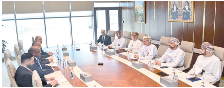
■ اللقاء أكد على أهمية تعزيز الشراكات الاقتصادية والاستثمارية بين البلدين