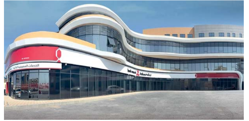
■ الفرع الجديد يقدم تسهيلات مصرفية متكاملة وعصرية