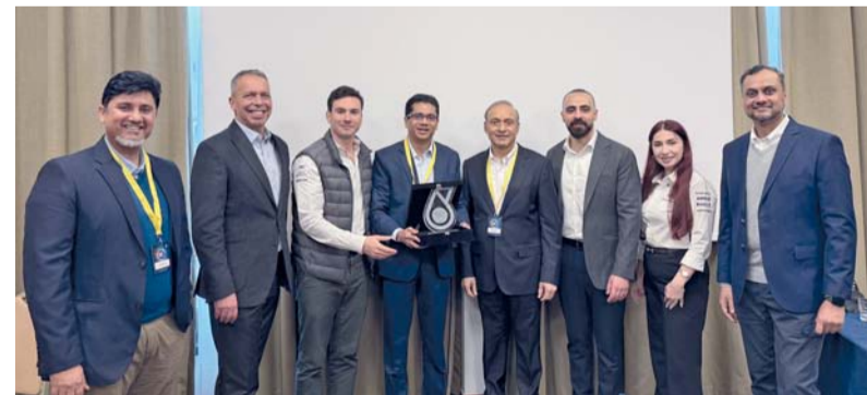
■ الجائزة تؤكد نجاح الشركة في الارتقاء بعلامتها التجارية في السوق العماني

شراكتنا مع بتروناس قائمة على التزام مشترك بأعلى معايير الجودة والابتكار العالمية، ونحن مستمرون في سعيها لضمان بقاء بتروناس الخيار الأول والمنتج المفضل لخبراء ومحبي السيارات على حد سواء. وتواصل «بتروناس» ريادتها في قطاع الزيوت الصناعية والتشحيم عالمياً من خلال التفوق التقني