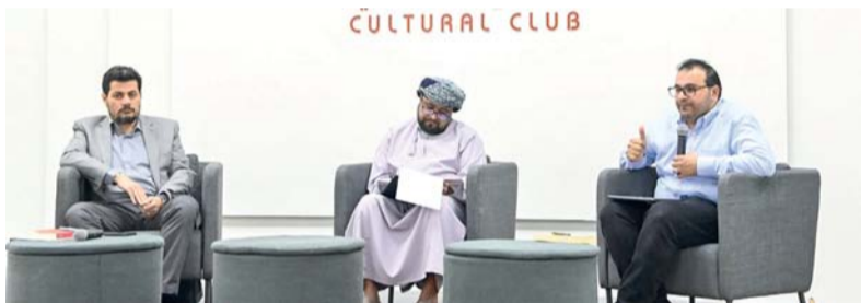
المشاركون في الجلسة الحوارية