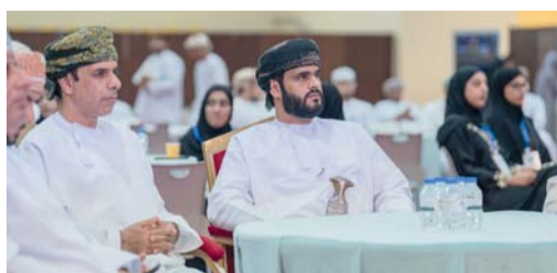
تقديم برنامج تعريفى حول تحليل نصوص القضايا