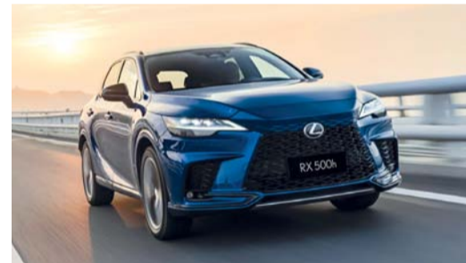
■ لكزس آر إكس ٥٠٠ إتش بمجموعة من التقنيات الحديثة

أمامية، وتأتي لكزس «آر إكس ٥٠٠ إتش» مجهزة بنظام الصوت المحيطي المتميز مارك ليفنسون، بينما تعرض شاشة العرض البانورامية مقاس ١٤ بوصة تفاصيل أساسية طوال الرحلة، كما زودت بتصميم التقنيات مثل مساعد تغيير المسار، ونظام لمراقبة النقطة العمياء، ومساعد الحفاظ على المسار، وتتبع المسار مع الاهتزاز، ونظام ما قبل الاصطدام، ونظام تثبيت السرعة التكيفي، ونظام تنبيه مغادرة المسار، وأجهزة استشعار عند ركن السيارات في الأمام والخلف من أجل زيادة انتباه السائق على الطرق، كما أنها تساعد في تقديم تجربة قيادة لا مثيل لها بين ميزات السلامة المتقدمة الأخرى الجديدة بالملاحظة.