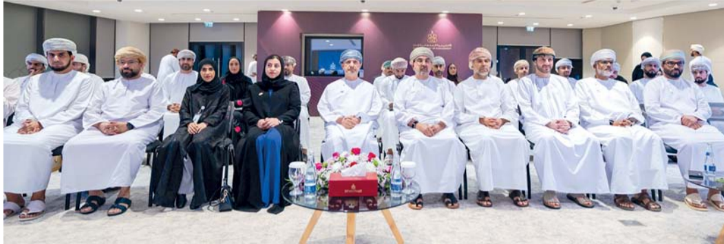
■ بناء منظومة قيادية مرنة تتسم بالكفاءة