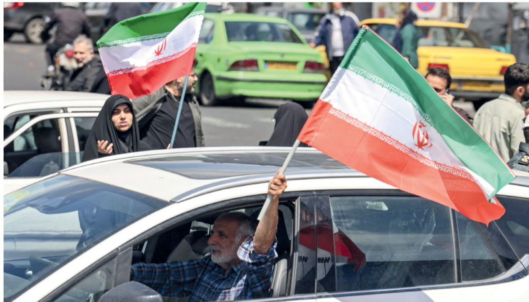
إيرانيون يلوحون بالأعلام بينما يجتمع الناس في ميدان الثورة بظهران بعد اتفاق الولايات المتحدة وإيران على وقف إطلاق النار.

مسقط. العُمانية: أكد معالي المهندس سعيد بن حمود المعولي وزير النقل والاتصالات وتقنية المعلومات أمام مجلس الشورى أن استثمارات بعض شركات القطاع الخاص الكبرى في مجال الذكاء الاصطناعي والتقنيات الرقمية المتقدمة تجاوزت ٧٩ مليون ريال عُمان، وتم إطلاق عدد من المبادرات الوطنية النوعية. وقال معاليه إن الوزارة تستهدف خلال الخطة الخمسية الحادية عشرة تنفيذ استراتيجيات الموائمة لتعزيز تنافسيتها والتحول نحو الموائمة الخضراء منخفضة الانبعاثات، والتوسع في مشروعات الوقود الأخضر، وإعادة تدوير السفن وتطوير الموانئ الصغيرة والمتوسطة من خلال اتفاقيات الامتياز.