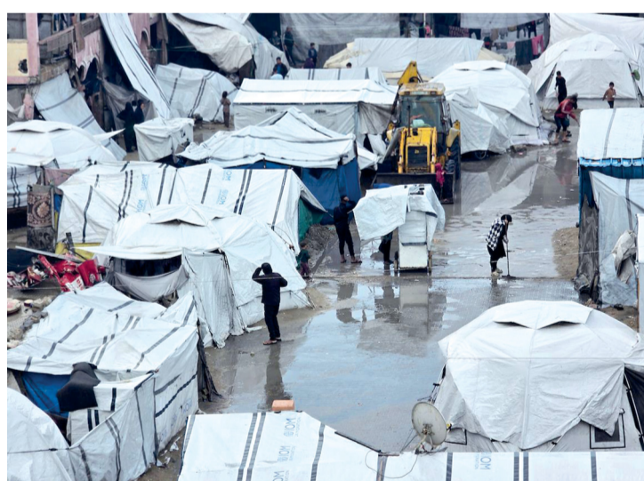
مياه الأمطار تغرق خيام النازحين في خان يونس.

واصل جيش الاحتلال الإسرائيلي خروقاته المميتة ووقف إطلاق النار في مختلف مناطق قطاع غزة، حيث أُنشئت الخروقات الإسرائيلية، خلال ٢٤ إلى استهداف ثلاثة وإصابة أعداد أخرى في مختلف مناطق القطاع. ومع اقتراب فصل الصيف تهدد الأوبئة الصامتة القطاع، حيث تتفاقم أزمة بيئية وصحية خطيرة داخل مخيمات النزوح في قطاع غزة. وبيات انتشار القوارض والحشرات يشكل تهديداً يومياً لحياة آلاف العائلات، في ظل ظروف معيشية قاسية ونقص حاد في الخدمات الأساسية. كما أن تراكم النفايات بشكل كبير حول أماكن النزوح إلى بؤر مفتوحة للأمراض، وسط عجز واضح في السيطرة على الوضع.