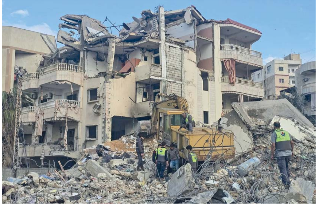
رجال الإنقاذ يعملون في موقع غارة جوية إسرائيلية على مدينة صور جنوب لبنان

مسقط، عواصم وكالات: رحبت سلطنة عمان بإعلان وقف إطلاق النار بين الجمهورية الإسلامية الإيرانية والولايات المتحدة الأمريكية، مُثمنة الجهود التي بذلتها جمهورية باكستان الإسلامية في هذا الإطار وكافة الأطراف الداعية لوقف الحرب. وأكدت سلطنة عمان في بيان لوزارة الخارجية على أهمية تكثيف الجهود الآن لإيجاد الحلول الكفيلة بإنهاء الأزمة من جذورها وتحقيق وقف دائم لحالة الحرب والأعمال العدائية في المنطقة. واتفقت الولايات المتحدة وإيران على وقف إطلاق النار لمدة أسبوعين وذلك قبل ساعة واحدة فقط من انتهاء مهلة الإنذار الذي أطلقه دونالد ترامب بتدمير الجمهورية الإسلامية، على أن تبدأ محادثات سلام في إسلام آباد يوم الجمعة. وبعد أكثر من خمسة أسابيع من الضربات الإسرائيلية الأمريكية على إيران، أعلنت طهران فجر أمس أن المحادثات مع واشنطن ستبدأ الجمعة في باكستان التي تُعد وسيطا رئيسيا في هذه الحرب التي بدأت في ٢٨ فبراير.