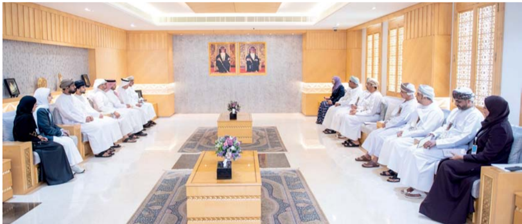
الجانبان استعرضا المبادرات البحثية والبرامج الأكاديمية

وخلال اللقاء تطرقت معالي الدكتور رئيس جامعة الخليج إلى أنشطة الجامعة ومشاريعها الاستراتيجية واستعرض الجانبان أبرز المبادرات البحثية والبرامج الأكاديمية التي تسهم في دعم مسارات التنمية المستدامة وتعزيز جودة التعليم العالي في المنطقة، بالإضافة إلى التعريف ببرامج كليات