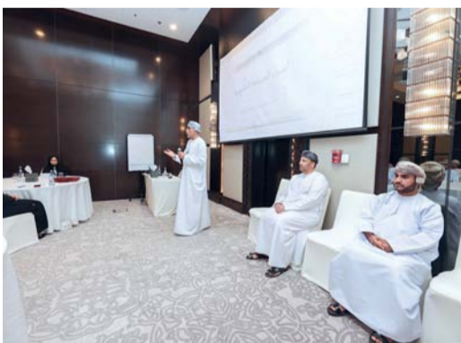
تنمية المهارات في صياغة التشريعات والعقود والاتفاقيات

ويتناول البرنامج الذي يشارك فيه عدد من شغلي الوظائف القانونية في وحدات الجهاز الإداري للدولة.. وغيرها من الأشخاص الاعتبارية العامة. محاور متنوعة خلال أيام التدريب يقدمها عدد من المستشارين والقضاة والمحامين والمختصين من القطاعين العام والخاص، حيث