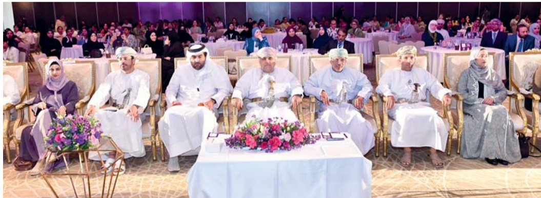
المؤتمر يهدف إلى تقديم أحدث ما توصل إليه العلم في مجال علاجات الأورام

التأكيد على الدور المتقدم لكل من العلاج المناعي والعلاج الموجه في تحسين نتائج علاج أورام الرئة والثدي، إلى جانب عدد من الأورام ويسعى الحفل لتقديم عرض على الفحوصات الجينية المتقدمة (NGS) في تحديد الإنذار المرضي واختيار العلاج الأنسب لكل حالة. وأوصى المؤتمر على أهمية الاستمرار في دعم البحث العلمي وتعزيز أوجه التعاون الدولي، بما يسهم في تحسين جودة الرعاية الصحية ورفع معدلات الشفاء لدى مرضى الأورام.