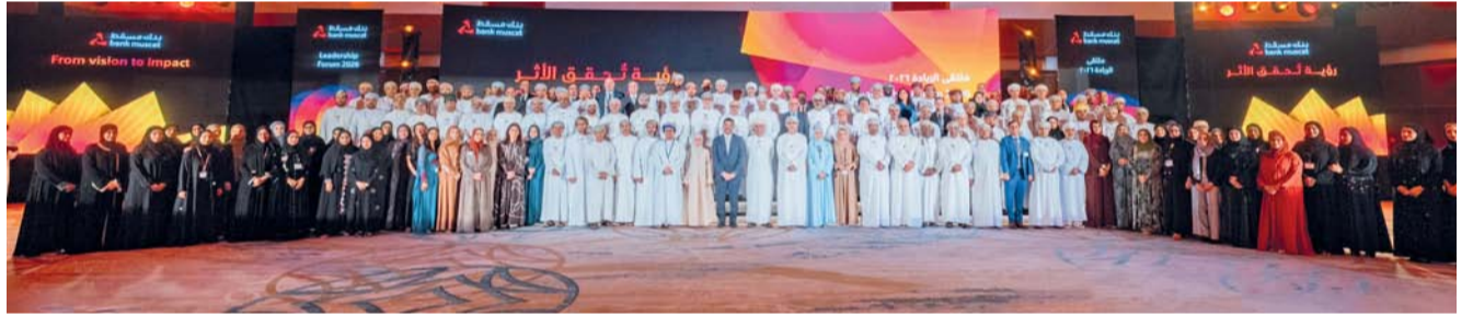
صورة جماعية للمشاركين في ملتقى الريادة السنوي