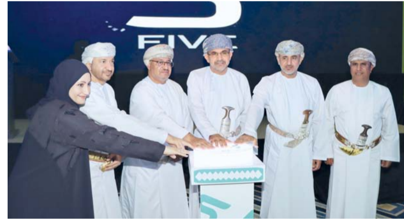
لحظة تدشين الهوية البصرية لأسبوع سلامة الغذاء

افتتاح المعرض المصاحب لأسبوع سلامة الغذاء، الذي ضم عدداً من الأركان التوعوية والمبادرات والبرامج التوعوية، إلى جانب مشاركة عدد من الشركات المنتجة للمنتجات الغذائية. جدير بالذكر أن أسبوع سلامة الغذاء سينظم حلقات عمل تخصصية، ومسابقات توعوية، وزيارات ميدانية للمنشآت الغذائية، إلى جانب برامج توعوية تستهدف المدارس والجامعات، بما يعزز تكامل الجهود الوطنية في مجال سلامة الغذاء.