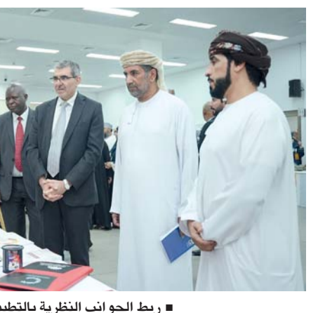
■ ربط الجوانب النظرية بالتطبيق العملي

بدأت فعاليات الأسبوع الأكاديمي الخامس في جامعة البريمي تحت رعاية سعادة حميد بن جمعة الشامسي عضو مجلس الشورى، ممثل ولاية البريمي، بحضور عدد من الأكاديميين والإداريين والطلبة، إلى جانب مشاركة متميزة من ممثلي المؤسسات الحكومية والخاصة. تضمنت الفعالية كلمة تناولت أهمية هذا الحدث وبهدف تعزيز البيئة الأكاديمية، وتنمية مهارات الطلبة وربط الجوانب النظرية بالتطبيق العملي وأستعرض فيها أهداف الأسبوع الأكاديمي ودوره في دعم