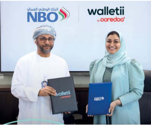
المذكرة تشمل تطوير منظومة المحافظ الرقمية