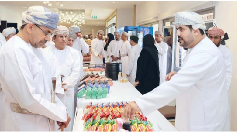
المعرض المصاحب يبرز جهود الشركات المشاركة