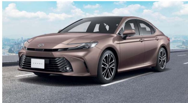
كامري توفر تجربة قيادة فائقة

السيارة ميزات مثل نظام ما قبل الاصطدام، ونظام تثبيت السرعة التكيفي بالرادار، ونظام التنبيه عند البقاء في المسار، كما تتضمن كامري أيضاً شاشة عرض بانورامية ونظام المساعدة على الخروج الآمن للمساعدة في منع الحوادث قبل وقوعها. يضمن هذا المزيج من التكنولوجيا المتطورة وميزات الحماية أن تتمكن العائلات من السفر بيقظة تامة. ومع استمرار الحملة حتى ٨ أبريل الجاري، يُعد الآن الوقت الأمثل لزيارة صالة عرض