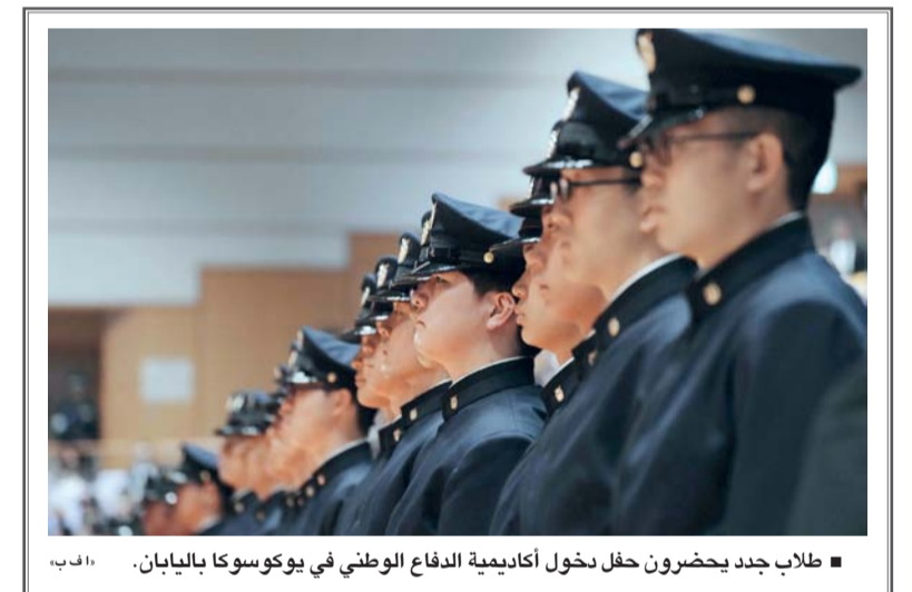
■ طلاب جدد يحضرون حفل دخول أكاديمية الدفاع الوطني في يوكوسوكا باليابان.

تبدأ حياته بعد. ولم تقتصر أساليب القتل على الصواريخ فحسب، بل جاء تحالف الحصار والجوع والبرد ليخطف أرواح الأطفال؛ إذ توفي 157 طفلا بسبب الجوع، بينما قضى 25 آخرون نتيجة الصقيع في خيام النازحين، فيما لا تزال حكايات نحو 9,500 مفقود تحت الأنقاض مرسومة على الخراب، غالبية من الأطفال والنساء ابتلعهم الركام، دون شاهد أو قبر.