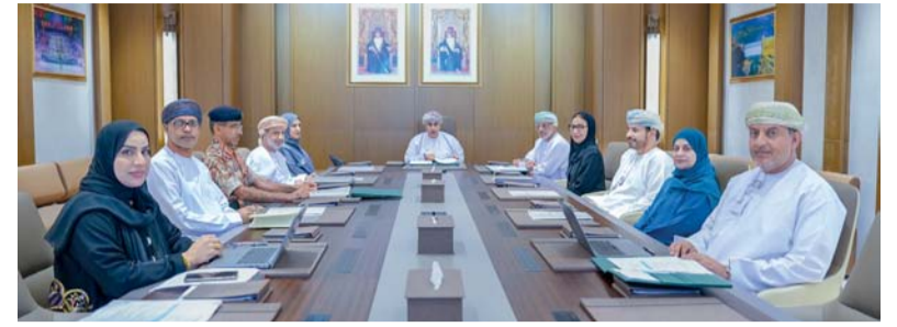
■ اجتماع لجنة إدارة وتنظيم الرعاية الصحية

يستضيف مجلس الشورى يومي الأربعاء والخميس القادمين، معالي المهندس سعيد بن حمود المعولي وزير النقل والاتصالات وتقنية المعلومات، الذي سيلقي بيان الوزارة أمام أعضاء مجلس الشورى خلال جلسات المجلس الاعتيادية الرابعة عشرة والخامسة عشرة لدور الانعقاد العادي الثالث (٢٠٢٥ - ٢٠٢٦) من الفترة العاشرة (٢٠٢٣ - ٢٠٢٧م)، والذي سيتضمن جملة من المحاور المرتبطة بأداء الوزارة وخططها الاستراتيجية المستقبلية.