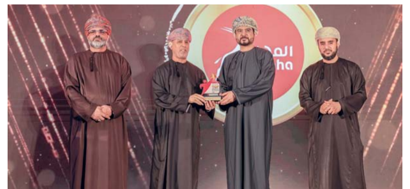
التكريم دافع لمواصلة الشركة التميز والابتكار

وقد أصبح امتلاك كامري الآن أكثر فائدة من أي وقت مضى، حيث تغطي كل عملية شراء باقة خدمة شاملة لمدة ٥ سنوات أو ٥٠ ألف كيلومتر لضمان راحة البال التامة لسنوات قادمة. بالإضافة المزيد من القيمة، يحصل العملاء أيضاً على تأمين مجاني لمدة سنة واحدة، وتسجيل مجاني لمدة سنة واحدة، و٥٠ ريالاً عمانياً من نقاط ثقة من برنامج «ولا».