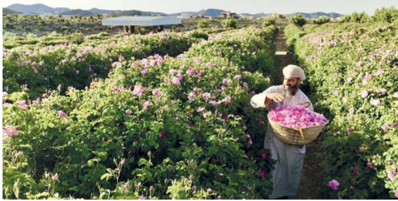
المشروع يقدم حزمة من أوجه الدعم المتكاملة للمزارعين

الزراعية وتوفير الشتلات مجاناً لزراعة أشجار الورد، بما يسهم في تعزيز الإنتاج وتحسين جودة المحاصيل. ووضحت أن الدعم يمتد ليشمل تمكين المؤسسات الصغيرة والمتوسطة المهتمة بتصنيع وتسويق منتجات الورد من خلال توفير آلات استخلاص زيت ودهن الورد، بما يعزز القيمة المضافة للمنتج المحلي ويدعم استدامته.