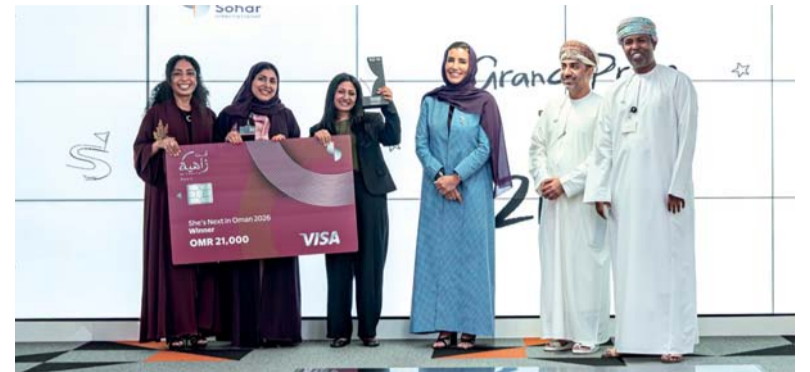
تمكين رائدات الأعمال استثمار استراتيجي في مستقبل الاقتصاد الوطني

ويهدف المشروع إلى دعم زراعة مساحة (٥) أفدنة إضافية من الورد المحلي بالجبل الأخضر وإدخال الميكينة الزراعية وتحسين بعض المعاملات الزراعية بنسبة ٥٠ بالمائة وتنفيذ دورات مرتبطة بتصنيع منتجات ماء الورد للمرأة