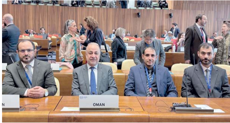
وفد سلطنة عُمان في أعمال الدورة بجنيف

وجاءت مشاركة سلطنة عُمان، ممثلة في وزارة العمل ووفد سلطنة عُمان الدائم لدى الأمم المتحدة والمنظمات الدولية في جنيف، في إطار دورها (كعضو أصيل) في مجلس الإدارة، وما يتجسد ذلك من الإسهام المباشر في مناقشة واعتماد سياسات وبرامج