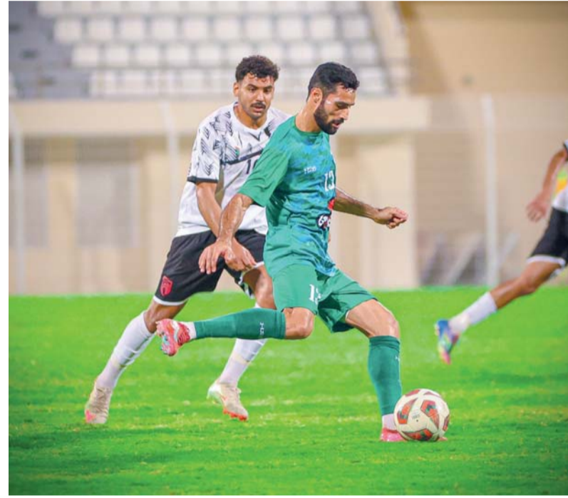
■ من منافسات دوري جندال

تجته أنظار جماهير كرة القدم العمانية مساء اليوم إلى مواجهتين مهمتين ضمن منافسات دوري جندال للموسم 2025-2026، حيث تتباين الأهداف والطموحات بين فرق تنافس على اللقب وأخرى تسعى للهروب من مناطق الخطر، ما يضيف على الجولة طابعاً تنافسياً خاصاً. يدخل نادي السبب لقاء اليوم وهو متربع على صدارة جدول الترتيب برصيد 45 نقطة، بعدما قدم مستويات لافتة هذا الموسم جعلته المرشح الأبرز لنيل اللقب. ويطمح الفريق إلى مواصلة سلسلة نتائجه الإيجابية وتعزيز الفارق مع أقرب ملاحقيه، مستفيداً من الاستقرار الفني والفعالية الهجومية التي ميّزت أداءه في الجولات الماضية، خاصة وأن السبب خسر لقب الكأس الغالية وكأس جيتور ولم يبق له سوى الصراع على لقب الدوري بطبيعة الحال.