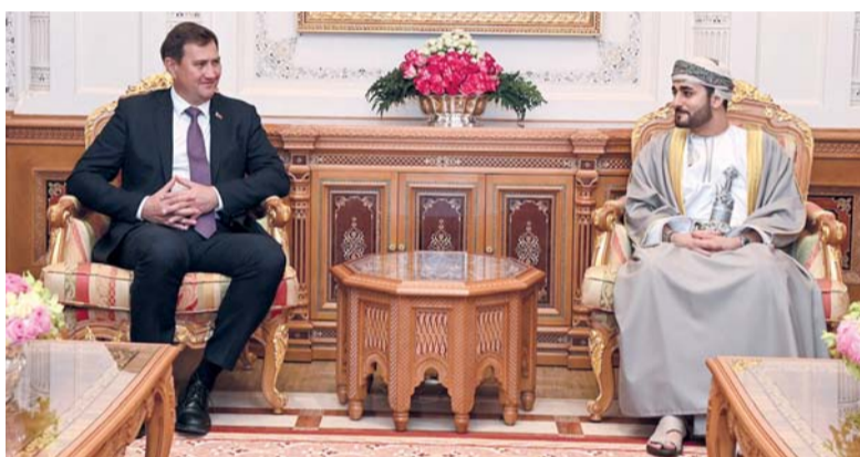
ذي يزن يستقبل ماكسيم ريزنيكوف

وأكد معالي الدكتور محمد بن سعيد العمري، وزير الأوقاف والشؤون الدينية الذي رعى افتتاح أعمال المؤتمر في كلمته على أهمية هذا المؤتمر بوصفه منصة علمية تجمع الباحثين لمناقشة أحد أرق مجالات البحث المرتبطة بالنص القرآني، وهو ترجمة معانيه، مشيراً إلى أن هذا المجال يتطلب فهماً عميقاً للنص ومقاصده، وإدراكاً للفروق اللغوية والثقافية بين الشعوب. ووضح معاليه أن المؤتمر يأتي في إطار الجهود المشتركة لتعزيز البحث العلمي وخدمة القرآن الكريم، وبناء جسور معرفية بين الثقافات، مؤكداً على أن ترجمة معاني القرآن ليست مجرد نقل لغوي، بل هي جهد علمي يتطلب دقة وأمانة علمية عالية، خصوصاً في ظل ما يتميز به النص القرآني من عمق دلالي وبلغائي.