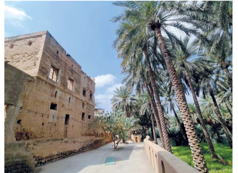
ولاية وادي المعاول تشتهر بالعديد من المعالم التراثية والسياحية