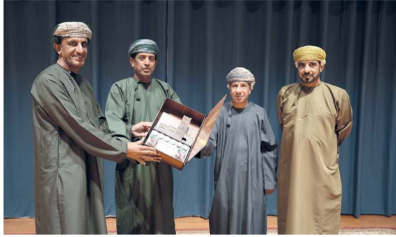
تكريم المشاركين والمساهمين في العمل

كُفِّي بِكَافِ فَمِنْهُ قَلْبِي بَاكٍ أَسَامِنُ نُبُوبَ النَّائِبَاتِ فِدَاكِ فَلِي الشُّعْمُ إِذَا نَعِمْتَ وَإِنْ لِي ضِعْفُ الشُّقَاءِ إِذَا شَهِدْتَ شِقَاكِ لَا تَهْلِكُنِي حَزْنًا فَأَهْلِكَ تَابِعًا فَعَلَى هَلَاكِكَ قَدِ عَقَدْتُ هَلَاكِي إِنْ كَانَ دُعَى الْقَلْبِ يَكْرِي لِلنُّوَى مِنْ دُونَ تَعْرِيفِ ، فَكَيْفَ نَوَاكِ ؟ إِنْ قَالَا لَا أَهْوَاكَ مُدْعِيًا ، فَمِي عَيْنَايَ قَالَتْ : إِنِّي أَهْوَاكَ إِنِّي لِأَزْغِبُ أَنْ تَرِي بِنَوَاطِرِي كَيْ تَعْلَمِي كَيْفَ الْمَحَبِّ بِرَاكِ لَوْ كَانَ ذَلِكَ مَا عَجِبْتُ مِنَ الْهُوَى وَلَمَّا تَفَوُّهُ بِأَمْلَاةِ فَكِ أَصْفَاكَ رَبِّكَ بِالْجَمَالِ وَإِنَّهُ بِجَمِيعِ مَا جَلَبَ الْهُوَى أَصْفَاكَ شَيْئًا - سَوَى حُسْنِ بَوَاجِهِكَ - آخِرُ مَنْ قَلْبِي الْخُزُونُ قَدْ أَنْتَاكَ هُوَ أَنِّي مَا عَدْتُ عَنْكَ وَبِي أَسَى يَوْمًا وَلَمْ أَشْكُ الْأَسَى لِسَوَاكَ كَمْ كُرْبَةً أَصْبَحْتُ حِينَ شَكُوهُنَا مُتَهَلِّلِ الْقَسَمَاتِ ، نَسْتُ بِشَاكِ وَمَسَّحَتْ بِالْحَلَمَاتِ عَنْ قَلْبِي فُلُو تَمَحَّوْ مُوَعِي فِي الْخُنُودِ بِدَاكِ لَوْ تَجَعَلَيْنَهُمَا هُنَاكَ لَمَّ لَوْ تُهْدِي جِبِينِي قَبْلَةَ شَفَاكِ فَأَخْطِي إِلَيَّ الْآنَ خُطْوَةَ عَاشِقِ وَجُفَوْنَ عَيْنِي مَوْطِي لَخْطَاكَ