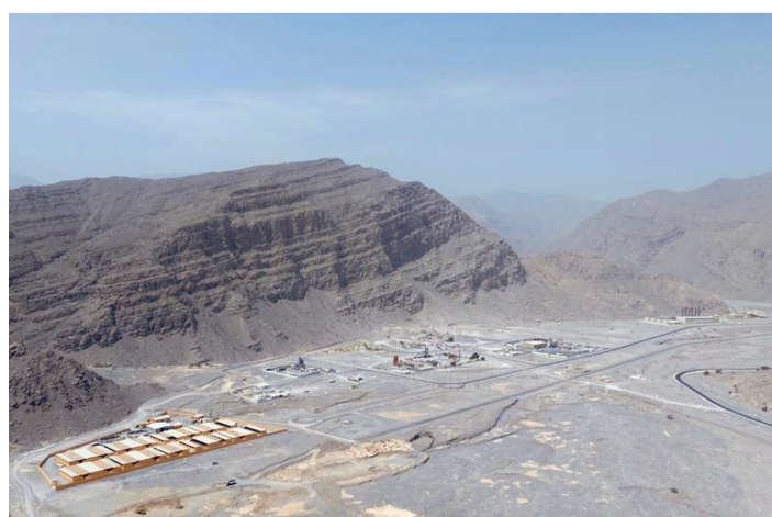
المدينة تنجح في توطين عدد من المشروعات الاستثمارية

مسقط - العُمانية: سجّل الميزان التجاري لسلطنة عُمان فائضاً بـ ٢٥٦ مليون ريال عُمان حتى نهاية شهر يناير ٢٠٢٦ مقارنة بفائض بلغ ٥٢٨ مليون ريال عُمان خلال الفترة نفسها من عام ٢٠٢٥، وفق ما بينت الإحصاءات المبدئية الصادرة عن المركز الوطني للإحصاء والمعلومات. وأظهرت الإحصاءات أن إجمالي قيمة الصادرات السلعية سجّلت ملياراً و٨٣١ مليون ريال عُمان بنهاية شهر يناير ٢٠٢٦، مسجلاً انخفاضاً بنسبة ٦,١ بالمائة مقارنة بالفترة نفسها من العام السابق.