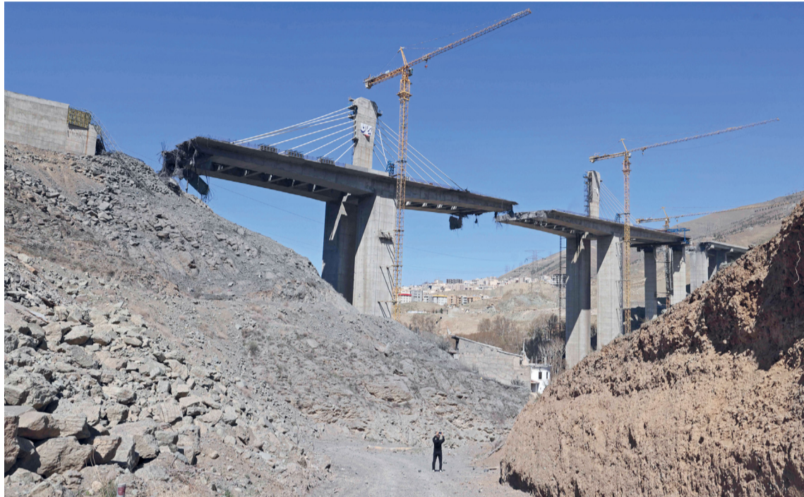
رجل يلتقط صورةً بهاتفه لجسر B1، بعد يوم من تدميره في غارة جوية في كرج، على بُعد حوالي ٣٥ كيلومتراً جنوب غرب طهران. وكان الرئيس الأميركي دونالد ترامب قد صرح بأن أطول جسر في إيران قد دُمّر.

طهران - عواصم، وكالات: تتواصل الحرب التي تشهدها الولايات المتحدة وإسرائيل، على إيران، حيث شهدت العاصمة طهران انفجارات دوت في شمال وشرق المدينة؛ وسط تحليق مكثف لمقاتلات مع استهداف البنية الأساسية والمشاريع الكبرى. وأفادت وكالة «فارس» للأنباء بأن قصفاً استهدف منطقة ماهشهر للبتروكيمياويات بالأهواز، مشيرةً إلى تصاعد أعمدة الدخان، فيما تم إرسال فرق الإنقاذ والإطفاء للمنطقة. ورجّح مسؤول إيراني لوكالة «فارس» سقوط قتلى في استهداف ماهشهر. وقد استهدف القصف على مجمع ماهشهر ٤ شركات للبتروكيمياويات، وأفادت مؤسسة البتروكيمياويات في ماهشهر بإخلاء وحدات صناعية ولا خطر من تلوث بيئي بالمنطقة. وأشار مسؤول إيراني كذلك إلى استهداف شركة بندر الإمام للبتروكيمياويات في خور موسى، كما ذكرت وكالة «تسنيم» أن مقذوفاً سقط قرب محطة بوشهر النووية، مشيرةً إلى مقتل شخص جراء الحادث. وفيما تحدثت إعلام إيراني عن دوي انفجارات وتحليق مقاتلات في طهران وبوشهر، أعلن الجيش الإسرائيلي استهداف مواقع دفاعية رئيسية ومواقع لإنتاج الأسلحة ومراكز للبحث والتطوير في طهران. ودوت انفجارات في «إسرائيل» أيضاً، حيث أفادت هيئة البث الإسرائيلية، بإطلاق إيران صواريخ باتجاه «إسرائيل»، ما أسفر عن سقوط شظايا في مناطق مختلفة، بينها شمال ووسط تل أبيب.