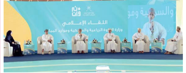
■ اللقاء أكد على ضمان سلامة وجودة الغذاء وفق الضوابط والتشريعات

■ «ترانزم» تطلق عملياتها في تنزانيا ضمن مسارها نحو التوسع الدولي