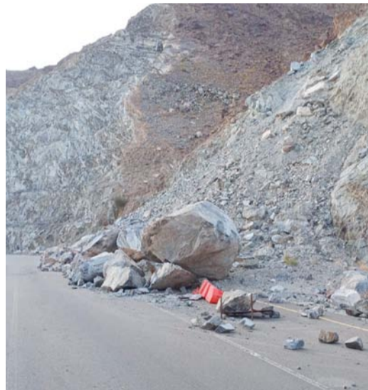
الانهيارات الجبلية تسبب حوادث وتعرقل المرور