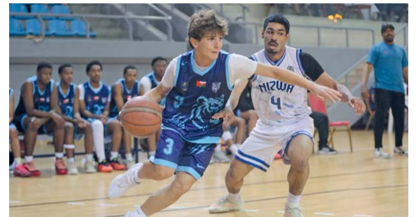
■ لقاء نزوى وصلالة

تختتم اليوم منافسات دوري الشباب لكرة السلة تحت 18 سنة للموسم الرياضي 2025-2026، بإقامة الجولة الأخيرة، حيث يلتقي نادي العمارات مع نادي نزوى عند الساعة الخامسة مساءً، فيما تجمع المباراة الختامية نادي السبب مع نادي صلالة في الساعة السابعة مساءً، على أن يتم عقباها تنويج أصحاب المراكز الثلاثة الأولى، بعدما وصل الدوري لمرحلة الحسم النهائية، في ظل تنافس قوي بين الأندية الأربعة المشاركة حيث سيقام حفل التتويج تحت رعاية السيد إدريس بن منصور بن ناصر البوسعيدي المدير العام للشؤون الإدارية