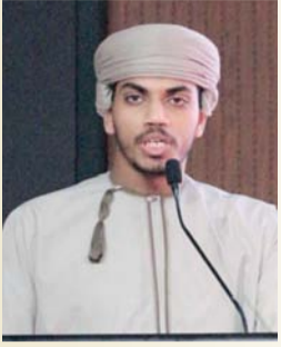
أنس بن خميس المكدمي شاعر عماني