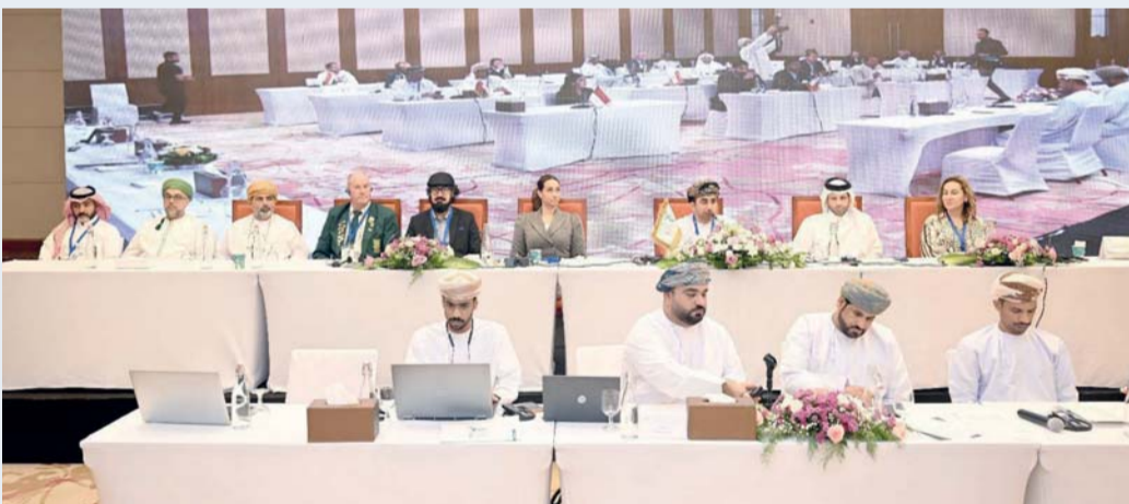
■ من اجتماع الجمعية العمومية للاتحاد الدولي لالتقاط الأوتاد