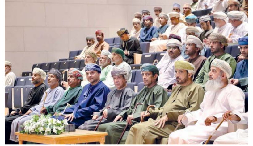
تدشين الفيلم الوثائقي «الملك»

المبادرات الشبابية التطوعية، ودور بعض الجهات في استزراعها ودراساتها علمياً، مع طرح رؤية مستقبلية قائمة على تكامل الجهود لحمايتها، وأشار إلى أن الفيلم يهدف إلى تعزيز الوعي بأهمية شجرة «الملك» كجزء أصيل من الموروث الطبيعي لولاية منح، وتشجيع الاهتمام المجتمعي والعلمي بها، وتوثيق العلاقة بين الإنسان والأرض من خلال نموذج محلي يعكس الهوية العمانية. وفي ختام الحفل، قام سعادة محمد بن سعيد البلوشي وكيل وزارة الإعلام بتكريم المشاركين والمساهمين في إنجاز هذا العمل.