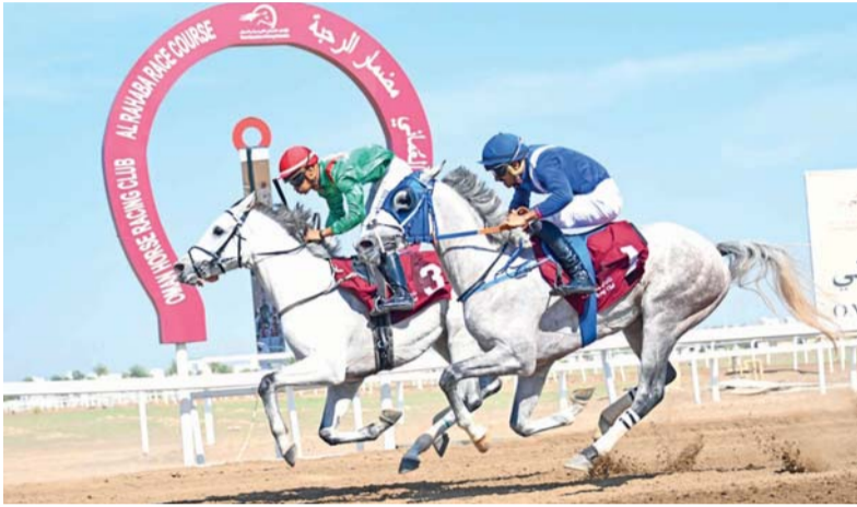
■ أحد أشواط السباق