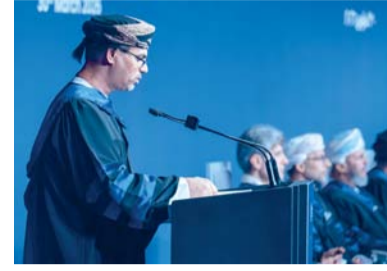
محمد البادي يلقي كلمته

شهد الحفل تخريج ٤٧٩ خريجاً وخريجة من تخصصات متنوعة، شملت برامج الماجستير في القيادة التربوية، وتكنولوجيا التعليم، وإدارة الأعمال، بالإضافة إلى بكالوريوس ودبلوم إدارة الأعمال، وتقنية المعلومات والحوسبة، والقانون وبرامج الدبلوم، والبكالوريوس، والماجستير بنظامي التعليم المفتوح والمنظم. تضمن برنامج بتقديم فيلم وثائقي سلط الضوء على التطور النوعي للجامعة ودورها المحوري كمنارة أكاديمية تخدم المجتمع العماني وترقد التنمية الشاملة في المنطقة. واعرب الأستاذ الدكتور محمد بن حمدان البادي رئيس الجامعة في سلطنة عمان عن اعترازه بالخريجين، مؤكداً أن هذا اليوم يعقل ثمره لسنوات من الجد والمثابرة. وأشار البادي إلى أن الجامعة تضي بخلى واثقة نحو تعزيز جودة التعليم بما يتماشى مع «رؤية عمان ٢٠٤٠»، كاشفاً عن تدشين برامج أكاديمية جديدة هذا العام، منها دبلوم التأهيل التربوي وماجستير إدارة الأعمال باللغة العربية في القيادة وإدارة الجودة، استجابة لمتطلبات سوق العمل المتجددة. «وفي كلمة مصورة بثت خلال الحفل، هنأ صاحب السمو الملكي الأمير عبدالعزیز بن طلال بن عبدالعزیز آل سعود الخريجين، متمنياً مثابرتهم في مواجهة التحديات الدراسية. كما