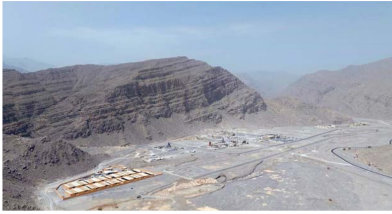
■ المدينة تنجح في توطين عدد من المشروعات الاستثمارية

موقعها الجغرافي الفريد والمطل على مضيق هرمز بعداً اقتصادياً مهماً في دعم وتأسيس وقيام العديد من المشروعات الاقتصادية ومنها المشروعات الصناعية واللوجستيات والمشروعات السياحية، وتهدف «مدائن» من خلال إنشاء مدينة محاس الصناعية إلى التوسع في إنشاء المدن الصناعية وترسيخ مكانة سلطنة عُمان كمركز تنافسي للاستثمارات الإقليمية والدولية ودفع النمو الصناعي المستدام وتعزيز المنتجات الوطنية وإيجاد فرص عمل جديدة مما يسهم في تنمية اقتصادية شاملة ومستدامة.