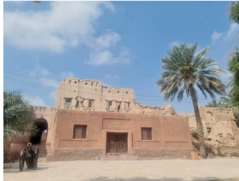
ترميم الحارات القديمة يعد ركيزة أساسية للحفاظ على الهوية الوطنية والذاكرة التاريخية