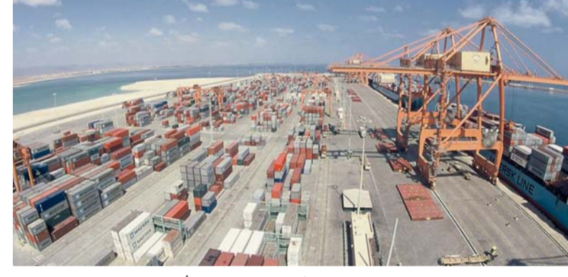
إجمالي قيمة الصادرات السلعية تسجل ملياراً و٨٣١ مليون ريال عماني بنهاية يناير ٢٠٢٦ م