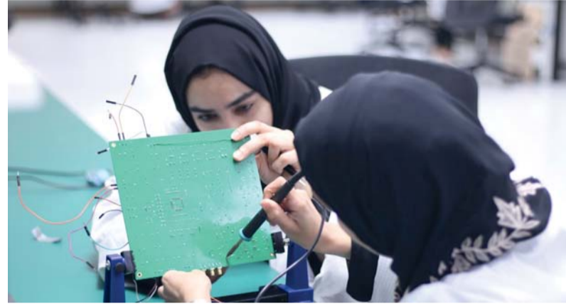
تدريب أكثر من ٩٠ مهندساً عمانياً في تصميم الرقائق الإلكترونية

سُرع جهاز الاستثمار العماني استثماراته المحلية في مجال أشباه الموصلات الذي يعد أحد الأعمدة الأساسية للاقتصاد الرقمي، وركيزة محورية في تطبيقات الاتصالات المتقدمة، والطاقة، والنكاه الاصطناعي، والتحول الرقمي، وذلك عبر ثلاثة استثمارات قامت بها مجموعة إنكباء الذراع الاستثمارية للجهاز في قطاع تقنية المعلومات والاتصالات استقطبت من خلالها ثلاث شركات عالمية بنهاية ٢٠٢٥ م لتأسيس مراكز ومكاتب لها في سلطنة عمان. وذلك تجسيدا لتوجهه نحو الاستثمارات التي تخدم القطاعات الاقتصادية ذات الأولوية ضمن الخطة الخمسية الحادية عشرة، وتعزيزاً لتحقيق مستهدفات التنوع الاقتصادي وفقاً لأولويات رؤية عمان ٢٠٤٠، وترسيخاً لحيوية سلطنة عُمان في الصناعات التقنية بما يُمكن من توطين جزء من سلاسل القيمة. ويأتي تنامي هذه الاستثمارات انسجاماً مع فلسفة «البعيد العماني» التي ينتهجها الجهاز في استثماراته