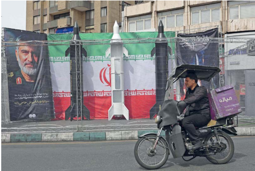
■ إيراني يمر بجوار نماذج هيكلية لصواريخ إيرانية منصوبة على جانب الطريق في ساحة ولي عصر بطهران.

القُدس المحتلة - وكالات: حذر رئيس أركان الجيش الإسرائيلي إيل زامير من أن قواته «ستكثف عملياتها البرية المحددة» في لبنان وتنتهي له أسبوع من القتال» بعد تنفيذ بيروت «انتهاك صارخ» للسيادة على خلفية استهداف إسرائيل بني أساسية في لبنان. وياشر الجيش الإسرائيلي تنفيذ أوامر قيادته بتدمير الجسور على نهر الليطاني بزرعة استخدامهما من قبل حزب الله، وقد أفادت «الوكالة الوطنية للإعلام» الرسمية اللبنانية بتعرض مناطق عدة في الجنوب لغارات. وأفاد مراسل وكالة فرانس برس بأن جسر القاسمية الواقع على نهر الليطاني إلى الشمال من مدينة صور، تعرض لغارة أدت إلى تدميره بشكل جزئي وتصاعد أعمدة كثيفة من الدخان. وأوردت الوكالة الوطنية للإعلام اللبنانية في وقت لاحق وقوع غارة