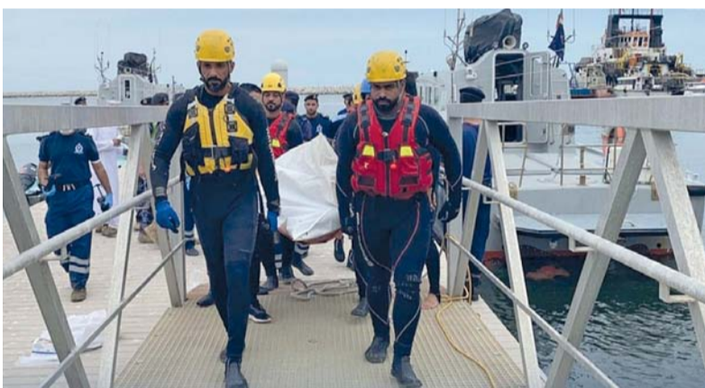
فرق الإنقاذ تعثر على المفقود الثالث مفارقاً للحياة في حادثة بركاء

وتهيب شرطة عمان السلطانية الجميع بضرورة اتباع الإرشادات المتبعة، نظراً لاستمرار الحالة الجوية وهطول الأمطار الغزيرة على عدد من محافظات السلطنة. كما يدعو الدفاع المدني