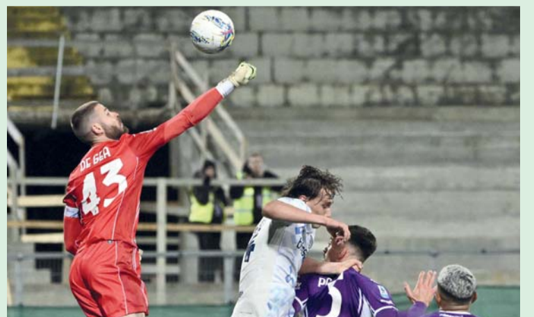
حارس مرمى فيورنتينا ديفيد دي خيا، يتصدى لتسديدة ميلان

وحصد كل فريق نقطة واحدة ليرفع إنتر ميلان رصيده في الصدارة إلى ٦٩ نقطة بفارق ست نقاط عن ميلان الوصيف وسبع نقاط عن نابولي صاحب المركز الثالث، مقابل ٢٩ نقطة لفيورنتينا في المركز السادس عشر. ونجح إنتر ميلان بعد ٤٠ ثانية فقط في افتتاح