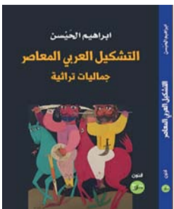
■ غلاف الكتاب

التراث وقدمته بصورة حية وبأسلوب حدائثي استند إلى (المعايشة الجمالية) والحوار المتجدد. فالتراث هنا لا يستعاد بوصفه زخرفة جامدة، بل بوصفه منهجاً في الرؤية، وفعل ذاكرة حية تحول الماضي من حنين متحفي إلى طاقة خلّاقة. هذا السعي كان محاولة جادة للتحرك من الأساليب الاستشراقية وتأسيس فلسفة تشكيلية تستمد مشروعيتها من الذات الثقافية ومن الواقع المعيش. يمضي الكتاب في تحليل هذه العلاقة عبر مسارات متداخلة، تبدأ ببحث الجدلية التفاضلية بين الفن والتراث وسعي الحركات التشكيلية لإثبات الذات إبان وبعد فترة الاستعمار. ويتوسع الحيسن في دراسة الجماعات الفنية الكبرى (كجماعة بغداد ومدرسة تونس والدار البيضاء) التي جعلت من العودة للجزور مشروعاً فكرياً متكاملاً، مع التركيز على (الحروفية) التي حولت الحرف العربي إلى مفردة تشكيلية وقيمة جمالية مجردة تتجاوز دلالاته اللغوية. ■