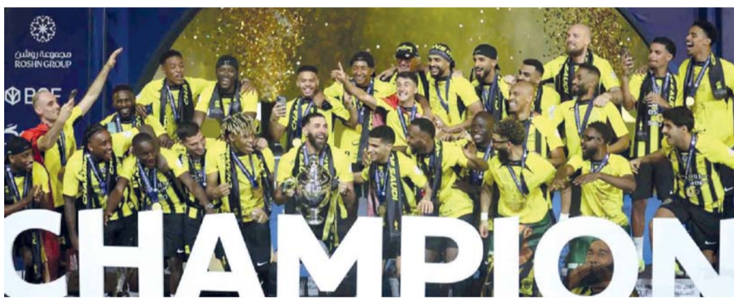
■ فريق الاتحاد

للرياض. د.ب.أ.: دشّن المنتخب السعودي لكرة القدم، مساء امس الاول، تدريباته ضمن معسكره الإعدادي في جدة، والمقام في إطار المرحلة الثالثة من برنامج الإعداد لبطولة كأس العالم ٢٠٢٦ بالولايات المتحدة الأمريكية وكندا والمكسيك. وسيقام المعسكر في محافظة جدة وجمهورية صربيا خلال الفترة من ٢٢ إلى ٣١ مارس الجاري، حيث يستضيف المنتخب (الأخضر) نظيره المصري ودياً يوم الجمعة القادم، فيما سيحل ضيفاً على منتخب صربيا بعدها بأربعة أيام.