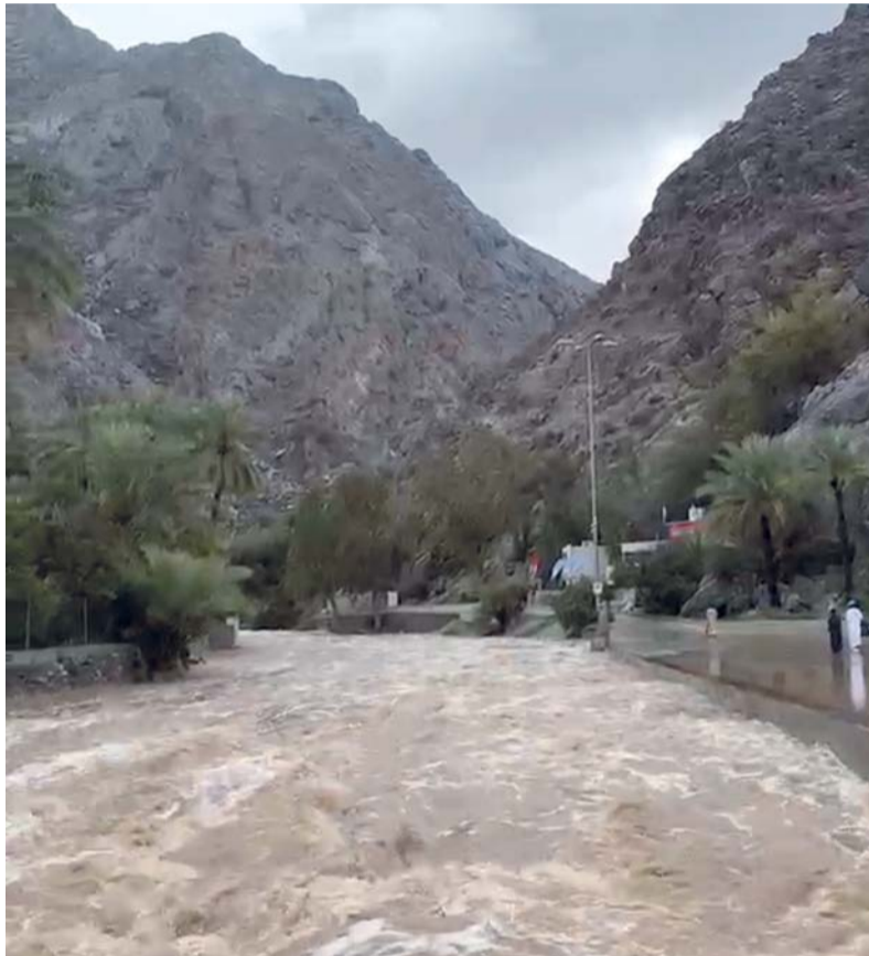
جريان الأودية في وادي المعاول

وأدت الأمطار إلى جريان عدد من الأودية والشعاب، من أبرزها وادي الميح. جعلها الله أمطار خير وبركة وعم بنفعها البلاد والعباد.