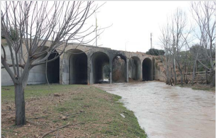
■ صورة تظهر أثر الغارة الجوية الإسرائيلية التي استهدفت جسر القاسمية، الواقع على طريق سريع رئيسي يربط قرى في قضاء صور بقرى أخرى شمالا بلبنان.

العربية المتحدة أن دفاعاتها تصدت «لاعتداءات صاروخية وطائرات مسيرة قادمة من إيران» موضحة أن الأصوات التي سمعت «في مناطق متفرقة من الدولة هي نتيجة اعتراض كل من منظومات الدفاع الجوي للصواريخ الباليستية، والمقاتلات للطائرات المسيّرة والجوالة». وأطلقت البحرين بدورها «صافرة الإنذار» طالبة من «المواطنين والمقيمين الهدوء والتوجه لأقرب مكان آمن». بحسب ما أفادت وزارة الداخلية البحرينية على وسائل التواصل الاجتماعي.