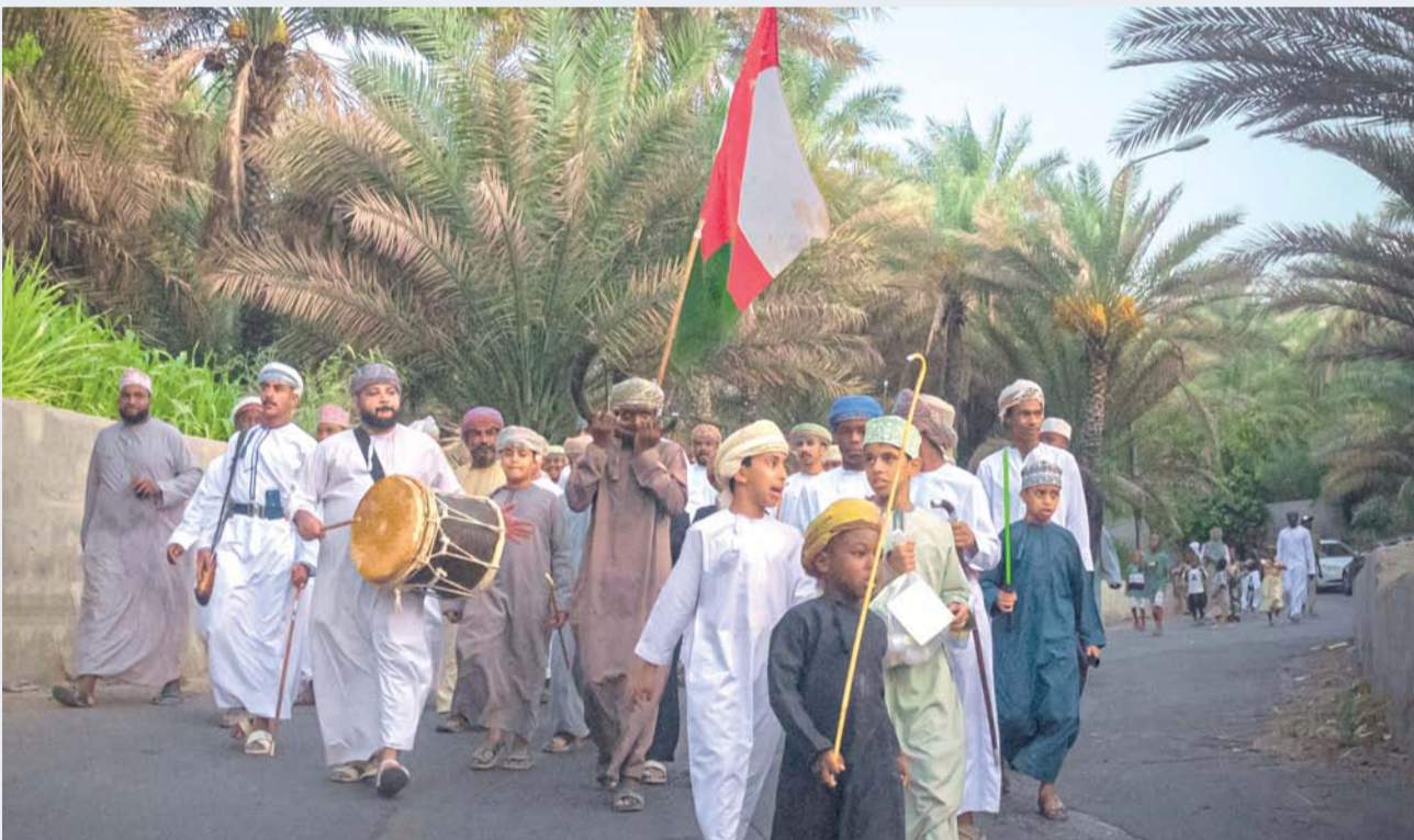
■ ... وتوثق حياة الناس وعاداتهم وتقاليدهم