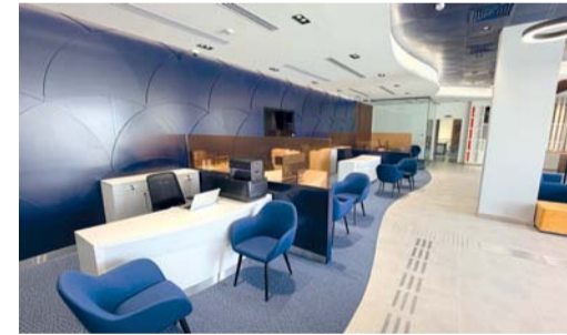
الفرع الجديد يقدم خدمات مصرفية متطورة

بإشراف صغار الإسلامي، النافذة المصرفية الإسلامية لصغار الدولي، عملياته في موقع فرعه الجديد بمحافظة البريمي، حيث يقع الفرع في شارع وسط المدينة. ويهدف تعزيز حضوره في المحافظة، وتسهيل وصول الزبائن إلى خدماته، يأتي هذا الفرع في إطار مساعي البنك المستمرة لتطوير شبكة فروعها بما يواكب تطلعات زبائنه، والحفاظ على علاقاته الوثيقة مع المجتمعات التي يخدمها. وبافتتاح هذا الفرع، ارتفع عدد فروع صغار الإسلامي إلى ٢١ فرعاً، بالإضافة إلى مركز خدمة في مختلف أنحاء سلطنة عمان، وذلك بعد افتتاح فرع بوشر وإطلاق مركز خدمة في بديعة خلال عام ٢٠٢٥، والافتتاح الأخير لفرعه في جعلان بني بو حسن. وقال فهد بن أكبر الزبجالي، رئيس صغار الإسلامي: يعكس انتقال فرعنا في البريمي التزامنا المستمر بتعزيز وصول الزبائن إلى الحلول المالية المتوافقة مع أحكام الشريعة الإسلامية، مع الحفاظ على قربنا من المجتمعات التي