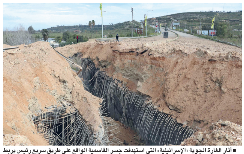
أثار الغارة الجوية «الإسرائيلية» التي استهدفت جسر القاسمية الواقع على طريق سريع رئيس يربط قرى في قضاء صور بقرى أخرى شمالاً.

بيروت . وكالات: شرعت «إسرائيل» في ما يبدو أنه فصل لشمال نهر الليطاني عن جنوبه في إطار حربها على لبنان والتي تواصل فيها استهداف البنية الأساسية، حيث أعلن وزير الحرب «الإسرائيلي» إسرائيل كاتس أنه أمر الجيش بتدمير كافة الجسور على نهر الليطاني، والتي تربط الجنوب بطريق العاصمة بيروت أو حتى البقاع الغربي شرق لبنان. واستهدفت الغارات «الإسرائيلية» جسر القعقية، أحد الجسور الخمسة الرئيسية التي تربط ضفتي نهر الليطاني.