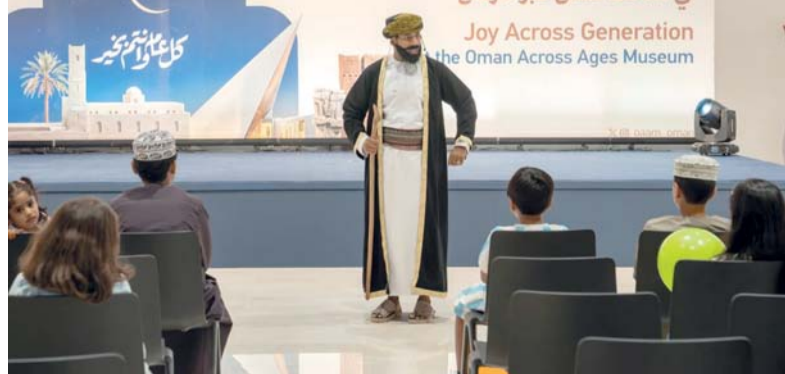
■ البرنامج تضمن باقة متنوعة من الفعاليات والأنشطة