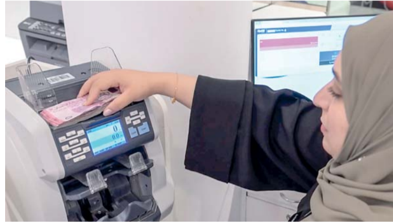
قبول الطلاب التي تبلغ قيمتها مليون ريال عماني أو أكثر المقدمة من أصحاب العطاءات

والملومات ارتفاع مؤشر الرقم القياسي لأسعار العقارات في سلطنة عمان بنسبة ١٣,٩ بالمائة في الربع الرابع من عام ٢٠٢٥م مقارنة بالفترة ذاتها من عام ٢٠٢٤م. وسجل مؤشر الرقم القياسي لأسعار العقارات التجارية نمواً بنسبة ١٢,٣ بالمائة، مدفوعاً بارتفاع أسعار الأراضي التجارية بنسبة ١٨,٨ بالمائة، في حين تراجعت أسعار المحلات التجارية بنسبة ١٢,١ بالمائة، كما انخفضت أسعار الأراضي الصناعية بنسبة ٢,٩ بالمائة. أما مؤشر أسعار العقارات السكنية فقد حقق نمواً ملحوظاً بنسبة ١٤,٦ بالمائة في الربع الرابع من عام ٢٠٢٥م مقارنة بالربع المماثل من عام ٢٠٢٤م، ويعزى ذلك إلى ارتفاع أسعار الأراضي السكنية بنسبة ١٤,٦ بالمائة، وزيادة طفيفة في أسعار الشقق السكنية بنسبة ٠,٦ بالمائة، إلى جانب نمو أسعار الفلل بنسبة ٢٠,٦ بالمائة، وارتفاع أسعار المنازل الأخرى بنسبة ٢٥,٨ بالمائة. ■