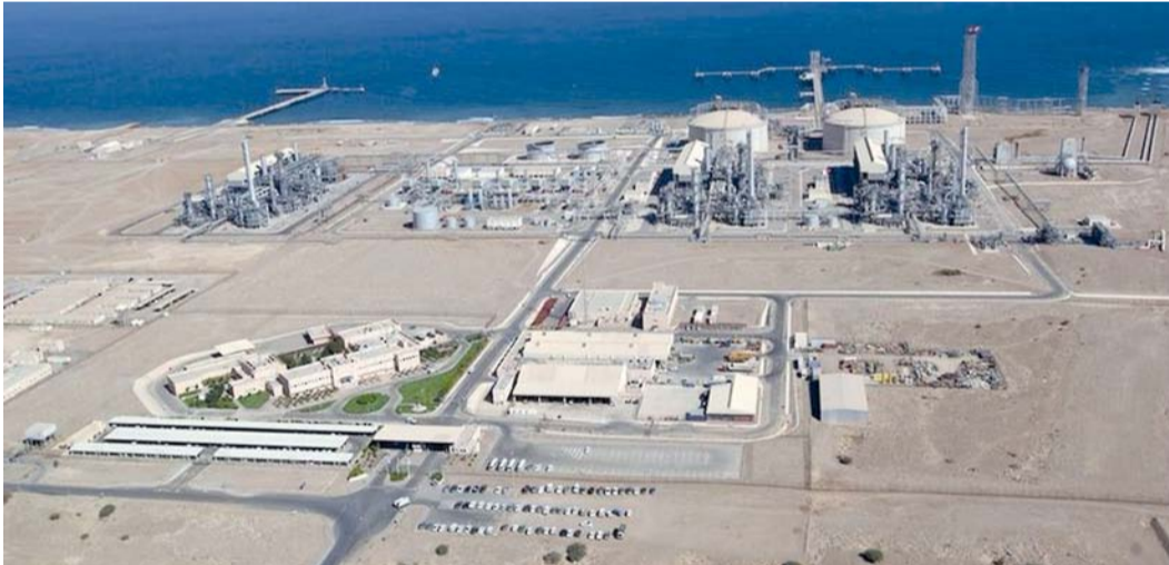
■ الأنشطة النفطية حققت خلال الربع الرابع من عام ٢٠٢٥ نمواً بنسبة ٣,٤ بالمائة

قطاع الزراعة وصيد الأسماك انخفض بنسبة ١,٤ بالمائة ليبلغ ٢٦٣ مليوناً و٢٠٠ ألف ريال عماني، مقارنة بـ ٢٦٧ مليون ريال عماني في الربع الرابع من عام ٢٠٢٤م. كما سجلت الأنشطة الصناعية ارتفاعاً بنسبة ١,٨ بالمائة لتصل إلى مليارين و٢٣٠ مليوناً و٦٠٠ ألف ريال عماني، مقابل مليارين و١٩١ مليون ريال عماني في الفترة نفسها من العام السابق. في حين ارتفعت الأنشطة الخدمية بنسبة ٢,٤ بالمائة لتبلغ ٥ مليارات و١٣٣ مليوناً و٢٠٠ ألف ريال عماني، مقارنة بـ ٤ مليارات و١٢ مليوناً و٢٠٠ ألف ريال عماني في الربع الرابع من عام ٢٠٢٤م. ■