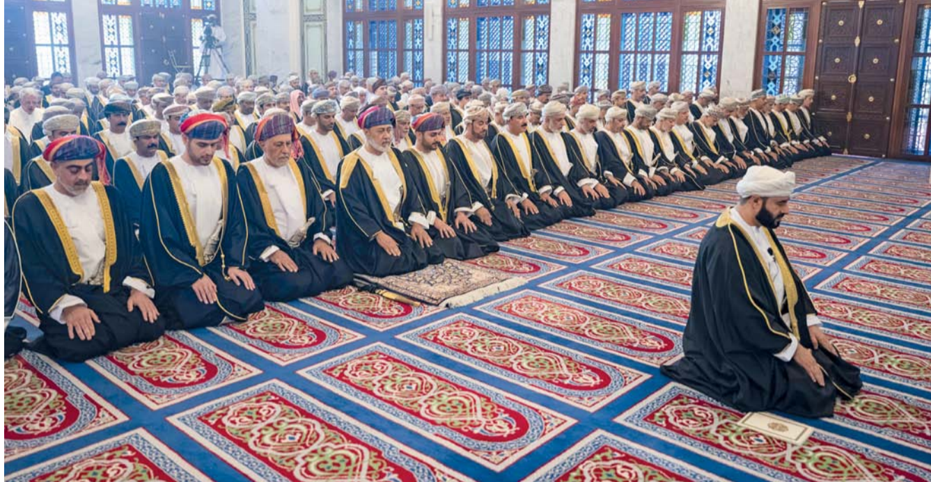
■ جلالة السلطان يؤدي صلاة عيد الفطر بمسجد الخور بمحافظة مسقط وبمعية جلالته عدد من أصحاب السمو أفراد الأسرة المالكة الكريمة، ورجال السادة، والسادة البوسعيد وعد من أصحاب المعالي والسعادة.

تفضل حضرة صاحب الجلالة السلطان هيثم بن طارق المعظم، حفظه الله ورعاه، فوجه التهنئة للمواطنين والمقيمين على أرض سلطنة عُمان الطيبة وللأمة الإسلامية بمناسبة عيد الفطر السعيد.