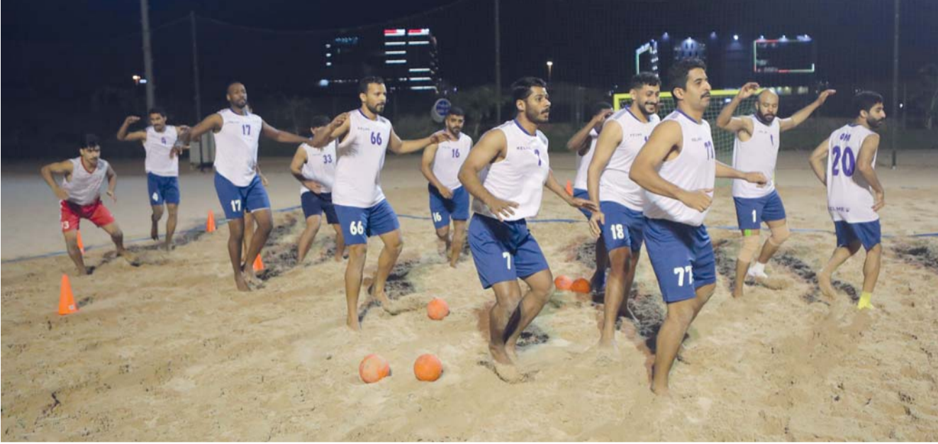
■ من تدريبات منتخبنا الوطني لكرة اليد الشاطئية

خارجي في تايلاند أو الصين خلال الفترة من ١٤ إلى ١٩ أبريل سيخوض عدداً من المباريات الودية بهدف رفع الجاهزية الفنية والبدنية وفي ٢٠ أبريل المقبل ستوجه البعثة إلى الصين حيث سيخوض المنتخب مباراة ودية فور وصوله للتأقلم مع أجواء البطولة قبل انطلاق المنافسات رسمياً في ٢٢ أبريل.