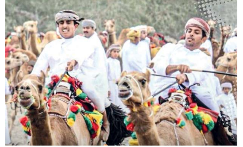
■ من ركض العرصة

أوقعت قرعة دورة الألعاب الآسيوية الشاطئية السادسة التي تستضيفها مدينة سانيا الصينية خلال الفترة من ٢٢ إلى ٣٠ أبريل المقبل منتخبنا الوطني لكرة اليد الشاطئية في المجموعة الثانية إلى جانب منتخبات باكستان والأردن والمالديف وبنغلاديش وتايلاند وقطر ومنغوليا وهي مجموعة قوية نظراً لتقارب مستويات عدد من المنتخبات وتطور كرة اليد الشاطئية في القارة الآسيوية خلال السنوات الأخيرة في المقابل تضم المجموعة الأولى منتخبات الصين وإيران والفلبين وهونغ كونغ والهند وسريلانكا والبحرين ما يعكس حجم المنافسة المرتفعة في الدورة التي تشهد مشاركة واسعة من مختلف الدول