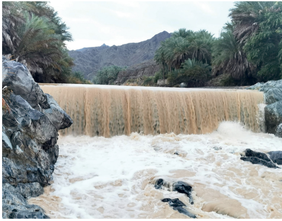
جريان الأودية بالحوقين بعد أمطار غزيرة جزاءً منخفض المسرات