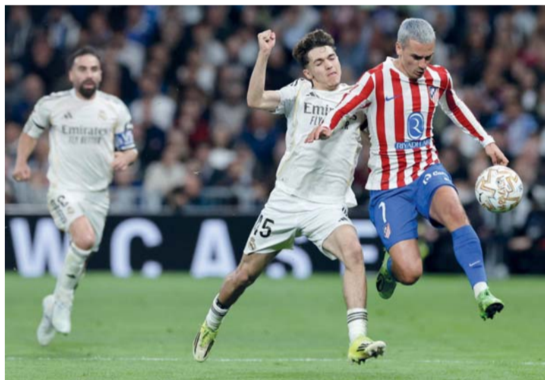
تياجو لاعب الريال (في الوسط)، مع مهاجم أتلتيكو مدريد أنطوان