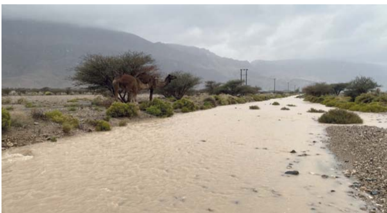
أحد أودية قرى محافظة الظاهرة