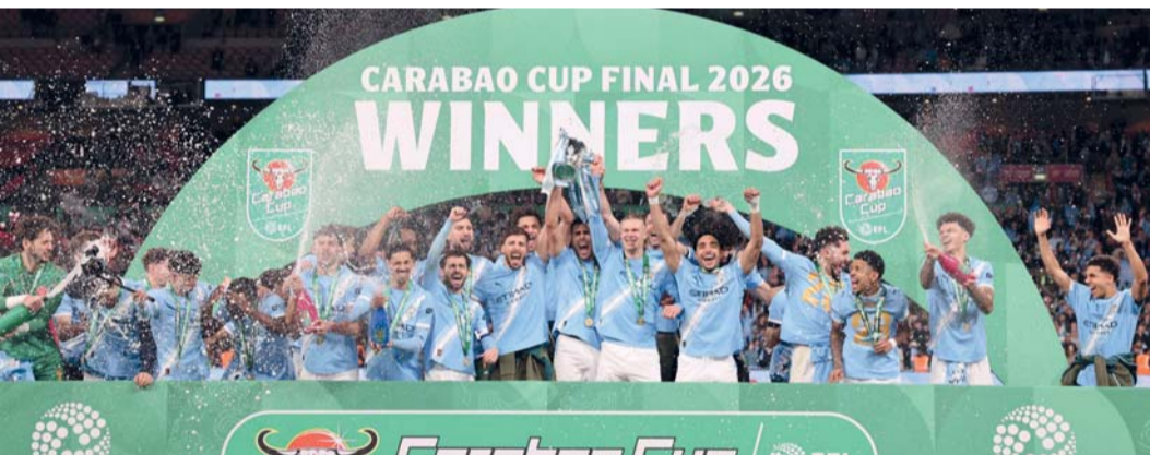
لاعبو مانشستر سيتي يحتفلون بالكأس بعد المباراة النهائية لكأس الدوري الإنجليزي لكرة القدم بين أرسنال ومانشستر سيتي على ملعب ويمبلي

مريد د.ب.أ: انتزع ريال مدريد ثلاث نقاط ثمينية في مشوار المنافسة على لقب الدوري الإسباني لكرة القدم بالفوز ٣ / ٢ على جاره أتلتيكو مدريد في ديربي العاصمة بختام منافسات الجولة التاسعة والعشرين من المسابقة. تقدم أتلتيكو بهدف مهاجمه النيجيري آدميولا لوكمان في الدقيقة ٣٣، لينتهي الشوط الأول لصالح الضيوف. وفي الشوط الثاني، قلب الريال الطاولة بهدف فينيسوس جونيور وفيريكو فالفيدي في الدقيقة ٥٢ و٥٥ قبل أن يتعادل أتلتيكو بهدف ناهويل مولينا في الدقيقة ٦٦. ولكن فينيسوس سجل الهدف الثاني له والثالث لفريقه في الدقيقة ٧٢، وحافظ الريال على تفوقه رغم النقص العددي