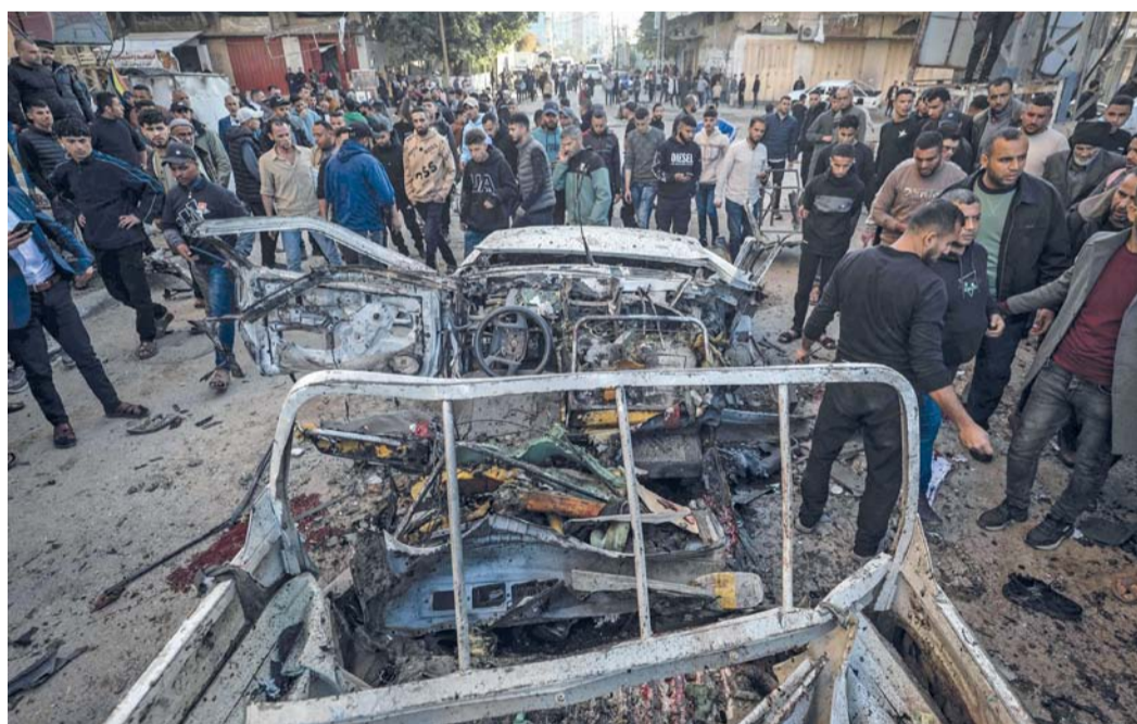
■ فلسطينيون يتجمعون حول سيارة جيب تابعة للشرطة الفلسطينية مدمرة بعد غارة إسرائيلية في مخيم النصيرات للاجئين وسط قطاع غزة.

وأعلن مجمع العودة الطبي وصول ثلاثة شهداء وعشر إصابات إثر استهداف طائرات الاحتلال مركبة قرب مفترق أبو صرار في مخيم النصيرات وسط قطاع غزة. وكان جيش الاحتلال اغتال في وقت سابق القيادي في كتائب الأقصى يوسف لافي بمدينة غزة.