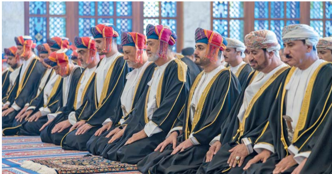
■ خطبة العيد تركز على تكامل شهر رمضان المبارك والقرآن الكريم والعيد السعيد، حيث إن الوعي نور يقيم ميزان الأولويات ويمنح الفرد والمجتمع بصيرة تحمي من الانجراف.

كما أدى الصلاة بمعية جلالته، أيده الله، عدد من أصحاب السمو أفراد الأسرة المالكة الكريمة، ورجال السادة، والسادة البوسعيد، وأصحاب المعالي الوزراء والمستشارين، وقادة قوات السلطان المسلحة وشرطة عُمان السلطانية والأجهزة الأمنية الأخرى، وأصحاب السعادة رؤساء البعثات الدبلوماسية للدول الإسلامية، وأعضاء مجلسي الدولة والشورى من محافظة مسقط، وعدد من أصحاب السعادة الوكلاء، وجمع من الشيوخ ورجال الأعمال