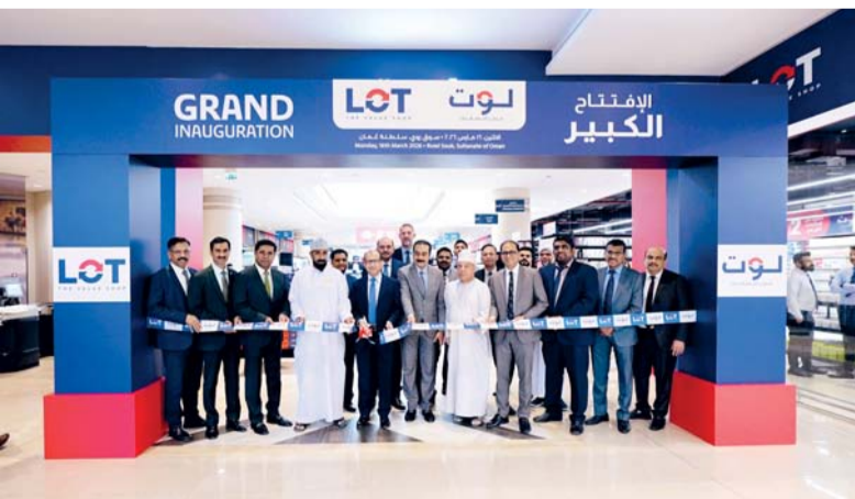
المتجر الجديد يقدم تجربة تسوق سهلة ومرحة

الفتات، مما يضمن تجربة تسوق سهلة ومرحة. ويمكن للمتسوقين استكشاف تشكيلة رائعة من أحدث صيحات الموضة الموسمية للرجال والنساء والأطفال، بما في ذلك الأحذية والمجوهرات الأنيقة وحقائب النساء والتجميل بأسعار مميزة، كما يقدم المتجر الجديد مجموعة واسعة من المستلزمات المنزلية