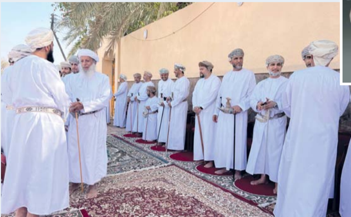
■ الصورة رسالة ضوئية سامية