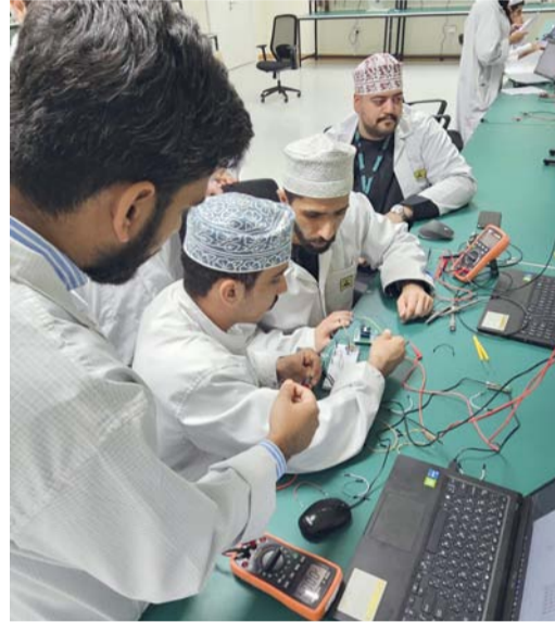
الاستثمارات تمكن سلطنة عمان من ترسيخ موقعها كمركز إقليمي للصناعات التقنية المتقدمة

الدولية، ولا سيما في قطاع الاقتصاد الرقمي، من خلال جلب التقنيات وتوطينها، ونقل الخبرات، وبناء منظومة وطنية متكاملة للبحث والتطوير؛ لتسهم هذه الاستثمارات في تعزيز مكانة سلطنة عُمان كموقع جاذب لصناعات التقنية المتقدمة، ودعم بناء اقتصاد معرفي مستدام، وتنوع مصادر الدخل الوطني، وفتح فرص وظيفية نوعية للشباب العماني في مجالات الهندسة والتقنية والابتكار. ويمثل استثمار جهاز الاستثمار العماني عبر مجموعة إنكباء في شركة