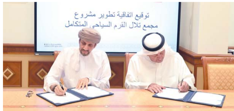
■ المشروع ينفذ على مراحل تمتد إلى ١٥ عاماً

للاستثمار في قطاع السياحة وقيمة مضافة في محافظة مسقط كمجمع سياحي متكامل، مشيراً إلى أن المشروع بعد اكتماله سيعمل على زيادة عدد الغرف الفندقية في محافظة مسقط كما سيعزز فرص العمل للعُمانيين، مضيفاً أن المشروع يتيح التملك الحر للعُمانيين ولغير العُمانيين. ويأتي توقيع هذه الاتفاقية تأكيداً على التزام وزارة التراث والسياحة بتطوير البنية الأساسية للقطاع السياحي، وتعزيز جاذبية المقاصد السياحية، ودعم المحتوى المحلي، وإيجاد فرص عمل مستدامة، بما يسهم في تحقيق مستهدفات القطاع السياحي وتعزيز إسهامه في الاقتصاد الوطني.