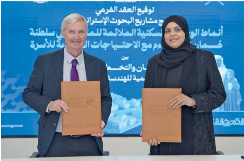
الاتفاقية تساهم في تحقيق تنمية عمرانية مستدامة

ويتمثل اعتماد هذا المشروع ضمن برنامج مشاريع البحوث الاستراتيجية خطوة مهمة نحو ربط السياسات الإسكانية بالبحث العلمي التطبيقي، بما يعزز تكامل الأدوار بين المؤسسات الحكومية والقطاع الأكاديمي، ويدعم تطوير نماذج سكنية أكثر مرونة