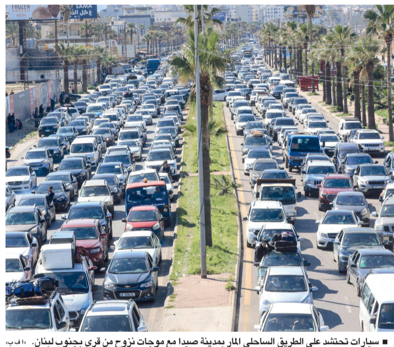
سيارات تحتشد على الطريق الساحلي المار بمدينة صيدا مع موجات نزوح من قرى جنوب لبنان.

مرسوم سلطاني بتعيين سفراء غير مقيمين مسقط، العمانية: أصدر حضرة صاحب الجلالة السلطان هيثم بن طارق المعظم، حفظه الله ورعاه، مرسوماً سلطانياً سامياً رقم (٢٠٢٦/٤١) بتعيين سفراء غير مقيمين. ■ تفاصيل ..... ص ٤ إدراج صندوق بوابة عمان في بورصة مسقط كتب - عبدالله الشريقي: شهدت بورصة مسقط فصلاً جديداً في تاريخ القطاع المالي العُماني بإدراج صندوق بوابة عُمان، وهو أول صندوق استثماري مشترك في سلطنة عُمان يجمع بين خصائص الصناديق ذات النهاية المفتوحة ومرونة التداول اللحظي. ويحزّن إدراج صندوق بوابة عُمان يأتي ليعزز من حيوية بورصة مسقط ويفتح آفاقاً جديدة للمستثمرين الباحثين عن أدوات استثمارية مبتكرة. ■ تفاصيل ..... «الاقتصادي»