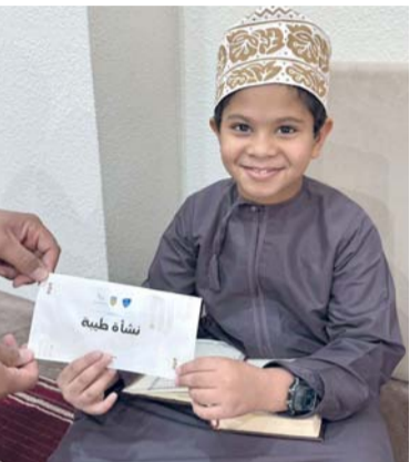
■ غرس السلوكيات الإيجابية في نفوس الأطفال