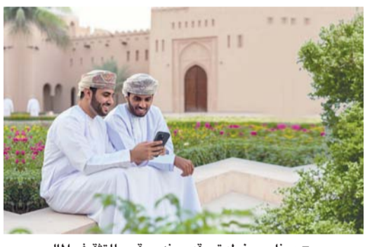
برنامج «خطوة» يقدم منح رقمي للتقني المالي

وخاصة الشباب. والتفاعل مع المفاهيم المالية باستخدام الهواتف الذكية أو أجهزة الكمبيوتر. وتأتي هذه الجهود بدعم من شركات حكومية تشمل وزارة التعليم في إطار استراتيجية تهدف للوصول إلى الشباب أينما كانوا. ويكمل هذه المناهج المنظمة منتجات مصرفية عملية موجهة للشباب، مثل: حساب الشباب من بنك ظفار الذي يتيح للعمانيين من عمر ١٨ إلى ٢٣ عاماً بدء رحلتهم المالية بسهولة عبر خدمات إلكترونية، مما يعزز ثقافة البنك بأن الوصول المبكر إلى الأدوات المالية يرسخ الاستقلالية والمسؤولية.