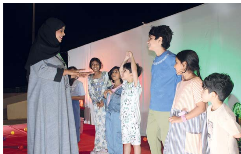
■ أجواء احتفالية تعكس فرحة الصغار بالشهر الفضيل

واستشارات طبية مجانية بالتعاون مع مختصين في عدد من المجالات الصحية، إضافة إلى تنظيم يوم للمشي المجتمعي يهدف إلى تعزيز ثقافة النشاط البدني وترسيخ مفهوم الصحة الوقائية بين أفراد المجتمع. وقد وفرت اللجنة المنظمة جوائز وهدايا للمشاركين من الأطفال والكبار، تقديراً لتفاعلهم وتحفيزاً لهم على المشاركة الفاعلة في مختلف البرامج، بما يسهم في ترسيخ روح التعاون والمشاركة المجتمعية. يأتي تنظيم الخيمة الرمضانية ضمن أنشطة فريق العامرات الخيري بهدف تعزيز أواصر التكافل الاجتماعي، وترسيخ قيم التطوع والعمل الخيري، ودعم الأسر المنتجة، وإيجاد مساحة مجتمعية تلقي فيها الأسر في أجواء رمضان قائمة على التراحم والتواصل والبذل والعطاء.