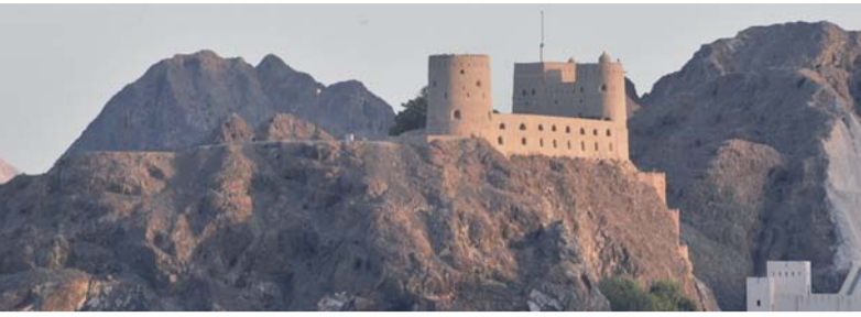
المشروع يعزز القيمة المضافة للمواقع التراثية

باريس - العُمانية: أصدرت منظمة الأمم المتحدة للتربية والعلم والثقافة (اليونسكو) تقريراً عن تقييم جاهزية سلطنة عُمان حول توسيع نطاق حوكمة الذكاء الاصطناعي الأخلاقية الشاملة والقائمة على حقوق الإنسان (RAM) في سلطنة عُمان، والذي أشرفت على إعداده وزارة النقل والاتصالات وتقنية المعلومات. ويمثل التقرير خطوة استراتيجية نحو تعزيز الحوكمة الأخلاقية والتشريعية، ومواصلة السياسات الوطنية مع أفضل الممارسات الدولية، بما يرسخ الاستخدام المسؤول للتقنيات الحديثة لخدمة الإنسان والمجتمع. وأكد التقرير على أن سلطنة عُمان تمتلك مرتكزات قوية للانطلاق في مجال الذكاء الاصطناعي، في مقدمتها وجود إطار استراتيجي واضح يضع الاقتصاد الرقمي ضمن أولوياته، إلى جانب إطلاق (السياسة العامة للاستخدام الآمن والأخلاقي لأنظمة الذكاء الاصطناعي) عام ٢٠٢٥. كما يشير التقرير إلى أهمية إصدار قانون حماية البيانات الشخصية بالمرسوم السلطاني ٦ / ٢٠٢٢ في تعزيز الثقة الرقمية، فضلاً عن التقدم في البنية الأساسية للاتصالات، وارتفاع نسبة الخريجات في تخصصات العلوم والتقنية والهندسة والرياضيات. ومن أبرز المبادرات الوطنية التي رصدها التقرير تطوير النموذج اللغوي العُماني الكبير (مُعِين)، الهادف إلى إنتاج حلول ذكاء اصطناعي تراعي