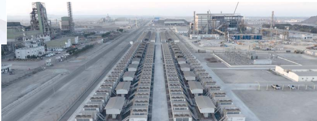
■ الهيئة تشرف على ٢٣ منطقة اقتصادية خاصة وحررة ومدن صناعية

يذكر أن الهيئة تشرف على ٢٣ منطقة اقتصادية خاصة ومنطقة حرة ومدن صناعية وقد تجاوزت الاستثمارات الجديدة فيها خلال عام ٢٠٢٥ إلى نحو ١,٤ مليار ريال عُمانى ليرتفع بذلك إجمالي حجم الاستثمار الملتزم في المناطق التي تشرف عليها الهيئة العامة للمناطق الاقتصادية الخاصة والمناطق الحرة إلى ٢٢,٤ مليار ريال عُمانى، مسجلاً نمواً بنسبة ٦,٨٪ مقارنة بعام ٢٠٢٤.