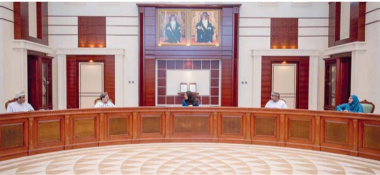
■ مديحة الشيبانية تستقبل حسين آل صالح