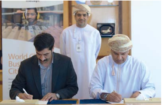
مدينة السوق الصناعية تقدم فرصاً استثمارية متميزة وحوافز تنافسية

بما يسهم في دعم الأمن الغذائي وتعزيز الاستثمار الزراعي والصناعات المساندة. ومن المتوقع أن يتم البدء في أعمال تنفيذ هذا المشروع خلال العام الجاري ٢٠٢٦م، وتشكل مدينة السوق الصناعية إضافة نوعية إلى منظومة المدن الصناعية التابعة لـ«مدائن» لما تقدمه من فرص استثمارية متميزة وحوافز تنافسية تساهم في توفير فرص عمل مباشرة وغير مباشرة للمواطنين، وتمكين رواد الأعمال من إطلاق مشاريع مبتكرة، إلى جانب تعزيز الإيرادات غير النفطية للاقتصاد الوطني.