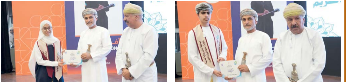
بناء جيل واع متمسك بثوابته الدينية وقيمه الأصيلة