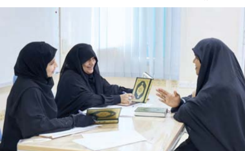
■ تنمية مهارات التجويد لدى المشاركين

وأضاف: تهدف المسابقة إلى تشجيع المشاركين الإقبال على كتاب الله حفظاً وتلاوة، وتنمية مهارات التجويد، واستثمار أجواء شهر رمضان المبارك في تعزيز القيم الإيمانية، وبناء روح التفاني الشريف.