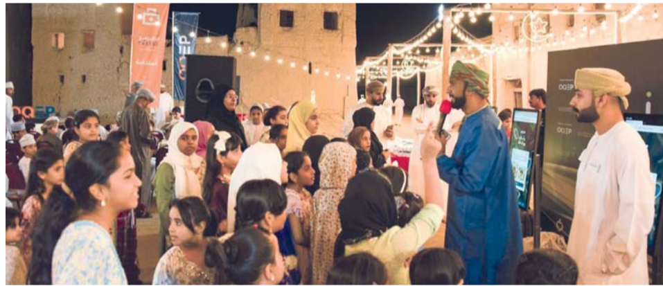
البرنامج يشمل فعاليات ومسابقات ثقافية وفقرات ترفيهية