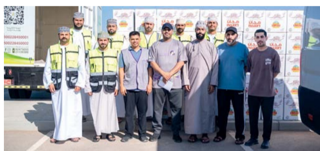
■ البنك يواصل تعزيز مبادراته المجتمعية الهادفة

وإنسانية تعكس روح الشهر المبارك. بعيداً عن خدماته المصرفية وتعزيزاً لعلاقاته مع شركائه، أطلق البنك رسمياً أول منصة للتعمير الجماعي الوقفي بالتعاون مع مؤسسة بوشر الوقفية ومنصة وديعة، بهدف ترسيخ ثقافة العطاء الخيري المستدام وتسهيل سبل الإسهام المجتمعي المنظم عبر حلول رقمية آمنة وموثوقة. وإلى جانب ذلك، التابعة لوزارة الأوقاف والشؤون الدينية التعريف بحسابات الزكاة المتاحة لديه بما يضمن توجيه أموال الزكاة عبر قنوات رسمية تعزز الشفافية وتحقق الأثر المنشود.