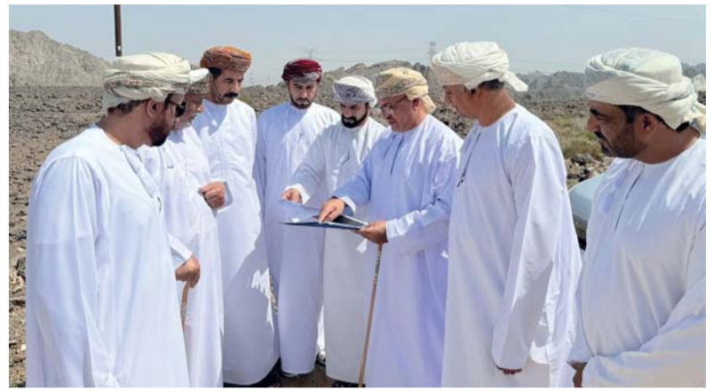
التنسيق بين مختلف الجهات لتذليل المعوقات

ويعد هذا المشروع في سياق التوجهات الوطنية الرامية إلى إحداث نقلة نوعية في مستوى الخدمات الحكومية، لا سيما في قطاع الإسكان الاجتماعي بما يساهم في تعزيز جودة الحياة وتحقيق تنمية عمرانية