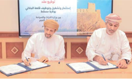
... ويرسخ مكانة سلطنة عمان على خارطة السياحة الثقافية

سلطنة عُمان وخارجها بما يعزز من جاذبية الوجهات التراثية ويرسخ مكانتها على خارطة السياحة الثقافية. كما يمثل خطوة في اتجاه تمكين القطاع الخاص وتعزيز دوره في إدارة وتشغيل المعالم التراثية وفق أفضل الممارسات. ويفتح المشروع أفقا استثمارية واسعة في مجالات الأنشطة السياحية والثقافية وتنظيم الفعاليات الترفيهية وإقامة المعارض الحرفية بما يدعم الصناعات الإبداعية ويعزز القيمة المضافة للمواقع التراثية، إلى جانب عمل مباشرة وغير مباشرة لبناء المجتمع المحلي ما ينعكس إيجاباً على التنمية الاقتصادية والاجتماعية. ومن المؤمل أن تسهم القلعة بعد تطويرها وتشغيلها في رفد الاقتصاد الوطني عبر تنشيط الحركة السياحية وزيادة الإنفاق السياحي، إلى جانب تحفيز رواد الأعمال في مجالات الضيافة والخدمات المصاحبة وتعزيز مكانتها كمقصد سياحي وثقافي بارز على خارطة السياحة العمانية.