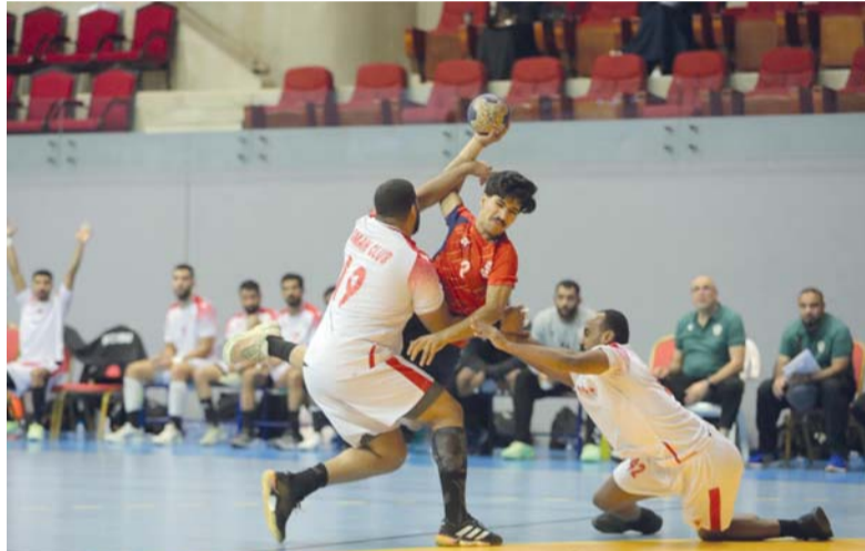
من مباراة نادي عمان ومسقط في الجولة الافتتاحية بالدور الثاني

يدخل نادي عمان مواجهة الليلة بمعنويات مرتفعة بعد أن حقق ثلاثة انتصارات متتالية في هذا الدور كان آخرها فوزه العريض على نزوى بنتيجة ٤٢/٢٩ في الجولة الثالثة ليرفع رصيده إلى ٦ نقاط ويؤكد جدارته بصدارة الترتيب ويقدم نادي عمان مستويات فنية مستقرة ويعتمد على منظومة جماعية متجانسة تجمع بين الخبرة والحيوية الأمر الذي منحه أفضلية واضحة في الجولات الماضية. ويدرك نادي عمان أن الفوز في لقاء اليوم سيرقيه كثيراً من حسم بطاقة التأهل المباشر إلى النهائي دون الدخول في حسابات معقدة أو انتظار