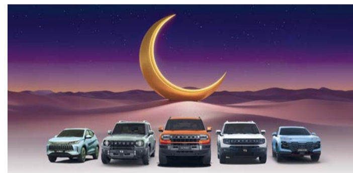
تشكيلة سيارات جيتور الديناميكية الرياضية متعددة الاستخدامات