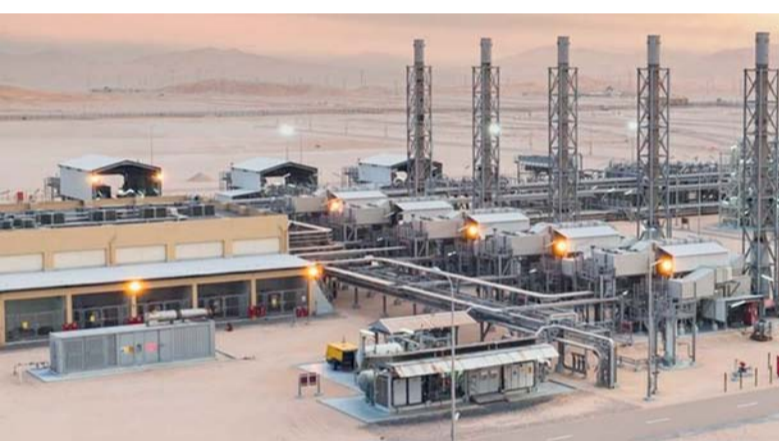
الشركة حققت نمواً بارزاً في مبيعات النفط والمكثفات خلال العام ٢٠٢٥م

مشروع «مرسى» لتزويد السفن بالغاز الطبيعي المسال وأحرزنا تقدماً جيداً، حيث بلغت نسبة اكتمال المشروع أكثر من ٣٩ بالمائة مع نهاية شهر ديسمبر ٢٠٢٥. وأوضح أن الشركة وقعت عدداً من اتفاقيات بيع الغاز طويلة الأمد لمنطقتي «امتياز» تابعة للشركة، وهما منطقة «الامتياز ٦٥» و«١٠»، لتعزيز عمليات تشغيل مشروع مرسى للغاز الطبيعي المسال، كما استطاعت الشركة تأمين أربع اتفاقيات استكشاف ومشاركة إنتاج جديدة وأخرى تم تعديليها. وقال: إن هذه الاتفاقيات تعد خطوة أساسية في تحقيق رؤية الشركة، وقد تضمنت اتفاقيات الاستكشاف ومشاركة الإنتاج