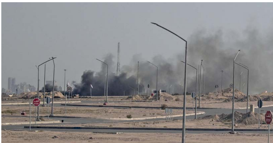
تصاعد الدخان من غارة جوية إيرانية في منطقة السفارة الأميركية بمدينة الكويت.

إلى ذلك واصلت قوات الاحتلال «الإسرائيلي» إغلاق المسجد الأقصى المبارك لليوم الثاني على التوالي. وأفادت محافظة القدس بأن الاحتلال منع المصلين من التواجد في المسجد، بحجة إعلان