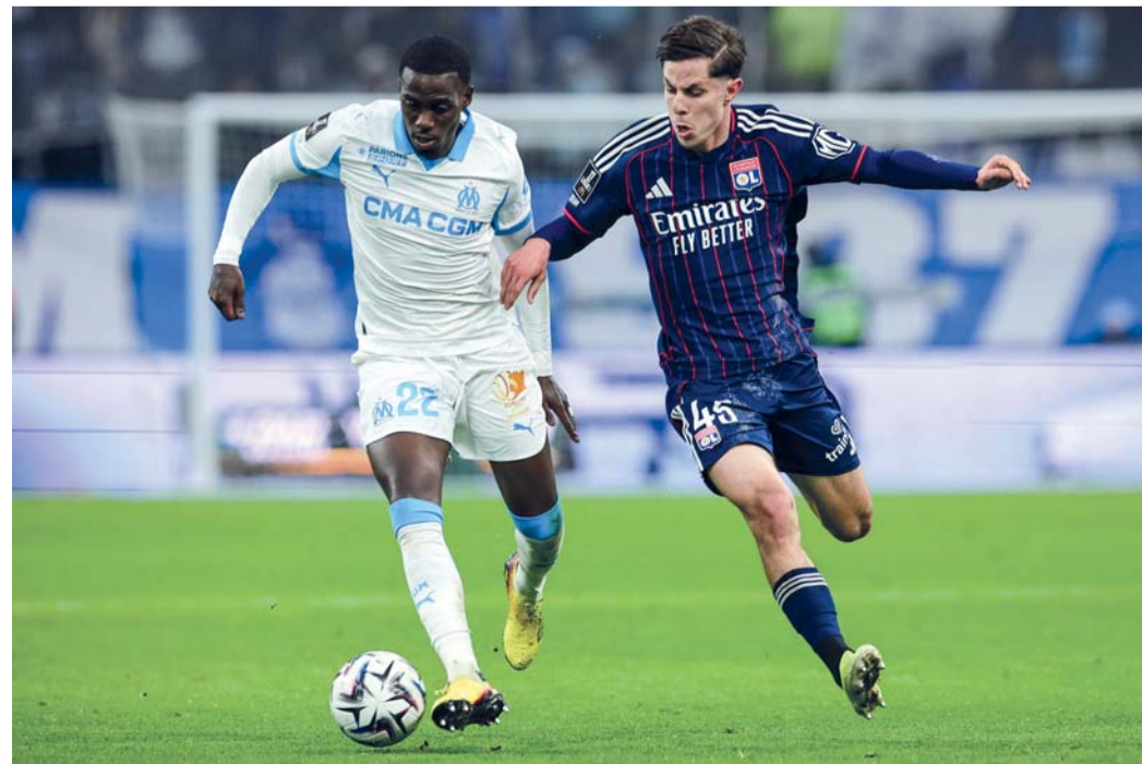
■ لاعب ليون هيمبير (يمين) ومهاجم مرسلية تيموثي يتنافس على الكرة

في المقابل، تواصلت معاناة فولفسبورج بتلقيه خسارته الخامسة في سلسلة من سبع مباريات لم يذق فيها طعم الفوز. وتجمد رصيده عند ٢٠ نقطة في المركز السابع عشر، متأخراً بفارق ثلاث نقاط فقط عن سانت باولي في المركز الخامس عشر الأيمن. وقلب لايبزيغ تأخره أمام هامبورج ليخرج فائزاً ٢-١، محققاً انتصاره الأول بعد ثلاث مباريات في مختلف المسابقات. وتأخر لايبزيغ خارج أرضه بهدف البرتغالي فابيو فييرا (٢٢) لكنه عاد بفضل هدفي البرازيلي روميلو كاردوسو (٣٦) الذي أهدر لاحقاً ركلة جزاء (٦٢)، والعاجي يان ديومانده (٥٠).