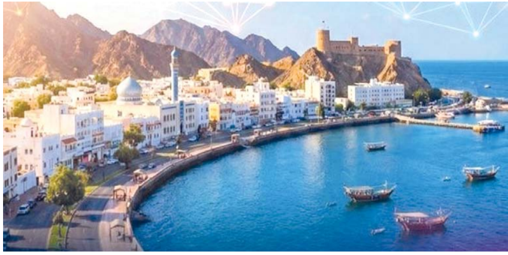
التقرير يمثل خطوة استراتيجية نحو تعزيز الحوكمة الأخلاقية والتشريعية

باريس - العُمانية: أصدرت منظمة الأمم المتحدة للتربية والعلم والثقافة (اليونسكو) تقريراً عن تقييم جاهزية سلطنة عُمان حول توسيع نطاق حوكمة الذكاء الاصطناعي الأخلاقية الشاملة والقائمة على حقوق الإنسان (RAM) في سلطنة عُمان، والذي أشرفت على إعداده وزارة النقل والاتصالات وتقنية المعلومات. ويمثل التقرير خطوة استراتيجية نحو تعزيز الحوكمة الأخلاقية والتشريعية، ومواصلة السياسات الوطنية مع أفضل الممارسات الدولية، بما يرسخ الاستخدام المسؤول للتقنيات الحديثة لخدمة الإنسان والمجتمع. وأكد التقرير على أن سلطنة عُمان تمتلك مرتكزات قوية للانطلاق في مجال الذكاء الاصطناعي، في مقدمتها وجود إطار استراتيجي واضح يضع الاقتصاد الرقمي ضمن أولوياته، إلى جانب إطلاق (السياسة العامة للاستخدام الآمن والأخلاقي لأنظمة الذكاء الاصطناعي) عام ٢٠٢٥. كما يشير التقرير إلى أهمية إصدار قانون حماية البيانات الشخصية بالمرسوم السلطاني ٦ / ٢٠٢٢ في تعزيز الثقة الرقمية، فضلاً عن التقدم في البنية الأساسية للاتصالات، وارتفاع نسبة الخريجات في تخصصات العلوم والتقنية والهندسة والرياضيات. ومن أبرز المبادرات الوطنية التي رصدها التقرير تطوير النموذج اللغوي العُماني الكبير (مُعِين)، الهادف إلى إنتاج حلول ذكاء اصطناعي تراعي