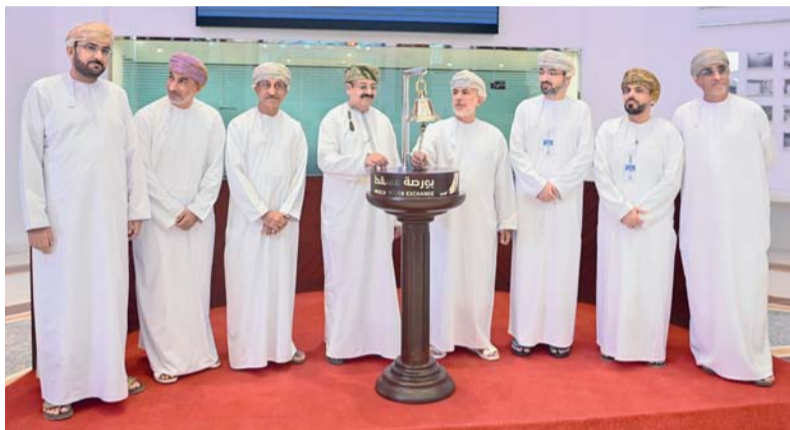
إدراج الصندوق يعزز من حيوية بورصة مسقط ويفتح آفاقاً جديدة للمستثمرين

مؤسسية عالية للمستثمرين في سلطنة عمان. تجدر الإشارة إلى أن بورصة مسقط شهدت خلال العام الماضي ارتفاعاً ملحوظاً ومستداماً في قيم التداول وأحجام التداول اليومية، مدفوعاً بإصلاحات رؤية «عمان ٢٠٤٠»، وتعزيز الانضباط المالي، وزيادة نشاط قطاع السوق، كما أن التحسن المستمر في حوكمة السوق ومستويات السيولة يعزز من فرص إدراج سلطنة عمان ضمن مؤشرات الأسواق الناشئة وهو ما قد يسهم في جذب تدفقات رأسمالية كبيرة.