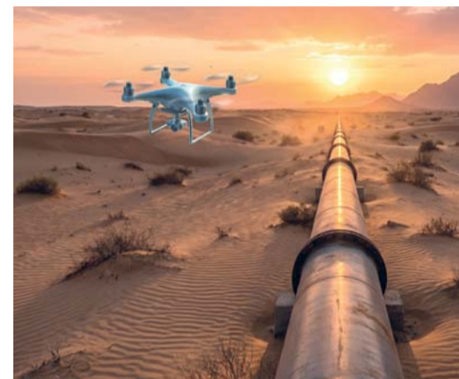
الجائزة تعزز مكانة الشركة كأحد الرواد الإقليميين في نقل الغاز

جاء ذلك خلال الحفل الذي نظمته بورصة مسقط أمس تحت رعاية سعادة عبدالله بن سالم السالمي الرئيس التنفيذي لهيئة الخدمات المالية. وأوضح أن صندوق بوابة عمان يوفر للمستثمرين أداة استثمارية مدارة باحترافية ومتنوعة تنجح للمستثمرين المحليين والأجانب الاستفادة من هذه المرحلة المحورية في تطور سوق رأس المال العماني، حيث سيتيح الصندوق للمستثمر الاستثمار في مختلف الأسهم