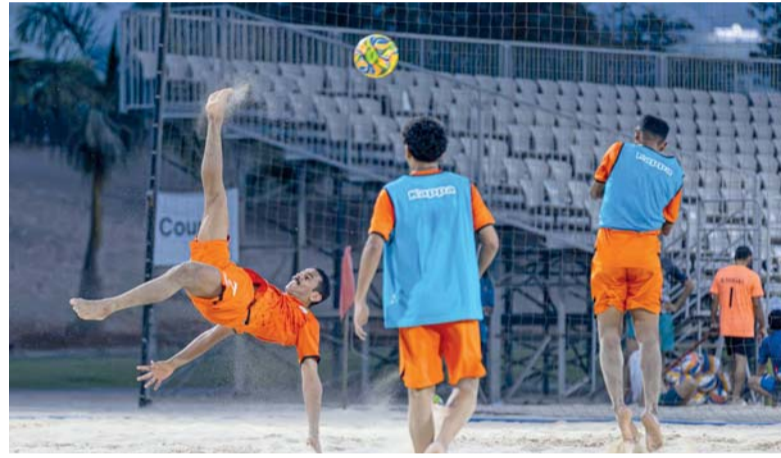
من الحصص التدريبية لمنتخبنا في معسكره الداخلي الأول بمجمع بوشر

العجمي ويعتمد الجهاز الفني خلال هذا المعسكر على تكتيف الجرات التدريبية مع التركيز على الجوانب البدنية لرفع معدلات اللياقة إلى جانب تنفيذ عدد من التطبيقات التكتيكية والتدريبات المتنوعة التي تحاكي أجواء المباريات بما يضمن الوصول إلى أعلى درجات الانسجام والاستقرار الفني قبل الاستحقاق القاري المرتقب. ويسعى منتخبنا من خلال مشاركته في النسخة السادسة إلى تحقيق نتيجة إيجابية تعكس تطور كرة القدم الشاطئية العُمانية خاصة وأنه يُعد أول منتخب آسيوي ينال شرف التتويج بالميدالية الذهبية في النسخة الأولى من دورة الألعاب الآسيوية