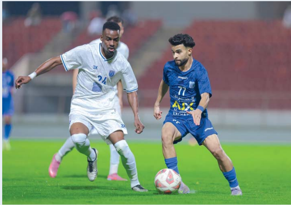
من مباريات دوري جندال

في المقابل، يعيش صور وضعاً مقلقاً في المركز الثالث عشر برصيد ٩ نقاط فقط، بعدما استقبل ٢٥ هدفاً، ليكون أحد أضعف خطوط الدفاع في المسابقة. الفريق مطالب بالرد سريعاً، خاصة أن أي خسارة جديدة قد تضعه في قلب منطقة الهبوط بشكل مباشر. المباراة تبدو نظرياً في صالح بهلاء، لكن عامل الضغط قد يصنع الفارق. صور سيدخل اللقاء بشعار "لا بد من النقاط الثلاث"، ومن