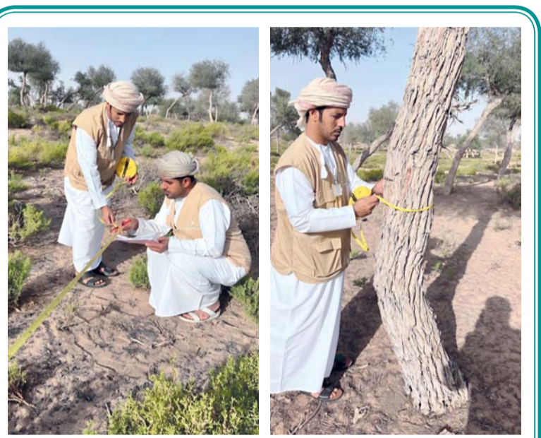
استخدام منهجيات علمية وأخذ عينات ميدانية