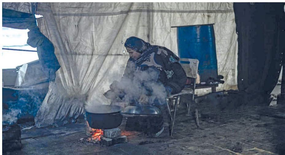
نازحة فلسطينية تحضر طعام الإفطار داخل أحد مراكز الإيواء التابعة للأونروا في مدينة غزة، في ظل أوضاع إنسانية صعبة يعيشها النازحون مع حلول شهر رمضان.

مسقط. العُمانية: تبدأ غرفة تجارة وصناعة عُمان أمسياتها الرمضانية غداً حيث تنظم الغرفة ٣ أمسيات رمضانية لتكون بمثابة حلقات مترابطة تقدم قراءة شاملة لمستقبل عدد من القطاعات الحيوية؛ إذ ستكون الأمسية الأولى والتي ستعقد يوم غد الاثنين بمسقط بعنوان «مستقبل القطاع العقاري والمُدن المستدامة».. أما الأمسية الثانية التي ستعقد في الثاني من مارس المقبل، فتحمل عنوان «أولويات الخطة الخمسية الحادية عشرة».. وستعقد الأمسية الثالثة «الدبلوماسية الاقتصادية ودورها في دعم الاقتصاد الوطني» في منتصف شهر مارس المقبل. تفاصيل... الاقتصادي