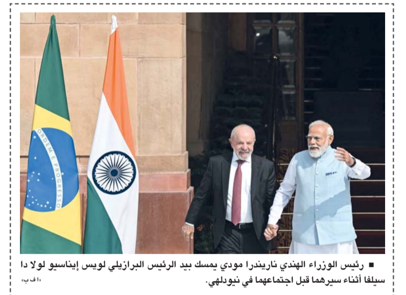
رئيس الوزراء الهندي ناريندرا مودي يمسك بيد الرئيس البرازيلي لويس إيناسيو لولا دا سيلفا أثناء سيرهما قبل اجتماعهما في نيودلهي.

تايبيه. د.ب.أ. رصدت وزارة الدفاع الوطني التايوانية ٨ طائرات عسكرية وسبع سفن حربية صينية حول تايوان بين الساعة السادسة صباح الجمعة والساعة السادسة صباح أمس السبت. وأضافت الوزارة أن جميع الطائرات عبرت الخط