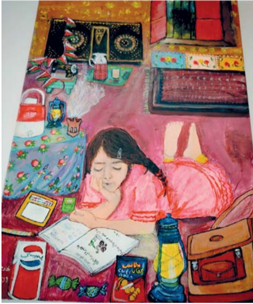
العديد من الأعمال الفنية عن جمال الطبيعة والتراث والحياة الاجتماعية