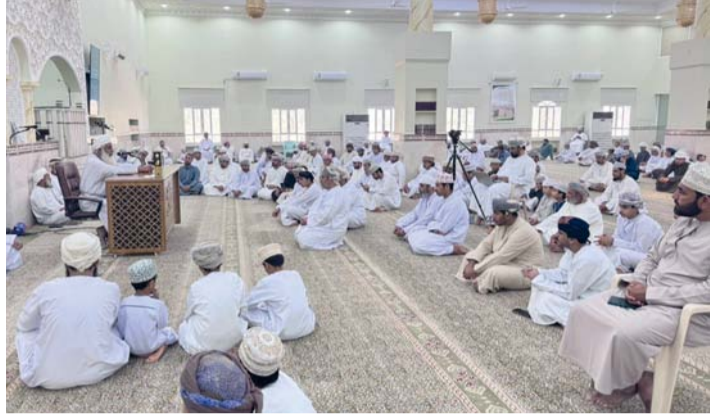
تعزيز الوعي الديني والقيم الاجتماعية وتعويد الأبناء على القيم الروحية

استهل المحاضر بالحديث عن خرافة «الطاعة العمياء» حيث يظن بعض الوالدين أن من حقهم أن يُطاعوا دون نقاش وأن على الأبناء تنفيذ الأوامر فوراً دون سؤال أو حوار.