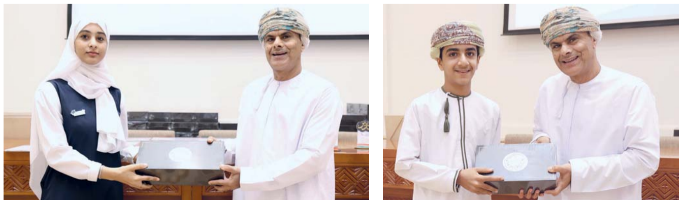
تكريم الطلبة الجيدين

الباطنة، وجمع من الإداريين بالمدارس، والمشرفين والمعلمين، والطلبة، وأولياء الأمور. وقد شمل الحفل تكريم الحاصلين على مراكز متقدمة على المستوى الوطني لسلطنة عمان، بالإضافة إلى المراكز الفائزة على مستوى محافظة شمال الباطنة، ولجان التقييم والمعلمين والمشرفين والطلبة ضمن الأنشطة التربوية المختلفة التي سعت إلى تنمية مهارات طلبة المدارس وصقلها. حيث ضمت الأنشطة البرنامج الوطني للقرأة، وأفضل عرض مرئي، والفنون التشكيلية، والعزف الفردي، والتمثيل المسرحي، ومناظرات اللغتين العربية والإنجليزية، والتحدث بالعربية، والخطابة، والإلقاء الشعري، وتعميق دراسة النحو، ومناهزات اللغة العربية، والتصوير الفوتوجرافي، والمسابقات الجماعية، ومسابقة بالعربية نبدع، ومسابقتي البحرين فن الطفل، ومصر في عيون أطفال العالم، والفنون البصرية المصاحبة لمهرجان المسرح، وكتابة الرسائل، ومسابقة الإنشاد الوطني، والتأليف المسرحي، والقصة القصيرة.