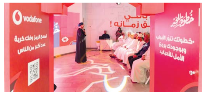
■ مبادرة خطوة للخير تمكن الابتكار والعمل الجماعي وروح التعاطف

للخير أكثر من مجرد حملة رمضان؛ فهي اليوم تجربة وطنية مشتركة تجسد كيف يمكن للأفعال اليومية البسيطة أن تحدث فرقاً حقيقياً ومن خلال تعاوننا هذا العام مع مبادرة فك كربة تعزز البعد الإنساني للمبادرة عبر المساهمة في لم شمل الأسر وفتح أبواب جديدة من الأمل ونفخر بمواصلة توظيف التكنولوجيا كقوة فاعلة للخير تجمع أفراد المجتمع في مختلف أنحاء سلطنة عمان. كما تمثل نسخة عام ٢٠٢٦ محطة مهمة في مسيرة المبادرة، حيث تفتح باب المشاركة أمام جميع أفراد المجتمع في سلطنة عمان، وذلك من خلال تحميل تطبيق «فودافون»، والمساهمة بخطواتهم اليومية في دعم القضية المشتركة وتسهم الحملة في تعزيز التفاعل المجتمعي على مستوى سلطنة عمان عبر شراكات مع البلديات والمؤسسات المجتمعية، إلى جانب مسارات مشي تفاعلية، وأنشطة ميدانية، ومناقصات ودية بين المحافظات تعكس روح العطاء والتكافل خلال الشهر الفضيل. ■