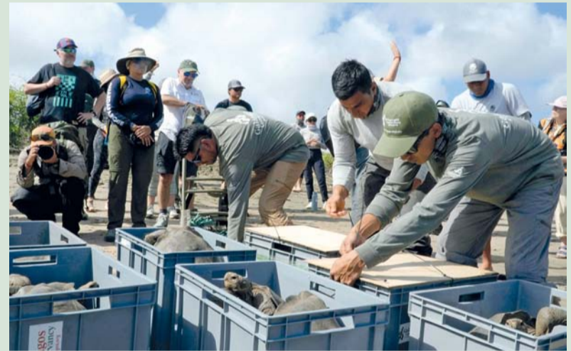
حراس منتزهات يُطلقون سلاحف فلوريانا العملاقة في جزيرة فلوريانا ضمن أرخبيل جالاباجوس في الإكوادور

كتبت. أ. ف. ب: أعلنت وزارة البيئة في الإكوادور أن علماء وحراساً للغابات وضعوا ١٥٠ سلحفاة عملاقة في جزيرة فلوريانا في أرخبيل جالاباجوس بعدما اندثرت من هناك قبل أكثر من قرن. وسار حراس الغابات سبعة كيلومترات عبر «أراض بركانية ومناطق صعبة لنقل السلاحف مع التأكد من أنها تأقلمت»، بحسب ما جاء في بيان الوزارة. ونقلت هذه السلاحف إلى موطنها الطبيعي بعدما كانت تعيش في مركز في حديقة وطنية في جالاباجوس. وخضعت كل سلحفاة لحجر صحي طويل ووُضعت معها شريحة إلكترونية لتمييزها، قبل إطلاقها في الغابة. تقع جزر جالاباجوس على بعد ألف كيلومتر قبالة سواحل الإكوادور، وفيها حياة نباتية وبرية فريدة من نوعها في العالم. وفي هذه الجزر، توصل عالم الأحياء تشارلز داروين لنظريته عن تطور الأنواع في القرن التاسع عشر. وإضافة لهذه السلاحف، تعمل السلطات على إعادة أنواع أخرى سبق أن اندثرت هناك، منها أنواع مختلفة من الطيور.