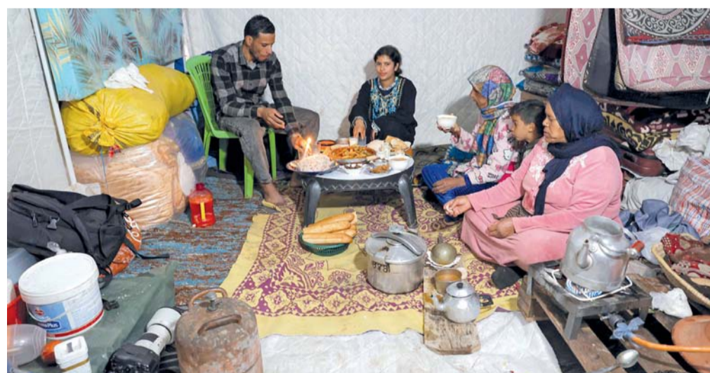
عائلة تتناول وجبة الإفطار في خيمة مخصصة لمخيم إغاثة للمتضررين من الفيضانات التي ضربت شمال وغرب المغرب وذلك في منطقة القنيطرة.

باريس. د. ب. أ: اعتاد متحف اللوفر خطف الأنظار بعروضه الفنية المبهرة، إلا أن سلسلة من الأخبار السلبية عنه تتوالى منذ أشهر: عملية سطو جريئة في وضح النهار استولت خلالها عصابة على مجوهرات تقدر قيمتها بـ ٨٨ مليون يورو، وتنامي شبهات حول احتيالات واسع في مبيعات التذاكر، وصولاً إلى تسرب مائي بسبب أعطال مفاجئة في شبكات الأنابيب. سلسلة من الأحداث تتجاوز كونها فضائح أو أعطالاً فردية، وتضع مستقبل المتحف كواحد من أعرق المؤسسات في العالم موضع تساؤل. فما الخطوات العاجلة المطلوبة الآن؟ منذ منتصف ديسمبر ٢٠٢٥ يشهد المتحف إضرابات جزئية عن العمل تسببت في إغلاقه بالكامل لمدة أربعة أيام. ووفقاً لصحيفة «لوموند» الفرنسية، بلغت الخسائر جراء هذه الإضرابات نحو ٢٥ مليون يورو. ويطالب العاملون بزيادة عدد الموظفين وتحسين ظروف العمل والتوقف عن إبرام عقود عمل هشة وإنهاء الاستعانة بمتعهدين خارجيين، إضافة إلى الاستثمار في المباني والتجهيزات التقنية. وتهدد النقابات بمزيد من الإضرابات.