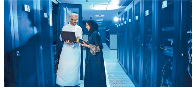
■ ١٣ مؤسسة حصلت على مستوى متقدم في قياس الإجابة للتحويل الرقمي

وتضمنت الأعمال التي وافق المجلس على إسنادها واعتمادها خلال اجتماعه: مشروع إنشاء سدي الحماية من مخاطر الفيضانات على وادي الأنصب بحفاظة مسقط بقيمة ٩ ملايين و٧٥٠ ألف ريال عماني، وتوريد لوازم غسل الكلي البريتوني بقيمة ٨ ملايين و٣٩٠ ألفاً و٢٨٥ ريالاً عمانياً، وتقديم الخدمات الاستشارية لتصميم المرحلة الثالثة للاستاد الرياضي في المدينة الرياضية المتكاملة بقيمة ٤ ملايين و٦٥٠ ألف ريال عماني، وأعمال إعادة تأهيل وصيانة مبنى وزارة المالية بقيمة ٣ ملايين و٢٦٨ ألفاً و٥٣٠ ريالاً عمانياً، والأعمال الإضافية لمشروع إنشاء نفق تقاطع اثنين مع شارع ١٨ نوفمبر بمدينة صلالة بقيمة ٣ ملايين و٢٠٣ آلاف و١٥١ ريالاً عمانياً، ومشروع شق الطريق الترابي الساحلي رخيوت - ضلكوت في محافظة ظفار بقيمة ٧٠٠ ألف ريال عماني. كما تضمنت الأعمال ترقيعية البنية الأساسية