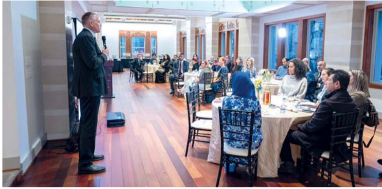
تعزيز الحوار بين الثقافات وتوطيد الروابط التاريخية بين سلطنة عُمان وأمريكا

واختتمت الأمسية بنقاش حول أهمية التعلم التجريبي في نقل المجتمعات من مرحلة التسامح إلى مرحلة الاحترام المتبادل والمصالحة، أعقبه حوار مفتوح مع الحضور حول سبل تعزيز هذه القيم في السياقات الدولية المختلفة.