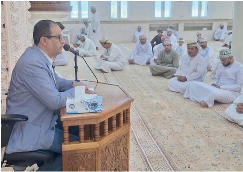
توثيق الروابط الاجتماعية وتعزيز التواصل بين أفراد المجتمع

موضحاً على أهمية السماح للأبناء بارتكاب بعض الأخطاء غير الخطرة ليتعلموا منها التجربة جزء أساسي من عملية التعلم ولا يمكن حماية الطفل من كل خطأ دون أن نخزئه من فرصة النضج. وفي سياق متصل انتقد المحاضر «التربية بالصراخ» موضحاً أن العصبية ورفع الصوت لا يبينان علاقة صحية بين الوالدين والأبناء بل يزرعان الخوف والبعد النفسي في حين أن الحوار والاحترام يعززان الثقة والانفتاح. واختتم بالتأكيد على أن الطفل يفهم المشاعر منذ سنواته الأولى ويتأثر بالخلافات الأسرية حتى إن لم يظهر ذلك مما يستوجب وعياً أكبر بطريقة إدارة الخلافات أمام الأبناء، مؤكداً في مجملها أن التربية علم يحتاج إلى تعلم وثقافة مستمرة وأن تصحيح المفاهيم الخاطئة هو الخطوة الأولى نحو بناء جيل متوازن نفسياً وأخلاقياً، قادر على اتخاذ القرار وتحمل المسؤولية في المستقبل.