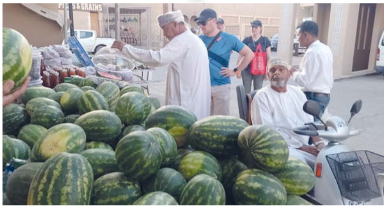
توافر كميات من الجح والشمام المحلي بسوق نزوى