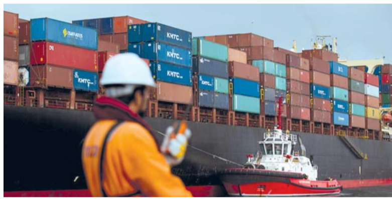
ارتفاع قيمة الصادرات غير النفطية وأنشطة إعادة التصدير

بالمائة، فيما جاءت المملكة المتحدة في المرتبة الثالثة بـ ٢٠,٧ ملايين ريال عماني، والمملكة العربية السعودية رابعاً بـ ١٩,١ مليون ريال عماني، والهند في المرتبة الخامسة بـ ٨,٤ مليون ريال عماني. وشهدت الواردات السلعية من دولة الإمارات العربية المتحدة خلال العام الماضي نمواً بنسبة ٥,٤ بالمائة متجاوزة ٤,١ مليار ريال عماني مقابل ٣,٩ مليار ريال عماني في عام ٢٠٢٤م، وارتفعت الواردات السلعية من الصين بنسبة ٥,٧ بالمائة من مليار و١٨٣٠ مليون ريال عماني إلى مليار و٩٣٥ مليون ريال عماني، في حين سجلت الواردات السلعية من الهند تراجعاً بنسبة ٣,٨ بالمائة من مليار و٥٠٥ ملايين ريال عماني إلى مليار و٤٤٨ مليون ريال عماني، وتراجعت الواردات السلعية من دولة الكويت من مليار و٦٩٢ مليون ريال عماني إلى مليار و٣١٤ مليون ريال عماني، وتراجعت الواردات السلعية من المملكة العربية السعودية من مليار و٢٨٦ مليون ريال عماني إلى مليار و٢١٨ مليون ريال عماني.