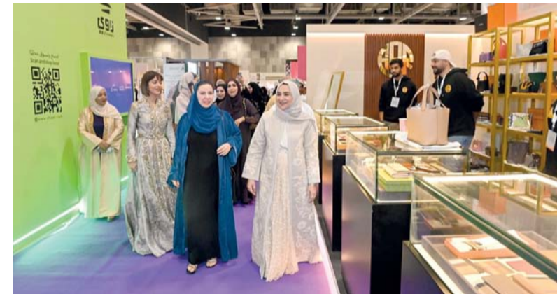
المعرض يسهم في إيجاد منافذ تسويقية

من دول مجلس التعاون الخليجي التي دائماً ما تكون معنا مشاركة وحاضرة في هذا المعرض. وأضاف: في حديثها قائلة بفضل الإقبال الكبير والحضور الجماهيري المتعارف عليه في عرض العطاء أرتأينا بأن نغير في آلية المعرض منها رغبة عند مطالبات المشاركين وكذلك تسهيل للحضور والجمهور، حيث قمنا بتخصيص أوقات مختلفة للتسوق والحضور. ويُنبت بأن برنامج المعرض خلال الفترة من الجمعة وحتى الأحد اتبع المجال أمام الجمهور والزوار للحضور من الساعة الثالثة عصرًا حتى الساعة الواحدة بعد منتصف الليل، وجاء الهدف من هذا التوقيت لعدة أسباب منها أولاً إتاحة الفرصة