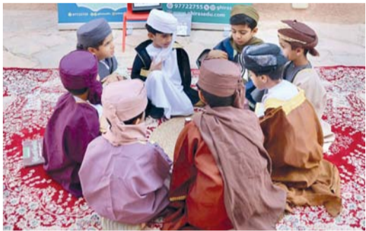
نخل، من سيف الكندي:

أقيم في قلعة نخل برنامج ترفيهي اجتماعي يجسد روح الانسجام والتواصل وتعزيز قيمة ومكانة الإرث التاريخي بين أبناء الولاية وربطه مع حياتهم اليومية من تاريخ ومكانة القيم النبيلة التي تزرع في نفوس الناشئة بأهمية التعرف على ما تحتويه من رحلة تراثية ممتعة يتعلمون منها العادات والتقاليد التي سيكون لها الأثر الإيجابي في إشراقة المستقبل الذي يربط وينسج ليكون حلقة وصل مع حياتهم المعاصرة بحيث يكونون على اطلاع ومعرفة بها، فتسليط الضوء على عادات وتقاليد الضيافة العمانية المتوارثة