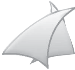
من أسرة تحرير «الوطن»