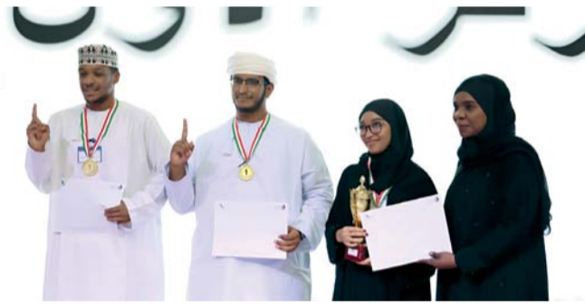
الفائزون في المسابقة

صور. من عبدالله باعلوي: اختتمت جامعة التقنية والعلوم التطبيقية بصور بطولة مناظر الغد وسط حضور أكاديمي وطلابي مميز، وبمشاركة مجموعة من الفرق المتأهلة، وتكريم عدد من المحكمين الدوليين المعتمدين، في أجواء عكست مستوى متقدماً من مهارات الإقناع وبناء الحجة والرد المنهجي لدى الطلبة وتأتي البطولة ضمن رؤية نادي المناظرات لتكثيف الطلبة وتعزيز ثقافة الحوار البناء، وبطولة مناظر الغد ليست مجرد منافسة، بل مشروع لصناعة جيل قادر على التفكير النقدي واحترام الرأي