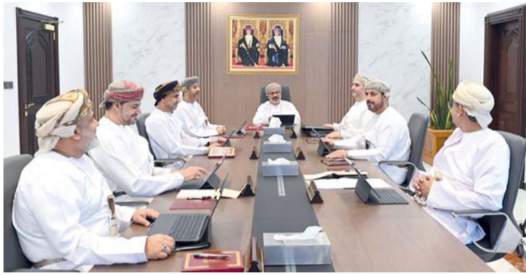
■ مناقصات ومشاريع يعتمدها مجلس المناقصات

وتعزيز قاعدة التصنيع المحلي وإيجاد فرص عمل إضافية للشباب العماني. وأكد معالي قيس بن محمد اليوسف رئيس الهيئة العامة للمناطق الاقتصادية الخاصة والمناطق الحرة على أن الهيئة مستمرة في جهودها لتهيئة بيئة استثمارية تنافسية وجاذبة تسهم في دعم التنوع الاقتصادي وتعزيز الاستفادة المالية، مؤكداً أن استراتيجية الهيئة ورؤيتها ترتكز على ترسيخ مكانة المناطق الاقتصادية الخاصة والمناطق الحرة والمناطق الصناعية كوجهة مفضلة للاستثمار عبر تنظيم بيئة أعمال محفزة وتقديم حوافز نوعية، وتعظيم القيمة المضافة للمشروعات. وأضاف أن المناطق الاقتصادية والحررة والصناعية رسخت موقعها كمراكز اقتصادية متكاملة تؤدي دوراً فاعلاً في دعم التنوع الاقتصادي وتعزيز جاذبية الاستثمار إلى جانب تعظيم الاستفادة من اتفاقيات التجارة الحرة والشركات الاقتصادية الشاملة. ■