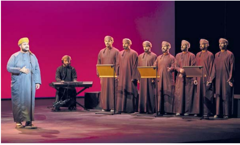
من الأمسيات الإنشادية في دار الأوبرا السلطانية مسقط

طشقند، العُمانية: أدرجت سلطنة عُمان أربعة مواقع ثقافية بارزة وهي: حصن الحِزم، وحصن جبرين، وحصار السيباني، وحصار اليمن على قائمة التراث في العالم الإسلامي، وذلك خلال الدورة الثالثة عشرة للجنة التراث بمنظمة اليونسكو التي عقدت في طشقند عاصمة أوزبكستان. وشاركت وزارة التراث والسياحة في أعمال الدورة التي شهدت تسجيل ١١٧ موقعاً وعرضاً ثقافياً من ١٦ دولة إسلامية. وتعكس المواقع العُمانية الميراث الثقافي والتاريخي ومعمارية مهمة؛ إذ يجسد حصن الحِزم وجبرين نماذج متقدمة للعمارة الدفاعية والإدارية، بينما