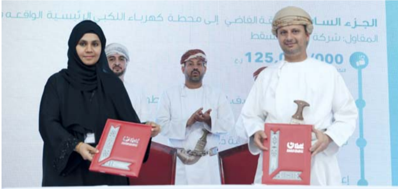
تعزيز تكامل الشبكات المحلية مع المنظومة الكهربائية العامة

مستويات السلامة، ويرفع كفاءة الأداء، ويدعم التحول نحو شبكات ذكية وأمنة ومستدامة. ويجري حالياً تنفيذ مشاريع رئيسية مصاحبة للربط بالشبكة الرئيسية باستثمارات تبلغ ١٧ مليون ريال عماني، وهي قيد التنفيذ حالياً، ومن المتوقع الانتهاء منها قبل نهاية عام ٢٠٢٧م. وتهدف هذه المشاريع إلى تعزيز تكامل الشبكات المحلية مع المنظومة الكهربائية العامة، وتحسين مرونة التشغيل واستقرار الإمدادات في مختلف ولايات محافظة الوسطى.