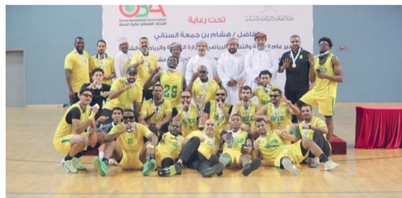
■ فرحة لاعبي السبب باللقب

نجاح فني وتنظيمي من جانبه أشاد أبو بكر الجمهوري نائب رئيس الاتحاد العماني لكرة السلة بالمستوى الفني العالي للمباراة الختامية وقال: إن تقييم أي بطولة أو