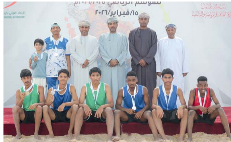
فريق صحم الحاصل على المركز الثاني

مجموعات ضمت المجموعة الأولى الرستاق والخابورة والسلام وصحم وخصب بينما ضمت المجموعة الثانية مسقط والمصنعة والعروبة ومصيرة والشباب في حين اقتضرت المجموعة الثالثة على ناديي صلالة والاتحاد قبل أن تتواصل المنافسات حتى المباراة النهائية التي شهدت تتويج مسقط بطلا للمنافسة.