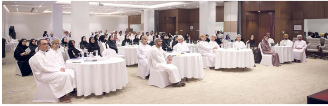
البرنامج يستهدف تطوير المهارات الفنية والإدارية للعاملين في إدارة المشاريع والعقود الحكومية

دشنت هيئة المشاريع والمناقصات والمحتوى المحلي أمس برنامج «إمكان ٣»، والذي يساهم على رفع كفاءة الكوادر الوطنية العاملة في إدارة المشاريع والعقود بمختلف الجهات الحكومية، ويحسن من منظومة تنفيذ المشاريع الحكومية وتعزيز جودة مخرجاتها.