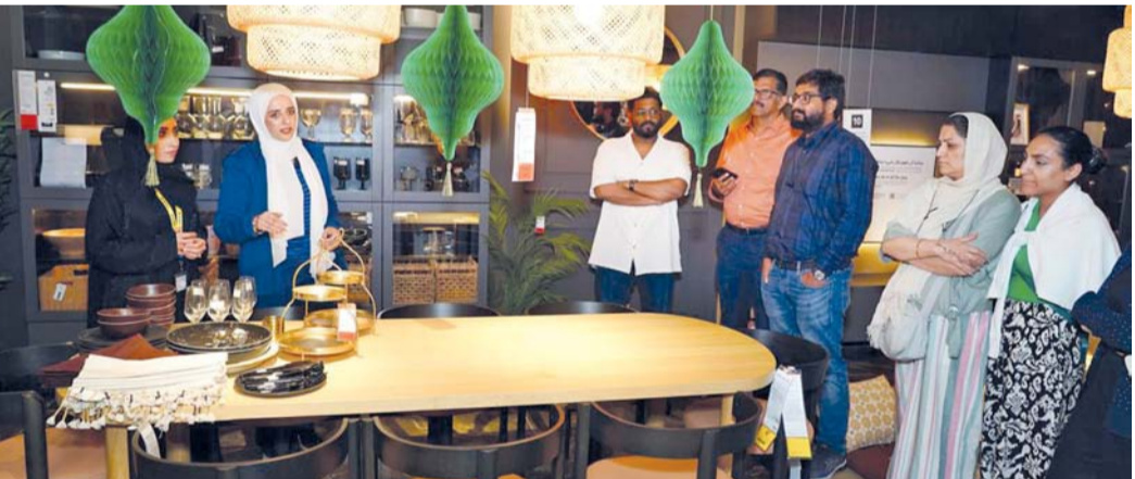
ايكيا عُمان تقدم خيارات إفطار متنوعة وبأسعار مميزة