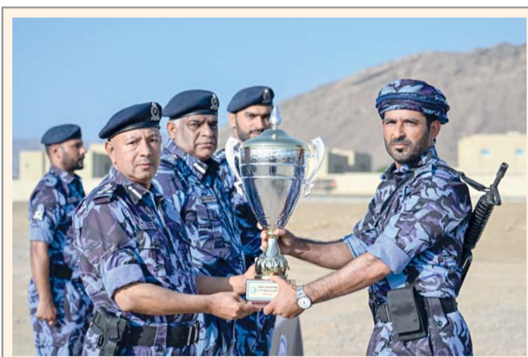
تتويج بطل المسابقة