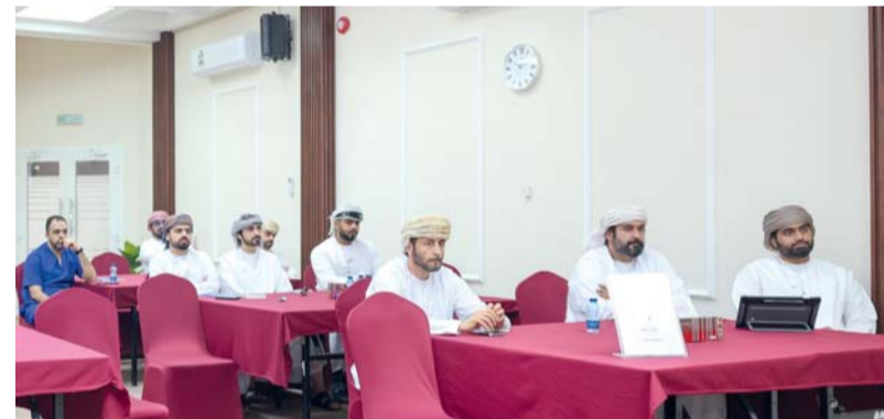
ترسيخ مفهوم الشمول الرقمي في تصميم الخدمات الحكومية

متقدمة، حيث تم تقديم تجربة حية لاستخدام الشخص الكفيف للهواتف الذكية عبر برامج قراءة الشاشة والتقنيات المسبقة للصوتية، حيث أسهم هذا المحور في تعميق فهم المشاركين للتحديات التقنية التي قد تواجه المستفيدين، وسبل معالجتها من خلال حلول برمجية مبتكرة تدعم استقلالية الفرد وترتقي بجودة حياته الرقمية.