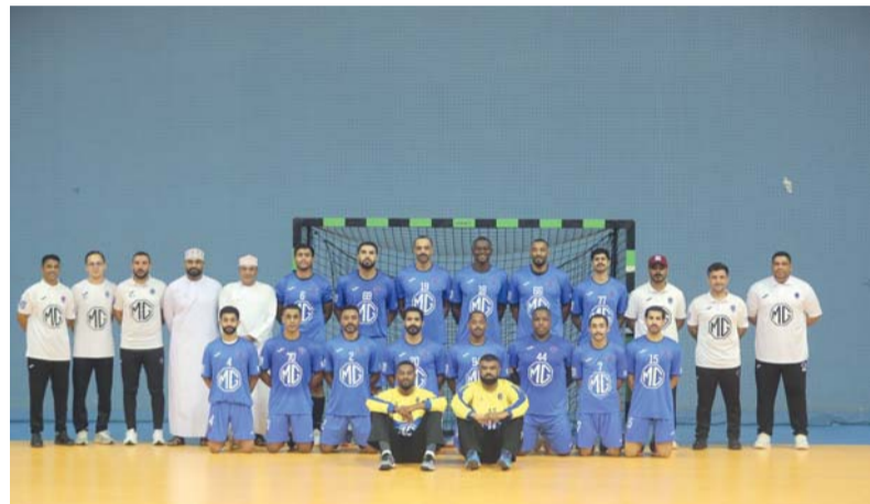
فريق كرة اليد بنادي العامرات