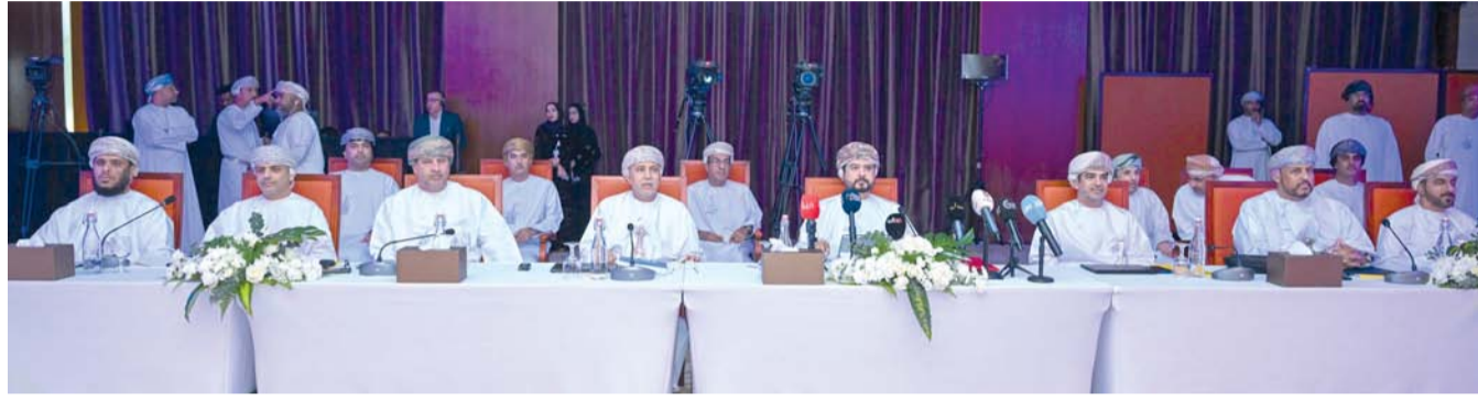
اللقاء أكد على استمرار الجهود لتهيئة بيئة استثمارية تنافسية وجاذبة لدعم التنوع الاقتصادي

جاء ذلك خلال اللقاء الإعلامي الذي عقده الهيئة أمس في فندق كراون بلازا بمدينة العرفان. وأشارت الهيئة إلى أنه جرى خلال العام الماضي التوقيع على ٣٢٥ اتفاقية استثمارية في مختلف القطاعات الاقتصادية، وطرح مساحات جديدة مهياً للاستثمار الصناعي في عدد من المناطق، ويجري العمل على تطوير المنطقة الاقتصادية الخاصة بمحافظة الظاهرة والمنطقة الاقتصادية في الروضة والمنطقة الحرة بمطار مسقط، إضافة إلى أربع مدن صناعية جديدة في الولايات: (المضيبي والسويق وشمريت ومدحا) وذلك بهدف استيعاب أنشطة صناعية متنوعة، وتعزيز قاعدة التصنيع المحلي، وإيجاد فرص عمل إضافية للشباب العماني. وخلال اللقاء الإعلامي، أكد معالي قيس بن محمد اليوسف رئيس الهيئة العامة للمناطق الاقتصادية الخاصة والمناطق الحرة، على أن الهيئة مستمرة في جهودها لتهيئة بيئة استثمارية تنافسية وجاذبة تسهم في دعم التنوع الاقتصادي وتعزيز الاستدامة المالية، مؤكداً أن استراتيجية الهيئة ورؤيتها ترتكز على ترسيخ مكانة المناطق الاقتصادية الخاصة والمناطق الحرة والمدن الصناعية كوجهة مفضلة للاستثمار، وذلك عبر تنظيم بيئة أعمال محفزة، وتقديم حوافز نوعية، وتعزيز القيمة المضافة للمشروعات. وأضاف في كلمته: إن المناطق الاقتصادية والحررة والصناعية رسخت موقعها كمحطات اقتصادية متكاملة تؤدي دوراً فاعلاً في دعم التنوع الاقتصادي وتعزيز جاذبية الاستثمار، إلى جانب تعظيم الاستفادة من اتفاقيات التجارة الحرة والشراكات الاقتصادية