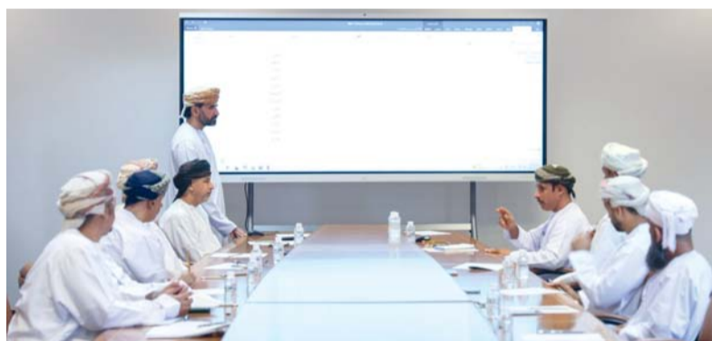
نظام العنونة يعزز التحول الرقمي المكاني في سلطنة عُمان

يعزز البعد الحضاري ويحفظ الإرث المحلي. الجدير بالذكر أن نظام العنونة الموحد يعزز التحول الرقمي المكاني في سلطنة عُمان، من خلال ترقيم المباني وتوحيد أسماء الشوارع وربط قاعدة بيانات مركزية بالتطبيقات الحكومية، مما يسهل تقديم الخدمات العامة والقطاع الخاص، ويسهم في التخطيط الجديدة تناسب مع هوية كل ولاية وتاريخها وثقافتها، بما