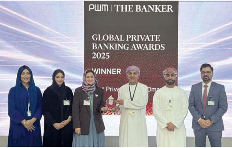
الجائزة تقديراً لدور البنك المتميزة في تعزيز تجربة الزبائن

ويأتي إطلاق «إمكان ٣» بالتوازي مع برنامج «إمكان ١» و«إمكان ٢»، ضمن عمل تطوير شامل يهدف إلى بناء قدرات وطنية قادرة على إدارة المشاريع والعقود بكفاءة عالية، وتعزيز جاهزية الكوادر الهندسية، وتحقيق الاستفادة في تنفيذ المشاريع الحكومية، بما يدعم مستهدفات التنمية ويعزز القيمة المضافة للاقتصاد الوطني، مع الحرص على رفع نسبة المحتوى المحلي للمشاريع الحكومية، وتعزيز كفاءة إدارة وتطوير المشاريع والعقود الحكومية.