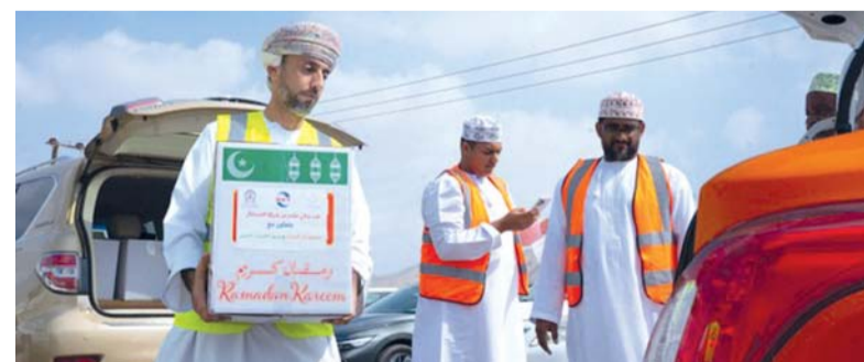
التخفيف عن الأسر التي شملها التوزيع

اعتمدت العوائل العمانية على استقبال شهر رمضان بها. وأرديفت في حديثها: لقد استفادت من تلك السلّة الرمضانية ٢٠٠٠ أسرة في الولايات التسع التي شملها التوزيع إلى جانب نيابة حمراء السدوع بولاية عبري، وقد شاركنا في ذلك مكاتب الولاية من خلال لجان التنمية الاجتماعية