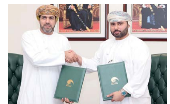
ربط المخرجات التعليمية باحتياجات سوق العمل