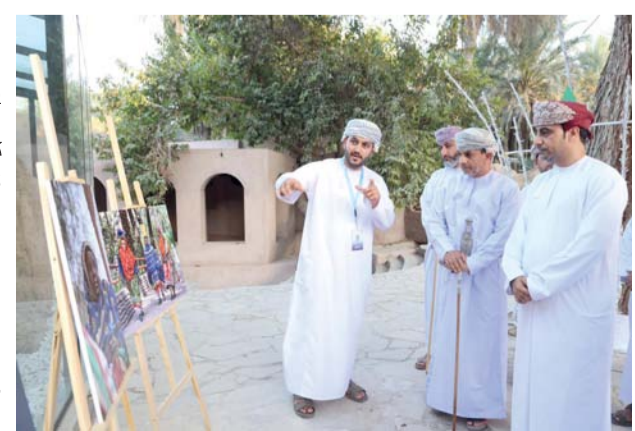
الأعمال تنوعت بين المدارس الواقعية والسريالية

ظلمت جامعة التقنية والعلوم التطبيقية كلية التربية بالرساق ممثلة بنادي الإعلام والتصوير ونادي الفنون التشكيلية بالكلية المعرض الفني الخارجي (سرمد) بولاية وادي المعاول مشى جرة الشيخ، رعى الاحتفال سعود بن سعيد المعولي نائب رئيس المجلس البلدي بمحافظة جنوب الباطنة رئيس لجنة تطوير وتنمية محافظة جنوب الباطنة. وبحضور عدد من المهتمين والمسؤولين. وشمل المعرض أكثر من ٤٠ لوحة تنوعت بين التصوير الفوتوغرافي