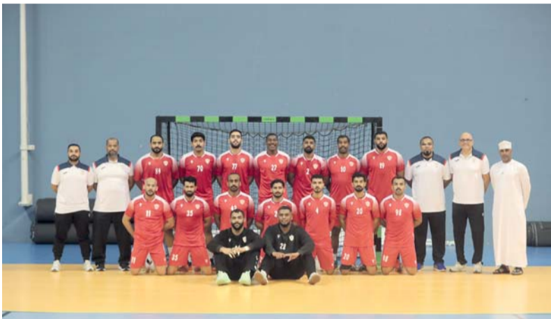
فريق كرة اليد بنادي عمان

يتصدر نادي مسقط السجل الذهبي لمسابقة درع الوزارة لكرة اليد بعد فوزه به ٨ مرات البداية من موسم ٢٠١١/٢٠١٠ و٢٠١١/٢٠١٠ و٢٠١٢/٢٠١١ و٢٠١٣/٢٠١٢ و٢٠١٤/٢٠١٣ و٢٠١٥/٢٠١٤ و٢٠١٦/٢٠١٥ و٢٠١٧/٢٠١٦ و٢٠١٨/٢٠١٧ و٢٠١٩/٢٠١٨ وفي موسم ٢٠٢٠/٢٠٢١ ونجح نادي مسقط بالفوز باللقب الثامن في تاريخه وحقق نادي عمان ٤ القاب ونادي عمان موسم ٢٠١٧/٢٠١٨ و٢٠٢٣/٢٠٢٢ و٢٠٢٣/٢٠٢٣ و٢٠٢٤/٢٠٢٣ و٢٠٢٤/٢٠٢٣ ولقبين و٢٠٢٥/ ٢٠٢٤ ونادي اهلي سداب موسم ٢٠١٢/٢٠١٣ و٢٠١٣/٢٠١٢ وموسم ٢٠١٩/٢٠٢٠ لم يستكمل بسبب جائحة كورونا كوفيد ١٩. وتم توزيع الجوائز المالية على نادي مسقط ونادي عمان بعد التأهل الى المباراة الختامية.