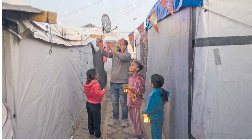
فتيات فلسطينيات يحملن فوانيس رمضان، بينما يقوم شاب بنصب الزينة بجوار خيامهم في مخيم البريج للاجئين وسط قطاع غزة.

المقبل. وكتب الرئيس ترامب، ٢٠٢٦ نحو ٧٢٠٦١ شهيداً في منشور عبر منصفته (تروث سوشال): «في ١٩ فبراير ٢٠٢٦، سأنضم مجدداً إلى أعضاء مجلس السلام، حيث سنعلم أن الدول الأعضاء قد تعهدت بتقديم أكثر من ٥ مليارات دولار لدعم الجهود كبير خلال اجتماعه الافتتاحي في واشنطن المقرر عقده الخميس ١٧ فبراير ٢٠٢٦. من ناحية أخرى أعلن الرئيس الأمريكي دونالد ترامب، أن «مجلس السلام» المشكل حديثاً سيكشف عن حزمة مساعدات إنسانية وإعادة إعمار لغزة، إلى جانب التزام أمريكي دولي الإنساني وإعادة إعمار غزة، كما خصصت آلاف الأفراد لقوة