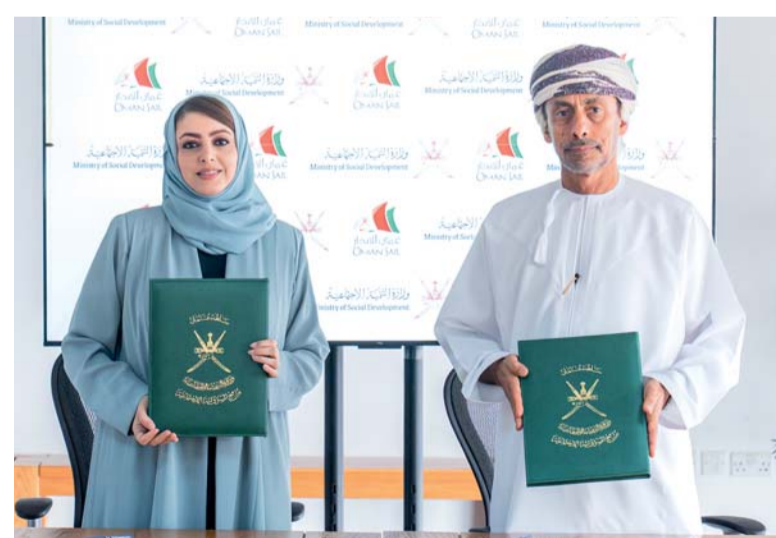
توقيع تعاون بين وزارة التنمية الاجتماعية وعمان للإبحار

ويستهدف البرنامج ١٦ طالباً تتراوح أعمارهم بين ١٠ و١٦ عاماً، يتم ترشيحهم من قبل الوزارة، على أن يُقسّموا إلى مجموعتين لضمان تحقيق أعلى مستوى من الاستفادة لكل مشارك. ويمتد البرنامج لثلاثة أيام لكل مجموعة، ويجمع بين ورش تدريبية تركز على تعزيز الثقة بالنفس وتنمية مهارات التواصل والعمل الجماعي، إلى جانب تجربة عملية في رياضة الإبحار الشراعي.