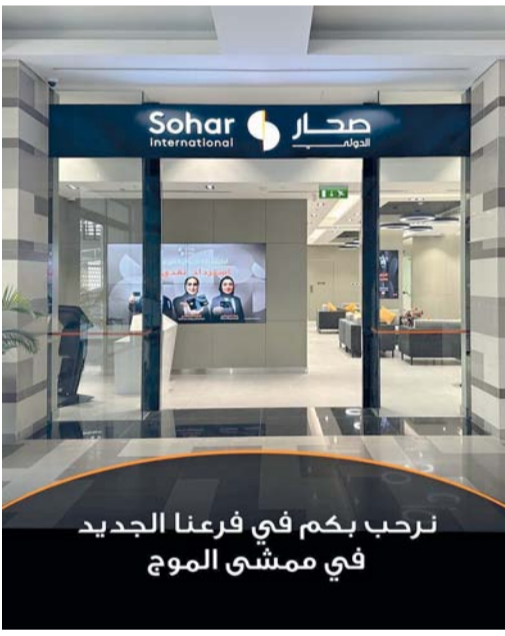
الفرع الجديد يقدم باقة متكاملة من الخدمات المصرفية

ويعكس تواجدنا في الموج نهجاً مدروساً قائماً على تحليل البيانات في توسيع شبكة فروع البنك، من خلال تقديم خدماتنا ضمن مجتمعات نابضة بالحياة تنسجم فيها أنماط المعيشة مع الأنشطة التجارية والحراك الاقتصادي، ويتيح لنا هذا الفرع تعميق مستوى التفاعل، وتعزيز الدور الاستشاري، وتقديم تجربة مصرفية متكاملة تركز على العلاقة المستدامة مع الزبائن. ويقدم فرع الموج باقة متكاملة من الخدمات المصرفية التي يلبي من خلالها احتياجات الزبائن من فئتي الأفراد والشركات، سواء في معاملاتهم اليومية أو متطلباتهم المالية الأكثر تخصصاً.