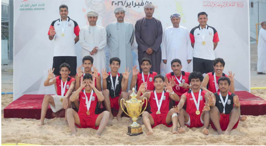
راعي المناسبة والحضور مع لاعبي نادي مسقط المتوج بالمركز الأول

وجاءت المباراة النهائية جيدة المستوى وشهدت منافسة بين الفريقين حيث فرض نادي مسقط أفضليته منذ البداية مستفيداً من الجاهزية البدنية والفنية العالية للاعبين ونجح في السيطرة على مجريات شوطي اللقاء ورغم محاولات نادي صحم للعودة وتقليص الفارق إلا أن التنظيم الدفاعي والتكتيك العالي للاعبين مسقط حالاً دون ذلك لينتهي الفريق الشوط الأول متقدماً ١٠/٢٢ ويواصل تفوقه في الشوط الثاني وسط تألق جماعي للاعبين ليحسم هذا الشوط بنتيجة ١٢/٢٢ والمواجهة بنتيجة (٠/٢) ويتوج باللقب. ويأتي تنظيم دوري الناشئين لكرة اليد الشاطئية ضمن خطط الاتحاد العماني لكرة اليد لتوسيع قاعدة الممارسة في اللعبة وإعداد جيل واعد من اللاعبين خاصة أن كرة اليد الشاطئية أصبحت إحدى الركائز الأساسية في برامج الاتحاد في ظل مشاركات المنتخب الوطني في البطولات الآسيوية وكأس العالم ويسعى الاتحاد من خلال هذه المسابقات إلى تكوين قاعدة مستقبلية تدعم المنتخب الوطني خلال السنوات المقبلة.