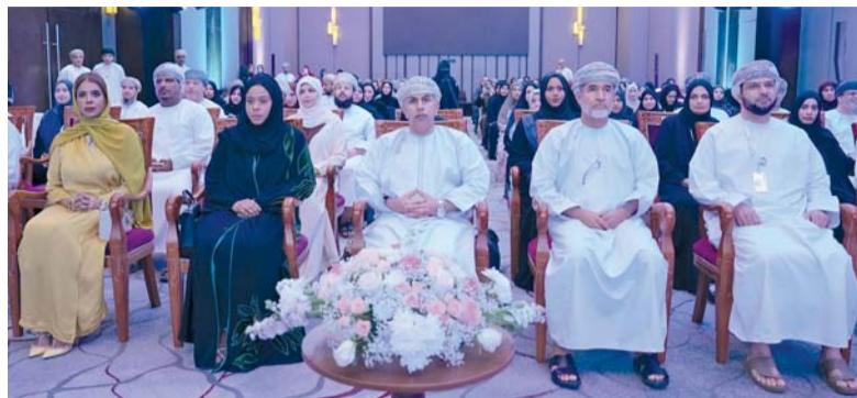
الحضور في حفل ملتقى القيادات

الجهود المبذولة على مختلف المستويات، بدءاً من تطوير البنية التحتية، مروراً برفع كفاءة الكوادر الصحية، وصولاً إلى تبني المبادرات النوعية التي عززت كفاءة التشغيل وجودة الرعاية.