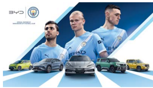
يحظى النادي بقاعدة جماهيرية عالمية

خطوة في استراتيجية بي واي دي لترسيخ وجودها في عالم كرة القدم الدولي، بهدف تعزيز الوعي بعلاقتها التجارية وسياراتها ومنتجاتها التقنية الأخرى. سبق للشركة أن كانت الراعي الرسمي لبطولة أمم أوروبا ٢٠٢٤ وبطولة أوروبا تحت ٢١ سنة ٢٠٢٥. وعلقت ستيفانيا لي نائبة الرئيس التنفيذي لشركة بي واي دي قائلة: يمثل مانشستر سيتي التميز والابتكار والشجاعة لتجاوز الحدود، وهي قيم متصلة في جوهر بي واي دي. تتجاوز هذه الشراكة مجرد كرة القدم أو النقل؛ فهي تهدف إلى إلهام الناس حول العالم من خلال تكنولوجيا تثير الحماس وتسهل التواصل وتسهم في بناء مستقبل أكثر استدامة. عندما يلتقي الابتكار بالشغف، يكون التأثير عالمياً بحق.