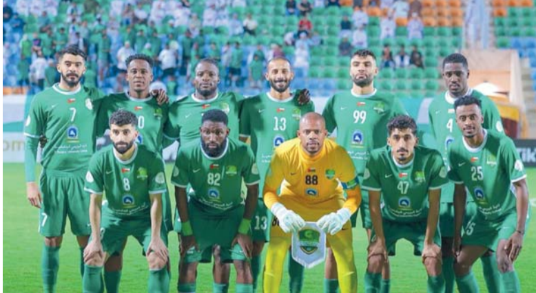
■ الفريق الكروي بنادي النهضة