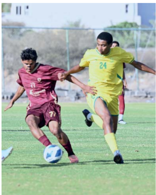
■ من اللقاء الذي جمع ناديي إزكي والسيب