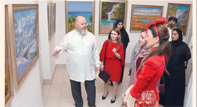
برنامج ثقافي وفني متنوع يعكس ثراء التراث والإبداع الحديث