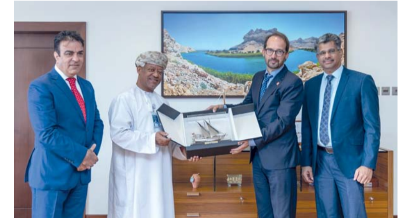
البنك يرسخ مكانته بين المؤسسات المحلية وأولويات التنمية الوطنية

ومع استمرار تلبيةه لتطلعات زبائنه بالتوازي مع التحول الرقمي، يواصل البنك التزامه بنموذج متوازن يدمج