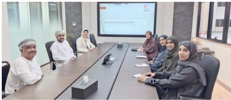
تحقيق جودة حياة أفضل للمستفيدين من الخدمات

القائمة، والتطلعات المستقبلية، إضافة إلى استعراض أهم التحديات والإجراءات المتخذة لمعالجتها، بما يعزز استدامة الخدمة وجودتها.