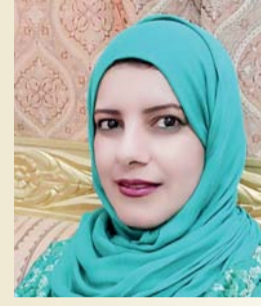
بدرية البدرية شاعرة عمانية

الشاعرة العمانية كاملة بنت جمعة البلوشية من الشعراء العمانية البارزات لمساهماتها في المناسبات والمحافل الأدبية والشعرية واهتمامها بالموروث الشعبي، لديها ملكات فكرية في مجالات شعر الميدان والسبع والرزحة والتشحشح واميم وابو زلف، والأشعار المغناة بجانب مشاركتها المتعددة في الأمسيات والمثاقبات الأدبية محليا وخليجيا واقليميا. تقول (البلوشية) عن بدايتها الشعرية: بان الشعر موهبة ولدي الشغف لكتابة النصوص الشعرية منذ الصغر وأنا في مقاعد الدراسة، وقد صقلت موهبتي بالمطالعة والمشاركات في المنتديات واللقاءات الشعرية ومع الاستمرار في رحلة العطاء مع الشعر، استطعت