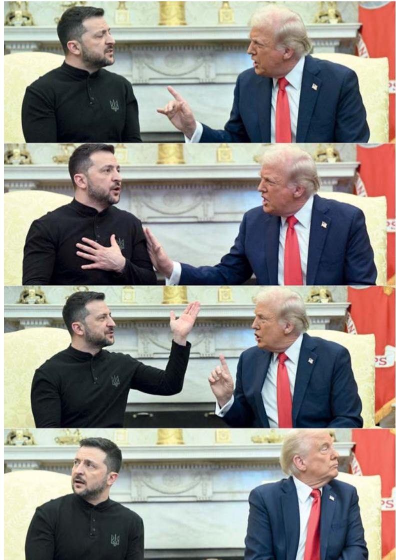
صورة مركبة للقطات تظهر ردود أفعال الرئيس الأميركي دونالد ترامب والرئيس الأوكراني فولوديمير زيلينسكي خلال المشادة التي جرت أثناء اجتماعهما في المكتب البيضوي بواشنطن أمس الأول.

واشنطن. أ.ف.ب: سار كل شيء على ما يرام عندما خرج الرئيس الأميركي دونالد ترامب لاستقبال نظيره الأوكراني فولوديمير زيلينسكي في البيت الأبيض، لكن في الداخل، ساءت الأمور بشكل مفاجئ وبسرعة مذهلة. أشعل نائب الرئيس