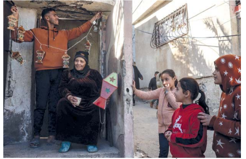
أطفال يتابعون شاباً يُعلق زينة شهر رمضان المبارك في خان يونس بجنوب قطاع غزة.

لم يجد الفلسطينيون من بدأ لاستقبال شهر رمضان الفضيل بالفرح والسرور والسعادة، وإظهار غزوة بكامل حلتها وجمالها وتزيين جدرانها المدمرة وتنظيف شوارعها التي ملأها الركام وبقياء الدمار، وذلك بشعار «غزة أجمل بأيدينا» لتكشف العزيمة والمبادرات التي حملها أهل القطاع على عاتقهم حجم الفرح والسرور الذي غمر القطاع بعد إعلان يوم السبت أول أيام شهر الصيام. وأطلقت بلديات غزة بالتعاون مع المجتمعات المحلية مبادرة «غزة أجمل بأيدينا» تعبيراً عن السعادة والفرح بحلول الشهر الفضيل، وامتلأت الأسواق بزينة رمضان التي يسعد بشرائها أهل