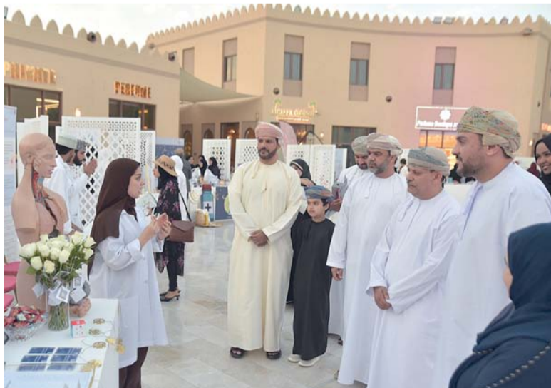
الفعاليّة ركّزت على تناول أدوية الأمراض المزمنة

الأمراض المزمنة بشكل عام وأدوية الضغط والسكري والأدوية النفسية والمضادات الحيوية بشكل خاص خلال الشهر الفضيل، وذلك للمرضى المصابين بالأمراض المزمنة وطرق التغلب على الجوانب السلبية لاستخدام الدواء ووسائل المحافظة على الصحة خلال فترة الصيام، كما اشتملت