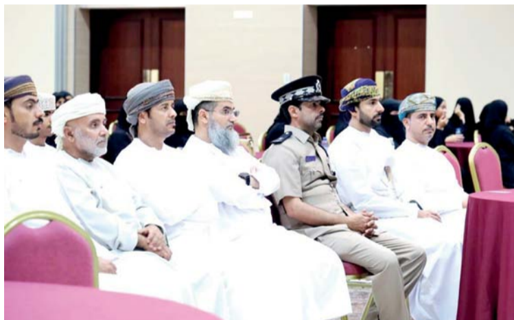
تعزيز الوعي المجتمعي حول حقوق الأطفال

وأشار سموه إلى وجود تعاون مع وزارة التربية والتعليم لدعم الموهوبين في سن مبكرة، مؤكداً رغبة الوزارة في اكتشاف المواهب سواء كانت ثقافية أو رياضية. وقال سموه: التركيز في الوقت الراهن على مشروع المدينة الرياضية المتكاملة والمكون الأساسي فيها استاد رياضي لكرة القدم، مما يعطي المجال