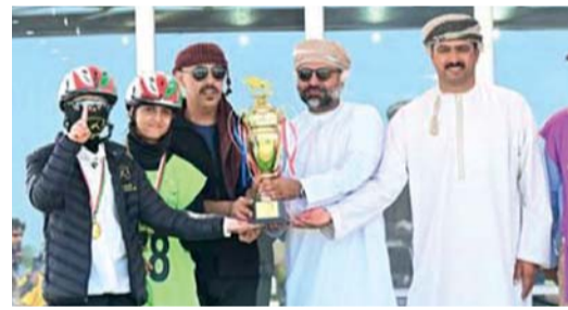
تتويج الشقصية بالمركز الأول في سباق القدرة

لقدرة والتحمل بولاية بركاء، تحت رعاية خالد محمد زمان الرئيس التنفيذي لمجموعة شركات الزمان بحضور عدد من أعضاء مجلس إدارة الاتحاد واشتملت المنافسة على سباق محلي لمسافة ١٠٠ كم، حيث وصل عدد المشاركين إلى ٦٧ خيلا في السباق المحلي لمسافة