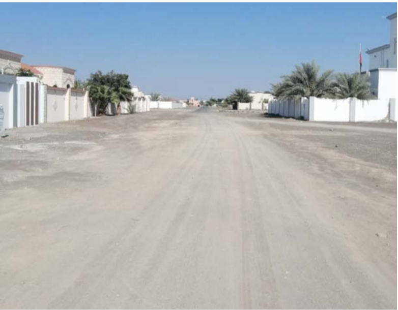
الطريق يربط بين عدد من القرى

الطريق عند هطول الامطار. تعزيز التواصل الاجتماعي اسما محمد بن عبدالله بن بخت الغافري فيقول رصف الطرق في المخططات السكنية تعمل على تنميتها عمرانيا واجتماعيا ولها ايجابية كبيرة في الاصحاح البيئي وتسهيل العبور امام الحركة المرورية، كذلك انها تعزز من التواصل بين افراد المجتمع ويحدونا الامل بان يتم النظر في طلبنا حول رصف طريق مساكننا وايصاله بطريق الخدمات بالبلدة وهذا مطلب ينتشده جميع الاهالي بالمخطط.