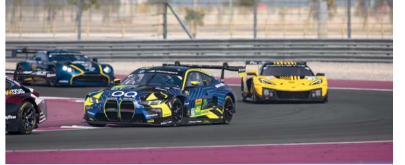
الحارثي أثناء مشاركته في سباقات الجولة الأولى لبطولة العالم للتحمل

تأهل ناديا أهلي سداب ونادي عمان إلى المباراة النهائية لدوري الدرجة الأولى لكرة اليد للموسم الرياضي ٢٠٢٤ / ٢٠٢٥ حيث جاء تأهل نادي أهلي سداب اثر تفوقه على نادي مسقط ٢٥/٣١ في المباراة التي جمعت الفريقين مساء امس الاول على ملعب الصالة الرياضية بنادي الامل ضمن منافسات دور النصف النهائي لدوري الشوط الاول انتهى بتقديم أهلي سداب بنتيجة ١٢/١٨ حيث استطاع ان يفرض سيطرته على مجريات هذا الشوط لعبا ونتيجة بعدما نجح مدرب أهلي سداب في إعادة ترتيب اوراق الفريق من جديد وتصحيح مساره، بعدما حل في المركز الرابع بالدور الثاني في الدوري واستطاع خلال فترة توقف منافسات الدوري بسبب مشاركة نادي عمان والسيب في البطولة الخليجية التي استضافتها سلطنة عمان مؤخرا نجح في معالجة الاخطاء التي وقع فيها اللاعبون في المرحلة الاول بالدور وتمكن من الوصول الى المباراة النهائية لدوري لمقابلة نادي عمان