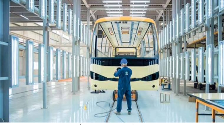
زيادة تدفقات الاستثمار الأجنبي المباشر لسلطنة عُمان بنسبة ١٧,٦ بالمائة

جاءت النتائج المالية لشركة أوكيو للاستكشاف والإنتاج لتعزز الموقع القوي للشركة في قطاع الطاقة في سلطنة عمان، خاصة وأن الشركة تتمتع بمحفظة قوية، تشمل ٥٥٪ من الغاز و ٤٥٪ من النفط، فقد حققت أوكيو للاستكشاف والإنتاج أرباحاً قبل الفوائد والضرائب والإهلاك والإطفاء بقيمة نحو ٦١٤ مليون ريال عماني، في عام ٢٠٢٤م. كما حافظت الشركة على نسبة ٢٤ بالمائة كعائد على رأس المال المشغل وحققت عائدات قوية بلغت ٨٤١,٢ مليون ريال عماني لعام ٢٠٢٤، فيما بلغت التدفقات النقدية الحرة ٢٥١ مليون ريال عماني مما يعزز ريادتها في قطاع الاستكشاف والإنتاج بمحفظة استراتيجية تضم ١٤ منطقة امتياز. وهذه النتائج تعزز من موقع الشركة في قطاع الطاقة حيث أنها ستدعم خطط التطوير للشركة والتي منها مشاريع رادة مثل مشروع مرسى لتزويد السفن بالغاز الطبيعي المسال والذي يتم بناؤه حالياً في صحار بالإضافة وحقل غريف بمنطقة امتياز ٦٠ ومحطة مسندم للغاز التي تمكنت من إنتاج كميات أعلى من الغاز. كما أن هذه النتائج التي تؤكد قدرة الشركة على تشغيل أصول عالية الجودة بتكاليف أقل وكذلك الإعلان عن خطط لتوزيع عوائد على رأس المال في صورة توزيعات أرباح، مستهدفة توزيع أرباح أساسية بقيمة ٢٣٠,٧ مليون ريال عماني لعامي ٢٠٢٥ و ٢٠٢٦م، وسيجعل من أسهم الشركة ووجهة للمستثمرين في بورصة مسقط ما يميز من جاذبية الاستثمار في الأسواق المالية العمانية.