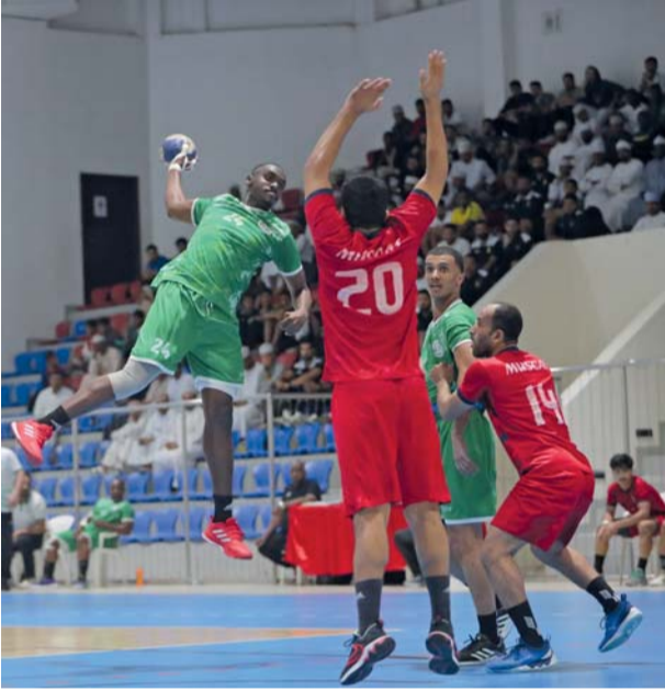
من مباراة أهلي سداب ومسقط

غدا الاثنين في الساعة التاسعة والنصف مساء على ملعب الصالة الرياضية بجمع السلطان قابوس الرياضي ببوشر . وفي المباراة الثانية تأهل نادي عمان بعد فوزه على نادي السيب بنتيجة ٢٨/٣٠ في المباراة التي جرت أحداثها مساء امس الاول على الصالة الرياضية بملعب نادي الامل ضمن منافسات الدور النصف النهائي للدوري الشوط الاول انتهى بتقديم نادي عمان ١١/١٢ وقدم الفريقان مباراة جيدة سعى كل منها الى الخروج من اللقاء فائزا بهدف الوصول الى المباراة النهائية وفي الشوط الثاني تواصلت الاثارة بين الطرفين لتنتهي لصالح نادي عمان بنتيجة ٢٨/٣٠ . وتقام اليوم مباراة تحديد المركزين الثالث والرابع بين نادي مسقط والسيب في الساعة التاسعة مساء على ملعب الصالة الرياضية بجمع السلطان قابوس الرياضي ببوشر، حيث يلطمح كل منها الحصول على المركز الثالث بعدما فقد المنافسة على المركز الأول في الدوري.