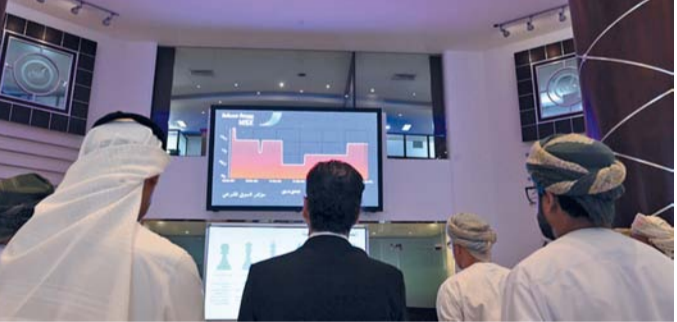
شركات المساهمة العامة تبدأ الأسبوع الجاري إقرار توزيعات الأرباح

الذي تبحث فيه توزيع أرباح نقدية بنسبة ١٠ بالمائة أيضاً، وفي الخامس من مارس الجاري تعقد شركة «شل العمانية للتسويق» اجتماع الجمعية العامة العادية السنوية الذي تبحث فيه توزيع أرباح نقدية بنسبة ٣٧ بالمائة، وفي السادس من مارس الجاري يبحث مساهمو شركة «مسندم للطاقة» توزيع أرباح نقدية بنسبة ١٣,٨ بالمائة، وشهدت بورصة مسقط الأسبوع الماضي تنفيذ ٤٤١٦ صفقة مقابل ٤٠٩٦ صفقة تم تنفيذها في الأسبوع الذي سبقه، وسجلت قيمة التداول تراجعاً بنسبة ١٣ بالمائة لتعيق ٢٠,٦ مليون ريال عماني إلى ١٧,٧ مليون ريال عماني، وجاءت «أوكيو للاستكشاف والإنتاج» في مقدمة الشركات الأكثر تداولاً من حيث قيمة التداول بعد أن شهدت تداولات بقيمة ٤ ملايين و ٢٩٤ ألف ريال عماني مستحوذة على ٢٤,١ بالمائة من إجمالي قيمة التداول.