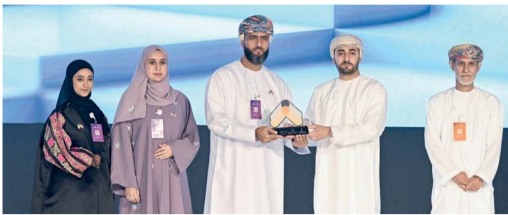
تكريم الفائزين في مبادرة «صناع الأفكار» في نسختها الثانية

وأكد سعادته على التزام سلطنة عُمان بجميع الاتفاقيات والبروتوكولات التي تعنى بالبيئة والتغير المناخي ومواكبتها القضايا العالمية من أجل ضمان تحقيق أهداف كبح تغير المناخ، ودعم تبني الحلول وتوسيع نطاقها.