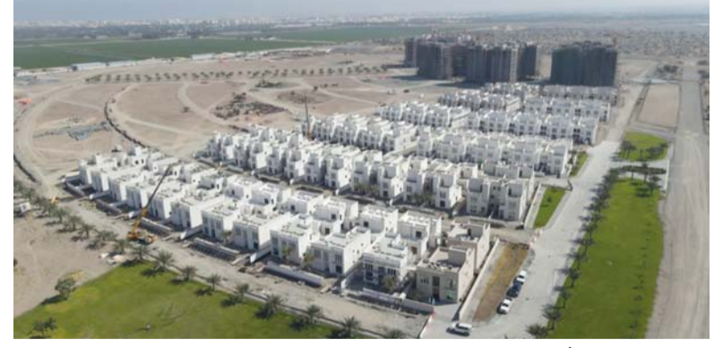
بنك الإسكان العماني ملتزم بمواصلة تقديم الحلول التمويلية المبتكرة لدعم التنمية العمرانية

السكنية. وأكد على التزام بنك الإسكان العماني بمواصلة تقديم الحلول التمويلية المبتكرة التي تدعم التنمية العمرانية في سلطنة عمان، وتعزز من جودة الحياة للمواطنين، بما يتماشى مع الأهداف الوطنية الرامية إلى توفير بيئة سكنية مستدامة ومتكاملة. وأوضح أن البنك يعمل على إجراء تحديثات شاملة على خدماته ومنتجاته، مستهدفاً تعزيز وتوفير حلول إسكانية مبتكرة، منوهاً إلى أن البنك يستعد خلال الفترة المقبلة