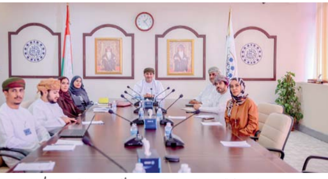
عروض مرئية حول الامتياز التجاري وأثره على الاقتصاد العُماني

وتأهيل الشركات العُمانية، ومكثها من توقع العديد من الافتاقيات، مما عزز من قدراتها التنافسية وتوسيعها محلياً ودولياً. وناقش الاجتماع أهمية تأسيس مركز الامتياز التجاري لتعزيز ثقافة الامتياز التجاري في سلطنة عُمان، كما تم تقديم عروض مرئية حول الامتياز التجاري وأثره على الاقتصاد العُماني، وأهم الخدمات التي تقدمها الشركة في إطار عملها مع برنامج الامتياز التجاري، والحملة التسويقية للعلامات التجارية في سلطنة عُمان.