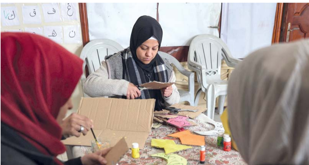
فلسطينيات تصنعن زخارف على شكل «فانوس رمضان» في مدينة غزة

المقاومة في الضفة الغربية حيث وقع خلال ٢٤ ساعة ١٥ عملا مقاوما ضد جنود الاحتلال والمستوطنين. ووفق مركز معلومات فلسطين «معطي» ٥ عمليات إطلاق نار، وعمليات تفجير عبوات ناسفة، وإعطاب آلية عسكرية، والإضرار بإحدى مركبات المستوطنين، والتصدي لاعتدائين من قبل المستوطنين، واندلاع مواجهات وإلقاء حجارة في ٥ نقاط متفرقة بالضفة. وتصدى فلسطينيون لاعتداءات المستوطنين في بلدة نعلين برام الله، تزامنا مع تنفيذ عملية إطلاق نار، إلى جانب عملية أخرى في قباطية، وإعطاب آلية عسكرية. وأطلق مقاومون النار صوب قوات الاحتلال