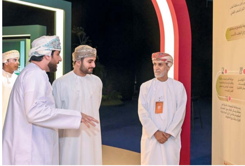
... ويتجول في المعرض المصاحب للجمهور