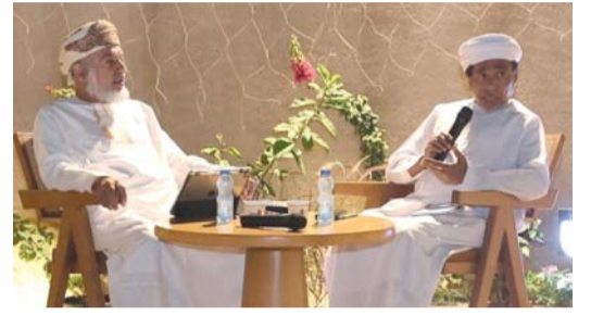
المشاركة في محاضرة الثقافة العمانية قبل الإسلام

المشاركين في محاضرة الثقافة العمانية قبل الإسلام