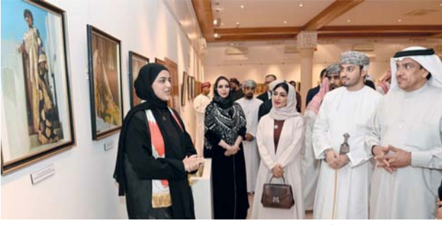
الفعالية تأتي في إطار تعزيز التبادل الثقافي بين البلدين الشقيقين

أحمد الكعبي سفير مملكة البحرين لدى سلطنة عُمان في كلمته يعمق العلاقات البحرينية العُمانية، وتعكس توجهات القيادتين الحكيمتين نحو مزيد من التقارب والتكامل في مختلف المجالات التنموية. ووضح سعادته أن فعالية (الأيام الثقافية البحرينية) تجسد نهج الدبلوماسية الثقافية الذي تتبناه مملكة البحرين، كجزء من استراتيجيتها في تعزيز العلاقات الدولية عبر الثقافة والفنون وإقامة هذه الفعالية تعكس تنفيذ مذكرات التفاهم والاتفاقيات التي أبرمت خلال الزيارات المتبادلة للقيادتين، وتدعم مخرجات