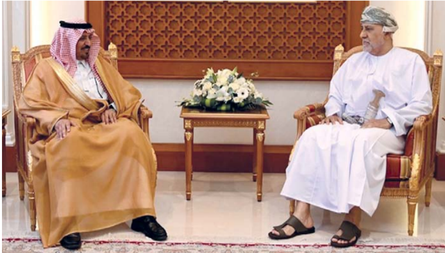
شهاب بن طارق أثناء استقباله إبراهيم سعد بيشان

مسقط. العُمانية: استقبل صاحب السمو السيد شهاب بن طارق آل سعيد نائب رئيس الوزراء لشؤون الدفاع بمكتبه بمعسكر المرتفعة أمس سعادة إبراهيم سعد بيشان سفير