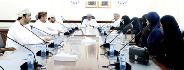
اللجنة ناقشت خطة عملها القادمة

لجنة الشركة الطلابية بفرع الغرفة بمحافظة جنوب الشرقية وHilo papel شركة طلابيه من الكلية المهنية بصور وهي أول شركة عمانية مختصة في إعادة تدوير الورق المهر إلى ألياف لصنع خيوط والابتكار.