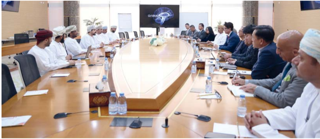
المشاريع ستسهم في ترسيخ مكانة سلطنة عُمان كمركز صناعي متطور على المستويين الإقليمي والعالمي

متخصص في رقائق أشباه الموصلات، التي تُعد أساساً لتقنيات الثورة الصناعية الرابعة والذكاء الاصطناعي، ويهدف المشروع إلى نقل المعرفة والخبرات، إلى جانب تأهيل الكوادر المحلية من خلال إنشاء مركز متخصص للتدريب والترقية في قطاع الصناعات التحولية، مما يساهم في تعزيز تنافسية السلطنة على الصعيد الصناعي.