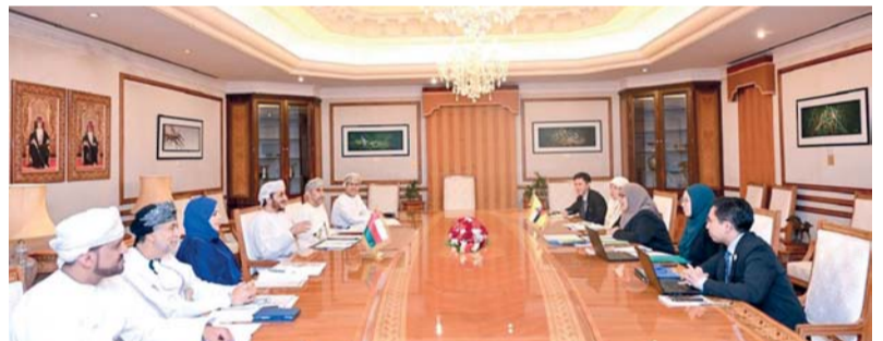
الجلسة ناقشت مجالات التعاون الاقتصادي والثقافية

مسقط. العُمانية: عقدت سلطنة عُمان وبروناي دار السلام جلسة المشاورات بينهما في دورتها الـ (٢٣)، وذلك في ديوان عام وزارة الخارجية. وقد ترأس الجانب العُماني سعادة الشيخ خليفة بن علي الحارثي وكيل وزارة الخارجية للشؤون السياسية، فيما ترأس من الجانب البرونايي سعادة بانغيران نور هشيمية بنت بانغيران محمد السكرتير الدائم بوزارة الشؤون الخارجية.