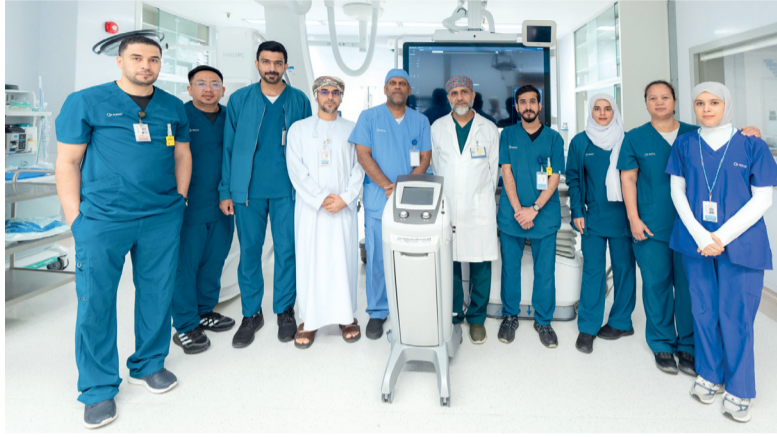
الفريق الطبي بالمدينة الطبية الجامعية