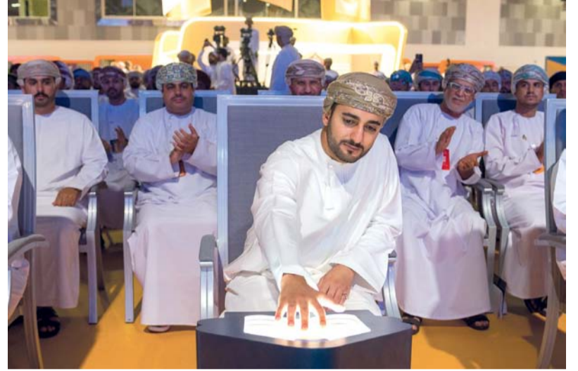
■ ذي يزن بن هيثم أثناء افتتاح الملتقى

الموحدة للخدمات الإلكترونية وهي بوابة رقمية مركزية موحدة لتقديم كافة الخدمات الحكومية الرقمية في سلطنة عُمان دون الحاجة للذهاب إلى مقر الوحدات الحكومية لإنجاز المعاملات سواء للأفراد أو قطاع الأعمال. وأكد معالي الشيخ الفضل بن محمد الحارثي أمين عام مجلس الوزراء في كلمته على أنّ ملتقى «معا نتقدم» يهدف إلى تعزيز الشراكة المجتمعية من خلال الحوار المباشر بين الحكومة والمجتمع عملاً بالنهج السامي لجلالة