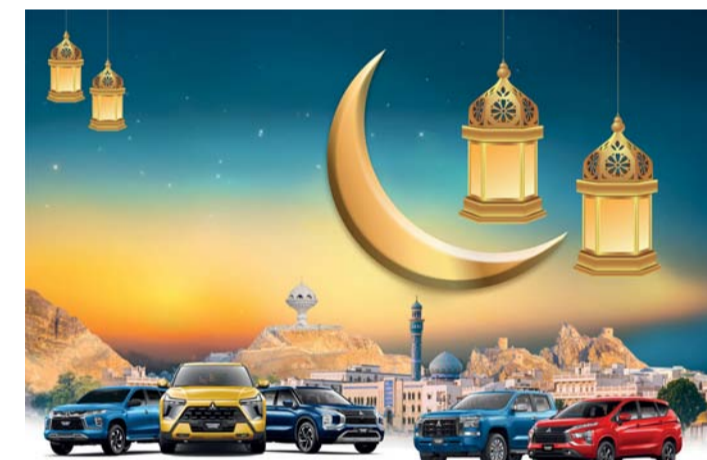
تشكيلة مميزة من ميتسوبيشي موتورز

احتياجاتهم وطموحاتهم وتقدم سيارة أوتلاندر حرفية متقنة وتقنيات متقدمة بينما مزج سيارة مونتيرو سبورت بين القوة والأناقة لتناسب القيادة في المدينة والمغامرات على الطرق الوعرة وتتمتع إكسפורس الجديدة كلياً بحضورها القوي والديناميكي في فئة السيارات الرياضية متعددة الاستخدامات مع أسلوبها المبتكر ومروريتها الاستثنائية كما سنجد العائلات الخيار المثالي بتصميمها الواسع ذي السبعة مقاعد بينما تبقى سيارة البيك