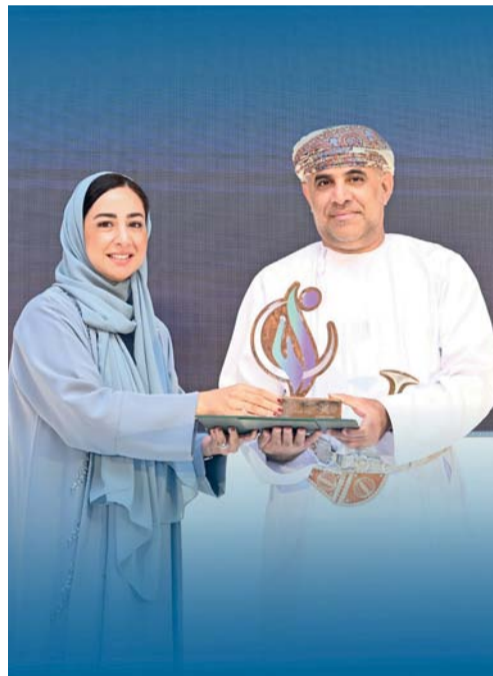
البنك الأهلي يؤكد التزامه بدعم المجتمع