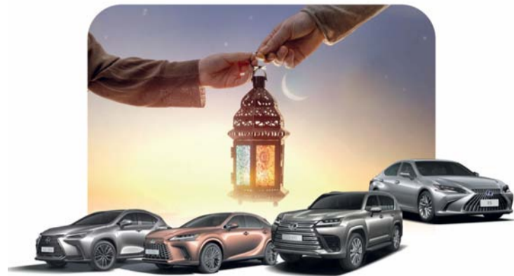
عروض رمضان رائعة على تشكيلة متنوعة من لكزس

مسقط. العمانية: نظمت غرفة تجارة وصناعة عُمان أمس منتدى الأعمال العماني الأوزبكي، لتعزيز التبادل التجاري والاستثماري، واستكشاف فرص التصدير والاستيراد بين البلدين، وذلك في المقر الرئيسي للغرفة. يأتي إقامة المنتدى على هامش زيارة وفد صاحبات الأعمال من جمهورية أوزبكستان الذي ترأسه نادرة شاه ترسونوفا نايبة رئيس غرفة التجارة في أوزبكستان، ويضم حوالي ٢٠ صاحبة أعمال أوزبكستانية، يمثلن قطاعات العقار والتصميم والهندسة الكهربائية والمنسوجات والتعليم الخاص والطب والتصدير والاستيراد.