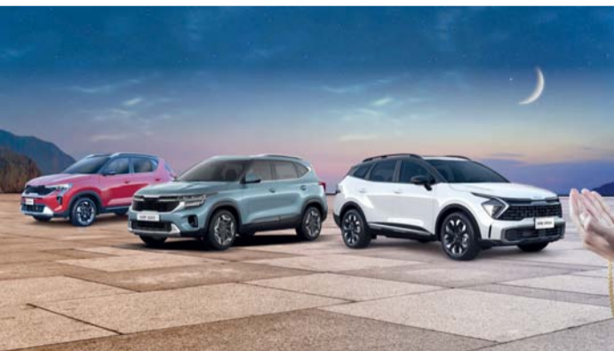
تشكيله سيارات كيا بمزايا حصرية خلال شهر رمضان

عجلات يبلغ طولها ٢٧٥٥ مم وحجرة الأمتعة التي تبلغ سعنها ٥٤٣ لترا. ويتوفر الطراز الأول بمحرك سعة ٢.٠ لتر ينتج ٢٣٣ حصانا، بينما يتميز الطراز الثاني بمحرك سعة ١.٥ لتر ينتج ١٩٧ حصانا وكلاهما مقترن بناقل حركة التناقل عبر السلك ذو ٨ سرعات ومزود بوظيفة الدفع الرباعي حيث توزع السيارة الرياضية متعددة الاستخدامات الطاقة دون المساومة على الأداء أو الفخامة. وتجمع سيارة كيا سونيت PE طراز ٢٠٢٥ بين التصميم العصري والوظائف، مما يجعلها خيارا مثاليا للاستخدام الحضري والعائلي استنادا إلى مجموعة