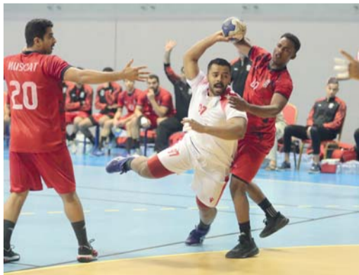
من منافسات دوري اليد

تقام يوم غد الجمعة مباراتان في الدور النصف النهائي لدوري الدرجة الأولى لكرة اليد للموسم الرياضي ٢٠٢٤/٢٠٢٥م بعد ختام مشاركة نادي عمان والسيب في البطولة الخليجية الـ ٤١ للأندية أبطال الكؤوس لكرة اليد التي استضافتها سلطنة عُمان ممثلة بنادي عُمان، حيث يلتقي في المباراة الأولى مسقط مع اهلي سداب في الساعة التاسعة والنصف مساء على ملعب الصالة الرياضية بنادي عمان تليها على نفس الصالة المباراة الثانية بين نادي عمان والسيب في الساعة الحادية عشرة والنصف مساء والفائز من المبارتين يتأهل الى المباراة النهائية التي ستقام يوم الاثنيين القادم بالصالة الرئيسية بمجمع السلطان قابوس الرياضي ببوشر، أما الخاسران سوف يلعبان مباراة تحديد المركزين الثالث والرابع يوم الأحد القادم في الساعة التاسعة والنصف مساء على ملعب الصالة الرياضية بمجمع السلطان قابوس الرياضي ببوشر.