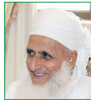
يجيب عن أسئلتكم سماحة الشيخ العلامة أحمد بن حمد الخليفي المفتي العام للسلطنة

كيف تستطيع المرأة إيصال فكرة التصور لبناء الجيل القرآني من خلال أسلوب تربوي؟ وسؤال آخر، ما معنى التصور القرآني؟