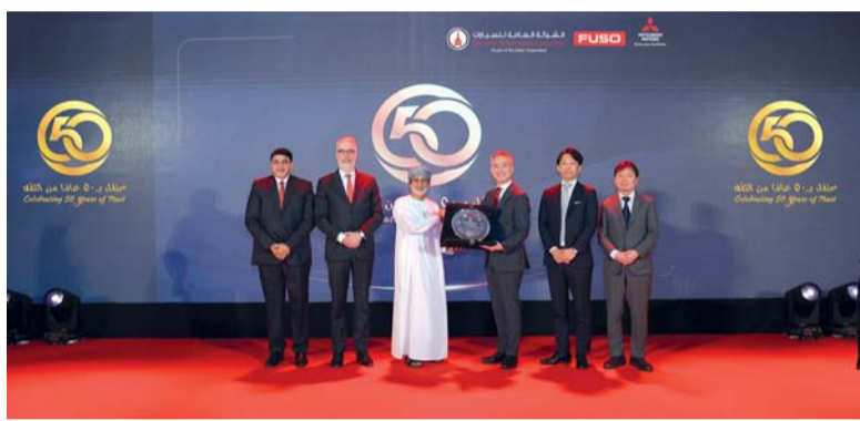
صورة جماعية لعدد من المشاركين في الاحتفالية