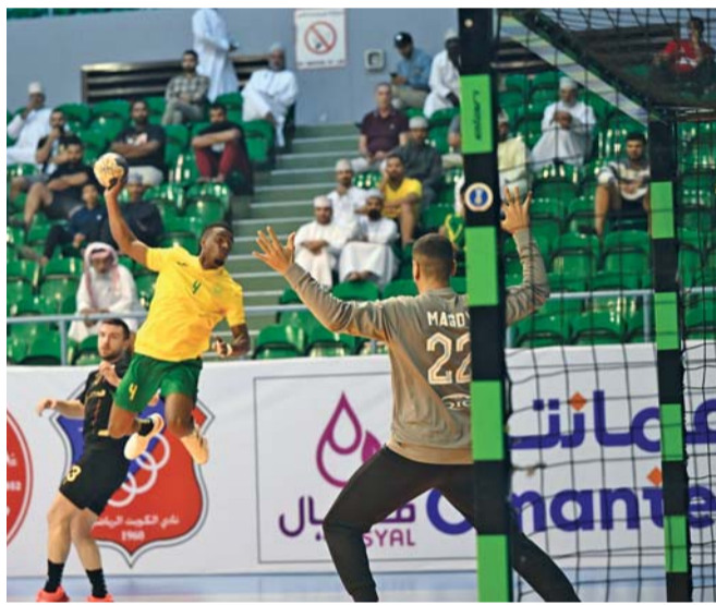
لاعب منتخب السيب في مواجهة حارس الريان القطري