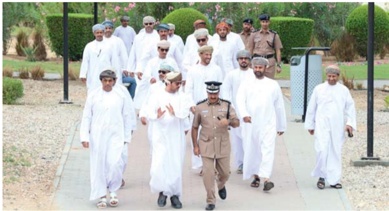
أثناء الإطلاع على المشاريع المنفذة

قام المجلس البلدي لمحافظة مسقط بزيارة إلى ولاية قريات بمشاركة سعادة أحمد بن محمد الحميدي رئيس بلدية مسقط؛ للتعرف على أبرز المشاريع في الولاية والوقوف على المراحل والتحديات بوجود المعنيين. تضمنت الزيارة الإطلاع أولاً على عرض مرئي بمكتب سعادة والي قريات من قبل بلدية مسقط في قريات، ثم المرور على مواقع عدد من المشاريع أبرزها مشروع الواجهة البحرية في كل من (منطقة الساحل وحي الشاطئ) ومشروع