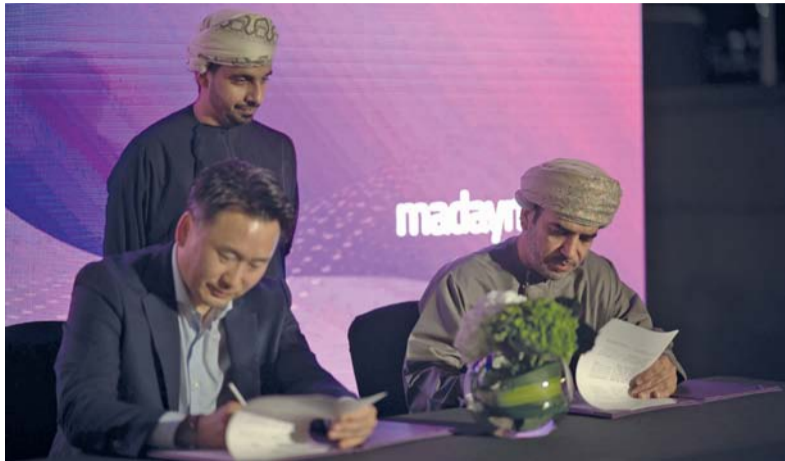
المذكرة تتضمن بناء مقهى قائم على منتجات المزارع الكورية

أهمية مباشرة في حياة الإنسان اليومية، حيث تخصص في مدنها الصناعية مساحات مهينة لهذا القطاع وتعمل على إطلاق المبادرات المساندة لاستدامة هذه الصناعات وتطويرها، حيث تحتضن «مدائن» حالياً داخل مدنها الصناعية ٨٥ مشروعاً في قطاع الصناعات الغذائية يصل إجمالي حجم الاستثمار التراكمي فيها إلى ١٥٠ مليون ريال عماني، حيث تقام هذه المشاريع على مساحة تتجاوز الـ ١,٣ مليون متر مربع ويعمل بها أكثر من ٣٦٠٠ عاملاً. وأشار الهادي إلى أن مشروع «مدائن الزراعية» يعد أحدث مبادرات القيمة المضافة لـ «مدائن» في مجال الصناعات الغذائية، حيث تسعى من خلاله بالتعاون مع وزارة الثروة الزراعية والسمكية وموارد المياه بسلطنة عمان، إلى تجهيز البيوت المحمية في عدد من المدن الصناعية بهدف دعم قطاع الصناعات الغذائية في سلطنة عمان وتشجيع ريادة الأعمال في القطاع الهام، وتغذية السوق المحلي بالمنتجات الزراعية، وتعزيز مشاريع الأمن الغذائي في سلطنة عمان، ورفع الميزان التجاري عبر زيادة الصادرات وتقليل الواردات.