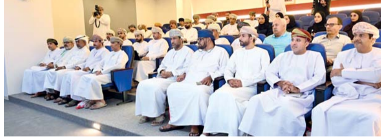
من حضور المؤتمر الصحفي