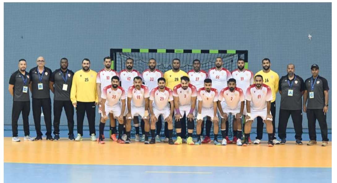
فريق نادي عمان لكرة اليد