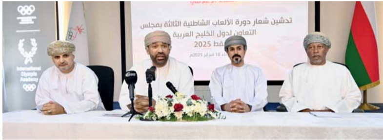
المحدثون في المؤتمر الصحفي