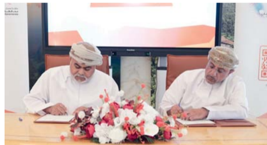
المشروعات تهدف لتعزيز جودة الحياة للمواطنين وتحفيز الاقتصاد المحلي

الموقعة تنفيذ طرق داخلية في ولاية سمائل، التي تدخل حاليًا في مرحلتها الأولى بطول ١٣ كيلومتراً، بالإضافة إلى مشروع تصريف طريق النجيد . وادي عندام. وذلك في إطار حرص المحافظة على تحسين شبكة الطرق، مما يسهل التنقل بين قرى الولايات ويعزز من فرص التنمية الاقتصادية. كما تشمل المشاريع تنفيذ طرق داخلية جديدة للمخططات السكنية في ولاية إزكي بطول ٢٠,٥ كيلومتر وولاية بطول ١٦,٦ كيلومتر وولاية بهلا بطول ١١ كيلومتر، مما يساهم في تعزيز الربط بين القرى والمناطق السكنية. وتتضمن التحسينات في البنية الأساسية إنشاء مواقف السيارات والمرافق العامة، مما يساهم في تيسير الحياة اليومية للسكان.