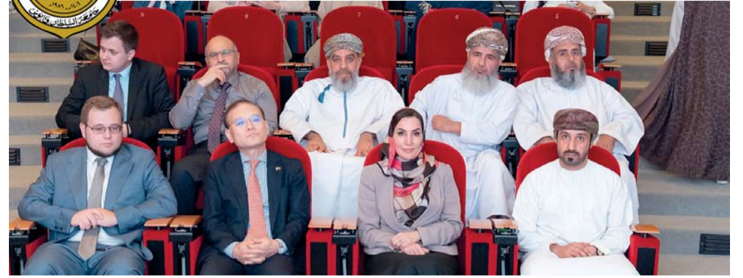
البرنامج قدم تجربة علمية وثقافية ثرية تعمقت في جماليات اللغة العربية وأصالة التراث العماني