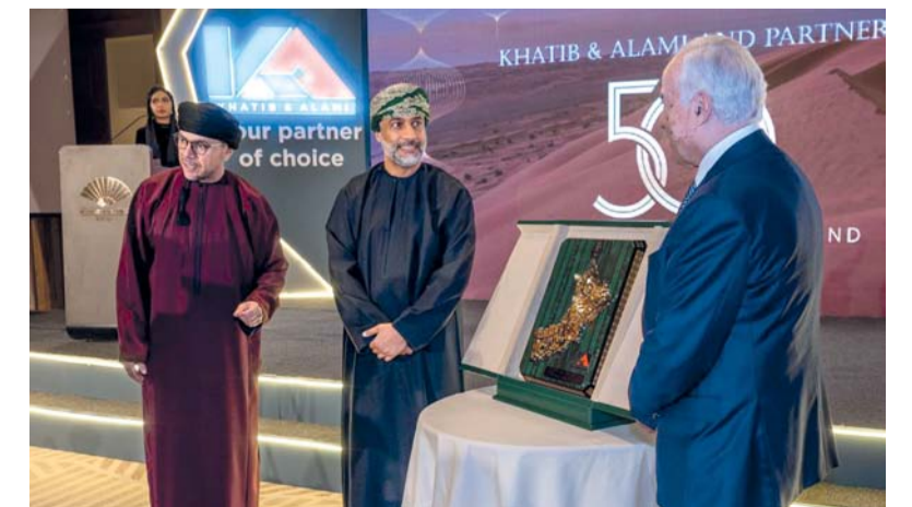
■ الإحتفالية سلطت الضوء على إنجازات شركة خطيب وعلمي وشركاؤه خلال ٥٠ عاماً