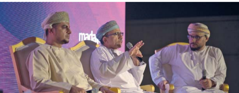
الجلسة النقاشية استعرضت إمكانات الاستثمار في قطاع الصناعات الغذائية

العالم. وخدمات الشركات المتواجدة في جناح السلطنة بمعرض جلفود، «مدائن» اهتماماً بالغاً بقطاع الصناعات الغذائية لما له من