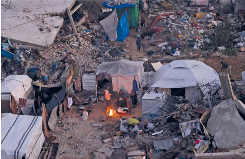
فلسطينيون يخيمون وسط أنقاض منازلهم في جباليا شمال غزة، بعد عودة الأهالي إلى الأجزاء الشمالية من القطاع

فلسطينيين على الاقل اثر اطلاق جيش الاحتلال الاسرائيلي النار قرب قرية الشوكة شرق مدينة رفح. وحسب شهود عيان اصعب فلسطينيان بالرصاص ونقلوا إلى المشفى الأوروبي قبل ان يصاب ثالث وينقل إلى نفس المشفى. وكان المصابون في طريقهم لتفقد منازلهم في القرية.