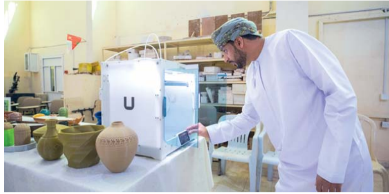
■ الإنجاز يرسخ مكانة سلطنة عُمان ككيئة داعمة ومحفزة للمشاريع الناشئة

مدير مدريد. العُمانية: حققت سلطنة عُمان المركز الثامن عالمياً في المؤشر العالمي لريادة الأعمال لعام ٢٠٢٤ من بين ٥٦ دولة، بعد أن سجلت معدل ٥,٧ مقارنة بـ ٥,٤ في عام ٢٠٢٣ م. ووفقاً لتقرير المرصد العالمي لريادة الأعمال، حصلت سلطنة عُمان على المركز الثامن في ١٣ مؤشراً رئيسياً، تغطي ٩ محاور في ريادة الأعمال الوطنية شملها التقرير، جاءت هذه المؤشرات متسلسلة كالاتي: تمويل رواد الأعمال، وسهولة الوصول إلى المصادر التمويلية، والسياسات الحكومية الممنوعة وأولوية الدعم، ومسار السياسات الحكومية والضرائب، والبرامج الحكومية، ومستوى ريادة الأعمال في التعليم الابتدائي والثانوي، ومستوى ريادة الأعمال في التعليم المهني والكليات والجامعات، ومستوى نقل البحث والتطوير، والوصول إلى البنية الأساسية المهنية والتجارية، وديناميكيات السوق الداخلية، وأعباء السوق