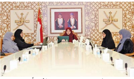
الوفد أثناء مشاركته في الاجتماع عبر الاتصال المرئي