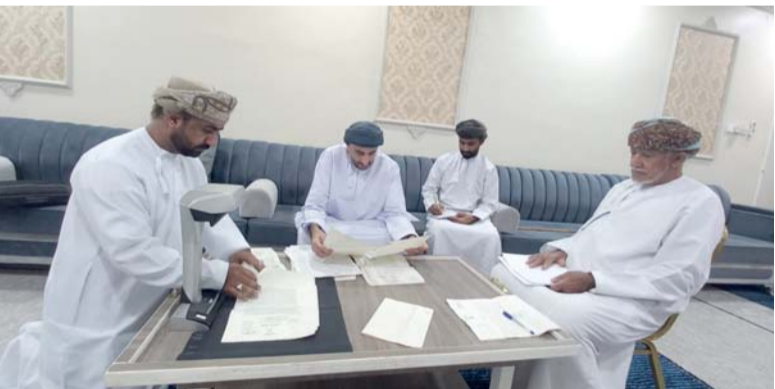
الزيارة تهدف إلى حفظ الذاكرة الوطنية والاستفادة منها في البحوث والدراسات

منها في البحوث والدراسات، وتمت خلال ذلك القيام بتقييمها هذه المخطوطات والوثائق، حيث وتصويرها وترميمها.