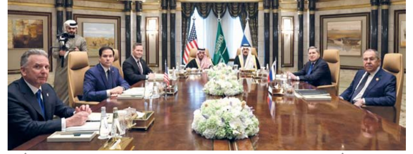
مسؤولون أميركيون وروس كبار بينهم وزيراً خارجية البلدين، ووزير الخارجية السعودي الأمير فيصل بن فرحان يحضرون اجتماعاً في قصر الدرعية بالرياض أمس.

وكانت إسرائيل أعلنت في وقت سابق عن اتفاق يقضى بإفراج القسام عن أربعة جثامين لقتلى اسرائيليين الخميس مقابل سماح إسرائيل بإدخال المعدات الثقيلة والمنازل المتنقلة. وقالت مصادر مصرية مطلعة قريبة من فريق التفاوض المصري الذي يجري مباحثات هامة مع نظيره الاسرائيلي من الوفدين السياسي والتقني الفني مساء امس الأول بالقاهرة حول اتمام صفقة تبادل الاسرى يوم السبت