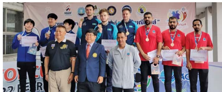
الفريق الوطني للرمية على منصة التتويج

تأتي هذه المشاركة الخارجية للفريق الوطني للرمية في إطار الخطط التأهيلية والتدريبية التي تنتهجها قوات السلطان المسلحة لتعزيز مستوى الأداء الرياضي، والمهارات الفنية للفريق الرياضية العسكرية.