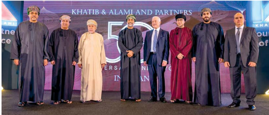
■ صورة جماعية لعدد من المشاركين في الإحتفالية

علمنا يتماشى بشكل عميق مع رؤية عُمان ٢٠٤٠، ما يضمن مساهمة كل مشروع ننفذه في المستقبل المستدام والرقمي للمجتمع. ونظراً لأن ٥٠٪ من القوى العاملة لدينا من العُمانيين، فإننا ملتزمون بتمكين المواهب المحلية ودفع عجلة التقدم، بدعم من نحو ٧٠٠٠ متخصص من أكثر من ٣٠ جنسية. وإن خبرتهم العالمية وحلولهم المبتكرة تعزز كل مشروع نقدمه. ■