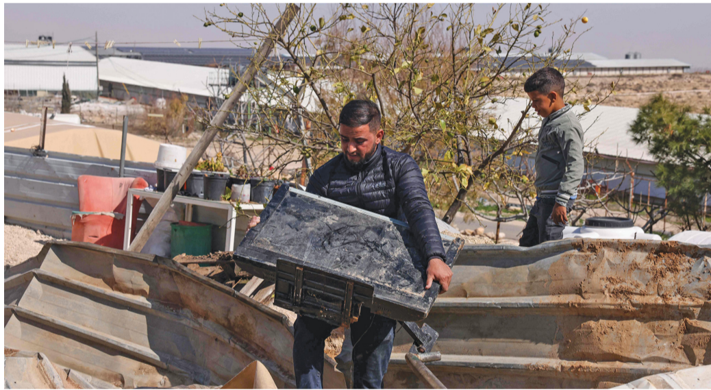
فلسطيني يحمل أعباءً قام بانتقالها من بين الأنقاض أمس، بعد أن هدمت آليات الجيش الإسرائيلي المباني والمناطق السكنية في قرية أم الخير، بالقرب من يطا جنوب الضفة الغربية المحتلة.