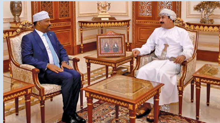
سلطان العُماني أثناء استقباله بشير حسن

مسقط . العُمانية: استقبل معالي الفريق أول سلطان بن محمد السلطاني بمكتبه أسس سعادة بشير حسن حاجي سفير جمهورية الصومال الفيدرالية المعتمد لدى سلطنة عُمان. تم خلال المقابلة تبادل الأحاديث الودية والتطرق إلى العلاقات الثنائية وسبل تعزيز التعاون المشترك في كافة المجالات بما يخدم تطورات البلدين الشقيقين.