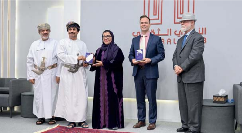
راعي المناسبة أثناء تكريم الفائزين

الإبداعية في ترجمة النصوص الشعرية، والسياسات التي تقتضي أن يعلو فيها صوت المترجم الشاعر على النص الأصلي.