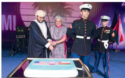
أثناء الإحتفال بيوم الإستقلال

الفندق الاستثماري في حي الساحل، ومشروع ممشى الكريب، ومشروع فندق ضباب، ومشروع تطوير هوية نجم، إلى