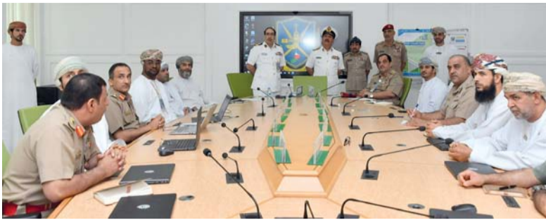
الندوة تطرقت إلى الحلول الرامية إلى توطین التكنولوجيا

تواصل كلية الدفاع الوطني بأكاديمية الدراسات الاستراتيجية والدفاعية تنفيذ فعاليات الندوة السنوية للقضايا الاستراتيجية بعنوان (السيادة الرقمية وأثرها على الأمن الوطني). حيث يناقش المشاركون في الندوة عدة محاور، أهمها: البنية الأساسية، والاستقلال التكنولوجي، والتعاون الدولي، والسياسات والتشريعات، إلى جانب الوقوف على أهم الممارسات والتجارب الدولية والإطلاع