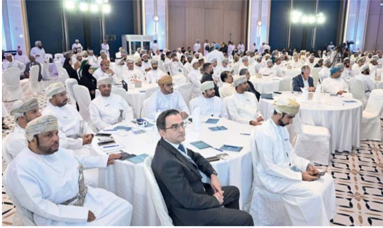
■ الاحتفال السنوي ببرز نجاح القطاع الصناعي في تحقيق مستهدفات الاستراتيجية الصناعية ٢٠٤٠

وأشار جبريل ميلر المدير العام لمنظمة الأمم المتحدة للتنمية الصناعية «اليونيدو» بدور سلطنة عُمان القيادي في مجال التصنيع المستدام، مشيراً إلى أن هذه الجهود تعكس حرص سلطنة عُمان بتعزيز التنمية الاقتصادية والاجتماعية بما يتماشى مع تفويض المنظمة، مؤكداً أن سلطنة عُمان قد أثبتت قدرتها على اتخاذ خطوات جادة نحو تطوير قطاع صناعي مستدام، ما يجعلها نموذجاً يحتذى به في المنطقة. بدوره أكد جيسموند هونغ، الرئيس التنفيذي للعمليات بالمركز الدولي للتحوّل الصناعي، أن المركز يتطلع إلى تعزيز التعاون مع سلطنة عُمان لدفع عجلة التحول الصناعي وتمكين قطاع التصنيع لتحقيق مستقبل مزدهر. حيث يعد المركز مؤسسة غير ربحية ومستقلة تهدف إلى تعزيز تحول التصنيع من خلال التعاون مع القطاع العام والخاص.