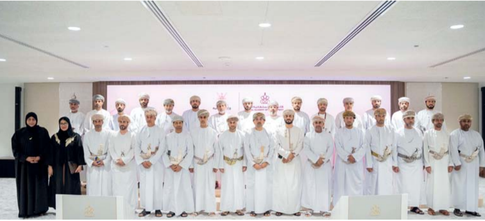
تعزيز قدرات الكفاءات الوطنية نحو اللامركزية

جلسة حوارية في المبنى الذكي وتصميم المشروعات وتقييمها، إضافة إلى عدد من المحاور الأساسية كالذكاء العاطفي والتواصل الفعال واتخاذ القرارات والتفكير الاستراتيجي وجمع البيانات وتحليلها لدعم اتخاذ القرارات وتصميم المشاريع التنموية وتقييمها والتي تنعكس كلها على الأداء الحكومي بمختلف محافظات سلطنة عُمان. ويسعى البرنامج إلى تعزيز دور أعضاء المجالس البلدية في التعاون مع الشباب المعاني لابتكار أفكار مجتمعية تدعم التنمية المستدامة، إضافة إلى تطوير مشاريع خدمية تعزز جودة الحياة في المحافظات.