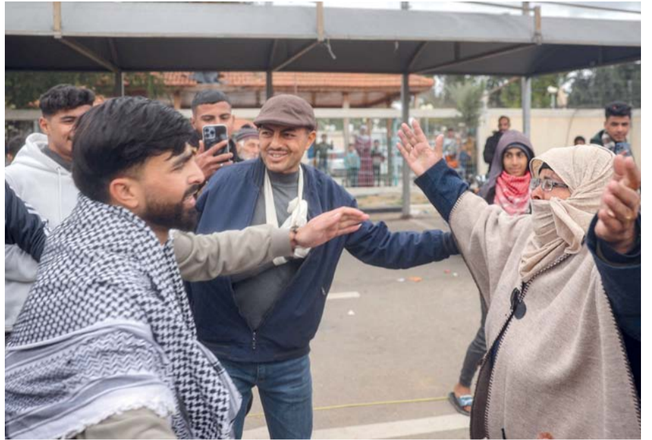
أسير فلسطيني مُحَرَّر يهرع للاحتضان والدته عند وصوله إلى المستشفى الأوروبي في خان يونس بجنوب قطاع غزة.