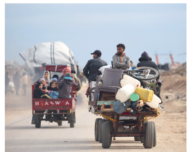
نازحون فلسطينيون يعبرون محور نتساريم وهم في طريقهم إلى الأجزاء الشمالية من قطاع غزة.

البليجكي لويس فريك يتوج بالمرحلة الثانية لـ طواف عمان توج الدرّاج البليجكي لويس فريك بلقب سباق المرحلة الثانية من «طواف عمان الدولي ٢٠٢٥» للدراجات الهوائية، بينما حل الدرّاج الفرنسي بارييت بينتر في المركز الثاني، وجاء البريطاني فلاين في المركز الثالث. وحصل على القميص الأحمر الدرّاج