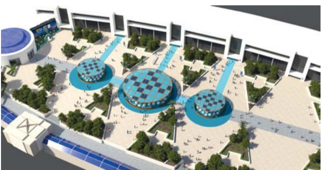
المركز يوفر المكان المثالي للاجتماعات المختلفة في أجواء هادئة وريحة

بطاقة استيعابية إجمالية تزيد عن ١,٠٠٠ ضيف، كما يقدم المركز قوائم طعام مخصصة للفعاليات المؤسسية، لضمان تجربة رمضان راقية لا تنسى.