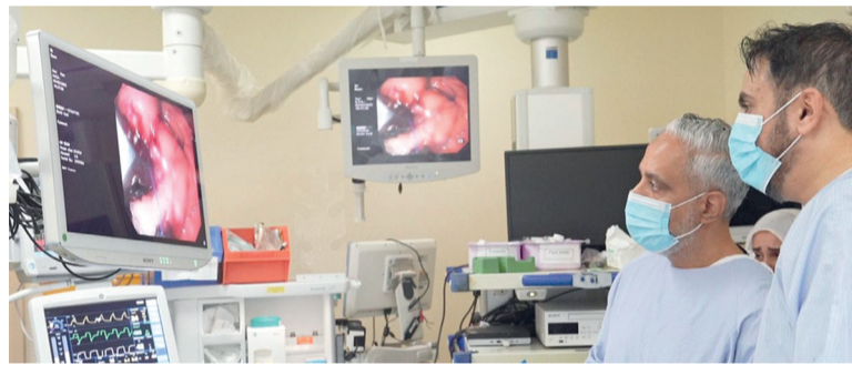
الفريق الطبي أثناء إجراء العملية

يعانون من السمنة من الدرجة الأولى والثانية أو لمن يعانون من السمنة المفرطة ولكنهم لا يرغبون في الخضوع لعملية جراحية. وأشار إلى أن هذه التقنية معتمدة عالمياً، ولا تتطلب قسماً أو استئصالاً لأي جزء من المعدة، مما يجعلها حلاً مثالياً للمرضى الذين يعانون من السمنة من الدرجة الأولى والثانية أو لمن يعانون من السمنة المفرطة ولكنهم لا يرغبون في الخضوع لعملية جراحية.