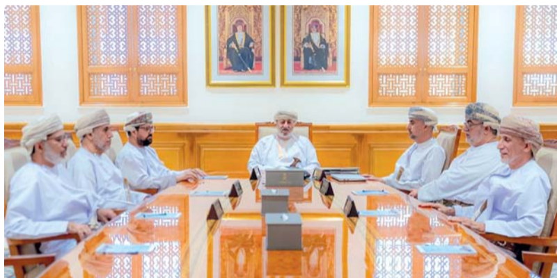
الاجتماع ناقش عدداً من الموضوعات المدرجة

في هذا الشأن. واطلع على عدد من الموضوعات المتعلقة بتطوير القوانين والتشريعات ذات الصلة بأعمال المجلس.