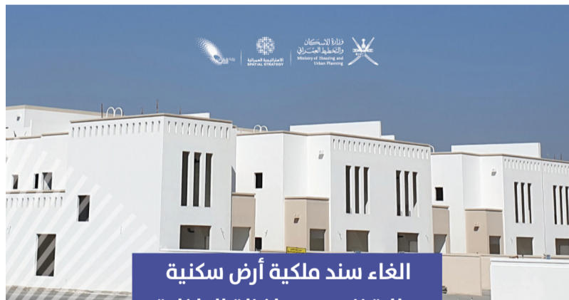
الغاء سند ملكية أرض سكنية بولاية نزوى بمحافظة الداخلية

استناداً إلى حكم المحكمة الابتدائية بنزوى في ملف التنفيذ رقم (2023/9103/635)، تعلن وزارة الإسكان والتخطيط العمراني (المديرية العامة للإسكان والتخطيط العمراني بمحافظة الداخلية)، عن إلغاء سند ملكية الأرض السكنية رقم (437)، بالمربع (م/2) الكائنة في ولاية نزوى/تيمساء والبالغ مساحتها (630)م 2 ، وتعتبر كأن لم تكن ولا يعتد بها في أي حال من الأحوال.