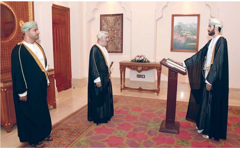
الأعضاء الجدد أثناء تأديتهم اليمين أمام نائب رئيس المجلس الأعلى للقضاء

وخضع أعضاء «دفعه التطوير» لدورات نظرية معمقة في العلوم القانونية، تلاها تدريب عملي في دوائر الادعاء العام الجغرافية والتخصصية بإشراف مباشر ومتابعة دقيقة من أعضاء الادعاء العام، مما أسهم في صقل مهاراتهم، وتزويدهم بالمعرفة اللازمة بما يعينهم على أداء مهامهم بكفاءة، كما عزز هذا البرنامج القيم والأعراف والتقاليد القضائية لديهم.