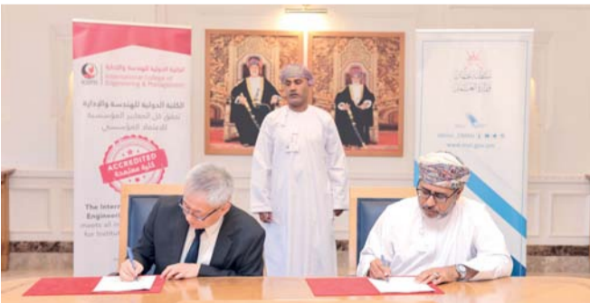
وكيل وزارة العمل لتنمية الموارد البشرية أثناء توقيع المذكرتين

تدخل في نطاق بيئة العمل المشتركة. والاستفادة من تواجدهم الضيوف والمختصين الإقليميين والدوليين الذين يستضيفهم الجانبين لعقد ندوات أو جلسات حوارية تخدم طبيعة العمل والاستفادة من إمكانيات والخبرات في دراسة الصعوبات والتحديات التي تواجه قطاع التشغيل والموارد البشرية، والعمل على تطوير النظم والسياسات، والتعاون في تقديم الخبرات والاستشارات والدراسات المختلفة، والتعاون باستمرار في تشجيع الأساتذة والباحثين، والأكاديميين من منطلق التبادل المعرفي واستضافتهم في بحوث مشتركة، والتعاون في تطوير محتوى المقررات الدراسية والمواد التدريبية والاستفادة من الخبرات المنقولة في مجالات التعليم والتعلم في نطاق أكاديمي مهني يخدم سوق العمل.