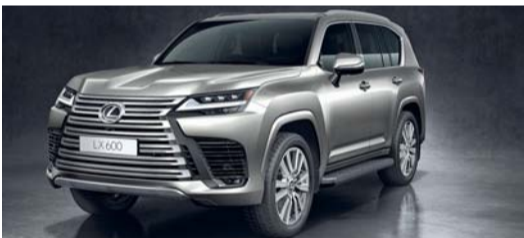
لكزس إل إكس ٦٠٠ بمجموعة كبيرة من الميزات المتقدمة

تأتي سيارة لكزس إل إكس مصممة للتعامل مع التضاريس الوعرة، وهي سيارة حديثة تلهم الثقة وتوجد التوازن المثالي بين الأناقة والقوة، وذلك في خيارين من مجموعة ناقل الحركة، وتتوافر إل إكس ٦٠٠ بمحرك بنزين مزدوج تيربو سعة ٣.٥ لتر، ٦ اسطوانات على شكل V ينتج ٤٠٩ حصان وعزم دوران يصل إلى ٦٦,٢٨ كجم. في حين أن محرك الديزل مزدوج تيربو سعة ٣.٥ لتر، ٦ اسطوانات على شكل V ينتج ٣٠٢ حصان وعزم دوران يصل إلى ٧١,٣٨ كجم، وكلاهما مقترن بناقل حركة آلي ذي ١٠ سرعات.