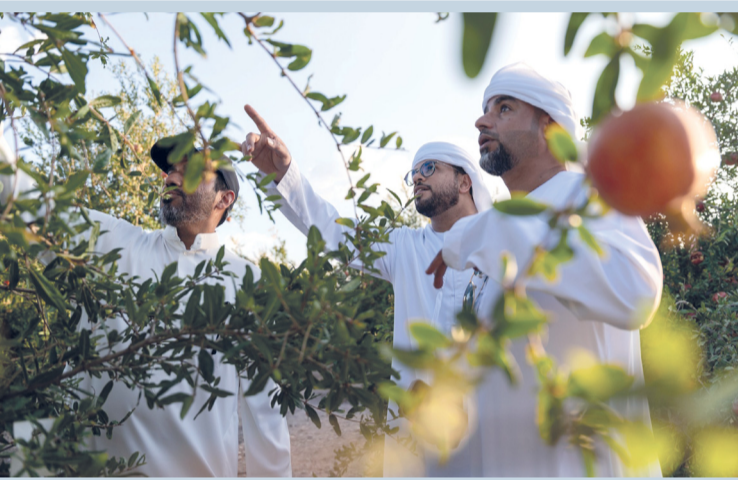
الجبل الأخضر وجهة سياحية مفضلة للكثير من الزوار

واشنطن ١٠ ف ب: ضرب زلزال بلغت قوته ٧,٦ درجة البحر الكاريبي حسبما أعلنت هيئة المسح الجيولوجي الأميركية، ما استدعى إطلاق تحذير من حدوث تسونامي في كوبا وهندوراس وجزر كايمان لفترة وجيزة. ووقع الزلزال في قلب البحر الكاريبي. وكان متوقفاً أن تصل الأمواج إلى ٣ أمتار في كوبا وإلى متر واحد في هندوراس وجزر كايمان، وفقاً لمركز التحذير من أمواج تسونامي في المحيط الهادئ الذي وضع في البداية أيضاً تسع دول أخرى في حالة تأهب.