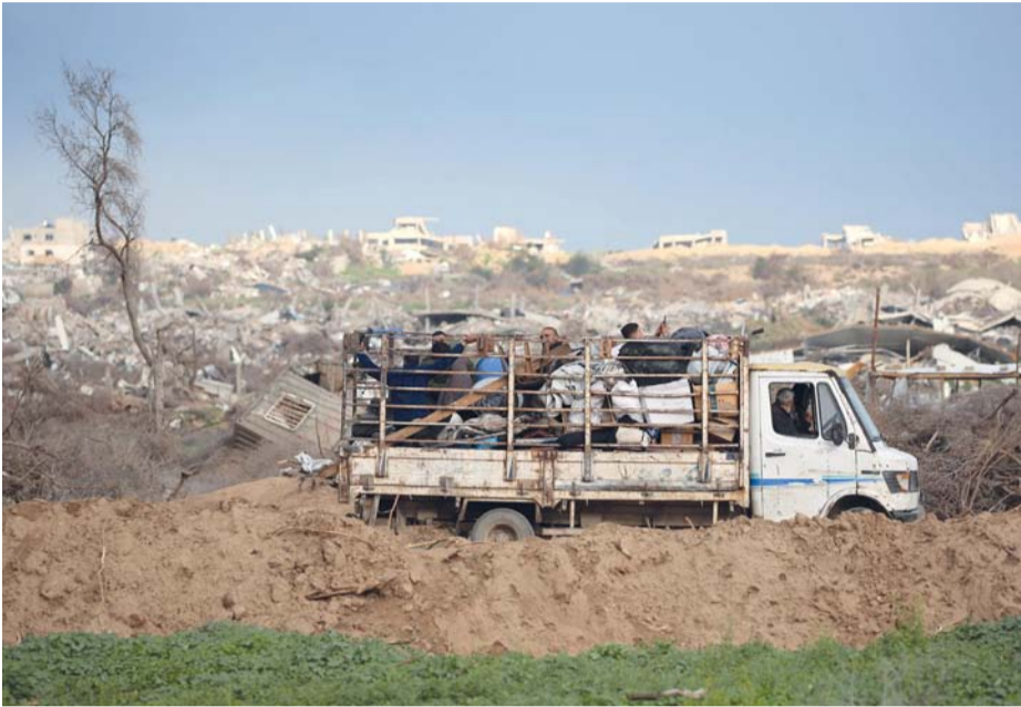
نازحون فلسطينيون يعبرون من نتساريم في طريقهم إلى الأجزاء الشمالية من قطاع غزة.

هجوم واسع النطاق هاجمها واشنطن وكالات، حث الرئيس الأميركي دونالد ترامب القادة الإيرانيين على التوصل إلى صفقة نووية ستجلب إيران هجوماً إسرائيلياً أو أميركياً واسع النطاق. وقال دونالد ترامب في مقابلة حصرية أجرتها معه صحيفة «نيويورك بوست» ونشرت أمس: «أود أن يتم التوصل إلى صفقة مع إيران حول (وضعها) غير النووي. أفضل ذلك على قصفها بشكل جهنمي.. هم لا يريدون الموت. لا أحد يريد الموت». وأضاف: «إذا أبرمنا الصفقة فلن نقصفهم إسرائيل». لكنه لم يكشف تفاصيل أي مفاوضات محتملة مع إيران، وقال: «لا أحب أن أفصح لكم عما سأخبرهم به. هذا ليس لطيفاً». وتابع: «يمكنني أن أخبرهم بما يجب أن أقوله، وأمل أن يقرروا عدم القيام بما يفكرون فيه حالياً». واعتقد أنهم سيكونون سعداء حقاً، وأضاف: «سأخبرهم أنني سأبرم صفقة».