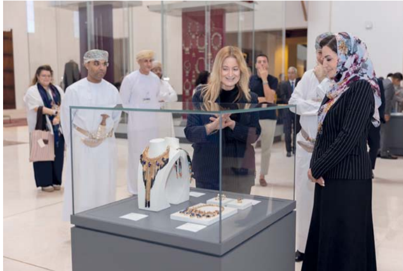
الحضور يتطلع على المعروضات من المجوهرات التي تعكس الإبداع الإيطالي العالمي

يضم المعرض الذي تشرف عليه أمانة المعرض البروفيسورة ألبا كابيليري، أستاذة تصميم المجوهرات في جامعة العلوم التطبيقية في ميلانو، ومديرة متحف مدينة (فيشنزا) للمجوهرات، وفريقها، أكثر من (100) قطعة مميزة من الحلي والمجوهرات الإيطالية، التي تُبرز التطور الفني والثقافي للمجوهرات الإيطالية العصرية، حيث تعكس هذه المجموعة الإبداعية التقدم التكنولوجي والتحول المجتمعي، ويحتفي المعرض بجمال المصنوعات الحرفية وإبداعات المجوهرات العصرية الإيطالية منذ الخمسينيات