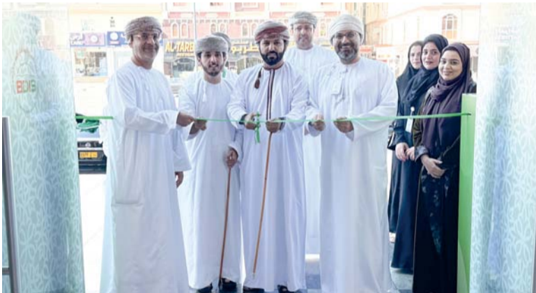
■ لحظة افتتاح فرع بنك ظفار الجديد في الغبرة