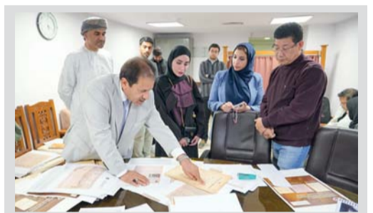
العاصمة الهندية نيودلهي تستضيف المعرض الوثائقي