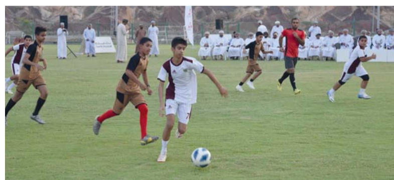
أحد الملاعب التي حظيت بدعم من برنامج «الملاعب الخضراء»

ويوفر برنامج «الملاعب الخضراء» الدعم لأربع فئات تشمل التعشيب الطبيعي والتعشيب الصناعي وتركيب أنظمة الإنارة وأجهزة تحلية المياه بهدف المساهمة في تطوير البنية الأساسية للرياضة الغمانية والمساهمة في تنمية مواهب الشباب وتعزيز إمكاناتهم الرياضية والثقافية والاجتماعية، ويدعو البنك الفرق الراغبة في المشاركة البدء في خطوات التسجيل وتقديم الطلبات في الموعد المحدد. تشكل الفرق الرياضية الأهلية أحد القطاعات الهامة