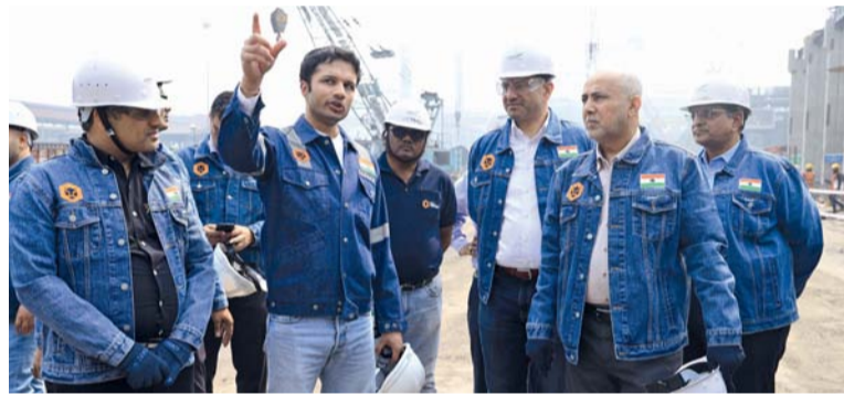
الوفد تعرف على البرامج الأكاديمية ومراكز البحوث والمتحف التعليمي

وأشار التقرير الصادر عن بورصة مسقط إلى أن القيمة السوقية انخفضت بنسبة ٠,٠٧٧ بالمائة عن آخر يوم تداول وبلغت ما يقارب ٢٧,٤٩ مليار ريال عُماني. وبلغت قيمة شراء غير العُمانيين في البورصة ٢٠٨ ألف ريال عُماني مشكلة ما نسبته ١٤,٨٨ بالمائة، فيما بلغت قيمة بيع غير العُمانيين ٣٥٠ ألف ريال عُماني أي ما نسبته ٢٥,٠١ بالمائة، بينما انخفض صافي الاستثمار غير العُماني ١٤٢ ألف ريال عُماني ونسبته ١٠,١٣ بالمائة.