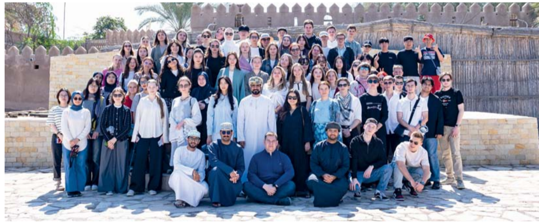
البرنامج يسعى إلى تقوية وتعزيز مهارات اللغة العربية للطلبة الدوليين