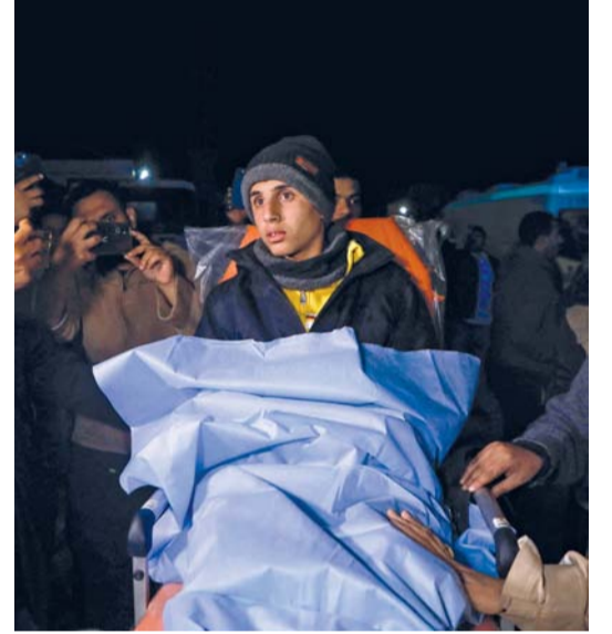
مريض فلسطيني تم إجلاؤه من غزة عبر معبر رفح، يتم نقله إلى مستشفى العريش العام في محافظة شمال سيناء المصرية.

أجبرت قوات الاحتلال عدة عائلات على الخروج من منازلهم في الأطراف الجنوبية لبلدة طمون، واستولت على مفاتيح منازلهم. كما وصلت قوات الاحتلال الإسرائيلي، عدوانها على مدينة طولكرم ومخيمها لليوم السابع على التوالي. وداهمت قوات الاحتلال برفقة الكلاب البوليسية، الليلة قبل الماضية المنازل في أحياء متفرقة من مدينة طولكرم وضواحيها، شملت الحي الشرقي وضاحية الطباح وحي الرشيد في ضاحية نناية، وقتلتها ودقت في هويات سكانها وأخضعتهم للاستجواب الميداني، دون أن يبلغ عن اعتقالات. ودفعت قوات الاحتلال دفعت بمزيد من ألياتها العسكرية من معسكر «تستوعز» غرب طولكرم، ومن حاجزي الطيبة وجبارة جنوباً، باتجاه المدينة ومخيمها وفرضت حصاراً شديداً عليهما، في الوقت الذي تواصل حصارها لمستشفى الشهيد ثابت ثابت الحكومي والإسراء التخصصي وتعرقل عمل مركبات الإسعاف والطواقم الطبية.