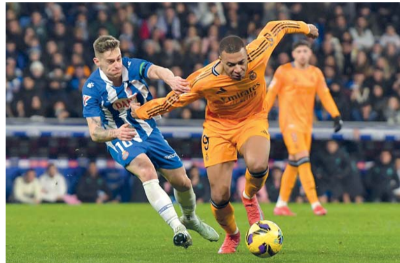
لاعب الريال كيليان مبابي (على اليمين) في محاولة لتجاوز لاعب إسبانيول بول لوزانو

مستوى عال مثل (المكسيكي خوليان كينونيس و(الجابوني بيار - إيمريك أوباميانج) بحسب رأيه. وأمام ما يناهز الـ ١٤ ألف متفرج، كاد الخلود، بقيادة مديره الجزائري نور الدين بن زكري أن يفجر مفاجأة من العيار الثقيل عندما تقدم على الاتحاد في جده بهدفين سريعين، قبل أن يقلب النمر الطاوله بأربعة أهداف وسط اعتراضات مدرب الخلود الذي عبر استيائه من قرارات الحكم ماجد الشمراي. وفي بريدة، وعلى وقع توقيع الدولي الكولومبي الواعد جون دوران (٢١ عاماً)، عاد النصر (الرابع بـ ٣٨ نقطة) بفوز ثمين على الرائد (٢-١) في مباراة ثبت فيها نجمة البرتغالي كريستيانو رونالدو أقدامه في صدارة الهدافين بـ ١٥ هدفاً بعدما سجل هدفاً وصنع آخر، متوجاً بجائزة الأفضل في المباراة. وأمام أكثر من ٩ آلاف متفرج، وفي أولى مبارياته، قدم المدرب الوطني الوحيد في الدوري السعودي سعد الشهري أوراق اعتماده مبكراً بعدما قاد الإنفاق إلى الفوز على الشباب (٣-١) في استاد عبد الله الدبل في الدمام. أوضح الشهري (٤٥ عاماً)، الذي خلف الإنجليزي ستيفن جيرارد، أن ما زال أمامه عمل كبير، «أشرفت على الفريق يوماً واحداً فقط من خلال التمرينات، واللاعبون كانوا كل شيء، عملنا على جانب تحفيزي، والعمل القليل كبير علينا».