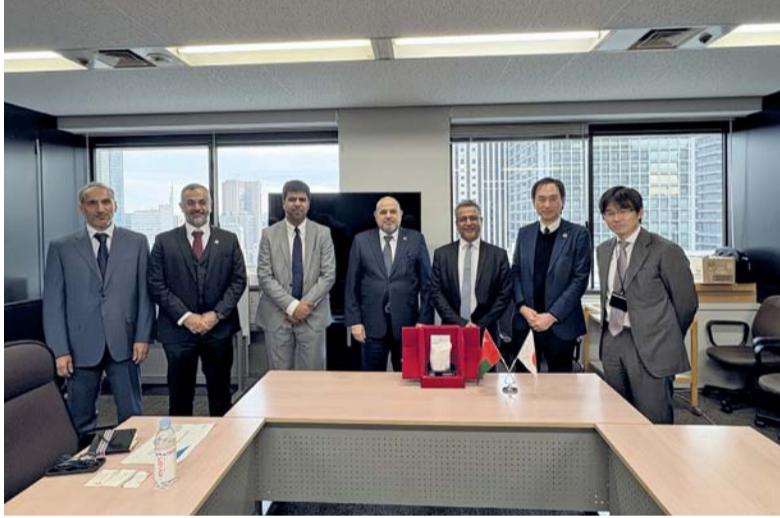
■ تعزيز التعاون مع اليابان في مجالات التحول في الطاقة

الطبيعي والهيدروجين، إلى جانب تقنيات التحليل الكهربائي لإنتاج الهيدروجين، والدور الذي تلعبه هذه التقنيات في دعم تحول الطاقة. كما شملت الزيارة عدداً من شركات الحديد