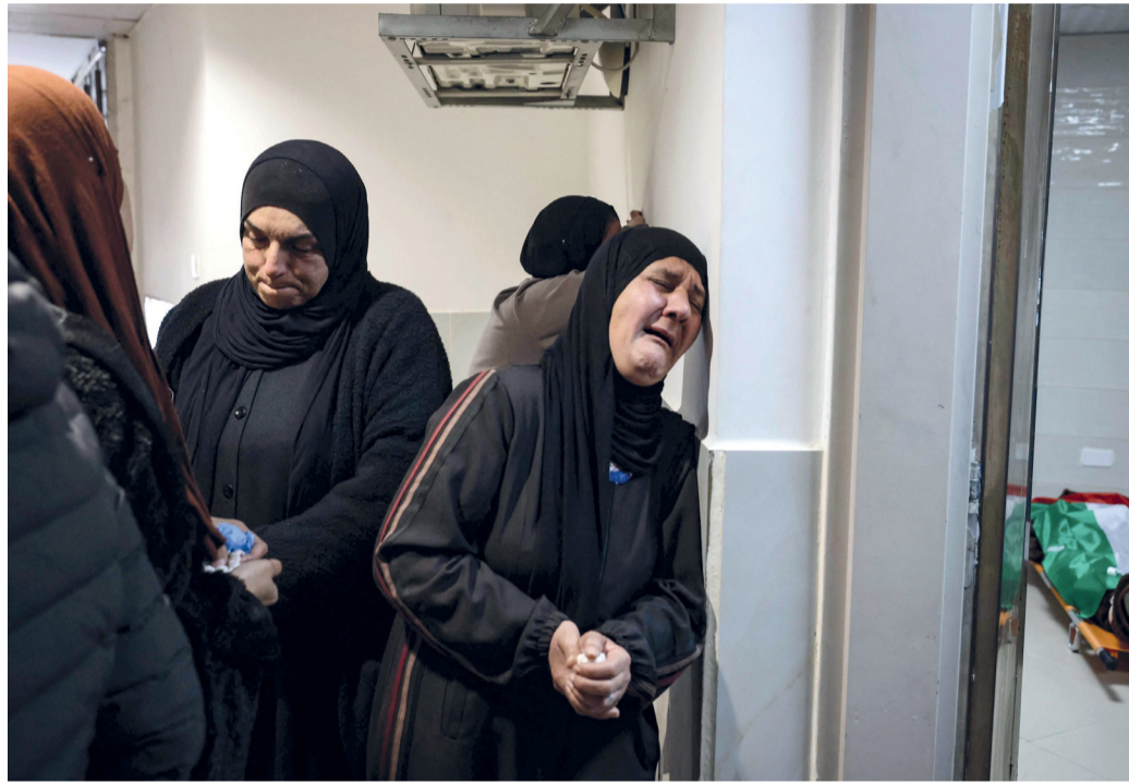
■ أقارب أحد شهداء العدوان «الإسرائيلي» على جنين ينتحبون قبل تشييع جثمانه في الضفة الغربية المحتلة أمس.

ويتواصل انتشار جثامين الشهداء بقطاع غزة؛ جراء العدوان «الإسرائيلي» على القطاع، حيث كشف التقرير الإحصائي اليومي لعدد الشهداء والجرحى وصول (٢٧) شهيداً إلى مشافي القطاع منهم (٢٤) شهيداً انتشال، وشهيدان متأثران بإصابتهما، وشهيد جديد برصاص الاحتلال شرق غزة مع ثلثي إصابات بمناطق متفرقة خلال (٢٤) ساعة، يأتي ذلك فيما قال وزير الخارجية المصري بدر عبد العاطي إن مصر لديها رؤية واضحة لإعادة إعمار غزة دون خروج أي فلسطيني من أرضه. وأضاف عبد العاطي، خلال مؤتمر صحفي مشترك مع نظيره الجبوتي محمود علي يوسف، «لدينا رؤية واضحة في إعادة إعمار غزة ولدينا توافق عربي في هذا الشأن، وننحدر مع الأمم المتحدة في هذا الإطار». وذكر أن هذه العملية تُعد مرحلة أولى تقود إلى بدء عملية سياسية ذات مصداقية تؤدي لقيام الدولة الفلسطينية تمنع تكرار حلقات العنف والعدوان، مشدداً على أن هذا هو السبيل الوحيد لتحقيق الأمن والاستقرار في المنطقة. من ناحية أخرى استشهد مسن صباح أمس برصاص قوات الاحتلال «الإسرائيلي» في مخيم جنين، شمال الضفة الغربية المحتلة، مع استمرار العدوان «الإسرائيلي» لليوم الـ (١٣) تواليًا. وبذلك ترتفع حصيلة الشهداء في محافظة جنين منذ بدء عدوان الاحتلال قبل (١٣) يوماً إلى (٢٥) شهيداً.