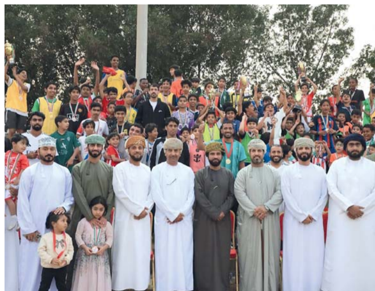
صورة جماعية لراعي الختام مع الحضور والمشاركين