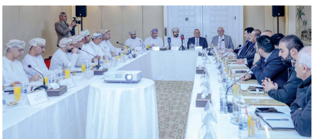
الجانبان أكدا على تعزيز التعاون في مجالات التجارة والصناعة والخدمات اللوجستية