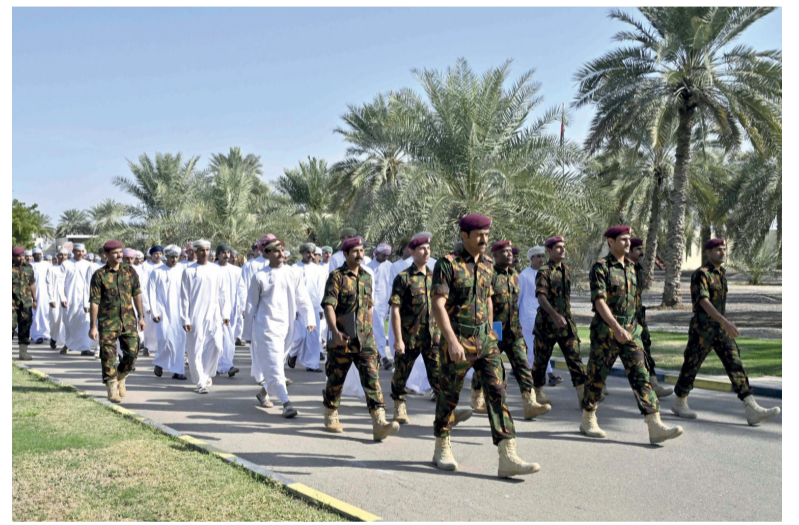
■ دفعة من المواطنين بعد أن اجتازوا مراحل القبول والتقييم والاختبارات والفحوصات

مسقط - العمانية: استقبل الحرس السلطاني العماني، بالتنسيق مع وزارة العمل، دفعةً جديدة من المواطنين لبدء برنامج التدريب العسكري الأساسي جنوداً مستجدين؛ للالتحاق بأقاربهم من منتسبي