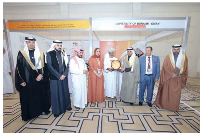
الجامعة تؤكد الالتزام برؤيتها الاستراتيجية الهادفة

التي شاركت جامعة البريمي مؤخراً في معرض الجامعات الدولي إكسبو الرياض ٢٠٢٥، الذي انطلقت فعالياته في مدينة الرياض. ويُعد هذا المعرض من أبرز الفعاليات التعليمية في المنطقة حيث يجمع نخبة من المؤسسات الأكاديمية من مختلف دول العالم، ويوفر منصة متميزة لعرض أحدث البرامج والتخصصات التعليمية.