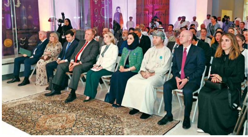
الحفل تخلله مشاهدة الفيلم الوثائقي «الخنجر» من إنتاج قناة روسيا اليوم العربية (أر تي) بالتعاون مع المتحف الوطني ووزارة الإعلام

عقد المتحف الوطني أمس الأول مؤتمراً إعلامياً حول تدشين البرنامج المتحفي من (المواسم الثقافية الروسية) في سلطنة عُمان، بالتعاون مع وزارة الثقافة الروسية ومؤسسة (المواسم الروسية)، كما دشّن المعرض الثاني ضمن مبادرة ركن متحف الإرمتاج الحكومي بعنوان: (هدايا أمراء بخارى وخانات آسيا الوسطى للبلاد القيصرية الروسي)، بحضور معالي أولجا لوبيموفا، وزيرة الثقافة الروسية، وصاحبة السمو السيدة الدكتورة منى بنت فهد بن