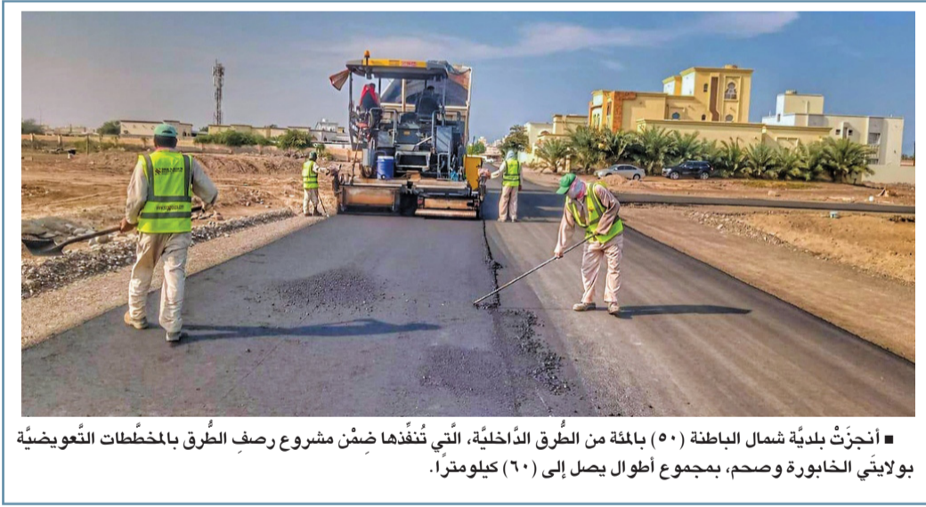
■ أنجزت بلدية شمال الباطنة (٥٠) بالمئة من الطرق الداخلية، التي تُنفذها ضمن مشروع رصف الطرق بالمخططات التوعوية بولايته الخابورة وصحم، بمجموع أطوال يصل إلى (٦٠) كيلومتراً.