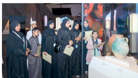
الأسبوع يستهدف الأطفال والناشئة والمهتمين بمجال الفنون

وسيقدم هذه الفعاليات مختصون من متحف عُمان عبر الزمان، وهيئة تنمية المؤسسات الصغيرة والمتوسطة، ومن الجامعات والكليات الخاصة، ومخرجون وممثلون مسرحيون. وستقام الفعاليات في ممر الفنون وقاعة المحاضرات ومعمل الابتكار ومعمل الأفكار.