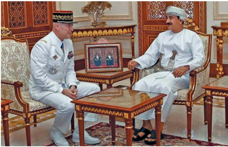
.. ويستقبله سلطان التعماني