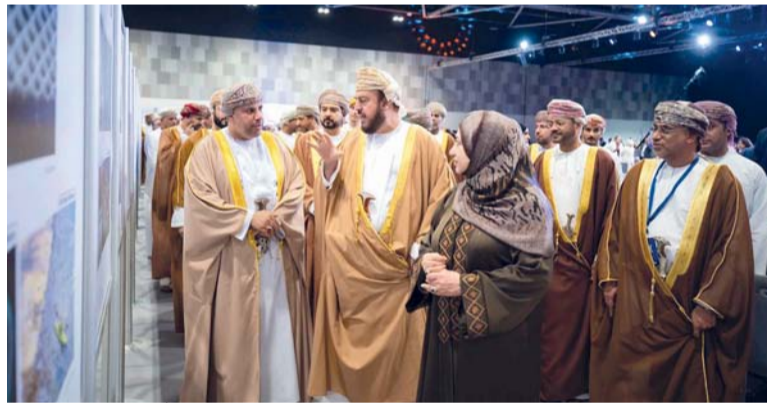
الجامعة تسعى لتعزيز حضورها في المحافل العلمية العالمية

الجامعة في هذا الحدث من خلال تسليط الضوء على جهودها البحثية والعلمية من خلال عرض أوراق عمل ومشاركة في نقاشات محورية تتعلق بمستقبل الذكاء الاصطناعي وتعزيز الثقة في البحث العلمي ودور العلوم في تحقيق التماسك الاجتماعي. ويتميز المنتدى بحضور نخبة من العلماء الدوليين وحملة جوائز نوبل، بالإضافة إلى مفكرين من جامعات ومراكز أبحاث عالمية مما يوفر منصة مهمة لتوسيع آفاق التعاون