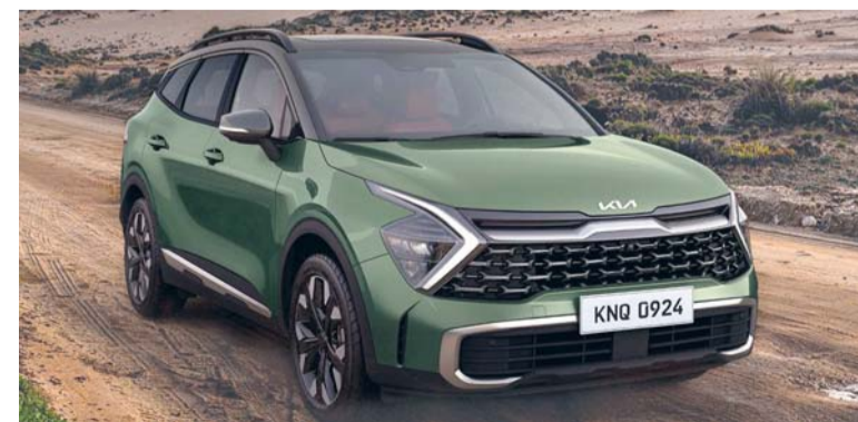
■ كيا سبورتاج إل الجديدة

سيول. العُمانية: انخفضت صادرات كوريا الجنوبية بنسبة ١٠.٣ بالمائة على أساس سنوي إلى ٤٩.١ مليار دولار في يناير وفق بيانات وزارة التجارة والصناعة والطاقة. وبحسب البيانات توقفت الصادرات عن الزيادة السنوية التي استمرت ١٥ شهراً على التوالي في يناير بسبب انخفاض عدد أيام العمل بسبب إجازة رأس السنة القمرية الممتدة. وتراجعت الواردات بنسبة ٦.٤ بالمائة على أساس سنوي إلى ٥١ مليار دولار في الشهر الماضي مما نجم عنه تسجيل أول عجز تجاري قدره ١.٨٩ مليار دولار في ٢٠ شهراً. وبحسب القطاع، ارتفعت صادرات أشباه الموصلات بنسبة ٨.١ بالمائة على أساس سنوي إلى ١٠.١ مليار دولار في يناير، وهو ثاني أعلى رقم لأي شهر يناير بعد تسجيل ١٠.٨ مليار دولار في يناير عام ٢٠٢٢. وتجاوزت صادرات أشباه الموصلات ١٠ مليارات دولار للشهر التاسع على التوالي.