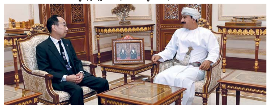
.. وأثناء استقباله السفير الصيني