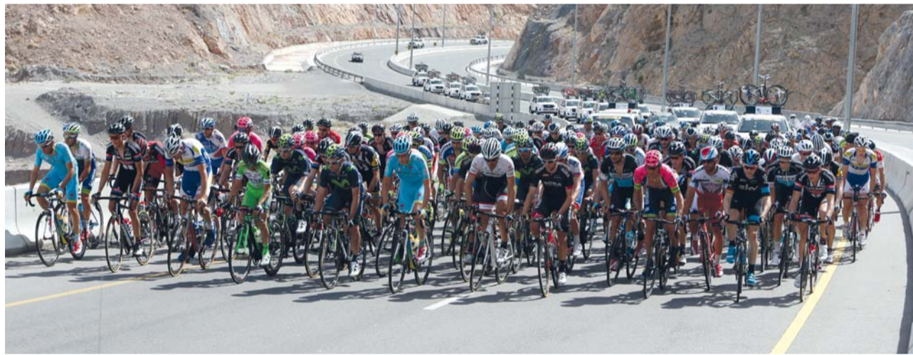
صورة أرشيفية من سباق طواف عمان الدولي للدراجات الهوائية

وفيتشنزو نيبالي، وكريس فروم، وغيرهم الكثير من الأبطال المعروفين في رياضة الدراجات الهوائية، وقد وضعت اللجنة المنظمة لطواف عمان الدولي علامات على مسارات المراحل التي يمر بها الدراجين في كل مرحلة من المراحل الخمس.