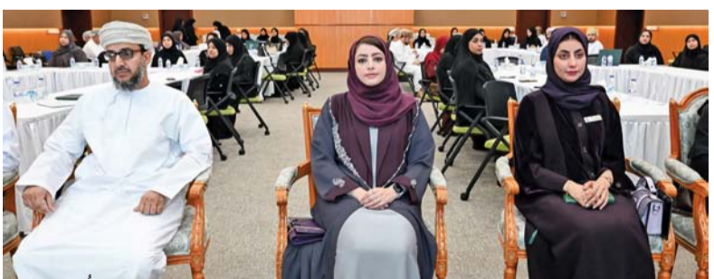
اللقاء تضمن عرضاً مرئياً جسّد قصة رعاية أسرة حاضنة لطفل فاقد للرعاية الأسرية

الفرنسية والوفد المرافق له الذي يقوم حالياً بزيارة رسمية لسلطنة عمان، حيث بحث الجانبان سبل تعزيز التعاون الثنائي المشترك بما يعزز أمن البلدين الصديقين، والتأكيد على عمق العلاقات التاريخية التي تربط بين سلطنة عمان والجمهورية