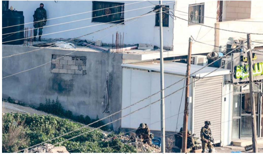
جنود الاحتلال يتخذون موقعا خلال مدهمة لمخيم الفارعة للاجئين الفلسطينيين جنوب جنين.

القاهرة. د.ب.أ: تلقى الرئيس المصري عبد الفتاح السيسي اتصالاً هاتفياً من الرئيس الأميركي دونالد ترامب. وقال المتحدث الرسمي باسم الرئاسة المصرية السفير محمد الشناوي إن الاتصال تناول القضايا الثنائية والإقليمية والدولية، والتأكيد على العلاقات الاستراتيجية التي تجمع البلدين، وضرورة تعزيز العلاقات الاقتصادية والاستثمارية بينهما، والتعاون في مجال الأمن المائي، وحرص الرئيسان على تحقيق السلام والاستقرار في الشرق الأوسط. وأضاف أن الاتصال شهد حواراً إيجابياً بين الرئيسين، بما في ذلك حول أهمية الاستمرار في تنفيذ المرحلة الأولى والثانية من اتفاق وقف إطلاق النار وتثبيت وقف إطلاق النار في قطاع غزة الذي تم التوصل إليه بوساطة مصرية قطرية وأميركية، وضرورة تكثيف إيصال المساعدات لسكان غزة. وفي هذا الإطار، أكد السيسي على أهمية التوصل إلى سلام دائم في المنطقة، مشيراً إلى أن المجتمع الدولي يحول على قدرة ترامب على التوصل إلى اتفاق سلام دائم وتاريخي ينهي حالة الصراع القائمة بالمنطقة منذ عقود، خصوصاً مع انحياز ترامب إلى السلام، وهو الأمر الذي أكد عليه الرئيس الأميركي في خطاب تنصيبه بكونه رجل السلام، وشدد الرئيس السيسي على ضرورة تدشين عملية سلام تفضي إلى حل دائم في المنطقة.