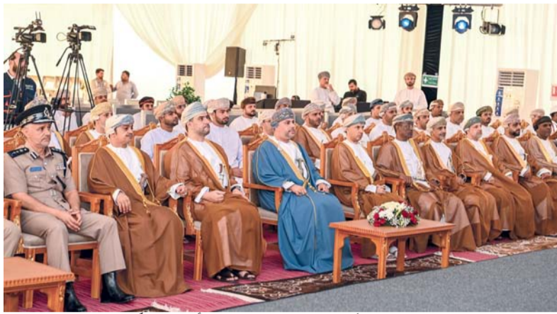
الحضور أثناء افتتاح مشروع شبكة الصرف الصحي

وفيما يخص المشروعات القادمة لتعزيز قطاع الصرف الصحي ومواكبة التطور العمراني، تم إسناد مناقصة توسعة المحطة الرئيسية للمياه المعالجة بريسوت لرفع سعتها لتصل إلى ٩٠ ألف متر مكعب/اليوم، بقيمة ٣٥ مليون ريال عماني، إذ بدأت الأعمال الإنشائية منذ مطلع العام الجاري، ومن المتوقع الانتهاء من المشروع في عام ٢٠٢٧.