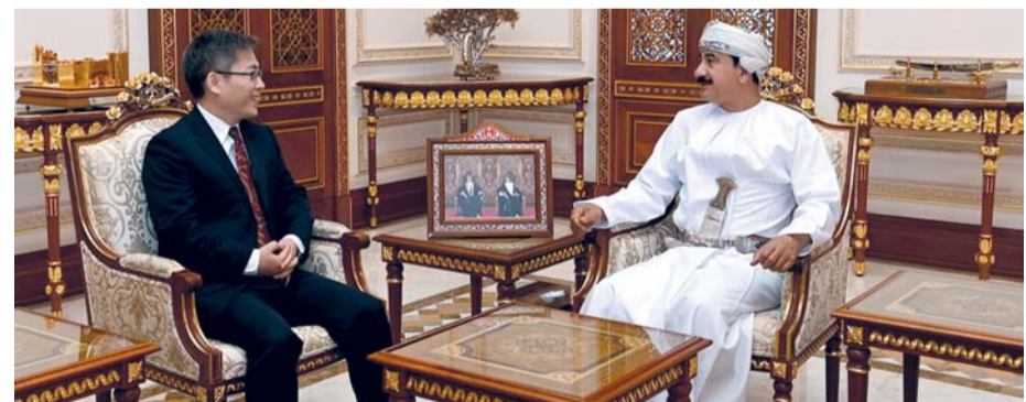
سلطان التعماني أثناء استقباله السفير الياباني

من جانبه أشاد معالي الفريق أول بجهد سعادته التي بذلها في سبيل تعزيز العلاقات القائمة ومجالات التعاون المشترك بين سلطنة عمان واليابان متمنياً له دوام التوفيق في مهام عمله القادمة. كما استقبل معاليه سعادة ليو جيان سفير جمهورية الصين الشعبية المعين لدى سلطنة عمان. في بداية اللقاء رحّب معالي الفريق أول بسعادته متمنياً له التوفيق في مهام عمله، كما تطرق معاليه إلى العلاقات الثنائية التي تجمع بين سلطنة عمان وجمهورية الصين الشعبية، وقد أبدى سعادة السفير الصيني تطلعه للعمل على تعزيز العلاقات الثنائية القائمة بما يخدم مصالح البلدين الصديقين.