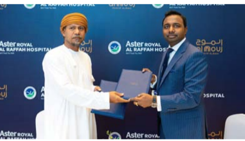
الافتتاحية تهدف إلى تقديم خدمات إسعافية متخصصة

على تطوير قدرات الموظفين العاملين في المحافظات والبلديات، من خلال تمكينهم من وضع الخطط والموازنات، وصياغة المشروعات، واستخدام الأدوات والنماذج المتبعة وفق المعايير الوطنية والعالمية، بما يعزز مشاركتهم الفاعلة في تحقيق الأولويات التنموية بالمحافظات.