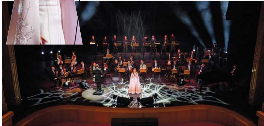
ماجدة الرومي قدمت مجموعة من أغانيها العذبة

رئاسة الجمهورية التونسية عام ١٩٨٧م ووسام الأرز الوطني اللبناني من رتبة فارس عام ١٩٩٤م، وحصلت على الدكتوراه الفخرية في العلوم الإنسانية من الجامعة الأميركية في بيروت عام ٢٠٠٩م، وفي عام ٢٠١٨م حصلت على الدكتوراه الفخرية في الفن والعلوم من الجامعة اللبنانية في بيروت، ومن جامعة بيروت العربية، وغيرها من الأوسمة والألقاب.