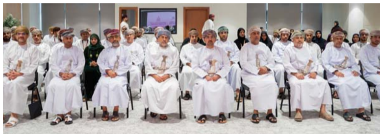
البرنامج يهدف إلى تعريف المشاركين بالمفاهيم المتعلقة بالإدارة المحلية

أطلقت الأكاديمية السلطانية لإدارة برنامج «تعزيز القدرات التخطيطية والاقتصادية بالمحافظات»، بالتعاون مع وزارة الاقتصاد، وذلك إيماناً بالرؤية السامية لحضرة صاحب الجلالة السلطان هيثم بن طارق المعظم. حفظه الله ورعاه. التي تهدف إلى تطوير القدرات الوطنية ذات المهارات المتجددة وتوافق مع مستهدفات رؤية عُمان ٢٠٤٠، واستمراراً في تقديم المبادرات الاستراتيجية.