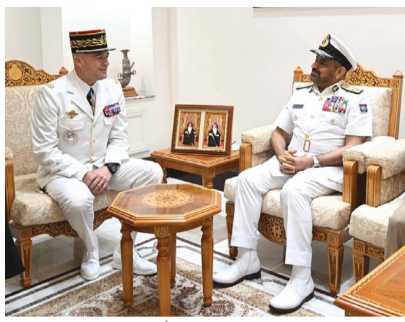
.. ويستقبله عبد الله الرئيسي

حضر المقابلة العميد الركن حامد بن عبدالله البلوشي مساعد رئيس أركان قوات السلطان المسلحة للعمليات والتخطيط، وعدد من كبار ضباط رئاسة أركان قوات السلطان المسلحة، والملحق العسكري بسفارة الجمهورية الفرنسية بمسقط.