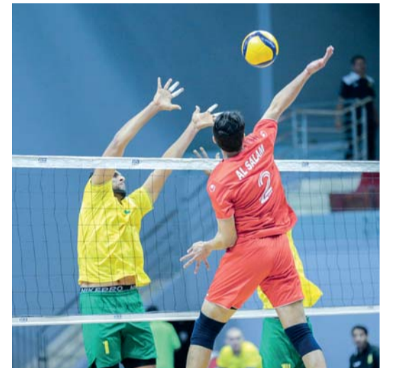
من مباريات دوري الدرجة الأولى للكرة الطائرة

حققت أندية البشائر ومصيرة والسلام الفوز أسس الأول ضمن مباريات الجولة الأخيرة من الدور التمهيدي لدوري الدرجة الأولى للكرة الطائرة للموسم الرياضي ٢٠٢٤/٢٠٢٥، في نسخته الـ٣٩ والتي أقيمت بصالة المجمع الرياضي في لقاء نادي الشباب مع نادي مصيرة تمكن نادي مصيرة من تحقيق الفوز بنتيجة ثلاثة أشواط مقابل شوط واحد وبنقاط أشواط ١٩/٢٥، و١٣/٢٥، و٢٥/٢١، وفي لقاء نادي البشائر مع نادي صحم فاز نادي البشائر بنتيجة ثلاثة أشواط دون مقابل وبنقاط