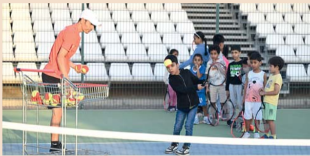
من فعاليات اليوم المفتوح