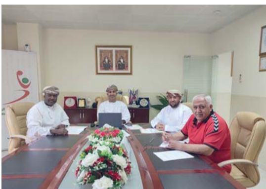
من اجتماع لجنة المسابقات باتحاد اليد