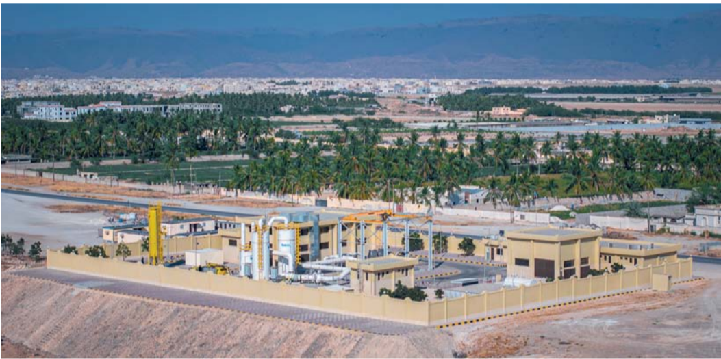
المشروع يخدم في الفترة الحالية نحو ٤٠٠٠ مشترك

وأضاف أن تنفيذ مشروع شبكة الصرف الصحي بصحلتوت يأتي بالشراكة مع الشركة الوطنية العمانية للهندسة والاستثمار لمدة ١٥ عاماً ضمن سعي الحكومة لتشجيع القطاع الخاص للاستثمار في البنية الأساسية لا سيما في قطاع الصرف الصحي، مؤكداً حرص نماء