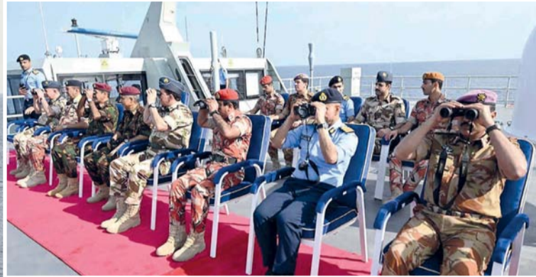
القادة استمعوا إلى إيجاز عن مجريات التمرين وأساليب تنفيذه

المصنعة. الغمانية زار عدد من قادة قوات السلطان المسلحة والأجهزة العسكرية والأمنية أمس موقع التمرين البحري (أسد البحر / ٢٠٢٥) الذي تنفذه البحرية السلطانية الغمانية، بمشاركة عدد من سفن أسطول البحرية السلطانية الغمانية، وإسناد من الجيش السلطاني الغماني، وسلاح الجو السلطاني الغماني، وشرطة خفر السواحل بشرطة عُمان السلطانية. وقد استمع القادة خلال الزيارة إلى إيجاز عن مجريات التمرين ووسائل وأساليب تنفيذه بما يحقق الأهداف التدريبية المتوخاة، ثم شاهدوا رماية حية على أهداف بحرية مفترضة، أظهرت المستويات العالية والكفاءة العملية التي يتمتع بها منتسبو البحرية السلطانية الغمانية.