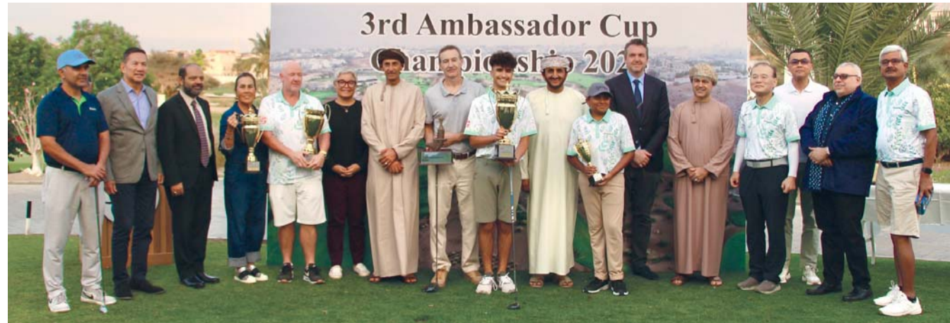
لقطة جماعية لأصحاب المراكز الأولى

السفراء للجولف للعام الثالث يصب في إطار الجهود المبذولة لتعزيز التعاون والروابط بين البعثات الدبلوماسية في سلطنة عُمان والقطاع الخاص العماني، موضحاً مساعده وشكره وتقديره لنادي غلا على استضافة الفعالية وتقديم الدعم المطلوب.