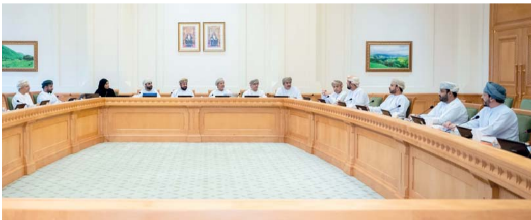
اللقاء استعرض الأهداف والمبررات المرتبطة بصياغة مواد وأحكام مشروع القانون

استضافت اللجنة الاقتصادية والمالية بمجلس الشورى أمس، عدداً من المختصين من وزارة المالية؛ وذلك في إطار دراستها لمشروع قانون تحصيل مستحقات الدولة الخاضعة للحكومة لتزجئة لنص المادة (٤٧) من قانون مجلس عمان التي أوضحت بأن تحال مشروعات القوانين التي تعدها الحكومة إلى مجلس عمان لإقرارها أو تعديلها، ثم رفعها إلى جلالته للسلطان مباشرة؛ للتصديق عليها وإصدارها. خلال اللقاء استمع أصحاب السعادة أعضاء اللجنة من قبل المعنيين في الوزارة إلى ملخص حول مشروع القانون، والأثر التشريعي له على القوانين النافذة؛ حيث تعد وزارة المالية الجهة الرئيسية القائمة على إعداد مشروع القانون؛ كما تم خلال اللقاء استعراض الأهداف والمبررات المرتبطة بصياغة مواد وأحكام مشروع القانون. من جانبهم