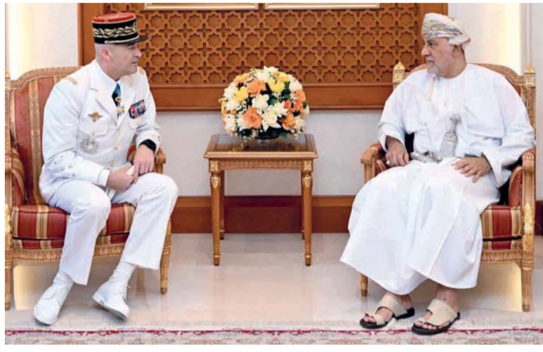
شهاب بن طارق أثناء استقباله تيري بوركار

قوات السلطان المسلحة أجريت له مراسم استقبال رسمية، حيث أدى حرس الشرف التحية العسكرية، وعزفت مجموعة من فرقة الموسيقى العسكرية سلام الشرف، ثم استعرض الفريق أول حرس الشرف.