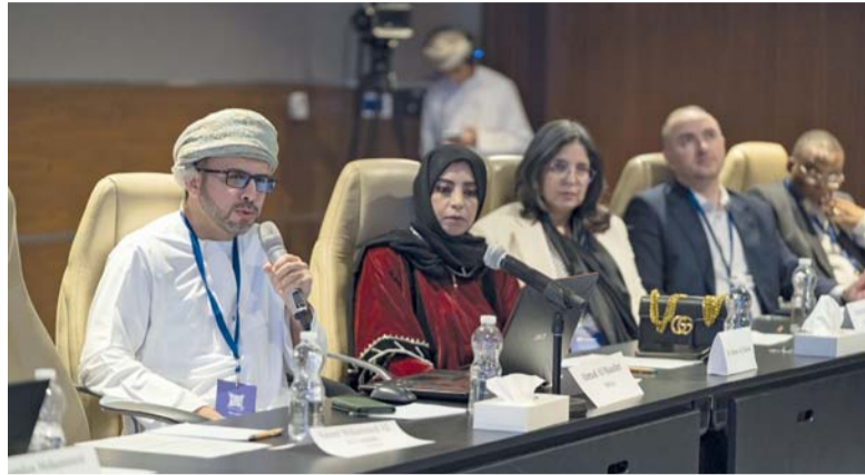
المنتدى يناقش تعزيز التعاون الدولي في أبحاث الذكاء الاصطناعي

تمكين الدور الذي تؤديه العلوم الاجتماعية في المشهد السياسي الحيوي في سلطنة عُمان. وتناولت «الحربة والمسؤولية في العلوم» إلى تبادل المعرفة ومناقشة الاتجاهات والتحديات والفرص والتعاون في منطقة الشرق الأوسط وشمال إفريقيا، وبين أعضاء (ISC) العالمين، وناقشت أهم المبادرات واهتمامات الأعضاء ذات الأولوية، كما ركزت على إمكانية دعم الأعضاء والشبكات التابعة للمجلس الدولي للعلوم (ISC)، وتعزيز السلوك الحر والأخلاقي والعادل للعلوم في جميع أنحاء المنطقة والعالم. واستكشفت الحلقة الثانية «تعزيز دور العلوم الاجتماعية في سياسة وممارسة التنمية المستدامة» أنوار المجلس الدولي للعلوم (ISC) في