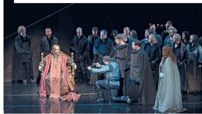
«سيمون بوكانيجرا» عرض يعكس الصراعات الداخليّة ويحتفي بقدرة الإنسان على التوبة والغفران

مسقط . «الوطن» : قدّمت فرقة مسرح مارينسكي في دار الأوبرا السلطانية مسقط عرض حكاية (سيمون بوكانيجرا)، عرضاً يعكس الصراعات الداخلية ويحتفي بقدرة الإنسان على التوبة والغفران. فرقة مسرح مارينسكي قدّمت هذا العرض التشويقي بمصاحبة عازفين مشهورين، استمتع خلالها الجمهور بوحدة من روائع الأوبرا، فتفاعل مع أناقة الأداء المذهل، والموسيقى الأسيّة، أبرزت عظمة الروائع الأوبرالية. تُعد أوبرا سيمون بوكانيجرا لجوزيبي فيردي من أبرز أعمال الأوبرا الكلاسيكية الرائعة التي حقّقت حضوراً مميّزاً منذ عرضها لأول مرة في عام ١٨٥٧، وواصلت نجاحاتها، فدوّنت على خشبة المسرح مسيرة مهنية رائعة على مدى ستة عقود، وقام جوزيبي فيردي (١٨١٣-١٩٠١) بتأليف (سيمون بوكانيجرا)، وهو في ذروة قوّته، حيث فتح أفقاً جديدة للفن الأوبرالي، ووضع أساساً شكّلت جوهر العروض الأوبرالية المعاصرة، وقد أظهر هذا العرض على خشبة المسرح عبقرية فيردي وقدراته الاستثنائية كمؤلف موسيقي. كما استضافت الأوبرا السلطانية دار الفنون الموسيقية على مسرحها روائع الأوبرا الروسية بمشاركة فنانين وكورال وأوركسترا مارينسكي التي جلبت الحاناً جميلة ومقتطفات سيمفونية من الإرث الفني لكبار المؤلفين الموسيقيين الروس. 🌸