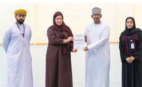
تكريم المشاركين في المبادرة

احتفل بمقر جامعة التقنية والعلوم التطبيقية بولاية عبري بمحافظة الظاهرة باحتتام فعاليات هاكاثون MDO برعاية سعادة السيد سليمان بن حمود البوسعيدي، نائب الأمين العام لمجلس الوزراء، والذي نظّمته شركة تنمية معادن عُمان بالشراكة مع مكتب محافظ الظاهرة، ومركز الابتكار ونقل التكنولوجيا، وجامعة التقنية والعلوم التطبيقية. شهدت فعاليات الهاكاثون مشاركة ٢٧ فريقاً و ١١١ مشاركا من مختلف أنحاء سلطنة عُمان، الذين قدموا حلولاً مبتكرة في قطاعات حيوية تشمل كفاءة الطاقة، وإدارة الموارد المائية، الأتمتة، وتأهيل الأراضي. تمثلت هذه الحلول خطوات طموحة نحو تحقيق التنمية المستدامة ودعم الاقتصاد الوطني. كما تم تقديم العديد من البرامج العملية المتخصصة وتزويد