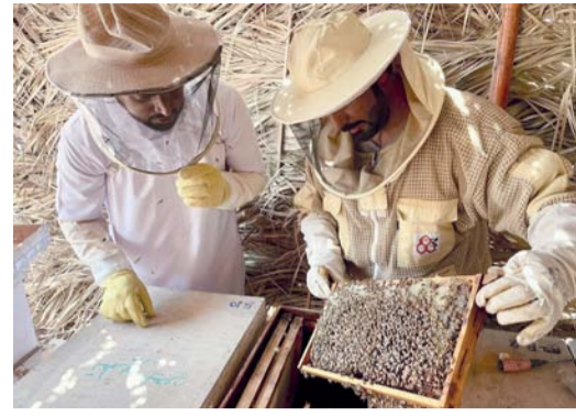
تربية نحل العسل في محافظة جنوب الباطنة.

للنحالين في المحافظة بالتعاون مع الجهات المعنية من القطاعين العام والخاص. وأشاد إلى أن وزارة الثروة الزراعية والسمكية وموارد المياه بمحافظة جنوب الباطنة أن الوزارة تقوم بجهود للمساهمة في استدامة قطاع العسل وتحقيق الأمن الغذائي في سلطنة عُمان، لما له من مردود اقتصادي لأصحاب هذه المهنة، مشيراً إلى أن الوزارة مستمرة في تشجيع النحالين لإقامة مناحل تجارية ذات عائد اقتصادي وحظهم على إدخال التقنيات الحديثة في عمليات إنتاج الملكات المحسنة والطور من أجل تعظيم العائد المادي لهم واتباع الأساليب الحديثة في تسويق المنتج وتنوع عمليات التربية لإنتاج كميات عسل ذات جودة عالية. وأكد أن المديرية مستمرة في عمل حلقات تدريبية وعملية للنحالين وإرشادهم على استخدام الطرق الحديثة في تربية خلايا نحل العسل، كما أنها تعمل على إقامة معارض خاصة