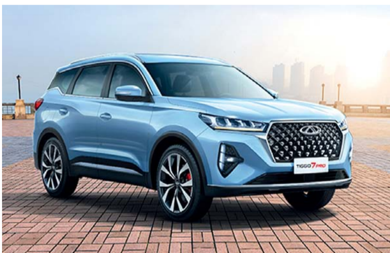
تتصدر شيري تيجو ٧ برو ماكس والأداء

تأتي شيري تيجو ٧ برو ماكس بعروض رائعة تجسد في توفير خدمة المجانية لغاية ٥٠,٠٠٠ كم، وضريبة القيمة المضافة المجانية والتسجيل والتأمين كلها لمدة سنة واحدة بالإضافة إلى هدايا مضمونة من خلال قسائم امسح واربح مثل هاتف سامسونج اس ٢٤ الترا ٥ جي أو اثنين من الكمبيوتر المحمول أو الحصول على ٣ تلفزيونات إل إي دي أو بطاقة وقود لكل ١٠٠ لتر M٩٥ ويصل عددها إلى ٥٤ بطاقة وقود وضمان المحرك لمدة ١٠ سنوات لكل ١٠٠,٠٠٠ كم، ويستمر هذا العرض حتى ٣٠ من يناير الجاري. وتواصل شيري إعادة تعريف تجربة القيادة بمزيجها من الفخامة والتكنولوجيا والأداء لطران تيجو ٧ برو ماكس المعروف بتصميمه الأنيق وميزات السلامة المتقدمة والمقصورة الفاخرة، حيث تجمع بين المظهر الخارجي الجريء والخطوط الأنيقة والشبكة البارزة مما يجعلها تتسم بالحضور القوي على الطريق كما توفر مقصورة فسيحة ومجهزة بمواد عالية الجودة