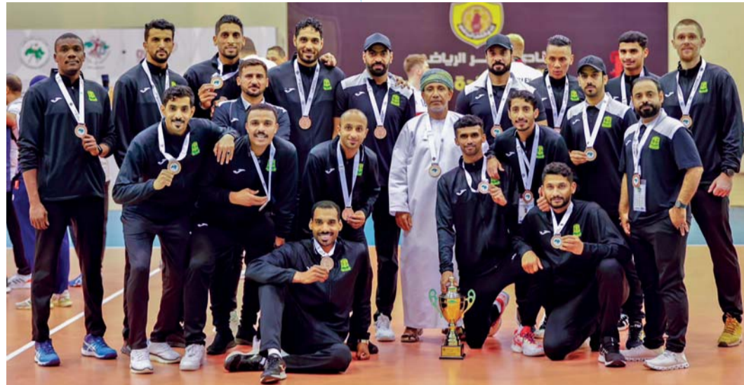
■ لاعبو السيب يحتفلون بالمركز الثالث والميدالية البرونزية