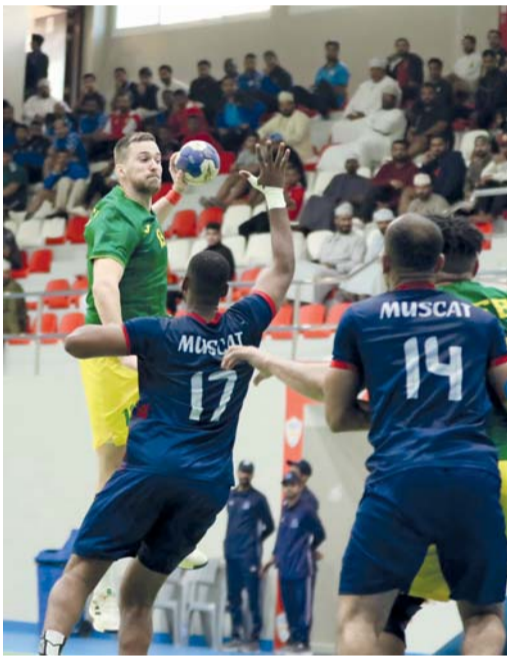
■ من مباراة السيب ومسقط

شهدت الجولة الرابعة من الدور الثاني لدوري عام السلطنة للدرجة الأولى لكرة اليد تعادلاً، حيث انتهى اللقاء الأول الذي جمع السيب ومسقط بالتعادل بنتيجة ٢٣ / ٢٣ في المباراة التي جرت أحداثها مساء أمس الأول على الصالة الرياضية بنادي عمان، كما سيطر التعادل أيضاً على المباراة الثانية بين نادي عمان وأهلي سداب بنتيجة ١٤ / ١٤ وبهذه النتائج أصبح لدى نادي عمان والسيب ومسقط ٥ نقاط، فيما حصد أهلي سداب نقطة الأولى في الدور الثاني وستقام غداً الثلاثاء مباراتان الأولى تجمع السيب مع أهلي سداب في الساعة الخامسة مساءً على ملعب الصالة الرئيسية بمجمع السلطان قابوس الرياضي ببوشر تليها على نفس الصالة المباراة الثانية بين مسقط ونادي عمان في الساعة السابعة مساءً.