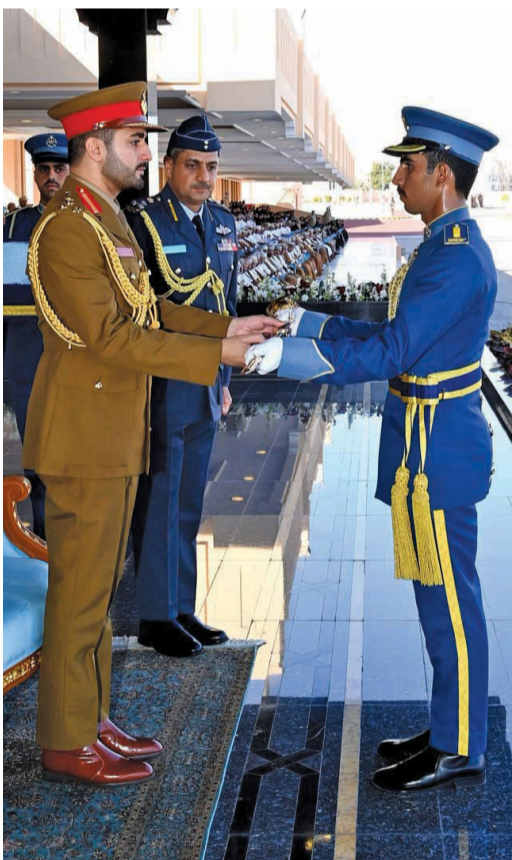
أثناء تسليم سموه سيف الشرف