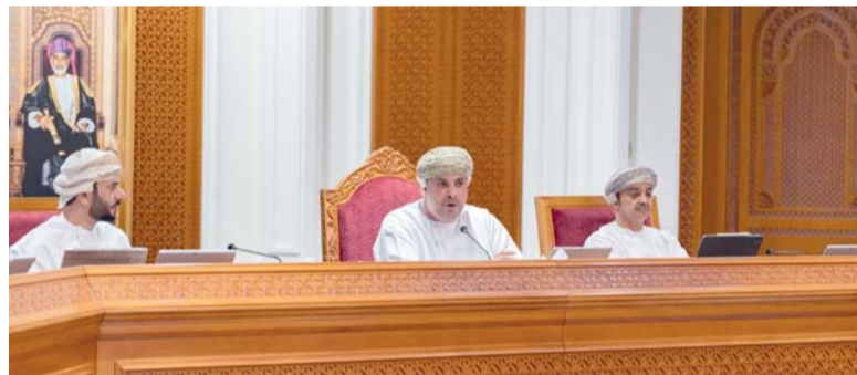
المجلس البلدي بمحافظة ظفار أثناء اجتماعه أمس

ومكاتب «سند»، وممثلة الشباب وجمعية المزارعين، وإدارة تنمية المؤسسات الصغيرة والمتوسطة، والتي بحثت عدد من المقترحات لتنظيم الحركة المرورية للشاحنات وسيارات الأجرة، وأعمال بيع ونقل وتسويق الحشائش، والسيات تعزيز الالتزام بالقوانين والأنظمة ذات العلاقة.