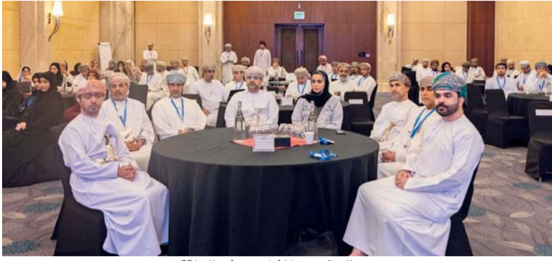
الحضور والمشاركون في الحلقة

نظمت وزارة التجارة والصناعة وترويج الاستثمار بالتعاون مع وحدة متابعة تنفيذ رؤية عُمان 2040، حلقة عمل بعنوان «حلقة التحديات التي تواجه ممارس الأعمال بفندق شيراتون مسقط والتي تمتد حتى 2 من فبراير القادم» حيث تجمع عددا من الجهات الحكومية والمستثمرين من مختلف القطاعات بهدف تعزيز بيئة الاستثمار في سلطنة عُمان، بما ينسجم مع أهداف رؤية عُمان 2040 وشهدت الحلقة حضور سعادة استام بنت أحمد الفروجية، وكيلة وزارة التجارة والصناعة وترويج الاستثمار وسعادة خالد بن سالم الغمري وكيل وزارة العمل للعمل وسعادة محمود