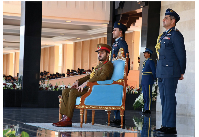
الحفل شهد عرض عسكري جسد مهارات المنتسبين والطائرات المقاتلة قدمت استعراضاً جويًا في سماء ميدان الاحتفال