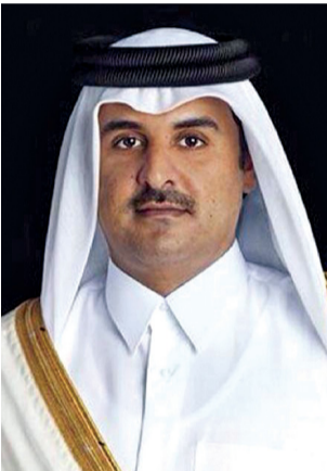
الزيارة تفتح أفقاً جديدة لتعميق الشراكة الاستراتيجية بين سلطنة عُمان ودولة قطر

مسقط. العُمانية: تلقى حضرة صاحب الجلالة السلطان هيثم بن طارق المعظم. حفظه الله ورعاه. برقية شكر جوازية من فخامة الرئيس شي جين بينغ رئيس جمهورية الصين الشعبية رداً على برقية جلّالته المعزية له في ضحايا الزلزال الذي ضرب إقليم التبت جنوب غرب الصين. وأعرب فخامة الرئيس في البرقية عن بالغ شكره وتقديره لجلالة السلطان على مشاعره الطيبة ودعوته الصادقة، مُتمنياً لجلالته تمام الصحة والعافية، وللشعب العماني السلام الدائم والرخاء العميم. تفاصيل... ص ٣