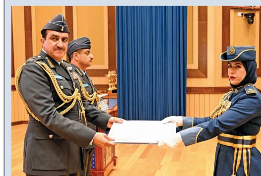
أثناء تسليم شهادات الدبلوم في العلوم العسكرية

ميدان الاستعراض مروراً من أمام المنصة الرئيسية، ثم قدمت فرقة موسيقى سلاح الجو السلطاني العماني معزوفات ومقطوعات موسيقية وعسكرية متنوعة عكست مدى المهارة الفنية والأداء الموسيقي العسكري المتقن الذي يجسد المستوى العالي والمهاري لمنتسبي موسيقى سلاح الجو السلطاني العماني وما زودت به من