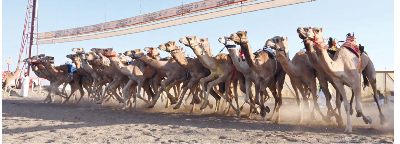
■ من انطلاق أحد أشواط السباق