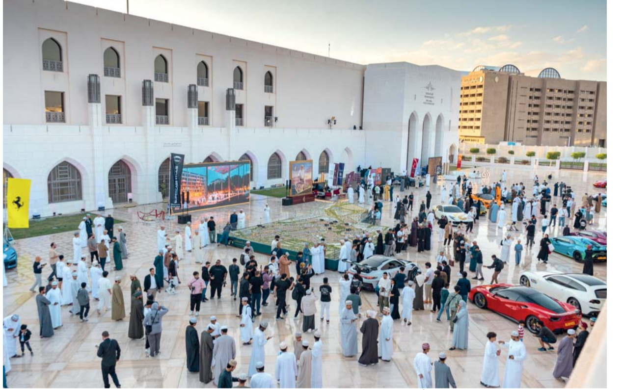
تجمع استثنائي للسيارات الرياضية وأحياء مدينة السلطان هيثم العصرية

نظرة للنقطة 5، وفي المباراة الثانية استطاع السيب الفوز على نادي أهلي سداب بنتيجة 7-0، ليصل السيب للنقطة 7، فيما وصل سداب للنقطة 4، وذلك في المباريات التي أقيمت على الصالة الفرعية لمجمع السلطان قابوس الرياضي ببوش. جاءت المبارتان قويتين ومثيرتين من طرفي المواجهات، ففي المباراة الأولى نجح البشائر في تحقيق الفوز على أهلي سداب بعدما تفوق في ثلاث فترات في حين لم يسعف تفوق نزوي في الربع الأول لتحقيق الفوز نتيجة فارق النقاط في باقي الفترات، حيث أنهى البشائر فترات المباراة الأربع 11-12 و 10-8 و 24-13 و 21-13 لتنتهي المباراة بفوز البشائر على نزوي بنتيجة 7-0. وفي المباراة الثانية تمكن السيب من الفوز على أهلي سداب بنتيجة 7-0، في مباراة مثيرة بدأ فيها أهلي سداب الربع الأول بشكل جيد، لكن السيب نجح بعدها في التعديل والتقدم وزيادة الفارق، حيث أنهى السيب فترات المباراة على النحو الآتي: 16-17 و 13-6 و 25-19 و 23-8 لتنتهي المباراة بفوز السيب على أهلي سداب بنتيجة 7-0.