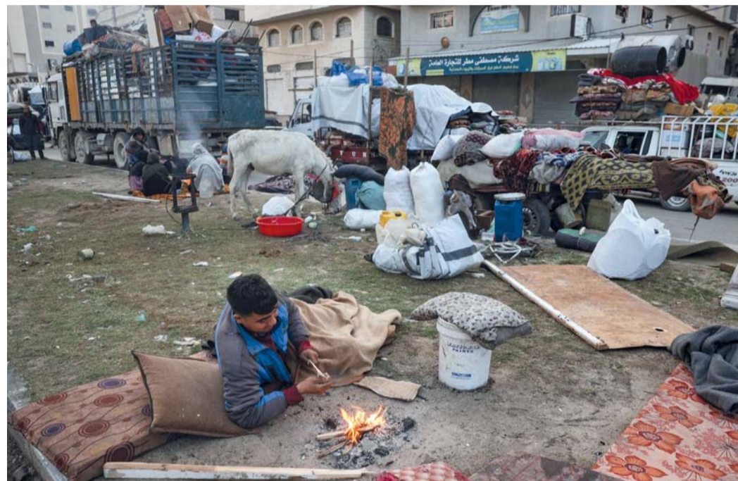
صبي فلسطيني يحاول تدفئة نفسه أمام نار بينما ينتظر النازحون الفلسطينيون على طول طريق صلاح الدين في النصيرات للعبور إلى الجزء الشمالي من قطاع غزة.

وفرض انسحاب حزب الله إلى ما وراء (نهر) الليطاني. وحمل الجيش اللبناني إسرائيل مسؤولية عدم استكمال انتشاره، مطالباً السكان بعدم الاقتراب من المناطق التي ينسحب منها الجيش الإسرائيلي والالتزام بتعليمات الوحدات العسكرية. وأقرّ حصول تأخير في عدد من المراحل نتيجة المماطلة في الانسحاب من جانب القوات الإسرائيلية، مؤكداً على جاهزيته لاستكمال انتشاره فور انسحاب الأخير. وتبادل الطرفان خلال الأسابيع الماضية الاتهامات بانتهاك وقف إطلاق النار. يشار إلى أن القصف الجوي والعمليات البرية الإسرائيلية أدت إلى نزوح مئات الآلاف ولم يتّح بعد لسكان العديد من القرى والبلدات الحدودية التي تعرّضت لدمار واسع، والعودة إليها مع تواصل الانتشار العسكري الإسرائيلي.