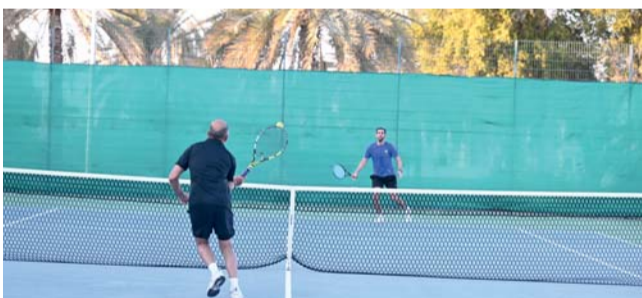
■ من مباريات بطولة عمان المفتوحة للتنس