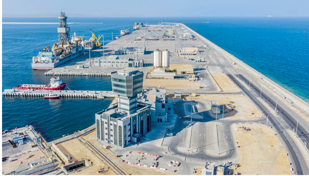
■ حجم التبادل التجاري بين البلدين وصل نهاية نوفمبر 2024 إلى نحو 90,8 مليون ريال عماني

لأي من دول مجلس التعاون الاستثمار فيها، ومن المتوقع أن تزيد نسبة الاستثمارات النوعية في سلطنة عُمان في القطاع السياحي واللوجستي والأمن الغذائي. وبين سعادته أنه تم تأسيس صندوق استثماري مشترك بين الجانبين العُماني والقطري تحت مسمى شركة الحصن للاستثمار حيث تأسست في عام 2007م وهي شركة مساهمة مغلقة مقرها في مسقط، وشراكة بين شركة قطر القابضة التابعة لهيئة الاستثمار القطرية بنسبة 50 بالمائة وجهاز الاستثمار العُماني بنسبة 50 بالمائة. ووضح سعادته أن الشركة تستثمر في مشروعات من مختلف القطاعات منها القطاع المصرفي، والصناعة، والاتصالات والتكنولوجيا، والغذاء، والرعاية الصحية، والتعليم والسياحة والنظف والغاز، وقد أثمرت بشركات استثمارية منها إنشاء الشركة العُمانية لتنمية الاستثمارات الوطنية وشركة قطر للمواد الأولية وغيرها.