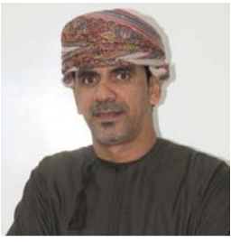
عبد الحميد الدوحاني شاعر عماني

إن كان غطتنا سحابة ماء وأسفلنا تراب ما نعترض إلا على ميعاد يخلدنا ويروح وإن كان نرجي فزعة من ذيب له ألفين ناب ما عاد في أرضي صلاح الدين أو في البحر نوح صرنا نبيع أحلامنا للشمس والسناب وأجمل ملامحنا تصب الخل في زيت الجروح ماتت ضمائرنا قبل لا يفتح للنور باب واستوقفتني ذاكرة طوفان مجد بلا طموح نعيش به وهو للأسف أصغر طموحاته عذاب ما يدري إن دللنا من أوجاعنا قامت تفوح أبعثذر إن كان طولنا عليك بلا جواب أعذارنا أقبح من ذنوب الفقير لا جا يلوح وأبعثذر عن آخر الوافين لأحضان الغياب إن ما قبلتوني عنز .. ما عاد للعشاق روح