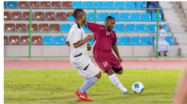
■ من مباريات البطولة

وهيئة الوثائق والمحفوظات الوطنية بنتيجة ٠/٠، أما منافسات المجموعة الخامسة انتهت بتعادل فريقي هيئة الطيران المدني وهيئة حماية المستهلك بنتيجة ٠/٠، وتفوق فريق وزارة الطاقة والمعادن على فريق وزارة المالية بنتيجة ٣/٤، وفي المجموعة السادسة فاز فريق هيئة تنظيم الخدمات العامة على فريق جهاز الرقابة الإدارية والمالية للدولة بنتيجة ١/٢، وكتسح فريق وزارة العمل نظيره فريق هيئة تنمية المؤسسات الصغيرة والمتوسطة به أهداف مقابل هدف وحيد، أما في المجموعة السابعة حقق فريق ديوان البلاط السلطاني فوزاً كبيراً على فريق الأكاديمية السلطانية العمانية بنتيجة ٠/٧، وتقدم فريق وزارة الأوقاف والشؤون الدينية على فريق وزارة التراث والسياحة بنتيجة ٠/١، وفي المجموعة الثامنة تعادل فريقاً الأمانة العامة لمجلس الوزراء ووزارة الإعلام بنتيجة ١/١، وتغلب فريق وزارة النقل والاتصالات وتقنية المعلومات على فريق وزارة الاتصالات وتنظيم