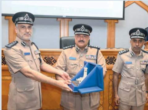
احتفلت شرطة عُمان السلطانية صباح أمس بيوم الجمارك العالمي لعام ٢٠٢٥

الجمارك العالمي لعام ٢٠٢٥ بشعار (الجمارك تقي بالتزامها بالكفاءة والأمن والأزدهار). رعى الاحتفال العميد محيي الدين بن هلال النوسعي مدير عام الجوازات والأحوال المدنية بحضور عدد من ضباط شرطة عُمان السلطانية وممثلي الجهات المعنية بالعمل الجمركي. وتطرق العميد سعيد بن خميس الغيثي مدير عام الجمارك في كلمته بهذه المناسبة إلى جهود شرطة عُمان السلطانية في تطوير وتحديث مختلف جوانب العمل الجمركي لتسهيل الإجراءات ودعم حركة التبادل التجاري، مشيراً إلى أن شعار هذا العام يؤكد الدور الاستراتيجي للإدارات الجمركية حول العالم في تحقيق التوازن بين متطلبات التسهيل والتيسير من جهة والرقابة والأمن من جهة أخرى.