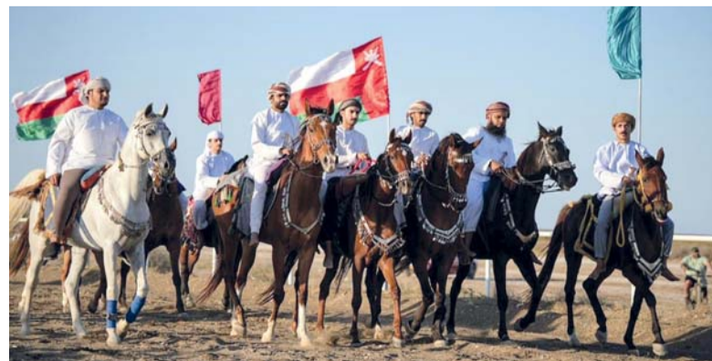
■ من استعراض الفرسان المشاركين في المهرجان

وعرضة الخيل، وتأتق الفرسان في استعراض مهاراتهم وتزيين خيولهم بالزينة التقليدية كما هو في الموروث العماني الأصيل، فقرات الحفل على إقامة مهارات للخيل بين سباق الإثارة وقفز الحواجز والتقاط الأوتاد وفقرات التحوير والهبل