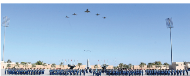
الحفل شهد عرضاً عسكرياً جسّد مهارات المنتسبين .. والطائرات المقاتلة قدّمت استعراضاً جويّاً في سماء ميدان الاحتفال

مسقط. العُمانية: رعى صاحب السمو السيد ذي يزن بن هيثم آل سعيد وزير الثقافة والرياضة والشباب احتفال سلاح الجو السلطاني العماني بيوميه السنوي الذي يوافق الخامس والعشرين من يناير من كل عام، وتخرّج نورة الضباط المرشدين الأساسية، ونورة الضباط المرشدين للخدمة المحدودة والجامعيين، وذلك على ميدان الاستعراض العسكري بقاعدة غلا وأكاديمية السلطان قابوس الجوية. تفاصيل... ص ٢