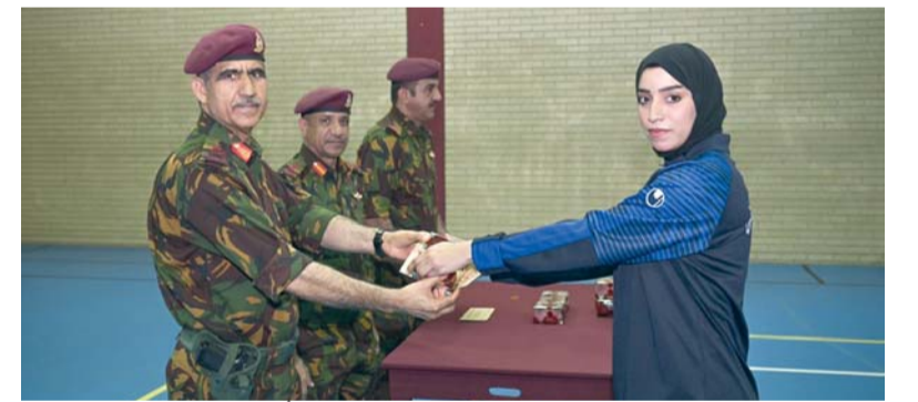
سالم الحوسني يكرم إحدى الراميات في فريق الحرس السلطاني العماني للرمية

مسقط. العمانية: كرم اللواء الركن سالم بن علي الحوسني قائد الحرس السلطاني العماني أسس فريق الحرس السلطاني العماني لرمية «التارجت سبرنت» الحاصل على المركز الأول على المستوى العام في مسابقة قوات السلطان المسلحة والأجهزة العسكرية والأمنية الأخرى لرمية «التارجت سبرنت» لعام 2025م وتحقيقه لعدد من المراكز الأولى في مختلف منافسات البطولة. وهذا اللواء الركن قائد الحرس السلطاني العماني الفريق على