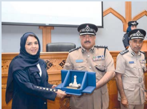
تكريم عدد من الضباط والجهات الفائزة

الجمارك العالمي لعام ٢٠٢٥ بشعار (الجمارك تقي بالتزامها بالكفاءة والأمن والأزدهار). رعى الاحتفال العميد محيي الدين بن هلال النوسعي مدير عام الجوازات والأحوال المدنية بحضور عدد من ضباط شرطة عُمان السلطانية وممثلي الجهات المعنية بالعمل الجمركي. وتطرق العميد سعيد بن خميس الغيثي مدير عام الجمارك في كلمته بهذه المناسبة إلى جهود شرطة عُمان السلطانية في تطوير وتحديث مختلف جوانب العمل الجمركي لتسهيل الإجراءات ودعم حركة التبادل التجاري، مشيراً إلى أن شعار هذا العام يؤكد الدور الاستراتيجي للإدارات الجمركية حول العالم في تحقيق التوازن بين متطلبات التسهيل والتيسير من جهة والرقابة والأمن من جهة أخرى.