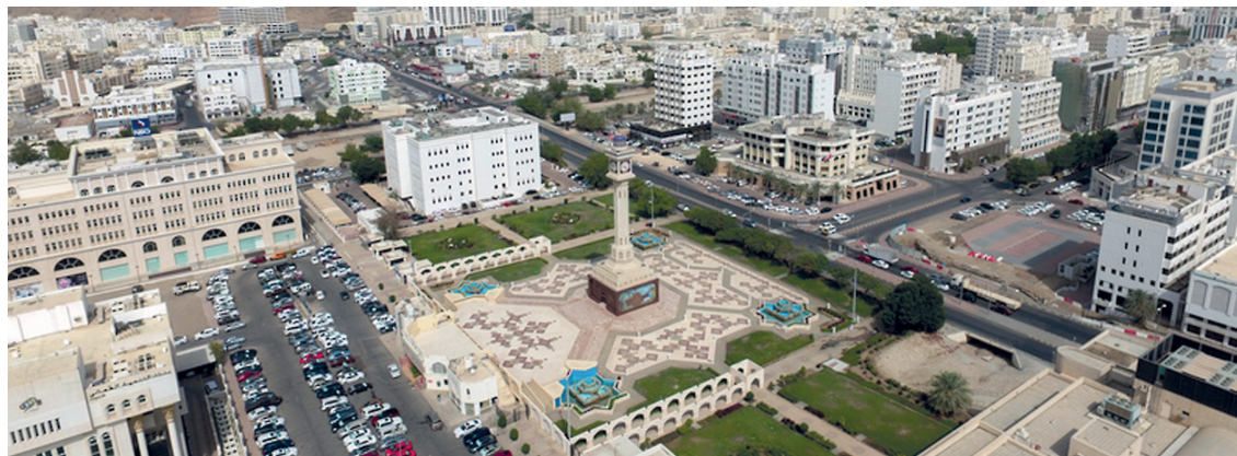
■ ارتفاع إجمالي الأصول للبنوك والنوافذ الإسلامية

مسقط . العُمانية : بلغ إجمالي الأصول للبنوك والنوافذ الإسلامية في سلطنة عُمان مجتمعة حوالي ٨,٣ مليار ريال عماني أي ما نسبته ١٨,٨ بالمائة من إجمالي أصول القطاع المصرفي في سلطنة عُمان بنهاية نوفمبر من العام الماضي ، مسجلة ارتفاعاً بمعدل ١٥,٤ بالمائة مقارنة بالفترة نفسها من عام ٢٠٢٣ م.