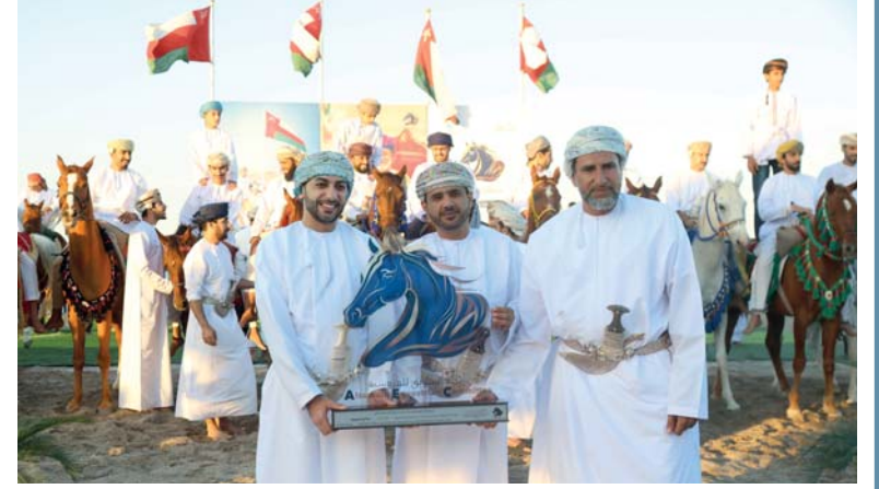
والي السويق يقدم هدية تذكارية لصاحب السمو السيد فهر بن فاتك راعي الحفل