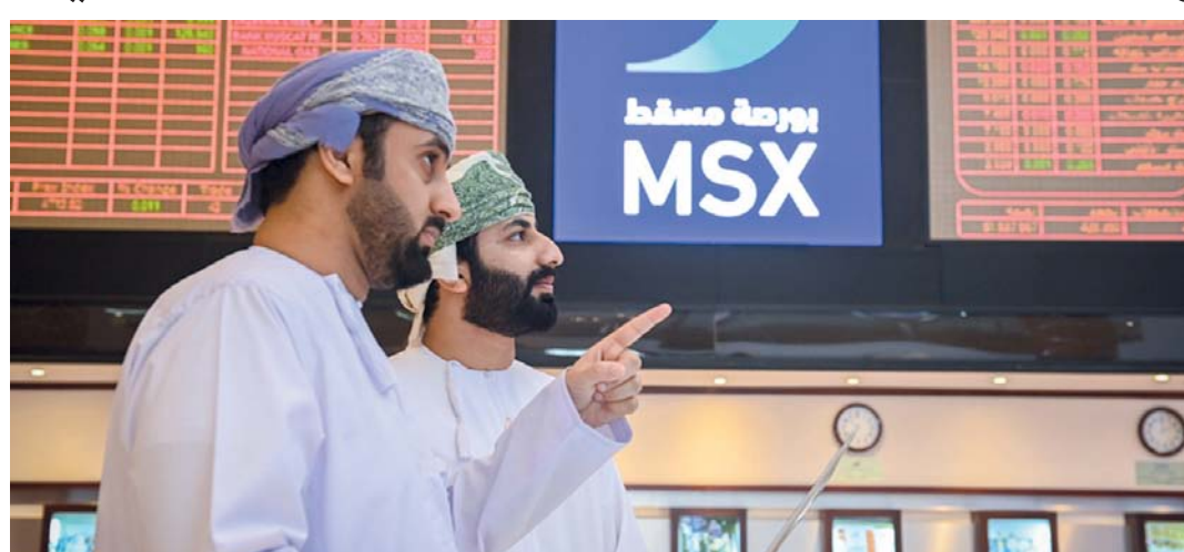
■ ارتفاع أرباح البنوك المحلية

خلال العام الماضي على ٢٦,٢ بالمائة من إجمالي قيمة الأسهم المتداولة في بورصة مسقط بعد أن شهدت تداولات بنحو ٣٠٥,٥ مليون ريال عماني، إلا أن تداولات البنوك سجلت العام الماضي تراجعاً بنسبة ٣١,٦ بالمائة عن مستواها في عام ٢٠٢٣ والبالغ ٤٤٧,١ مليون ريال عماني. وسجلت البنوك السبعة العام الماضي مكاسب في قيمتها السوقية تقدر بـ ٣٢٤,٨ مليون ريال عماني بعد أن شهدت بنهاية ديسمبر الماضي إلى ٤ مليارات و٥٩٥ مليون ريال عماني مستفيدة من ارتفاع أسعار الأسهم.