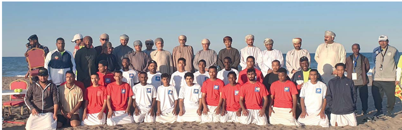
لقطة جماعية للمشاركين في الفعاليات مع راعي المناسبة

جنوب الباطنة «عن سعادته بنجاح الفعاليات الرياضية الشاطئية في كرة القدم والطائرة والألعاب الشعبية والإقبال الكبير الذي شهدته مؤكداً أن هذه الظاهرة الرياضية والثقافية تعكس الاهتمام بتنشيط الرياضات البحرية وتعزيز السياحة في ولاية المصنعة. وقال سعادته: «شهد المهرجان المصاحب لمهرجان جرب جنوب الباطنة نموذجاً رائعاً لدمج الرياضة بالتراث والثقافة في بيئة بحرية مثالية تمتاز بها ولاية المصنعة. إن الإقبال الكبير والمشاركة الواسعة تؤكد أهمية هذه الفعاليات في دعم السياحة الداخلية وتشجيع الشباب على ممارسة الرياضات البحرية والشاطئية، كما أن تخصيص مساحات للتراث والفنون الشعبية، إضافة إلى مشاركة ذوي الهمم، يعزز من القيمة المجتمعية لهذا الحدث، ومنتقل إلى المزيد من المبادرات المشابهة مستقبلاً».