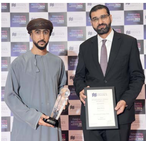
■ الجائزة تعكس جهود بنك نزوى في تبني مفهوم الابتكار والتحول الرقمي

واسعة من شرائح العملاء، حيث يقدم مجموعة شاملة من المنتجات المبتكرة التي تفي باحتياجات شرائح المجتمع كافة ويتصدر البنك في تعزيز الفرص الاستثمارية المتوافقة مع الشريعة مما يتيح للمستثمرين الاشتراك في الاكتتابات العامة من خلال تطبيق البنك وغير شبكة فروعه. ويواصل البنك التزامه بتعزيز الشمول المالي وتمكين الأفراد والشركات من ضمان مستقبلهم المالي وهذا النهج لا يقتصر على تحسين حياة عملائه فحسب، بل يساهم أيضاً في النمو الاقتصادي والاجتماعي العام وازدهار الوطن.