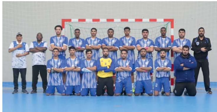
فريق صحم لكرة اليد