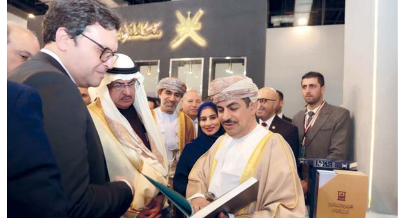
وقد سلطنة عُمان المشارك ترأسه معالي الدكتور عبدالله الحارصي وزير الإعلام