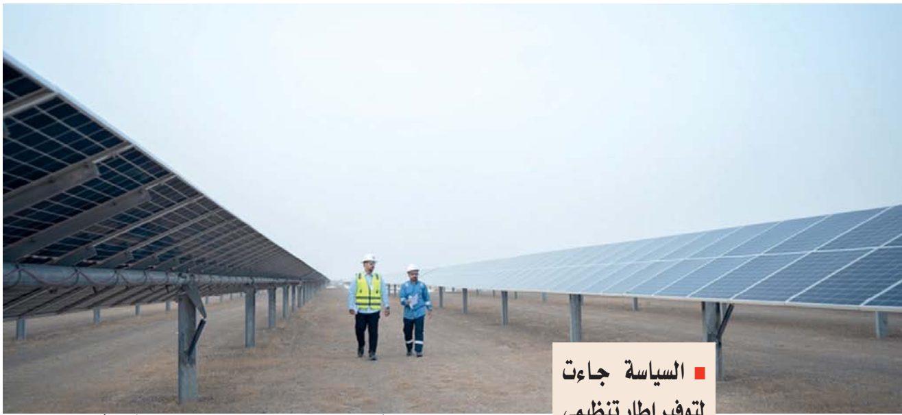
■ السياسات الثلاث تُشكل خطوة مهمة نحو تعزيز استغلال الطاقة المتجددة

يسهم في تعزيز البنية الأساسية للطاقة وتنظيمها. وأضاف أن السياسة تهدف إلى إيجاد بيئة استثمارية جاذبة توازن بين المصالح الاقتصادية والبيئية، مع الأخذ بعين الاعتبار تحقيق استدامة الشبكة الكهربائية وتلبية متطلبات المستهلكين والمستثمرين.