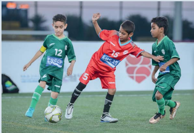
■ من منافسات البطولة السابقة

وتعليمية جنوب الباطنة ويمثلها مدرسة العهد للتعليم الأساسي، وتعليمية البريمي ويمثلها مدرسة الطلائع للتعليم الأساسي، وتعليمية مسندم ويمثلها مدرسة خصب للتعليم الأساسي. البطولة تستهدف طلبة الحلقة الأولى لفئة الذكور، والبالغ عددهم (١٠٠) طالب بواقع (١٠) طلاب من كل مدرسة، وسوف يقام دوري المجموعات أيام الأحد والاثنين والثلاثاء، بينما تقام مباريات تحديد المركزين الثالث والرابع والنهائي يوم الأربعاء، وسبق إقامة النهائيات تنفيذ مرحلة التصفيات بمشاركة (٣٣٠) مدرسة، ويمثلها (٣٥٣٢) طالبا وإشراف (٥٨٥) معلمة ومشرفة، ومعلمة من المدربين، والمدرسين، والمنظمين، والحكام، الجدير بالذكر أن مدرسة حي النهضة بتعليمية جنوب الباطنة توجت بلقب البطولة الماضية، ونالت مدرسة الشموخ بتعليمية الوسطى المركز الثاني، وجاء في المركز الثالث فريق مدرسة الخشبية بتعليمية شمال الشرقية.