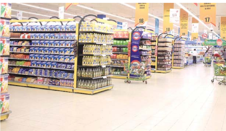
■ ارتفاع معدل التضخم

وسجلت محافظة مسندم أعلى نسبة ارتفاع بالتضخم بنهاية شهر ديسمبر ٢٠٢٤ مقارنة بالفترة المماثلة من العام السابق، حيث ارتفع المؤشر بنسبة ١,٦ بالمائة وارتفع أيضاً بنسبة ١,٥ بالمائة في محافظة جنوب الشرقية وبنسبة ١,٤ بالمائة في محافظة الوسطى، وبمحافظة الظاهرة ارتفع بنسبة ٠,٩ بالمائة وبنسبة ٠,٨ بالمائة في كل من محافظات البريمي والداخلية ووظفار وبنسبة ٠,٧ بالمائة بمحافظة شمال الشرقية، وارتفع المعدل بنسبة ٠,٦ في محافظة مسقط وبنسبة ٠,٥ بالمائة محافظة شمال الباطنة، أما في محافظة جنوب الباطنة فقد انخفض بنسبة ٠,١ بالمائة.