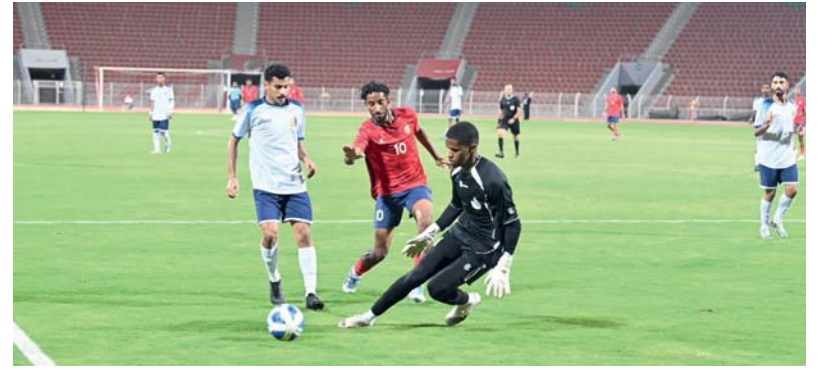
من المباراة النهائية