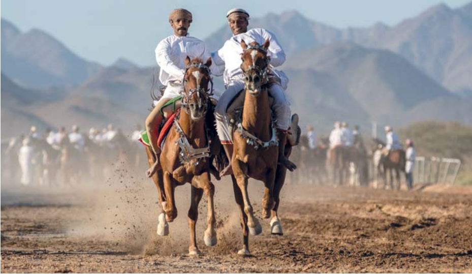
■ من فعاليات المهرجان