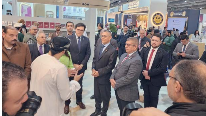
الزوار تعرفوا على المنجزات الثقافية والفكرية لسلطنة عُمان

وتشارك سلطنة عُمان بجناح موحد يضم وزارة الثقافة والرياضة والشباب ووزارة الإعلام ووزارة التراث والسياحة ووزارة الأوقاف والشؤون الدينية ومؤسسات من المجتمع المدني ودور نشر ومكتبات عُمانية، حيث يتضمن الجناح معرض المخطوطات العُمانية النادرة، ومعرض الفنون التشكيلية، وعروض فنية وموسيقية وشعبية وعروض أفلام ترويجية وسياحية قصيرة عن سلطنة عُمان، إلى جانب ركن خاص لتقنية (VR)، إضافة إلى فعاليات ثقافية متنوعة بين محاضرات وندوات وحلقات عمل وأمسيات شعرية.