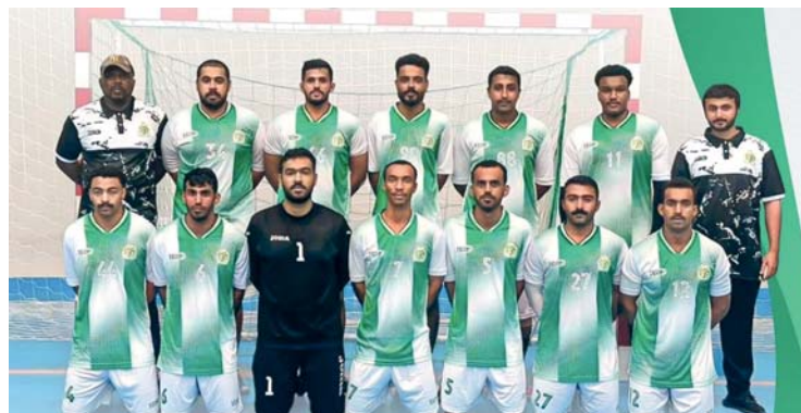
فريق صحار لكرة اليد