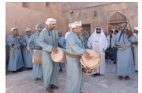
الوفد الزائر تعرف على تاريخ حصن جبرين وشاهد عروضاً للفنون الشعبية العمانية

وتخللت الزيارة مجموعة من الأنشطة الترفيهية المتنوعة، حيث تعرّف الطلبة على تاريخ الحصن وأهميته المعمارية والثقافية وقاموا بتجربة حية لمشاهدة طريقة صناعة الحلوى العمانية، وشاهدوا عروضاً مميزة للفنون الشعبية العمانية وفي زاوية الأركان الخاصة بالحرف التقليدية مثل السعفيات وصناعة الفخار والركن الخاص بالمأكولات العمانية التقليدية.