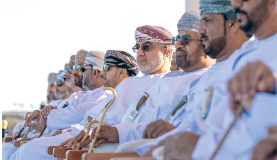
■ راعي المناسبة والحضور ومتابعة فقرات المهرجان