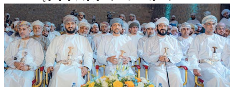
الحضور أثناء الحفل

محاضرة مسند، مبيّن أثر ما صنعته شخصية النبي محمد (النبي) انقسم إلى خمسة مشاهد