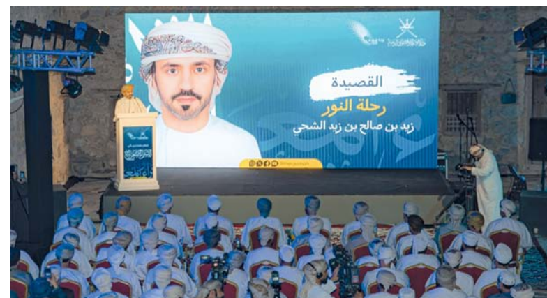
الحفل تضمن إلقاء قصيدة قصيدة عن ذكرى الإسراء والمعراج