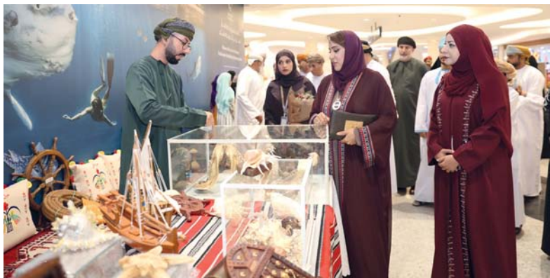
الاحتفال يجسد قيمة وطنية تؤكد تجديد الولاء للسلطان وحب الوطن

زوار الجناح بالمعارض وخاصة المجلدات القديمة والإصدارات العُمانية، لما تمثله من دور مهم في الانفتاح على الثقافة العُمانية. وتعرض الجمعية العمانية للكتاب والأدباء عدداً من إصداراتها الأدبية لعدد من الكتاب والأدباء العُمانيين والتي تعكس روح الثقافة العمانية وتجلياتها، كما تشكل هذه الإصدارات النتاج الفردي للكتاب والمبدعين في سلطنة عُمان، نظراً لما تتمتع به البيئة الثقافية من تنوع فكري وأدبي نوعي. ويعرض جناح النادي