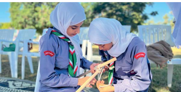
الفعاليات تضمنت مهارات التنمية الشخصية وأنشطة الكفاءات الاصطناعية

احتفت سلطنة عُمان - ممثلة بوزارة الأوقاف والشؤون الدينية - بمناسبة ذكرى الإسراء والمعراج لعام ١٤٤٦ هـ - على صاحبها أفضل الصلاة وأزكى السلام - وجسد الحفل الذي أقيم في حصن حصب بولاية حصب المواقع العظيمة والقيم الرفيعة المستلهمة من حادثة الإسراء والمعراج وأثرها في قلوب المسلمين وتذكير العالم الإسلامي بها ليستفيد منها أفراد المجتمع في واقعهم المعيش. رعى الحفل معالي السيد إبراهيم بن سعيد البوسعيدي محافظ مسند بحضور معالي الدكتور محمد بن سعيد المعمرى وزير الأوقاف والشؤون الدينية وعدد من أصحاب السعادة والفضيلة وعدد من المسؤولين من القطاع الحكومي والخاص وجمع من المواطنين. افتتح الحفل بتلاوة عطرة من كتاب الله الحكيم تلاها القارئ بلال بن محمد الشحي، وحوى الحفل فيلمًا مصورًا في حب النبي - صلى الله عليه وسلم -