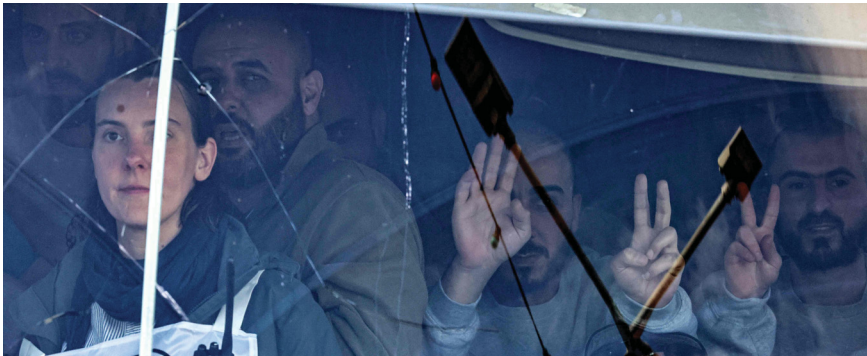
أسرى فلسطينيون يلوحون بشارة النصر أثناء ركوبهم في إحدى حافلات اللجنة الدولية للصليب الأحمر أثناء تحركها في بلدة بيتونيا بالقرب من رام الله في الضفة الغربية المحتلة.

يأتي ذلك فيما تمّ إنجاز الدفعة الثانية من صفقة تبادل الأسرى بغزة، حيث أفرجت كتائب القسام عن (٤) مُجنّدين «إسرائيليين» أسرتهم الكتائب، وتمّ التسليم في ميدان فلسطين وسط غزة مقابل تسليم (٢٠٠) أسير فلسطيني من بينهم (١٢١) من المحكوم عليهم بمؤبّدات و(٧٩) من ذوي الأحكام العالية.