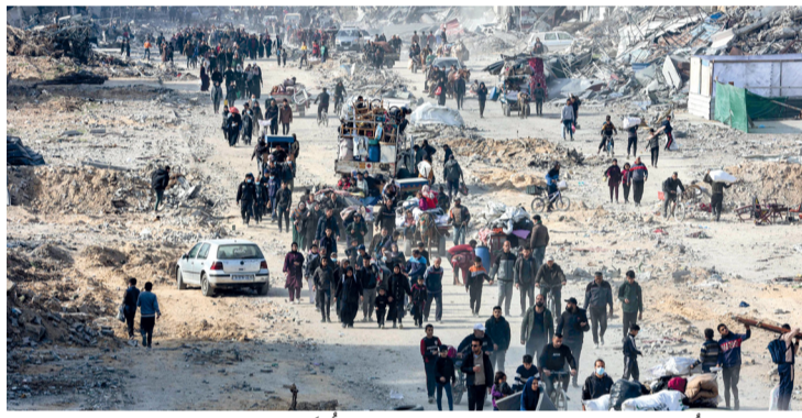
فلسطينيون يسبرون بالقرب من أنقاض المباني المدمرة على طول شارع الصفاوي في جباليا شمال قطاع غزة.