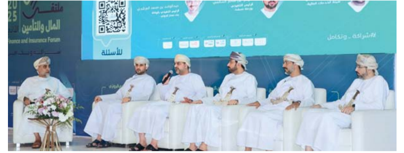
■ الملتقى يناقش أفضل الممارسات في قطاعات المال والتمويل والتأمين

أبو ظبي - العمانية: تشارك سلطنة عُمان ممثلة بوزارة المالية في الاجتماع السنوي العاشر لوكلاء وزارات المالية في الدول العربية الذي بدأت أعماله أمس في العاصمة الإماراتية أبو ظبي، بمشاركة من صندوق النقد الدولي والبنك الدولي ومنظمة التنمية والتعاون الاقتصادي، وتستمر لمدة يومين. ويناقش الاجتماع تحديات دعم الطاقة في المنطقة العربية، وتقييم أثر السياسات المالية على النمو، بالإضافة إلى التوجهات العربية في إدارة الدين العام ومخاطر المالية العامة، ودور جهود تنمية مصادر الطاقة المتجددة في تعزيز أمن الطاقة. واستعرضت وزارة المالية تجربة سلطنة عُمان في مراجعة دعم الطاقة، والجهود الحكومية المبذولة في هذا المجال، وتشجيع الاستثمار في مشاريع الطاقة المتجددة بما ينسجم مع أولوية التنويع الاقتصادي في رؤية عُمان ٢٠٤٠. كما سيتم خلال الاجتماعات استعراض تجارب الدول العربية في التحول الرقمي في المالية العامة، وتطبيق المعايير البيئية والاجتماعية والحوكمة في المؤسسات العامة. ويأتي هذا الاجتماع في إطار التحضير لاجتماع الدورة الاعتيادية السادسة عشرة لمجلس وزراء المالية العرب.