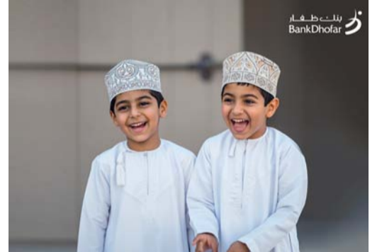
■ حساب الأطفال يسمح بتحديد أهداف الادخار ومتابعة الأموال