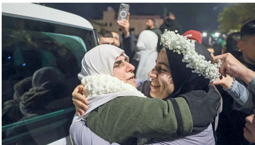
ذوو الأسرى الفلسطينيين يستقبلونهم عقب إطلاق الاحتلال سراهم.