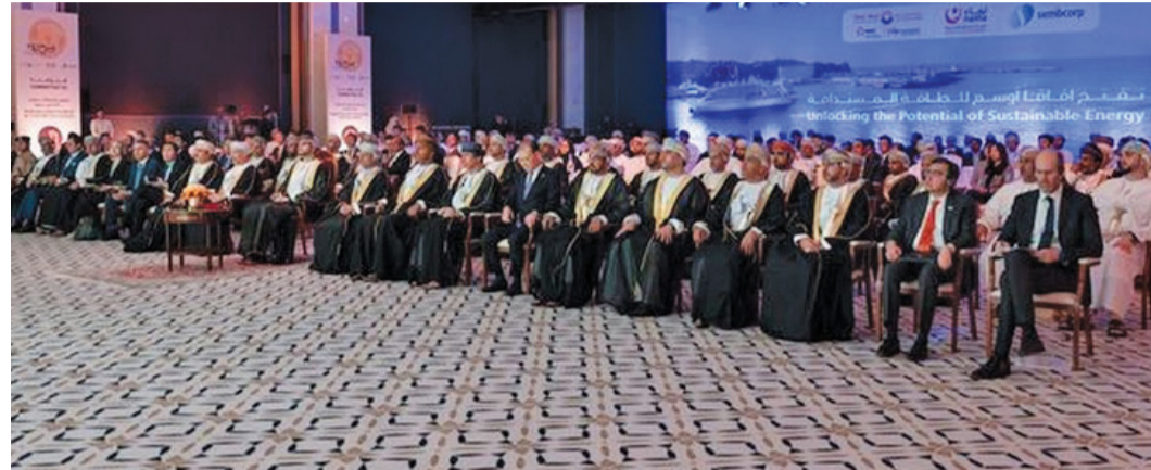
بلعرب بن هيثم أثناء افتتاح محطتي منح ١ ومنح ٢ للطاقة الشمسية بمحافظة الدُخلية أمس.

شركة نماء لشراء الطاقة والمياه إن الشركة ملتزمة بتعزيز استخدام الطاقة المتجددة وضمان أمن الطاقة واستدامتها على المدى الطويل للمساهمة في تحقيق رؤية سلطنة عُمان للحياد الصفري بحلول عام ٢٠٥٠م، مبيّن أن سلطنة عُمان سعت إلى زيادة سعة الطاقة المتجددة بمقدار ٨ جيجاواط بحلول عام ٢٠٣٠م إضافة إلى رفع نسبة مساهمة الطاقة المتجددة كجزء من مزيج