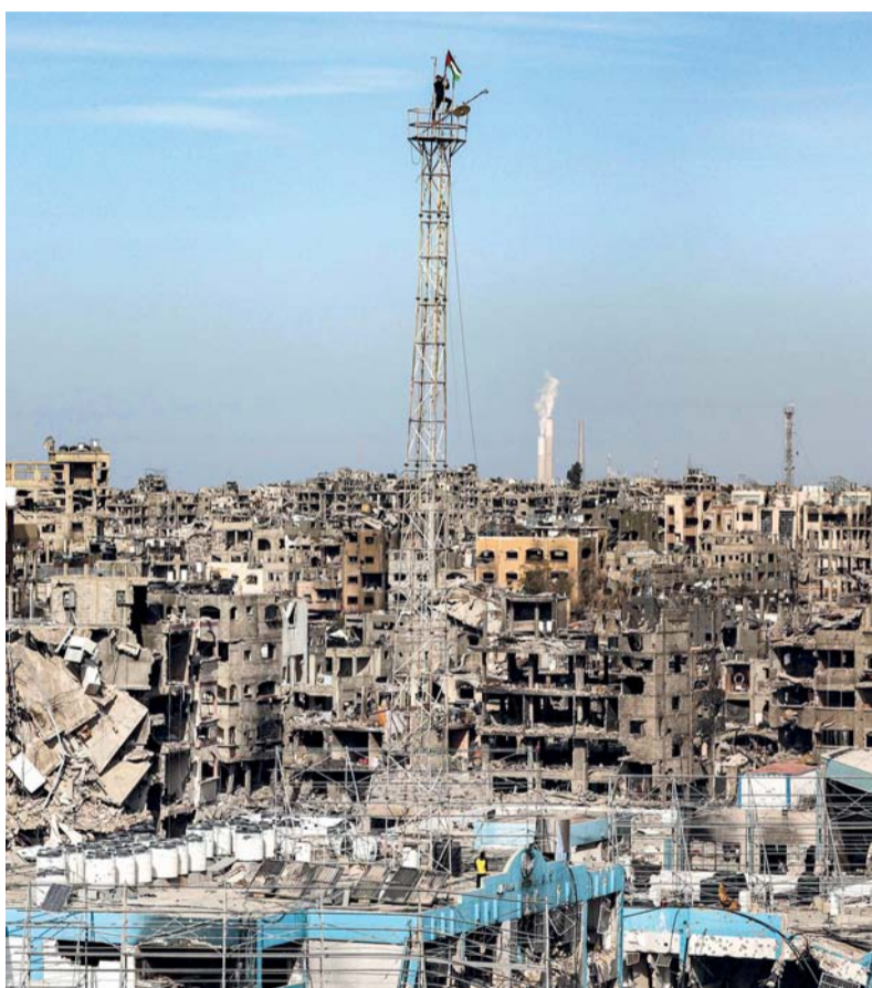
فلسطيني يثبت العلم فوق هوائي مبنى مدمر كان بمثابة عبادة لوكالة الأمم المتحدة لإغاثة وتشغيل اللاجئين الفلسطينيين (الأونروا) في مخيم جباليا للاجئين الفلسطينيين شمال قطاع غزة.

أسيراً فلسطينياً ضمن خطوات تطبيق اتفاق وقف إطلاق النار بين حركة حماس وإسرائيل الذي بدأ تنفيذه صباح أمس الأول. وأفادت وكالة الأنباء الفلسطينية «وفا»، بأن سلطات الاحتلال أفرجت الليلة قبل الماضية عن الدفعة الأولى من الأسرى ضمن اتفاق وقف إطلاق النار في غزة، مشيرة إلى أن حافلات الأسرى الفلسطينيين المرحج عنهم تحركت من سجن عوفر التابع للاحتلال إلى بلدة بيتونيا تمهيداً لنقلهم إلى بلداتهم في الضفة الغربية المحتلة. كما سلمت حركة حماس للجنة الدولية للصليب الأحمر في مدينة غزة ٣ محتجزات إسرائيليات ضمن خطوات تطبيق اتفاق وقف إطلاق النار. وفي هذا الصدد حذر المدير العام لمنظمة الصحة العالمية تيدروس أدهانوم غبرييسوس، من أن إعادة بناء النظام الصحي في قطاع غزة ستكون «مهمة معقدة وصعبة» بعد حرب مدمرة انطلقت قبل أكثر من ١٥ شهراً. وأكد غبرييسوس أنه ستكون تلبية الاحتياجات الصحية الهائلة وإعادة بناء النظام الصحي في غزة مهمة معقدة وصعبة، نظراً إلى حجم الدمار والتعقيدات التشغيلية والقيود الموجودة. من جانبه أعلن برنامج الأغذية العالمي التابع للأمم المتحدة سعيه لتوفير الغذاء لأكثر عدد ممكن من سكان قطاع غزة بعد إعادة فتح المعابر. وقال كارل سكاو نائب المدير التنفيذي للبرنامج إن شاحنات المنظمة ومقرها في روما بدأت دخول القطاع ونحاول الوصول إلى مليون شخص في أقرب وقت ممكن. ودخلت أولى شاحنات برنامج الأغذية العالمي إلى غزة من معبر كرم أبو سالم جنوب القطاع ومعبر زكيمة الواقع شماله، بحسب بيان للبرنامج. وأكد البرنامج على أنه خزن قرب قطاع غزة ما يكفي من الغذاء لإطعام أكثر من مليون شخص لمدة ثلاثة أشهر.