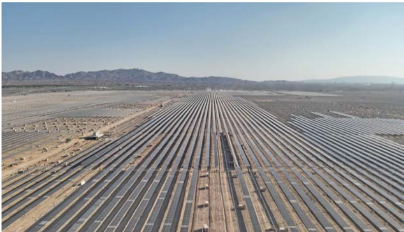
تشغيل المشروع يُمثل خطوة استراتيجية نحو تحقيق التحول المنشود في قطاع الكهرباء

شركة نماء لشراء الطاقة والمياه إن الشركة ملتزمة بتعزيز استخدام الطاقة المتجددة وضمان أمن الطاقة واستدامتها على المدى الطويل للمساهمة في تحقيق رؤية سلطنة عُمان للحياد الصفري بحلول عام ٢٠٥٠م، مبيّن أن سلطنة عُمان سعت إلى زيادة سعة الطاقة المتجددة بمقدار ٨ جيجاواط بحلول عام ٢٠٣٠م إضافة إلى رفع نسبة مساهمة الطاقة المتجددة كجزء من مزيج