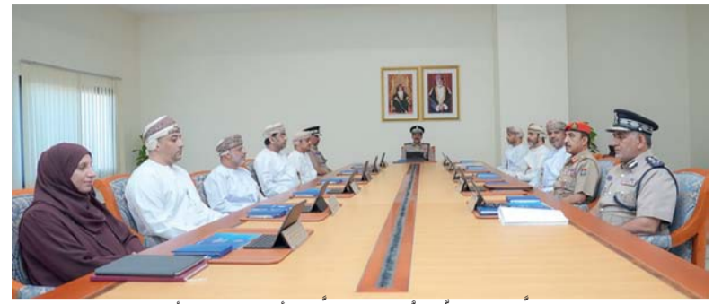
اللجنة الوطنية للسلامة على الطريق أثناء اجتماعها أمس

وحول المنتدى ألقى وزير التعليم العالي والبحث العلمي والابتكار كلمة قالت فيها: إن