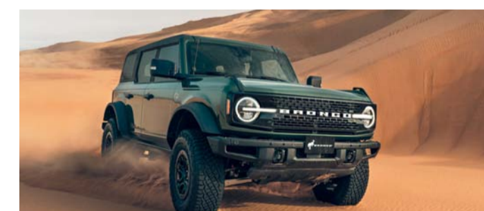
■ فورد برونكو قوة في الطرق الوعرة

معدت فورد برونكو من جديد ببنية وأداء قوي واستعداد مذهل حيث تتوفر بوجود عدد اثنين من الأبواب ويعد أول طراز من طرازات برونكو بأربعة أبواب على الإطلاق وتأتي برونكو سبورت صغيرة وصلبة و صم كل طراز من طرازات برونكو لتقديم تجارب مشوقة وواقعة على الطرق الوعرة وتتسم بجميع صفات سيارة برونكو الأصلية لعام ١٩٦٦ وترافقها في السباقات من خلال التقنيات المبتكرة الجديدة. وتعد تقنية الدفع الرباعي في صميم قدراتها على الطرق الوعرة وفي قلب كل ذلك نظام إدارة التضاريس الحصري مصمم لمساعدة السائقين على التحكم بشكل أفضل في أي نوع من التضاريس حيث خفضت تشكيلة سيارات فورد برونكو الجديدة كليا لاختبارات على مسارات سباق باجا، وتم تقديم ما يصل إلى سبعة أوضاع يختارها السائق بما في ذلك الوضع العادي والبني والرياضي والزلق والرمل والطين والشقوق والزحف الصخري للقيادة على الطرق الوعرة. ويتميز النظام المتقدم الاختياري بعلبة نقل كهروميكانيكي ذات سرعتين تصيف وضعا تلقائيا للمشاركة عند الطلب للاختيار