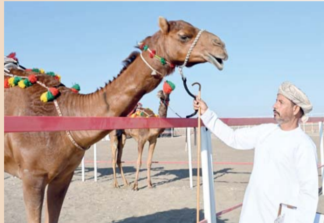
■ أحد أعضاء لجنة التقييم أثناء تقييمه للهجن المشاركة