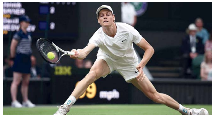
■ يانك سينر

العالمية للاعب التنس المحترفين، منذ أواخر عام ٢٠٢٤. في الموسم الماضي، حقق سينر الفوز في ٧٣ مباراة وخسر في ست، وتوج بثمانية ألقاب، وهو أول رجل يحقق الفوز بهذا العدد من البطولات في عام واحد منذ أن فعل البريطاني أندي موراي هذا الأمر في ٢٠١٦. وكان رون ٢١ عاماً يحاول الوصول لدور الثمانية في بطولة أستراليا المفتوحة للمرة الأولى في مسيرته، ويلتقي سينر في دور الثمانية، مع الفائز من مباراة دور الـ ١٦ التي تجمع بين الأسترالي أليكس دي مينور المصنف الثامن والأميركي أليكس ميتشيلسن،