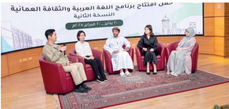
البرنامج يستمر حتى ٢٠ فبراير المقبل

مسقط . العُمانية: انطلقت بجامعة السلطان قابوس امس فعاليات النسخة الثانية من برنامج (اللغة العربية والثقافة العمانية) لعام ٢٠٢٥، بمشاركة ٧٧ منسباً من مركز الحضارة العربية بجامعة كاوان الفيدرالية بروسيا، واتحاد جامعة دانكوك وجامعة يوسان للدراسات الأجنبية بكوريا الجنوبية، ويستمر حتى الـ ٢٠ من فبراير المقبل، تحت رعاية صاحب السمو السيد الدكتور فهد بن الجندلي برنامج الشريك اللغوي، إلى