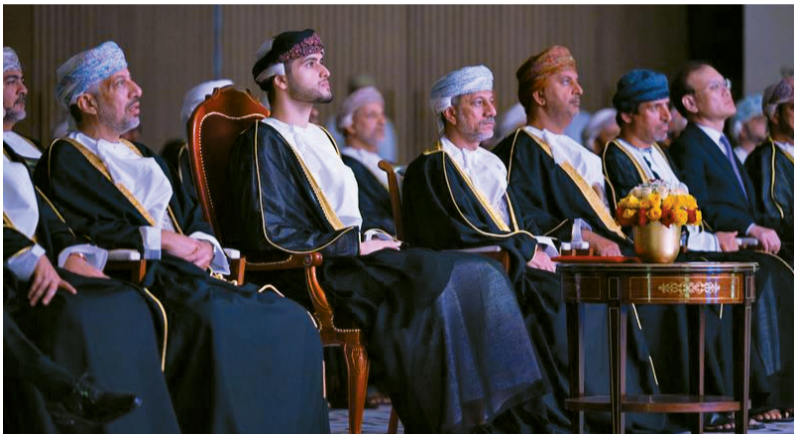
بلعرب بن هيثم أثناء افتتاح المشروعين أمس

ثاني أكسيد الكربون بمقدار (١,٤) مليون طن سنوياً، ما يُعد خطوة كبيرة نحو تحقيق الحياد الصُفري التي تطمح سلطنة عُمان له بحلول عام ٢٠٥٠م، والإسهام في تقليل الطلب المتزايد على الكهرباء بتوليد الطاقة الكهربائية الكافية بما يقرب من (١٢٠) ألف منزل. ■ تفاصيل.....ص ٤