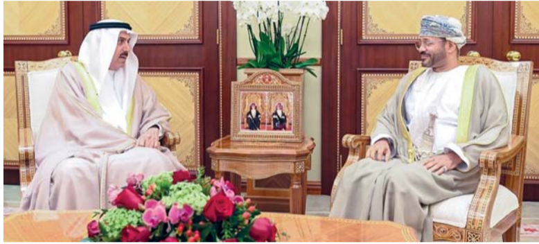
بدر البوسعيدي أثناء استقبله سقر غباش

مسقط. العُمانية: استقبل معالي السيد بدر بن حمد البوسعيدي وزير الخارجية أمس بديوان عام وزارة الخارجية، معالي سقر غباش، رئيس المجلس الوطني الاتحادي بدولة الإمارات العربية المتحدة، الذي يقوم بزيارة رسمية إلى سلطنة عُمان حالياً. ورخب معالي السيد بمعالي الضيف والوفد المرافق، مؤكداً على عمق العلاقات الأخوية والتاريخية التي تربط سلطنة عُمان ودولة الإمارات العربية المتحدة، والتي ترتكز على التعاون الوثيق والتنسيق المشترك في مختلف المجالات. وناقش الجانبان خلال المقابلة سبل تعزيز الشراكة بين البلدين، مع التأكيد على أهمية