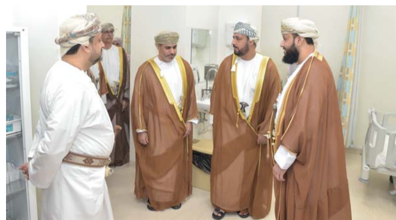
جولة تعريفية في أقسام المجمع الصحي

مكانة المحافظة وجهة صحية رائدة في المنطقة. وأضافت الميمنية أن افتتاح هذا المجمع يمثل خطوة مهمة نحو تحقيق أهداف رؤية عُمان ٢٠٤٠، التي تهدف إلى بناء نظام صحي مستدام يعزز من جودة الحياة ويواكب التطورات العالمية في مجال الرعاية الصحية، فالمجمع لا يقتصر دوره على تقديم خدمات علاجية فحسب، بل يسهم في تعزيز الجوانب الوقائية والتوعوية، بما يضمن بيئة صحية آمنة ومستدامة. وأوضحت أن هذه المشاريع تسهم في تخفيف الأعباء الصحية، وتعزيز الوقاية من الأمراض والكشف المبكر عنها؛ مما يقلل من التكاليف الصحية ويحسن نوعية الحياة. تخلل الحفل جولة تعريفية في أقسام المجمع الصحي، حيث اطلع سعادته والحضور على المرافق الحديثة والخدمات المتنوعة التي يقدمها المجمع، وعرض مقطع مرئي عن مراحل تنفيذ المشروع والخدمات التي سيقدّمها للمجتمع، وأبرز المشاريع الصحية بمحافظة مسقط والخدمات المقدمة فيها. وشيّد المجمع الصحي الذي استغرق تشييده أربعة