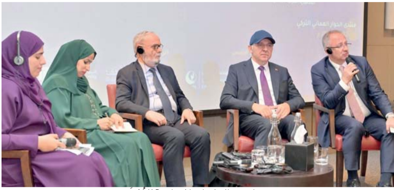
إحدى الجلسات المصاحبة للمنتدى

وأعرب سعادته عن أهمية المنتدى كمنصة مثالية لتعزيز التعاون العلمي والثقافي بين البلدين، مشيراً إلى تضمن المنتدى عدة جلسات نقاشية تهدف إلى تبادل الأفكار والمشاركة في تطوير مجالات التاريخ، الثقافة، الأدب، والدبلوماسية، كما أوضح أن هذه النقاشات ستسهم في تعزيز التفاهم المتبادل وتقوية الروابط بين البلدين. ويشترك في المنتدى ١٧ جامعة تركية بالإضافة إلى عدد من المراكز البحثية والثقافية التركية، وكافة مؤسسات التعليم العالي الخاصة، وعدد من المؤسسات التعليمية الحكومية بسلطنة عُمان.