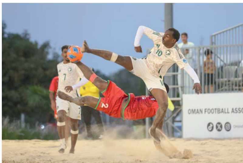
من المباراة الودية الأولى لمنتخبنا أمام نظيره المنتخب السعودي

للخسر منتخبنا الوطني لكرة القدم الشاطئية يوم أمس الأول تجربته الودية الأولى أمام شقيقه المنتخب السعودي بركات الجزاء الترجيحية بنتيجة 4/3 بعد انتهاء الوقت الأصلي للمباراة بالتعادل 4/4 في اللقاء الذي جمع المنتخبين على الملعب الرملي بمجمع السلطان قابوس الرياضي بجوشر، وذلك في إطار استعدادات الفريقين للمشاركة في نهائيات كأس أمم آسيا التي ستقام في شهر مارس القادم بتايلاند، حيث يلعب منتخبنا في المجموعة الرابعة بجوار منتخبات البحرين وماليزيا وفيتنام، بينما يلعب المنتخب السعودي في المجموعة الثانية بجوار منتخبات اليابان والعراق والصين.