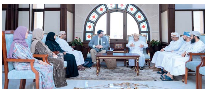
اللقاء تناول برامج تبادل الطلاب وأعضاء هيئة التدريس

التعاون في إنشاء حرم جامعي مصرف داخل الجامعة يعني بدراسة البرامج التي تقدمها، بهدف تعزيز تجربة الطلبة من خلال الخوض في مناهج دولية وتقديم الدعم للشباب لنحويل أفكارهم إلى مشاريع ناجحة ومبتكرة. والمشاركة في تطوير برنامج الماجستير الذي تقدمه الجامعة لتنسيبها. تناول اللقاء أهمية برامج تبادل الطلاب وأعضاء هيئة التدريس بين المؤسسات، إلى جانب تنظيم ندوات ومسابقات وفعاليات مشتركة في ريادة الأعمال، ما يعزز الابتكار ويحفز الطلاب على تطوير أفكارهم الريادية. حضر الاجتماع عدد من نواب رئيس الجامعة ومساعديه بالفرع، بالإضافة إلى مسؤولين من رئاسة الجامعة.