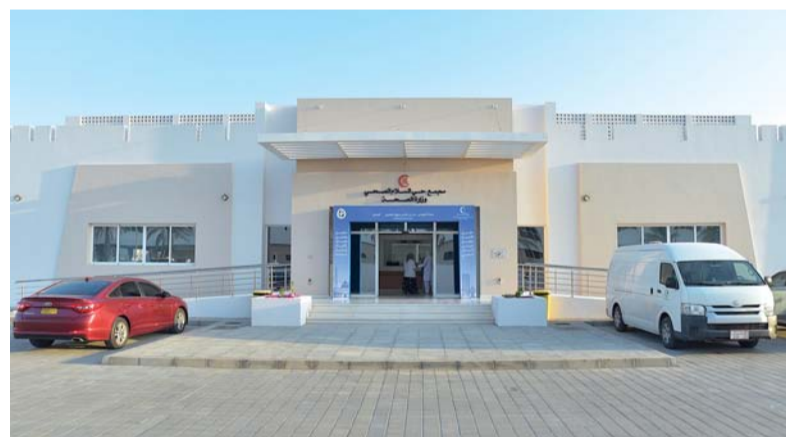
المشروع شُيّد على مساحة ١٥ ألف متر مربع

صحية عالية المستوى، تلبي على حد سواء؛ حيث إننا نؤمن بأن هذا المجمع سيصبح احتياجات المواطنين والمقيمين الرعاية الصحية، وسيعزز من