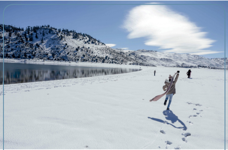
سياح يستمتعون بالأجواء الشتوية على ضفاف بحيرة «أكلام سيدي علي» في مدينة تيمحضيت بالمغرب