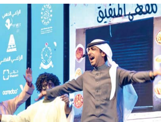
مشهد من العرض المسرحي «دك ولا لك»