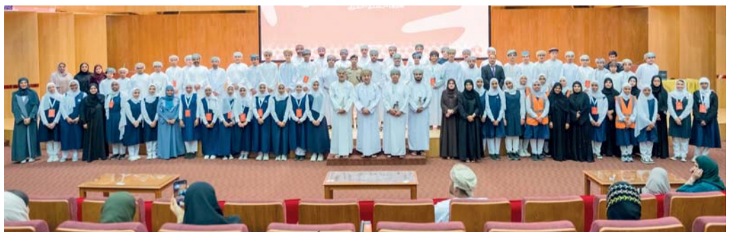
صورة جماعية لراعي الاحتفالية والطلاب المشاركين في المسابقة

اختتمت مؤخراً مؤسسة إشراقة، كيمي رامداس لتعمية المجتمع، بنجاح مسابقة المسؤولية الاجتماعية، والتي أقيمت برعاية سعادة الشيخ الدكتور حمد بن سعيد المعمرى والى مطرح. المبادرة تهدف إلى تعزيز العمل التطوعي وتنمية مهارات القيادة والعمل الجماعي بين الطلاب، حيث شارك في البرنامج الذي أقيم على مدار خمسة أسابيع ٥٠ طالباً وطالبة من ١٠ مدارس حكومية في مطرح، بهدف تعزيز إبداعهم وتشجيعهم على تطوير أفكار قابلة للتنفيذ لمشروع المسؤولية الاجتماعية. حيث تم تنظيم سلسلة من حلقات العمل والأنشطة المصممة لتثقيف الطلاب وتعزيز مهاراتهم حول التفكير الإبداعي والعمل الجماعي المرتبط بأنشطة المسؤولية الاجتماعية وذلك بقيادة مختصين في هذا المجال. كما عمل الطلاب على تنفيذ أفكار مشاريعهم بإشراف وتوجيه من فريق إشراقة وأعضاء لجنة تحكيم المسابقة. وأكد نايلش كيمي عضو مجلس إدارة مجموعة كيمي رامداس، على أهمية تعزيز المسؤولية الاجتماعية لدى الناشئة، حيث قال: تهدف في مثل هذه المبادرات إلى تمكين الجيل القادم من الإسهام بفعالية في التنمية الاجتماعية والاقتصادية في سلطنة عمان بما