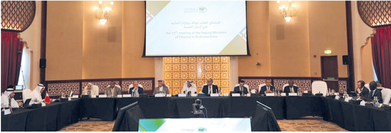
■ الاجتماع يناقش تحديات دعم الطاقة في المنطقة العربية

أبو ظبي - العمانية: تشارك سلطنة عُمان ممثلة بوزارة المالية في الاجتماع السنوي العاشر لوكلاء وزارات المالية في الدول العربية الذي بدأت أعماله أمس في العاصمة الإماراتية أبو ظبي، بمشاركة من صندوق النقد الدولي والبنك الدولي ومنظمة التنمية والتعاون الاقتصادي، وتستمر لمدة يومين. ويناقش الاجتماع تحديات دعم الطاقة في المنطقة العربية، وتقييم أثر السياسات المالية على النمو، بالإضافة إلى التوجهات العربية في إدارة الدين العام ومخاطر المالية العامة، ودور جهود تنمية مصادر الطاقة المتجددة في تعزيز أمن الطاقة. واستعرضت وزارة المالية تجربة سلطنة عُمان في مراجعة دعم الطاقة، والجهود الحكومية المبذولة في هذا المجال، وتشجيع الاستثمار في مشاريع الطاقة المتجددة بما ينسجم مع أولوية التنويع الاقتصادي في رؤية عُمان ٢٠٤٠. كما سيتم خلال الاجتماعات استعراض تجارب الدول العربية في التحول الرقمي في المالية العامة، وتطبيق المعايير البيئية والاجتماعية والحوكمة في المؤسسات العامة. ويأتي هذا الاجتماع في إطار التحضير لاجتماع الدورة الاعتيادية السادسة عشرة لمجلس وزراء المالية العرب.