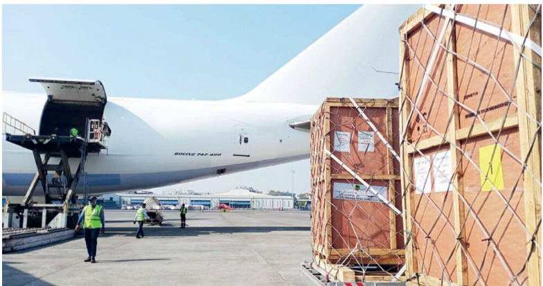
«أسياد» تؤكد قدرتها على تقديم حلول لوجستية متكاملة تلبي احتياجات الأسواق العالمية

مسقط . العُمانية: نجحت مجموعة «أسياد» في تنفيذ عملية شحن متكاملة من جمهورية الهند إلى جمهورية نيجيريا، من خلال تقديم حلول شحن متعددة الوسائط عبر النقل البحري والجوي؛ لنقل حمولة ثقيلة بلغ وزنها (٣٣٥) طناً مترياً من المعدات المتخصصة. وتضمنت العملية نقل معدات للغاز الطبيعي المضغوط، ومولدات ولوحات كهربائية، وأسطوانات غاز فارغة، وقطع غيار، بدءاً من التجميع والتخزين والشحن، إلى التوثيق والتخليص الجمركي، وصولاً إلى النقل الجوي والبحري في وقت واحد. تفاصيل.....«الاقتصادي»