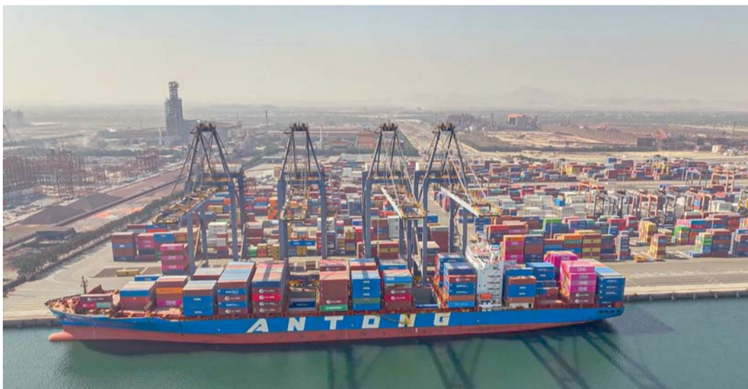
■ ارتفاع قيمة صادرات سلطنة عمان من النفط والغاز بأكثر من ١٣ مليار ريال عماني بنهاية أكتوبر الماضي

وأيضا في نهاية شهر أكتوبر ٢٠٢٤ سجلت ٢٠٢٤ بما قيمته ٨٣٩ مليون ريال عماني، بارتفاع نسبه ١٠,٨ بالمائة عن نهاية شهر أكتوبر ٢٠٢٣ وكذلك عمليات التبادل التجاري في إعادة التصدير من سلطنة عمان، حيث بلغت قيمة إعادة التصدير إليها ٤٩٤ مليون ريال عماني. أيضا في الدول المصدرة لسلطنة عمان بقيمة ٣ مليارات و ٢٨٦ مليون ريال عماني.