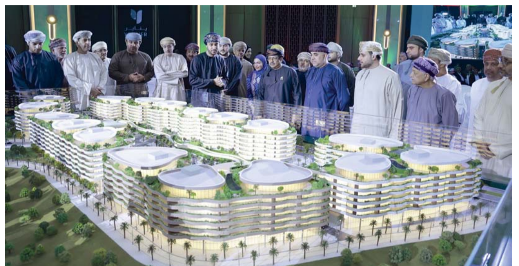
■ مشروع «مساكن يناير»، محطة جديدة في مفهوم الحياة الفاخرة

وقال معالي الدكتور خلفان بن سعيد الشيعلي وزير الإسكان والتخطيط العمراني، إن «مساكن يناير» التي تقع في قلب مدينة السلطان هيثم، روح التطور العمراني المستدام، وتتماشى مع أهداف رؤية عمان ٢٠٤٠، وتظهر التزام البلاد بالابتكار حيث تمثل أكثر من مجرد عنوان، فهي وجهة متكاملة للحياة العصرية للباحثين عن التميز وتمتد هذه المدينة الصديقة للبيئة على مساحة ٢,٩ مليون متر مربع، وتضم مكونات رئيسية مثل المساحات الخضراء، البنية التحتية الذكية، والمرافق المتكاملة التي تشمل الرعاية الصحية، المدارس، الجامعات، المساجد، المنشآت التجارية، الأسواق، والمراكز الثقافية ومراكز رعاية الأطفال.