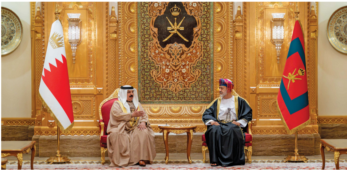
جلالة السلطان وملك البحرين أثناء جلسة المباحثات الرسمية بقبض العلم العامر أمس

للشهبونة . العُمانية: استقبل فخامة الرئيس الدكتور مارسيلو ريبيلو دي سوزا رئيس الجمهورية البرتغالية سعادة السفير أحمد بن محمد العريمي لتقديم أوراق اعتماده سفيراً فوق العادة ومفوضاً لسلطنة عُمان غير مقيم لدى جمهورية البرتغال، وذلك بالقبض الرئاسي. ونقل سعادته خلال المقابلة تحيات حضرة صاحب الجلالة السلطان هيثم بن طارق المعظم . حفظه الله ورعاه . وتمنيات جلالة لفضائله بموفور الصحة والسعادة، ولحكومة وشعب جمهورية البرتغال الصديق بدوام التقدم والازدهار.