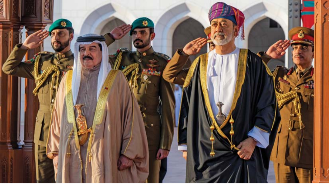
■ العاهلان أثناء عزف السلام الوطني لمملكة البحرين