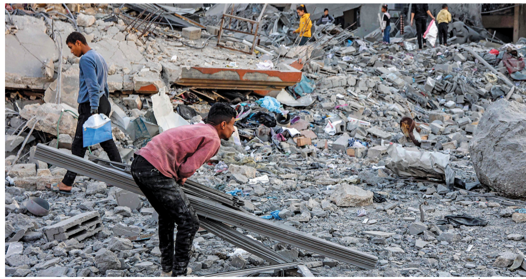
فلسطينيون يرفعون بعض الأنقاض من موقع القصف الإسرائيلي على مبنى سكني في شارع الجلاء بمدينة غزة أمس.