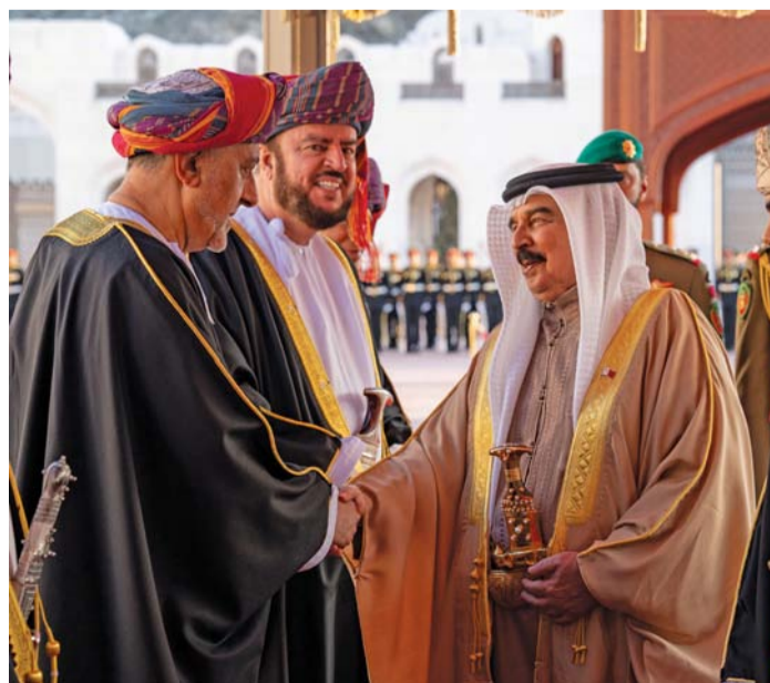
■ .. ويصافح شهاب بن طارق