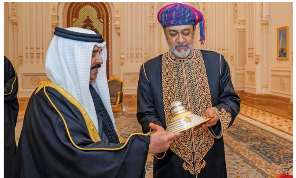
العاقلان يتبادلان الهدايا التذكارية تعبيراً من لذن جلالتهما عما يجمع البلدين والشعبين من أواصر أخوة ووشائج قرى