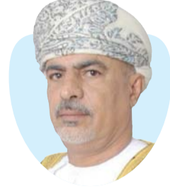
عبدالفار بن عبدالكريم البلوشي سفير سلطنة عمان لدى بنجلاديش

هذه الزيارة الميمونة التي أثارت في نفسي الذكريات الشخصية ورحلة العمر، وجعلتني أكتب هذه السطور دون أن أعرف أين أتوقف.