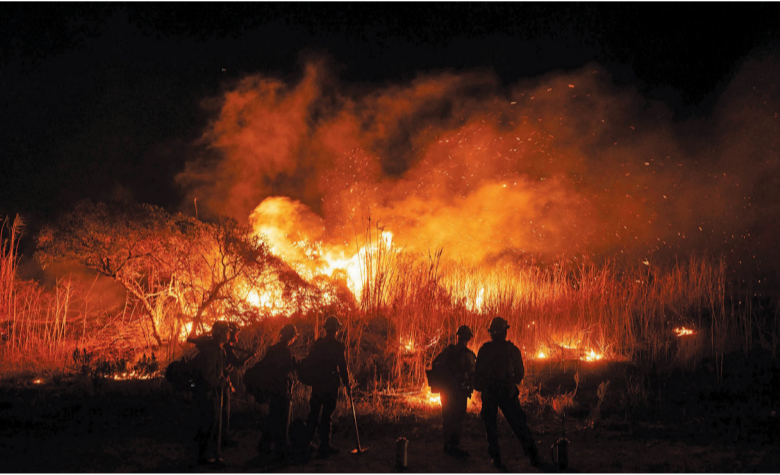
رجال إطفاء يحاولون السيطرة على انتشار الحرائق المستعرة شمال غرب مدينة لوس أنجلوس بولاية كاليفورنيا الأمريكية

تفاديه بعد. وأضافت: «الرؤية ليست واضحة أمامنا حتى الآن... وينبغي ألا نتخلى عن حذرنا». وتقوم حالياً سلطات المدينة بتقديم كمادات واقية مجانية للأفراد، بسبب زيادة كميات الرماد والغبار الناعم المنتشرة في الهواء. ومع دخول حرائق الغابات المدمرة التي خلفت دماراً بالمقاطعة أسبوعاً الثاني، قالت المدينة إنها يساورها القلق بشأن التأثيرات الصحية الناتجة عن الدخان على الفئات الأكثر عرضة للخطر.