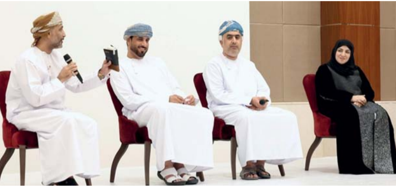
■ الندوة ناقشت نتائج البحث الاستراتيجي لتوظيف تقنية تتبع حركة العين في قراءة اللغة العربية