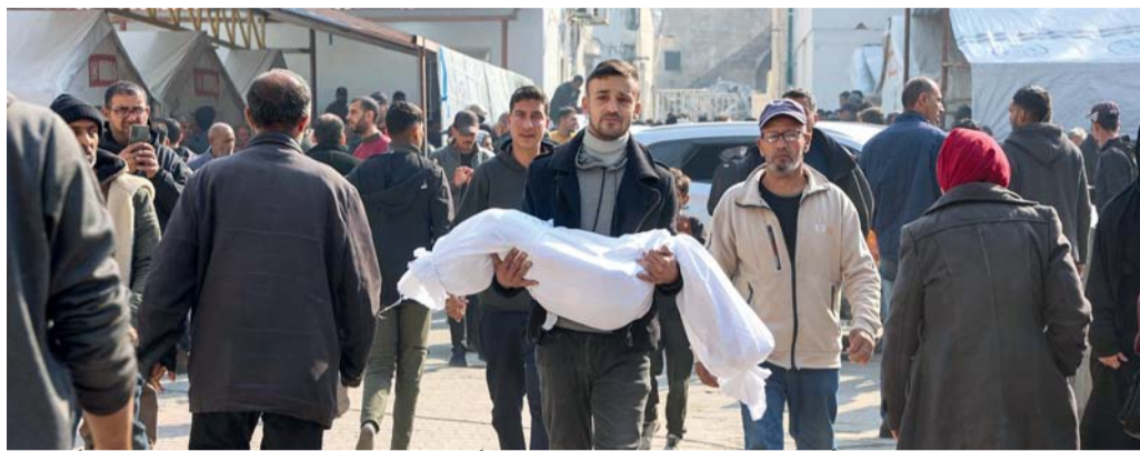
■ فلسطيني يحمل جثمان طفله الذي استشهد في غارة إسرائيلية على غزة، في المستشفى الأهلي العربي، المعروف أيضاً باسم المستشفى المعداني.

للإعلان عن الصفقة «ثلاثة مراحل تنتهي بالإنفراج عن جميع المختطفين مقابل آلاف الأسرى الفلسطينيين وعودة النازحين وإخلاء المساعدات». أما المرحلة الثالثة فهي إعادة إعمار غزة وترتيبات اليوم التالي للحرب. وقال مسؤولون إسرائيليون كبار لصحيفة «يسرائيل هيوم» في وقت سابق إن الصفقة تقدمت بسبب رغبة ترامب في تقديم إنجاز قبل دخول البيت الأبيض.