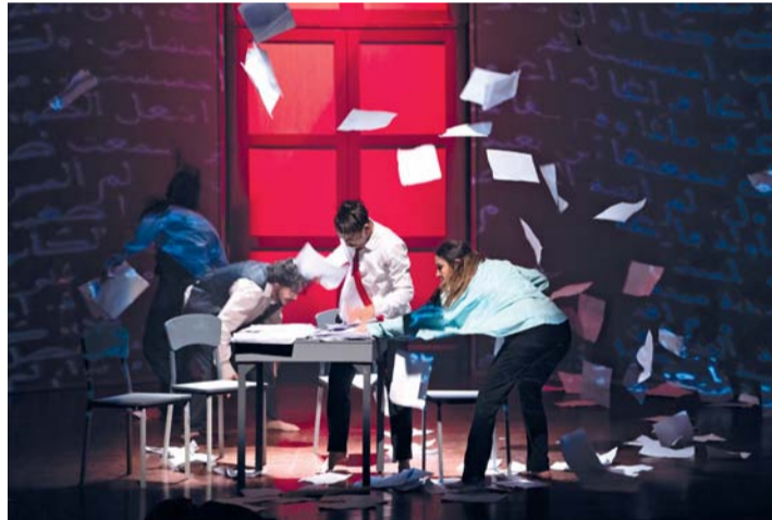
■ العروض عكست تنوع الاتجاهات المسرحية العربية وتناولها قضايا الحاضر وملامح المستقبل

وكما رافقت المهرجان فعاليات فكرية بارزة، أبرزها مؤتمر بعنوان (المسرح والذكاء الاصطناعي بين صراع السيطرة وثورة الإبداع)، الذي امتد لثلاثة أيام وركز على الدور المتنامي للتكنولوجيا في المشهد المسرحي. قدم الباحثون والمختصون،