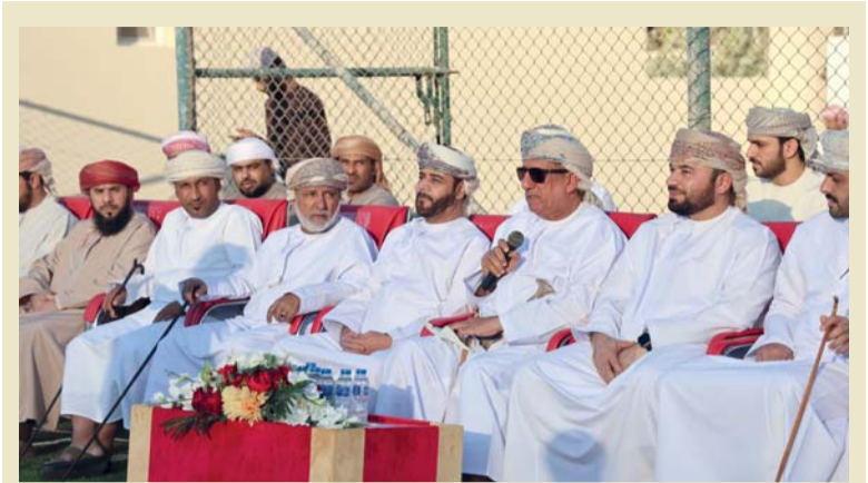
إعلان افتتاح البطولة

حفل الافتتاح أقيم برعاية الشيخ طلال بن سعيد المعمرى، الرئيس التنفيذي للشركة العمانية للاتصالات «عمانتل»، وبحضور سعادة الشيخ سالم بن حمد المحروقي رئيس اللجنة العمانية للكراتيه وبرعاية بلدية مسقط، حيث وأثناء الحفل أقيمت المباريات النهائية لفئة متلازمة داون وفئة أصحاب الكراسي وبعدها تم تتويج الفائزين بالميداليات الملونة. كما تم تكريم الحكام الدوليين والوطنيين، وتقديم الدروع التذكارية للجهات