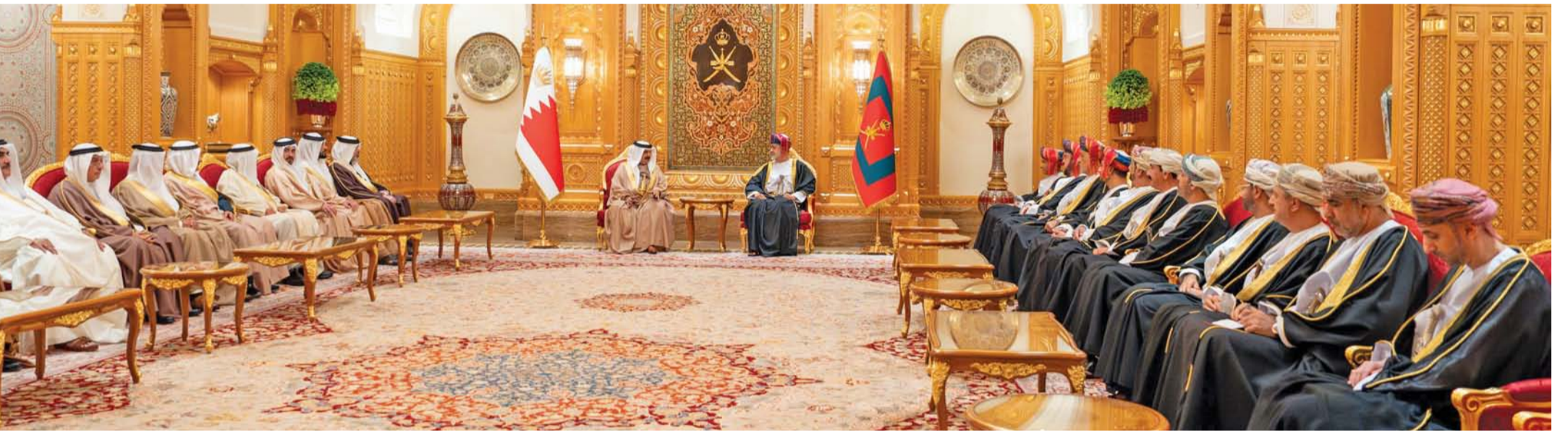
■ جلالة السلطان وملك البحرين أثناء جلسة المباحثات الرسمية بقصر العلم العامر أمس

الشيخ عبد الله بن حمد آل خليفة الممثل الشخصي لجلالة الملك، وسُمو الشيخ ناصر بن حمد آل خليفة الممثل الشخصي لجلالة الملك للأعمال الإنسانية وشؤون الشباب، وسُمو الشيخ خالد بن حمد آل خليفة رئيس الهيئة العامة للرياضة رئيس اللجنة الأولمبية البحرينية، ومعالي الشيخ خالد بن أحمد آل خليفة وزير الديوان الملكي، ومعالي الشيخ سلمان بن عبد الله آل خليفة نائب رئيس اللجنة العليا للتخطيط العمراني، ومعالي الفريق أول الشيخ راشد بن عبد الله آل خليفة وزير الداخلية، وسعادة نبيل بن يعقوب الحمر مستشار جلالة الملك للإعلام، ومعالي الشيخ خالد بن أحمد آل خليفة مستشار جلالة الملك للشؤون الدبلوماسية، وسعادة الدكتور ماجد بن علي النعيمي وزير الشؤون العامة بالديوان الملكي، وسعادة الدكتور عبد اللطيف بن راشد الزياني وزير الخارجية، ومعالي الشيخ سلمان بن خليفة آل خليفة وزير المالية والاقتصاد الوطني، وسعادة عبد الله بن عادل فخرو وزير الصناعة والتجارة، وسعادة السفير الدكتور جمعة بن أحمد الكعبي سفير مملكة البحرين المعتمد لدى سلطنة عُمان.