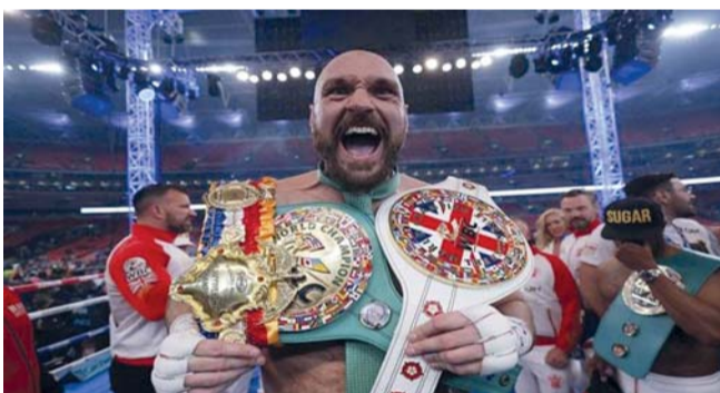
■ تايسون فيوري

فوزه على ديليان وايت في أبريل ٢٠٢٢، لكنه عاد إلى المنافسة بعدها بعام. وكان أوسيك قد صرح عن فيوري الذي لم يُهزم في ٣٥ نزالا حتى خسارته في مباراة توحيد الأوزمة الأربعة في مايو الماضي «إنه مقاتل عظيم، إنه انجاز كبير». وأضاف «إنه أفضل صديق لي. أحترم هذا الرجل لأنني أعتقد أنه خصم صعب حقا.