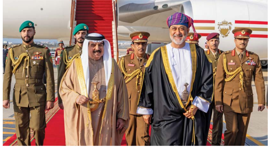
■ جلالة السلطان في مقدمة مستقبلي ملك البحرين بالمطار السلطاني الخاص