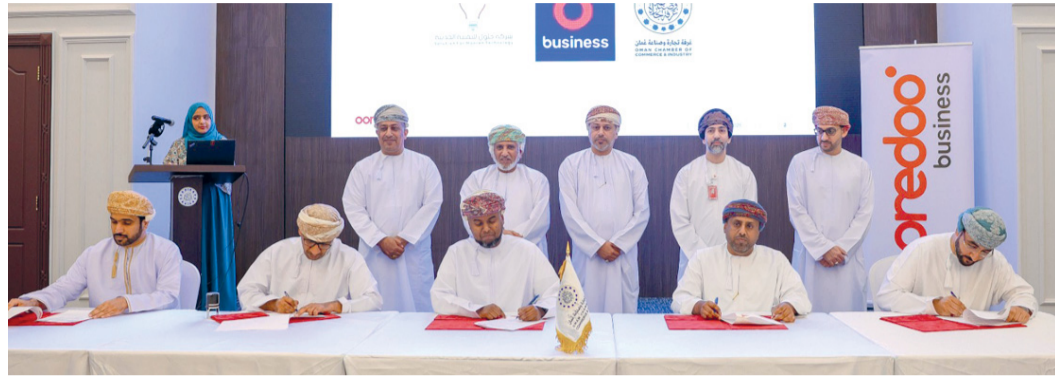
المذكرات تسهم في إيجاد بيئة محفزة لنمو واستدامة المؤسسات الصغيرة والمتوسطة

المبادرة حققت أولى خطواتها بالتوقيع على مذكرات تعاون بين الشريك الاستراتيجي التابع للشركة العمانية القطرية للاتصالات وعدد ٤٠ مؤسسة صغيرة ومتوسطة للاستفادة من هذه المبادرة والعروض المقدمة من الشركة. مؤكداً أن لجنة المؤسسات الصغيرة والمتوسطة بالتعاون مع بعض الجهات الحكومية والخاصة لدعم هذه المؤسسات، ومن ضمن هذه المذكرات تم التوقيع مع الشركة العمانية القطرية للاتصالات (أوريدو)، والتي تهدف إلى تعزيز التعاون بين الجهتين لدعم المؤسسات الصغيرة والمتوسطة. موضحاً أن هذه