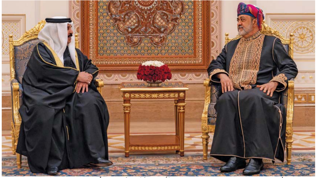
جلالة السلطان والعاقل البحريني أثناء مأدبة العشاء الرسمية بضيافة قصر العلم العامر والتي أقامها جلالته تكريماً لأخيه ملك البحرين

التنفيذيين. وقبيل مأدبة العشاء تبادل عاهل البلاد المفدى .أيده الله . وأخوه جلالة الملك الهدايا التذكارية، تعبيراً من لذن جلالتهما عما يجمع البلدين والشعبين من أواصر أخوة ووشائج قرى.