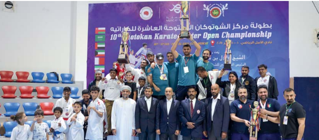
لقطة جماعية لأصحاب المراكز الأولى

اختتمت منافسات بطولة مركز الشوتوكان المفتوحة العاشرة للكراتيه التي أقيمت على مدار يومين متتاليين في صالة نادي الأمل الرياضي بمحافظة مسقط، ضمن فعاليات لياالي مسقط. البطولة جمعت أكثر من ٤٠٠ لاعب ولاعبة من ٣٤ نادياً يمثلون تسع دول وهي: سلطنة عمان، السعودية، الإمارات، الكويت، البحرين، مصر، الجزائر، إيران، والنيبال، وسط حضور جماهيري كبير وأجواء تنافسية مميزة.