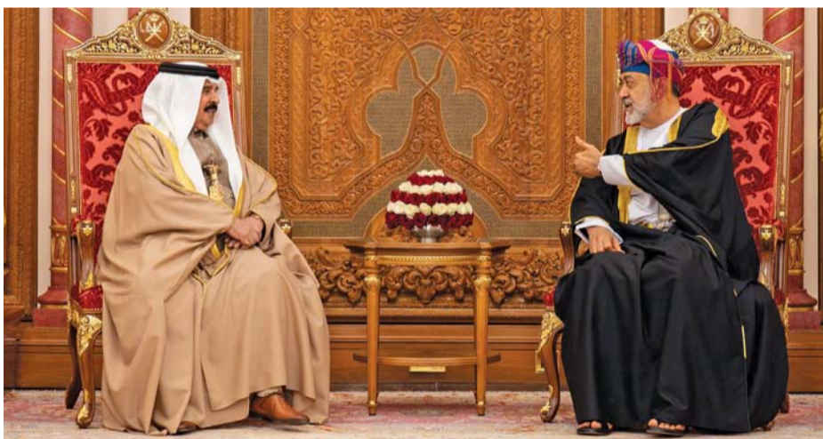
جلالة السلطان وملك البحرين أثناء استراحة قصيرة بالمطار السلطاني الخاص

جاءت القمة التي جمعت حضرة صاحب الجلالة السلطان هيثم بن طارق المعظم وأخاه جلالة الملك حمد بن عيسى آل خليفة . حفلهما الله ورعاهما . في إطار زيارة «دولة» التي يقوم بها العاهل البحريني لسلطنة عمان مجسدة لمعنى العلاقات الوثيقة التي تجمع بين البلدين، ومُشكّلةً منطلقاً لأفق جديد يدعم فيه التوافق العماني البحريني من مسيرة كل من العمل الخليجي المشترك والعمل العربي. ومتت مباحثات جلالة السلطان المعظم والعاقل البحريني . حفلهما الله ورعاهما . فرصة لتبادل وجهات النظر في ظل ما تمر به المنطقة وما تواجهه من خطر وتهديدات، حيث يجمع البلدين التزام صادق بالعمل معاً لمواجهة التحديات الإقليمية والدولية، والرغبة الأكدية في تعزيز الأمن والاستقرار في المنطقة جنباً إلى جنب مع الارتقاء ودعم التعاون الثنائي في جميع المجالات السياسية والاقتصادية والثقافية وغيرها. خصوصاً وأن هناك توافقاً في المحددات والنوايا والرؤى للسياسة الخارجية لكلا البلدين الشقيقين، والتي تتمثل في الحياض الإيجابية وحسن الجوار، وعدم التدخل في الشؤون السياسية للدول، وتغليب لغة الحوار السلمي، إلى جانب شراكتها في أسس وقيم واضحة المعالم من الأتزان والاعتدال والتعاون، وتكريس قيم الحوار والتعايش الإنساني وتعزيز التعاون الدولي.