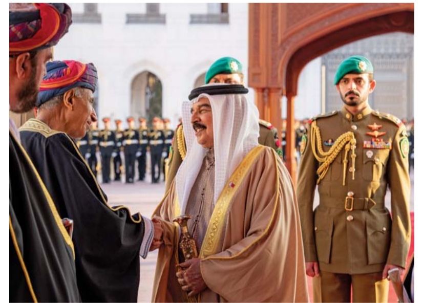
■ العاهل البحريني يصافح فهد بن محمود

مسقط. العمانية: عقد حضرة صاحب الجلالة السلطان هيثم بن طارق المعظم. حفظه الله ورعاه. وأخوه حضرة صاحب الجلالة الملك حمد بن عيسى آل خليفة ملك مملكة البحرين جلسة مباحثات رسمية بقصر العلم العامر أمس. وفي بداية الجلسة جدد جلالته السلطان المعظم ترحيبه بجلالة الملك ضيفاً عزيزاً على سلطنة عُمان، متمنياً له ولوفده المرافق طيب الإقامة في بلدهم الثاني. من جانبه عبر جلالته الملك حمد بن عيسى آل خليفة ملك مملكة البحرين الشقيقة عن خالص شكره وعظيم تقديره لجلالة السلطان المعظم على حفاوة الاستقبال وكرم الضيافة وحسن الوفادة. كما تم خلال الجلسة استعراض العلاقات الأخوية التاريخية الراسخة بين البلدين الشقيقين، وسبل تعزيزها وتنميتها في كافة المجالات، بما يخدم مصالح الشعبين ويحقق تطلعاتهما المشتركة، إضافة إلى تبادل وجهات النظر حول مستجدات الأوضاع التي تشهدها المنطقة ومجمل التطورات الإقليمية والدولية والأمور ذات الاهتمام المتبادل.