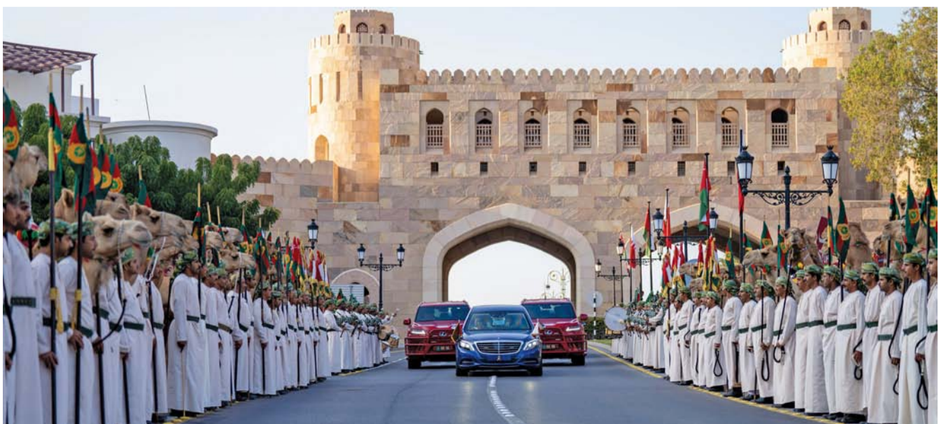
مراسم استقبال شعبية ورسمية احتفاءً بمقدم العاهل البحريني ضيفاً كريماً على سلطنة عمان