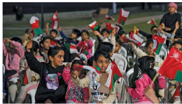
■ فعاليات متنوعة شهدها شاطئ حل بولاية بحاء

الله ورعاه. مقاليد الحكم في بلادنا الحبيبة عمان. بدأ المتلقى أبيات عطرة من القرآن الكريم بصوت القارئ خليل بن محمد السعيد، وبعد ذلك قدم الشيخ الدكتور يعقوب بن محمد بن عبيد السعيد كلمة ترحيبية بهذه المناسبة شكر فيها المنظمين وأشد بأهمية هذه المناسبة الغالية على قلوب كل العمانيين. وبعد ذلك ألقى كوكبة من الشعراء قصائدهم المعبرة لهذه المناسبة الغالية، تخللها الملقى بعض الأهازيج الشعبية وفن العازي أحد الموروثات العمانية الأصيلة. وفي الختام شكر الشيخ يعقوب بن محمد بن عبيد السعيد الحضور على هذه المشاركة الفعالة. كما نظم أبناء ولاية نخل احتفالية ولاء وعرفان لحضرة صاحب الجلالة السلطان هيثم بن طارق المعظم. حفظه الله ورعاه. بمناسبة ذكرى تولي جلالته مقاليد الحكم، وجاءت هذه الاحتفالية من الأهالي مضمين ما تحقق في سلطنة عمان من