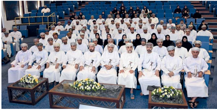
المختبر الوطني للمحتوى المحلي يهدف إلى التكامل بين القطاعات المعنية لتحقيق أهداف استراتيجية طويلة المدى

من ناحيته قال المهندس غالب بن عامر بن خميس الهنائي رئيس المكتب الوطني للمحتوى المحلي: نستهدف من خلال المختبر الوطني للمحتوى المحلي الخروج بعدد من المبادرات، نذكر منها ارتفاع قيمة الاستثمار المباشر من خلال المساهمة في توطين الصناعات، وتحقيق الاكتفاء الذاتي في السلع التي تصنف كمخاطر استراتيجية، ورفع الوعي بأهمية المحتوى المحلي في الجهات الحكومية والمجتمع العماني، والمساهمة في إيجاد وظائف ورفع نسب التعميم في مختلف القطاعات، وتعزيز مساهمة القطاعات الاقتصادية في الناتج المحلي الإجمالي، وتحسين الميزان التجاري من خلال إحلال الواردات، وزيادة الإنفاق على البحث والتطوير وتعزيز الابتكار. وأضاف: كما نستهدف تحقيق عدد من المخرجات الهامة من هذا المختبر، منها إيجاد الاستراتيجية الوطنية للمحتوى المحلي، مع تحديد أولويات