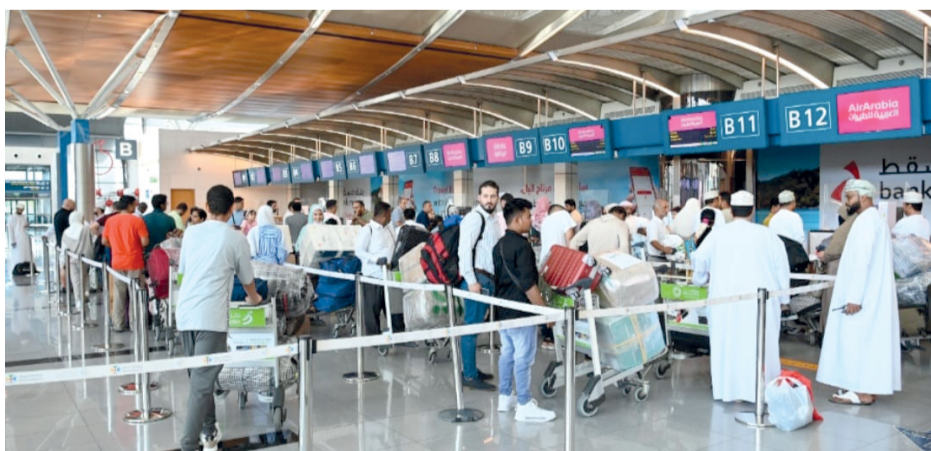
ارتفع عدد المسافرين عبر مطارات سلطنة عمان بنهاية نوفمبر ٢٠٢٤ بنسبة ٣,١ بالمائة

الجنسية الهندية أعلى عدد المسافرين في الرحلات المغادرة والقادمة عبر المطار بإجمالي بلغ ١٥٣ ألفاً و٥٥٧ ركاباً بنهاية نوفمبر ٢٠٢٤ م (عدد القادمين ٧٦ ألفاً و٥٥٣ مسافراً والمغادرين ٧٦ ألفاً و٥٥٣ مسافراً) وتلتها الجنسية العمانية بإجمالي بلغ ١١٥ ألفاً و٨٧١ مسافراً (عدد القادمين ٥٧ ألفاً و٥٨ مسافراً والمغادرين ٥٨ ألفاً و٨١٣ مسافراً) ومن ثم الجنسية الباكستانية بإجمالي ٤٩ ألفاً و٤٣٨ ركاباً (٢٤ ألفاً و١١٥ مسافراً قادمًا و٢٥ ألفاً و٣٢٣ مسافراً مغادراً).