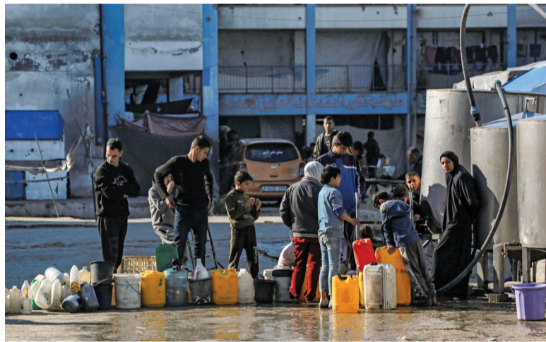
ناحون فلسطينيون لجأوا إلى مدرسة في خان يونس بقطاع غزة يصفون أمس ملاء المياه.