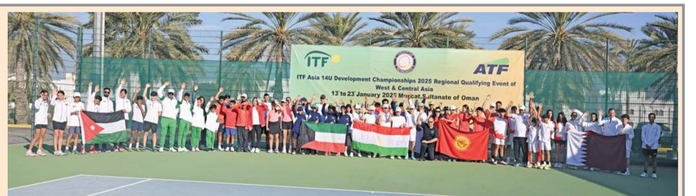
■ صورة جماعية للاعبين المنتخب المشاركة في البطولة

تبدأ صباح اليوم الثلاثاء منافسات الدور الرئيسي لبطولة عمان الدولية التنافسية لكرة الطاولة (رجال وسيدات) لعام ٢٠٢٥ والتي تقام بتنظيم من الاتحاد العماني لكرة الطاولة وبالتعاون مع مؤسسة كرة