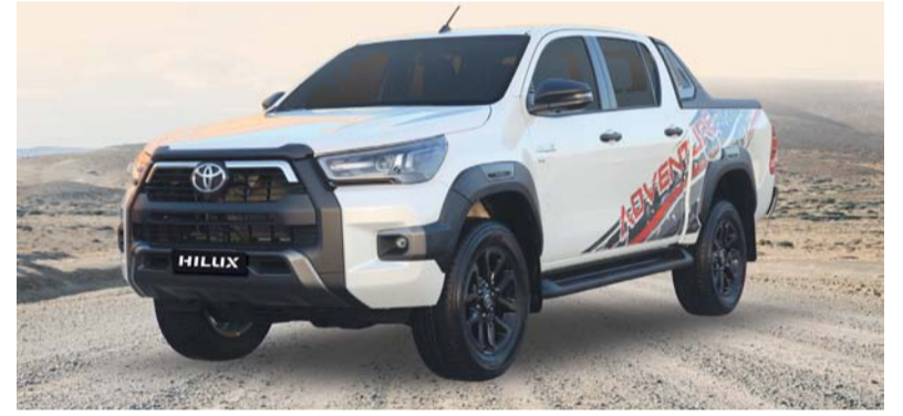
هايلوكس الجودة والسلامة ضمن أولوياتها

قدمت سيارة تويوتا هايلوكس مزايا حصريّة ضمن مهرجان السعادة مع الحصول على خدمة لمدة ٣ سنوات لكل ٣٠,٠٠٠ كم أو لغاية ٦ سنوات لكل ٦٠,٠٠٠ كم بالإضافة إلى تأمين شامل سلطنة عُمان لمدة سنة واحدة وفرصة للفوز بواحد من ١٦ جهاز آيفون ١٦ برو ماكس وتختلف المزايا باختلاف الطراز المشتري وسنته وسنة الصنع ويخضع العرض حتى ٢٣ من يناير الجاري. وتقدم سيارة هايلوكس أوفنشر أداء استثنائيًا بمحركها القوي ذي ٦ اسطوانات على شكل V وسعة ٤,٠ لتر والذي ينتج ٢٣٥ حصانا وعزم دوران يبلغ ٣٨,٣ كجم كما يضمن الترس التفاضلي التلقائي فضلا مستمرا مما يجعل كل قيادة بهجة. وتأتي سيارة هايلوكس ذات الدفع الرباعي مزودة بمحرك بزيت سعة ٢,٧ لتر مع خيارات ناقل حركة يدوي بخمس سرعات وناقل حركة ألي بست سرعات مما يوفر قوة مذهلة تبلغ ١٦٤ حصانا وتجمع بين القدرة القوية والرفي الحديث وتميز تصميمها بصدام أمامي ضخم منحوت مثل السيارات الرياضية متعددة الاستخدامات، ومصاييب ضباب أمامية، وعجلات من سبائك الألمنيوم وخطوط جانبية مذهلة تضيف إلى