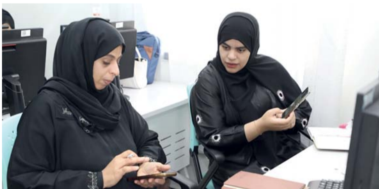
■ تعزيز المعرفة العملية في استخدام الذكاء الاصطناعي