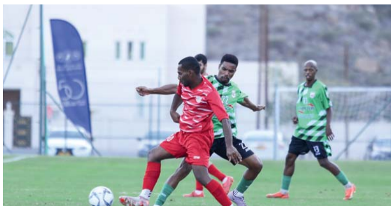
■ من مباريات دوري أبطال جنوب الباطنة بالعوابي