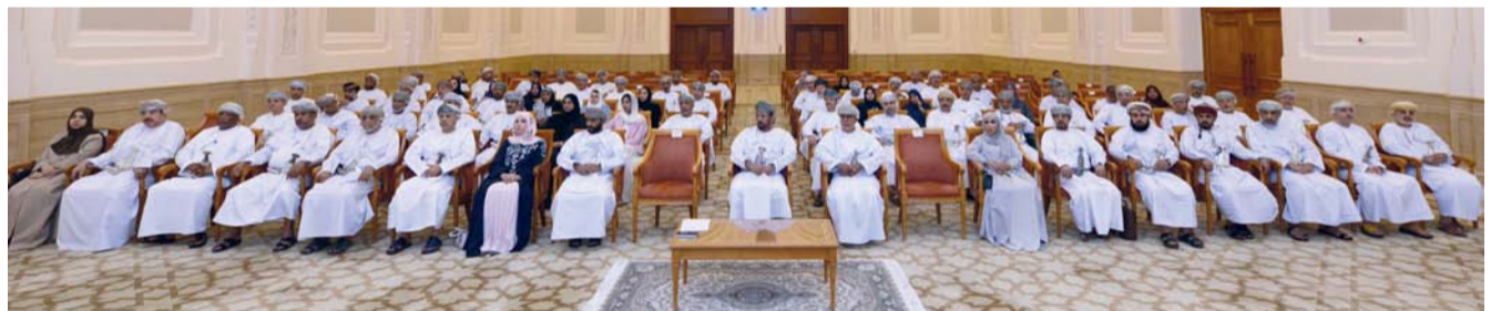
اللجنة تسعى إلى تعزيز التعاون مع المجالس التشريعية

مسقط. «الوطن»: استضاف مجلس الدولة، أمس اللجنة العمانية لحقوق الإنسان؛ للاطلاع على دورها والاختصاصات المنوطة بها، وذلك بحضور عدد من المزمين الأعضاء وسعادة الأمين العام للمجلس. حيث قدم الأستاذ الدكتور راشد بن حمد البلوشي رئيس اللجنة العمانية لحقوق الإنسان عرضاً حول اللجنة، مشيراً إلى أنها تهدف إلى حماية وتعزيز حقوق الإنسان في سلطنة عُمان، وأوضح أن اللجنة تضم ١٣ عضواً من ممثلي الجهات الحكومية وغير الحكومية، بالإضافة إلى خبراء متخصصين في حقوق الإنسان. وأضاف رئيس اللجنة خلال حديثه أن اختصاصات اللجنة تشمل وضع استراتيجية وطنية لحقوق الإنسان ومتابعة تنفيذها بالتنسيق مع الجهات المختصة، وتلقي الشكاوى المتعلقة بانتهاكات حقوق الإنسان ودراستها، والعمل على حلها بالتعاون مع الجهات المعنية، كما تقوم اللجنة برصد التقارير الدولية المتعلقة بحالة حقوق الإنسان في سلطنة عُمان، وإعداد تقارير تسهم في تقديم صورة متكاملة عن الجهود المبذولة.