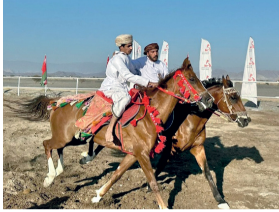
استعراض مهارات فنون الخيل