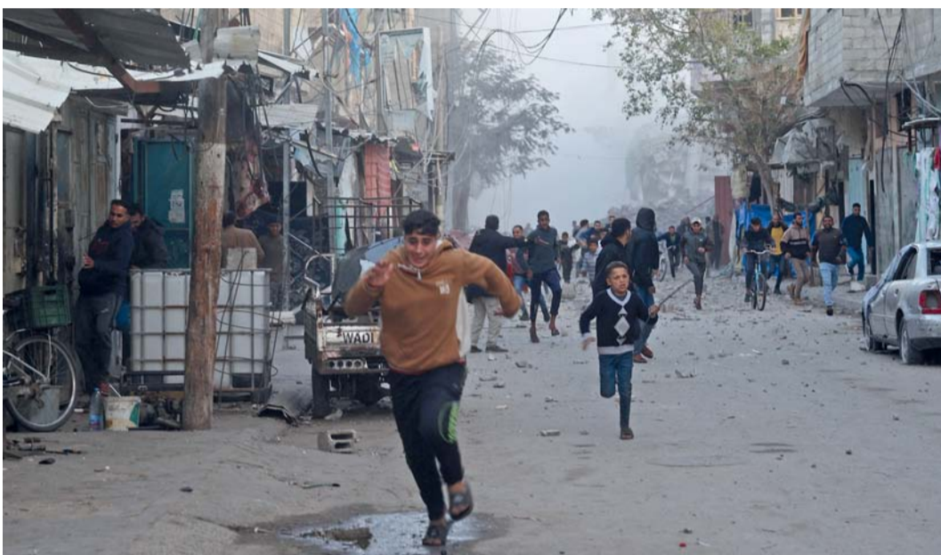
فلسطينيون يهربون من القصف الإسرائيلي في مخيم البريج للاجئين الفلسطينيين وسط قطاع غزة.