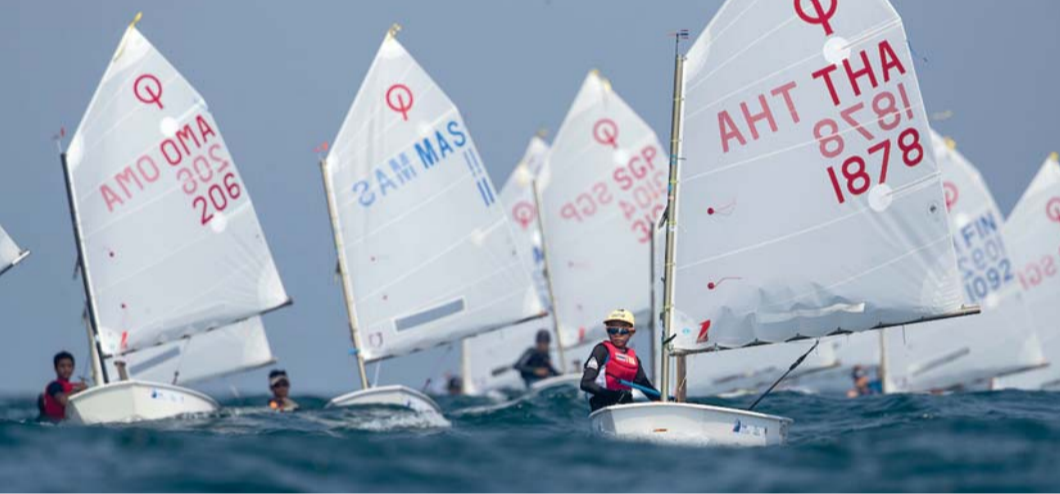
■ صورة أرشيفية من سباقات بطولة قوارب الأوبتمست

■ أعلن الاتحاد الدولي لقوارب الأوبتمست فوز سلطنة عُمان بملف استضافة بطولة آسيا وأوقيانوسيا لقوارب الأوبتمست ٢٠٢٥. وجاء الفوز بعد التصويت المنعقد خلال اجتماع الجمعية العمومية للاتحاد الدولي لقوارب الأوبتمست، وهو تأكيد لمكانتها المتنامية على