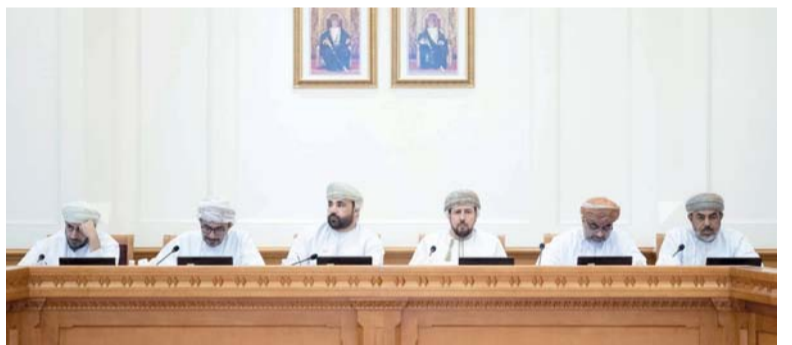
الاجتماع ناقش تعزيز المفاهيم الوطنية وتضمينها المناهج الدراسية