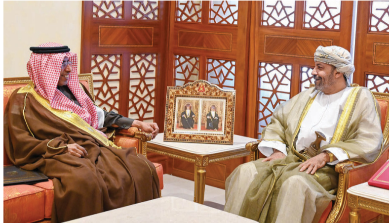
حمود بن فيصل أثناء استقباله محمد كومان

معالى الدكتور محمد بن علي كومان الأمين العام لمجلس وزراء الداخلية العرب. جرى خلال اللقاء استعراض عدد من الموضوعات ذات الاهتمام المشترك وسبل تعزيز التعاون بين الدول الأعضاء في الأمانة العامة لمجلس وزراء الداخلية العرب. كما استقبل معالي الفريق حسن بن محسن الشريقي المفتش العام للشرطة والجمارك بالقيادة العامة للشرطة في القرم