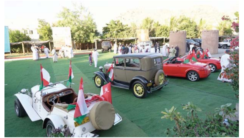
■ مشاركة أهالي نخل في احتفالية السيارات الكلاسيكية