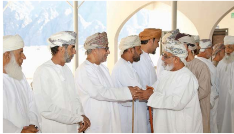
■ أهالي وادي الصرمي يُعبرون عن فرحتهم بهذه المناسبة

* من أسرة تحرير «الوطن» Issasallam@gmail.com