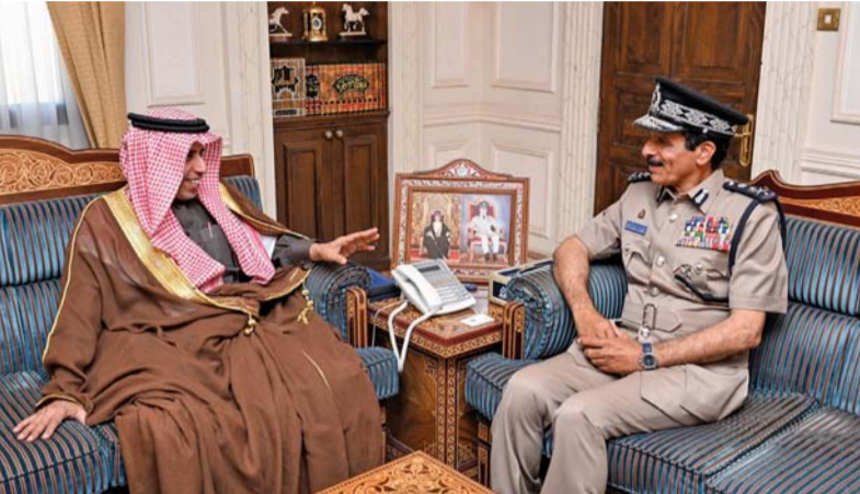
.. ويستقبله حسن الشريقي

معالى الدكتور محمد بن علي كومان الأمين العام لمجلس وزراء الداخلية العرب. جرى خلال اللقاء استعراض عدد من الموضوعات ذات الاهتمام المشترك وسبل تعزيز التعاون بين الدول الأعضاء في الأمانة العامة لمجلس وزراء الداخلية العرب. كما استقبل معالي الفريق حسن بن محسن الشريقي المفتش العام للشرطة والجمارك بالقيادة العامة للشرطة في القرم