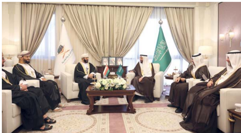
■ الاتفاقية تضمنت التأكيد على حصة سلطنة عُمان البالغ عددها ١٤ ألف حاج

الدولي بالمدينة المنورة، أما القدوم والمغادرة برأ فعبّر منفذ الربع الخالي ومنفذ البطحاء. وأكدت الاتفاقية على أهمية التقيد بجميع التعليمات العامة المنظمة لشؤون الحج بالملكة والتعليمات الواردة في وثيقة التعليمات المنظمة لشؤون الحج عبر منصة نسك مسار، مع التأكيد على استيفاء متطلبات السفر من جميع الحجج وفق المسارات الزمنية المحددة، والتأكيد على حزم الخدمات المتاحة من الجهات المختصة في المملكة ومستوياتها وتكاليفها. وحثت الاتفاقية أيضاً على مختلف التفاصيل المتعلقة بمكتب شؤون الحج، والإستراتيجيات الأمنية، وتفاصيل أعداد الحجج، والقدوم والمغادرة، وتفاصيل بيانات الاتصال والتواصل.