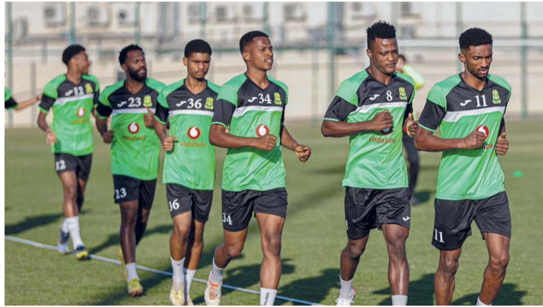
■ من تدريبات السيب