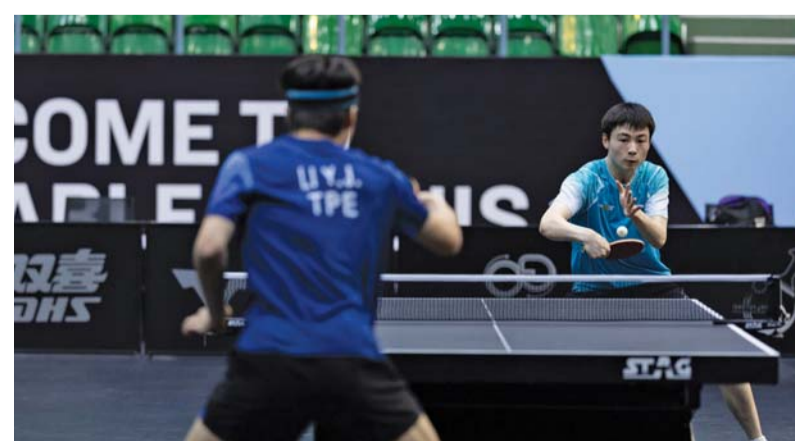
■ من مباريات بطولة عمان الدولية التنافسية لكرة الطاولة

المشاركة وكذلك اللاعبين، حيث أغلب الاستضافات تكون تحت اشراف الفئات بينما في السلطنة شهدنا بان جميع الكوادر هي وطنية تدير هذه البطولة وهذا دليل على القدرات والامكانيات التي يتميز بها كاد الاتحاد في تنظيم مثل هذه الأحداث. وحول الجوانب الفنية قال الحواج بان البطولة في يومها الأول شهدت منافسة جيدة من اللاعبين واللاعبات والجميع يسعى إلى تحقيق نتائج الفوز وحصد النقاط وبرز مجموعة من اللاعبين بشكل جيد ونتوقع لهم مستقبل كبير عبر هذه البطولة وستكون المنافسة أكثر إثارة خلال الأيام القادمة بعد دخول الجميع في اجواء البطولة وأغلب اللاعبين تم تجهيزهم بشكل جيد من الجوانب الفنية وهذا دليل على اهتمام الاتحادات باللاعبين حيث يسعى الاتحاد الدولي والآسيوي إلى صقل مثل هذه المواهب لتكون مستقبل التنس.