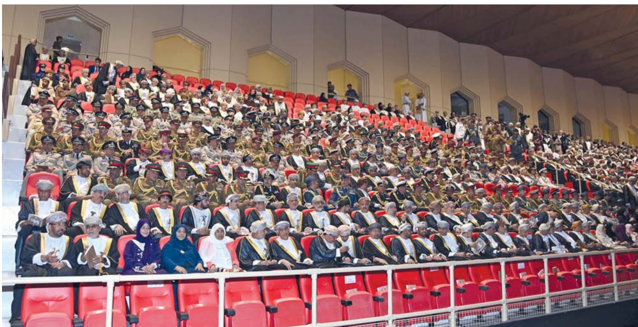
جمع غفير من المدعوين والحضور تابع لوحات المهرجان الطلابي «نهضة عُمان المتجددة»

مسقط . العُمانية: تفضّل حضرة صاحب الجلالة السلطان هيثم بن طارق المعظم . حفظه الله ورعاه . فشمّل برعايته السامية الكريمة المهرجان الطلابي «نهضة عُمان المتجددة»، بحضور السيدة الجليلة حرم جلالة السلطان في ميدان الفتح بالوطنية بمحافظة مسقط. فقبل وصول الموكب المقل لجلالة السلطان المعظم . أيده الله . إلى ميدان الفتح، اصطف على جانبي الطريق ما يقارب 1800 من المواطنين وفرق الفنون الشعبية من مختلف المحافظات؛ للترحيب بمقدم جلالته المبارك، حيث قُدمت الأهازيج والفنون الشعبية من فن الرواح، والفن البحري، وفنون العيالة والرزفة والرزحة، والفن النسائي، كما شاركت الفرقة الموسيقية السلطانية ومجموعة من الهجانة وكوكبة من الفرسان، وتضمنت الأهازيج عبارات الولاء والعرفان لجلالة عاهل البلاد المقدي، والاعتزاز والابتهاج بهذه المناسبة