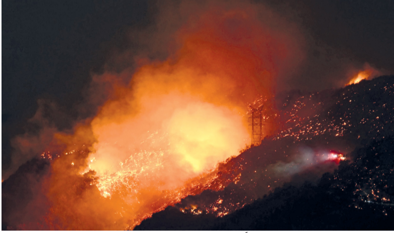
دخان ولهب يتصاعد من أحد التلال مع تزايد حرائق بأحد الأحياء في لوس أنجلوس بولاية كاليفورنيا الأمريكية

لوس أنجلوس. د. ب. أ: لا تزال حرائق الغابات التي اندلعت هذا الأسبوع في مقاطعة لوس أنجلوس مستعرة، ومن المتوقع أن تكون من بين أكثر الكوارث الطبيعية تكلفة في تاريخ الولايات المتحدة. وتسببت الحرائق المدمرة في مصرع ١٦ شخصاً وأحرقت ودُمرت أحياء كاملة كانت موطناً لعقارات تقدر بملايين الدولارات، حيث تقدر فرق الإطفاء أن أكثر من ٥٣٠٠ منزل دمر في حي باليسيدز بحسب وكالة الأنباء الألمانية. وبالرغم من أنه من المبكر جداً تقديم حصيلة دقيقة للخسائر المالية، إلا أن التقديرات تشير إلى أن الخسائر حتى الآن تجعل هذه الحرائق من أكثر الحرائق تكلفة في تاريخ الولايات المتحدة. وأشار تقدير أولي من شركة أكويونذر إلى أن الأضرار والخسائر الاقتصادية حتى الآن تتراوح بين ١٣٥ مليار دولار و ١٥٠ مليار دولار. إلى ذلك، أكد مكتب الطب الشرعي في مقاطعة لوس أنجلوس أن حصيلة ضحايا الحرائق المدمرة في المنطقة قد ارتفعت إلى ١٦ شخصاً. وقالت مصلحة الطب الشرعي في بيان إن العدد الإجمالي للوفيات المؤكدة هو ١٦ ضحية، ولا تزال الحالات قيد الفحص.