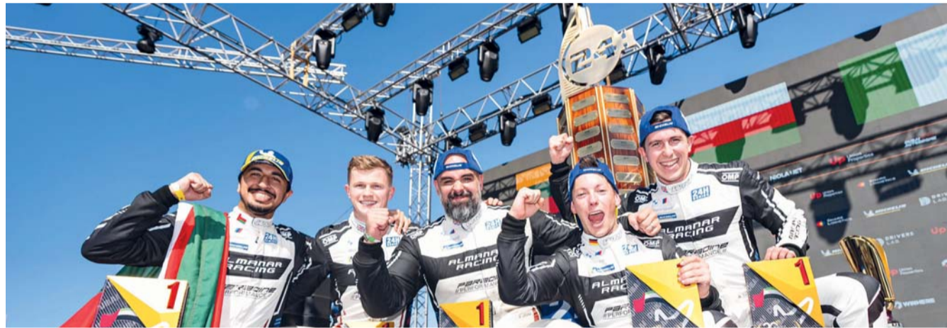
■ فرحة الفيلس وفريق المنار بالتتويج