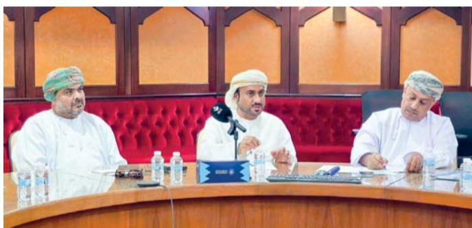
■ الاجتماع أكد على إنشاء منصة خاصة لمكاتب استقدام الأيدي العاملة

تتمثل في التجارة المستمرة، ومزاولة النشاط بدون ترخيص، وغياب المصادقية لدى بعض المكاتب الخارجية، بالإضافة إلى إصدار تأشيرات لعمالات منزليات من جنسيات لا توجد سفارات أو هيئات دبلوماسية لبلدائهن في سلطنة عُمان. كذلك ناقش الاجتماع عدداً من التحديات التي يواجهها المتعاملون مع المكاتب، مثل ارتفاع التكاليف، وتأخير وصول العمالات، وعدم التوافق بين الأيدي العاملة والمتطلبات، وعدم التزام العاملة بالشروط والضوابط والأخلاقيات المهنية، بالإضافة إلى بعض الممارسات السلبية مثل الاحتيايل من قبل بعض المكاتب. الجدير بالذكر أن فريق عمل مكاتب الاستقدام يضم ممثلين عن عدد من الجهات، منها وزارة الخارجية، ووزارة الصحة، ووزارة العمل، وشرطة عُمان السلطانية، واتحاد عمال سلطنة عُمان، ووزارة التجارة والصناعة وترويج الاستثمار، واللجنة العمانية لحقوق الإنسان.