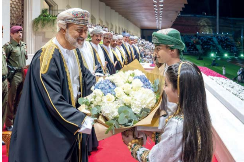
جلالة السلطان يتقبل باقة من الورود

لوحات جسدت مسارات التعليم المتعددة والإنجازات التي تحققت خلال السنوات الخمس وأصالة سلطنة عمان وحضارتها والموروث التقليدي العماني والتعبير عن مشاعر الولاء والعرفان