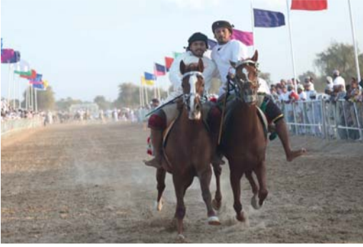
من عرضة الخيل