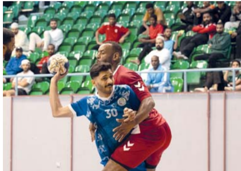
■ من منافسات دوري الدرجة الأولى

الثانية، وفي المرحلة الثانية للدوري التي ستنتقل يوم الثلاثاء المقبل، ستعقد الأندية الحاصلة على المركز من الأول إلى الرابع في الدور الأول، دوري من دورين للذهاب والإياب «تجمع نقاط». وفي المرحلة الثالثة والأخيرة من الدوري، سيخوض صاحب المركز الأول مباراة واحدة مع صاحب المركز الرابع، بينما سيلعب صاحب المركز الثاني مع صاحب المركز الثالث، والفائزان من هاتين المباراتين سيلعبان على المباراة النهائية، بينما سيخوض الخاسران مباراة تحديد المركزين الثالث والرابع.