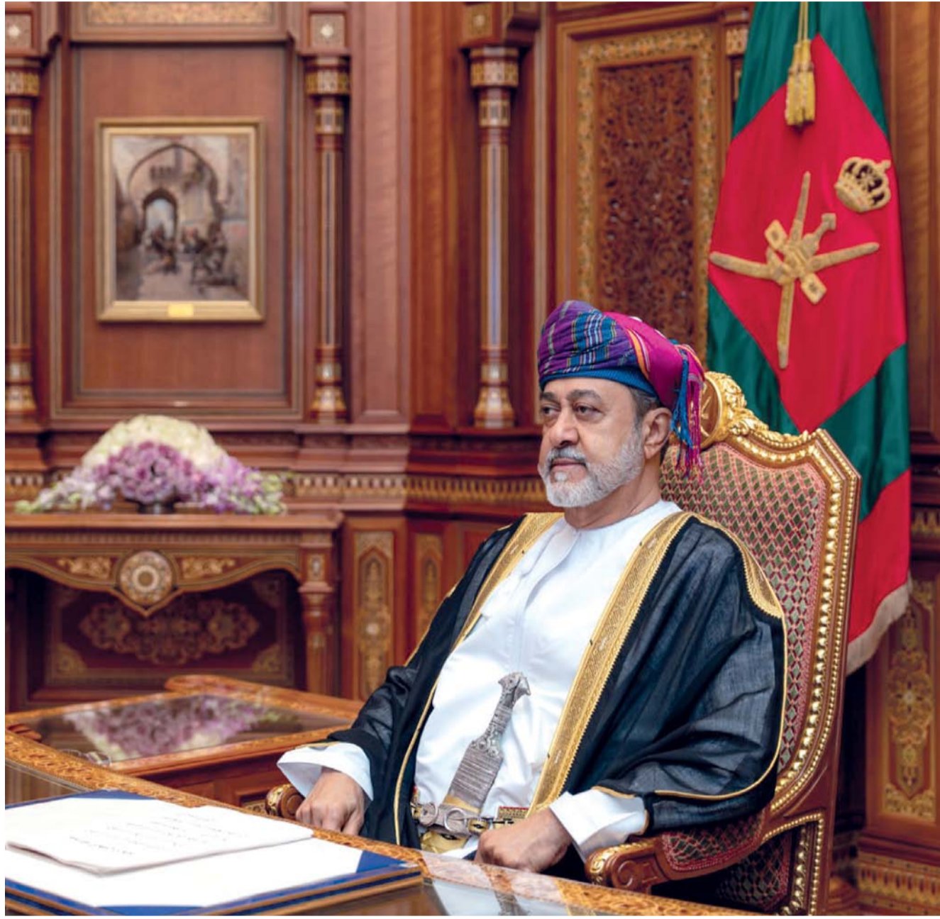
المكرمة السامية جاءت في إطار تلمس جلالته لاحتياجات أبناء شعبه العزيز وابتهاجاً بالذكري الخامسة المجيدة لتولي جلالته مقاليد الحكم في البلاد

لأبناء سلطنة عُمان، وأعاد علي جلالته وأبناء الوطن العزيز هذه المناسبة الوطنية الجليلة أزمنة عديدة إنه سميع مجيب، وكل عام والجميع في خير وعافية.»