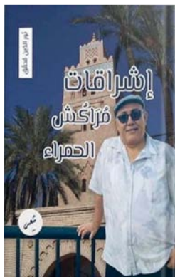
■ غلاف الكتاب الشعري

الكاتب الواقعي لها، وأنه لا يعدو أن يكون قد جعل من الوقائع التي عاشها بالفعل وقائع روائية بامتياز. إنها نفس اللعبة السردية التي نجد صداها عند كبار الكتاب العالميين مثل أرنست همنجواي وهنري ميلر وبول أوستر وغيرهم. ■