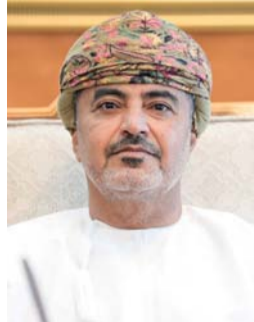
■ سعيد المعولي

قيمة مشاريع إنشاء وتأهيل الطرق وصيانتها منذ تولي جلالة السلطان المعظم حفظه الله ورعاه. الحكم وصلت أكثر من مليار و ٥٠٠ مليون ريال عماني وبعض مشاريع الطرق هذه لا يزال قيد استكمال التنفيذ، وبإكمالها، ستكون هناك نقلة نوعية في جودة وتكامل شبكة الطرق في سلطنة عمان. وبحسب الأوامر السامية لجلالته. أعزّه الله. يمتد طريق السلطان ثويني بن سعيد من دوار برج الصحوة بمحافظة مسقط إلى منفذ حفيت بمحافظة البريمي لمسافة تقدر بحوالي ٣٨٨ كيلومتراً وهو يربط بين محافظة مسقط ومحافظة الداخلية ومحافظة الظاهرة ومحافظة البريمي. أما طريق السلطان تركي بن سعيد فيتمتع لمسافة تقدر بحوالي ٢٥٠ كيلومتراً من تقاطع ولاية بدب بمحافظة الداخلية إلى إشارات سوق ولاية صور بمحافظة جنوب الشرقية.