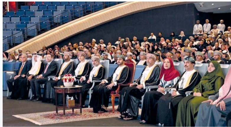
■ ذي يزن بن هيثم راعي حفل افتتاح مهرجان المسرح العربي في دورته الـ ١٥.