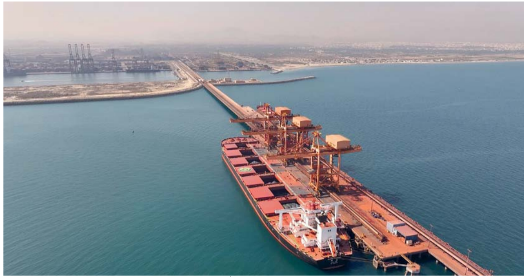
■ الإجمالي التراكمي للاستثمارات تجاوز ٢٦ مليار ريال عُمانى بنهاية النصف الأول من عام ٢٠٢٤م

٢٠٠ ألف متر مكعب، والمناطق الصناعية ٢٢٩ مليوناً و٣٠٠ ألف متر مكعب. يذكر أن الإنتاج غير المصاحب للغاز الطبيعي شاملاً الاستيراد بلغ ٤١ ملياراً و٢٥٢ مليوناً و١٠٠ ألف متر مكعب، فيما بلغ الإنتاج المصاحب ١٠ مليارات و٥٧٩ مليوناً و١٠٠ ألف متر مكعب. استقبل معالي قيس بن محمد اليوسف وزير التجارة والصناعة وترويج الاستثمار سعادة فيصل بن ثاني وزير التجارة والصناعة في دولة قطر، وذلك بمقر صالة "استثمر في عُمان". جاءت خلال المقابلة مناقشة سبل تعزيز التعاون المشترك بين البلدين الشقيقين في مجالات التجارة والصناعة، مع التركيز على استقطاب الاستثمارات النوعية في قطاعات عدة لاسيما الترفيه والسياحة. واستعرض الجانبان توسعة خط الغاز الرابط بين سلطنة عُمان ودولة قطر، وأهمية تسريع مفاوضات دول مجلس التعاون لدول الخليج العربية لإبرام اتفاقيات التجارة الحرة مع دول العالم. حضر المقابلة سعادة الدكتور صالح بن سعيد مسن وكيل وزارة التجارة والصناعة وترويج الاستثمار والتجارة والصناعة، وسعادة ابتهسام بنت أحمد الفرجية وكيلة وزارة التجارة والصناعة وترويج الاستثمار لترويج الاستثمار، وسعادة السفير ملكة البحرين لدى سلطنة عمان أن التبادل التجاري بين مملكة البحرين وسلطنة عمان سجل ارتفاعاً ملحوظاً، حيث زادت قيمته من ٨٤٠ مليون دولار إلى ١,٤ مليار دولار في عام ٢٠٢٣، مشيراً إلى ارتفاع عدد المستثمرين العُمانيين الذين يمتلكون أسهماً في الشركات المدرجة في بورصة البحرين إلى ١٣٦٣ مستثمرًا، بينما بلغ عدد المستثمرين البحرينيين في الشركات المدرجة في سلطنة عمان ٦٩٦ مستثمرًا.