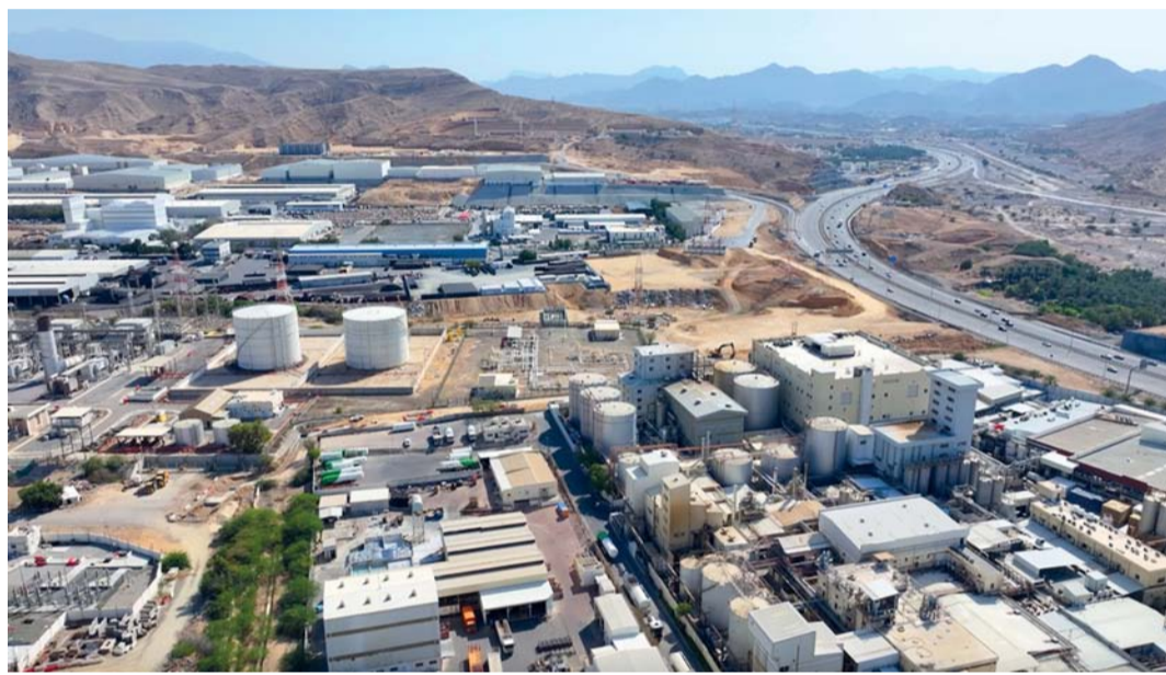
■ النمو المستمر في القطاع الصناعي يعكس فعالية الخطط التنموية المعتمدة من قبل الحكومة

الكبيرة في طلبات التراخيص الصناعية، حيث ارتفعت بنسبة ٦٢ بالمائة من ١٢,١ ألف طلب في عام ٢٠٢٠ إلى أكثر من ١٣٥ ألف طلب بنهاية نوفمبر ٢٠٢٤، مؤكداً على أن هذه الزيادة تعكس اهتمام المستثمرين بالقطاع الصناعي ونجاح السياسات التي تشجع على تأسيس المشاريع الجديدة. بالإضافة إلى ذلك، ارتفعت طلبات الإعفاءات الجمركية بنسبة ٤٢ بالمائة مما يدل على تحسن الظروف الاقتصادية وزيادة الأنشطة التجارية، وسجلت طلبات شهادات المنشأ ٧٧,٣ ألف طلب، مما يدل على زيادة حجم التجارة الخارجية ورغبة الشركات العمانية في التوسع في الأسواق الدولية، أما طلبات الإعفاءات الجمركية المقدمة، فقد بلغت ٥١٧ طلباً، محققة نمواً بنسبة ٤٢ بالمائة وتم إصدار قرارات إعفاء جمركي لـ ٥٩٠ طلباً، ما يعكس تحسن الإجراءات التنظيمية. وقال إن القطاع الصناعي شهد خلال عام ٢٠٢٤ تطوراً ملحوظاً يعكس الجهود المبذولة لتعزيز مساهمة القطاع الصناعي في الناتج المحلي الإجمالي، وتحقيق نمو مستدام يعزز مكانة عمان كقطب صناعي متطور.