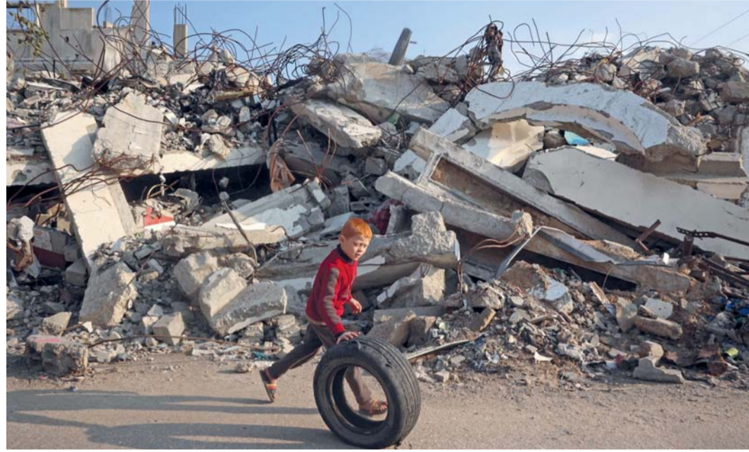
صبي يلعب بإطار مطاطي بجوار أنقاض مبانٍ مدمرة جراء المجازر الإسرائيلية بالقرب من مخيم النصيرات للاجئين وسط قطاع غزة. المخبرات شمال غرب مدينة غزة. واستشهد ثمانية فلسطينيين بينهم طفلان وامرأتان وأكثر من ٣٠ وزير (حلاوة) التي تؤوي نازحين في جباليا البلد شمالي قطاع غزة.