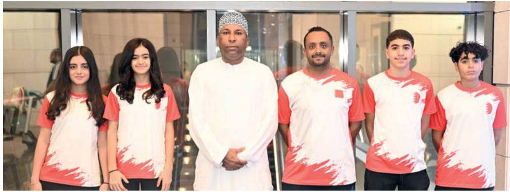
من وصول بعثة منتخب البحرين