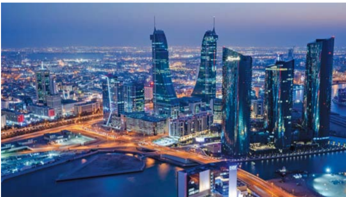
■ عدد السياح القادمين من سلطنة عمان إلى مملكة البحرين وصل إلى ٥٧ ألف سائح

بهذا قدماً نحو أفق أرحب. وفيما يتعلق بالسياسة الخارجية، وضح سعادتته في تصريح لوكالة الأنباء العمانية بأن هناك توافقاً في المبادئ والنوايا والركائز للسياسة الخارجية لكلا البلدين الشقيقين، والتي تتمثل في الحياد الإيجابي وحسن الجوار، وعدم التدخل في الشؤون السياسية للدول، وتغليب لغة الحوار السلمي، إلى جانب شراكتها في أسس وقيم واضحة المعالم من الأمانة والاعتدال والتعاون، وتكريس قيم الحوار والتعايش الإنساني وتعزيز التعاون الدولي، وإشاعة السلام المستدام، ومواصلة الجهود لتحقيق التنمية المستدامة وتعزيز حماية حقوق الإنسان وحرياته، والمحافظة على البيئة لما لها من دور مؤثر وفعال في تكريس مكانة البلدين الشقيقين على الصعيد الإقليمي والدولي. وأشار سعادة الدكتور إلى أنه سيتم إشهار الشركة العمانية البحرينية للاستثمار برأس مال يقدر بـ ١٠ ملايين ريال عماني، والتي تم التوقيع على عقد تأسيسها في البحرين أثناء الزيارة السامية لحضرة صاحب الجلالة السلطان هيثم بن طارق المعظم - حفظه الله ورعاه - لملكة البحرين، وستشكل انطلاقة جديدة لتحقيق مشروعات استثمارية تعود بالنفع على البلدين والشعبين الشقيقين. وقال سعادة السفير الدكتور جمعة بن أحمد الكعبي سفير مملكة البحرين لدى سلطنة عمان إن مجلس الأعمال البحريني - العماني الذي يجمع بين غرفتي التجارة والصناعة في كلا البلدين الشقيقين يعمل على تعزيز أفق التعاون في العديد من المجالات الاقتصادية والتجارية والاستثمارية لتحقيق التكامل بين رؤيتي عمان ٢٠٤٠ والبحرين ٢٠٣٠. وفيما يتعلق بالتعاون في مجال التعليم، وضح