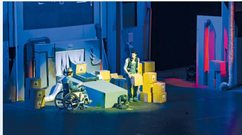
■ المهرجان يسليط الضوء على إبداعات المسرحيين العرب من مختلف الدول العربية.

الممثل من التفاعل المباشر مع سينوغرافيا رقمية حية. بفضل الجسات المزودة بالقناع، ترسل الإشارات لحظياً إلى بروجيكتورات البث التي تترجم هذه الحركات إلى مؤثرات بصرية ديناميكية على المسرح.