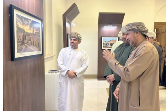
لوحات فنية مضيئة وثقتها عدسات المصورين المشاركين بالمعرض