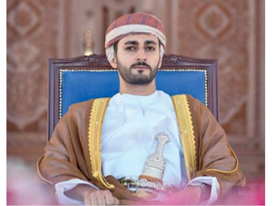
■ ذي يزن بن هيثم

تنظم جامعة السلطان قابوس خلال الفترة من ١٨ إلى ٢٤ يناير الجاري، الدورة الرياضية العاشرة لطلبة جامعات ومؤسسات التعليم العالي بدول مجلس التعاون لدول الخليج العربية. يقام حفل الافتتاح مساء يوم ١٩ يناير تحت رعاية صاحب السمو السيد ذي يزن بن هيثم آل سعيد، وزير الثقافة والرياضة والشباب بالقاعة الكبرى في المركز الثقافي بالجامعة. تأتي الدورة تحت شعار «خليجنا عزوتنا»، بهدف تعزيز الروابط الأخوية بين طلبة الجامعات ومؤسسات التعليم العالي بدول الخليج العربية، وتوثيق التعاون الرياضي والثقافي.