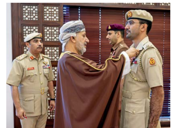
نصر الكندي أثناء تقليد الضباط ميداليتي الخدمة الممتازة والثناء السلطاني