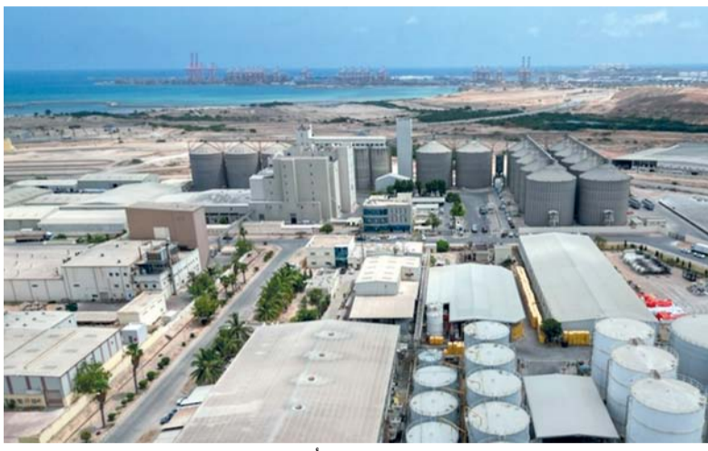
«مدائن» طوّرت خلال الخمس سنوات الماضية جميع المُن الصناعية القائمة وإنشاء مَدُن جديدة

ومن بين المشاريع الحيوية التي انتهت «مدائن» من إنجازها مشروع «تنفيذ الطريق الدائري والخدمات الملحقة بواحة المعرفة مسقط، بتكلفة إجمالية تصل إلى (٧) مليون ريال عماني حيث يتماشى مع التطورات المستقبلية وقطع الأراضي المرتبطة بالشبكات الحالية جنباً إلى جنب مع تطوير حلول تصريف مياه الأمطار بالموقع والمخطط الرئيسي العام ومخطط مسقط الكبرى. كما تم الانتهاء من مشروع «تطوير المنطقة الحرة بالمزينة (المرحلة الأولى - الحزمة الثانية) والمرحلة الثانية، بتكلفة إجمالية تصل إلى (٦) ملايين ريال عماني، والانتهاء من مشروع «إنشاء البنية الأساسية بمدينة سائل الصناعية، بتكلفة إجمالية تصل إلى (٤٠) مليون ريال عماني، علاوة على ذلك، تم الانتهاء من مشروع «توسعة مدينة ريسوت الصناعية - ريسوت ٢» بتكلفة إجمالية تصل إلى (٣) مليون ريال عماني. ﷻ