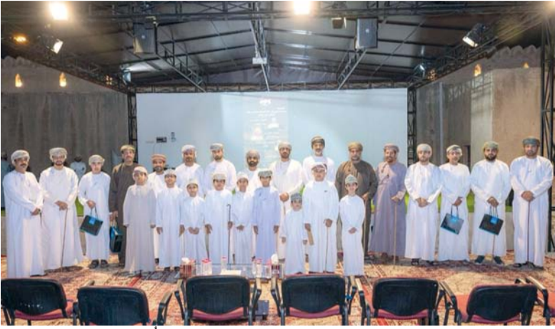
صورة جماعية لراعي المناسبة والمشاركين في الأمسية