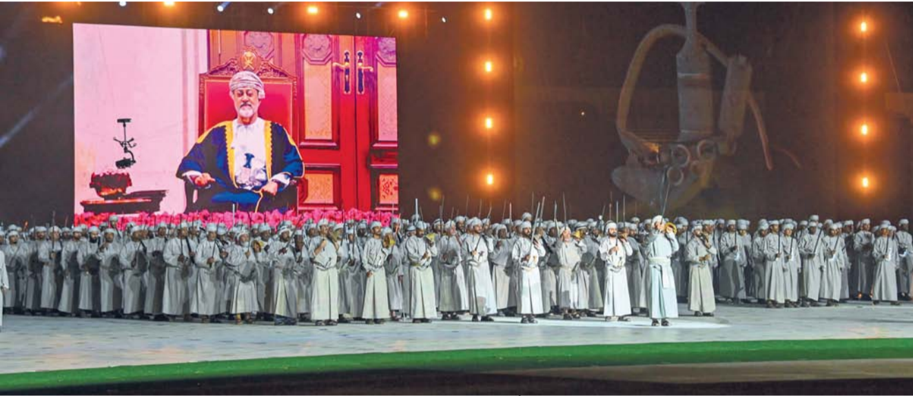
العازي والفنون الشعبية الأخرى أظهرت الموروث التقليدي العُماني

السُّمو أفراد الأسرة المالكة الكريمة، وجناب السادة، والسادة البوسعيد، وأصحاب المعالي الوزراء والمستشارون، وقادة قوات السلطان المسلحة وشُرطة عُمان السلطانية، ورؤساء البعثات الدبلوماسية المعتمدون لدى سلطنة عُمان، والمكرمون أعضاء مجلس الدولة وأصحاب السعادة أعضاء مجلس الشورى وأصحاب السعادة الوكلاء والمستشارون، وعدد من أصحاب الفضيلة القضاة وكبار الضباط، ورؤساء تحرير الصحف المحلية والأجنبية، ورؤساء الاتحادات والأندية، وجمع من المواطنين وأهالي الطلبة المشاركين.