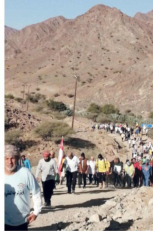
تضمنت فقرات الاحتفال في ختام المسير إقامة فقرة الرزفة الحماسية وإلقاء الشعراء قصائد في حب الوطن والقائد المفدى، وفي الختام تم تكريم الفرق المشاركة والمشاركين.

بمناسبة تولي حضرة صاحب الجلالة السلطان هيثم بن طارق المعظم - حفظه الله ورعاه - مقاليد الحكم في البلاد، نظم فريق رواسي شناس للمسير الجبلي والرحلات «مسير النهضة المتجددة» بقرية وادي فيض الجبلية التابعة لولاية شناس بمحافظة شمال الباطنة. شارك في المسير نحو ١٧٠٠ مشارك من (٦٦) فريقاً من مناطق ومحافظات سلطنة عُمان، وذلك لمسافة (١١) كيلومتراً، حيث انطلق المسير من منطقة بويدر ثم الرعة، نزولاً للوادي، حيث الأفلاج والسيرك المائية والمناظر الخلابة وصولاً لنقطة الاستراحة بمنطقة فيض، ثم العودة لنقطة الانطلاق.