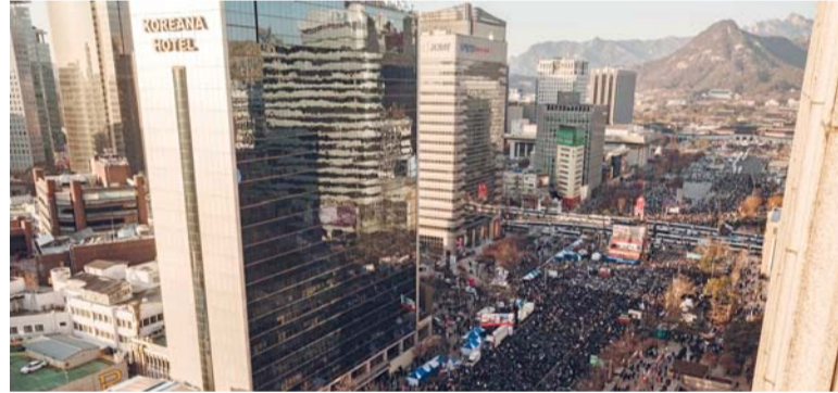
أنصار رئيس كوريا الجنوبية المعزول يون سوك يول يشاركون في مسيرة بمنطقة جوانج هوامون بالعاصمة سيئول قصيرة في الثالث من ديسمبر وقال المحامي «مع استمرار محاولات تنفيذ أمر توقيف غير قانوني وغير صالح بشكل غير قانوني، هناك مخاوف بشأن السلامة الشخصية والحواش. لكي يتمكن الرئيس من الحضور للمحاكمة، يجب حل مسألة السلامة والأمن الشخصيين». وفي السياق ذكرت شبكة

سيئول . وكالات: قال يون جاب . جيون، محامي الرئيس الكوري الجنوبي المعزول يون سيوك . يول إن يون لن يحضر الجلسة الرسمية الأولى في محاكمة عزله هذا الأسبوع بسبب مخاوف على سلامته. وألقى المحامي بهذا الإعلان في الوقت الذي تستعد فيه المحكمة الدستورية لعقد أولى جلساتها بشأن عزل يون، بحسب وكالة أنباء يونهاب الكورية الجنوبية. ومن المقرر أن تبدأ المحكمة الدستورية، غداً الثلاثاء رسمياً إجراءات عزل يون، الذي أصدر رسماً عسكرياً بفرض الأحكام العرفية لفترة