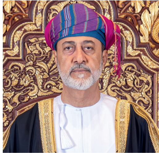
العلاقات العُمانية البحرينية تقوم على أسس متينة من الأخوة والتفاهم المشترك وتمثل نموذجاً يُحتذى به في مسيرة مجلس التعاون الخليجي.

برعاية ذي يزن بن هيثم.. جامعة السلطان قابوس تستضيف الدورة الرياضية الخليجية العاشرة ١٨ الجاري تنظم جامعة السلطان قابوس خلال الفترة من (١٨) إلى (٢٤) من يناير ٢٠٢٥ الدورة الرياضية العاشرة لطلبة جامعات ومؤسسات التعليم العالي بدول مجلس التعاون لدول الخليج العربية. تأتي الدورة بشعار «خليجنا عزوتنا»، بهدف تعزيز الروابط الأخوية بين طلبة الجامعات ومؤسسات التعليم العالي بدول الخليج العربية، وتوثيق التعاون الرياضي والثقافي. تفاصيل... «الرياضي»