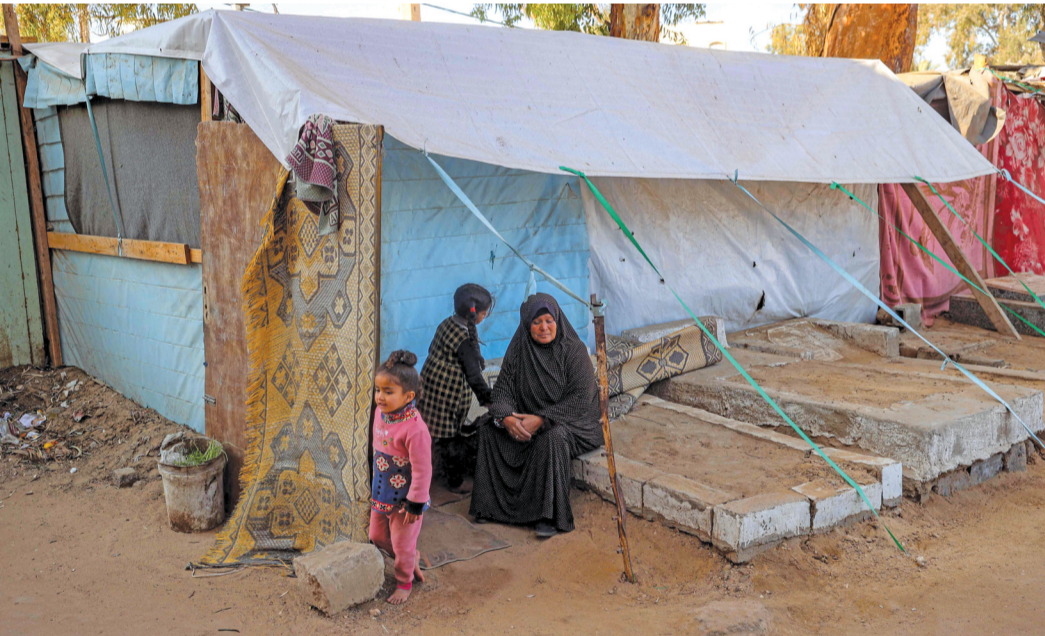
فلسطينية تجلس مع أطفالها خارج خيمة في مقبرة، حيث لجأت العائلات النازحة بسبب العدوان الإسرائيلي على دير البلح وسط قطاع غزة.

القدس المحتلة - «الوطن» - وكالات: أفاد مصدر طبي فلسطيني بوقوع (٥) آلاف شهيد ومفقود في العدوان الإسرائيلي المستمر منذ (١٠٠) يوم شمال قطاع غزة، في حين قال مصدر إسرائيلي مشارك بالمفاوضات إن هناك رغبة في التوصل إلى اتفاق قبل الـ (٢٠) من يناير الحالي. من جهته، أفاد الدفاع المدني في غزة بأن (٧٠) طفلاً استشهدوا خلال الأيام الخمسة الماضية في القصف الإسرائيلي على القطاع. يأتي ذلك، بينما قالت صحيفة «معاريف» الإسرائيلية، إن الجيش الإسرائيلي غير أساليب القتال في بيت حانون بعد الخسائر الفادحة التي تعرض لها. وأفادت «معاريف» بأن الحادثة، التي قتل فيها (٤) جنود من لواء نحال وأصيب فيها (٦)