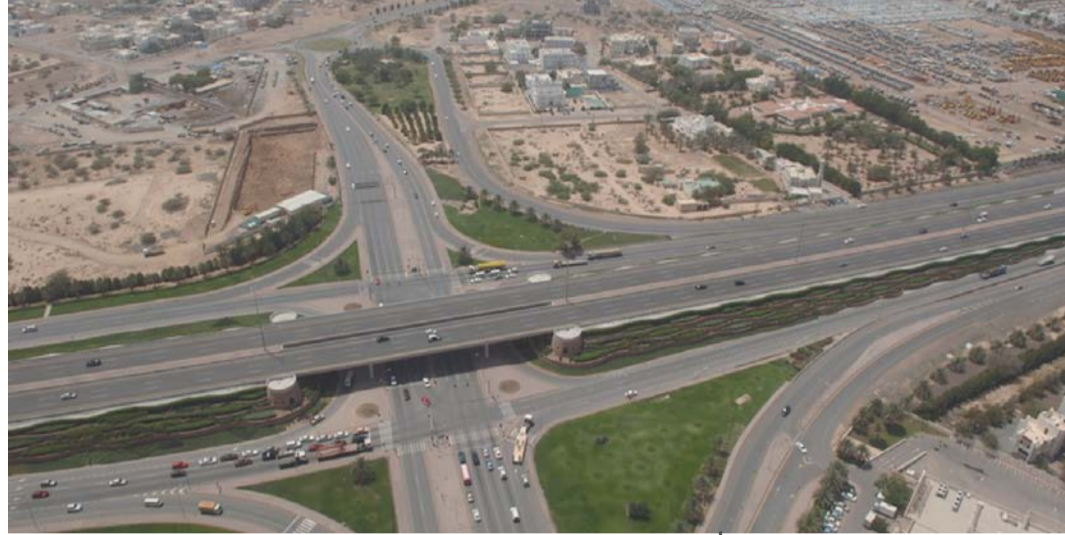
■ مسميات الطرق الرئيسية والاستراتيجية لها أبعاد وطنية وثقافية وحضارية

لها أبعاد وطنية، وثقافية، وحضارية، حيث ستصبح الطرق مرتبطة بمفردات التاريخ والحضارة العمانية، وستحفظ وعي المواطنين، والمقيمين، والسُور على استشعار الامتداد التاريخي، والعمق الحضاري الكبير لسلطنة عمان. وأضاف معالي وزير النقل والاتصالات وتقنية المعلومات إن جلالة السلطان