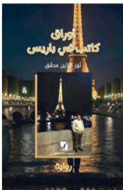
■ غلاف الكتاب الروائي