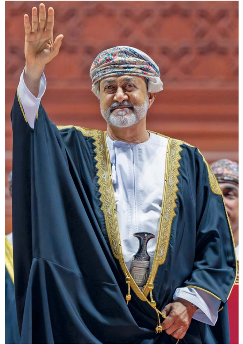
جلالة السلطان يُلقي التحية على أبنائه المشاركين في المهرجان