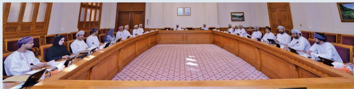
الاجتماع أكد توافق اللجان في جمع المواد محل الاختلاف بين مجلسي الدولة والشورى

نفط عمان يرتفع ٧ سنتات مسقط . العُمانيّة: بلغ سعر نفط عمان الرسمي أمس تسليم شهر مارس القادم ٧٦ دولاراً أميركياً و٦٠ سنتاً. وشهد سعر نفط عمان ارتفاعاً بلغ ٧ سنتات مقارنة بسعر يوم الجمعة الماضي والبالغ ٧٦ دولاراً أميركياً و٥٣ سنتاً. تجدر الإشارة إلى أن المعدل الشهري لسعر النفط الخام العماني تسليم شهر يناير الجاري بلغ ٧٢ دولاراً أميركياً و٤٦ سنتاً للبرميل، منخفضاً دولارين أميركيين و٣٦ سنتاً مقارنة بسعر تسليم شهر ديسمبر الماضي.