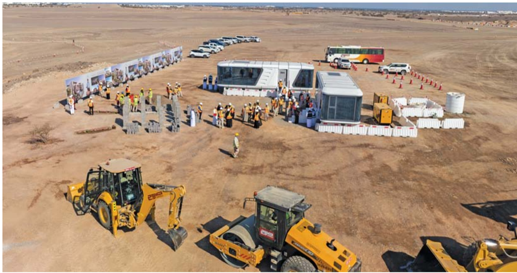
■ أثناء زيارة الوفد الإعلامي للموقع