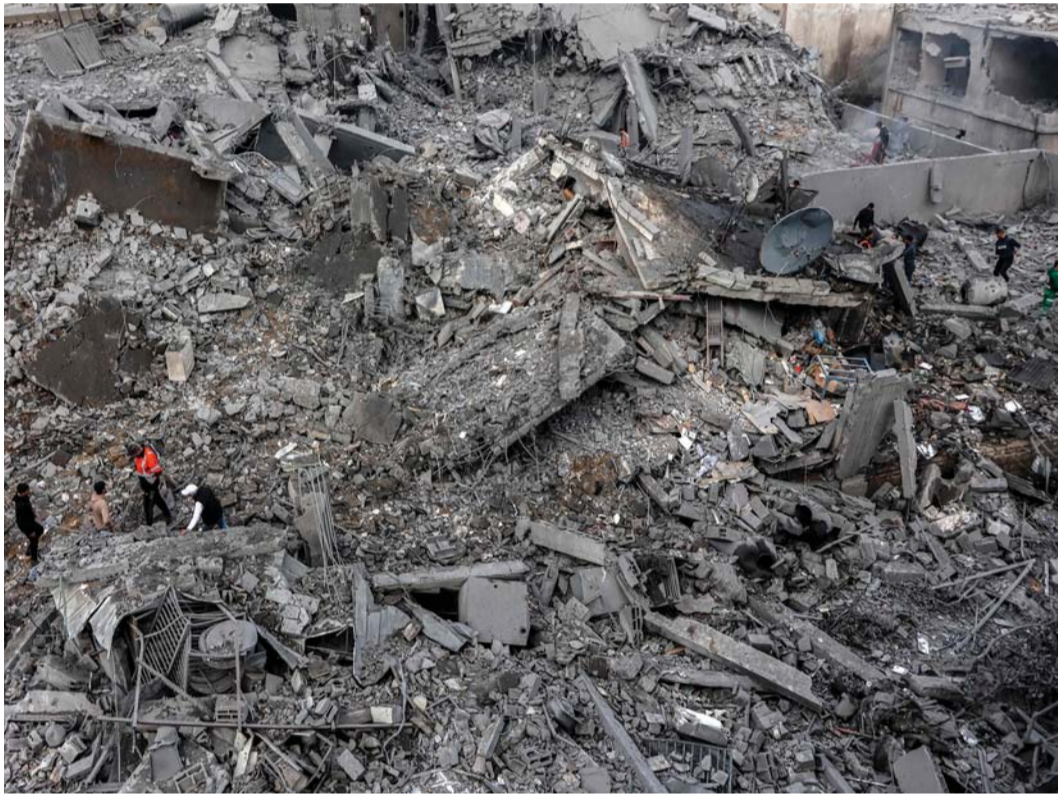
فلسطينيون يتفقدون أنقاض مبنى سكني منهار تعرض للقصف الإسرائيلي في منطقة السرايا وسط مدينة غزة.

ثلاثة شهداء وعدد من الجرحى بقصف طيران الاحتلال منزل عائلة عماد بمخيم البريج. واصيب ١٩ جراء إطلاق طائرات الاحتلال الإسرائيلي المسيّرة كواد كابتير عدة قنابل تجاه تجمع في منطقة حي الدعوة شرق مخيم النصيرات وسط قطاع غزة بعد وقت قصير من استشهاد خمسة وعدد من المصابين بقصف جوي إسرائيلي لمنزل في مخيم النصيرات وسط قطاع غزة. وارتقى شهيدان في قصف إسرائيلي في منطقة النصر شمال شرقي مدينة رفح جنوبي قطاع غزة كما ارتقى شهيدان من عائلة ضهير في منطقة مصبح شمال المدينة. وفي خان يونس ارتقى شهيدان وعدد من المصابين بقصف من مسيرة إسرائيلية على بلدة عيسان شرق المدينة. وكان اربعة استشهدوا واصيب آخرون إثر قصف إسرائيلي استهدف مركز شرطة أصداء شمال غربي مدينة خان يونس. يأتي ذلك فيما قال جيش الاحتلال الإسرائيلي ومسعفون إن مسلحين أطلقوا النار على مركبات بينها حافلة ركاب بالقرب من قرية فلسطينية في الضفة الغربية المحتلة ما أسفر عن مقتل ثلاثة أشخاص وإصابة سبعة آخرين. وقالت «المسعفين أكدوا مقتل ثلاثة إسرائيليين هم امرأتان ورجل».