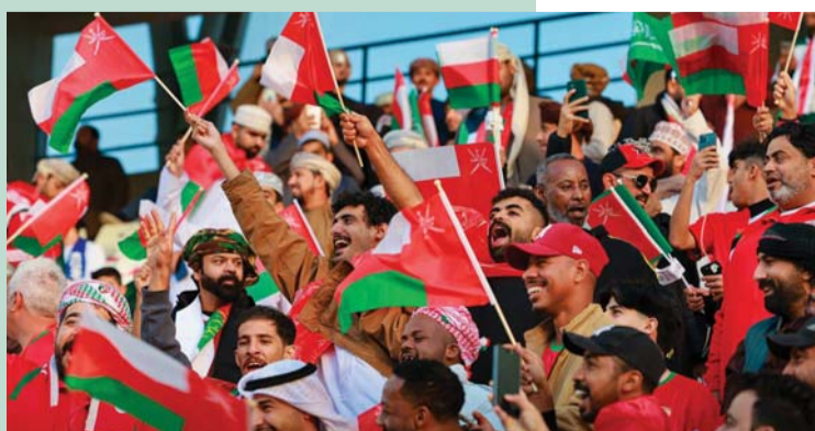
■ جماهيرنا الوفيّة الرقم الصّعب في الدّورة

ما قدمته الجماهير العمانية من نماذج رائعة مساندة لمنتخبنا يُعدّ درساً رائعاً لكل الوسط الرياضي، فالتضحيات التي قدمتها حشود الجماهير العمانية هو أمر غير مستغرب عنهم، لكنه كذلك. يجب أن لا يمر مرور الكرام، حيث يحتاج هؤلاء المحبون وقفات مختلفة من الاتحاد ووزارة الثقافة والرياضة والشباب والقطاع الخاص على حد سواء، فالمسافات التي تقطعها الجماهير العمانية مساندة لمنتخبنا في منافسات مختلفة هو أمر ليس بالهين، وأمر يحتاج إلى مال وجهد وتضحيات، وبالتالي ما أظهرته الجماهير العمانية في الكويت يُعدّ امتداداً لمشاهد سابقة حضرت خلالها الجماهير بشكل مشابه دون أي ضجر، فهي الجماهير التي وصلت للبحيرة، وهي التي وصلت للأردن، وهي التي وصلت إلى اليمن، حباً في المنتخب ودعمه لتحقيق الأهداف، فالشكر غير كاف في حق هؤلاء الأوفياء نظير هذا العمل الكبير والجهود المبذولة منهم، وأتمنى مساندتهم بالطرق المثالية لكلمة مشوارهم في قادم الأيام رفقة الأحمر العماني.