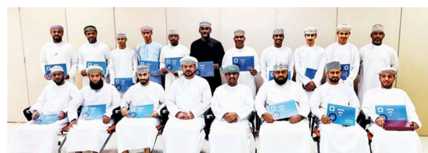
المشاركون في حلقة العمل

احترافية ومؤثرة، مما يعزز من حضور الفرق الأهلية على منصات التواصل الاجتماعي والإعلام، وقد أشاد المشاركون بالمحتوى المقدم، وأعربوا عن امتنانهم لمركز التدريب الإعلامي على تنظيم مثل هذه الحلقات التي تسهم في صقل مهاراتهم وتنمية قدراتهم الإعلامية.