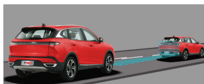
نظام تحذير من الإصطدام الخلفي