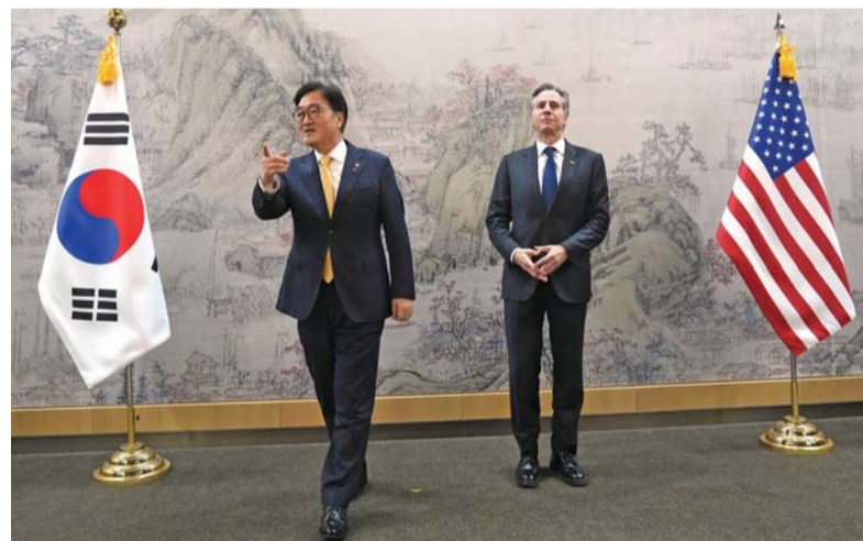
وزير الخارجية الأمريكي أنتوني بلينكن ورئيس الجمعية الوطنية الكورية الجنوبية وو وون شيك يقفان قبل اجتماع في الجمعية الوطنية في سيول أمس.

سيول. د.ب.أ: ألحقت الشرطة الكورية الجنوبية إلى رفض طلب من وكالة مكافحة الفساد في كوريا الجنوبية بتولي تنفيذ مذكرة التوقيف بحق الرئيس المعزول يون سيوك يول بسبب محاولته الفاشلة لفرض الأحكام العرفية. وفي وقت سابق، أرسل مكتب التحقيق في فساد المسؤولين رفيعي المستوى خطابا رسميا إلى الشرطة، يطلب منها تولي تنفيذ مذكرة التوقيف بحق يون، حسبما ذكرت وكالة يونهاب الكورية الجنوبية للأخبار. وقال بايك دونج - هيوم،