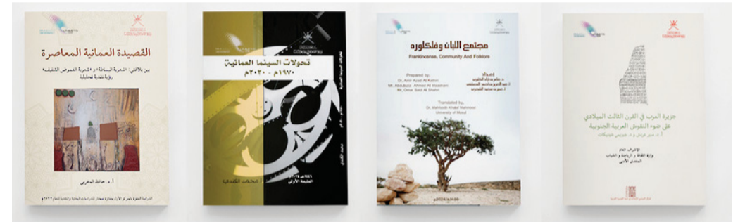
الإصدارات ترفد المكتبة العمانية من خلال أفكارها ومضامينها المتعددة

مسقط. العمانية: أصدرت وزارة الثقافة والرياضة والشباب ممثلة بالمنتدى الأدبي عدداً من الإصدارات الثقافية النوعية التي سترقد المكتبة العمانية من خلال أفكارها ومضامينها المتعددة. من بين هذه الإصدارات، إصدار (جزيرة العرب في القرن الثالث الميلادي على ضوء النقاش العربية الجنوبية)، وهو من تأليف أ.د. منير عربش ود. جيريبي شيتيكات، والذي يتناول فترة مهمة من التاريخ العربي في جزيرة العرب. يتمحور الكتاب حول النقوش المكتشفة في جبل ريام، والتي تعود إلى القرن الثالث الميلادي. يتناول المؤلفان الأهمية الكبيرة لهذه النقوش في فهم طبيعة العلاقات السياسية والقوى المؤثرة في تلك الحقبة، مع إبراز التفاعلات بين الحضارات العربية القديمة والإمبراطوريات الرومانية والفارسية. الكتاب يركز بشكل خاص على مدى تأثير القوى السياسية في تشكيل صورة الجزيرة العربية قبل ظهور الإسلام. ومن بين الإصدارات، ديوان (أنق الفجر) للشاعر هلال البهلاوي، الذي يضم مختارات مميزة من قصائده في موضوعات متعددة. يهدف الديوان إلى إبراز جماليات اللغة العربية وأدواتها، وتعزيز مكانة الشعر العربي الأصيل. كما يقدم المنتدى الأدبي للمكتبة العمانية إصداراً يتضمن (دراسات الفانزين بجائزة صحران للدراسات البحثية والتقدية لعام ٢٠٢٢م)، وتأتي تكريماً للأبحاث المميزة التي تسلط الضوء على الشعر العُماني ومجالاته الإبداعية. كما أصدر المنتدى الأدبي كتاب (ندوة الترجمة في البلاد العربية: الواقع والطموحات)، الذي يوثق حصاد أعمال الندوة التي أقيمت عام ٢٠٢٢م بالتعاون مع الجمعية العمانية للكتاب والأدباء. يتضمن الكتاب مجموعة من ٨ أوراق عمل قدمها نخبة من الباحثين والمتخصصين في مجال الترجمة، تناولت محاور متعددة أبرزها: واقع الترجمة في البلاد العربية وتحدياتها. وأصدر