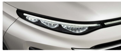
مصابيح أمامية LED مع خاصية الإنارة والإطفاء التلقائي