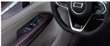
مقعد السائق قابل للتعديل بثمانية وضعيات