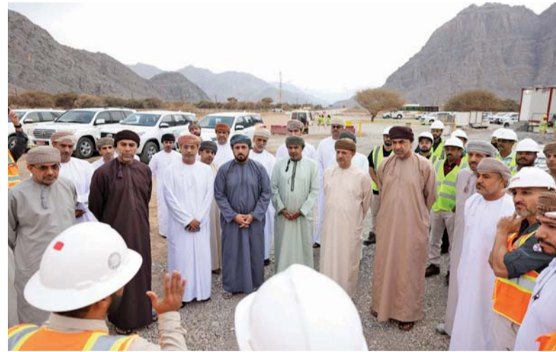
■ عددٌ من أصحاب المعالي والسعادة أثناء متابعة المشروعات التنموية والإطلاع على البرامج التطويرية بمسندم

مسندم . العُمانية: تواصل محافظة مسندم تنفيذ مشروعات تنموية استراتيجية ذات أثر خدمي واقتصادي وسياحي، تجاوز بعضها ٦٥ في المئة من نسبة إنجازها.