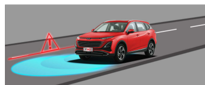
نظام التدخل الذكي عند تغيير المسار في السرعات العالية