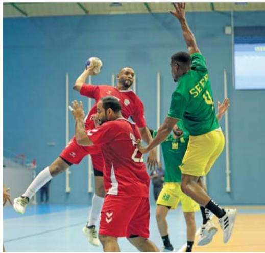
من مباريات دوري الدرجة الأولى لكرة اليد