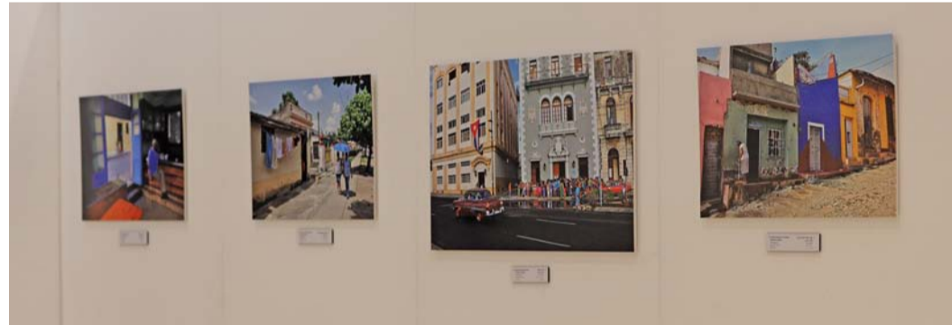
عمل المصورون العمانيون على إظهار تفاصيل مهمة من العادات والتقاليد الكوبية

مسيرة الفن البصري المحلي، وفرصة للمصورين العمانيين لاستطلاع طرق جديدة للتعبير، وللجمهور العماني لاكتشاف زوايا مختلفة من الجمال الإنساني. تكمن قيمة هذا المعرض في قدرته على جلب تجارب من خارج الحدود، ليصبح العمل الفني شهادة حية على عمق الإنسانية وجمال تنوعها. هذه التجارب تغني الفهم الثقافي، وتجعل للتصوير الضوئي وسيلة للتواصل تتجاوز الكلمات والحدود.