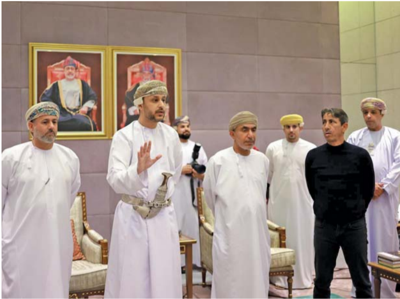
■ باسل الرواس يلتقي ببعثة منتخبنا عقب الوصول إلى البلاد

ظروف متشابهة حرمتنا لقبين ٢٥ و ٢٦ ولا بد من دراسة متأنية لمعرفة الأسباب الجذرية لذلك