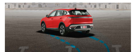
نظام ركن أوتوماتيكي بالكامل

تطبق الشروط والأحكام. الصور الظاهرة في هذا الإعلان هي نماذج للتوضيح فقط. المواصفات قد تختلف حسب طراز السيارة. المواصفات والمزايا قابلة للتغيير وفقاً لتقدير المصنع. مزايا النظام الصوتي والذكاء الاصطناعي قد لا تعمل في دول مجلس التعاون الخليجي. لمعرفة المزيد، تفضلوا بزيارة معرض سيارات بيستون.