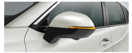
المرآة الخارجية للرؤية الخلفية قابلة للطي ألياً مع خاصية الذاكرة و الإرجاع المتزامنة