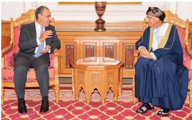
■ فهد بن محمود لدى استقباله بدر عبد العاطي

مشيراً إلى أهمية المحادثات التي يجريها مع المسؤولين بسلطنة عُمان لما لها من انعكاسات إيجابية على توطيد التعاون المشترك. حضر المقابلة معالي السيد بدر بن حمد بن حمود البوسعيدي وزير الخارجية. كما حضرها سعادة السفير محمد عبد الحليم راضي سفير جمهورية مصر العربية المعتمد لدى سلطنة عُمان. ﷻ