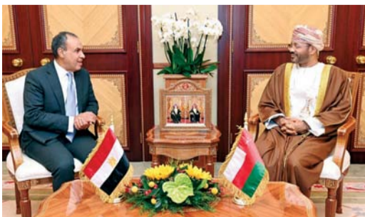
■ ... ووزير الخارجية يستقبله

والاقتصادية والثقافية بما يخدم المصالح المشتركة للبلدين والشعبين الشقيقين. وتبادل الوزيران وجهات النظر حول عدد من القضايا التي تربط سلطنة عُمان وجمهورية مصر العربية، والتأكيد على الرغبة المشتركة لتعزيز التعاون الثنائي في مختلف المجالات السياسية