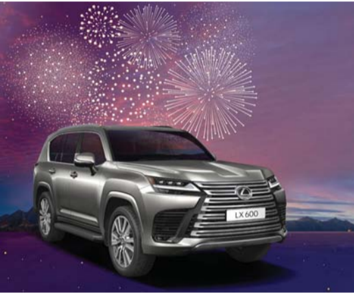
طرازات لكزس تجسد الإبداع والأداء والفخامة

تقدم لكزس لعملائها فرصة فريدة للاستفادة من امتيازات الخدمة حتى ٥ سنوات لكل ٥٠,٠٠٠ كم، وتسجيل مجاني للسنة الأولى لأفضل تشكيلات سيارات لكزس في صالات عرض سعود يهوان للسيارات حتى ٢٣ من يناير الجاري. تتضمن تشكيلات مركباتها المتحركة السيارات الرياضية متعددة الاستخدامات الفخمة لكزس آر إكس ولكزس يو إكس لركوب أكثر قوة ومن أجل تجسيد الإبداع والأداء إلى جانب الفخامة فتتواجد لكزس إل إكس. وتتوفر آر إكس ٥٠٠ بثلاثة مستويات قوية تتميز آر إكس ٣٥٠ بمحرك تيربو سعة ٢,٤ لتر و ٤ أسطوانات وطرازات آر إكس ٣٥٠ إتش وأر إكس ٥٠٠ إتش بقدرات محرك الهابريد وتأتي مزودة بأحدث التقنيات حيث تتوفر بذات الدفع الرباعي تجربة قيادة لا مثيل لها مع كفاءة وقود رائعة من خلال كل من التشطيبات الهابريد والبنزين.