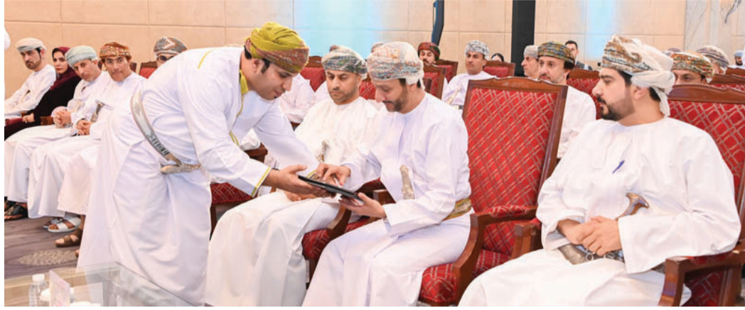
محافظ مسقط أثناء تدشينه الخدمات الإلكترونية الجديدة

تدشينت وزارة التجارة والصناعة وترويج الاستثمار بالتعاون مع بلدية مسقط أمس، خدمة عقود الإيجار في منصة عُمان للأعمال وخدمة التقارير المالية وتدشين خدمة الدليل التفاعلي للأسماء التجارية، تحت رعاية معالي السيد سعود بن هلال اليوسعي، محافظ مسقط، وبحضور معالي قيس بن محمد اليوسف وزير التجارة والصناعة وترويج الاستثمار وعدد من أصحاب السعادة والمسؤولين من الجهات ذات العلاقة.