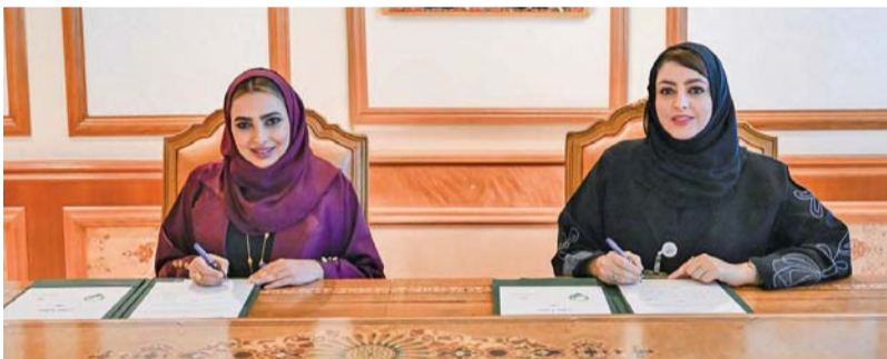
■ المبادرة تُسهم في تعزيز الاستدامة البيئية والاجتماعية

وُقعت أمس وزارة التنمية الاجتماعية على مذكرة تعاون لمبادرة «نورك علينا للطاقة الشمسية» مع مؤسسة الكون الأخضر، والتي تستهدف بعضاً من فئات الأيتام، وكبار السن، والأسر الحاضنة والبديلة، وبيوت الشباب التابعة لمركز رعاية الطفولة وبيوت الشباب، وذلك من خلال جمع بيانات عنها لتوفير الطاقة البديلة والمتجددة «الطاقة الشمسية»، الأمر الذي يساهم في تعزيز الاستدامة البيئية والاجتماعية، وتقليل تكاليف استهلاكها الشهري. وقُعت المذكرة بمقر ديوان عام الوزارة السيدة معاني بنت عبدالله البوسعيدية المديرية العامة للتنمية الأسرية بوزارة التنمية الاجتماعية، والمهندسة سمية بنت ناصر التنفيذية لمؤسسة الكون الأخضر.