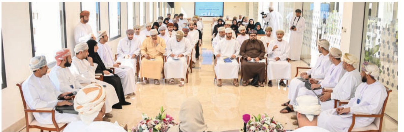
■ الجلسة تأتي في إطار مواصلة نهج الشراكة والتكامل بين المؤسسات الصغيرة والمتوسطة