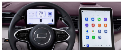
شاشة عدادات القياس وشاشة وسائل