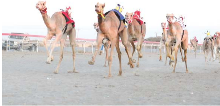
إثارة ومنافسة قوية شهدتها أشواط السباق

تواصل ولليوم الثالث على التوالي منافسات السباق العام ٢٠٢٥م، والذي تنظمه الهجانة السلطانية بشؤون البلاط السلطاني بمضمار الفليج بولاية بركاء، على مدى خمسة أيام ويتأهل من خلال هذا السباق عدد من النوق الحاصلة على المراكز الأولى إلى مهرجان كأس جلالة السلطان المعظم للهجن وتشتمل منافسات اليوم إقامة ٢٠ شوطا لفئة اللقاييا لمسافة ٥ كيلومترات، خصصت منها ١٣ شوطا للبقار، و٧ أشواط للقعدان. وأقيم صباح أمس ١٣ شوطا لفئة الحجاج لمسافة ٤ كيلومترات، خصصت جميعها للبقار، وتأهلت في الشوط الأول النوق الحاصلة على المراكز من الأول إلى الخامس إلى مهرجان كأس جلالة السلطان المعظم للهجن، فيما تأهلت من الشوط الثاني لغاية الشوط الثاني عشر النوق الحاصلة