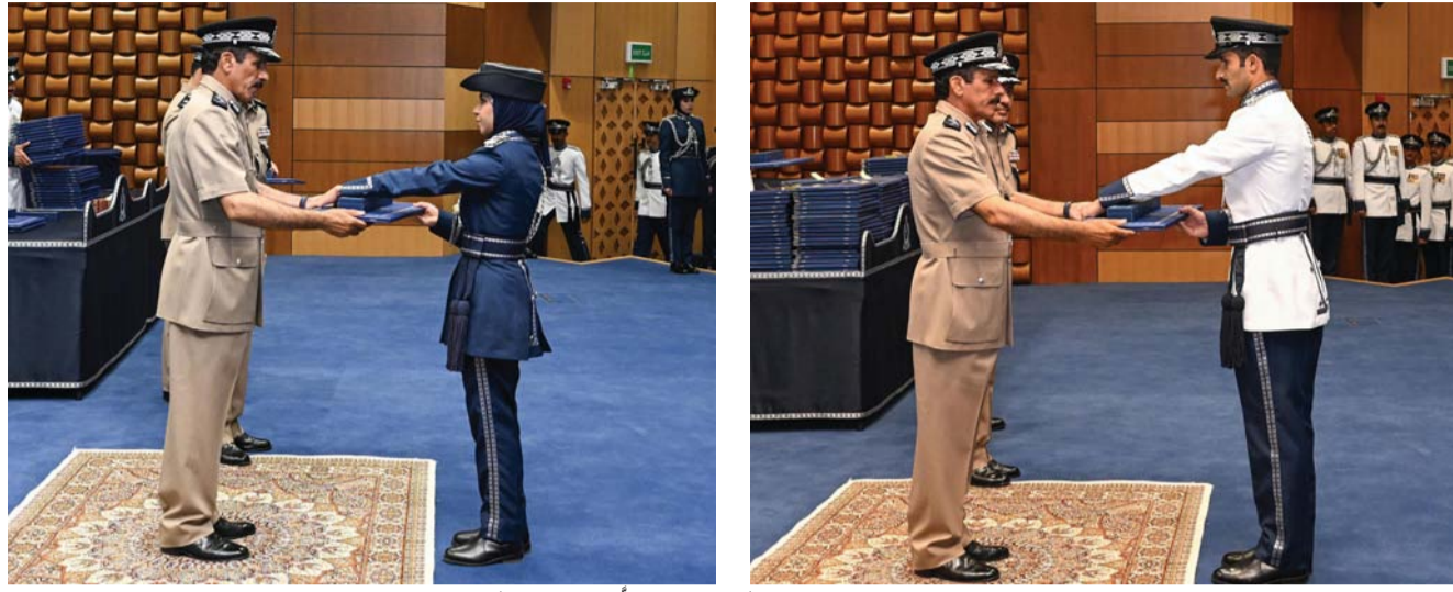
■ أثناء تكريم أوائل الضباط وتسليم الشهادات الدراسية

ضمن فعاليات احتفال شرطة عُمان السلطانية بيومها السنوي الخامس من يناير وتخرير دورات من الضباط، رعى معالي الفريق حسن بن مجسن الشريقي المفتش العام للشرطة والجمارك أمس حفل تسليم الشهادات الدراسية إلى الضباط الخريجين. وقام معالي الفريق بتكريم أوائل الضباط، وتسليم الشهادات الدراسية، وتكريم المديرين المشرفين. حضر المناسبة عدد من كبار ضباط شرطة عُمان السلطانية، وأعضاء الهيئة التدريسية والتربوية بإكاديمية السلطان قابوس لعلوم الشرطة.