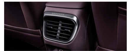
نظام تكييف أوتوماتيكي ثنائي المنطقة مع فتحات تكييف خلفية