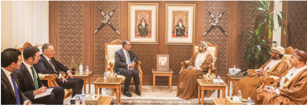
■ الجانبان أكدا على تعزيز الاستثمارات المشتركة واكتشاف الفرص الاستثمارية الواعدة.

من خلال تنويع المنتجات المتبادلة، بما يفتح آفاقاً أوسع أمام القطاعات الاقتصادية المختلفة. وتطرق الجانبان إلى تعزيز الاستثمارات المشتركة وتشجيع مؤسسات القطاع الخاص في البلدين على اكتشاف الفرص الاستثمارية الواعدة، وإضافة إلى إعادة، إضافة إلى التركيز على تعزيز التكامل في مجال اللوجستيات، بما يشمل تطوير الممرات البحرية بين سلطنة عمان وجمهورية مصر العربية والشقيقة، وتقديم الحوافز والتسهيلات اللازمة. حضر المقابلة سعادة الدكتور صالح بن سعيد مسن وكيل وزارة التجارة والصناعة والمسؤولين من الجانبين. وترويح الاستثمار للتجارة والصناعة، وسعادة خالد محمد عبد الحليم راضي سفير جمهورية مصر العربية المعتمد لدى سلطنة عمان، وعدد من المسؤولين من الجانبين.