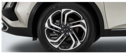
عجلات ألومنيوم ١٩ بوصة