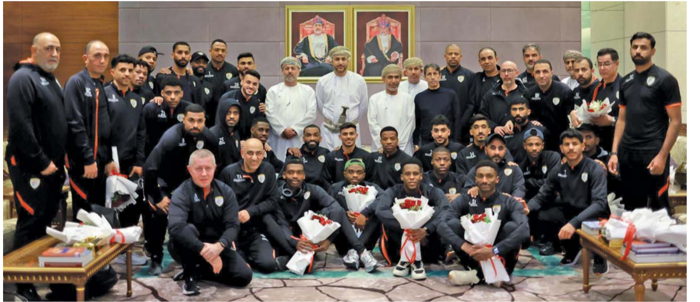
■ صورة جماعية لبعثة منتخبنا عقب وصولها مطار مسقط الدولي