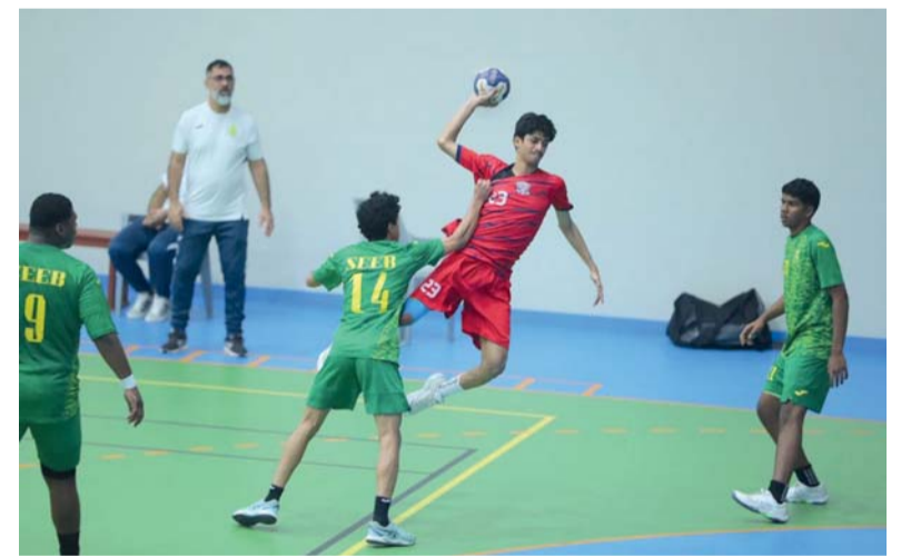
من لقاء مسقط ونزوى في مباراة الإياب بدوري الشباب