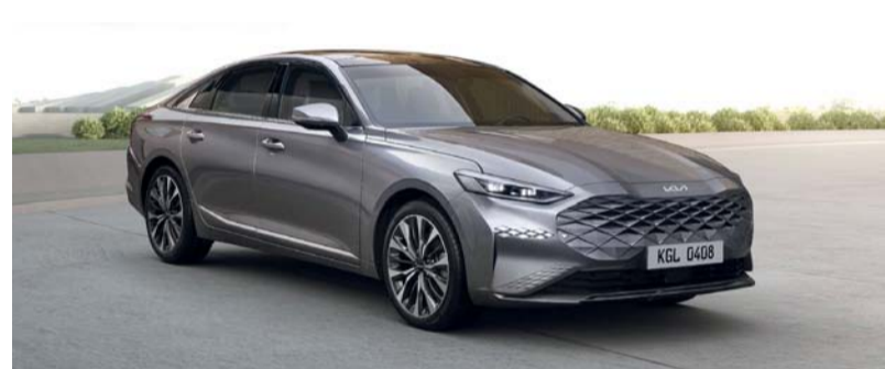
سيارة K8 توفر تكنولوجيا متطورة

تفريقيه مقاس 12,3 بوصة، مما يجمع بين تقنية الاتصال والمعلومات الترفيحية المتقدمة لسيارة K8 وتمتيز بتقنية الصوت الرائدة في الصناعة. ويأتي مقعد السائق بوضع تمدد مريح وبالنسبة للركاب الأماميين يوجد مقعد مريح يتحكم كهربائياً عالي التقنية قابل للتعديل في ثماني وضعيات، كما تضمن ميزة شاشة العرض الأمامية تشبهاً أقل من خلال عرض معلومات حيوية في رسومات حية على الزجاج الأمامي كما توفر اتجاهات ملاحية خطوة بخطوة. وتقدم شركة الاعتماد الدولية للسيارات موزع كيا في سلطنة عُمان تجربة امتلاك فريدة للزبائن من خلال المزايا الممتازة للمنتجات ودعم ما بعد البيع عبر العديد من المنشآت المتكاملة المنتشرة في جميع أنحاء البلاد للوصول برضاء الزبائن لأعلى المستويات ولجعل كل ميل على الطريق آميالاً من السعادة وراحة البال للزبائن.