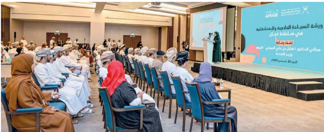
■ الحلقة تناولت واقع المرافق الفندقية والوجهات السياحية

تجربة الدول الرائدة، ومحور أفضل الممارسات والخدمات الصحية، والذي تطرق إلى جاهزية المؤسسات الصحية والمستشفيات في سلطنة عُمان من خلال استعراض الخدمات الصحية والعلاجية التي يمكن تعظيم الاستفادة منها في إطار السياحة العلاجية والاستشفائية، ومحور «الاستثمار والترويج السياحي» وتم خلاله مناقشة تواجدهم الاستشفائية في سلطنة عُمان، وتناولت الطاقة الاستيعابية للمستشفيات الحكومية، ومدى جاهزية المستشفيات الخاصة