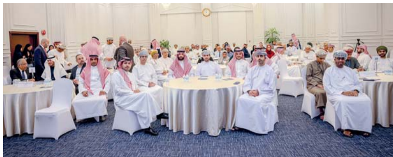
ملتقى الشراكة العماني السعودي استعرض متطلبات تعزيز التجارة البيئية

حضر الملتقى عدد من المستثمرين والمنتجين والمصدرين والمستوردين وشركات الجملة وممثلون للجهات الحكومية. وناقش الملتقى فرص الاستثمار وتعزيز أوجه التعاون بين القطاع الخاص في كل من سلطنة عُمان والمملكة العربية السعودية خصوصاً في المشاريع القائمة. وقال سعادة فيصل بن عبدالله الرواس رئيس مجلس إدارة غرفة