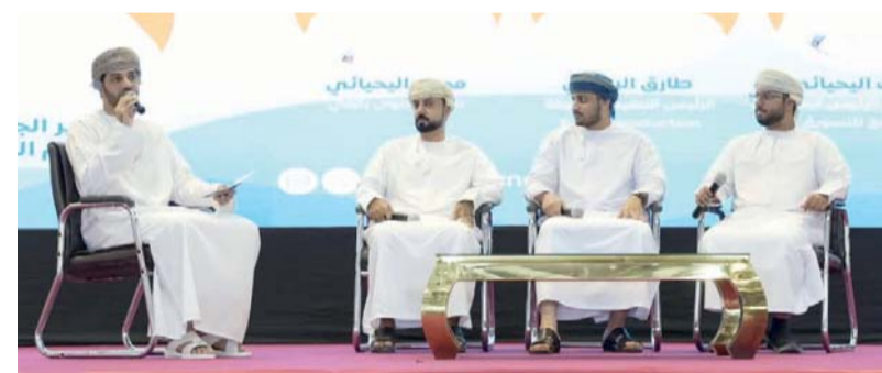
■ الملتقى يهدف إلى رفع مستوى الجودة في الإعلام المحلي

يهدف الملتقى إلى تعزيز القدرات الإعلامية بمحافظة الظاهرة ونشر الثقافة الإعلامية بين المشاركين من الدوائر الحكومية والشباب من خلال سلسلة من الأعمال والبرامج التدريبية التي