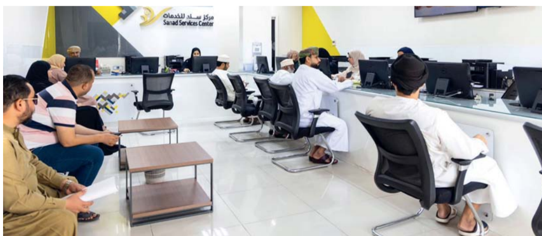
الملتقى يؤكد أهمية تعزيز التواصل بين الوزارة والجهات المساهمة في تنمية الخدمات الإلكترونية

التجارة والصناعة وترويج الاستثمار إقبالاً متزايداً في إنجاز المعاملات ليصل عدد ما تم إنجازه إلى ١,١ مليون معاملة وخدمة إلكترونية خلال الأشهر العشرة الأولى من العام ٢٠٢٤. وأشار إلى أن هناك حوالي ٢٣ مؤسسة حكومية وخاصة تقدم خدماتها المختلفة عبر مراكز سند للخدمات، تتنوع حسب احتياجات المستهلكين ليصل عدد الخدمات المقدمة إلى أكثر من ٣٧٠ خدمة.