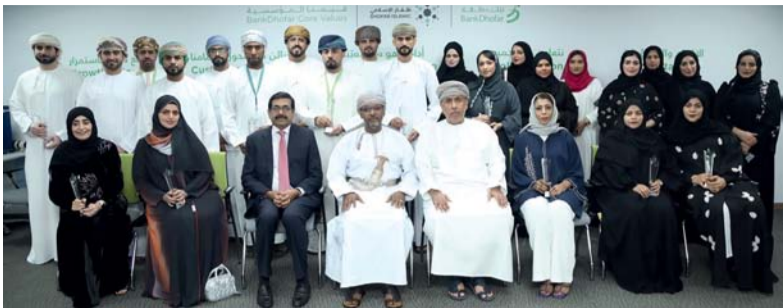
راعي الاحتفالية والمكرمون في صورة جماعية

تسابق الجهود وتعزيزها، خصوصاً وأن اللقاءات السابقة عملت على بلورة التوجهات العامة لتعزيز التبادل التجاري والاستثماري بين سلطنة عُمان والمملكة العربية السعودية. وأضاف: إن ما قام به القطاع الخاص في البلدين ومن خلال التنسيق المتواصل بين غرفة تجارة وصناعة عُمان واتحاد الغرف السعودية وكذلك مجلس الأعمال العماني السعودي ومنتديات الأعمال من