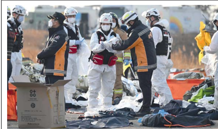
رجال الإطفاء وأفراد الإنقاذ يعملون في مكان الحادث الذي تحطمت فيه طائرة تابعة لشركة طيران جيجو في مطار موان الدولي بكوريا الجنوبية.

وتضاعفت نسبة أطفال العالم الذين يعيشون في مناطق الصراع، من نحو ١٠ بالمائة في التسعينيات إلى ما يقرب من ١٩ بالمائة اليوم.