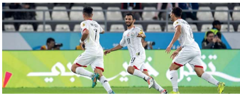
فرحة لاعبي المنتخب اليمني بإحراز الهدف الثاني

واللاعبين يؤكدون على أن هذا الفوز هو بداية خير وأخذ الثقة للمستقبل، وأن مشاركات اليمن القادمة ستكون مختلفة بحسب الأهداف المرسومة. الجماهير اليمنية عبرت عن هذا الفوز بطريقتها الخاصة وأشعلت سوق المباركية في مشهد رائع للغاية الغياب.