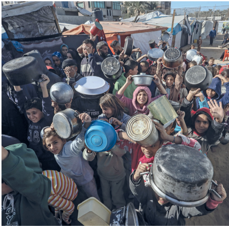
أطفال فلسطينيون يتجمعون لتلقي الطعام في مطبخ خيري في دير البلح بغزة.