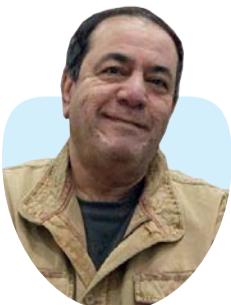
أ.د. محمد الدعيمي كاتب وباحث أكاديمي عراقي