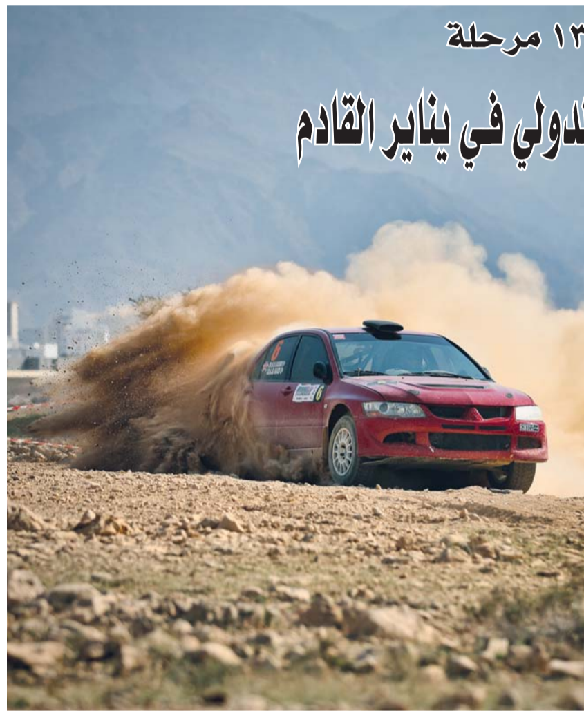
صورة أرشيفية من رالي عُمان الدولي

بمجمع الرساتاق الرياضي. وكانت مباريات الجولة الثانية بالدور الأول أسفرت عن فوز صحم مع مبراط بنتيجة 17/15 في المباراة التي جرت أحداثها مساء أمس الأول على ملعب الصالة الرياضية بمجمع السعادة الرياضي وعلى نفس الصالة تفوق النصر على الاتحاد بنتيجة 14/11 وفي المجموعة الثانية فاز السويق على مصيرة بنتيجة 19/16 في المباراة التي أقيمت على ملعب الصالة الرياضية بالجمع الرياضي بصور، وتفوق بديعة على صحم بنتيجة 21/23 في اللقاء الذي جمع الطرفين على ملعب الصالة الرياضية بالجمع الرياضي بالرساتاق.