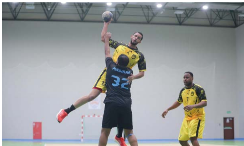
من لقاء السويق ومصيرة في دوري الدرجة الثانية لكرة اليد