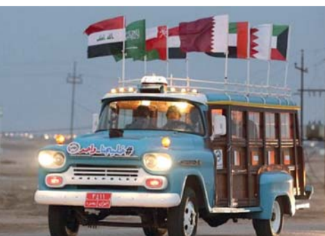
الحافلة من طراز ١٩٥٨

وصل «باص الخليج»، أقدم حافلة استخدمت في البطولات الخليجية السابقة على مدار ما يقارب ٦٠ عاماً، حيث وصلت من العراق إلى الكويت أمس الأول، وبالتحديد إلى مقر الوفود والبعثات الإعلامية «كراون بلازا». وقد بدأت الحافلة جولة في مدن وشوارع وملاعب الكويت خلال منافسات خليجي ٢٦، ويعد «باص الخليج» أقدم حافلة في البطولات الخليجية، من طراز ١٩٥٨، وهو مصنوع من الخشب، وتم العمل على إعادة تأهيله. جاءت فكرة الحافلة دعماً لبطولة كأس الخليج ٢٦، وتضمنت أولى زيارات الحافلة إلى سوق المباركية وملاعب المباريات، وقد شهدت الزيارة حفاوة استقبال وتوقفات عديدة، شملت التقاط الصور التذكارية مع أقدم مركبة تمثل إرث البطولة الخليجية الكبيرة.