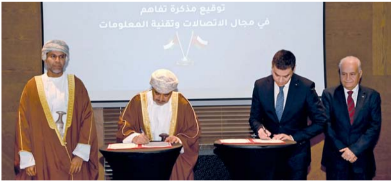
المذكرة تتضمن دراسة إمكانية الاستثمار المشترك في الاقتصاد الرقمي

وتعزيز مكانتهما في مجالات الاتصالات وتقنية المعلومات، بما يساهم في تحسين الخدمات الرقمية، وتعزيز قدرة البلدين على مواجهة التحديات المستقبلية.