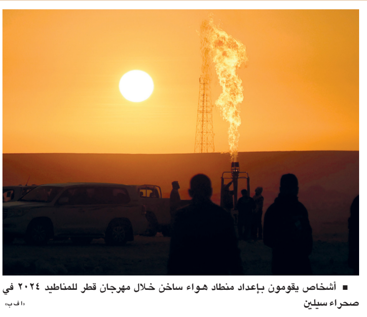
أشخاص يقومون بإعداد منطاد هواء ساخن خلال مهرجان قطر للمناطيد ٢٠٢٤ في صحراء سيلين.

انتهاء تفشي فيروس ماربورغ برواندا كيجالي (رواندا). د ب أ: أعلنت منظمة الصحة العالمية والحكومة الرواندية، انتهاء تفشي حمى ماربورغ المشابهة لفيروس الإيبولا في رواندا بعد عدم تسجيل أي حالات جديدة في الأسابيع الأخيرة. وكانت رواندا قد أعلنت تفشي المرض لأول مرة في ٢٧ سبتمبر حيث جرى تسجيل ١٥ حالة وفاة و٦٦ حالة إصابة، وكان معظم المصابين من العاملين في مجال الرعاية الصحية الذين تولوا رعاية المرضى الأوائل. لا يوجد لقاح أو علاج معتمد لفيروس ماربورغ، إلا أن رواندا تلقت مئات الجرعات من لقاح تجريبي خلال أكتوبر الماضي.