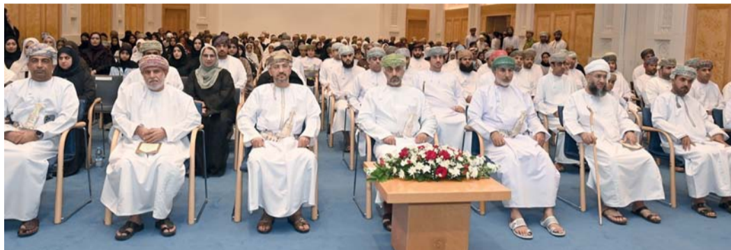
الحضور أثناء الحفل