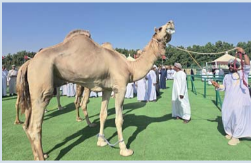
من عملية تقييم الهجن المشاركة في المهرجان