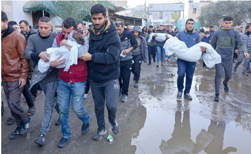
مشيوعون يحضرون جنازة فلسطيني استشهد في غارة إسرائيلية في جباليا، شمال قطاع غزة.

وأكدت الوزارة في بيان أن هذه المساعدات «ستعزز السياسة الخارجية والأمن القومي للولايات المتحدة من خلال تحسين أمن بلد حليف أساسي من خارج حلف شمال الأطلسي، يبقى شريكاً استراتيجياً مهماً في الشرق الأوسط».