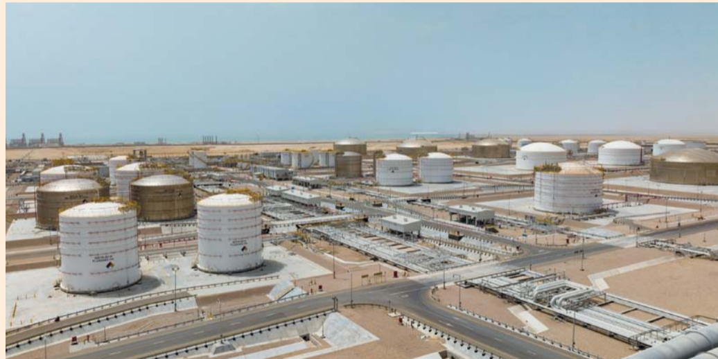
■ التوقعات تؤكد استمرار دول مجلس التعاون في تنفيذ استراتيجيات التنوع الاقتصادي خلال الأعوام ٢٠٢٤م - ٢٠٢٦م

والتكنولوجيا والابتكار والصناعات التحويلية. وبين المركز الإحصائي الخليجي أن لدول المجلس خلال عام ٢٠٢٣م بلغ ١,٦٩١,٨ مليار دولار أميركي محققاً نمواً بنسبة ٠,٥% مقارنة بعام ٢٠٢٢ حيث شهدت القيمة المضافة للقطاع غير النفطي نمواً بـ ٣,٣% في العام ٢٠٢٣م. وشهد متوسط نصيب الفرد من الناتج المحلي الإجمالي بالأسعار الجارية في دول المجلس تراجعاً بـ ٥% في عام ٢٠٢٣م ليصل إلى ٣٦,٧ ألف دولار أميركي مقارنة بما قيمته ٣٨,٦ ألف دولار أميركي في عام ٢٠٢٢م. ويساهم الناتج المحلي الإجمالي بالأسعار الجارية لدول المجلس بما نسبته ٢% من الناتج الإجمالي العالمي، والبالغ ١٠٥,٤ تريليون دولار أميركي خلال عام ٢٠٢٣م، ومساهمته بـ ٠,٥% من إجمالي الناتج العالمي والبالغ ٣,٥ تريليون دولار أميركي. من ناحية أخرى تشير توقعات المركز الإحصائي الخليجي إلى أن معدلات