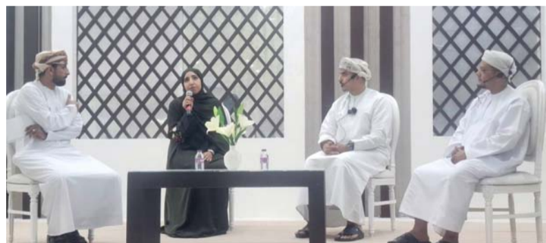
الجلسة تطرقت إلى التحديات السلوكية التي يواجهها الطلبة