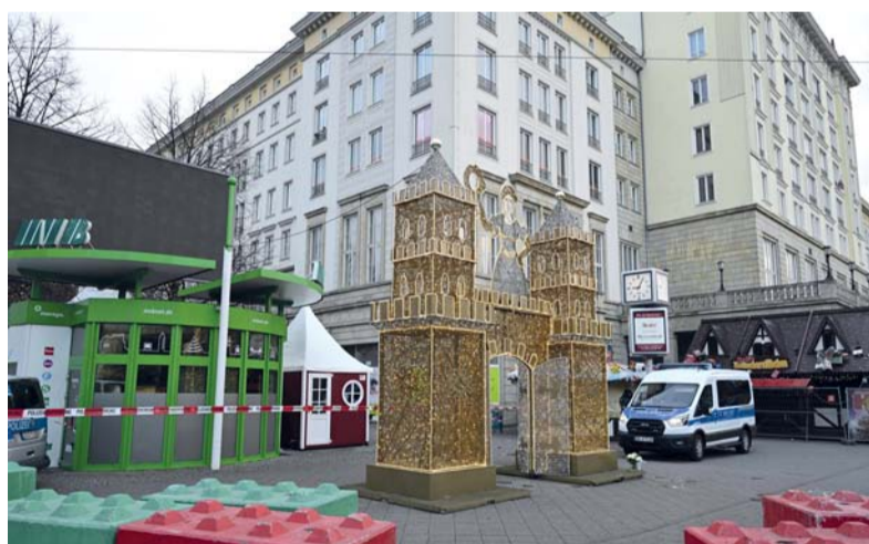
الشرطة تحرس مدخل سوق عيد الميلاد المغلق بعد الحادث الدامي في ماجديبورج، شرق ألمانيا.

برلين، ١٠ ديسمبر: قُتل شخصان أحدهما طفل وأصيب أكثر من ٦٠ آخرين بجروح في هجوم بسيارة استهدف حشدًا في سوق لعيد الميلاد في مدينة ماجديبورج في ألمانيا، بينما أوقفت السلطات مشتبهًا به هو طبيب سعودي. وقال المستشار أولاف شولتس على منصة إكس «المعلومات الواردة من ماجديبورج تشير أسوأ المخاوف». وتأتي هذه العملية بعد ثماني سنوات على هجوم مماثل استهدف سوقًا لعيد الميلاد في برلين. كما تأتي في وقت تشهد ألمانيا حملة انتخابية وقد وضعت قواتها الأمنية في حال تأهب قصوى تحسبًا لأي هجمات محتملة. وقال حاكم ولاية ساكسونيا أنهالت راينر هاسيلوف إن ما حصل ليس