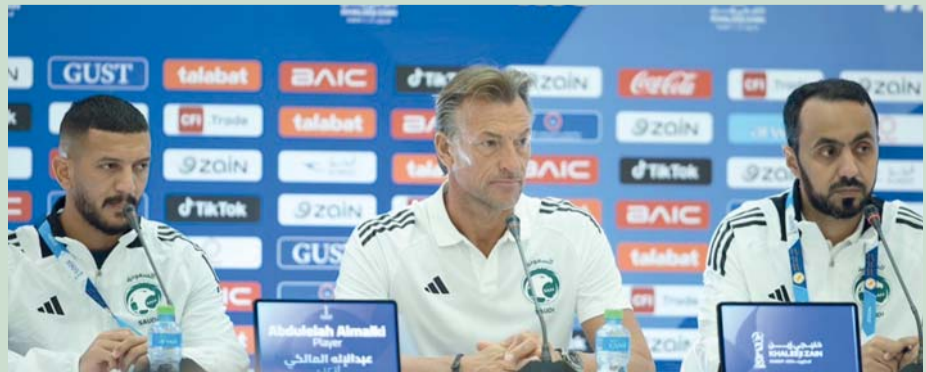
من المؤتمر الصحفي لمدرب المنتخب السعودي

أعرب الفرنسي هيرفي رينار المدير الفني للمنتخب السعودي عن أمله في تقديم بطولة رائعة في كأس الخليج لكرة القدم (خليجي ٢٦). وقال رينار في المؤتمر الصحفي للحديث عن مباراة البحرين في مستهل مشوار الأخضر