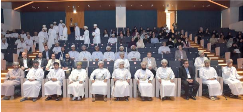
الحضور أثناء الحفل