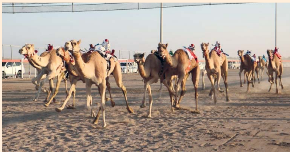
من منافسات سباقات المحطة السادسة من سباقات الهجن الأهلية ببركاء