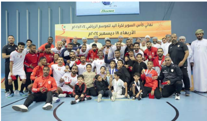
صورة جماعية للاعبين نادي عمان مع راعي الختام