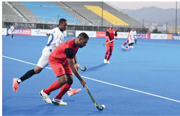
من مباريات بطولة كأس جلالتة للهوكي

تقام اليوم «الأحد» مباريات المربع الذهبي للنسخة الـ ٥٤ من مسابقة كأس جلالة السلطان المعظم للهوكي، التي تستضيفها ملاعب هوكي عُمان بولاية العامرات حيث يلتقي نادي أهلي سداب أول المجموعة الأولى مع نادي صلالة ثاني المجموعة الثانية بينما يلتقي نادي العامرات أول المجموعة الثانية مع نادي النصر ثاني المجموعة الأولى وسيلتقي الفريقان الفائزان في المباراة النهائية يوم الثلاثاء القادم لتحديد الفائز بالبطولة بينما يلعب الخاسران لتحديد المركزين الثالث والرابع. وجاء صعود نادي أهلي سداب بعد فوزه على نادي صحرار بنتيجة ٦-٠، فيما تأهل نادي النصر بفوزه على نادي السلام بنتيجة ١٠-٠ ضمن منافسات المجموعة الأولى، وبذلك تصدر أهلي سداب المجموعة الأولى، يليه نادي النصر في المركز الثاني، ثم نادي صحرار ثالثاً، ونادي السلام رابعاً. وفي المجموعة الثانية، تصدر نادي العامرات مجموعته بعد فوزه على نادي السيب بنتيجة ٣-١، وتأهل برفقته نادي صلالة الذي تعادل مع نادي ظفار بنتيجة ٢-٢، وجاء نادي السيب في المركز الثالث، ونادي ظفار في المركز الرابع. وكانت قرعة الأدوار النهائية قد أسفرت عن تقسيم الفرق إلى مجموعتين، وضمت المجموعة الأولى حامل اللقب نادي صحرار، إلى جانب أندية أهلي سداب والنصر والسلام، بينما شملت المجموعة الثانية أندية صلالة والسيب والعامرات وظفار.