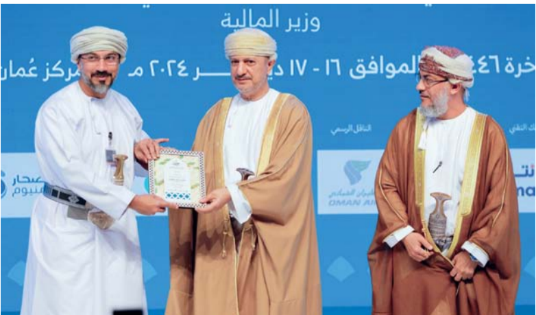
■ صحار الإسلامي يؤكد على مكانته الرائدة في تعزيز منظومة الأوقاف

القيمة المضافة وبناء شراكات مستدامة. وبصفته أحد أبرز الداعمين للتطوير الإسلامي، يواصل صحار الإسلامي دعم المبادرات التي تساهم في خلق أثر ملموس يعزز رفاهية المجتمع وتنميته.