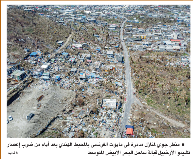
منظر جوي لمنازل مدمرة في مايوت الفرنسي بالمحيط الهندي بعد أيام من ضرب إعصار تشيدو الأرخبيل قبالة ساحل البحر الأبيض المتوسط.