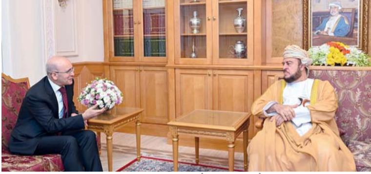
أسعد بن طارق أثناء استقباله محمد شيمشك

والمشروعات. وقّع على مذكرة التفاهم من الجانب العماني معالي الدكتور محمد بن سعيد المعمري وزير الأوقاف والشؤون الدينية، ومن الجانب الموريتاني معالي الدكتور سيدي يحي ولد شيخنا ولد لمرايط وزير الشؤون الإسلامية والتعليم الأصلي بالجمهورية الإسلامية الموريتانية بالعاصمة الموريتانية نواكشوط. وتناولت مذكرة التفاهم تعزيز وتنمية القطاعات الدينية، وتبادل الخبرات في إدارة الأوقاف، وتطوير البرامج التعليمية والتدريبية في هذا المجال.