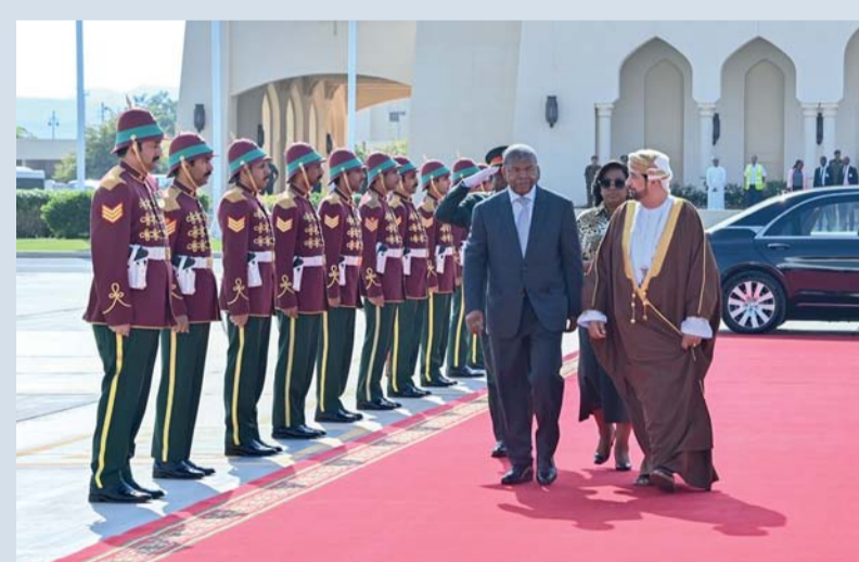
رئيس جمهورية أنجولا لدى مغادرته البلاد

الاقتصادية والعلمية والتكنولوجية والثقافية، إلى جانب إبرام مذكرات تفاهم واتفاقيات تشمل الإعفاء المتبادل من التأشيرات لحاملي الجوازات الرسمية، والمشاورات السياسية، وكذلك في مجال الزراعة. كما تبادل حضرة صاحب الجلالة السلطان المعظم - حفظه الله ورعاه - وفخامة الرئيس الأنجولي وجهات النظر حول القضايا الإقليمية والدولية ذات الاهتمام المشترك، مؤكداً احترامهما للقانون الدولي وميثاق الأمم المتحدة، وأهمية التعاون في إطار المنظمات الدولية لتحقيق السلام والأمن، مشددين على ضرورة تكثيف الجهود لمعالجة القضايا المتعلقة بتغير المناخ. وعقدت الوفود المرافقة اجتماعات لبحث سبل تطوير التبادل التجاري وتبادل