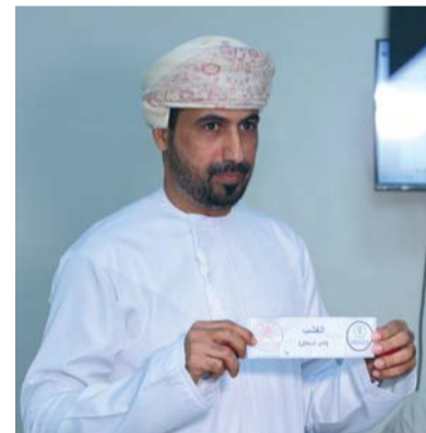
من سحب قرعة البطولة