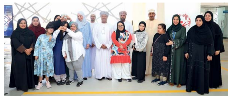
■ بنك عمان العربي يواصل التزامه بمبادرات المسؤولية المجتمعية

الأشخاص ذوي الإعاقة وأسهرهم والمجتمع ككل. ومن خلال هذه المبادرة المبتكرة، يُبرز موظفو بنك عمان العربي الأثر الإيجابي للمشاركة المجتمعية في تمكين ذوي الإعاقة كجزء من الأهداف الوطنية والتنمية الشاملة التي تسعى إليها سلطنة عُمان. وأضاف: يحرص بنك عمان العربي دائماً على تشجيع موظفيه للمشاركة الإيجابية في طرح وتنفيذ