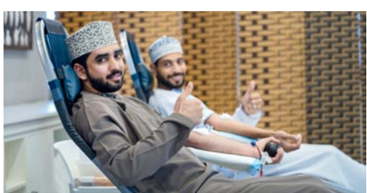
عدد المتبرعين وصل ١٧٠ متبرعاً في ٤ حملات للشركة