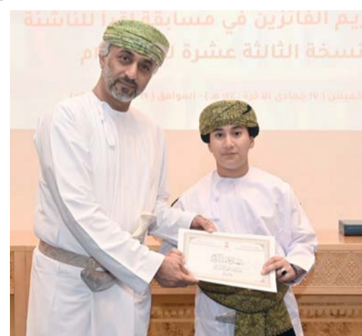
المسابقة تهدف إلى ترسيخ مبادئ وقيم المواطنة الصالحة