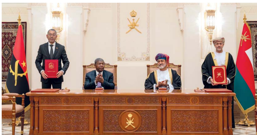
.. وأثناء مشاهدتهما التوقيع على اتفاقية ومذكرتي تفاهم

عزف السلام الوطني لجمهورية أنجولا، وأطلقت المدفعية ٢١ طلقة تحية لفخامته. بعدها صافح جلالة السلطان المعظم الوفد الرسمي المرافق لفخامة الضيف، فيما صافح فخامة الرئيس مستقبله من الجانب العماني، حيث كان في الاستقبال عدد من أصحاب السمو والمعالي وعدد من القادة العسكريين.