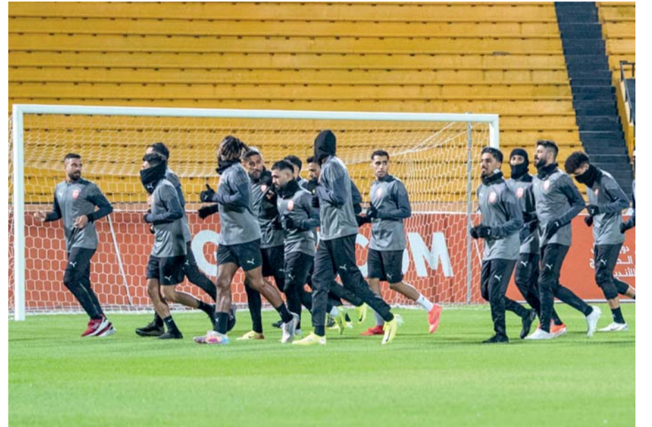
حصة تدريبية للمنتخب البحريني

بناء وإنقاذ مستقبله فقط في خليجي ٢٦ بل يراهن أيضاً على تميمة الحظ حيث سبق له التتويج على الأراضي الكويتية بأخر ألقابه الخليجية في عام ٢٠٠٤ وفاز بكأس العرب في عام ٢٠٠٢ بالكويت أيضاً. وتحظى هذه المباراة بطابع ثأري بالنسبة للمنتخب السعودي، حيث كانت آخر مواجهة جمعه بالمنتخب البحريني في بطولة خليجي انتهت بفوز البحرين ٢/٠ صفر في نهائي نسخة ٢٠١٩ والتي على إثرها توج المنتخب البحريني بأول ألقابه. ويسعى المنتخب البحريني لتكرار الفوز على السعودية مرة أخرى للتأكيد على أنه أحد المنتخب المرشحة للمنافسة على لقب البطولة خصوصاً في ظل الفترة الأخيرة التي شهدت تحسناً فني كبير للمنتخب الأحمر، ولعل المباراة الأخيرة التي جمعت السعودية والبحرين جرت قبل شهرين في التصفيات الآسيوية المؤهلة إلى كأس العالم